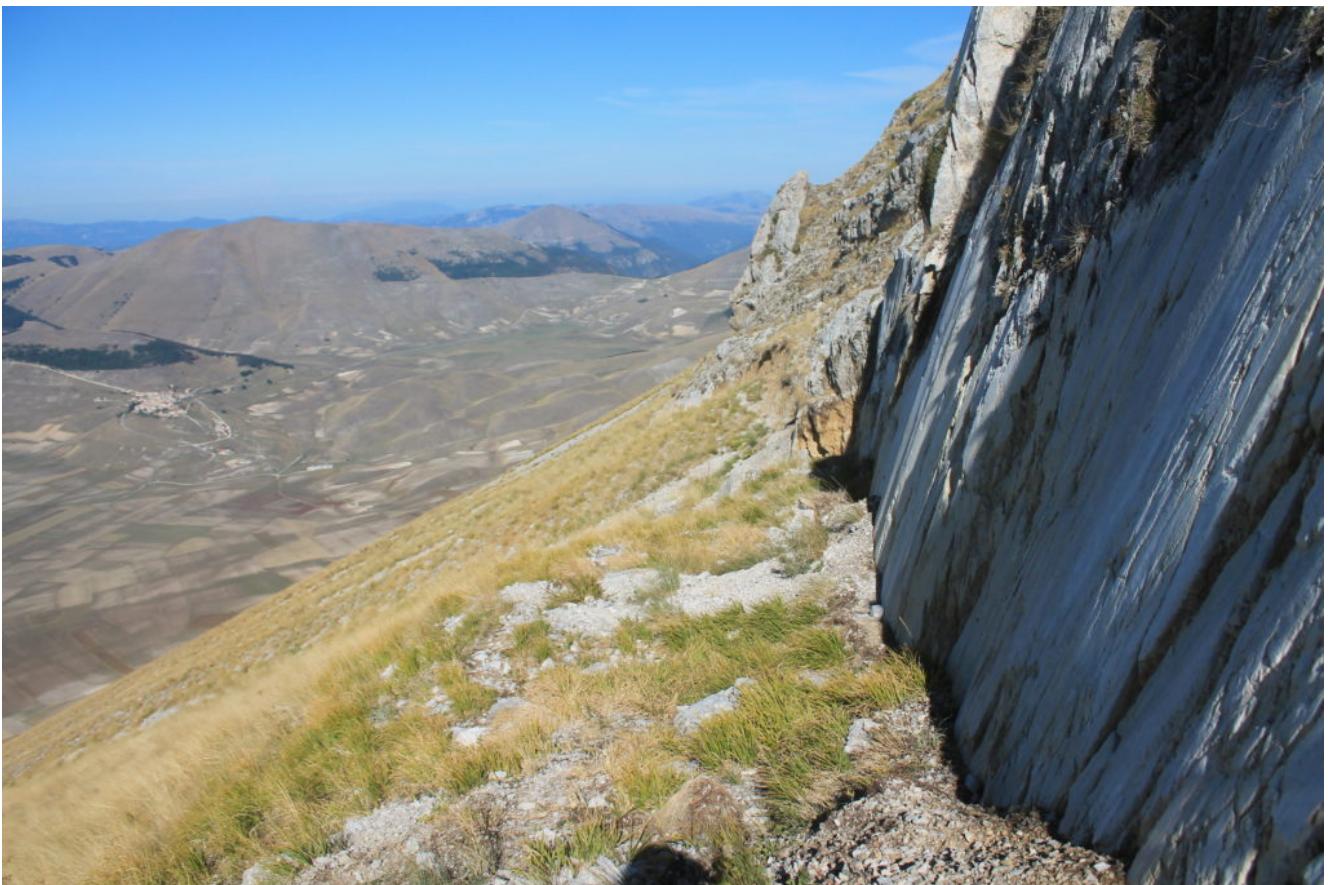
20- Cordone del Vettore, 23 settembre 2017.