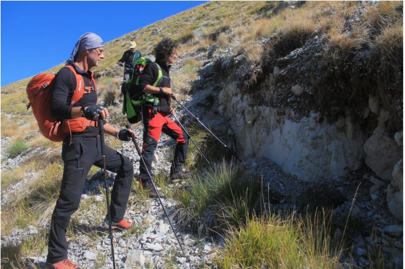
2- Il punto di maggiore dislivello della seconda scarpata cosismica.