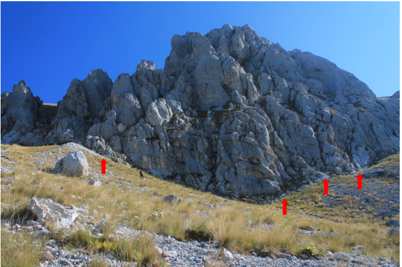
3- Lo scoglio dell'aquila, già si nota la scarpata cosismica ai suoi piedi e nelle pareti laterali.