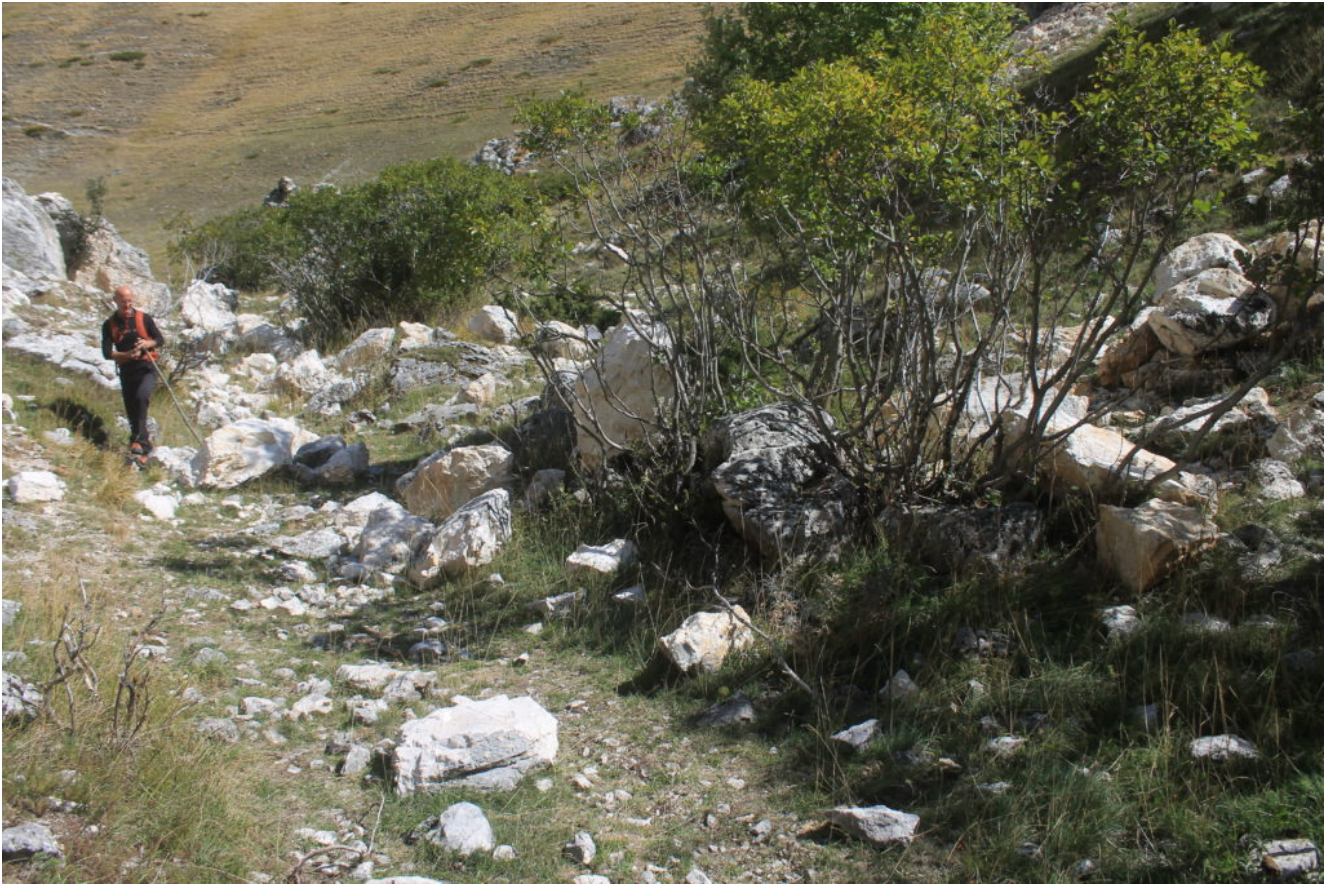
25- Il sentiero che attraversa la Portella del Vao costellato di grandi massi franati dalle pareti che la circondano.