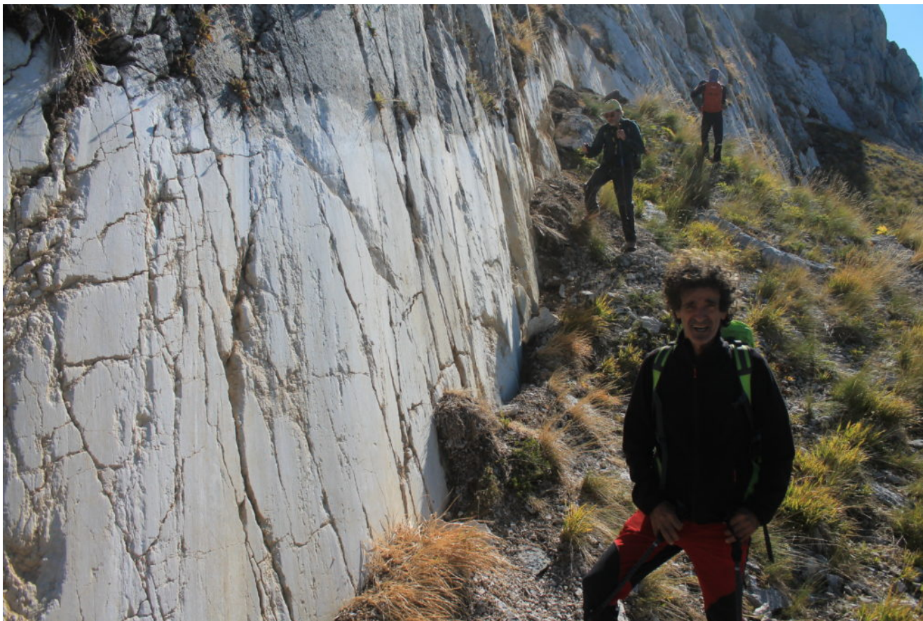
15- Percorrendo la scarpata cosismica.