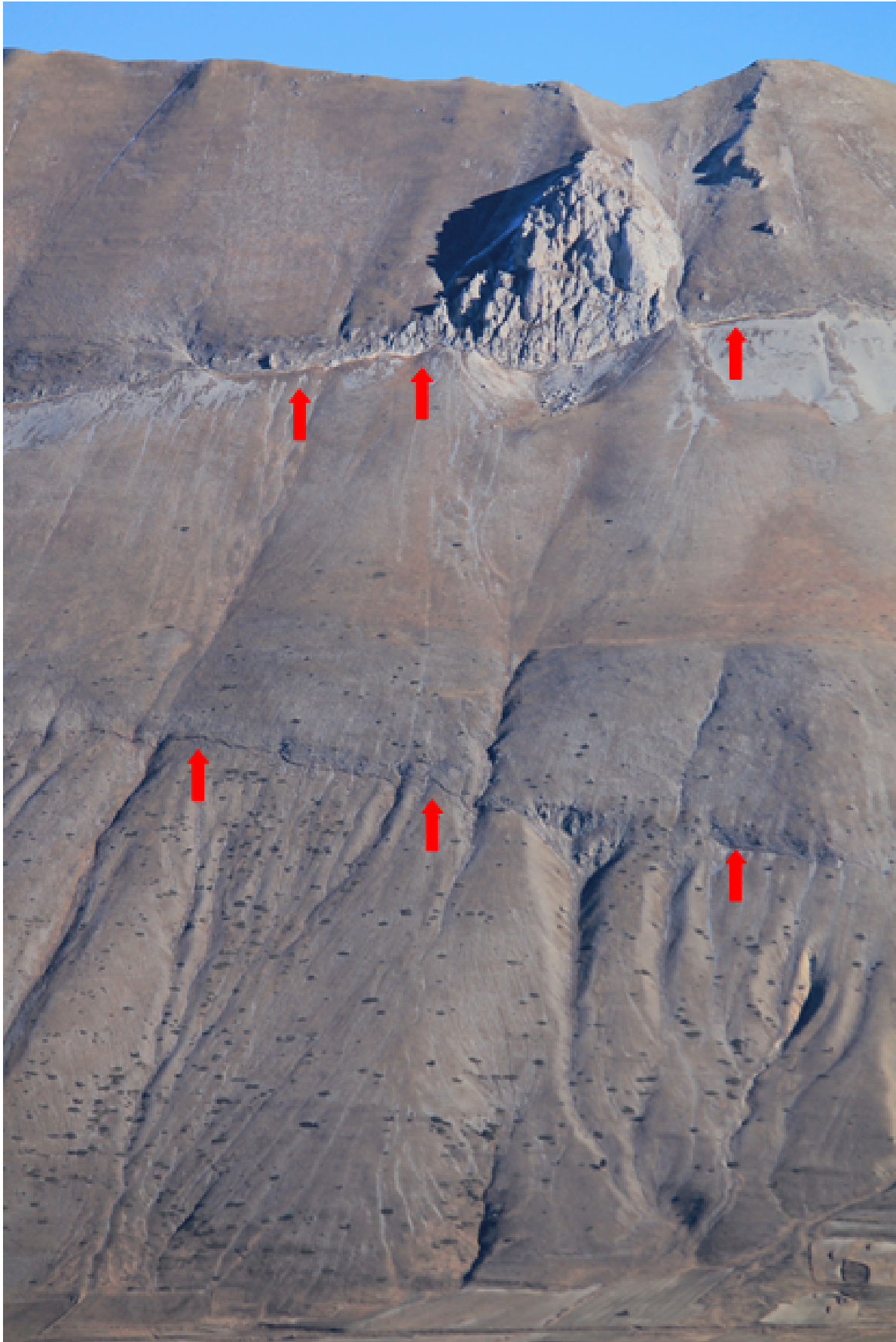
4- Dicembre 2016, il pendio oggetto della salita per lo Scoglio dell'Aquila, si nota la scarpata cosismica a metà altezza e quella del Cordone del Vettore ma non presentavano il dislivello attuale.