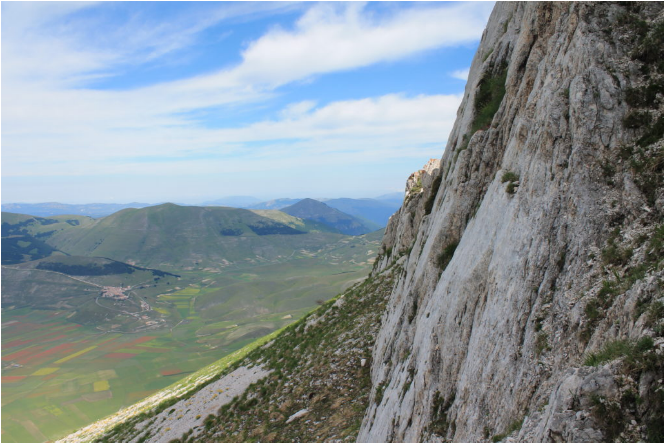
19- Cordone del Vettore, 12 luglio 2015.