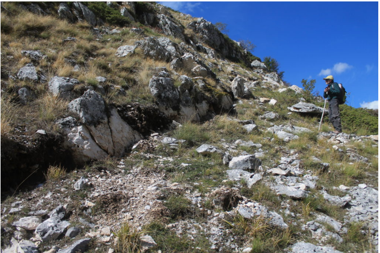
24- La scarpata in questa zona è alta circa 70 centimetri.