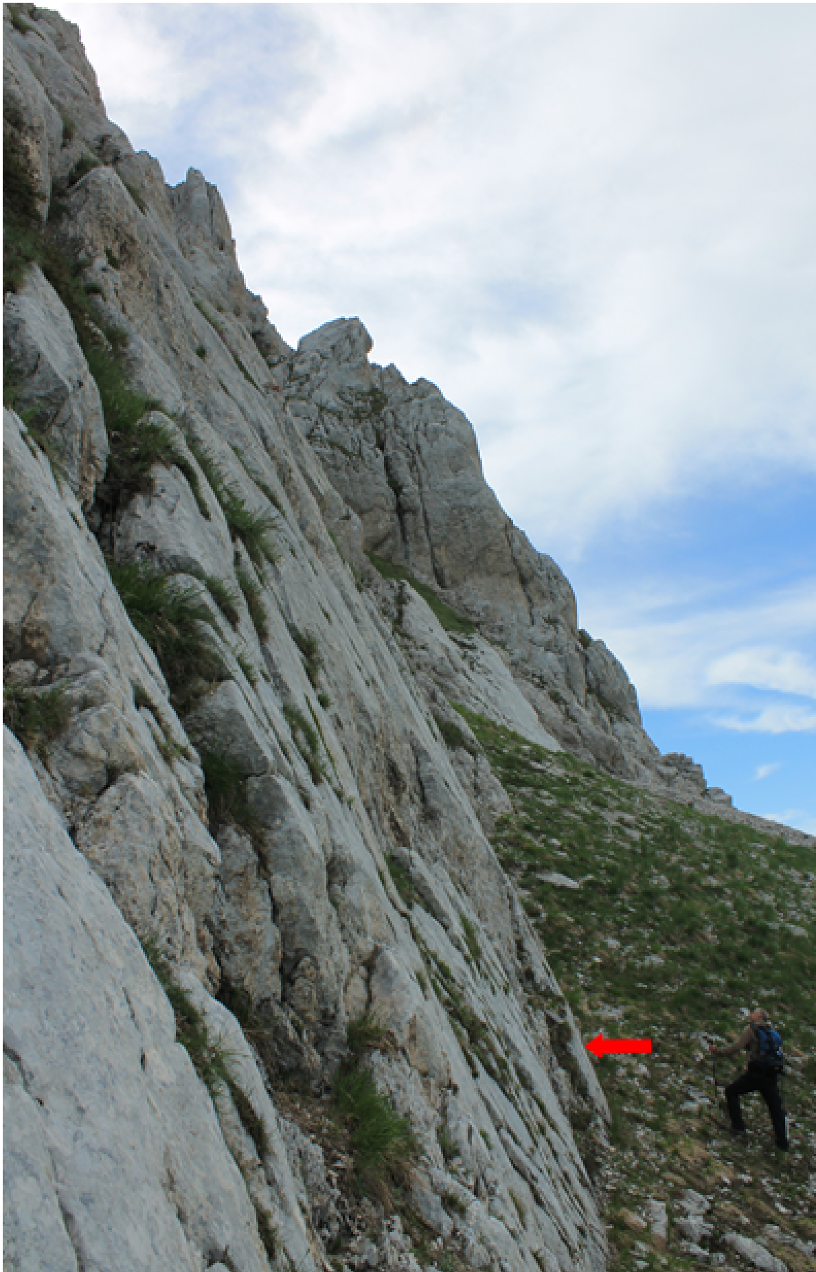
17- Nel Cordone del Vettore senza scarpata cosismica, 12