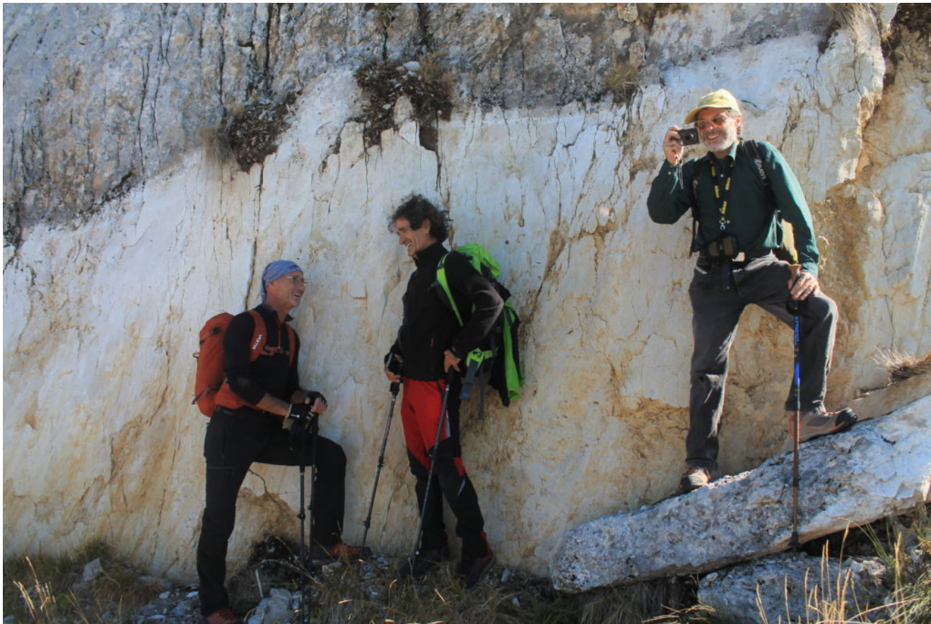
16- I miei amici se la ridono , non è il posto migliore per fare una sosta, basta vedere il masso caduto sotto ai piedi di