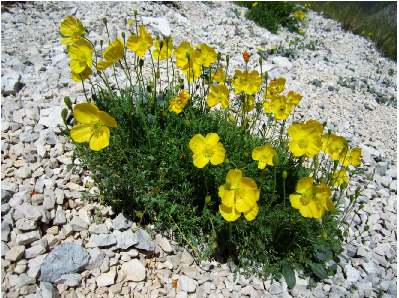
25- Papaver alpinum subsp. ernesti-mayeri presente nei Monti Sibillini solo al Lago di Pilato e M. Argentella.