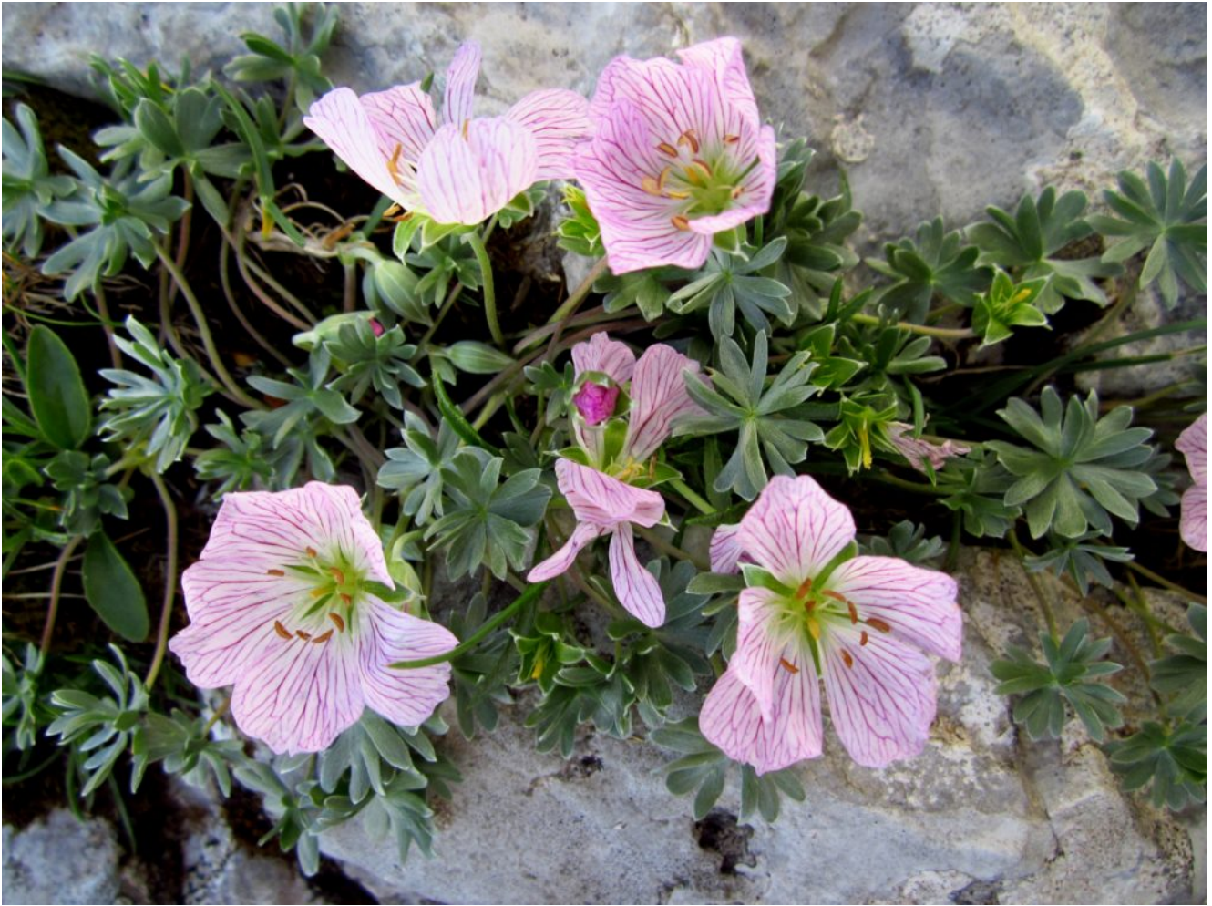
26- Geranium argenteum presente nei Monti Sibillini solo nella stazione indicata nella foto n.24.