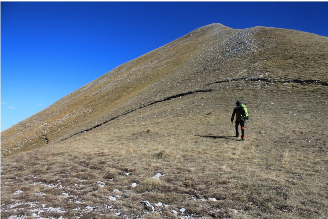
8- La scarpata cosismica nella cresta sud del Monte Porche