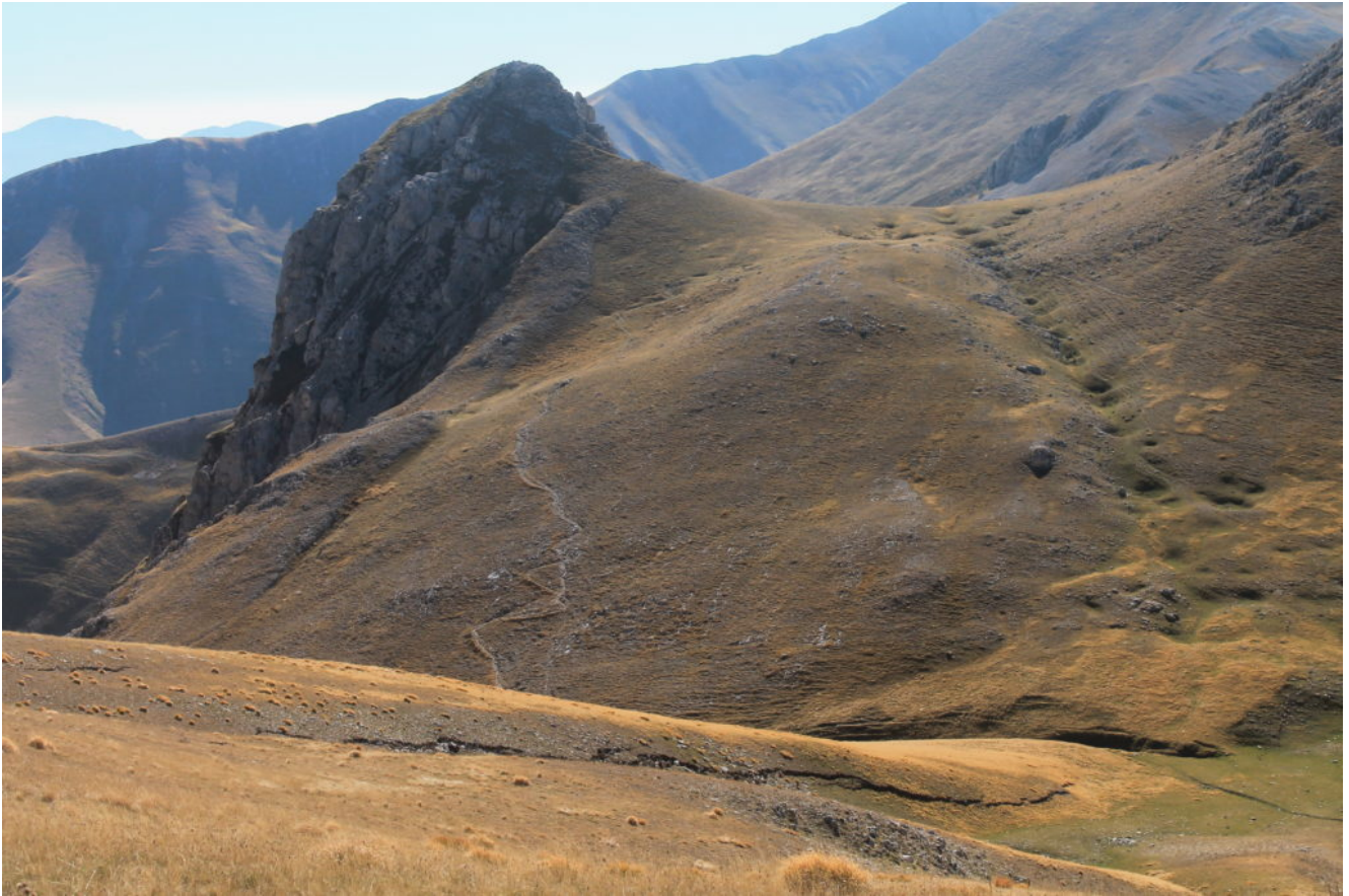
9-Il Sasso di Palazzo Borghese visto dalla cresta sud del Monte Porche e la scarpata cosismica che sale dalla valletta sottostante.