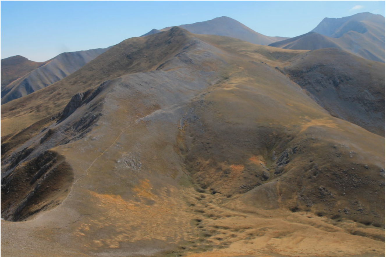
22- Il versante nord-ovest del Monte Argentella, sullo sfondo a destra la Cima del Redentore, al centro il Monte Vettore.