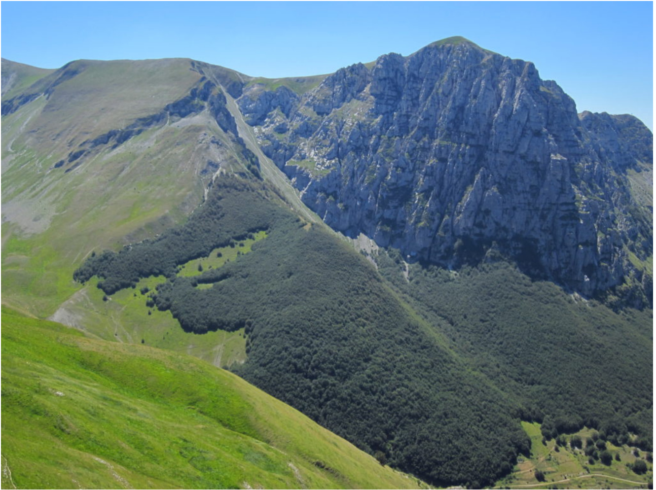
9- Il Monte Bove Nord visto dalla cima di Pizzo Tre Vescovi, estate del 2016.