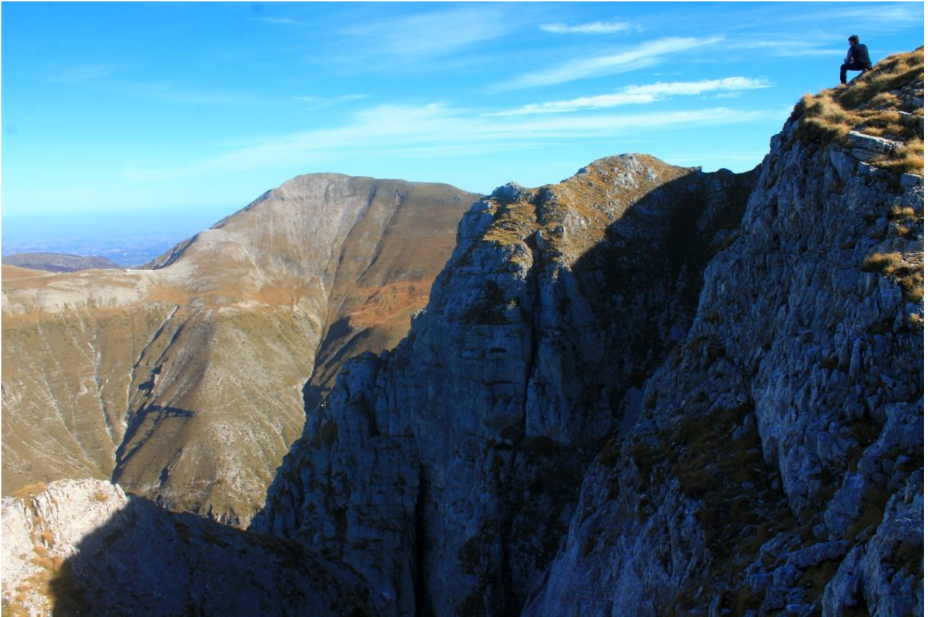
12- La sommità dello Spalto Centrale, novembre 2015, di fronte lo Spalto Orientale e sullo sfondo il Pizzo Tre Vescovi ed il Rifugio del Fargno.