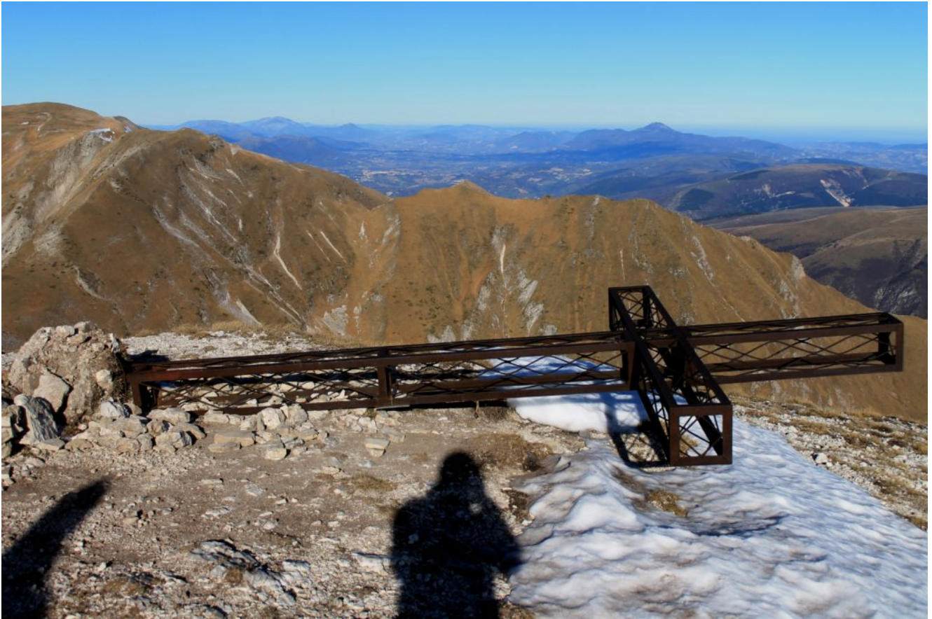
6- Smossa dal sisma e terminata l'opera dal vento ormai è ridotta così