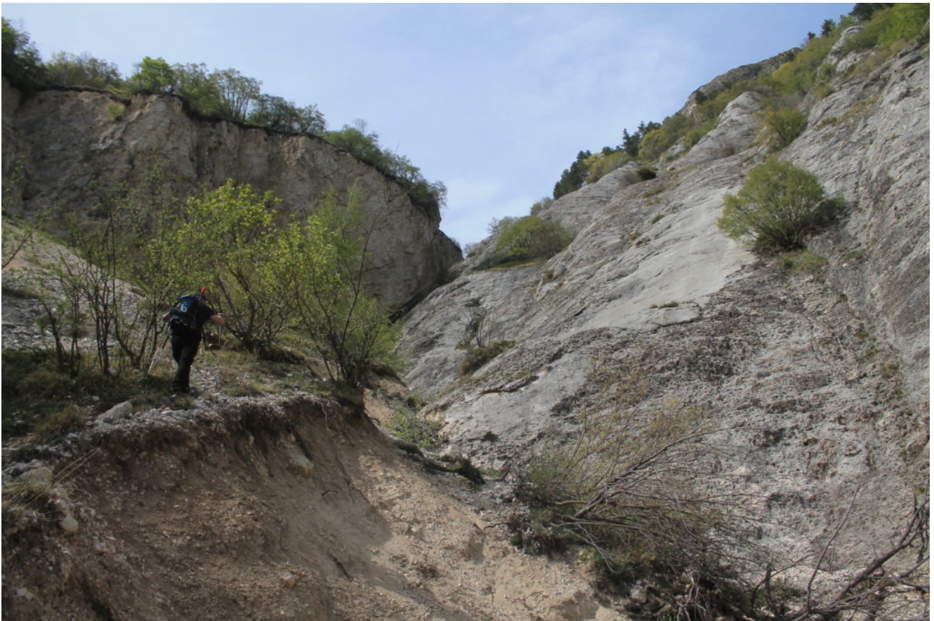
7- Il Fosso di San Simone il 22 aprile 2016, nei pressi di Casali, con il contatto di faglia tra le placche di calcare