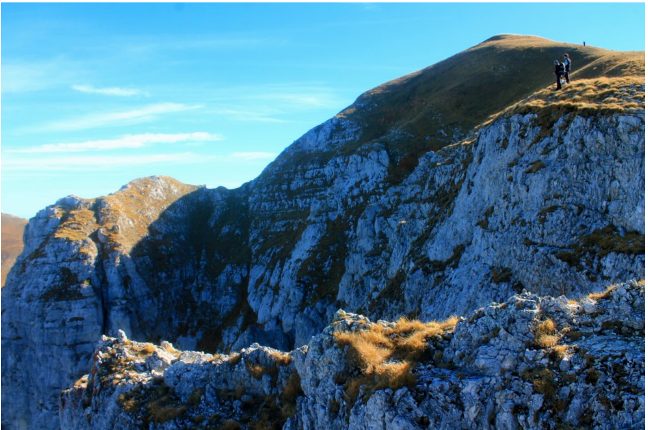
13 Immagine del novembre 2015 della cima di Monte Bove Nord