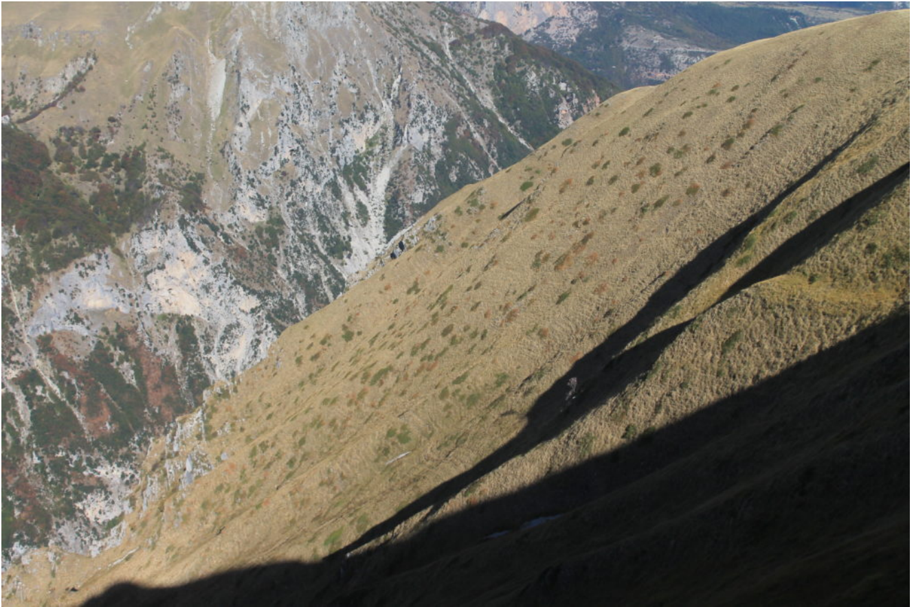
19- Il ripido versante nord-ovest del Monte Zampa dove corre il nostro itinerario n.8 riportato nel mio libro "IL FASCINO DEI MONTI SIBILLINI" Anno 2014.