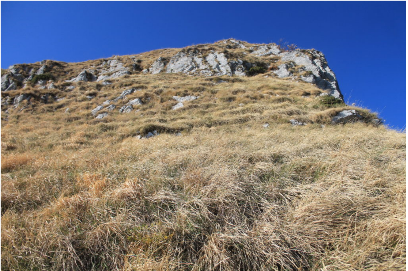
10- Giunti sotto il tratto verticale roccioso (foto n.6) si risale il canalino erboso a destra di fianco alla cresta.