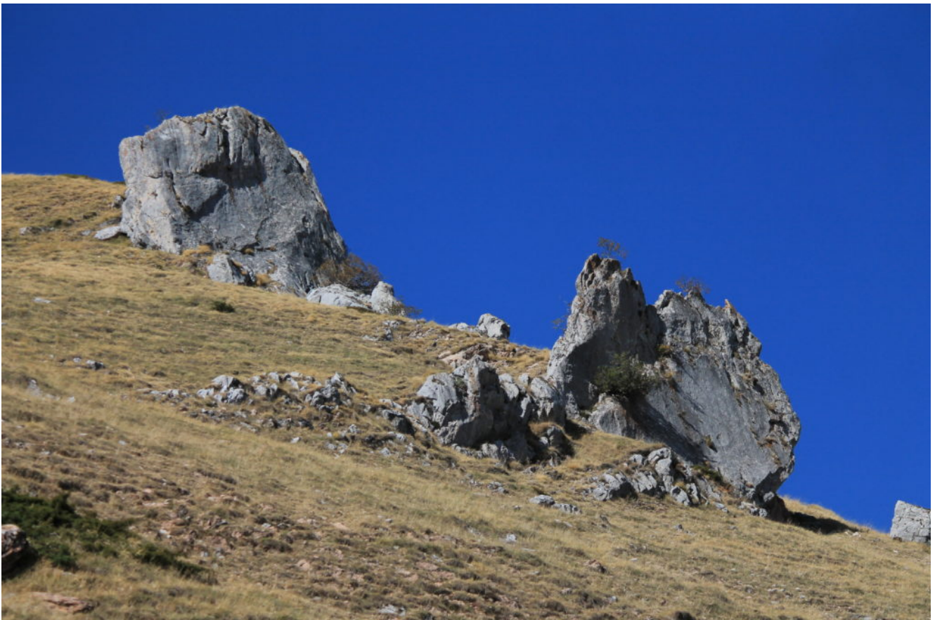
20- Caratteristici massi nel sentiero di discesa (cerchio