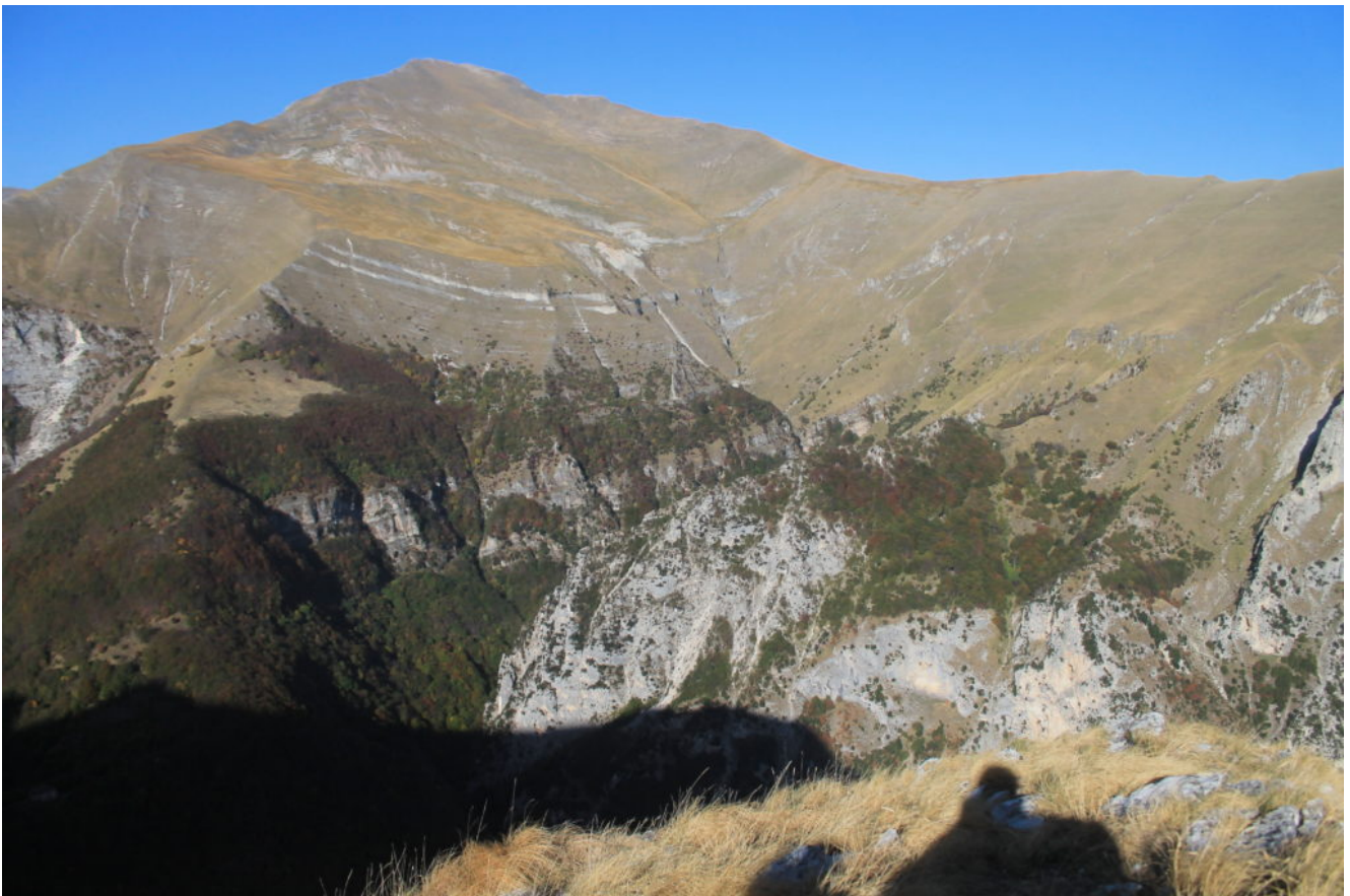
15- Il versante est del Monte Priora con il profondo vallone