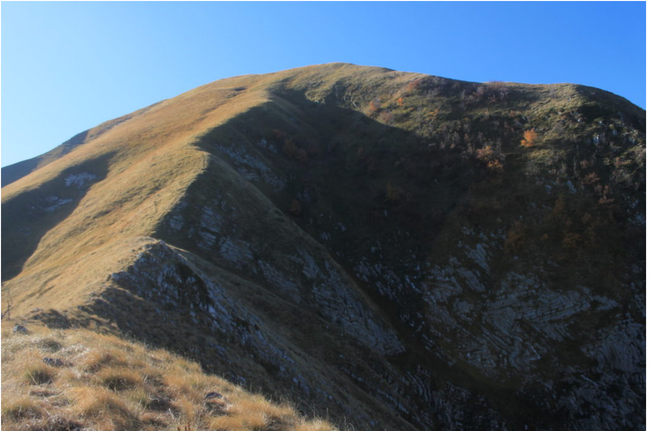
14- Giunti sul terzo ripiano rimane da salire l'ultima facile cresta erbosa a sinistra che conduce alla cima di Monte Zampa non ancora visibile.