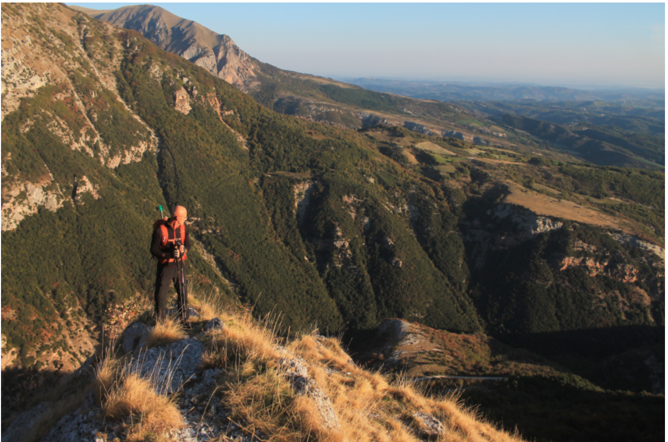
2- la sommità del primo ripiano, in basso si nota la strada