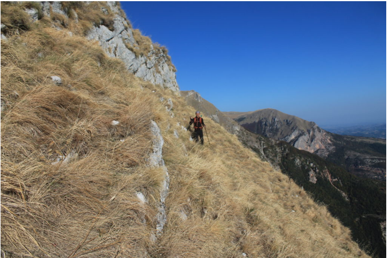
11- Sotto al canalino roccioso di salita, si nota nettamente l'elevata pendenza della cresta.