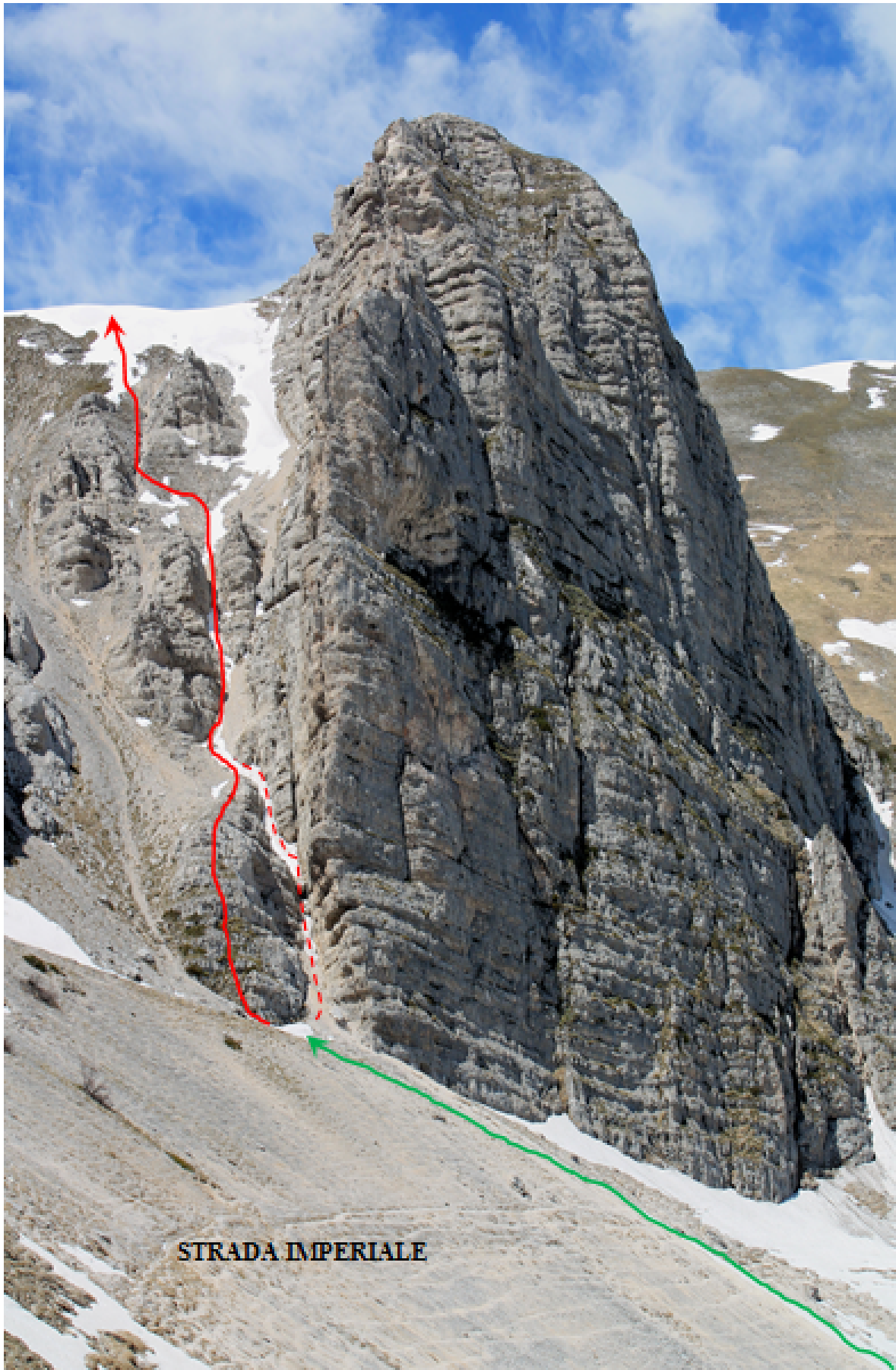
3. La maestosa parete est di Sasso di Palazzo Borghese e il canalone sud con il tracciato in rosso della via di salita ed in verde dell'avvicinamento, la parte iniziale tratteggiata