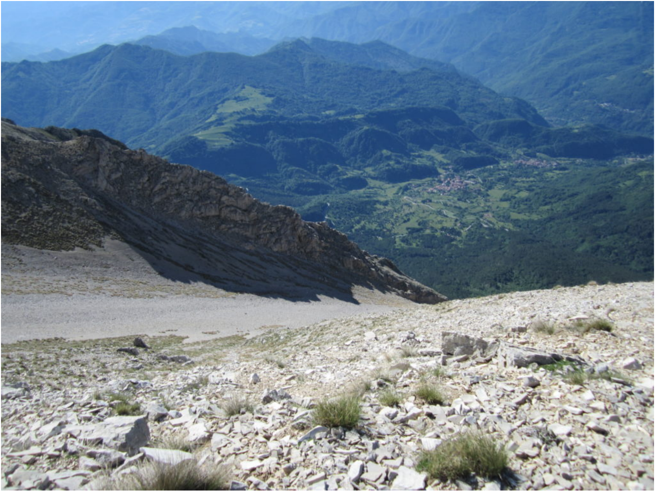
5- L'ultimo tratto del canale di salita visto dai pressi della croce del M. Vettore, sullo sfondo il paese di Pretare