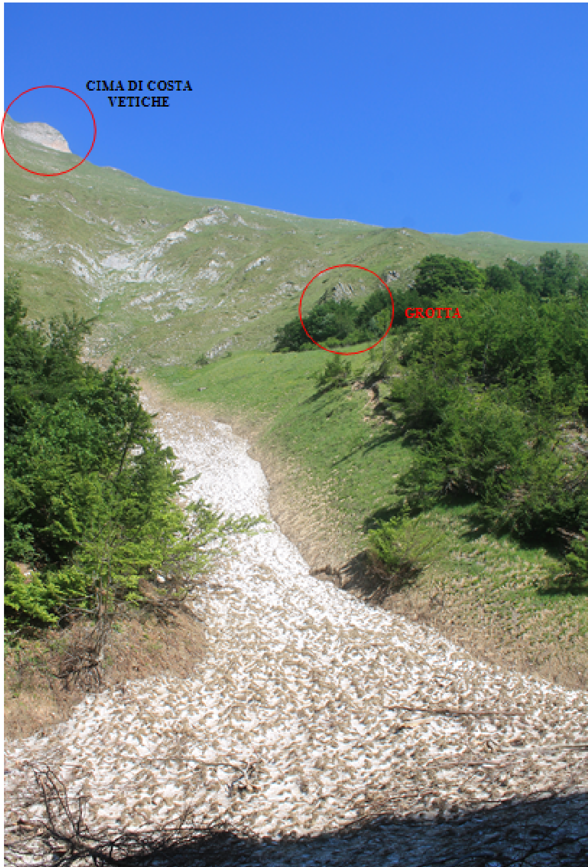
3- Il canalone di Costa Vetiche ancora pieno di neve con in alto il caratteristico scoglio rosso della cima e l'indicazione per la Grotta dell'Orso