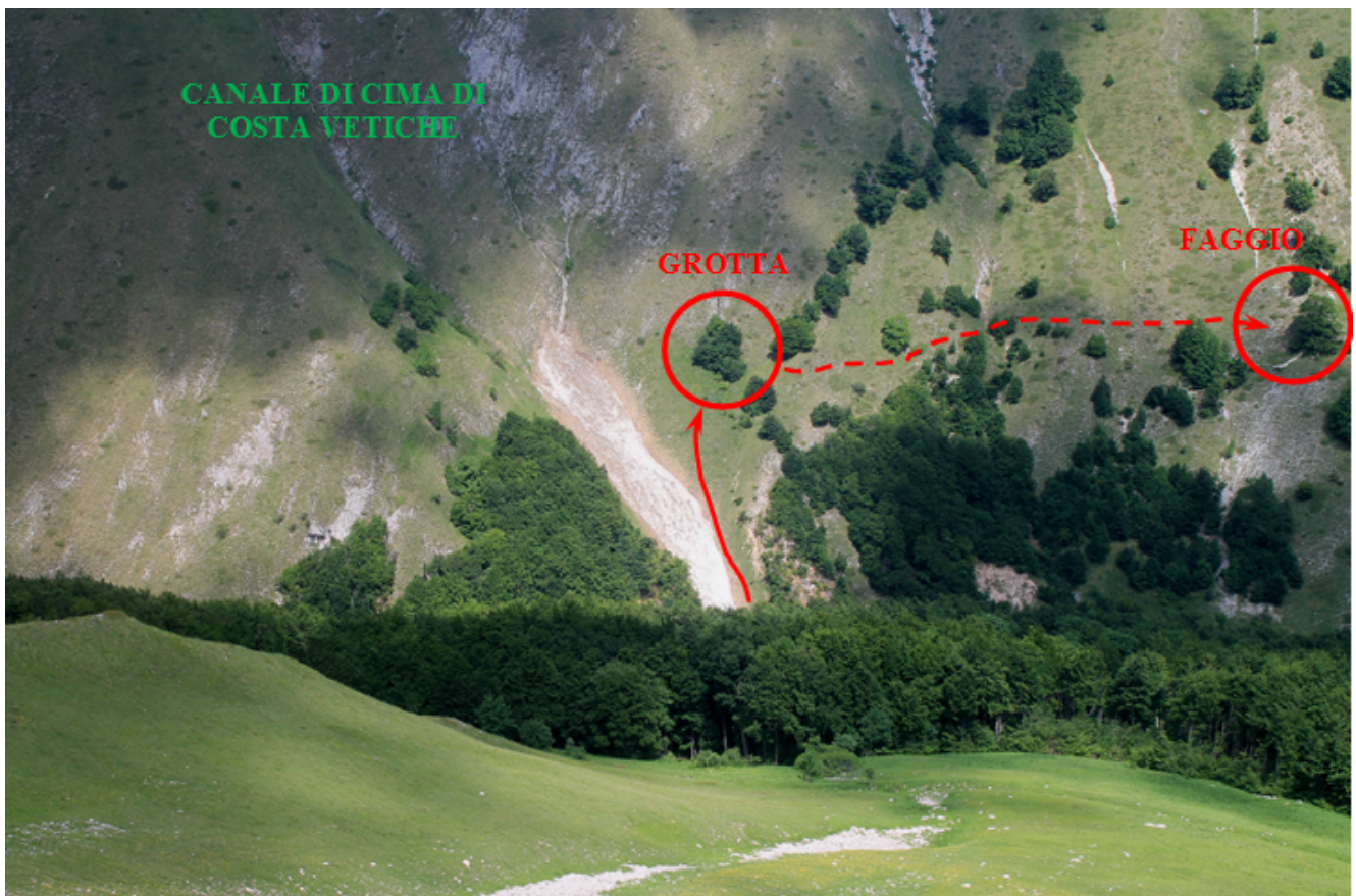
1- Il canalone di Costa Vetiche ancora pieno di neve con le

Guadando il torrente e salendo un centinaio di metri, con attenzione per l'erba ripida, la sponda destra del canale ci si dirige verso un nucleo di faggi isolato piuttosto grande, posto sotto a delle rocce, come visibile nella foto n.1 e 3.