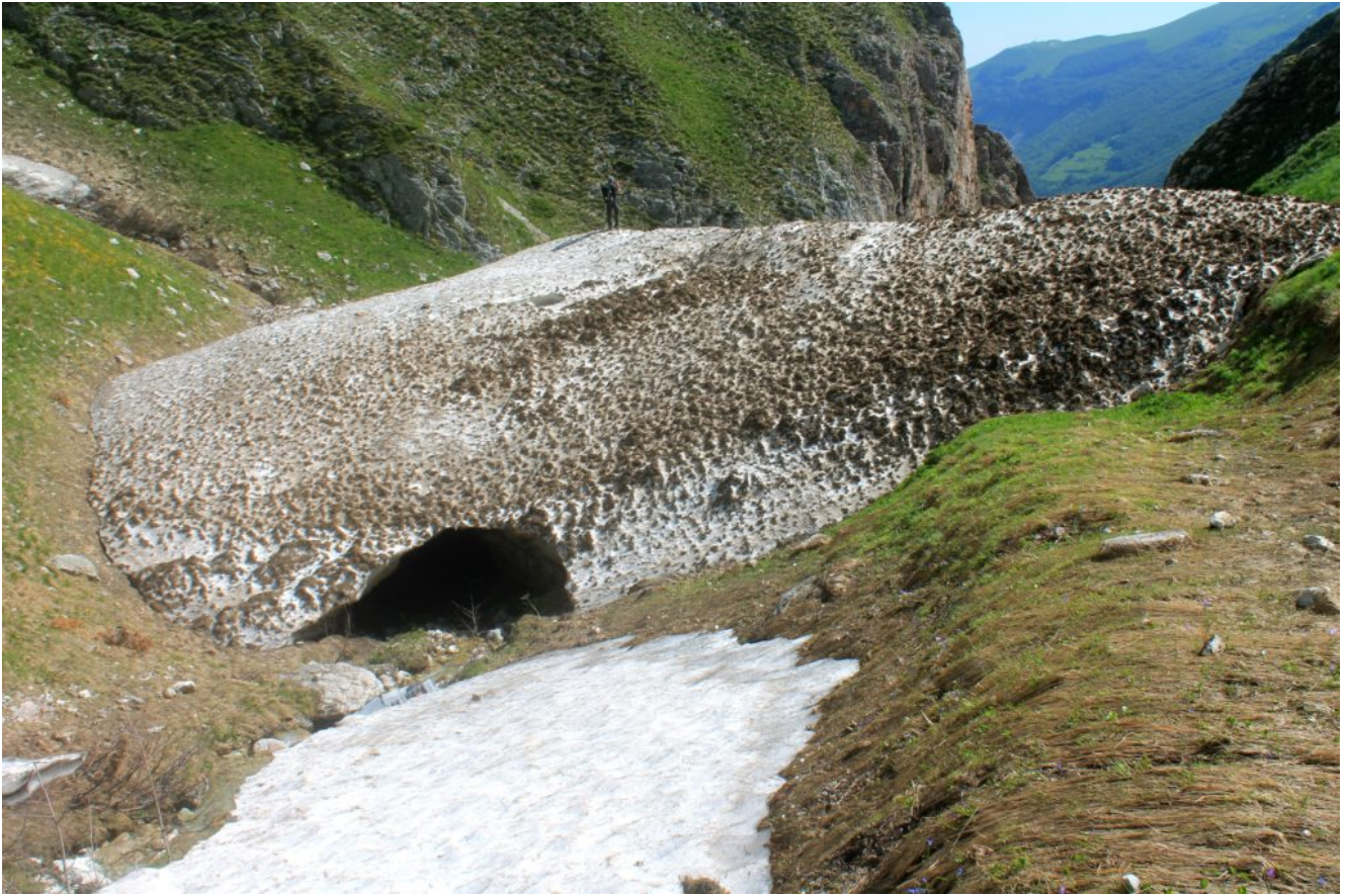
6 Grandi accumuli di neve primaverile nell'alta Valle del Fiastrone, dopo il restringimento sulla verticale della cresta nord del M. Acuto (parete di destra) .