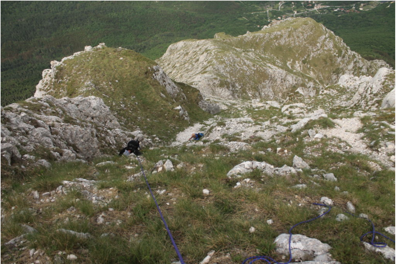
15 – Il pendio erboso finale poco prima di raggiungere la croce di vetta, al termine delle difficoltà