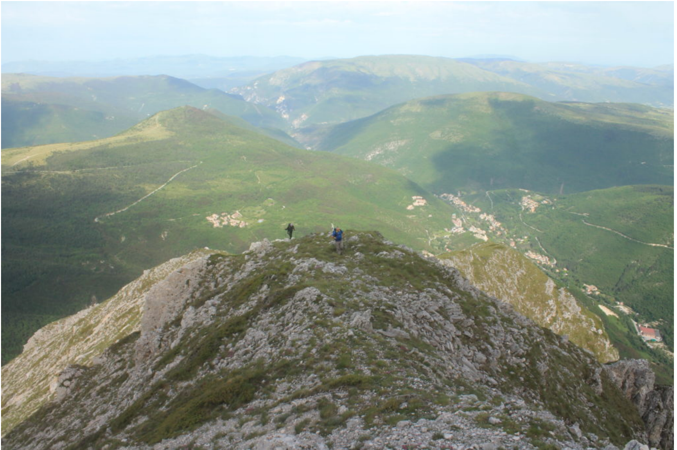
7- La sella della cresta nord, a destra l'abitato di Ussita e le frazioni limitrofe