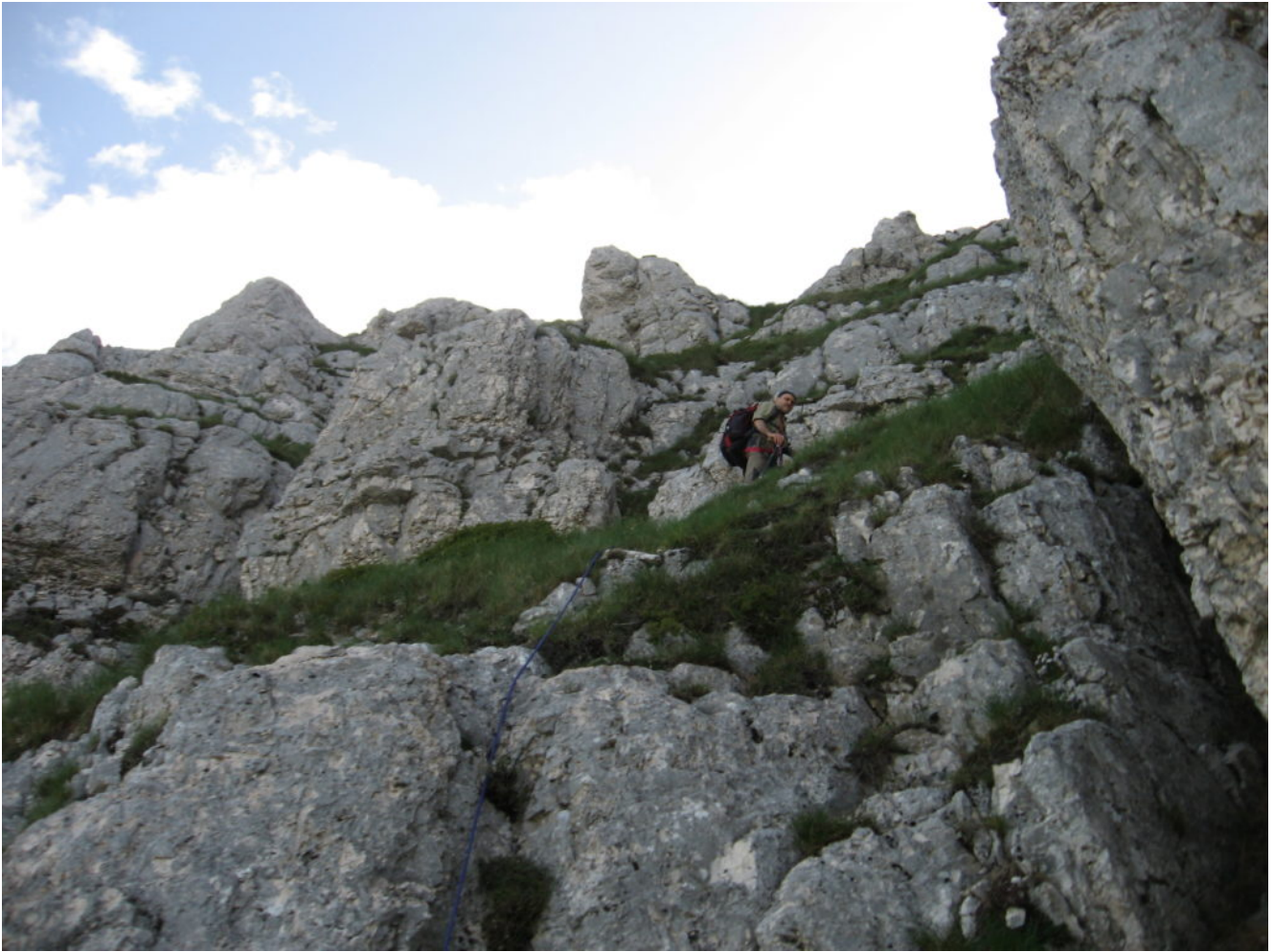
9- Il primo salto roccioso del canalino finale, visto dal basso