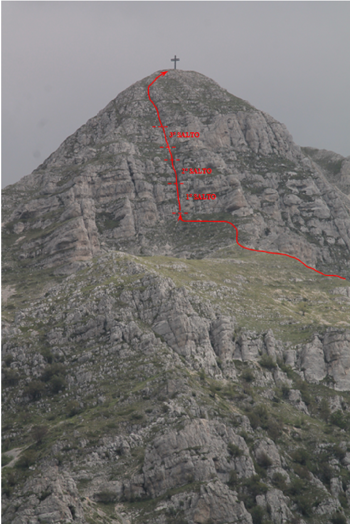
17- Il versante nord della Croce di Monte Bove visto dalla strada

del cerchio il pino della strettoia della foto n.2 . Il percorso in verde è l'itinerario di discesa