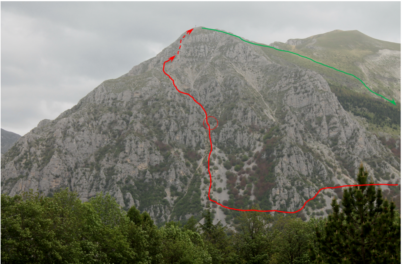
16- Il versante ovest della Croce di Monte Bove con il percorso di salita in rosso, visto da Frontignano, all'interno