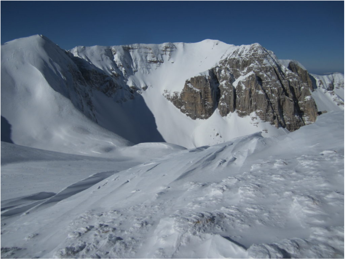
La cresta del Redentore