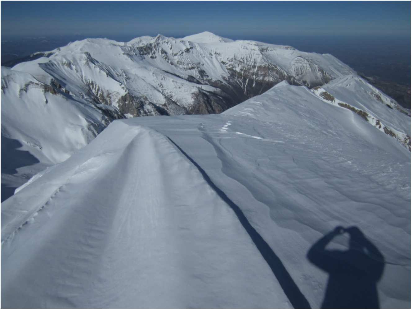
Veduta dell'intero gruppo dei Monti Sibillini dalla cima del M. Vettore