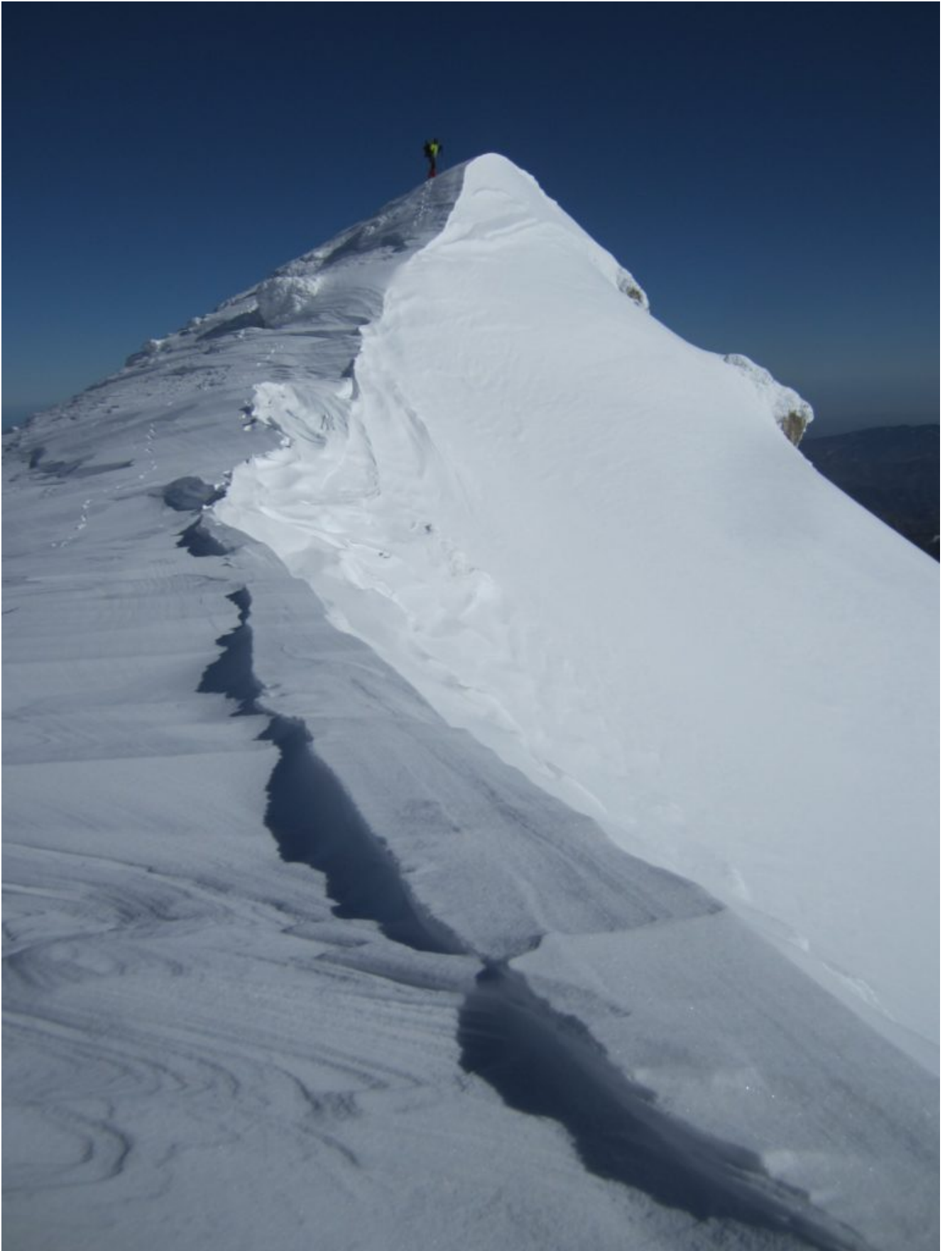
Verso la Cima di Pretare