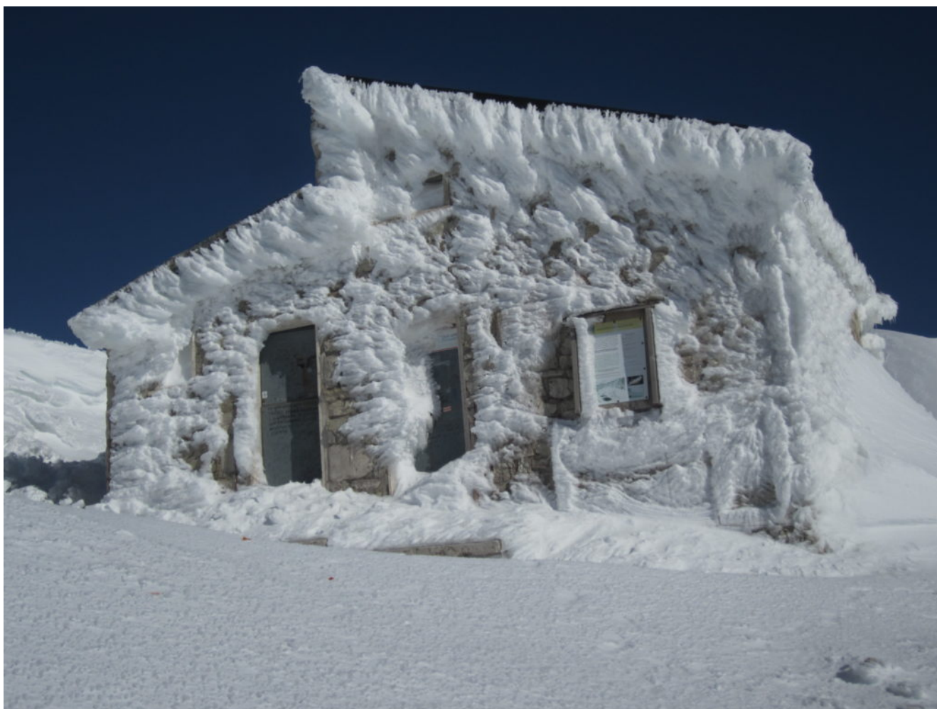
Il Rifugio Zilioli rivestito di galaverna