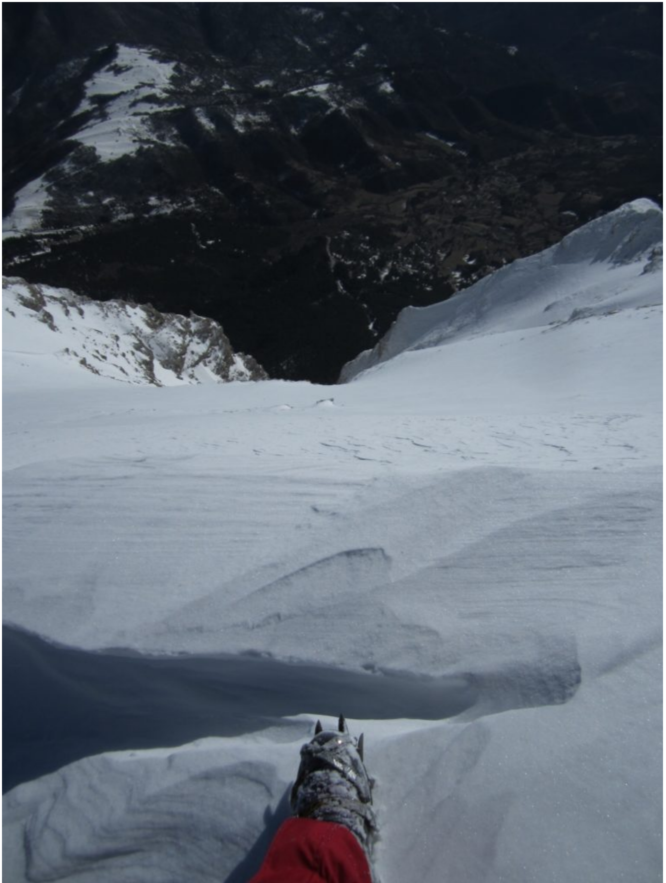
Veduta verticale mozzafiato sull'imbuto del Canalino, a destra la Piramide