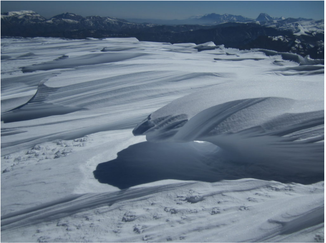
Cornici di neve sulla cresta per la cima di Pretare, sullo sfondo in Gran Sasso