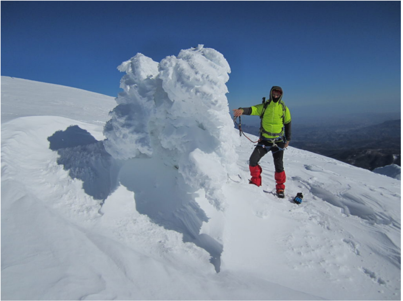
Sotto alla galaverna c'è la croce del M. Vettore