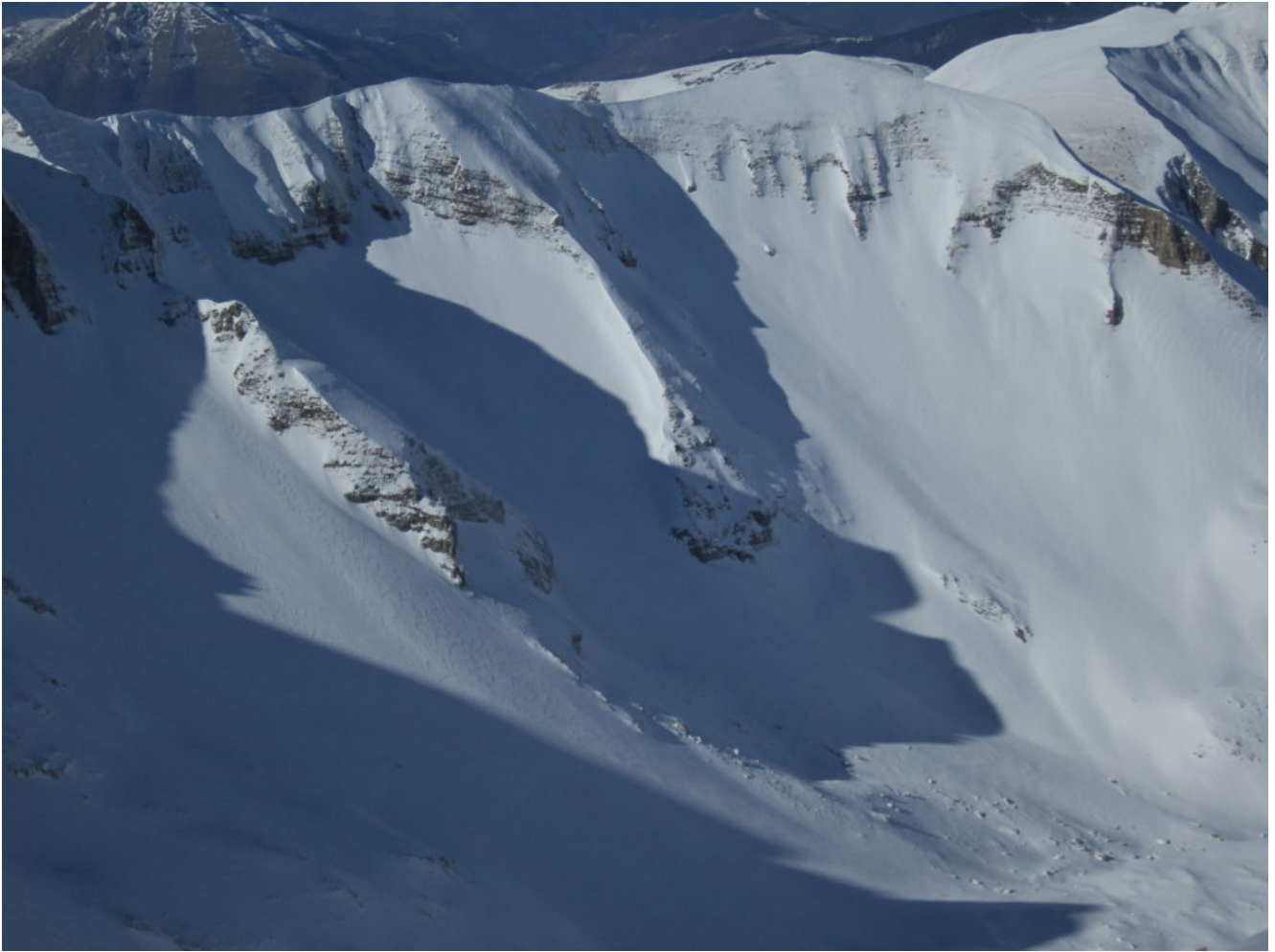
La cresta da Forca Viola al Quarto S. Lorenzo e la Valle di Pilato