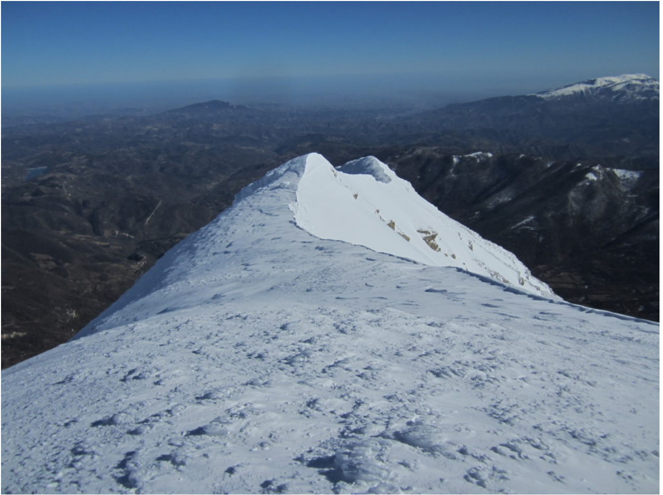
La cresta M. Vettore – Cima di Pretare