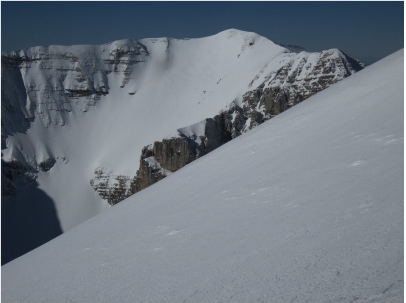
La Cima del Redentore ed il Pizzo del Diavolo visti dal pendio del M. Vettore