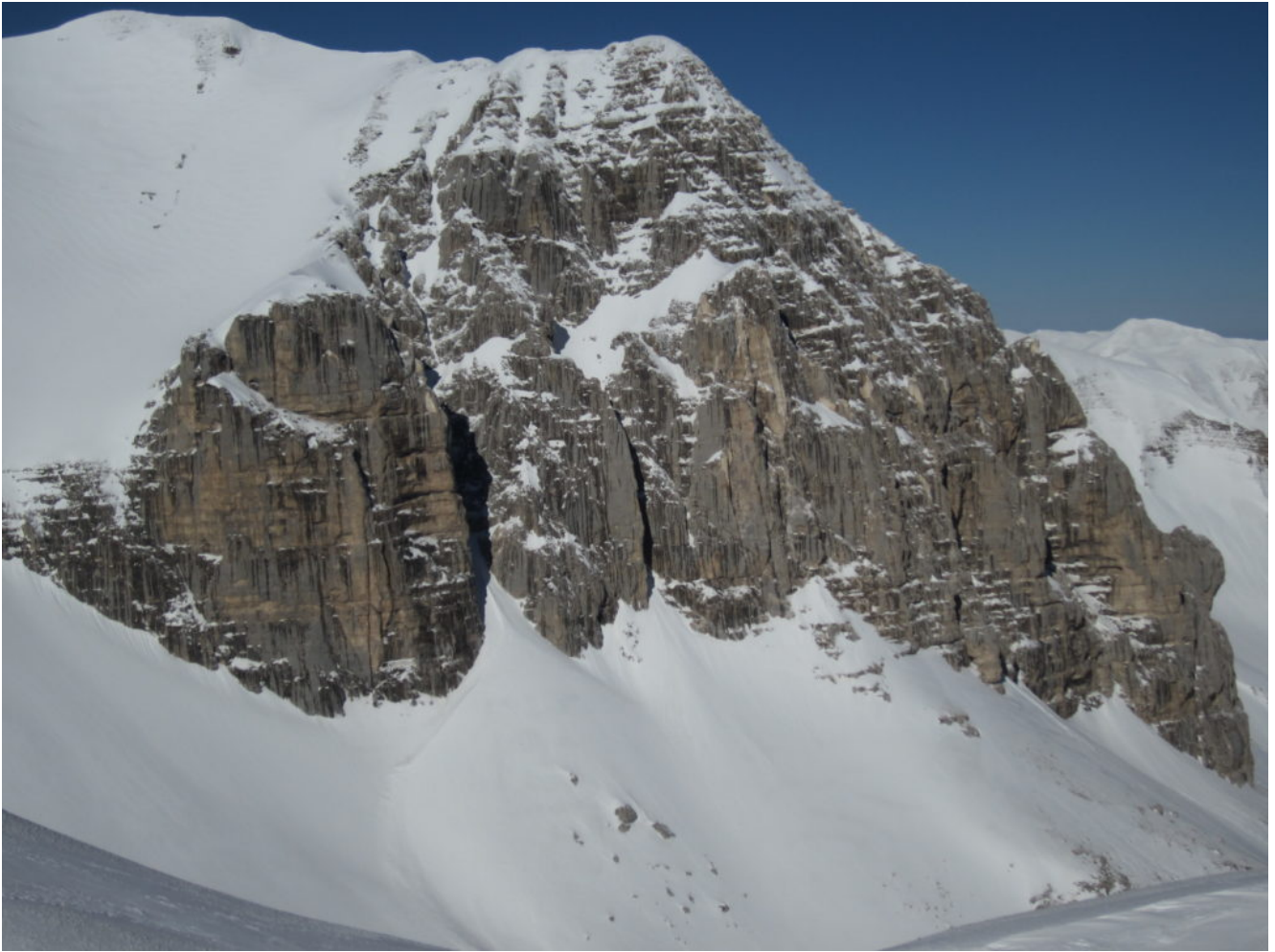
Il Pizzo del Diavolo