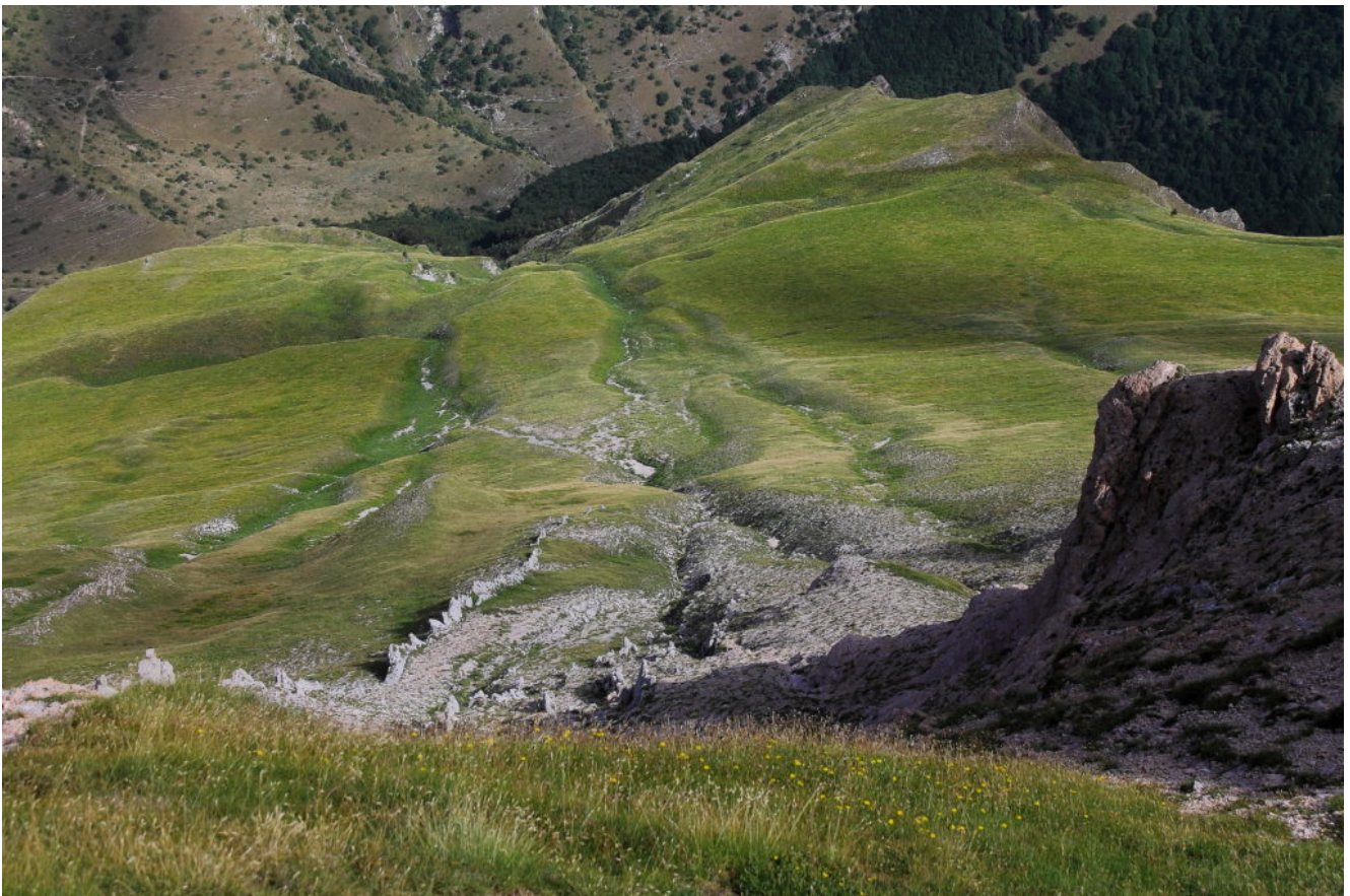
12- I ripidi canali rocciosi che scendono verso le Roccacce