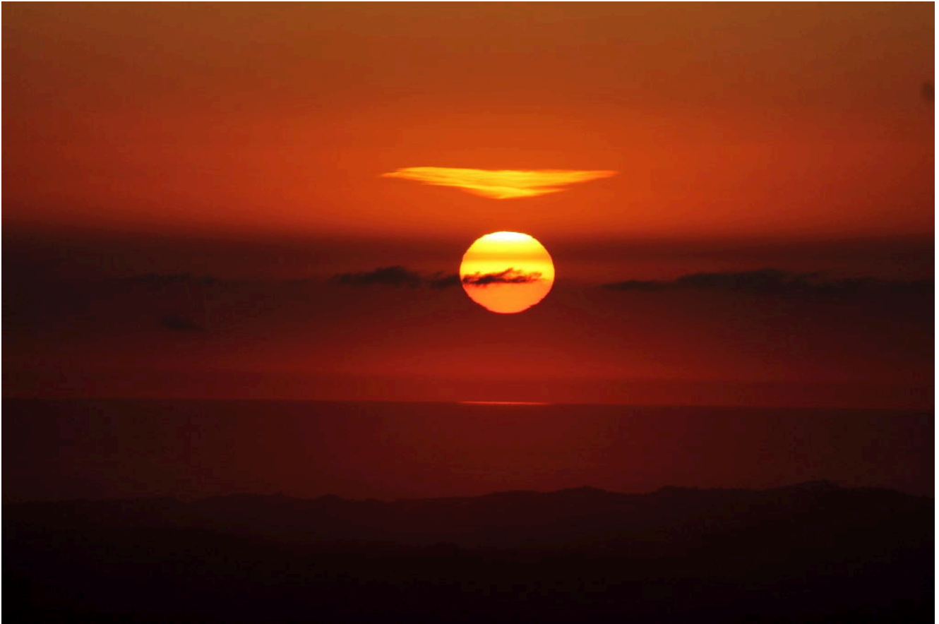
7- Il sole si riflette sul Mare Adriatico