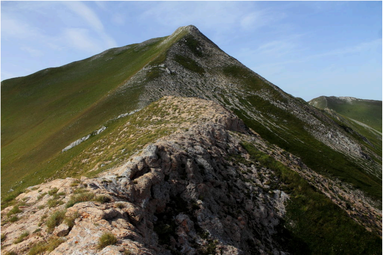
9- La cresta finale del Monte Priora o Pizzo Regina, a destra il Pizzo Berro.