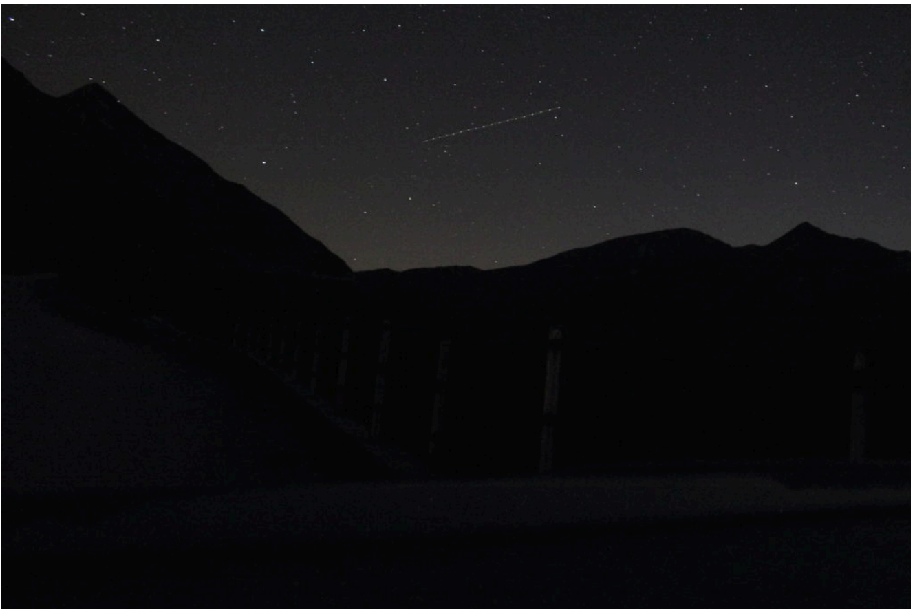
4- Il Monte Acuto ed il Monte Rotondo in notturna con passaggio di aereo