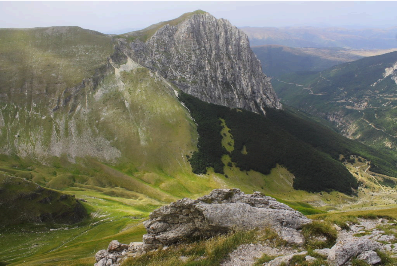
18- 13 agosto 2019, il masso Esner Ida, o quello che ne rimane (solo la base) dopo il terremoto dell'Ottobre 2016.