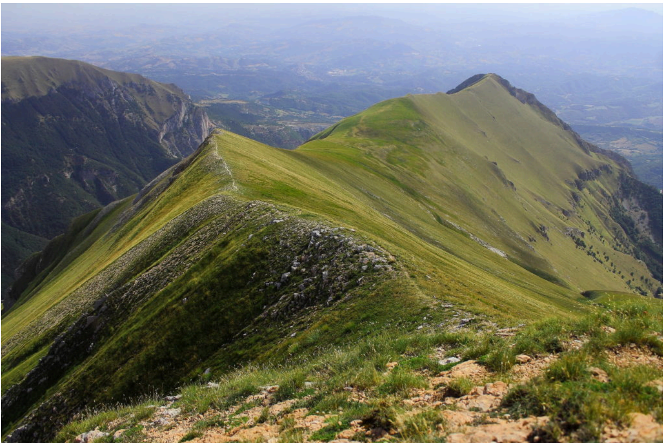
8- La lunga cresta da Il Pizzo (in basso) a Pizzo Regina