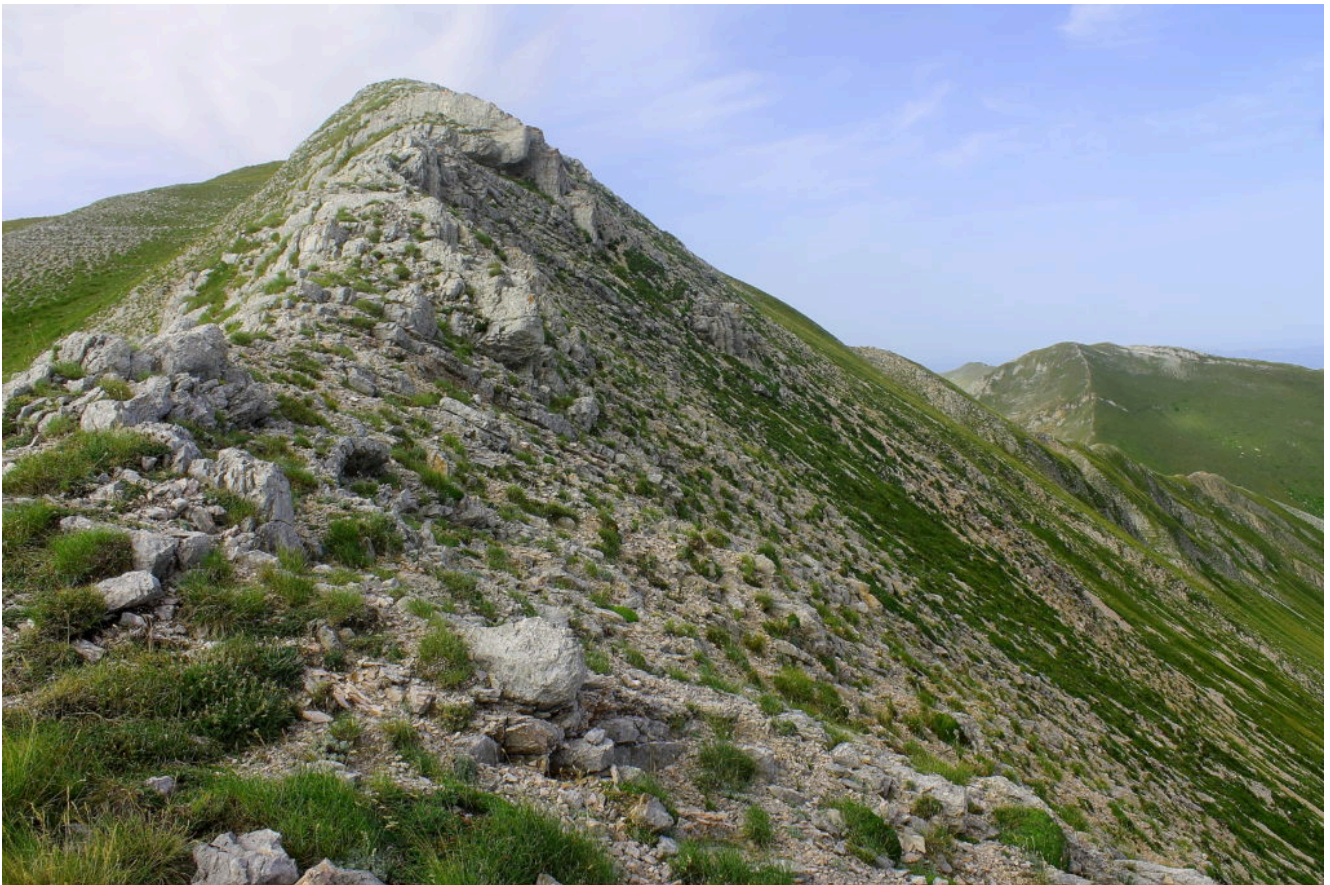
10- L'ultimo tratto di cresta rocciosa prima della cima del Pizzo Regina.