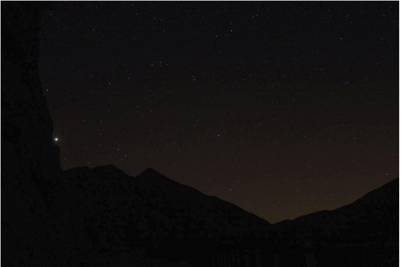
3- Il profilo notturno del Monte Acuto