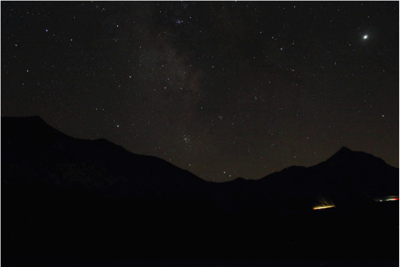
5 – La cresta dallo Scoglio del Montone al Monte Acuto in notturna con lo sfondo della Via Lattea e auto nella strada per il Rifugio del Fargno.