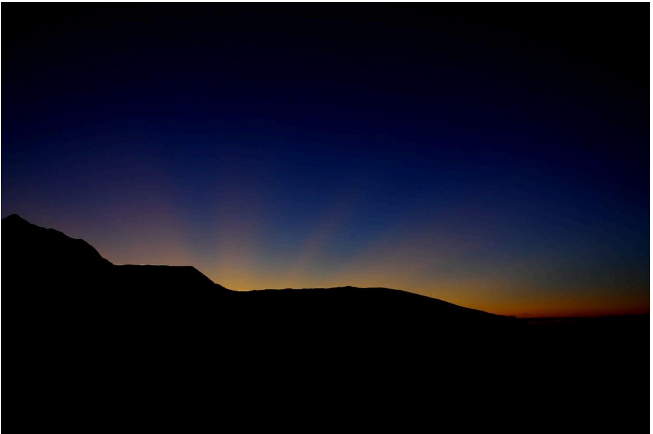
2- Tramonto verso Costa Vetiche