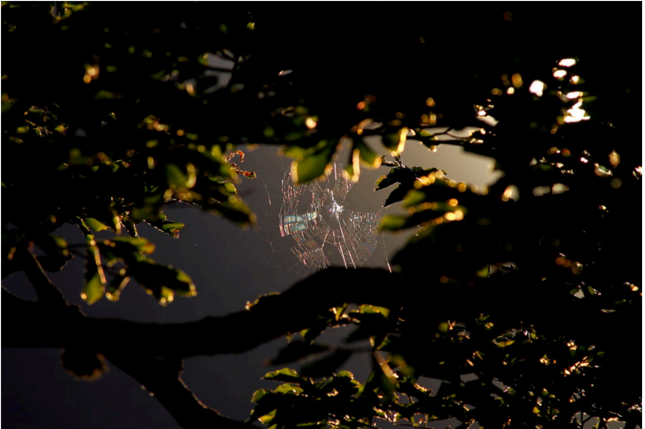
1- Ragnatela illuminata dal sole al tramonto nella Valle del Fargno.