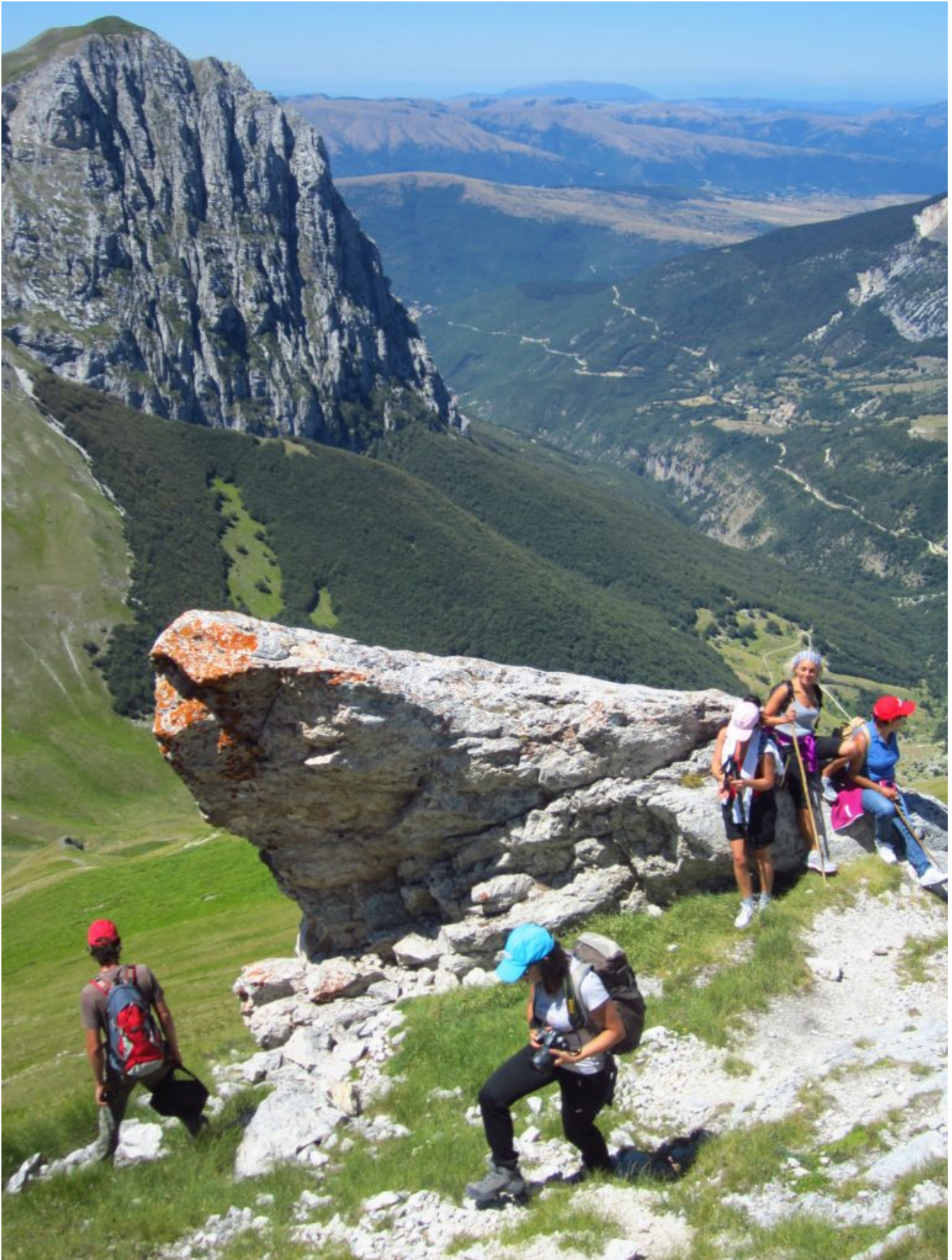
17- 3 agosto 2013, nei pressi del caratteristico masso isolato (denominato masso Esner Ida per la scritta a vernice presente) sulla cresta Ovest del Pizzo Berro, salendo dalla