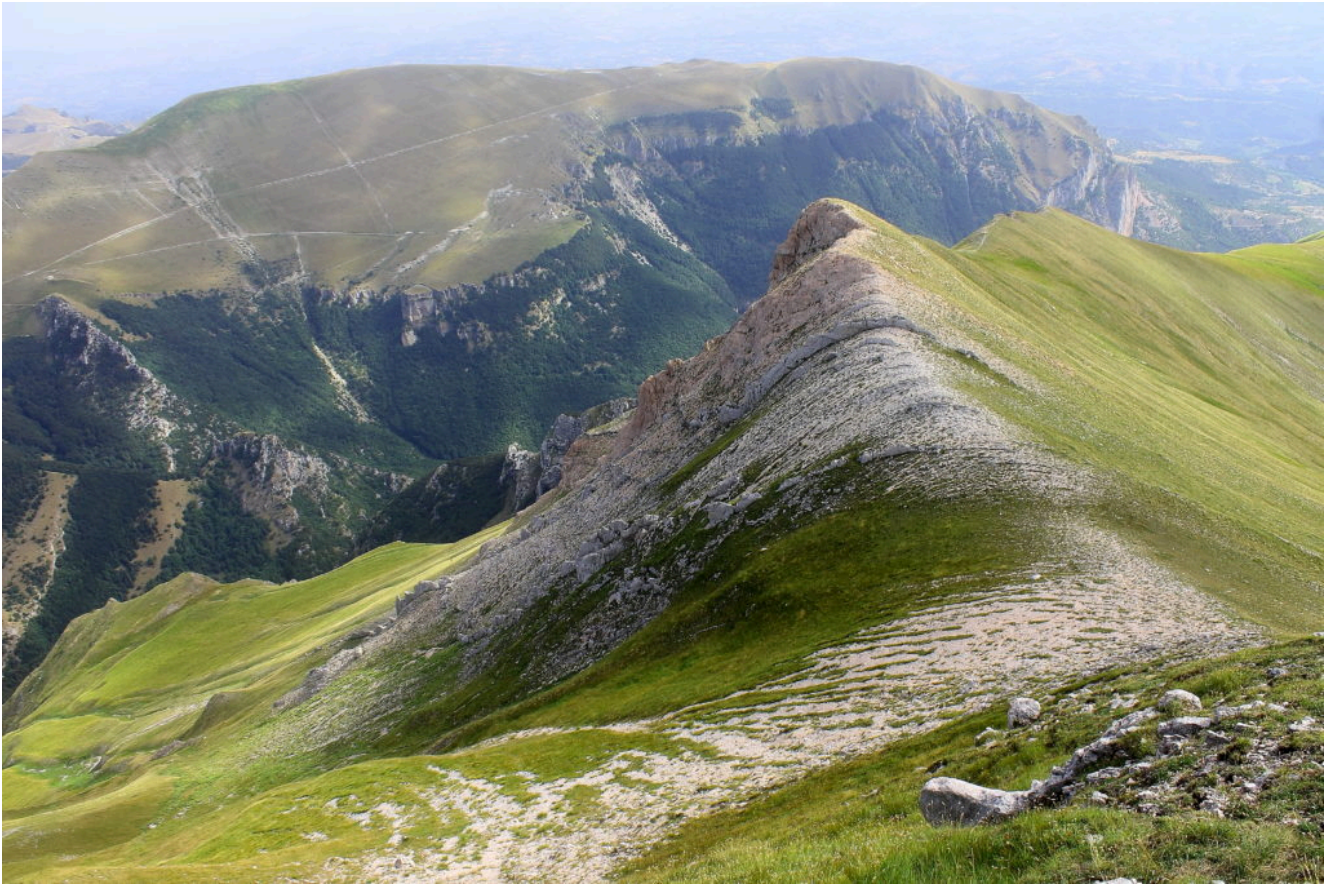
11- La cresta di salita vista dall'ultimo tratto prima della cima con il caratteristico torrione di scaglia rossa, sullo sfondo il Monte Castel Manardo.