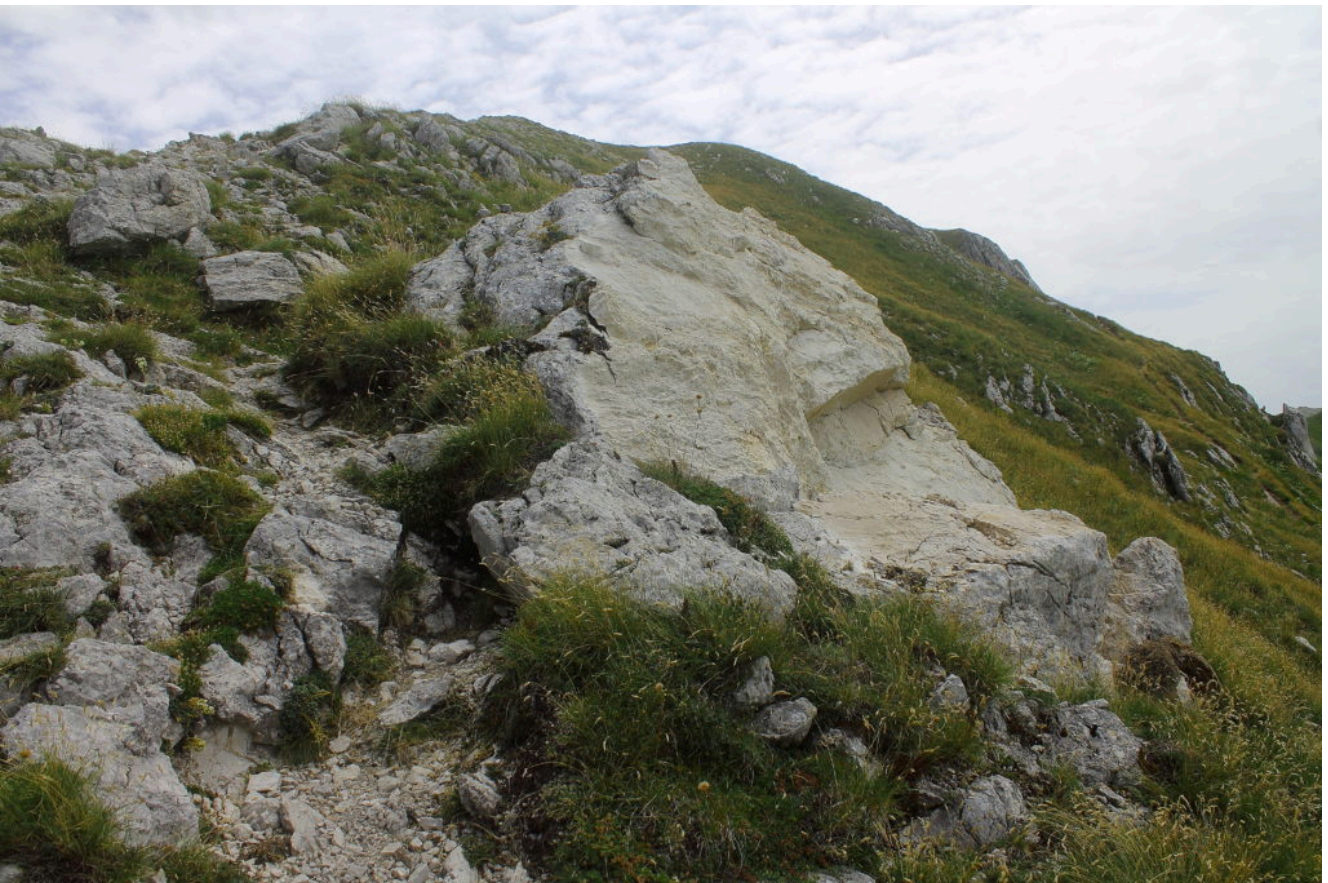
19- Il masso visto da valle, si nota la parte del distacco più