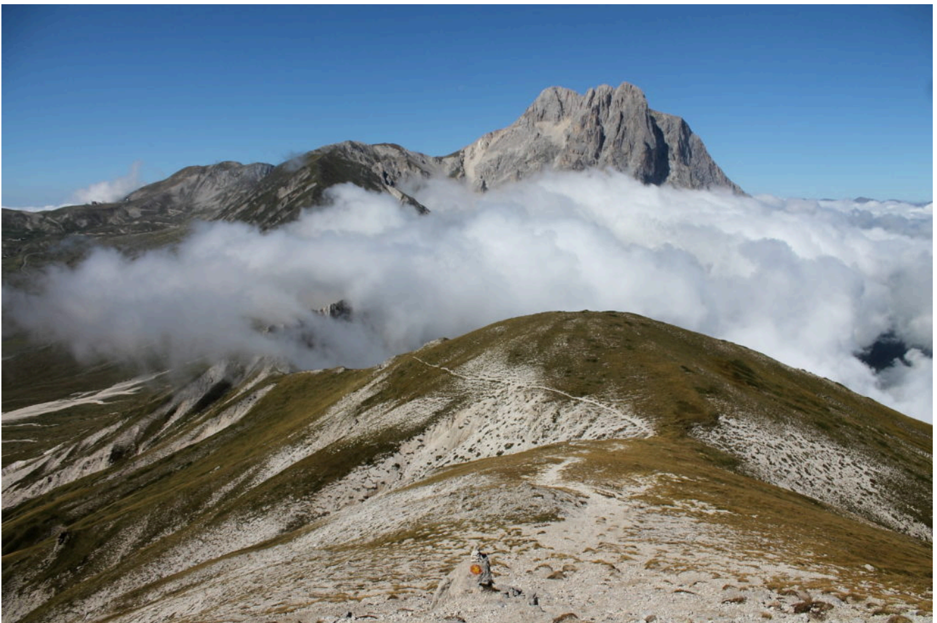
3- Giunti in prossimità della cima del M. Brancastello.