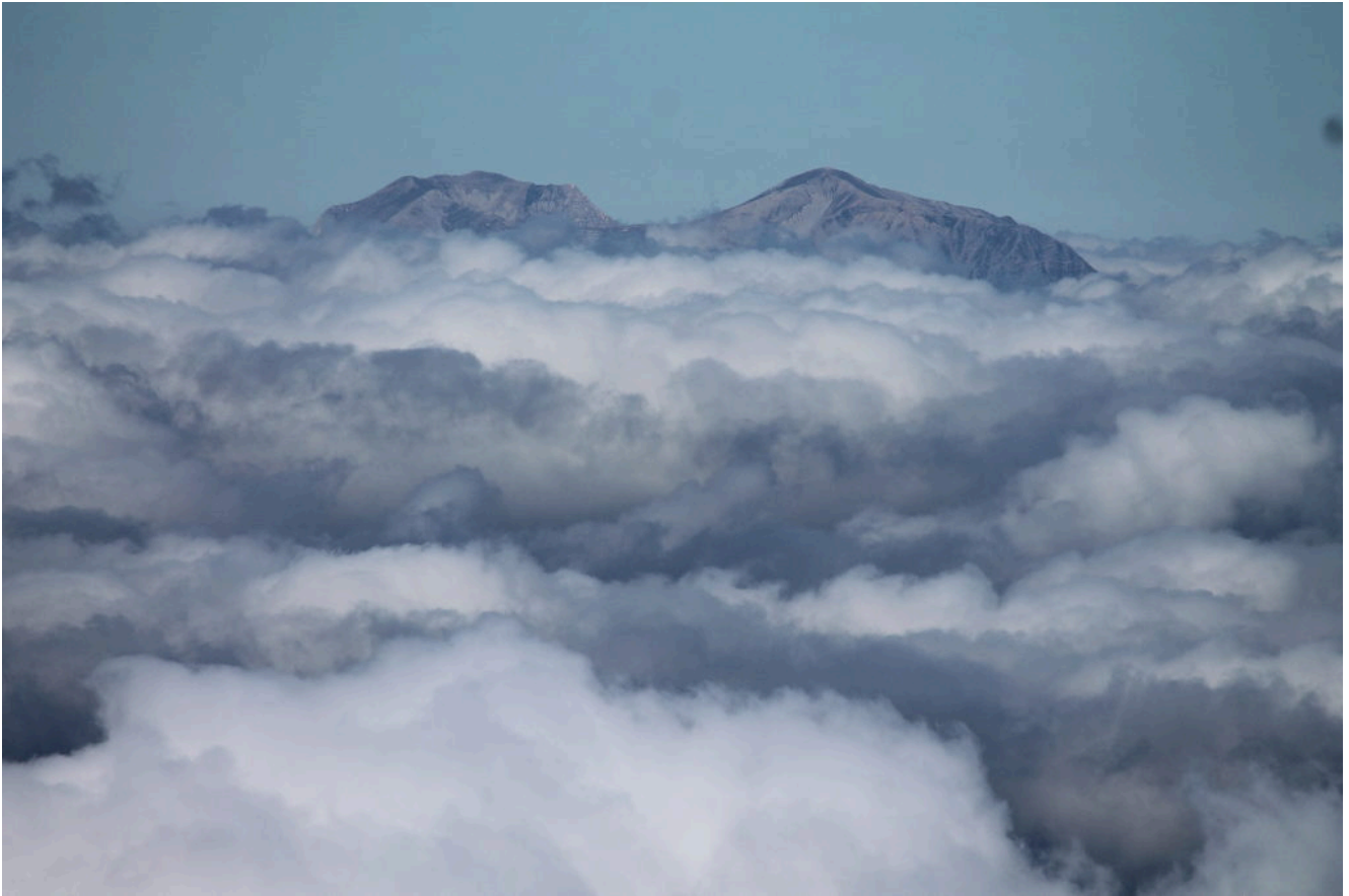
6- Il M. Vettore a destra e la Cima del Redentore nei Monti Sibillini a sinistra visti dal M. Brancastello