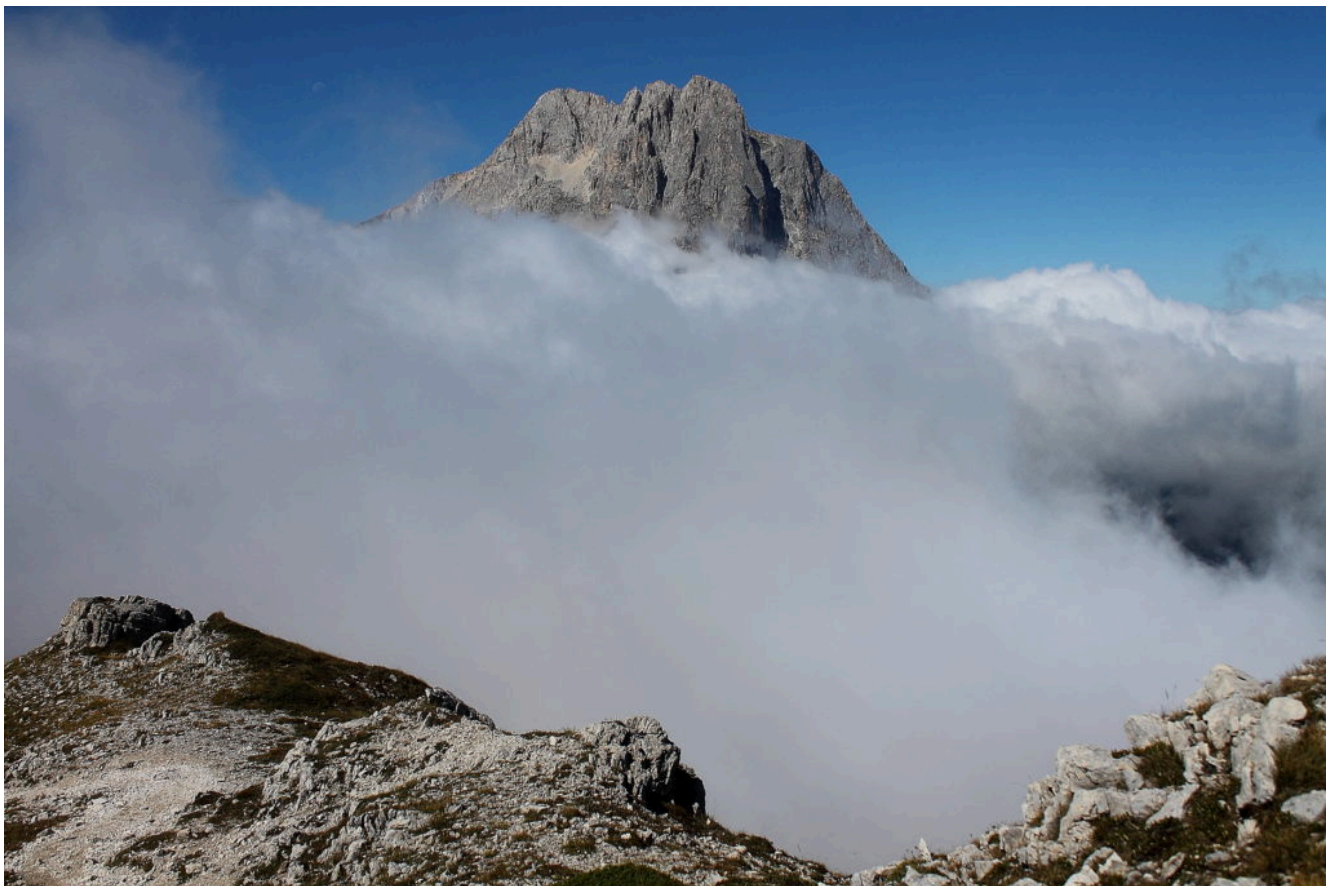
1- Il Corno Grande emerge dalla nebbia al Vado di Corno.

Di seguito le migliori immagini della giornata.