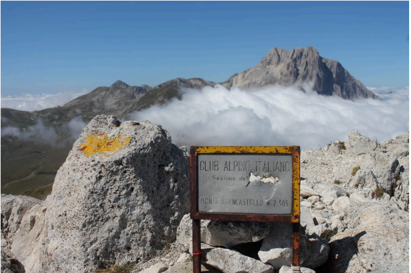
– La cima del M. Brancastello