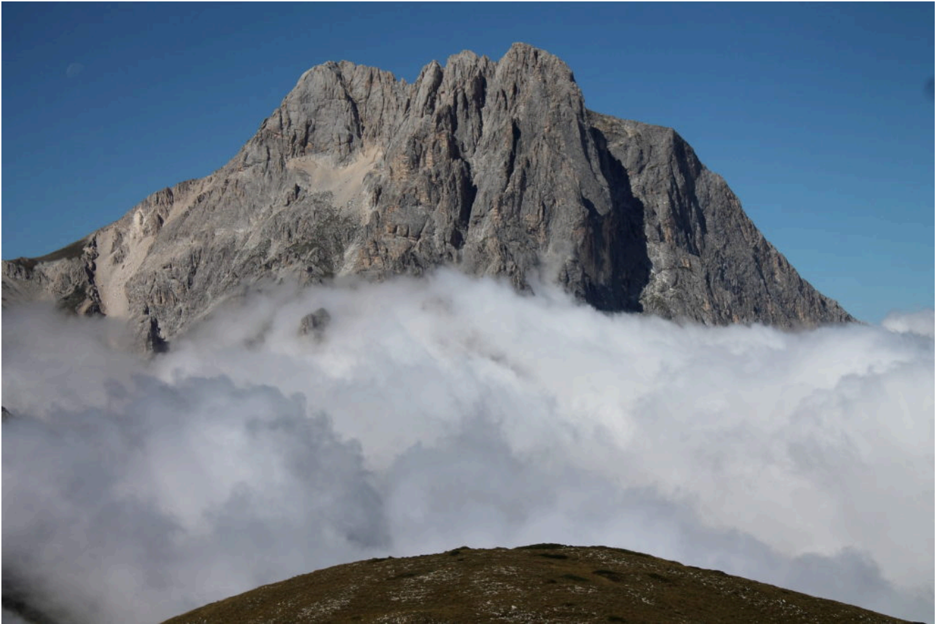
2- Il Corno Grande dalla salita verso il M. Brancastello.