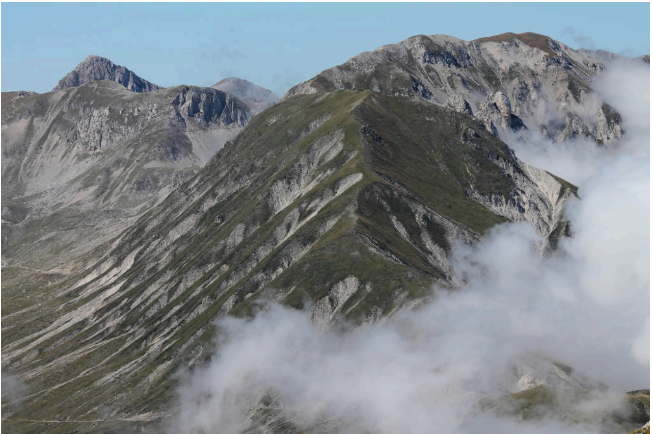
7- Il M. Aquila sovrasta il Vado di Corno sommerso dalla nebbia. Sullo sfondo a sinistra il Pizzo Cefalone.