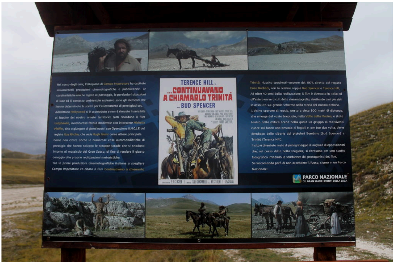
18- Il cartello all'imbocco della Valle della Macina a Campo Imperatore