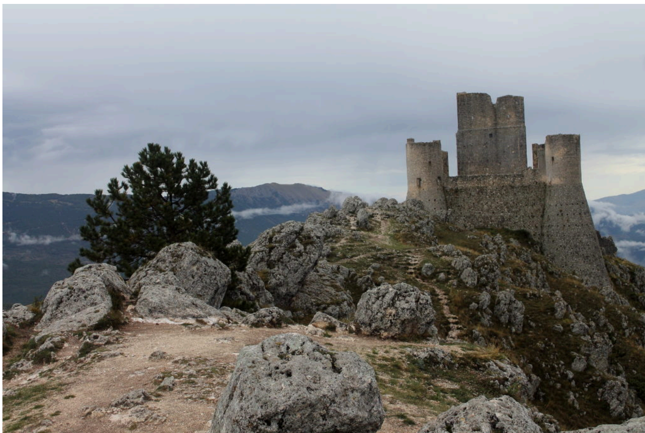
1- 2 – 3 Il castello di Rocca Calascio.

E la Valle della Macina che scende dal versante Ovest del Monte Camicia dal vallone della Miniera di Bitume dove è stato girato un famoso film con Bud Spencer e Terence Hill.