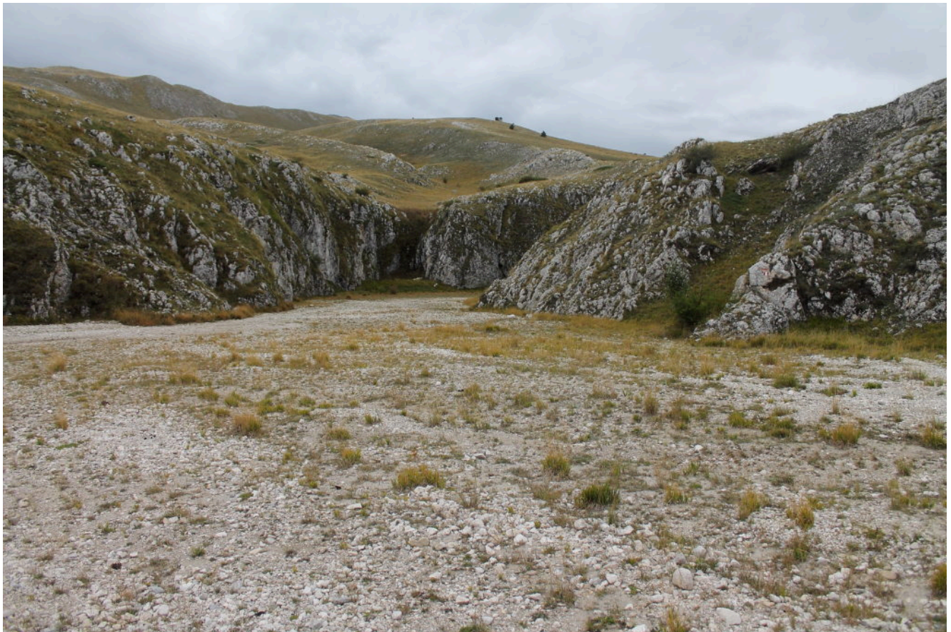
19- La Valle della Macina sul versante sud-ovest del Monte Camicia – Campo Imperatore