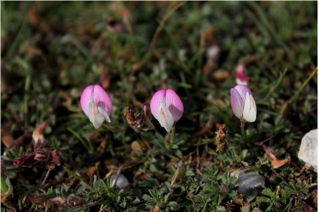
20- Ononis cristata subsp. apennina ai lati del sentiero della Valle delle Macine.