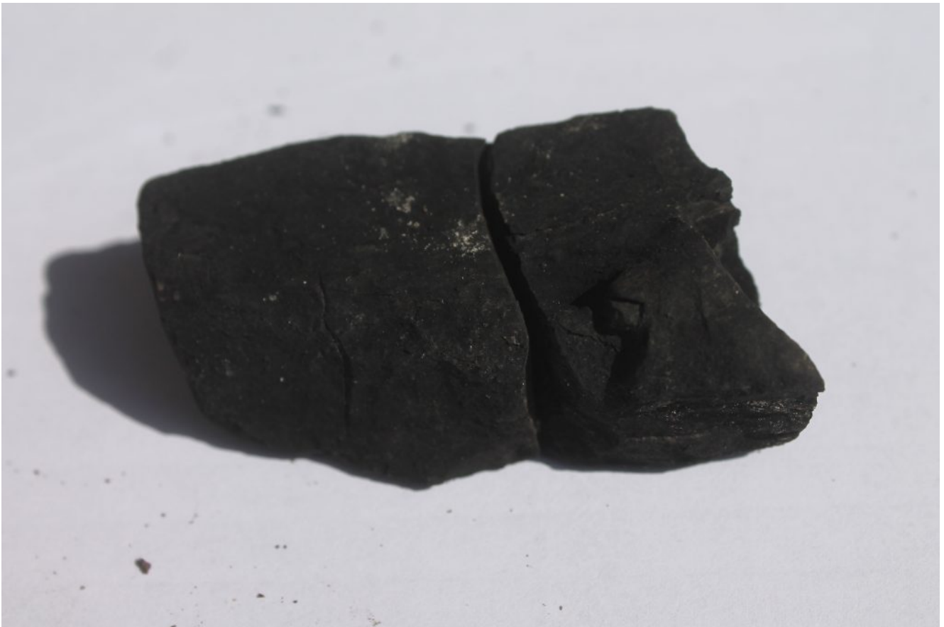
21- 23- Frammenti di scisto bituminoso provenienti dalla Miniera del Monte Camicia.