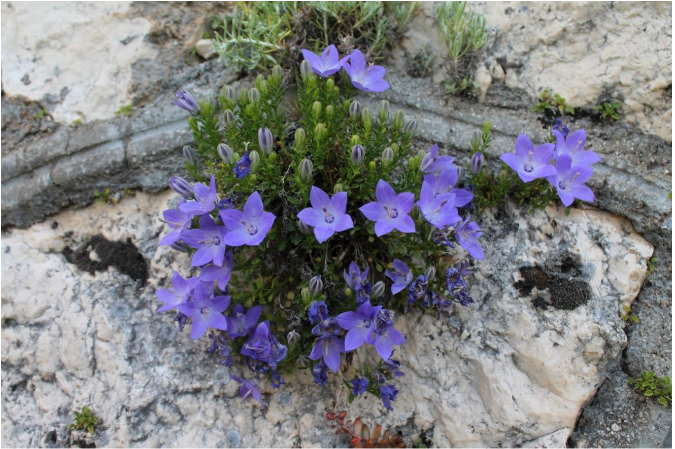
4 -12- La rarissima Campanula fragilis subsp. cavolini cresce sulle pareti del castello di Rocca Calascio. (fotografata nel Giugno 2021)