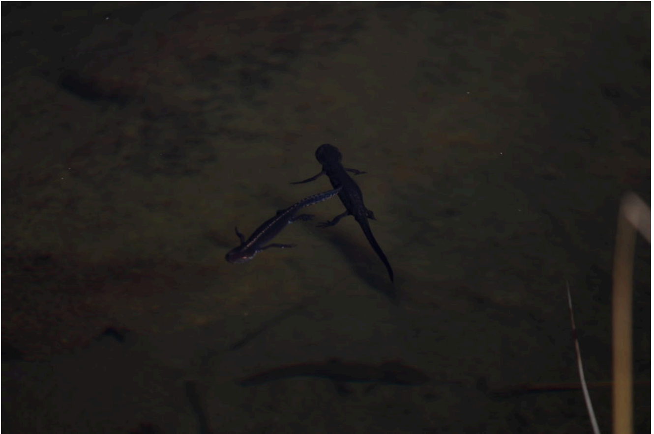
6- Tritoni alpini nelle acque del lago.