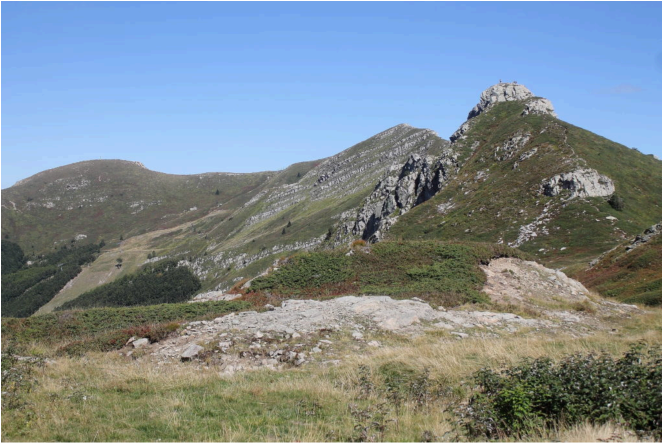
13- Il Monte Gomito, situato tra i due laghi, sopra ai campi da sci ad Ovest dell'Abetone