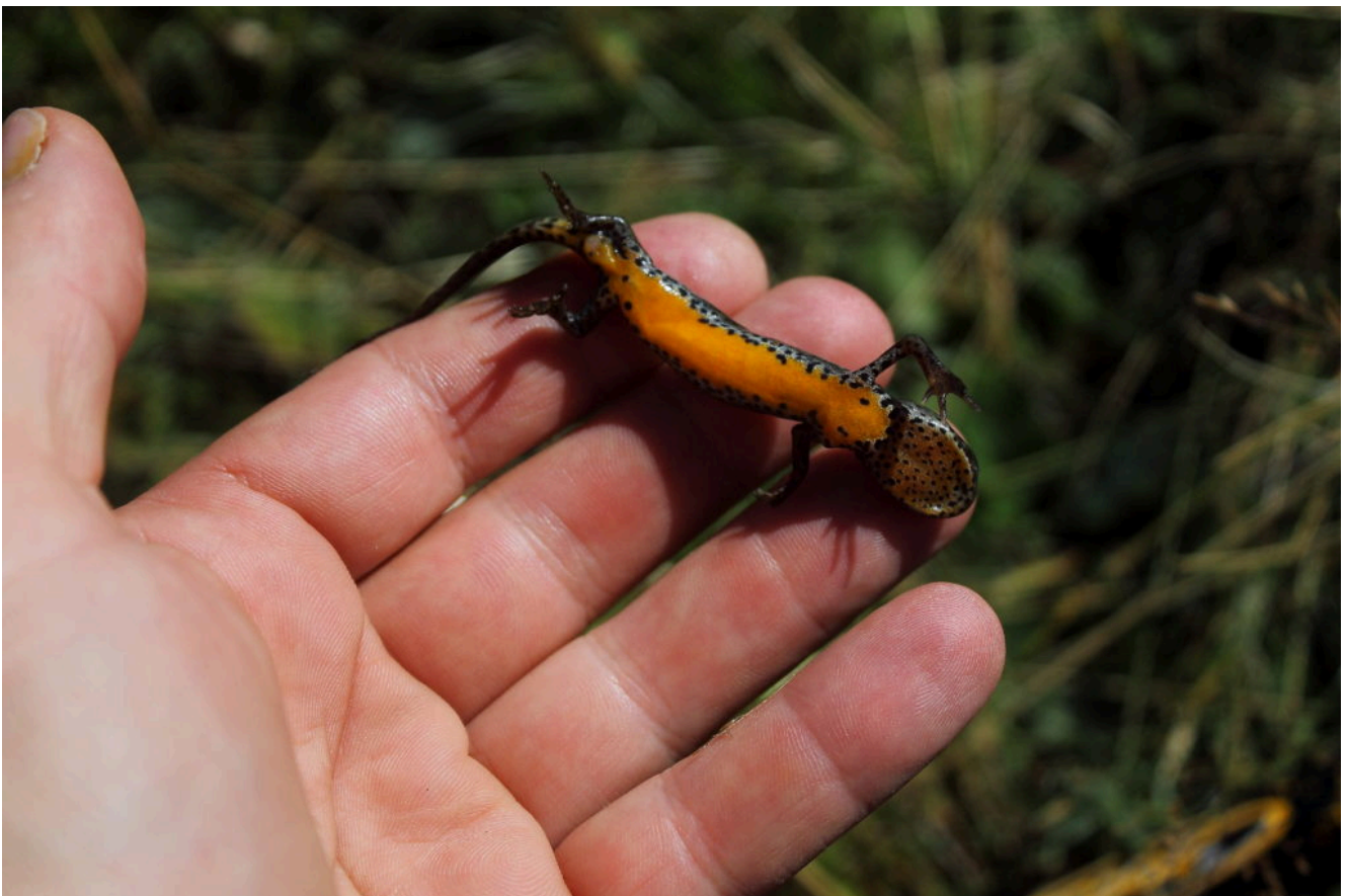
7- Il ventre giallo dei tritoni alpini