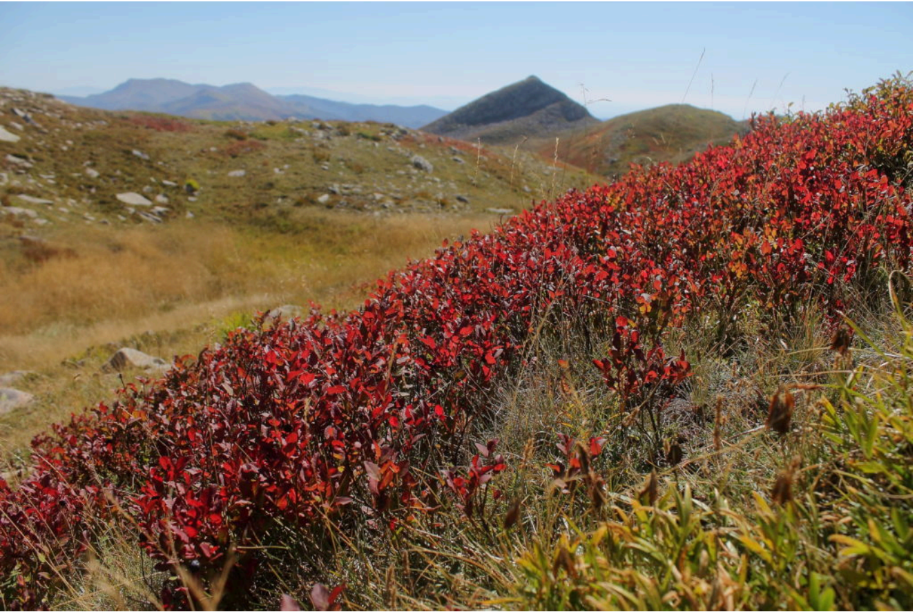
11- Mirtilli in veste autunnale