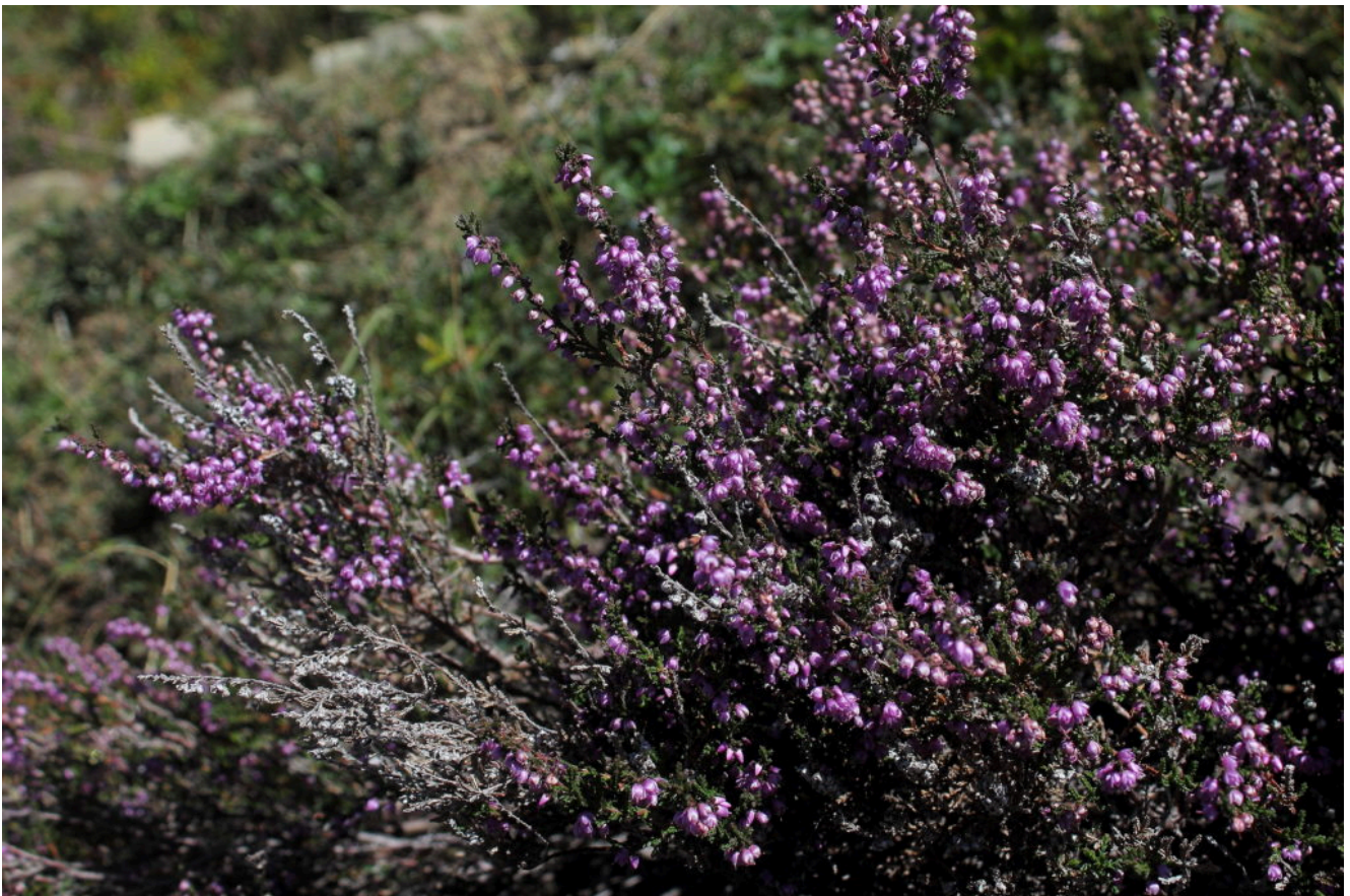
17- Calunna vulgaris in piena fioritura di fine estate nei