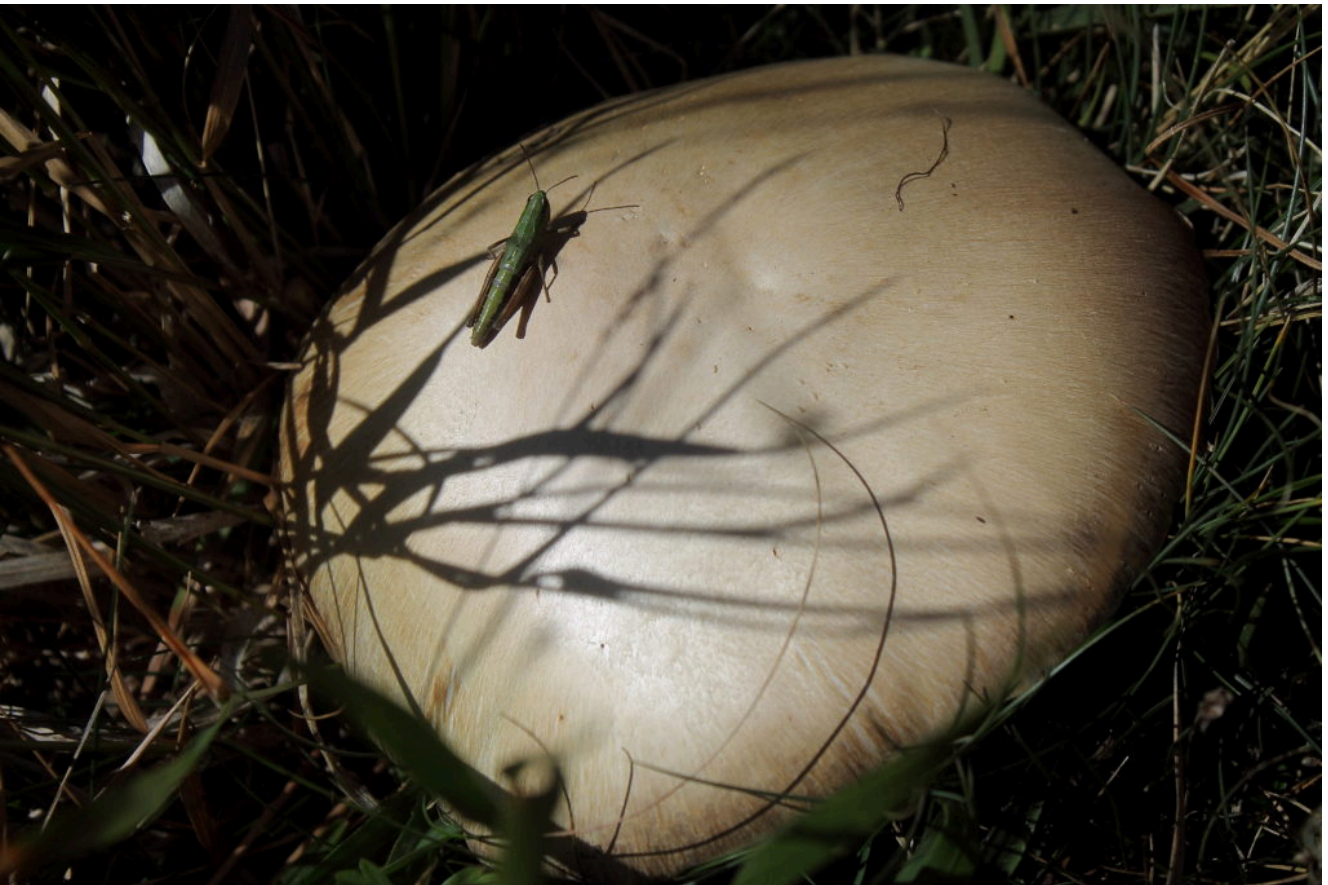
12- Prataiolo con grillo