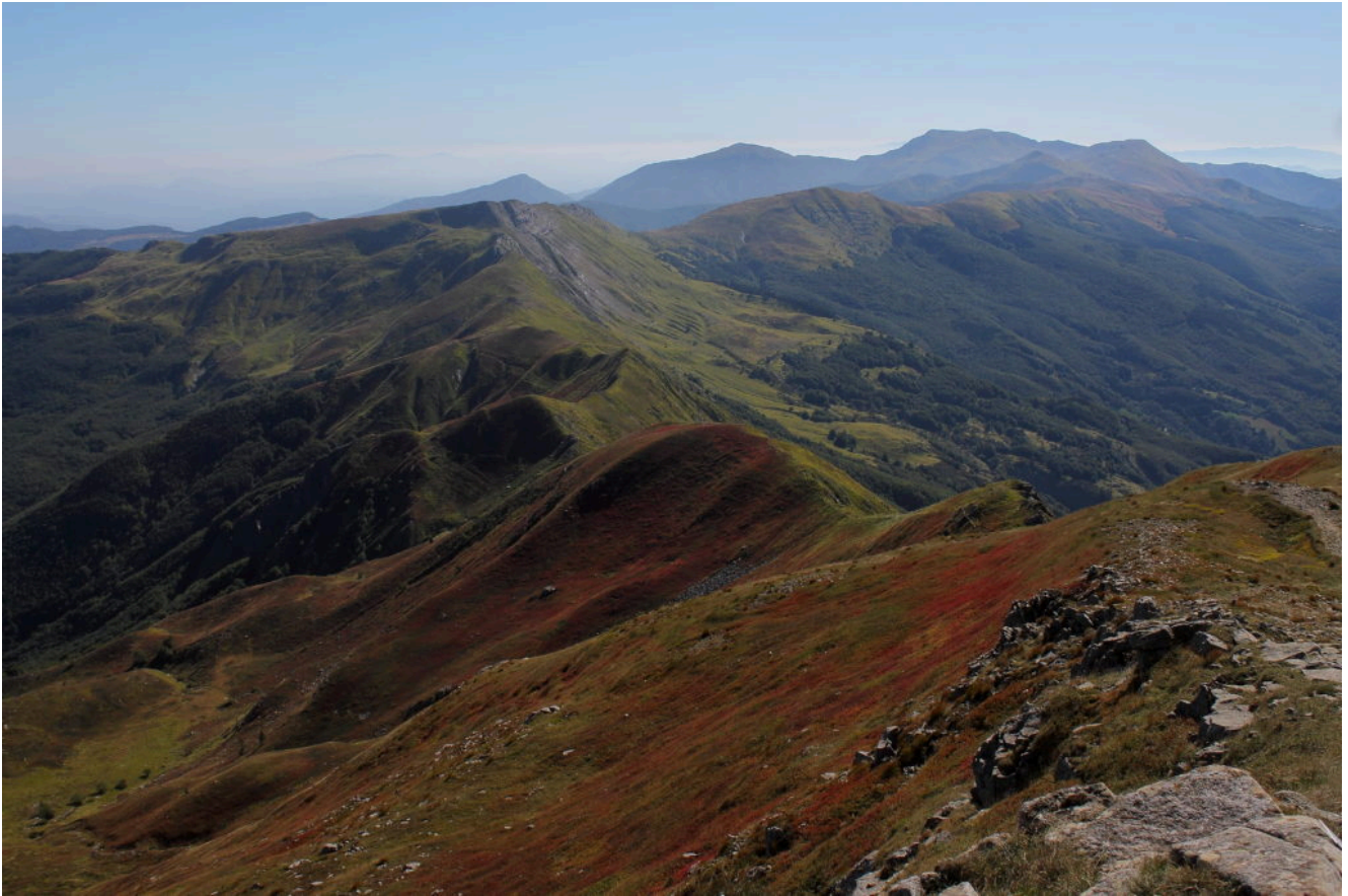
5- Veduta dalla cima del Monte Libro Aperto verso Sud, Sullo sfondo a destra il Corno alle Scale. In primo piano i vastissimi mirtilletti della zona, i più estesi dell'Appennino, in veste autunnale.