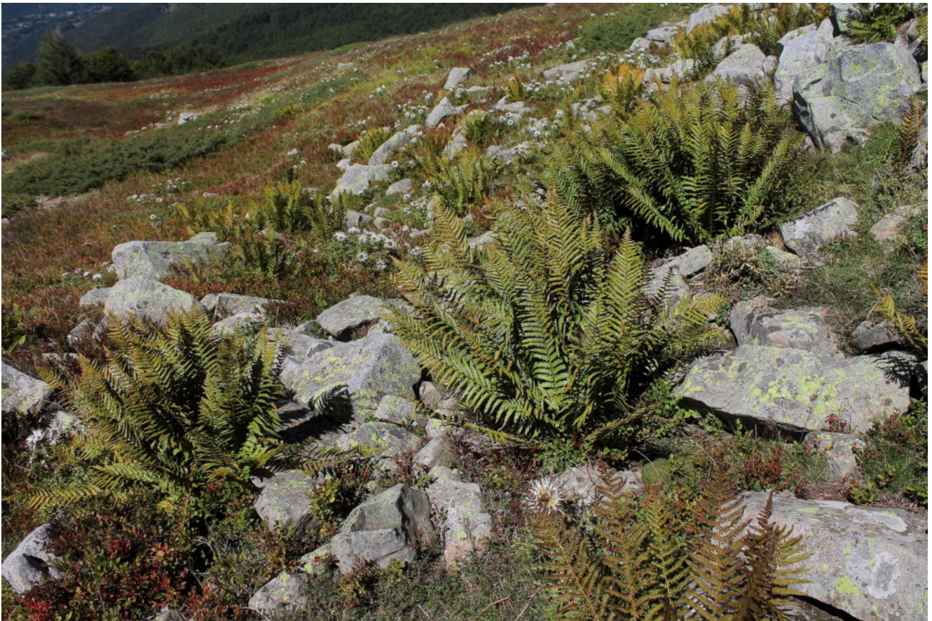
16- Cespugli di bellissime felci tra le rocce del Monte Belvedere.