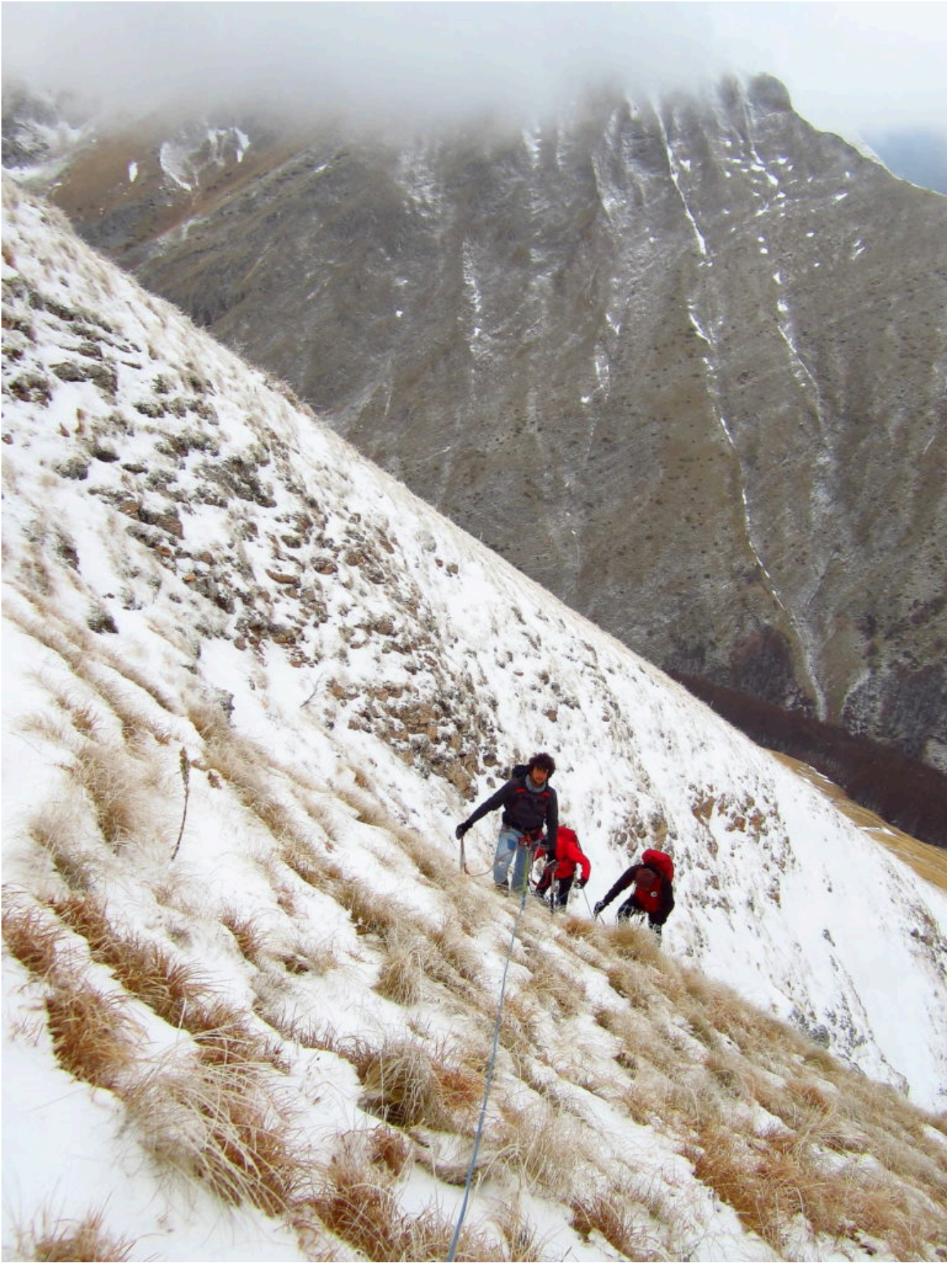
14- Il pendio finale.