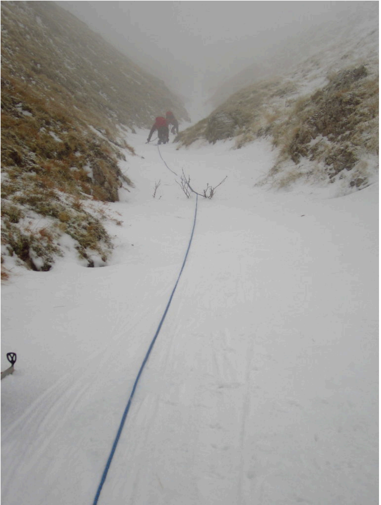
5- A metà canale arriva anche nebbia e nevischio.