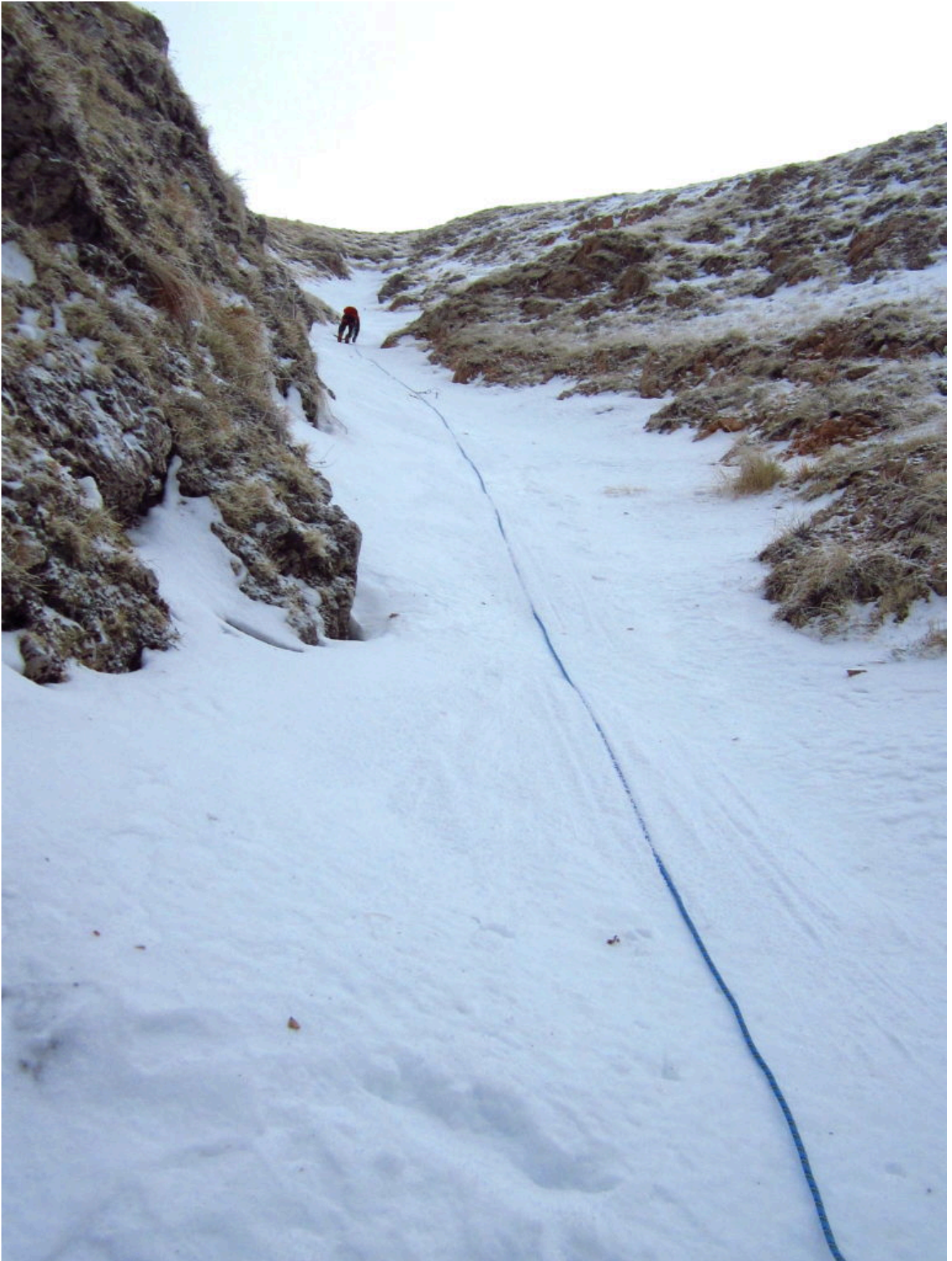
7 – 8 La parte terminale del canale.