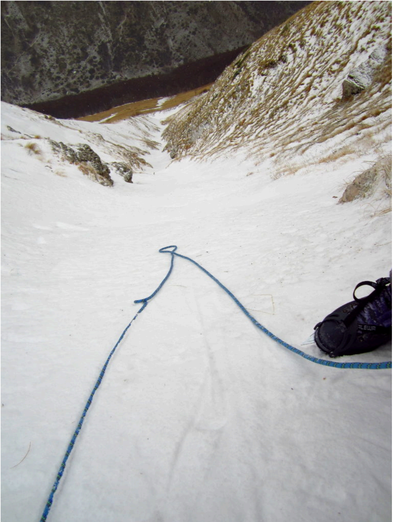
12- Il canale visto dal suo termine