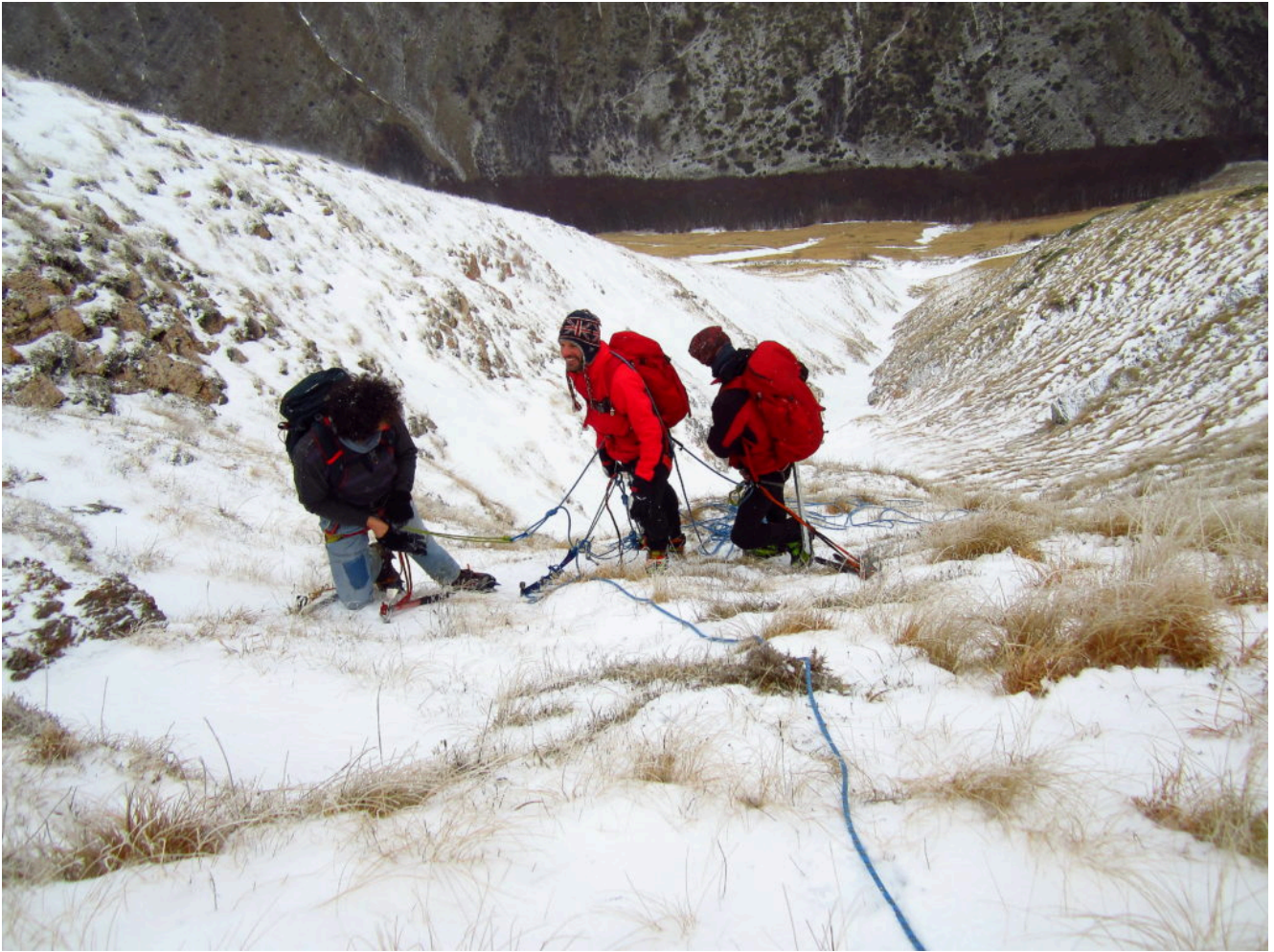
13- L'uscita dal canale con l'ultimo punto di sosta.