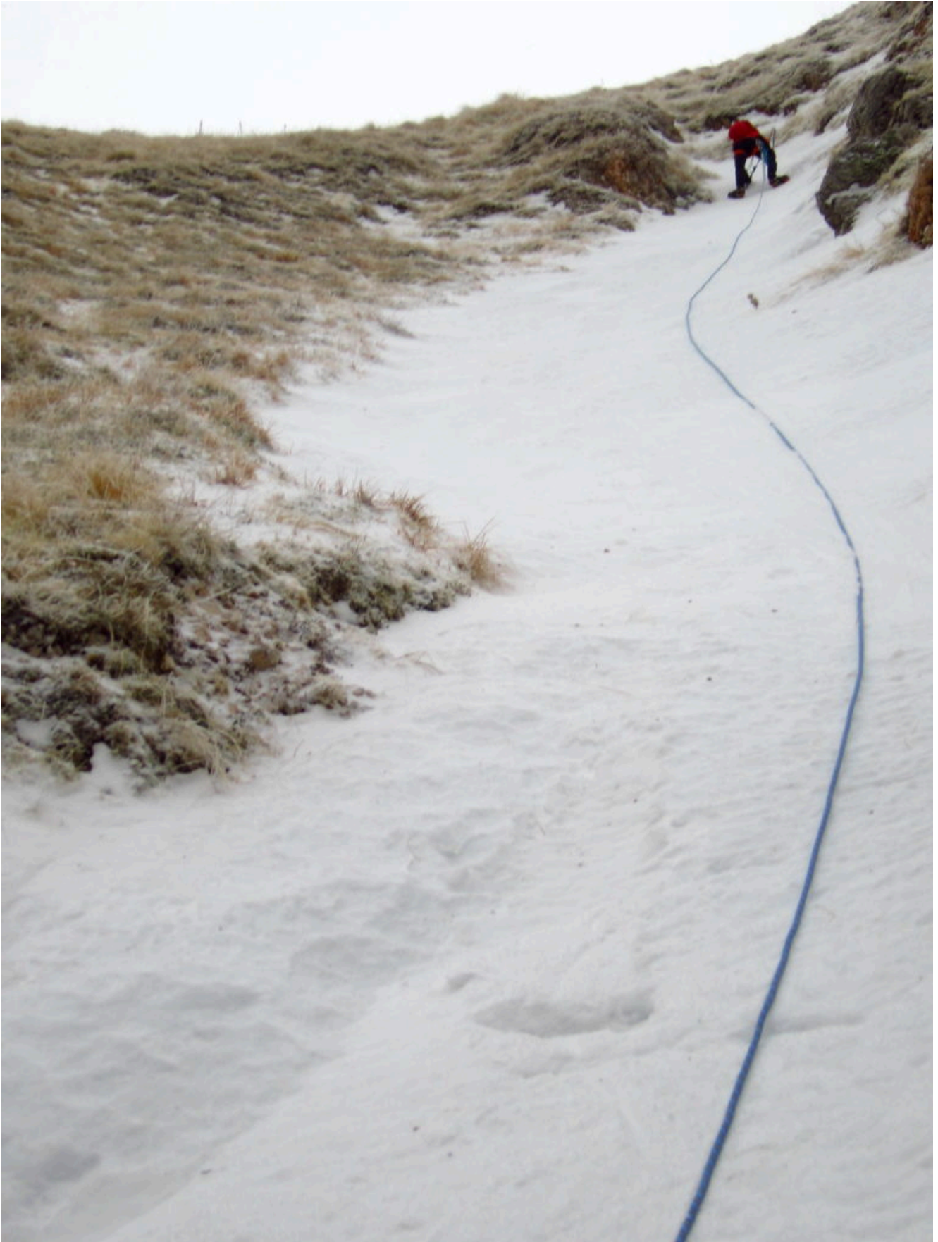
10 – 11 L'ultimo lembo di ghiaccio poi uscita su ripido misto.