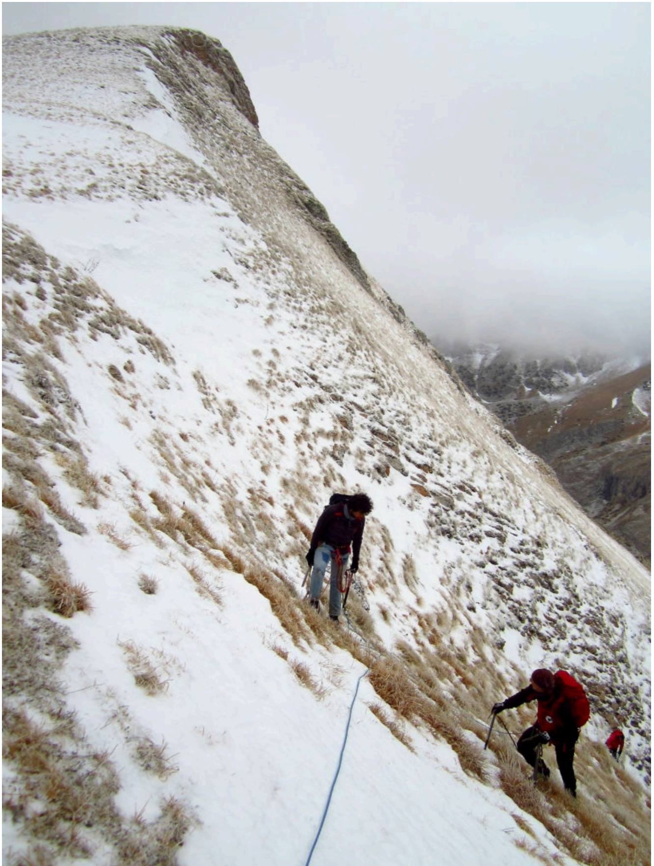
15- L'uscita nei pressi di Cima Acquario, a sinistra.