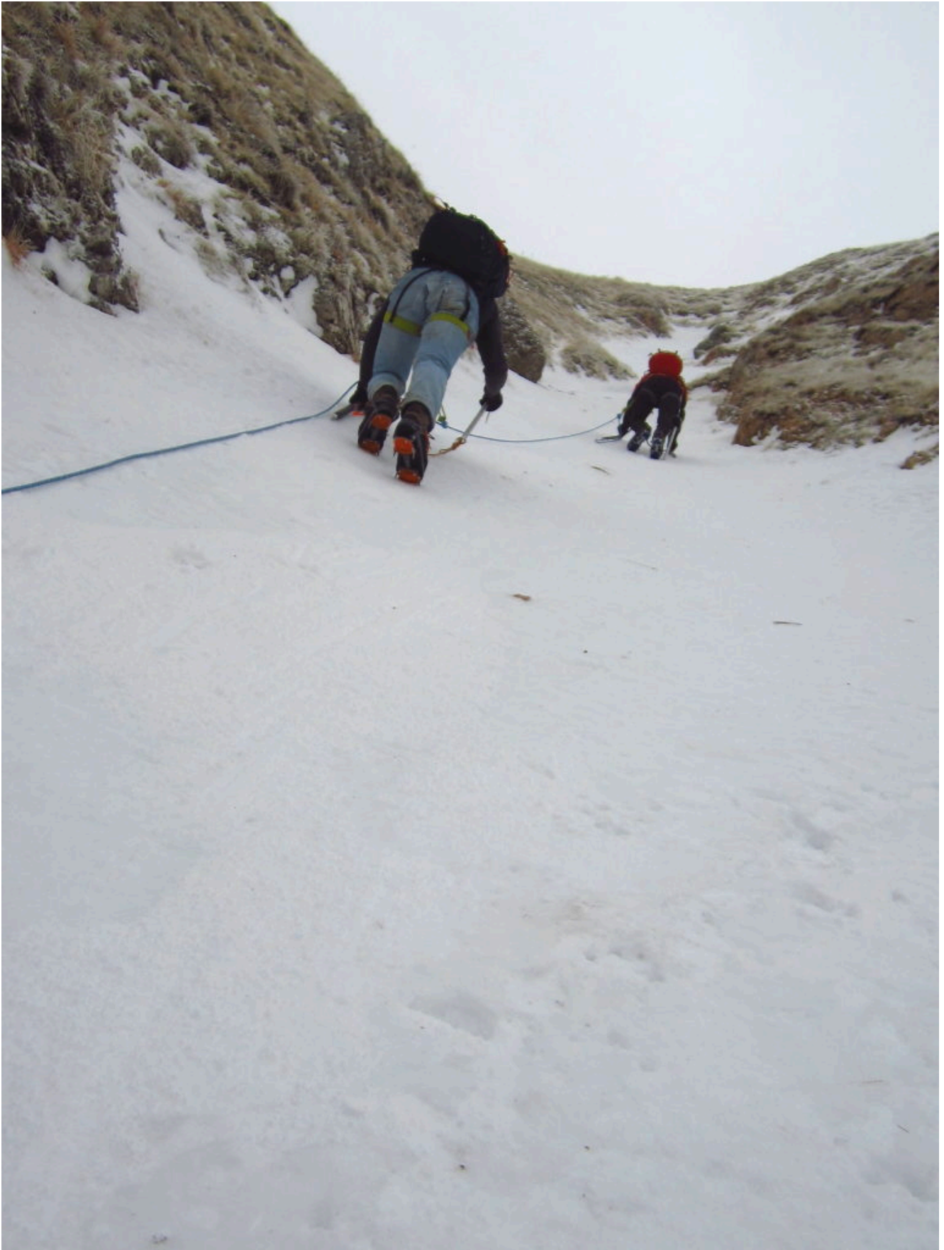
9- Verso l'uscita del canale su pendio sempre più ripido.