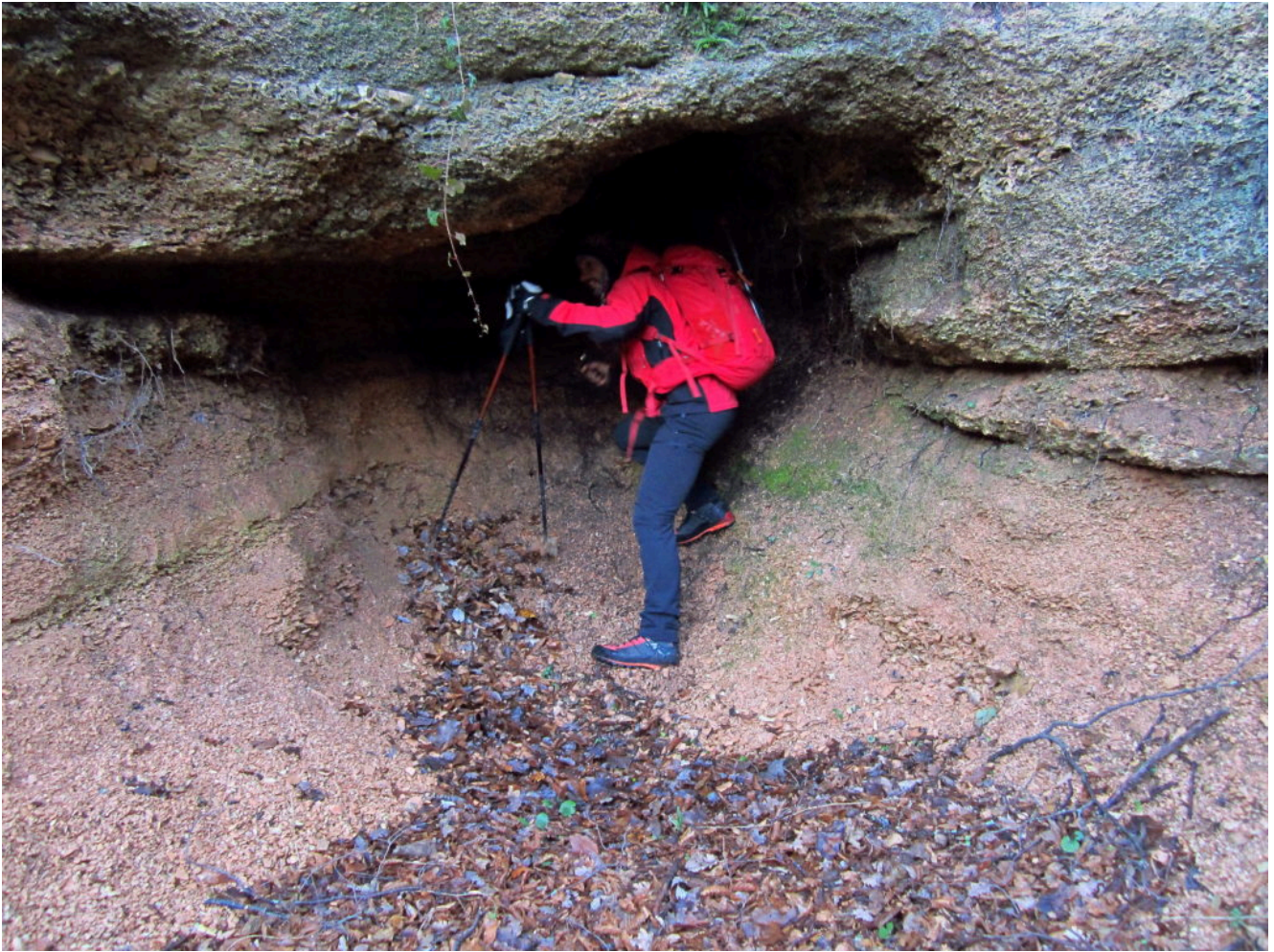
3- La Grotta del Maciniccio