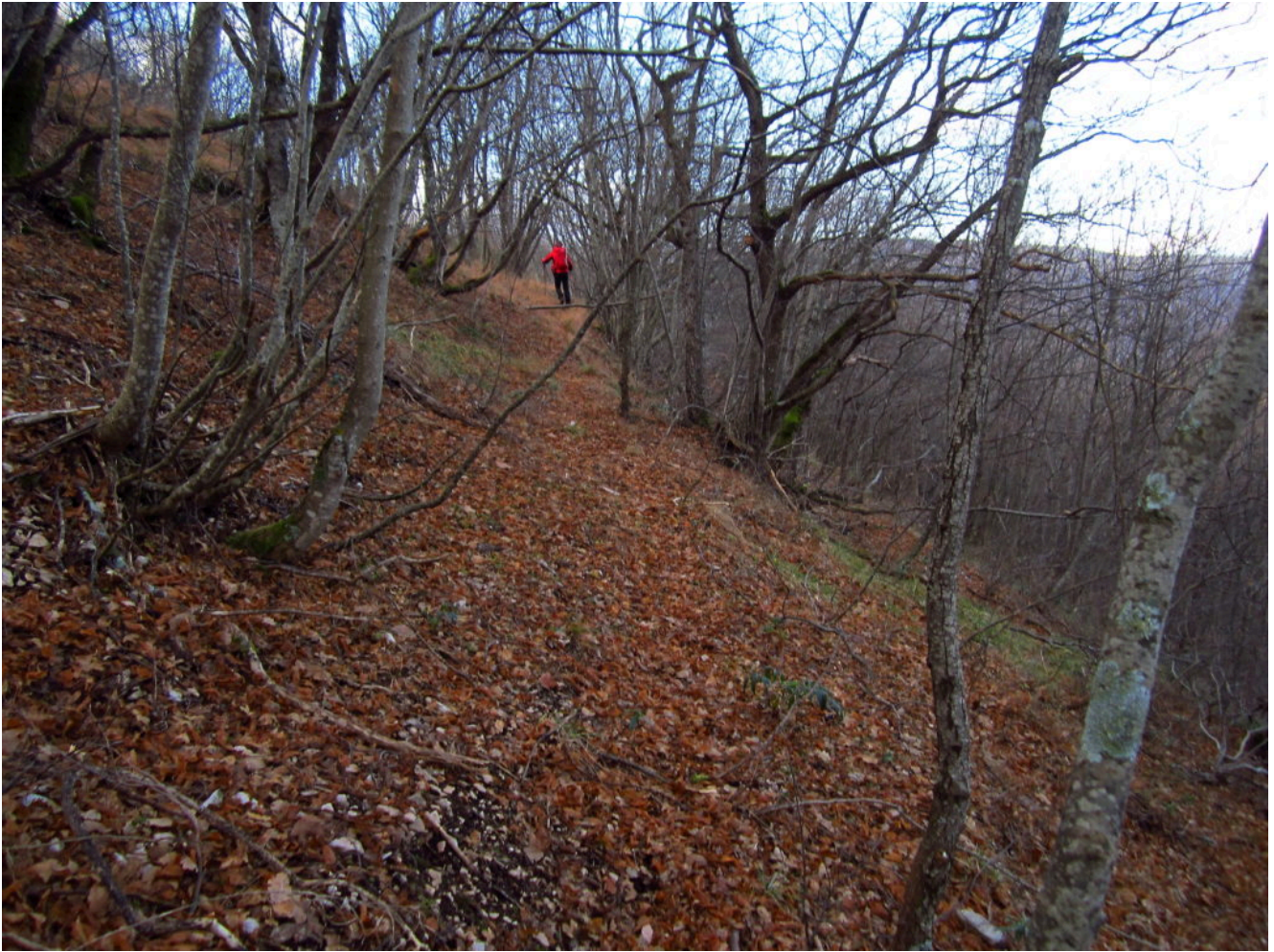
6- La traccia di sentiero all'interno del bosco che riporta verso la captazione.