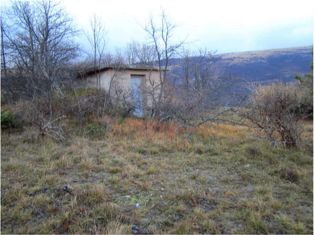
1- La captazione dell'acquedotto