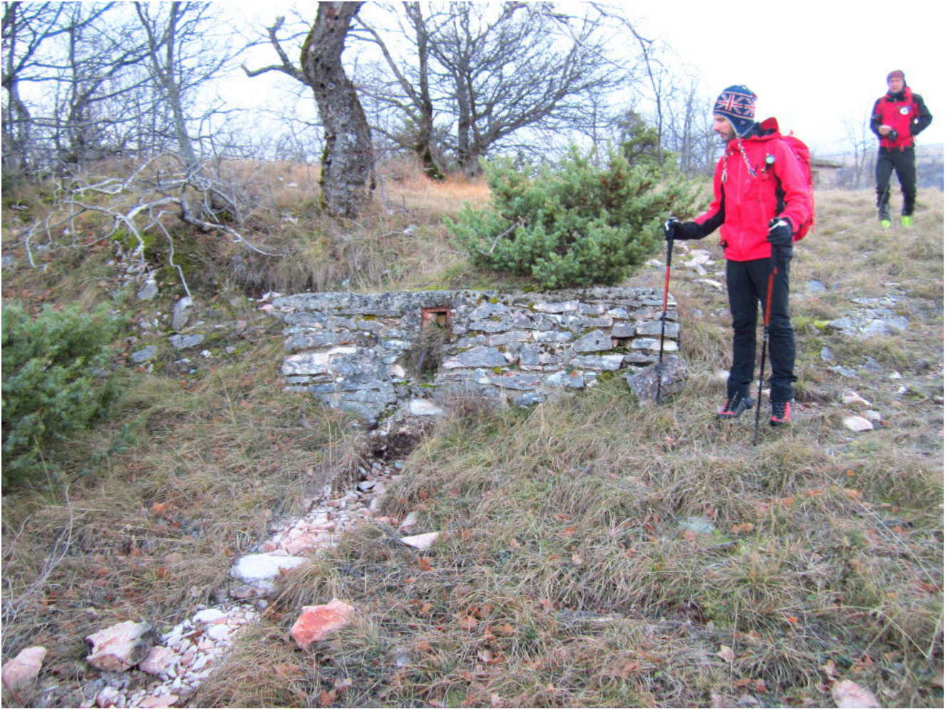
2- La vecchia fontana nei pressi della captazione visibile a destra tra Stefano e Fausto.