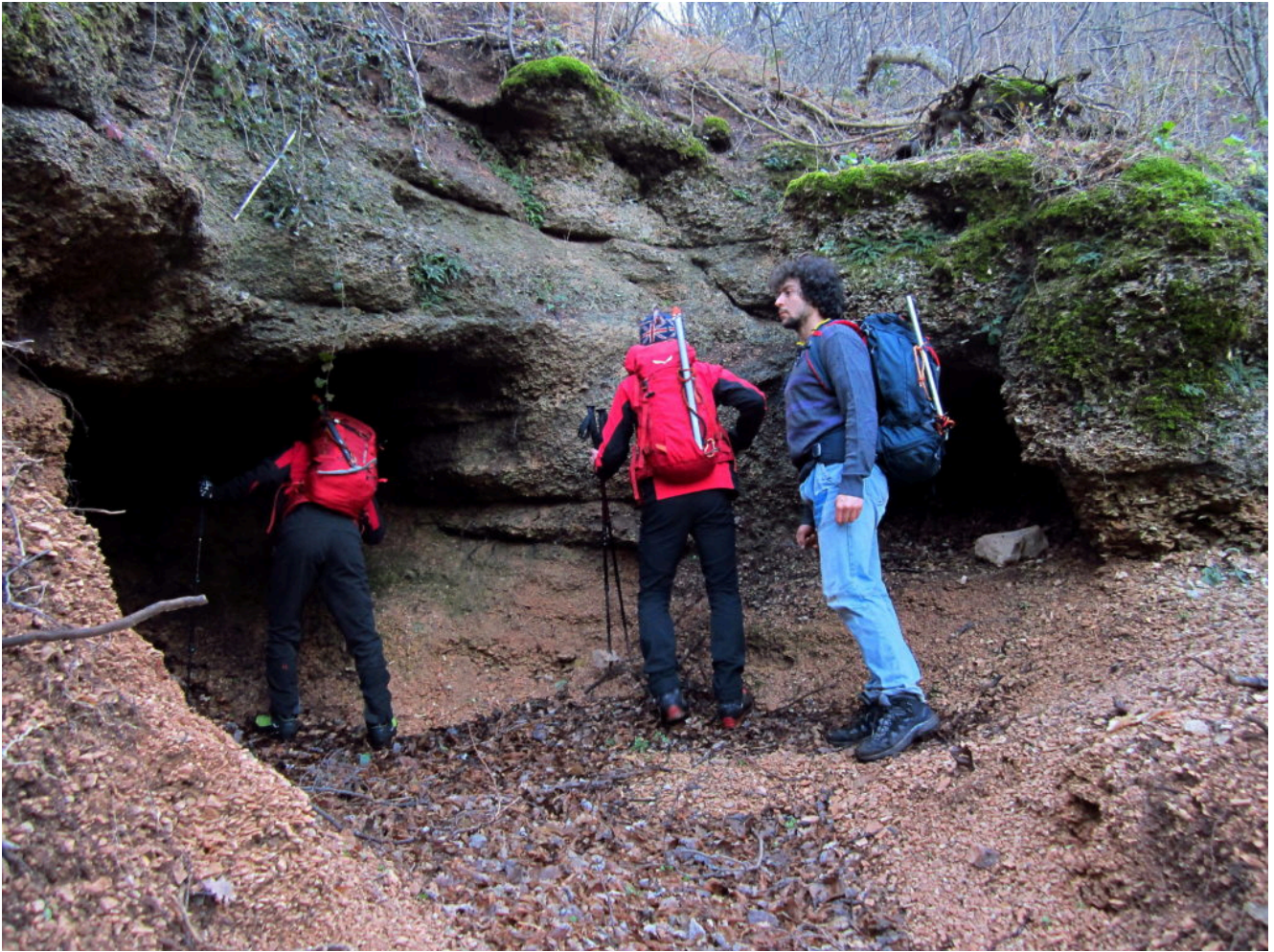
3- La grotta a sinistra e la seconda cavità più piccola a destra