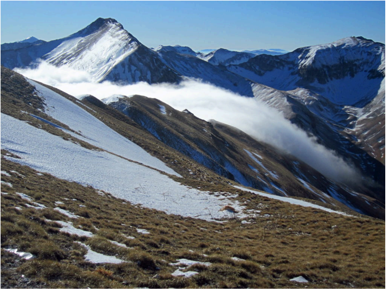
10- La nebbia che ha riempito la Valle dell'Ambro traccima verso la Val di Panico