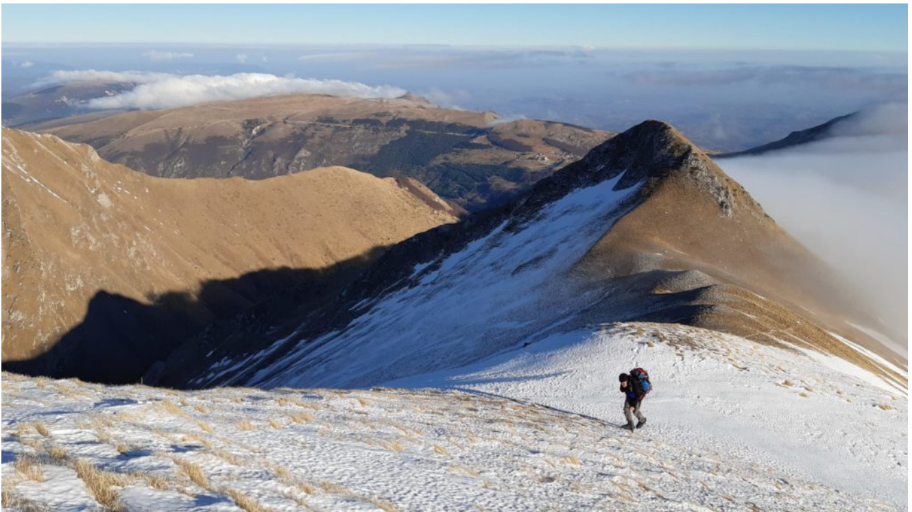
7- 8 Il sottoscritto durante la salita verso il Pizzo Tre Vescovi