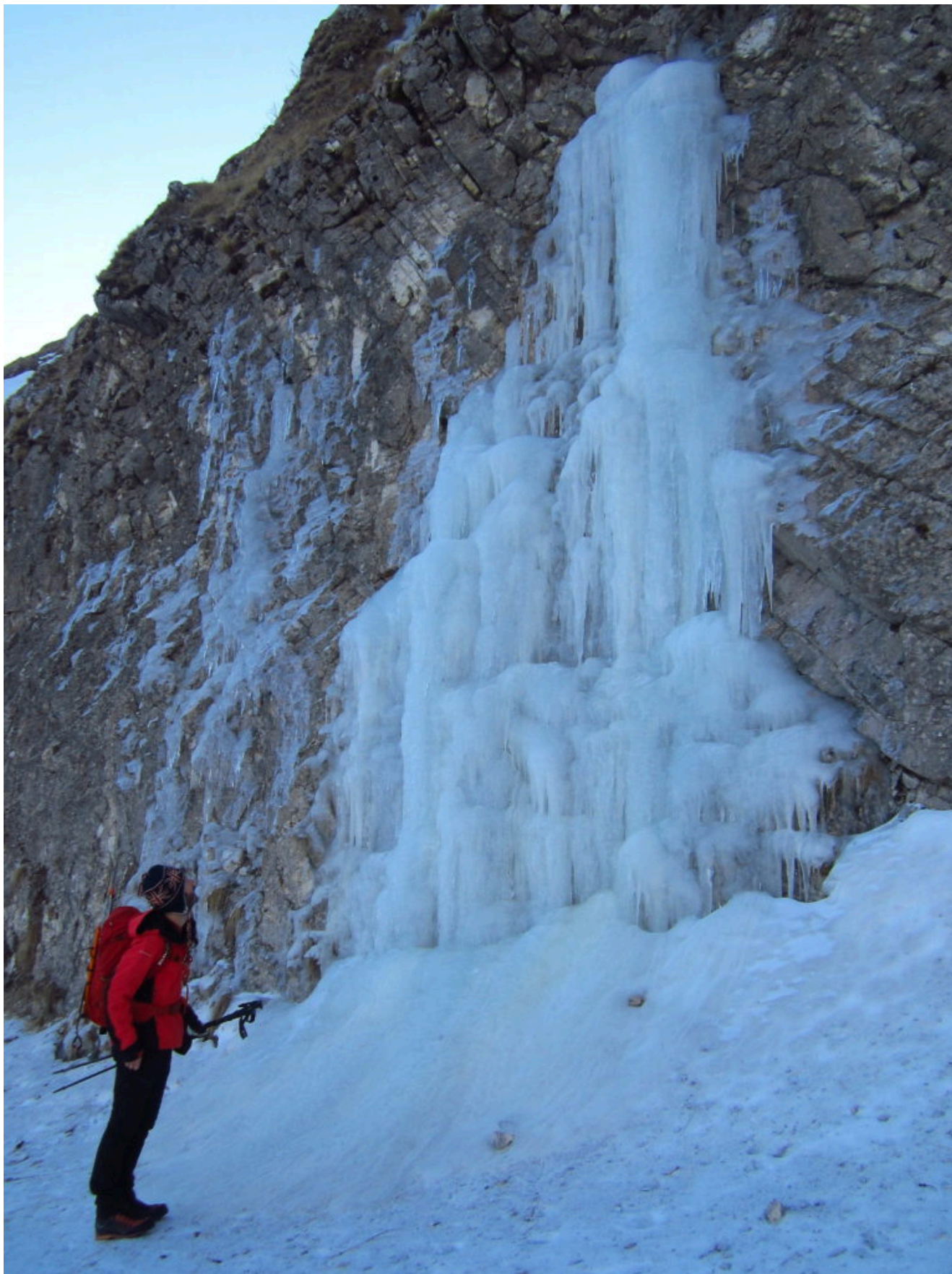
1- Colata di ghiaccio sulle pareti della strada sotto a M. Acuto