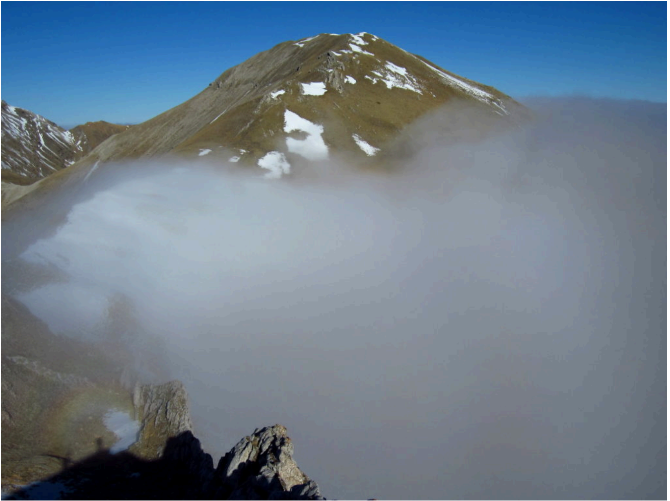
16- Il Pizzo Tre vescovi con la cresta discesa visto da Forcella Angagnola.