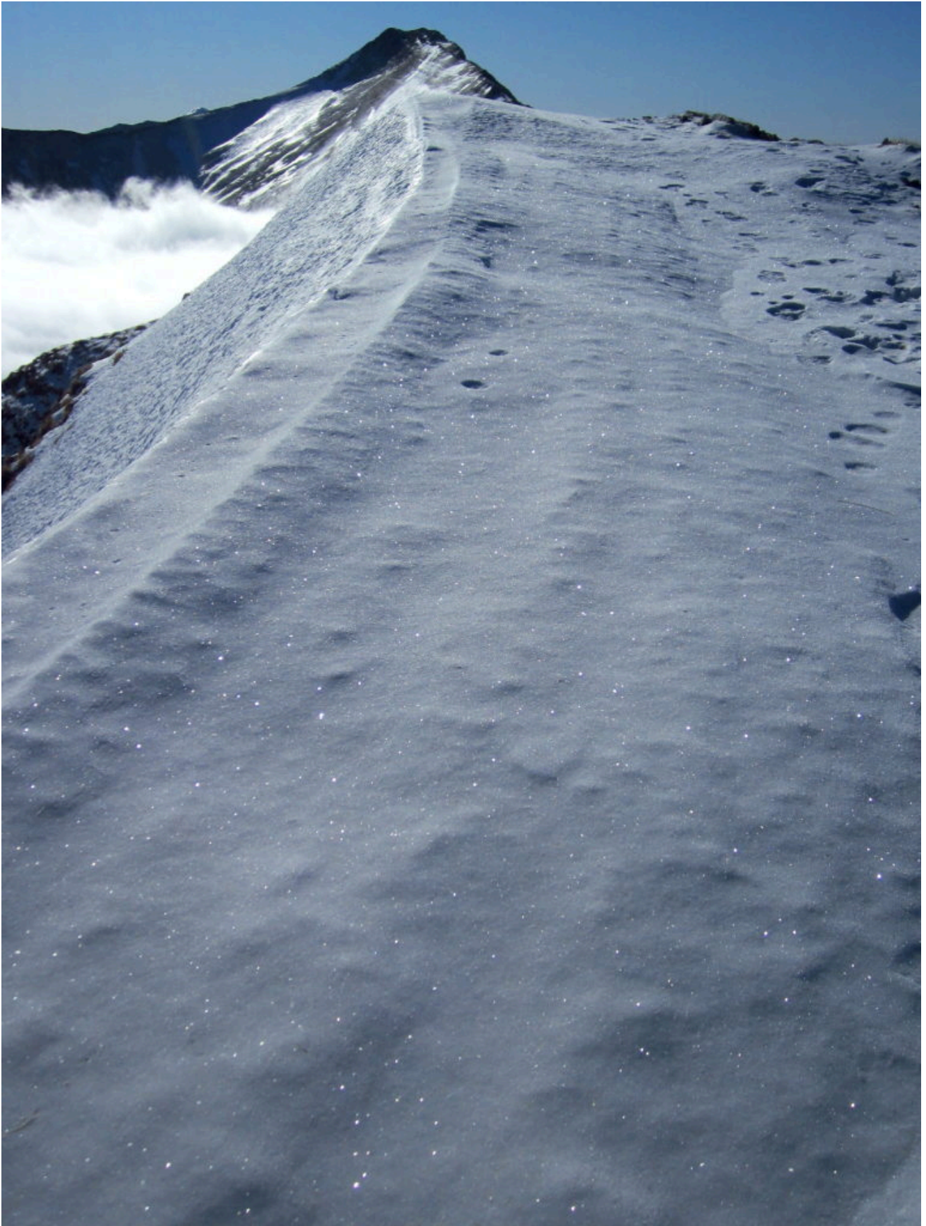
12- Cristalli di ghiaccio in cresta