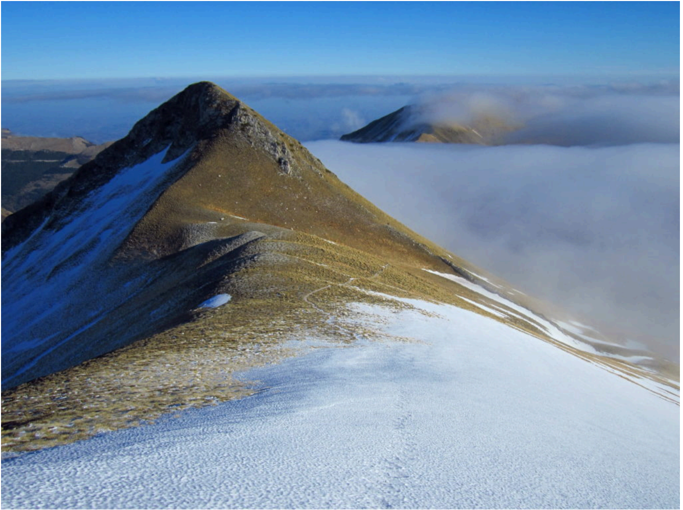
6- Il M. Acuto e sullo sfondo il M. Castel Manardo parzialmente ricoperto di nebbia.