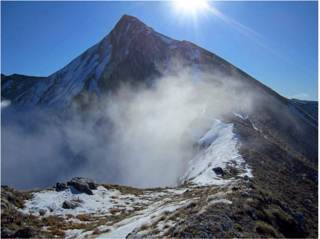
17- L'antecima Nord di Pizzo Berro vista da Forcella Angagnola, abbiamo scavalcato la nebbia.