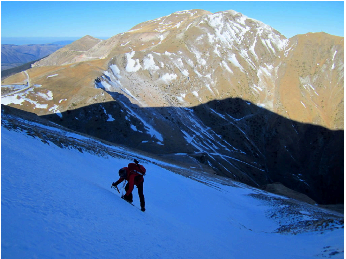
2- salita del canale Nord di Pizzo Tre Vescovi.