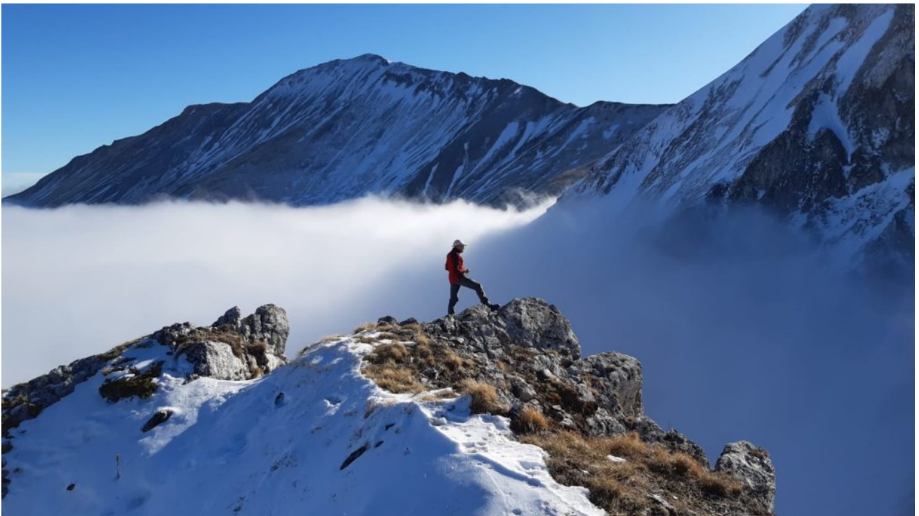
21- Il sottoscritto nella stessa posizione della foto 20