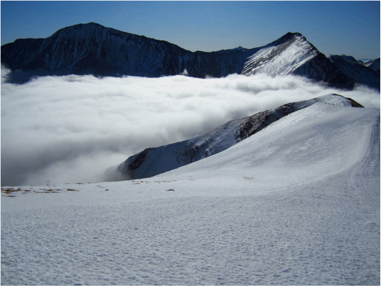
11- Il Pizzo Regina ed il Pizzo Berro visti dalla Cima di Pizzo Tre Vescovi.