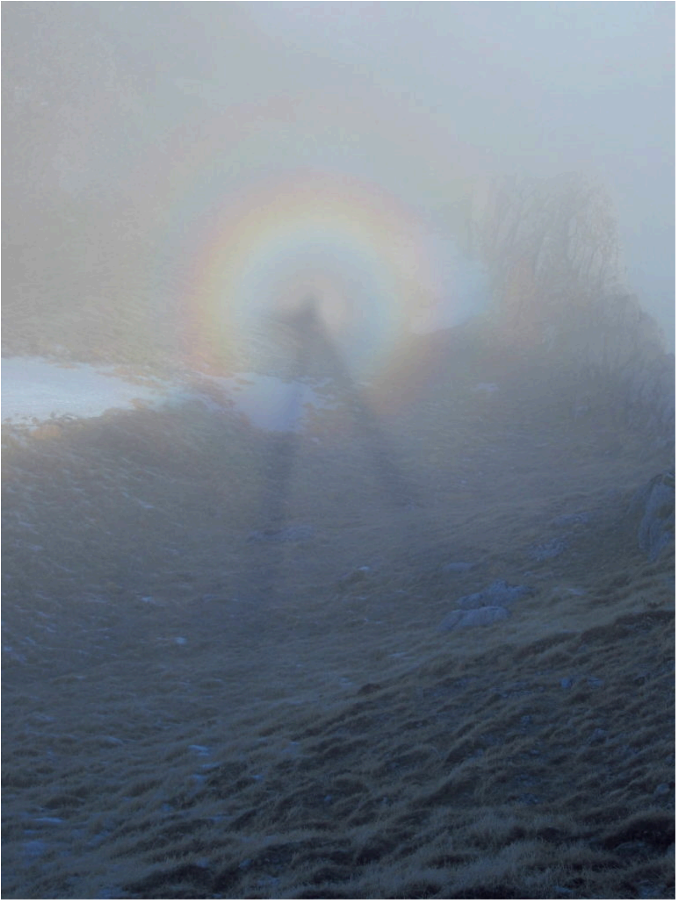
19- Gloria solare dalla cima che sovrasta Forcella Angagnola.