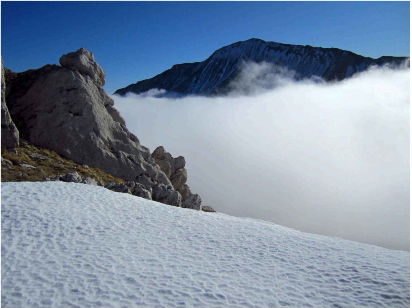
13- Massi posti sulla cresta che scende dalla cima di Pizzo Tre vescovi verso Forcella Angagnola.