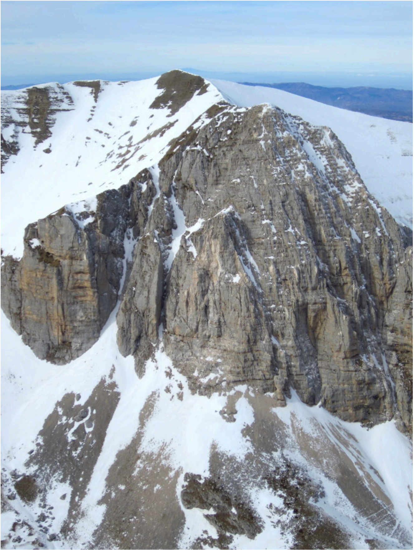
11- 12 Dettagli sul Pizzo del Diavolo dalla cima del M. Vettore.