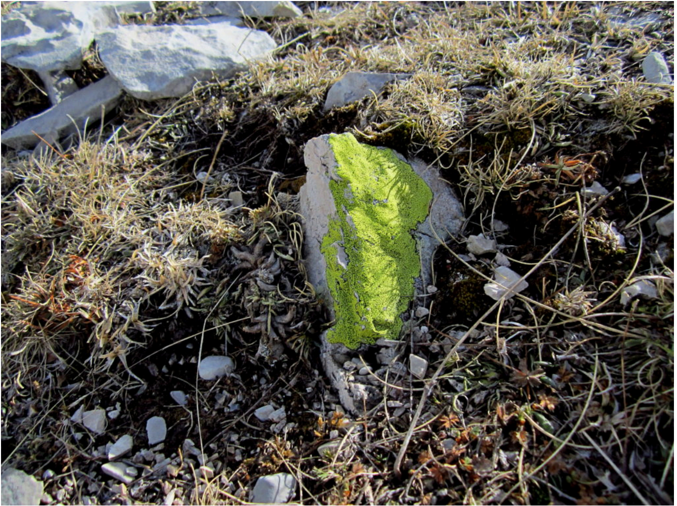
5- Lichene Rhizocarpon geographicum spicca tra i massi alla Forca delle Ciaole.