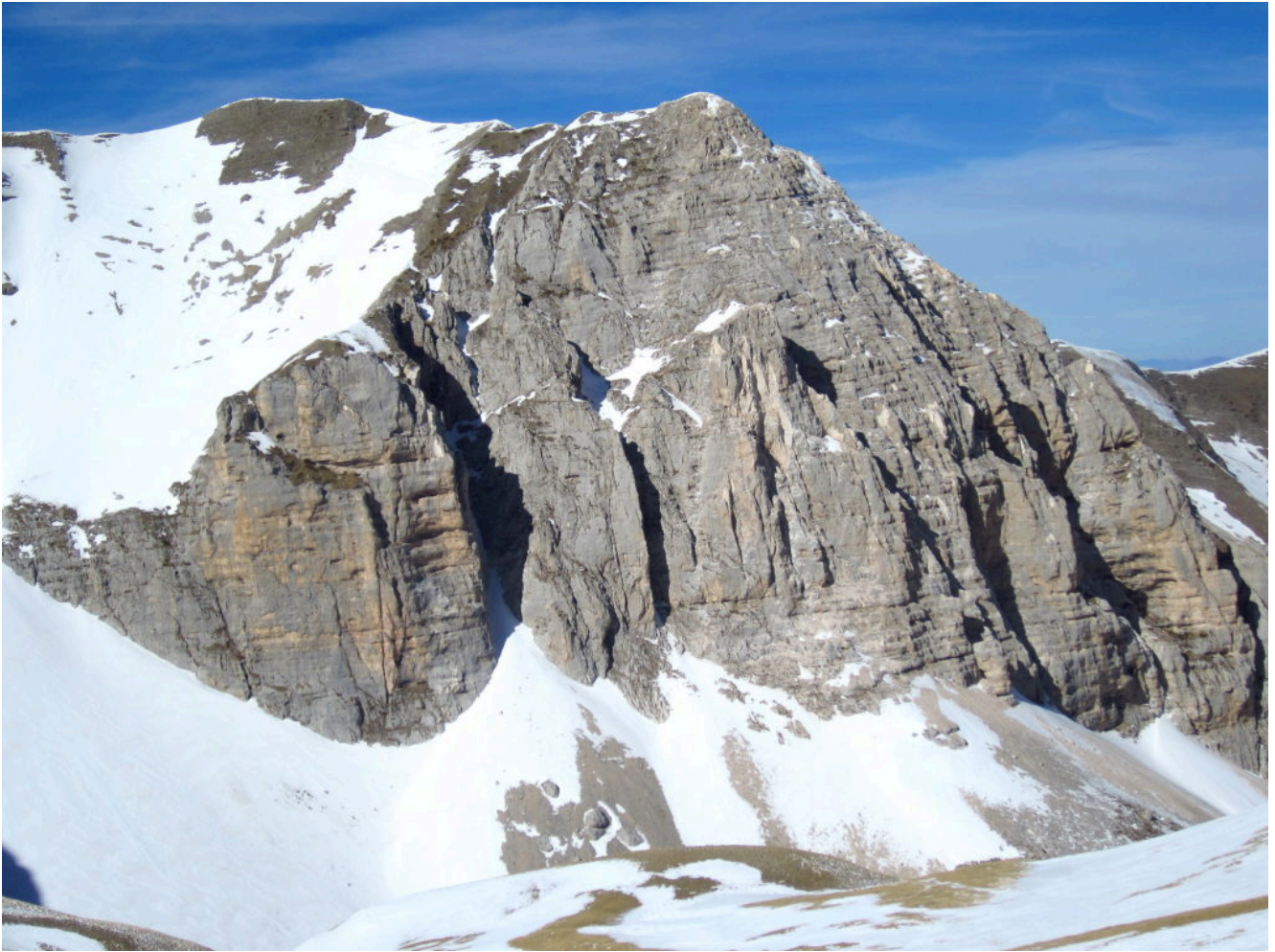
16- Il Pizzo del Diavolo visto dalla Forca delle Ciaole illuminato dal sole di mezzogiorno.