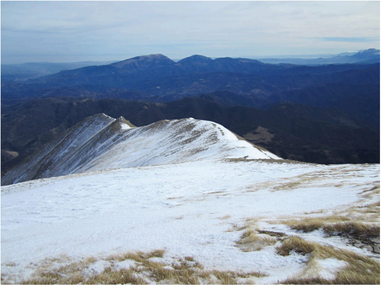
14- La cresta di Cima di Pretare anch'essa con pochissima neve.