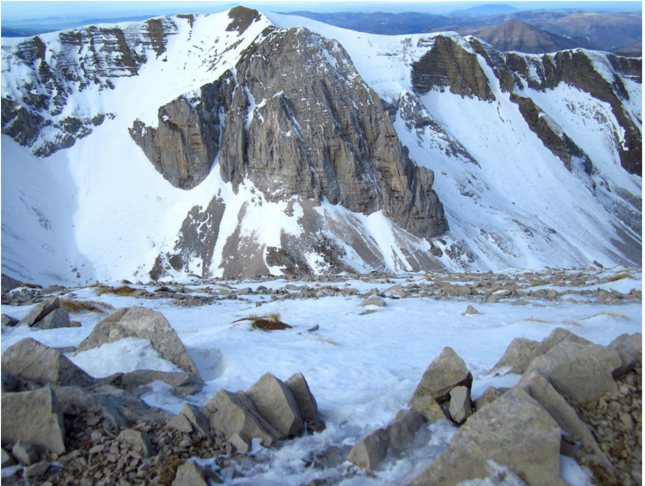
13- Veduta d'insieme dalla cima del M. Vettore.