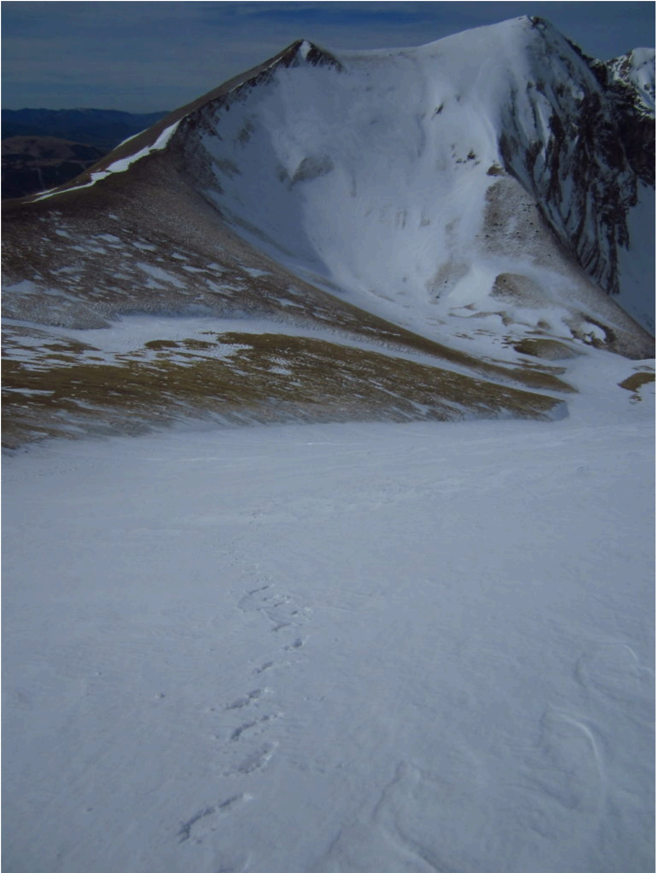
9- La Punta di Prato Pulito e la Cima del Lago viste dal canale Sud del M. Vettore.