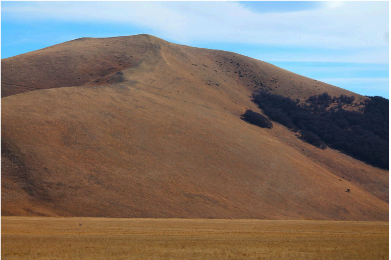
21- Il Monte Guaidone con due persone appena visibili a sinistra nel Piano Grande...come si è piccoli di fronte alle montagne.