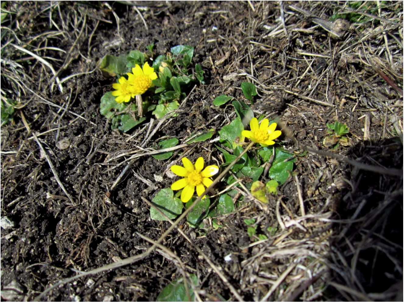
20- Ranunculus ficaria già in fiore a Forca di Presta Poi al pomeriggio una sosta ai Piani di Castelluccio: