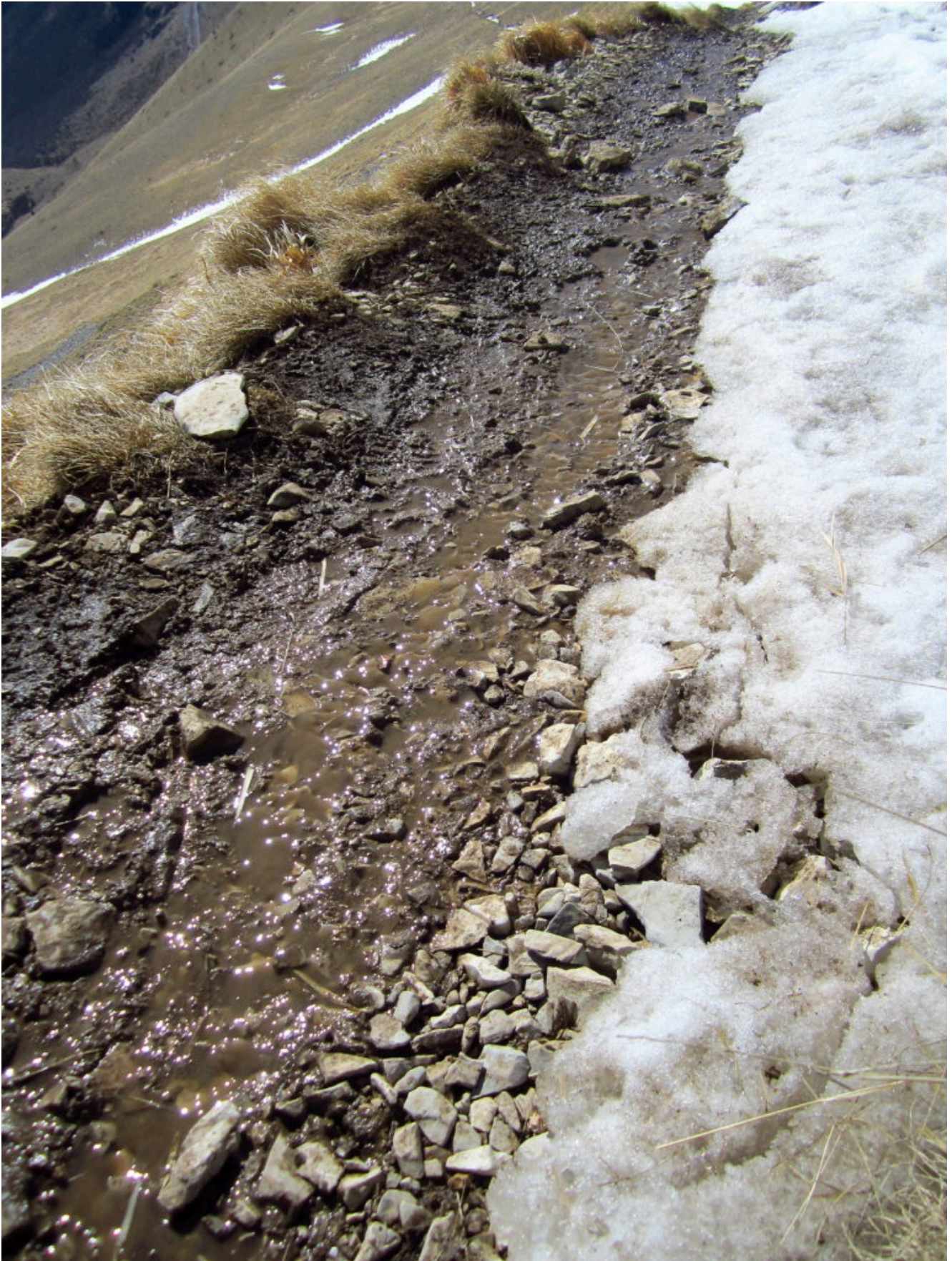
18- L'alta temperatura, 8°C, ed il vento hanno trasformato il sentiero in un ruscello sciogliendo la poca neve laterale e aumentando l'erosione. eppure non ci vorrebbe molto a fare qualche solco di scolo laterale.