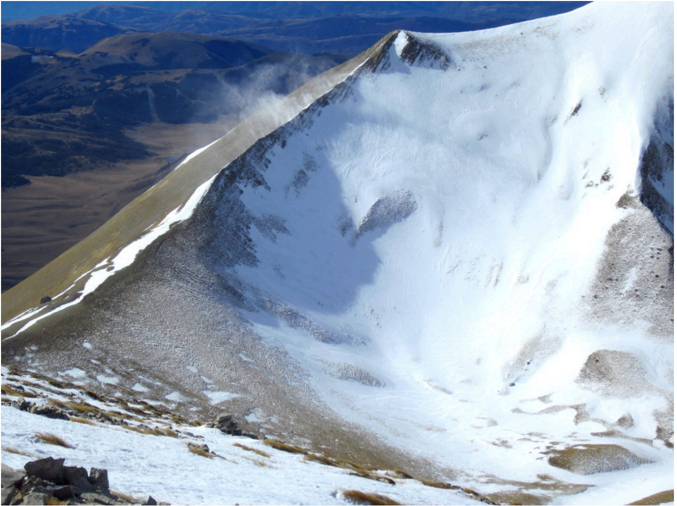
15- Discesa verso la Forca delle Ciaole con vento in aumento che solleva neve dalla cresta della Punta di Prato Pulito.