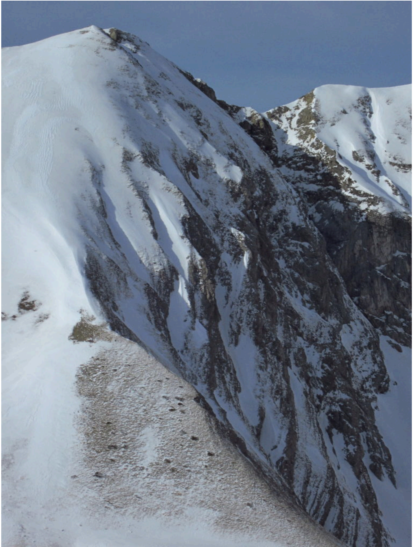
7- La Cima del Lago con le uscite dei canali della Nord anch'essi in condizioni minime per le salite invernali.