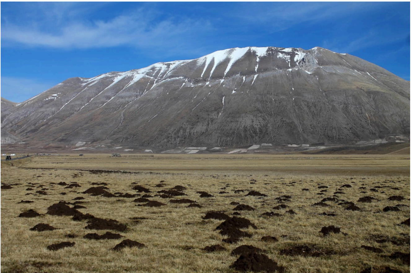
22- La Cima del Redentore in versione "maggio" con centinaia