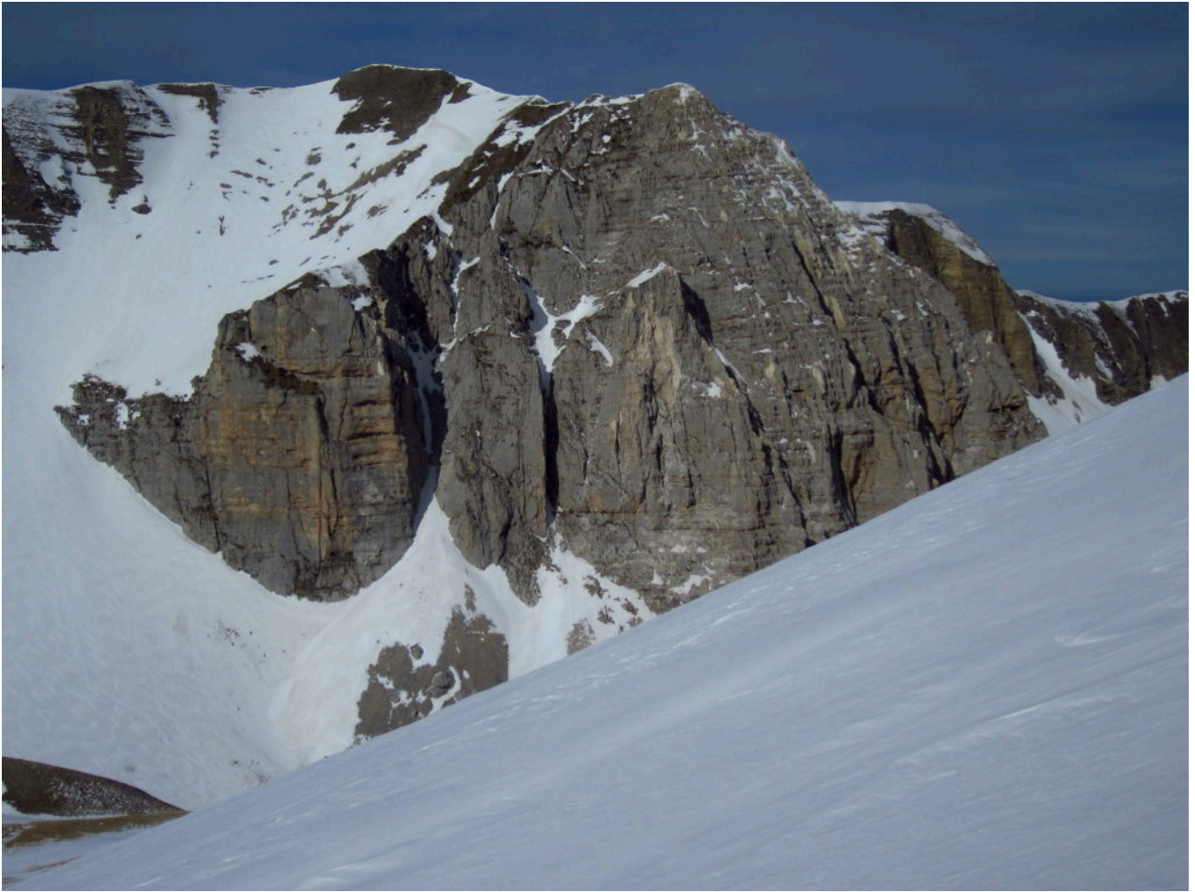
8- Il Pizzo del Diavolo e la Cime del Redentore viste dal canale Sud del M. Vettore.