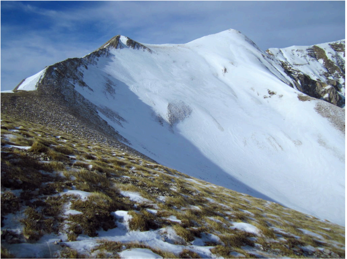
2- La Punta di Prato Pulito e la Cima del lago dalla Forca delle Ciaole con la neve solo sui versanti Nord.