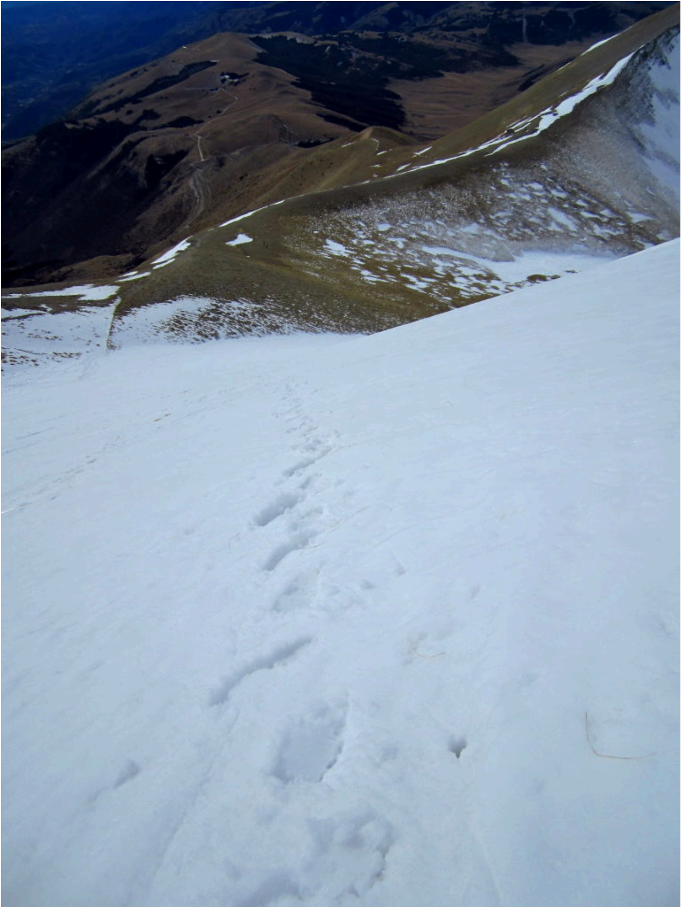
10- La Sella o Forca delle Ciaole con il Rifugio Zilioli a destra.