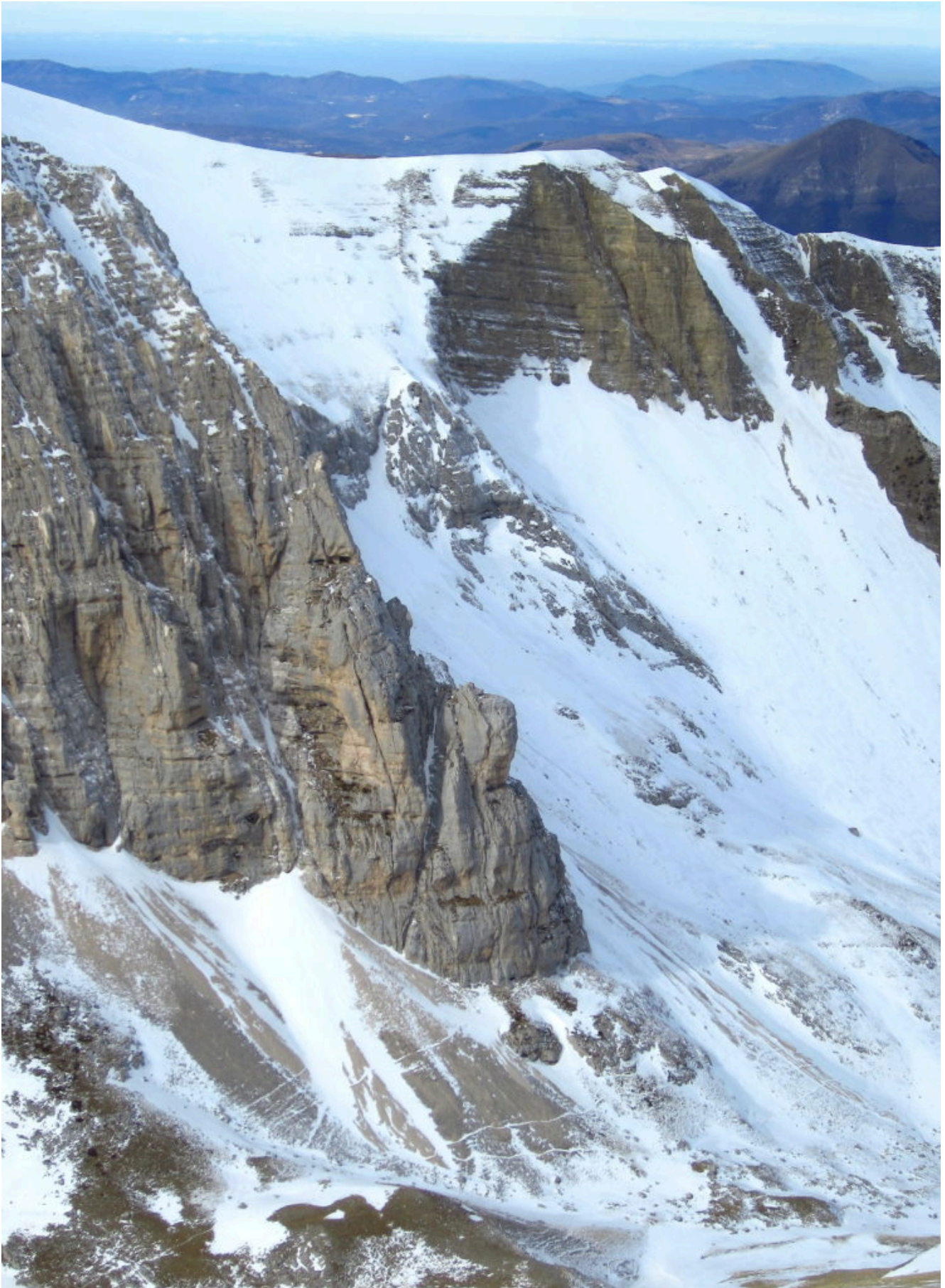
12- Il Gran Gendarme con la conca del Lago di Pilato quasi senza neve.