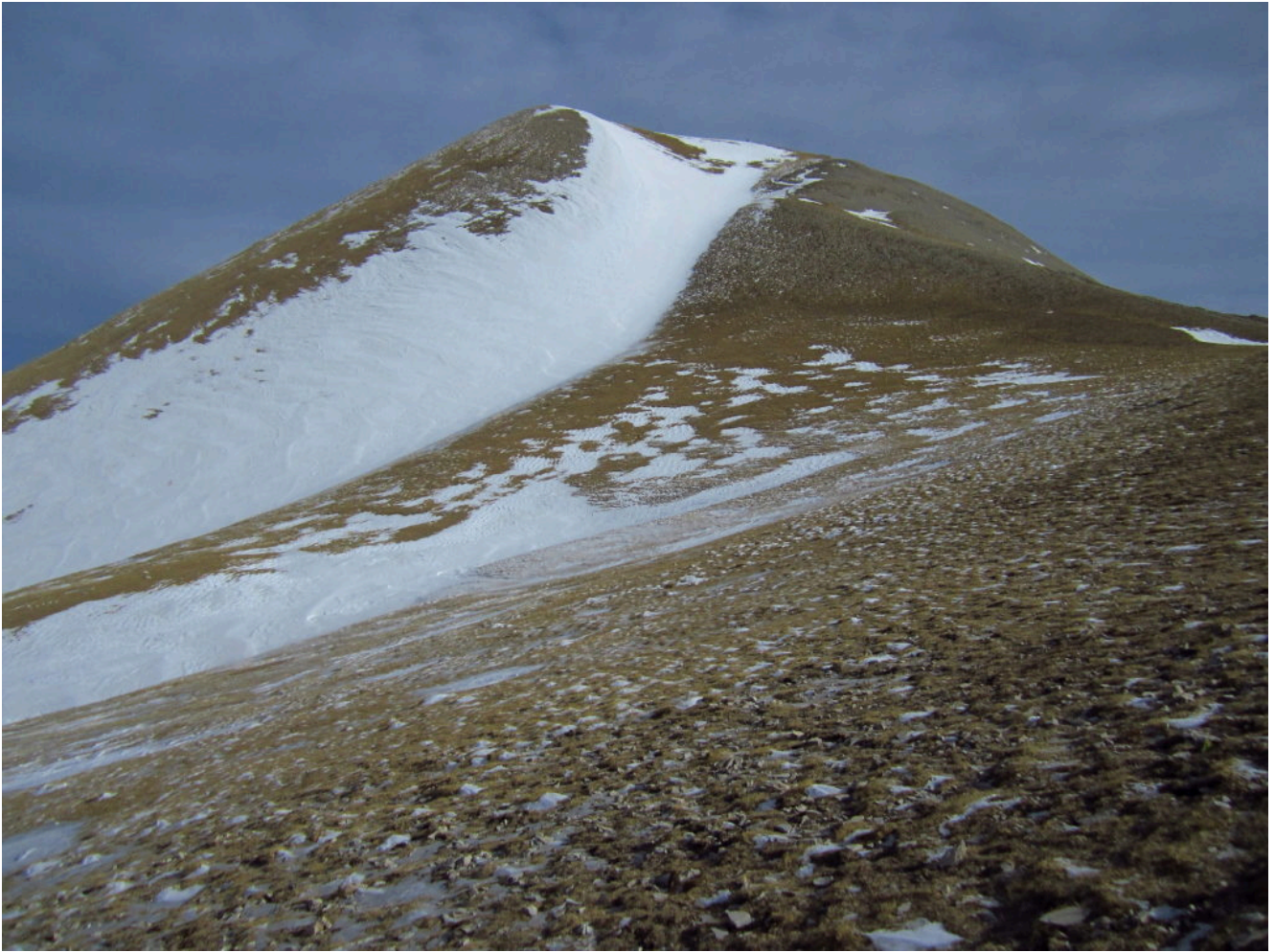
4- La cima del M. vettore con neve solo nel canale Sud.