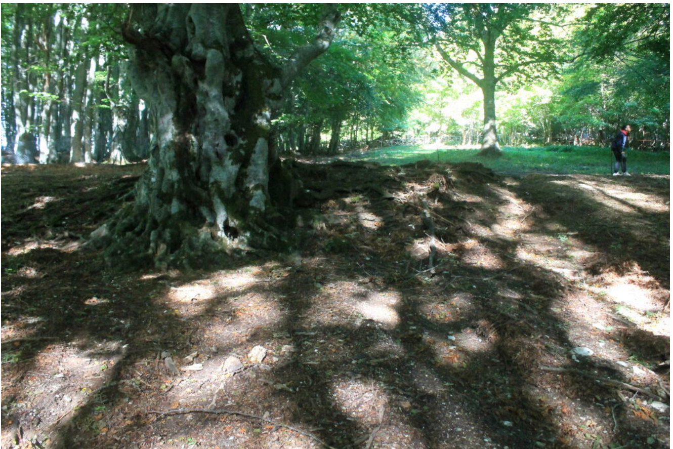
1- Il grande Faggio della Pintura di Bolognola.

Credo che sia in grado di intervenire al più presto per la salvaguardia dell'albero e dell'intera zona.