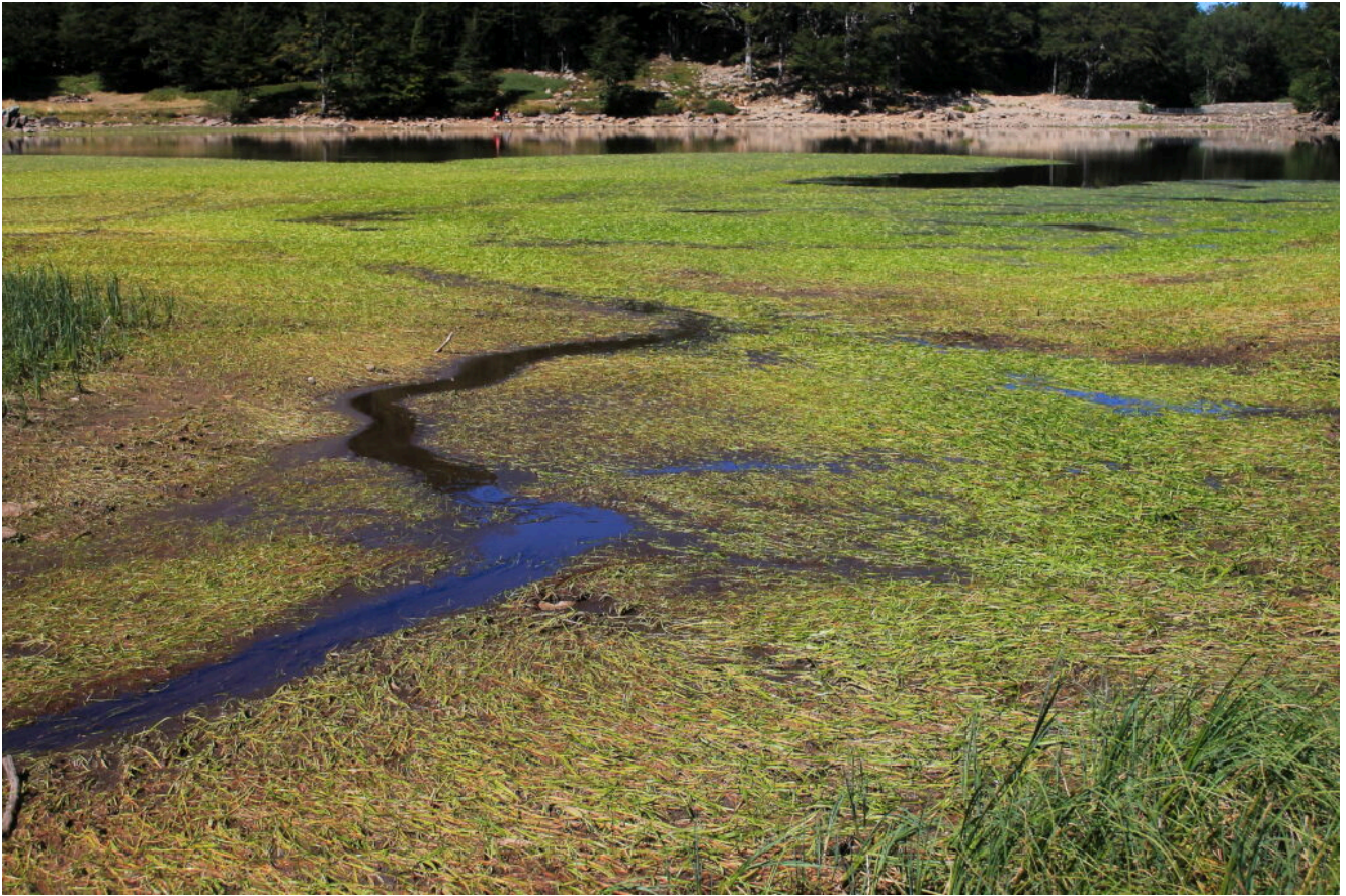
15- La parte iniziale paludosa del Lago Baccio