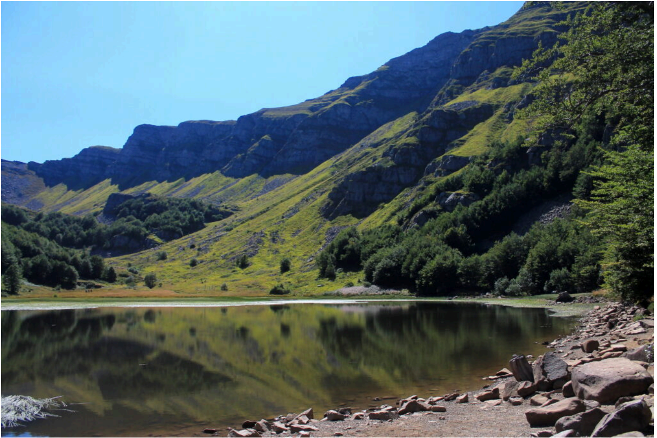
13- La testata della rocciosa valle che contiene il Lago Baccio.