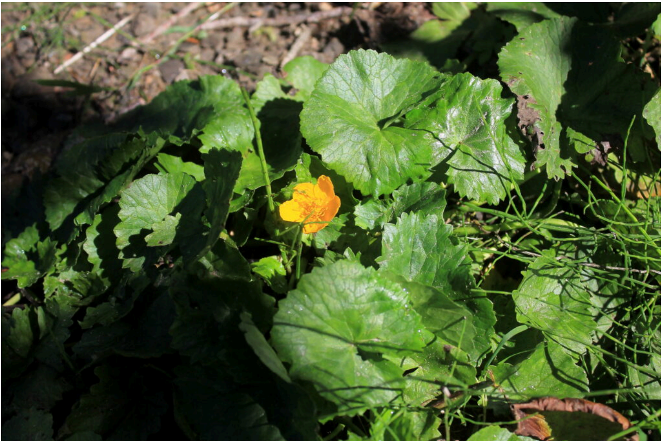
16- La rara Caltha palustris sulle sponde del Lago Baccio.