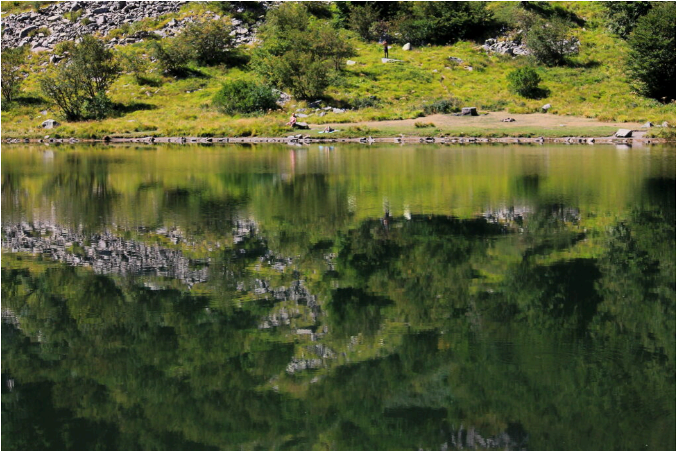
8- Il tratto settentrionale del Lago Santo dove si aprono dei prati ancora pieni di fiori alpini.