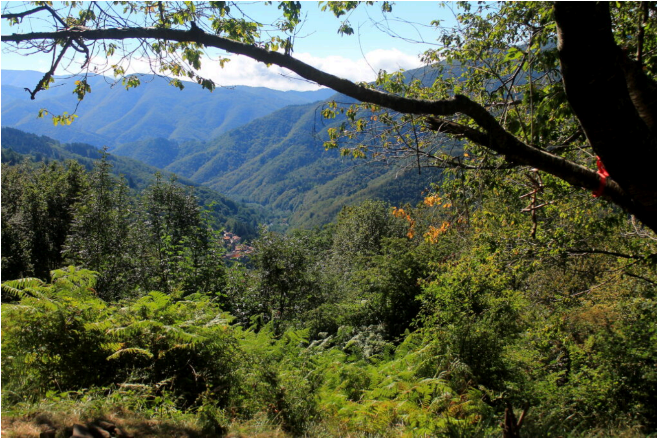
21- La boscosissima ed isolata Valle dell'Orsigna.