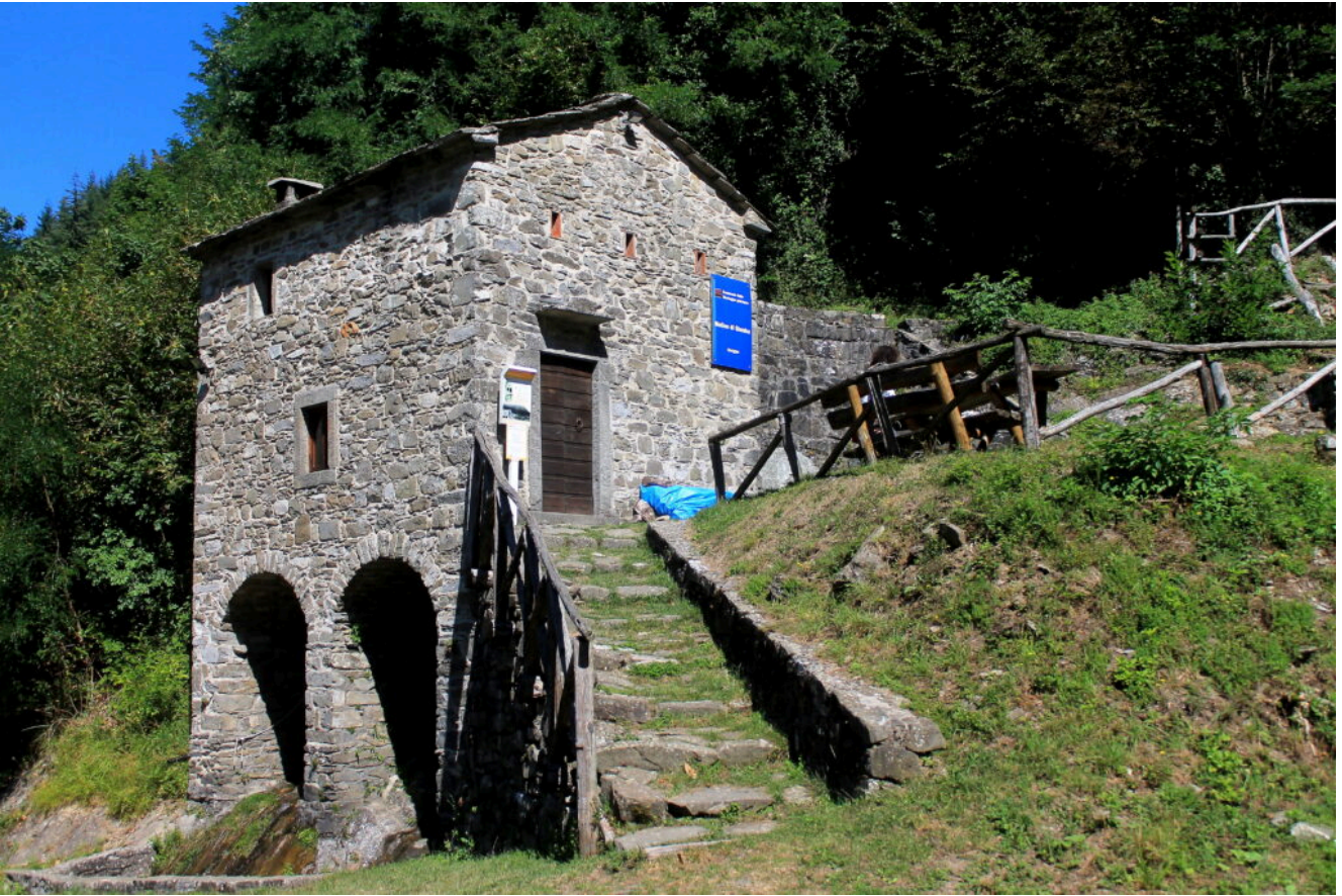
24- Il vecchio Mulino della Valle dell'Orsigna, ristrutturato e trasformato ora in Museo da chi ama la propria terra.