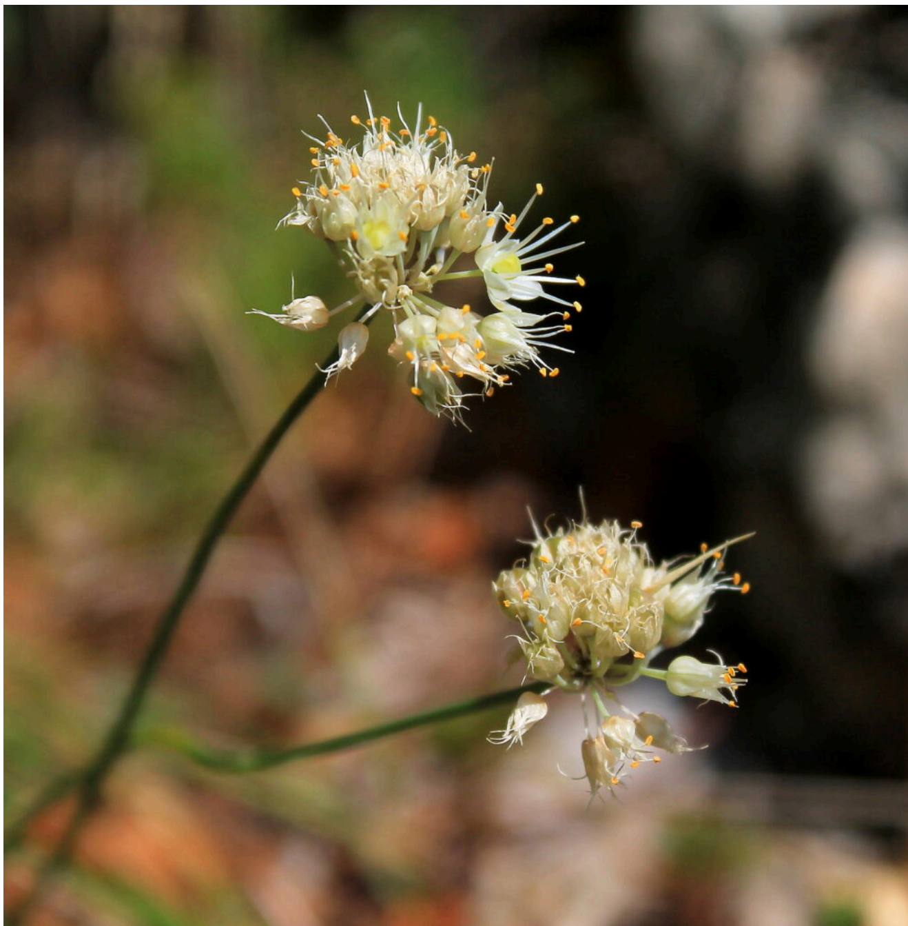
13- Allium saxatile

12- L'imponente parete Sud del Balzo Rosso nei pressi dell'incrocio con il sentiero che sale dalla Santuario della Madonna dell'Ambro con quello che devia a destra verso Campolungo.