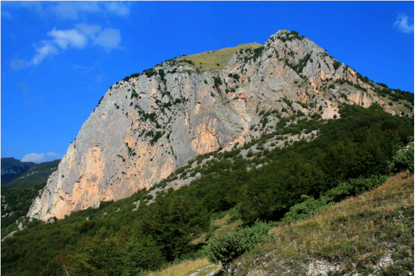
4- Veduta d'insieme del Balzo Rosso.