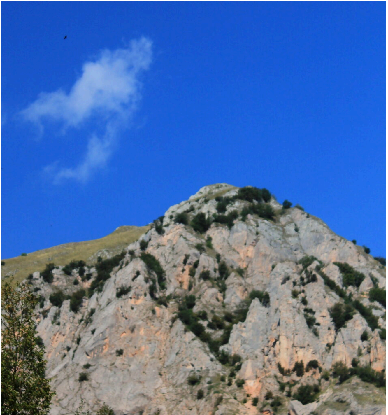
8- Aquila alta in volo sopra al Balzo Rosso.