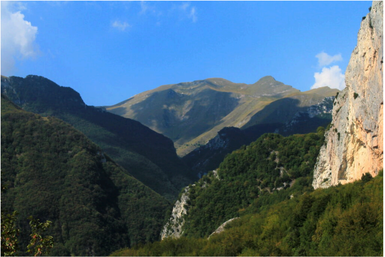
23- Il Pizzo Tre Vescovi ed il Monte Acuto nell'alta Val d'Ambro con la barriera delle Roccacce in ombra