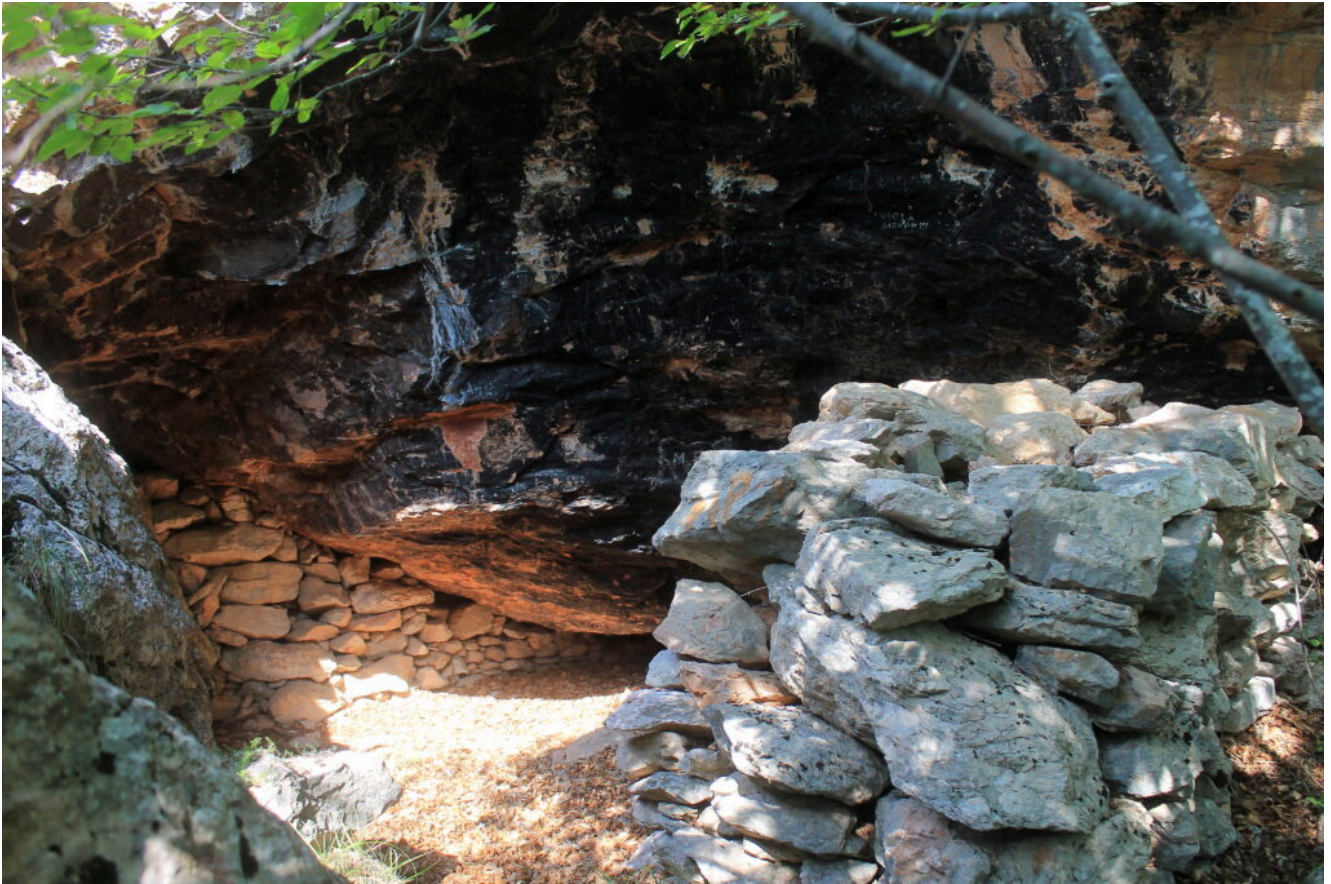
11- Bivacco di fortuna nei massi sottostanti il Balzo Rosso.