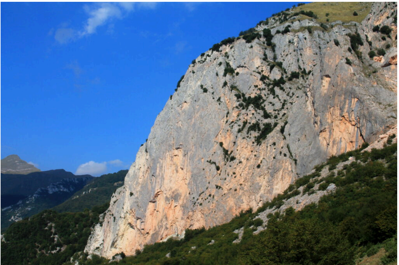
10- La parete Sud del Balzo Rosso, una lama di roccia che si innalza per oltre 250 metri.