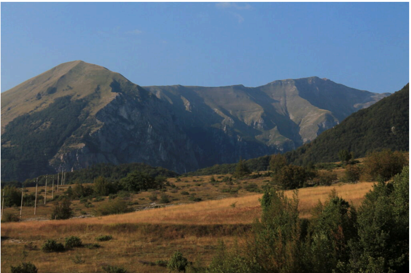
3- Il Monte Zampa a sinistra e il Monte Sibilla a destra.