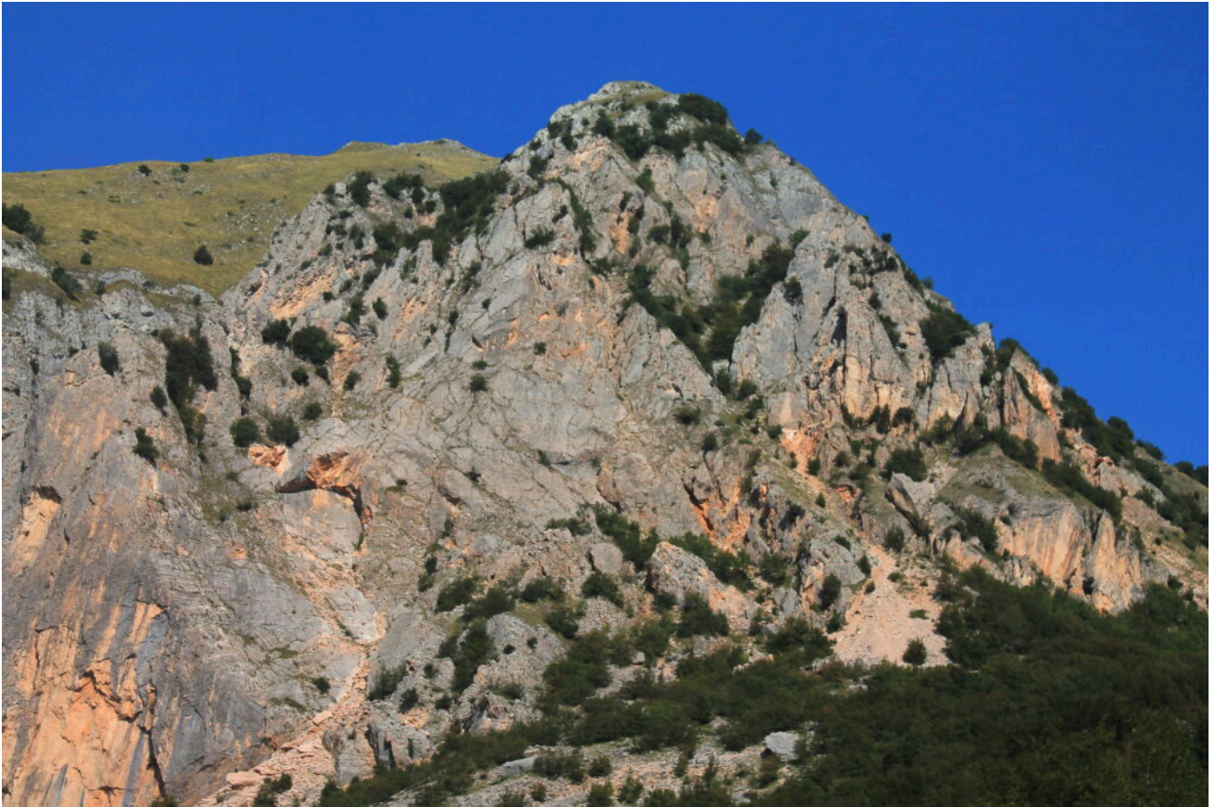
9- La parete Est del Balzo rosso