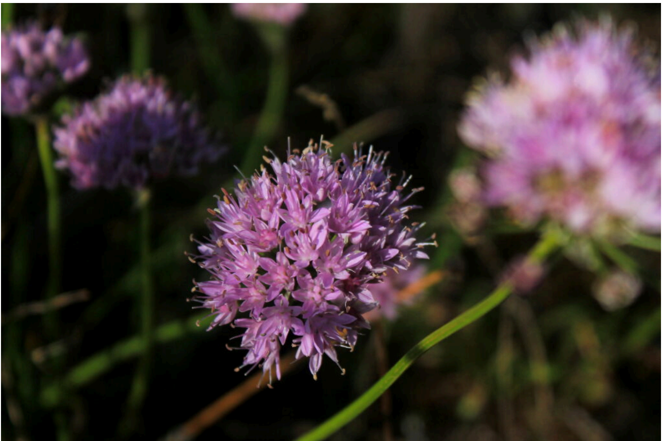
5- Allium lusitanicum