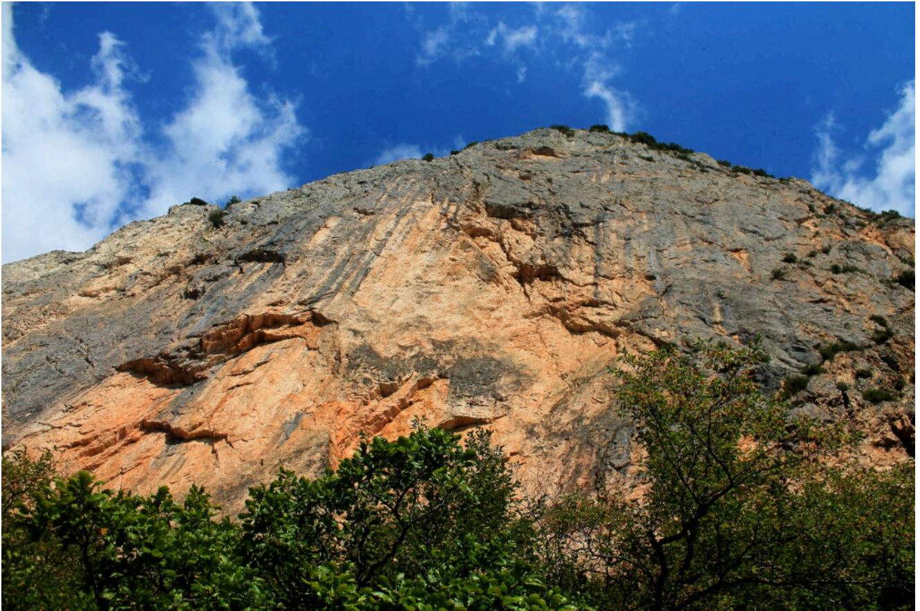
14- Sulla verticale della grande parete.