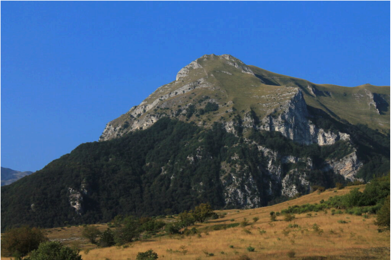
2- Il Monte Priora con Il Pizzo ed il Poggio della Croce.