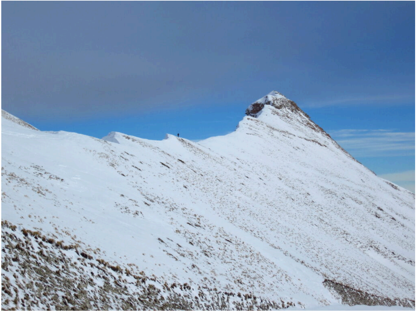
17- La cresta Ovest del Monte Sibilla con Federico che si appresta a raggiungere la cima.