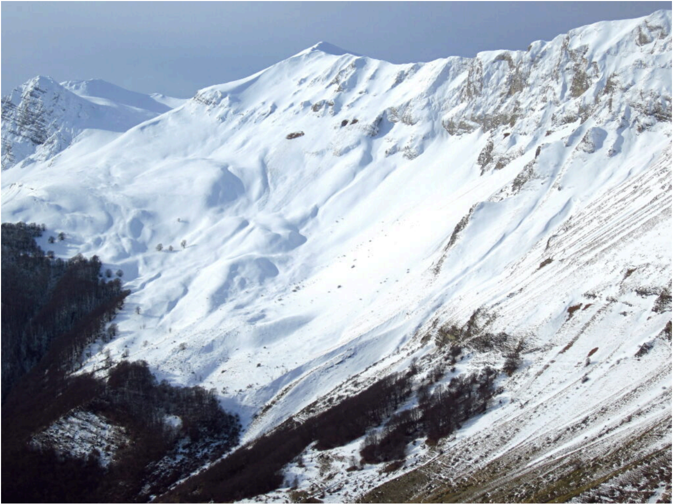
8- Il Monte Porche e la zona della Fonte del Faggio e Ramatico, sotto alle pareti del versante Est di Cima Vallelunga