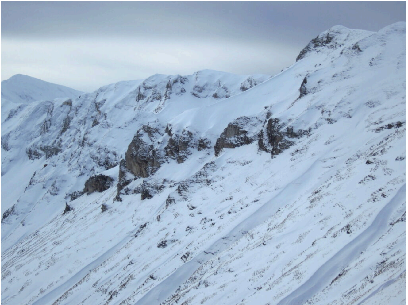
16- Cima Vallelunga con gli scogli denominati " i tre Vescovi"