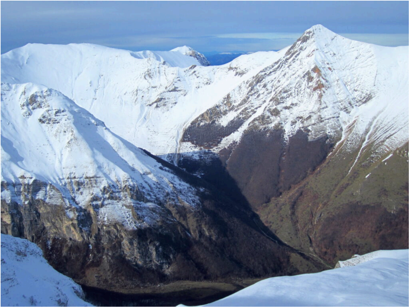
21- Il Pizzo Berro ed il Monte Bove Sud.