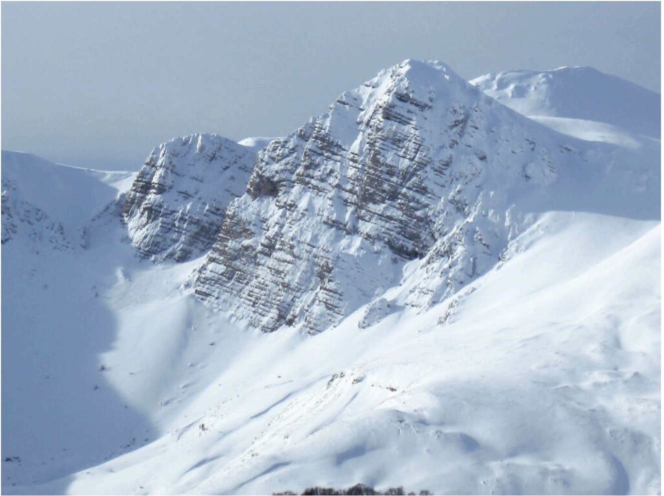
4- Il Sasso di Palazzo Borghese con la sua parete Est in piena forma invernale.