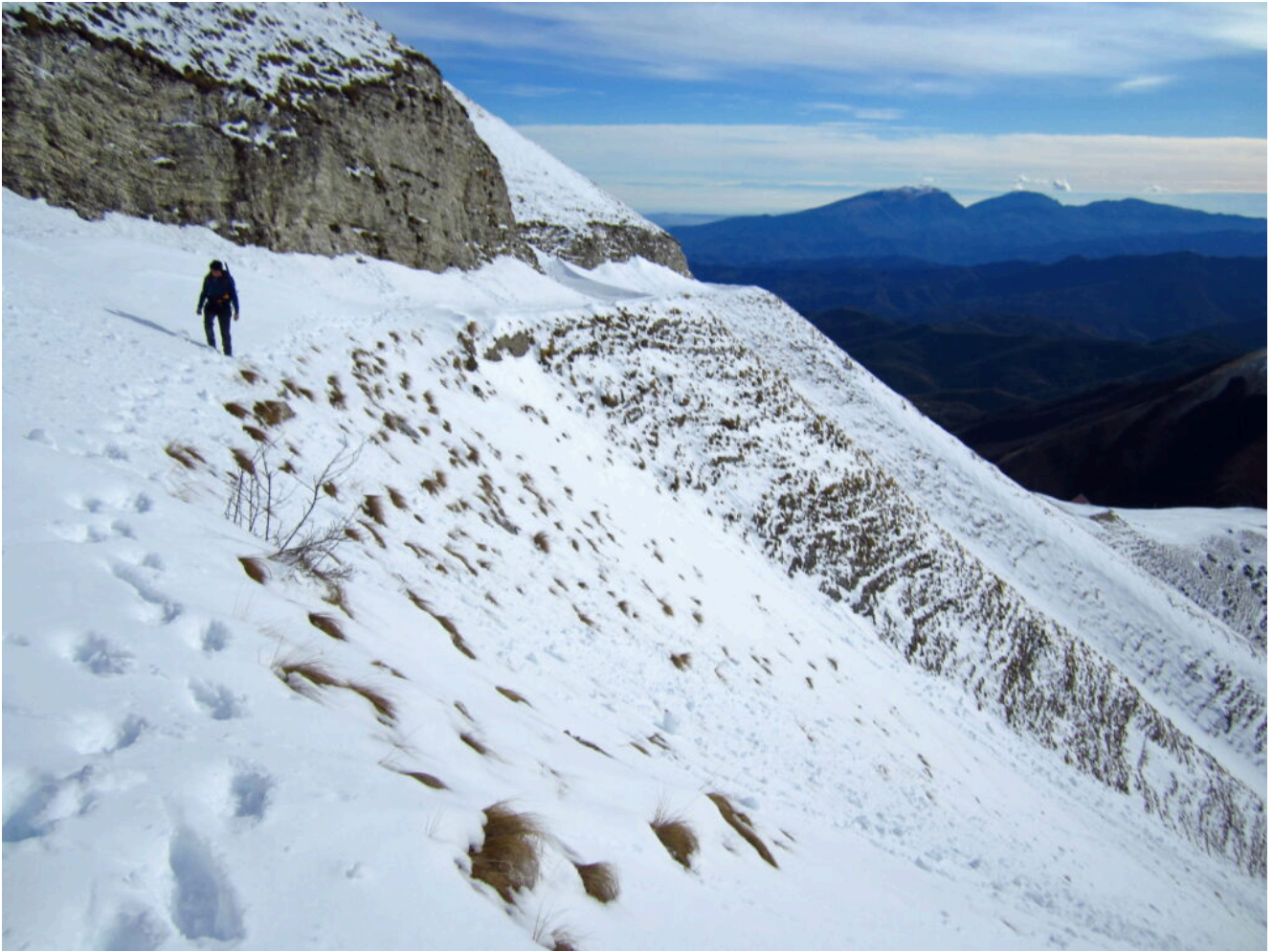
11 – 12- La strada della Sibilla con accumuli anche di più di un metro di neve fresca.