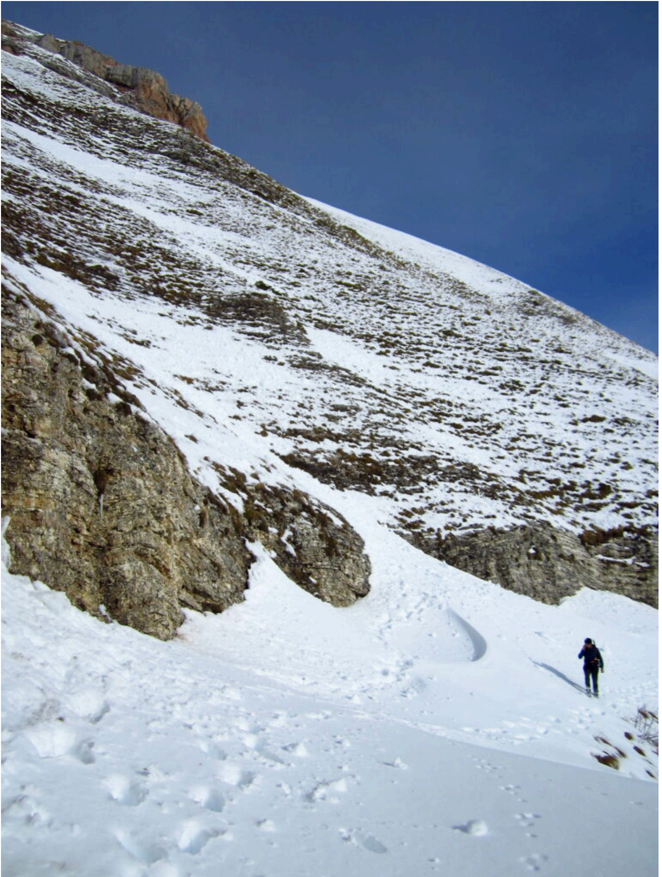
13- Nei pendii parzialmente scoperti invece la neve non supera mediamente i 30 centimetri.