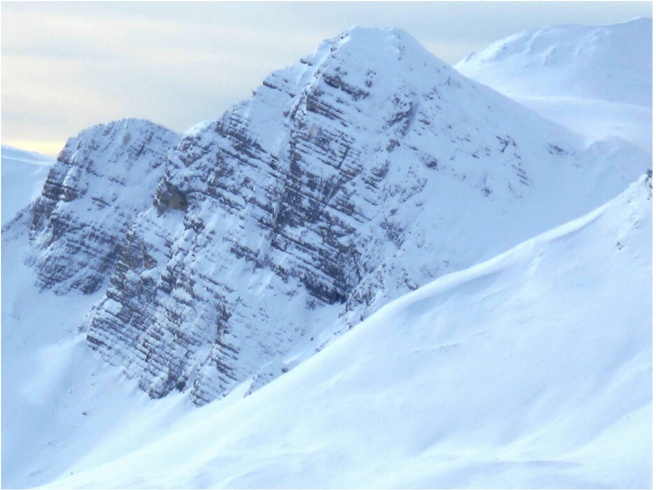
23- La parete Est del Sasso di Palazzo Borghese .