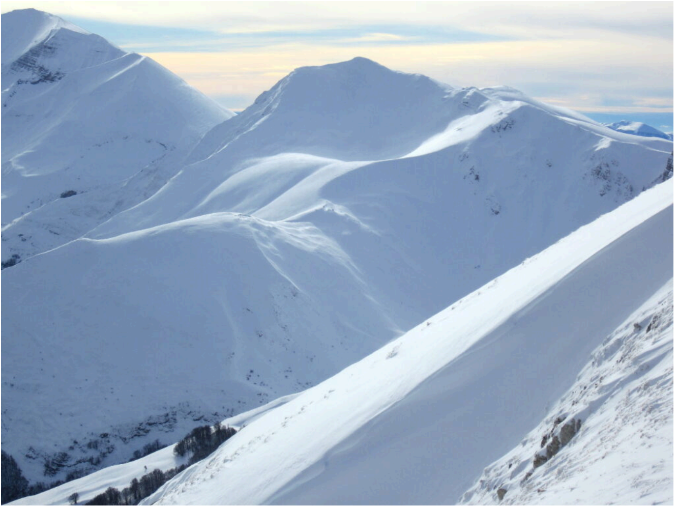
24- Il Pian delle Cavalle illuminato, nel versante Nord del Monte Argentella.