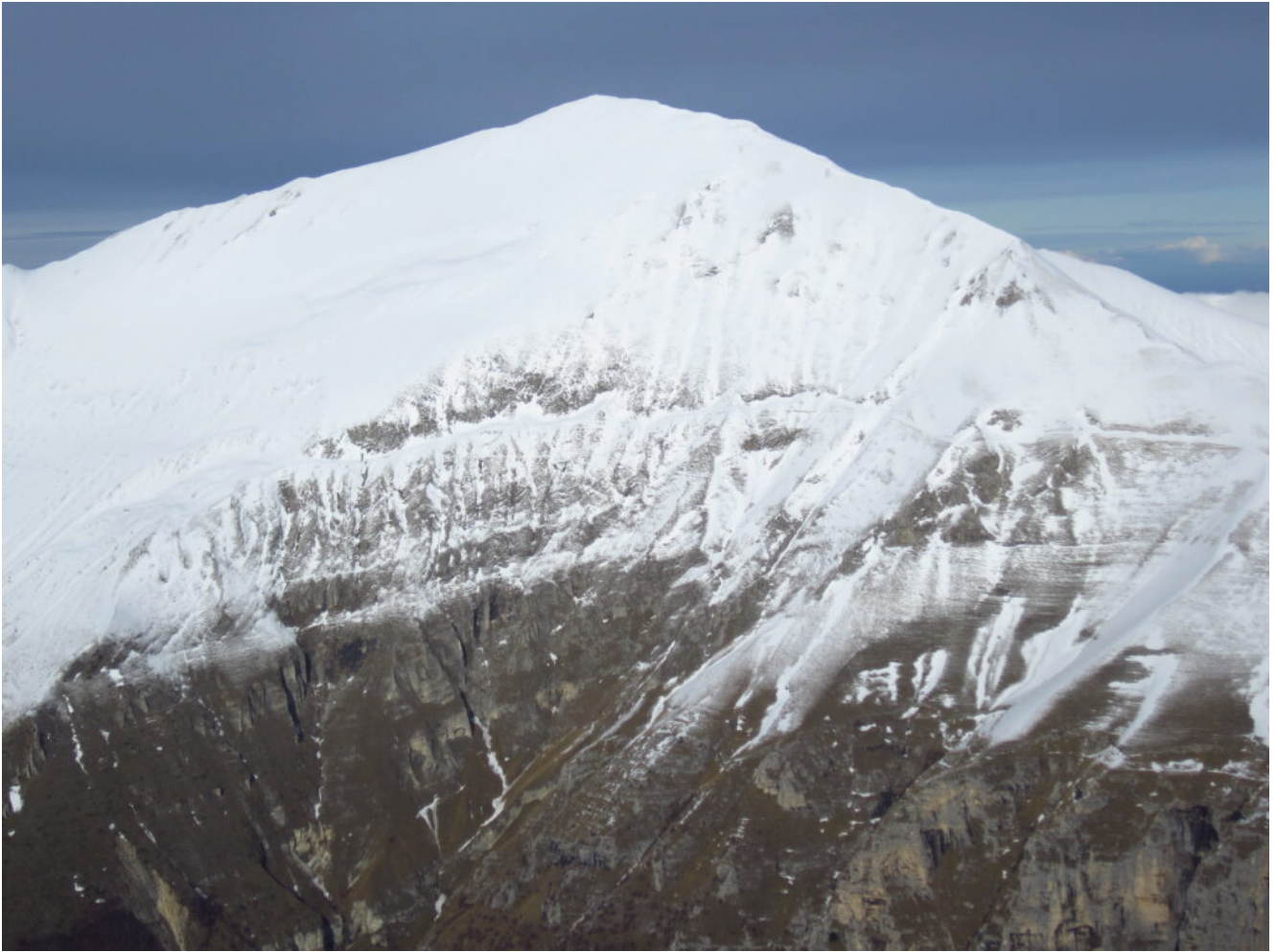
22- Il versante Sud del Pizzo Regina.