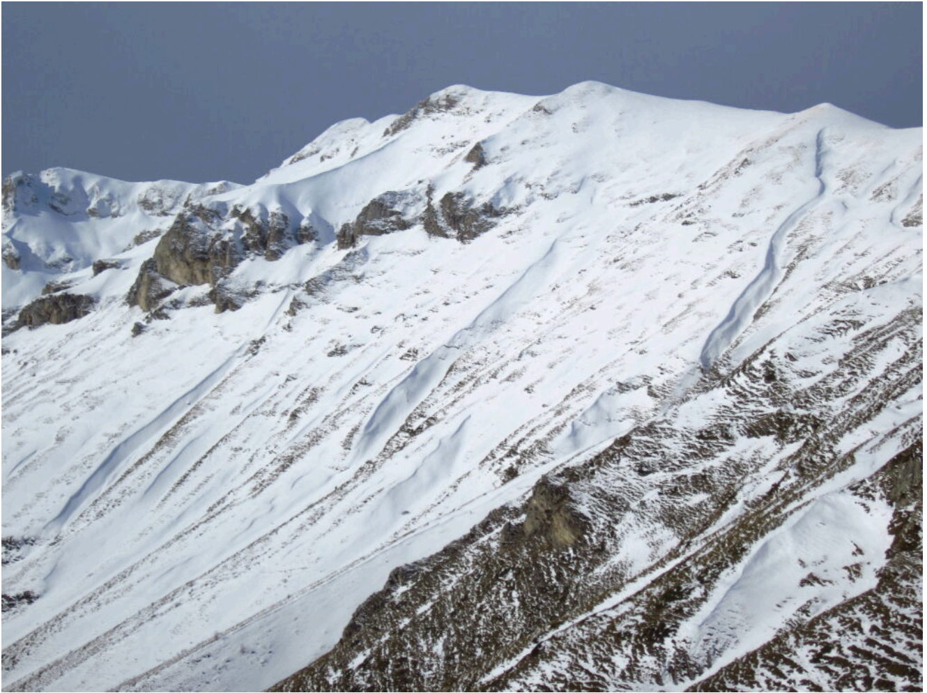
7- IL versante Est di Cima Valledunga che sale dalla Frondosa.