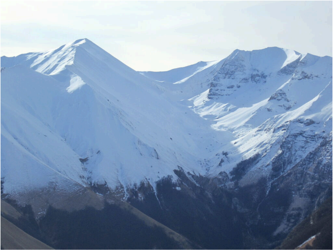
6- La Valle del Lago di Pilato con il Monte Vettore a sinistra e il Pizzo del Diavolo e la Cima del Redentore a destra.