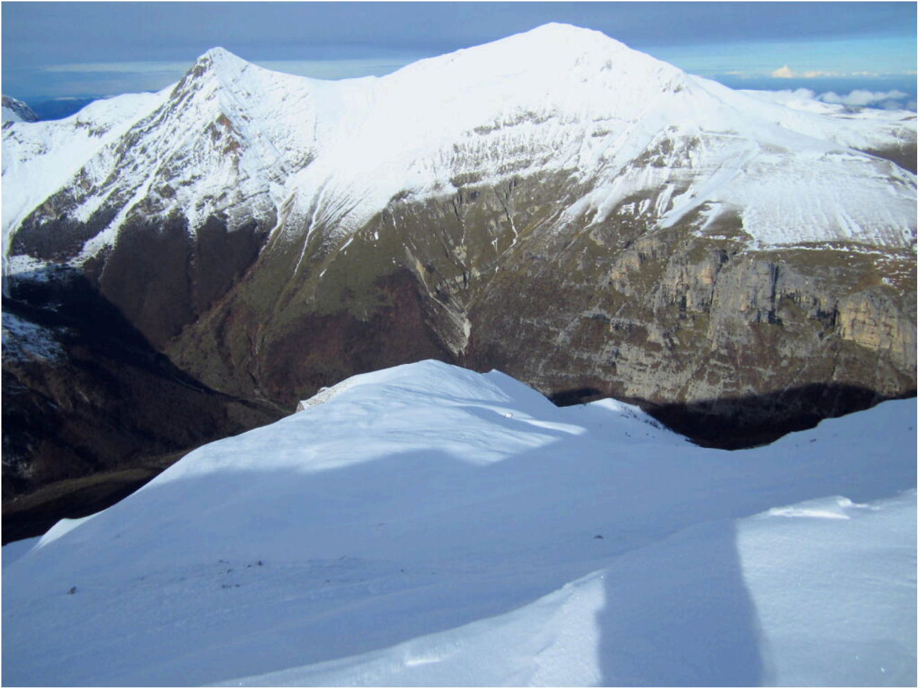
20- Il Pizzo Regina (M.Priora) a destra ed il Pizzo Berro a sinistra.