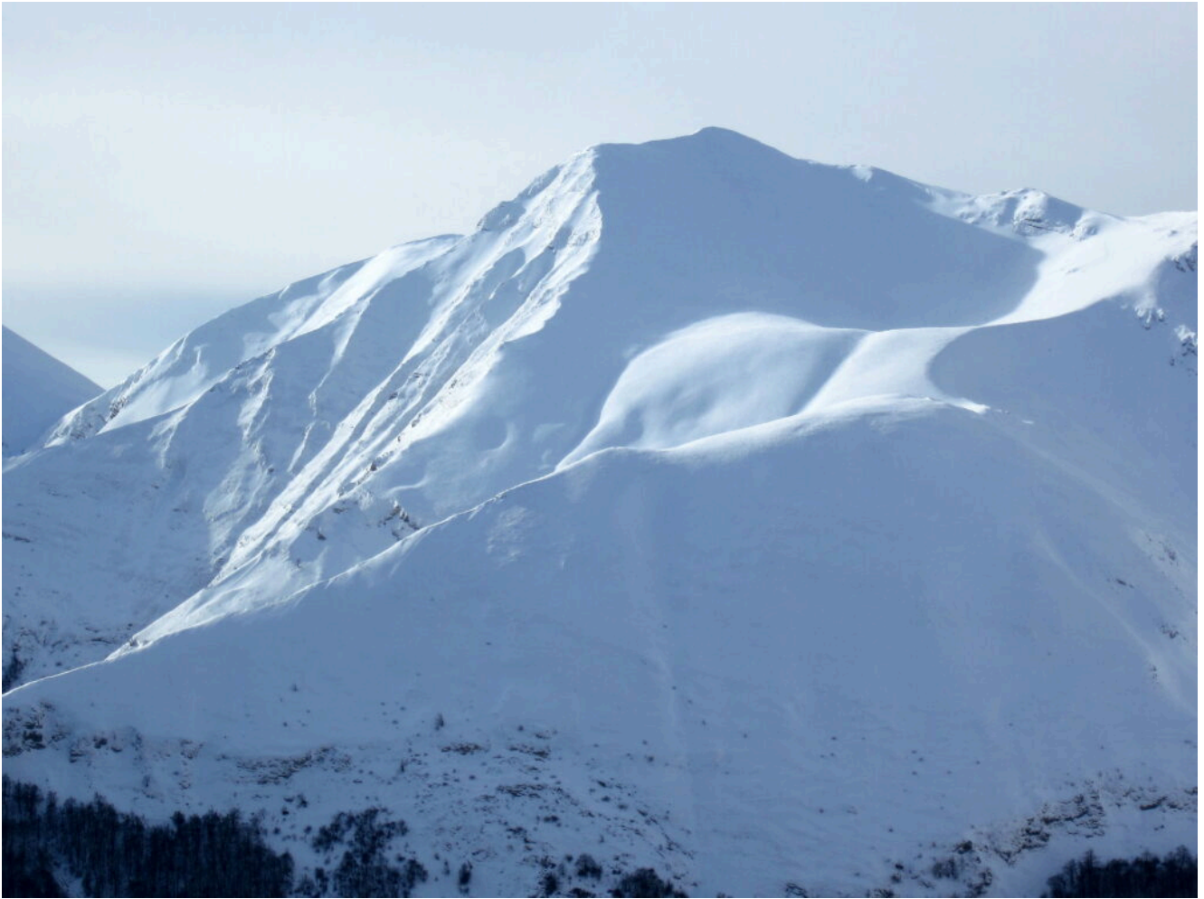
5- Il versante Nord e Nord-Est del Monte Argentella.