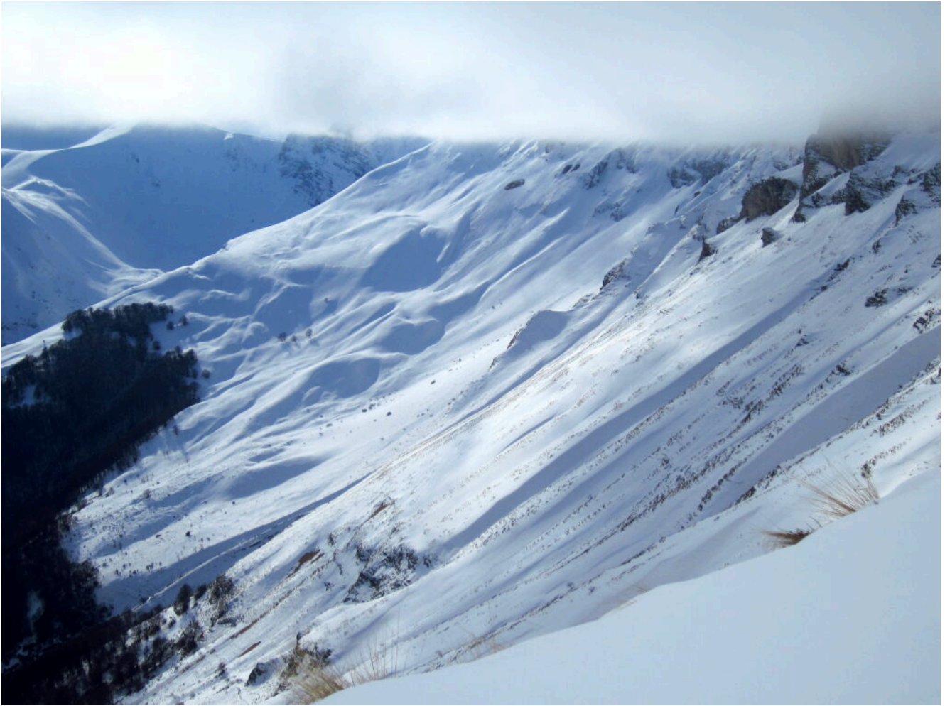
27- Per fortuna la nebbia forma una fascia in quota.