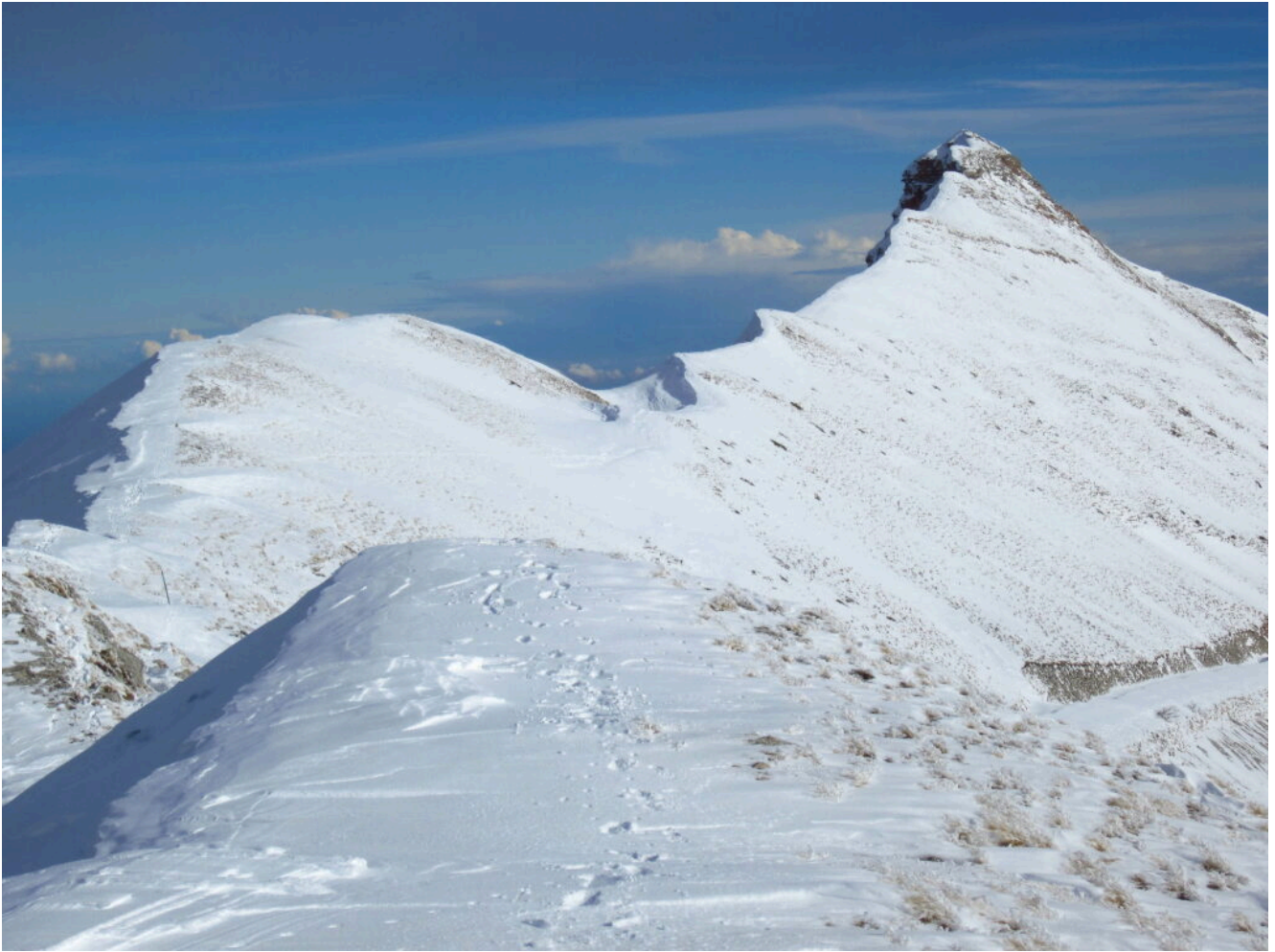
18- Il Monte Sibilla visto dalla cresta per Cima Vallelunga.