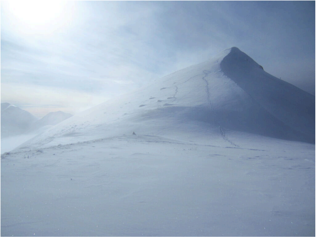
26- Scendiamo da Cima Vallelunga immersi nella nebbia.