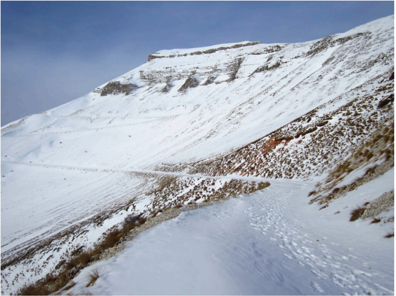
3- Versante Est del Monte Sibilla con la cosiddetta "corona" rocciosa.