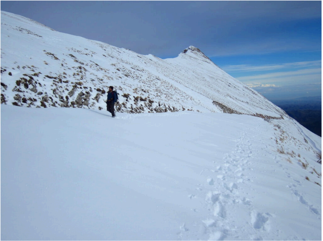
15- Giunti ormai quasi alla cresta con la strada praticamente sommersa dalla neve.