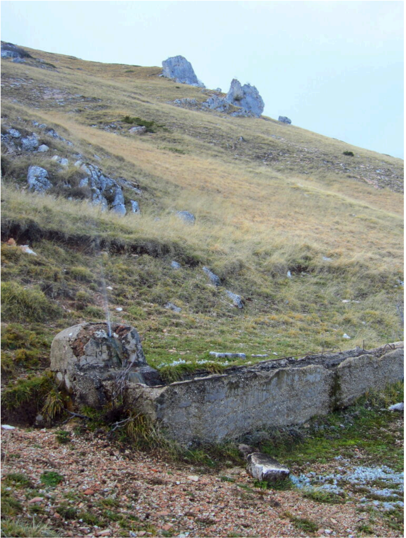
31- Ritorniamo alla fonte di Pianamonte, l'erba intorno si è scongelata, sopra si vedono i due scogli isolati denominati i "guardiani", a monte di Isola San Biagio.