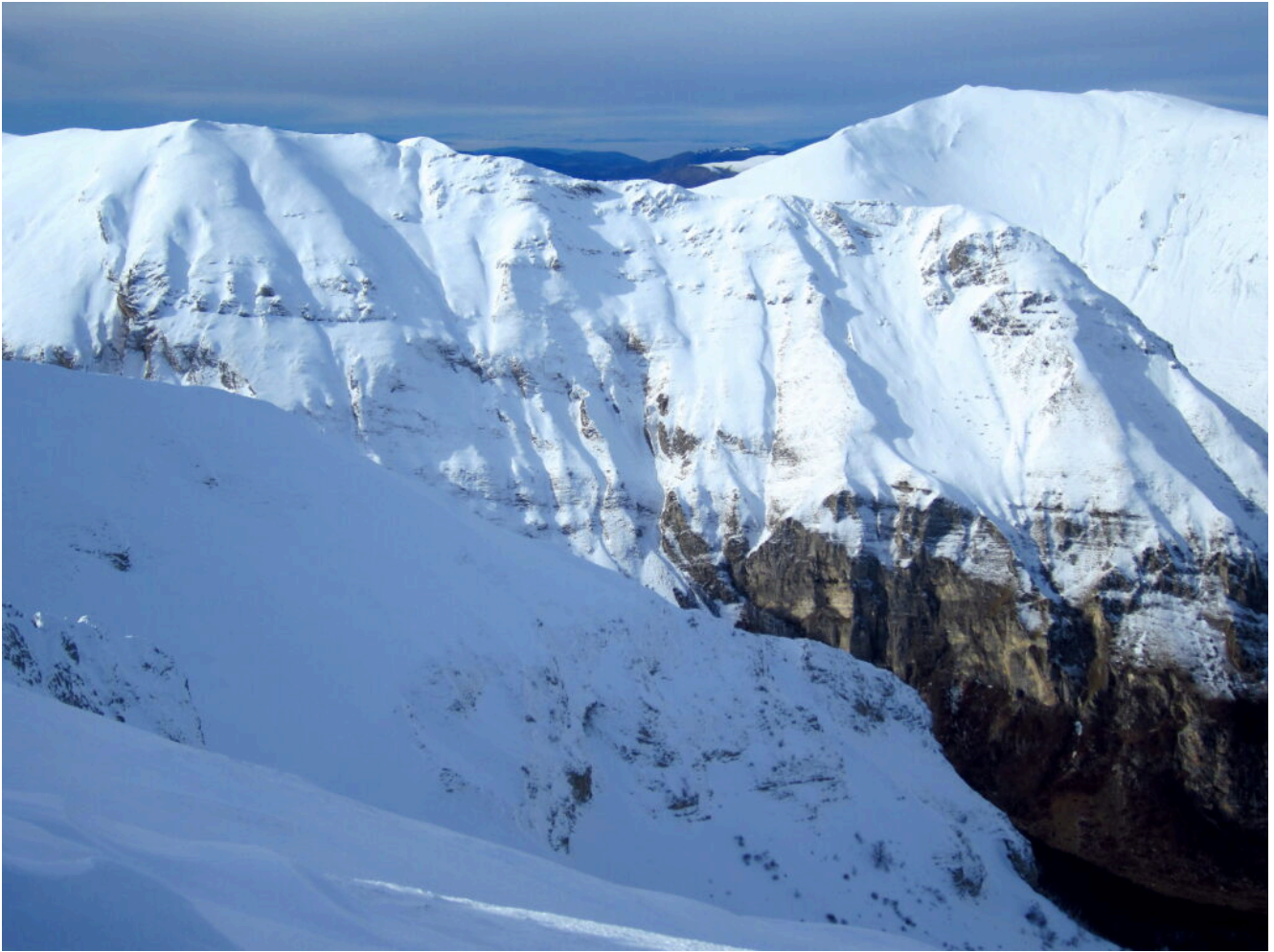
19. Cima Cannafusto e il Monte Bove Sud sullo sfondo.