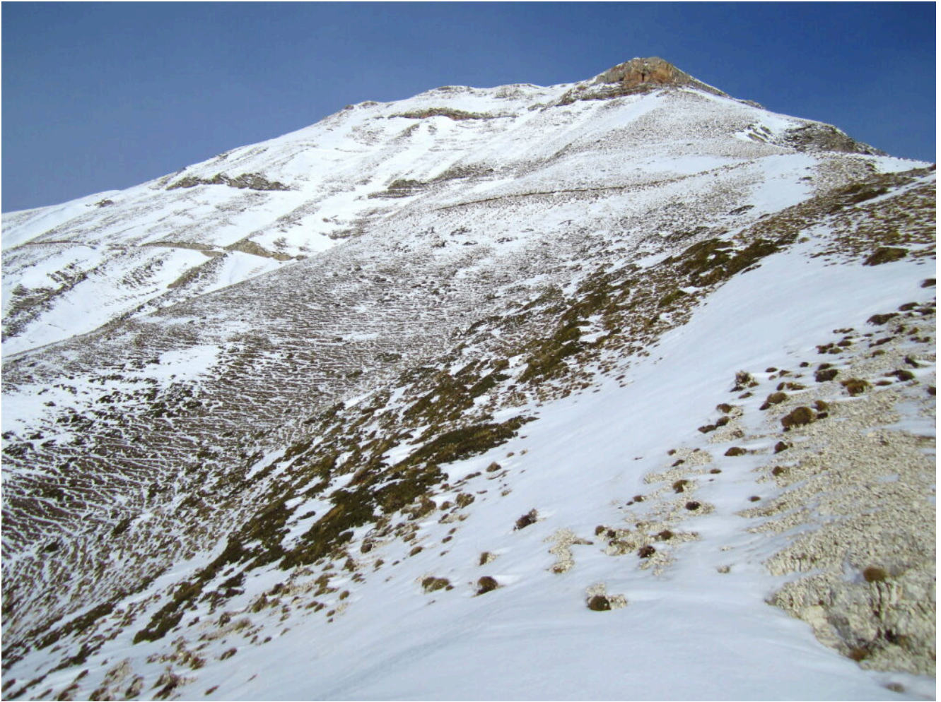
10- La cima del Monte Sibilla vista a monte della Banditella.