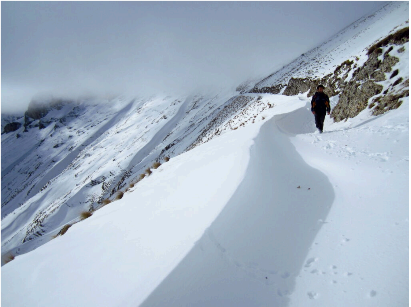
29- 30- La lunga discesa nella strada della Sibilla piena di neve.