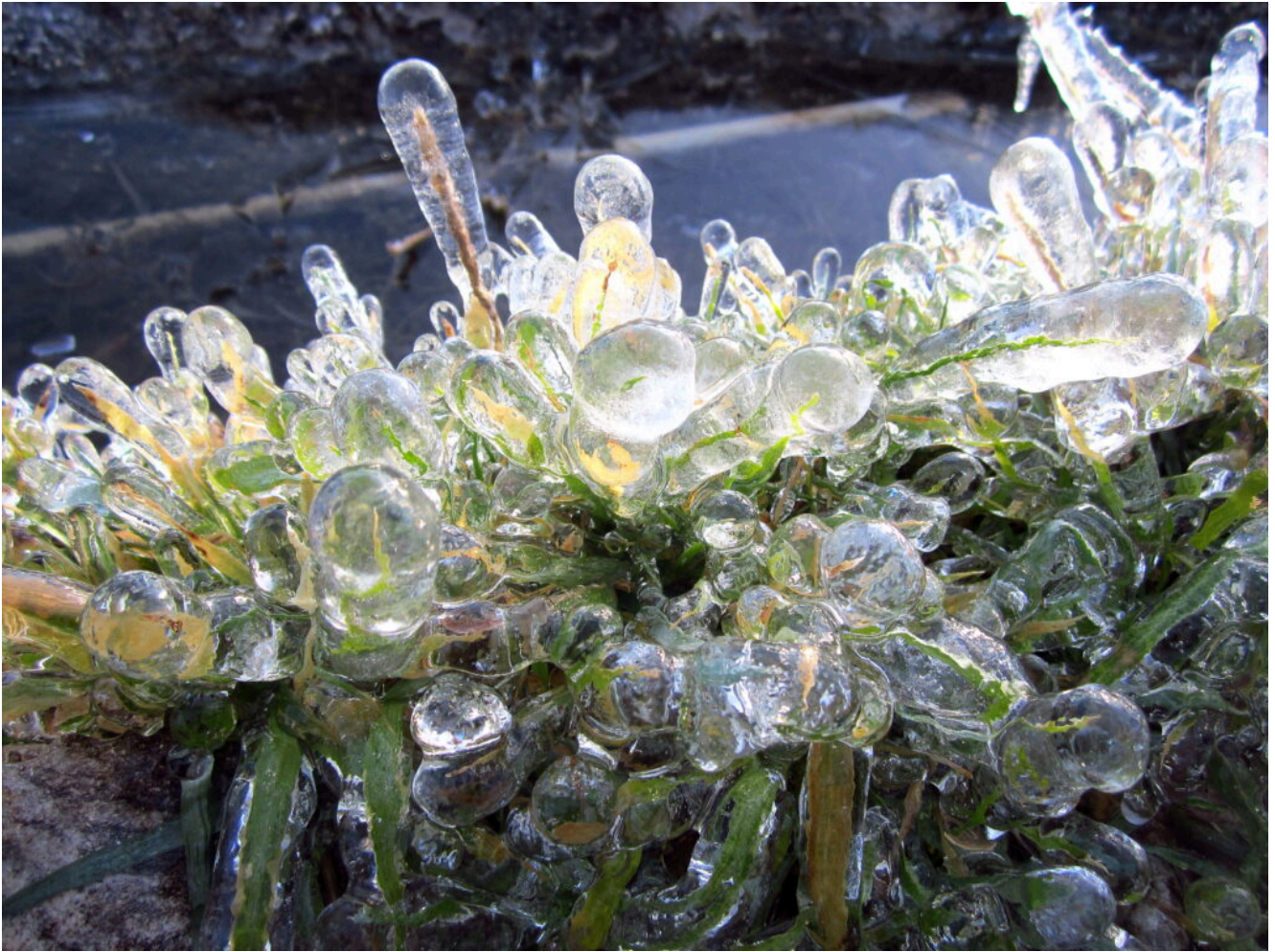
1- Erba glassata al mattino intorno alla fonte di Pianamonte nei pressi dei cosiddetti "guardiani", a monte di Isola San Biagio (vedi foto n.31).