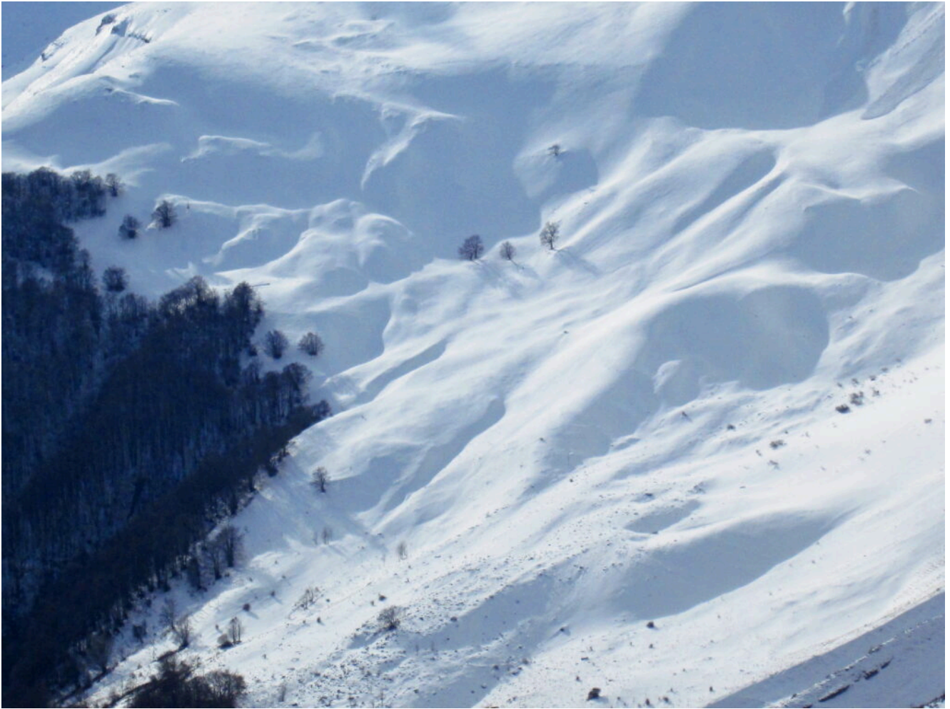
28- La zona della Fonte del Faggio.