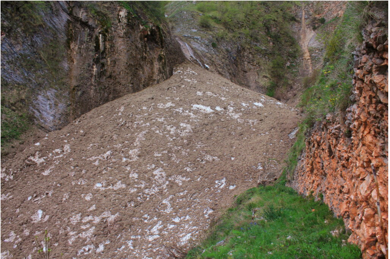
13- Il nevaio di Buggero a Maggio nel suo completo visto dal canale della centrale.