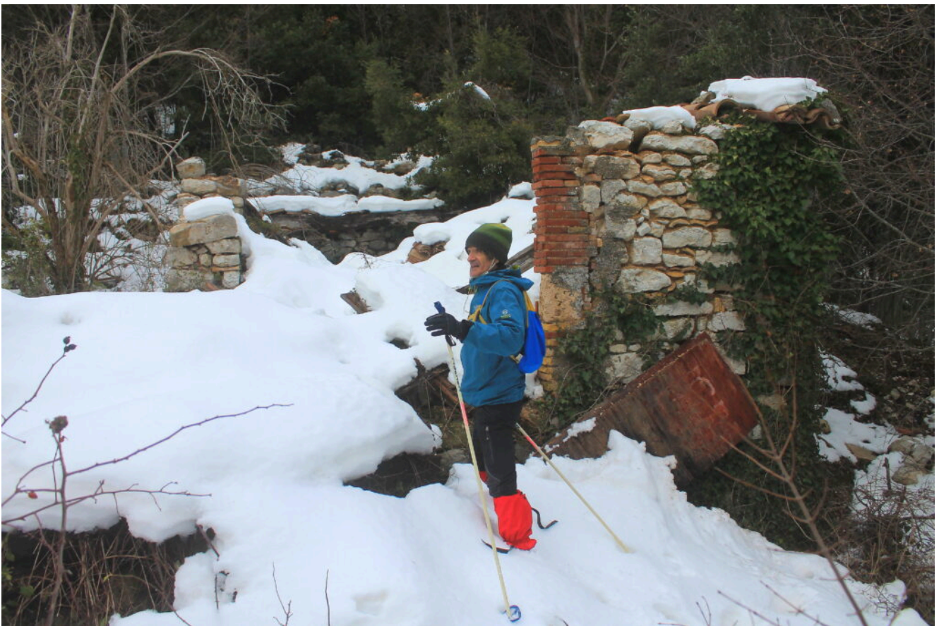
8- I ruderi di un cascinale sopra al poggio costruito sui ruderi della millenaria Badia di Rio Sacro.