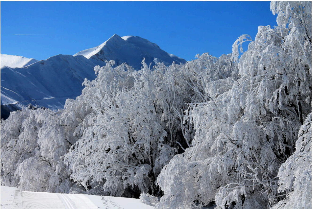
Sullo sfondo il Monte Acuto ed il Pizzo Tre Vescovi