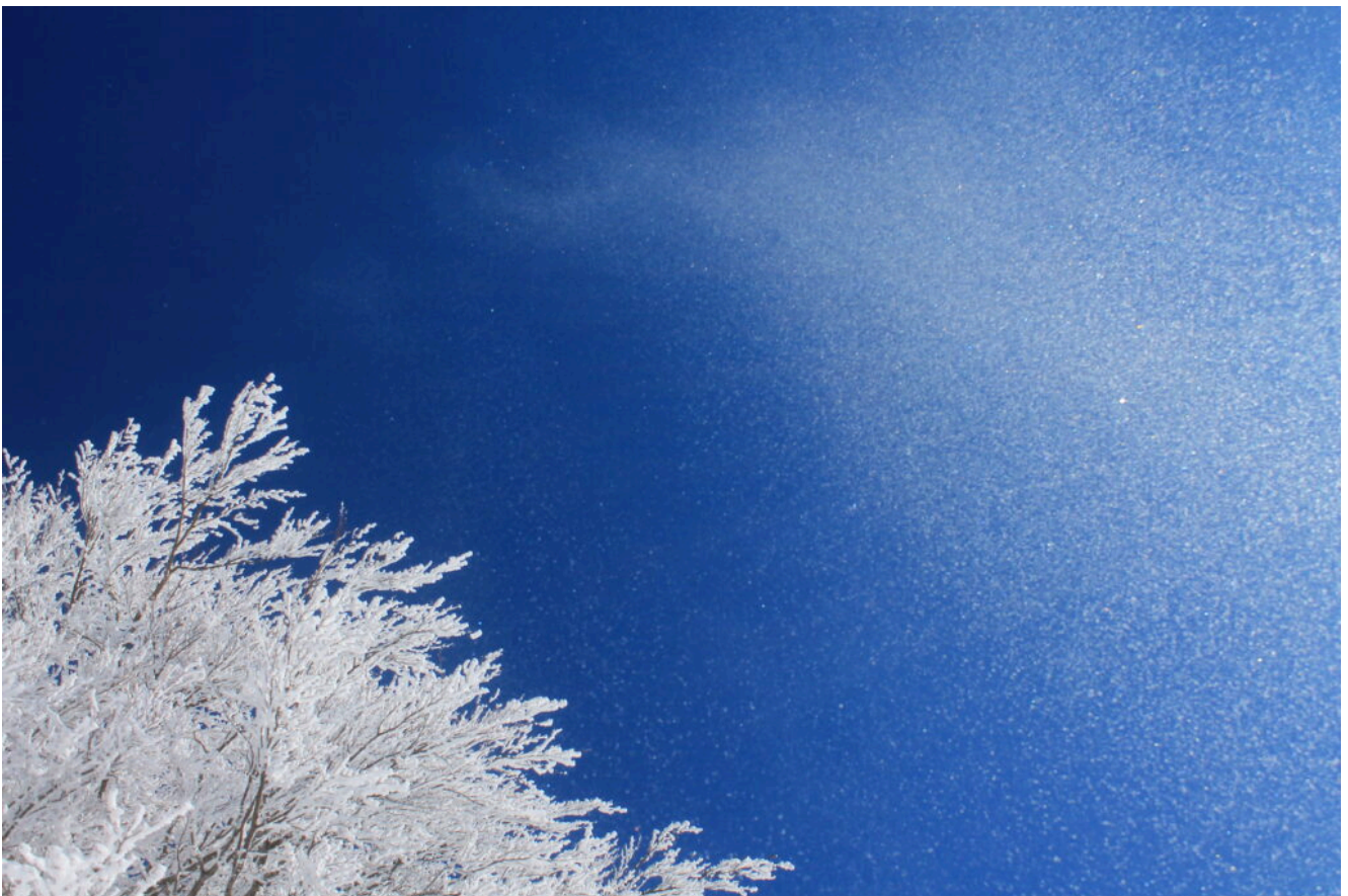
Al primo sole le prime cadute di galaverna