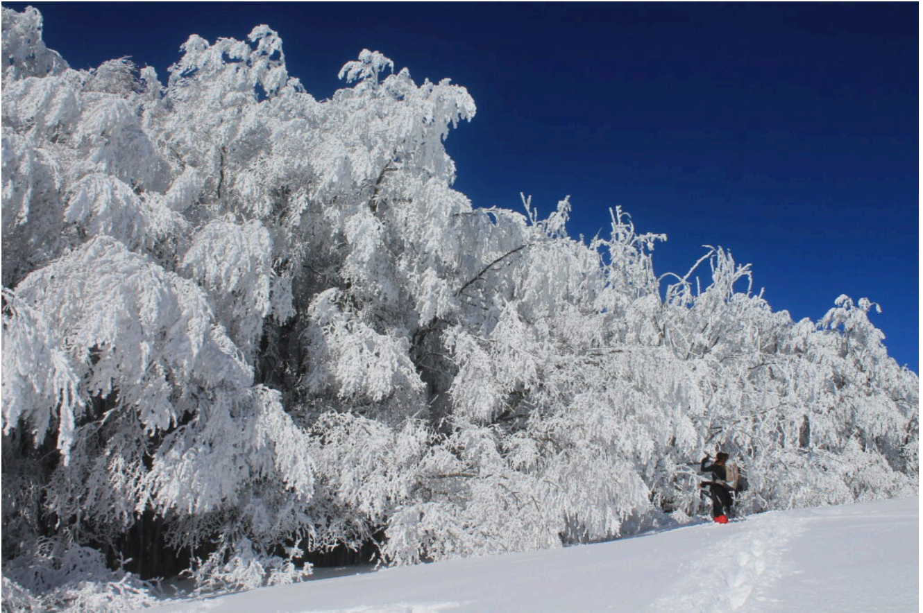
LA FAGGETA DI MACCHIA TONDA ED IL GRANDE FAGGIO SECOLARE