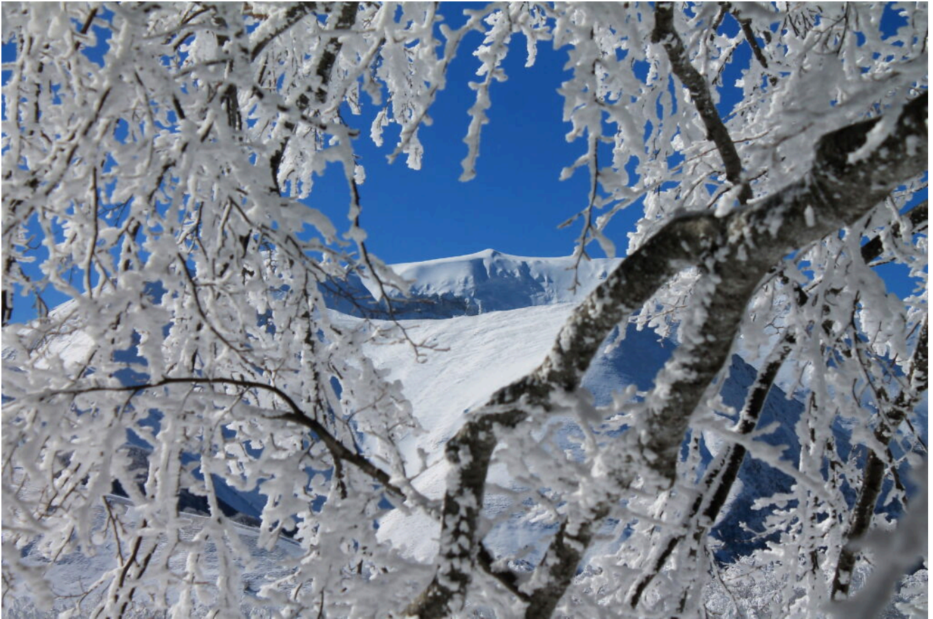
Il Monte Rotondo emerge dai rami.