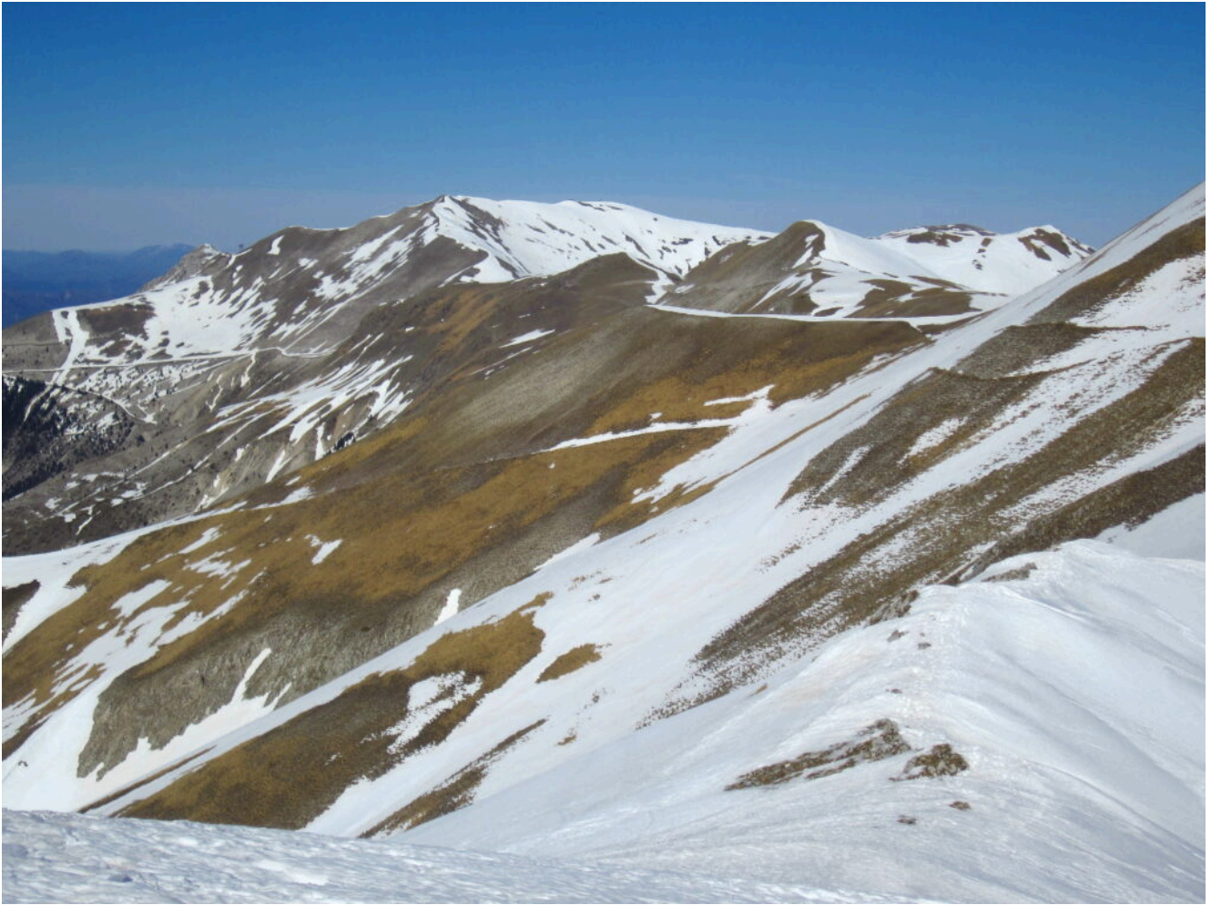
14- Veduta verso Nord con i versanti Ovest di Cima Vallinfante e Monte Bove Sud praticamente già senza neve.