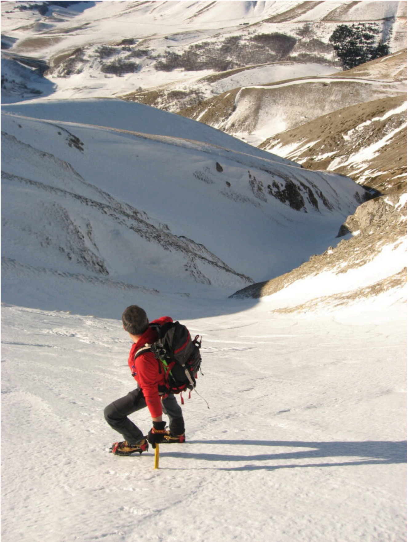
29- Uscita dalla strettoia del canale Ovest del Monte Porche, si prosegue diretti verso la cima, in alto a sinistra la zona del San Lorenzo.