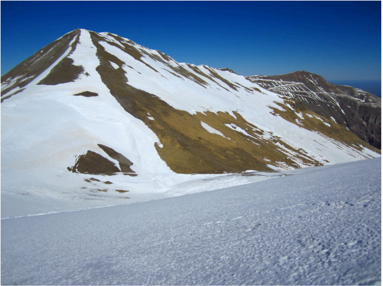
15- Slavine sotto al Monte Porche e il Monte Sibilla a destra anch'esso senza neve.