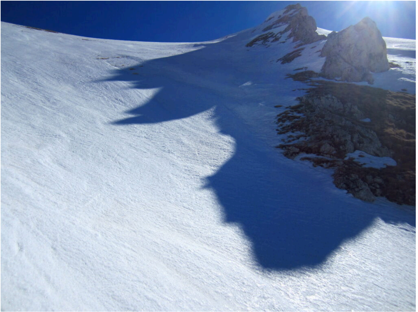
9 – 10- La fascia di roccia del lato destro del canale.