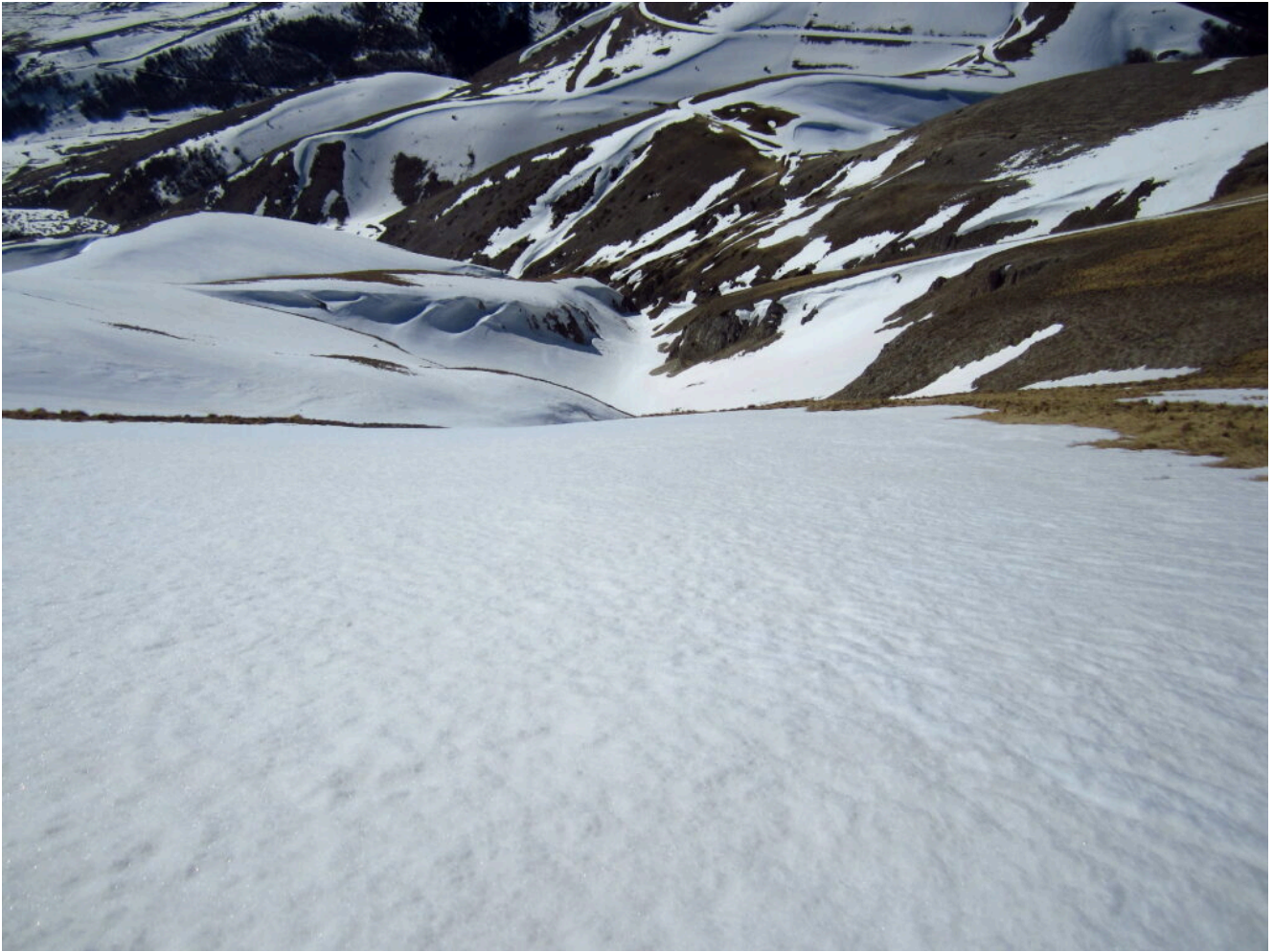
22- Il canale di salita visto dalla cresta per il Monte Porche..