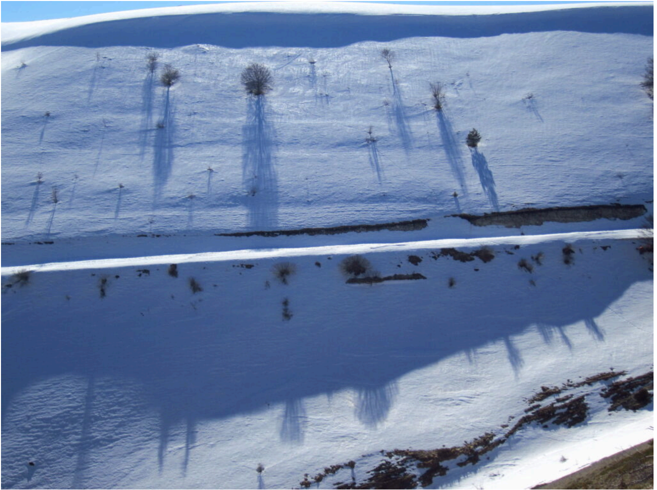
24- Giochi di ombre al Monte Prata