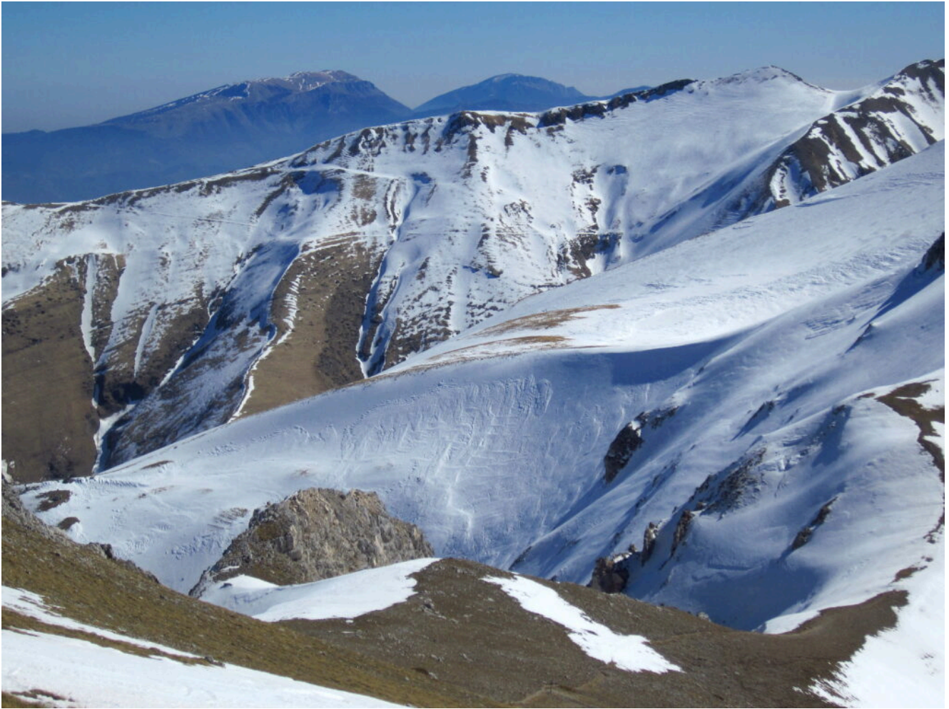
21- Veduta verso Est con il Pian delle Cavalle in primo piano e il Monte Torrone dietro. Sullo sfondo i Monti Gemelli.