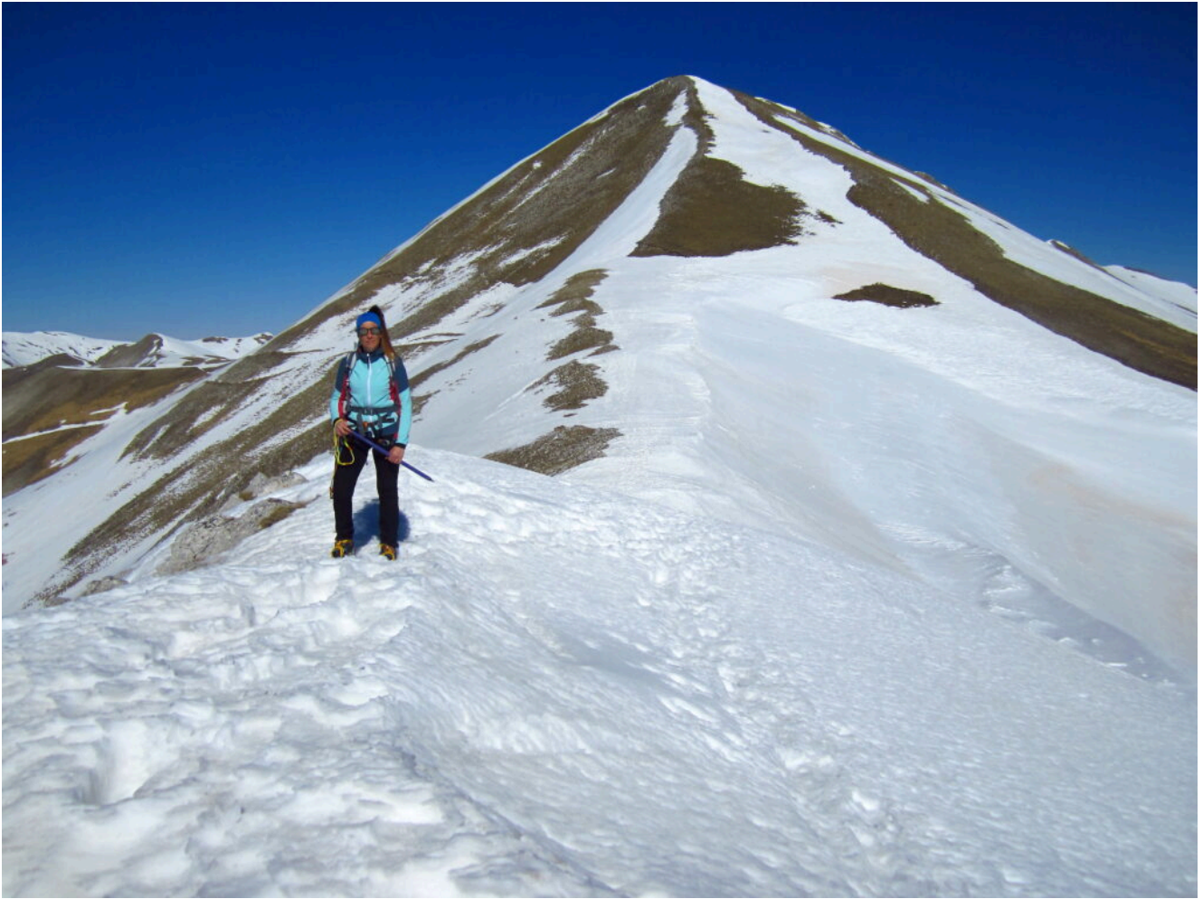
12- L'uscita in cresta, alle spalle il Monte Porche.