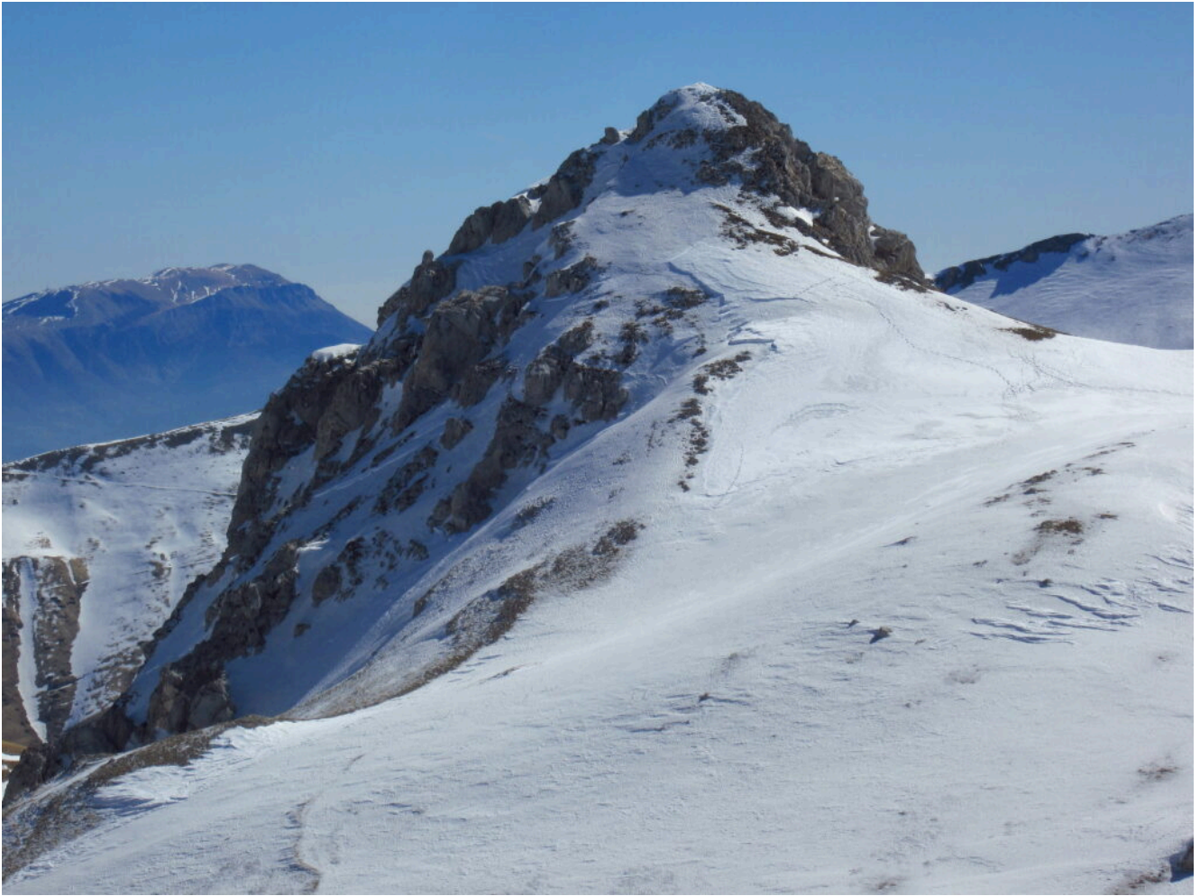
13- Il Sasso di Palazzo Borghese