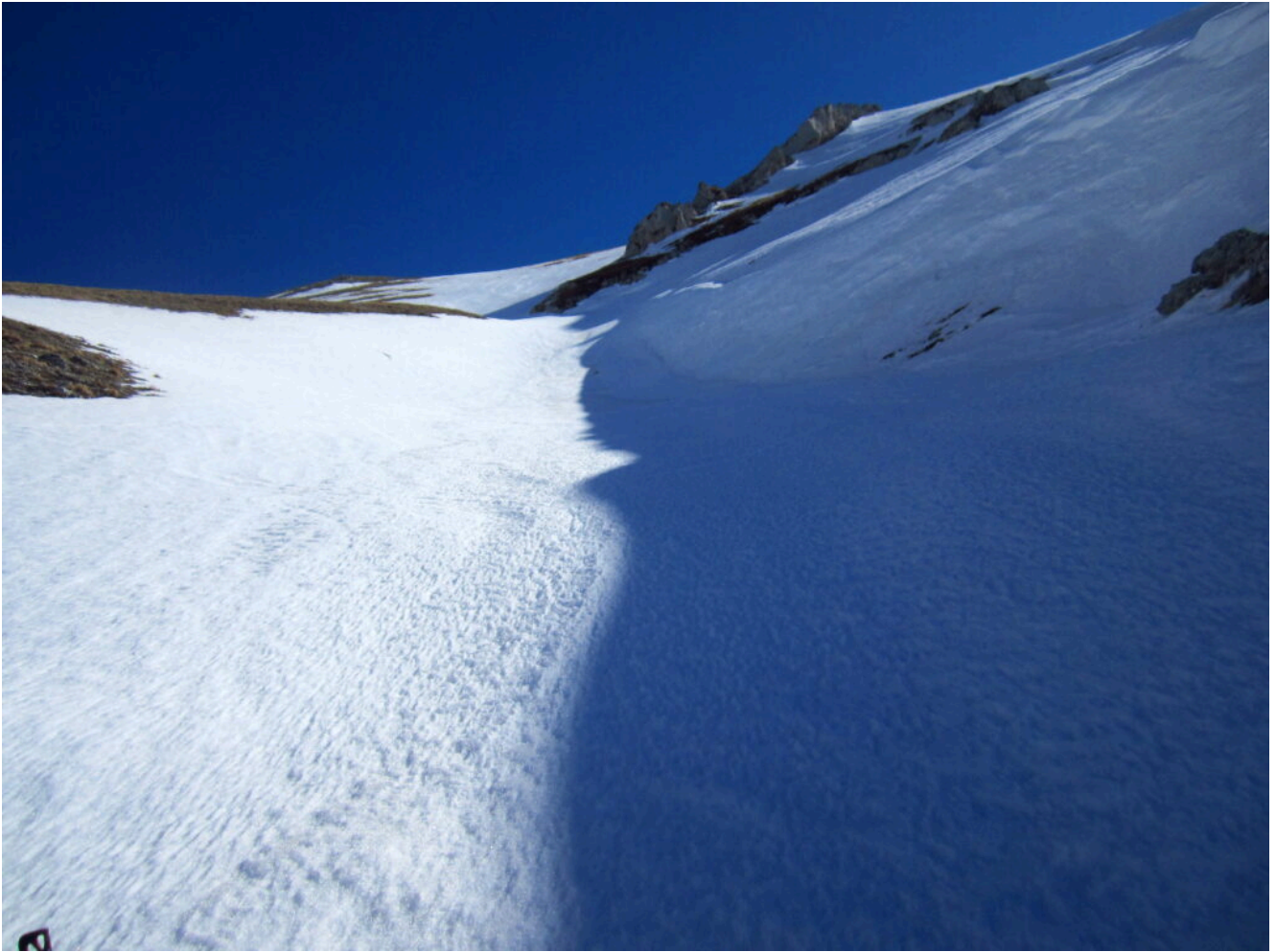
7- In alto la fascia rocciosa nel lato destro del canale.