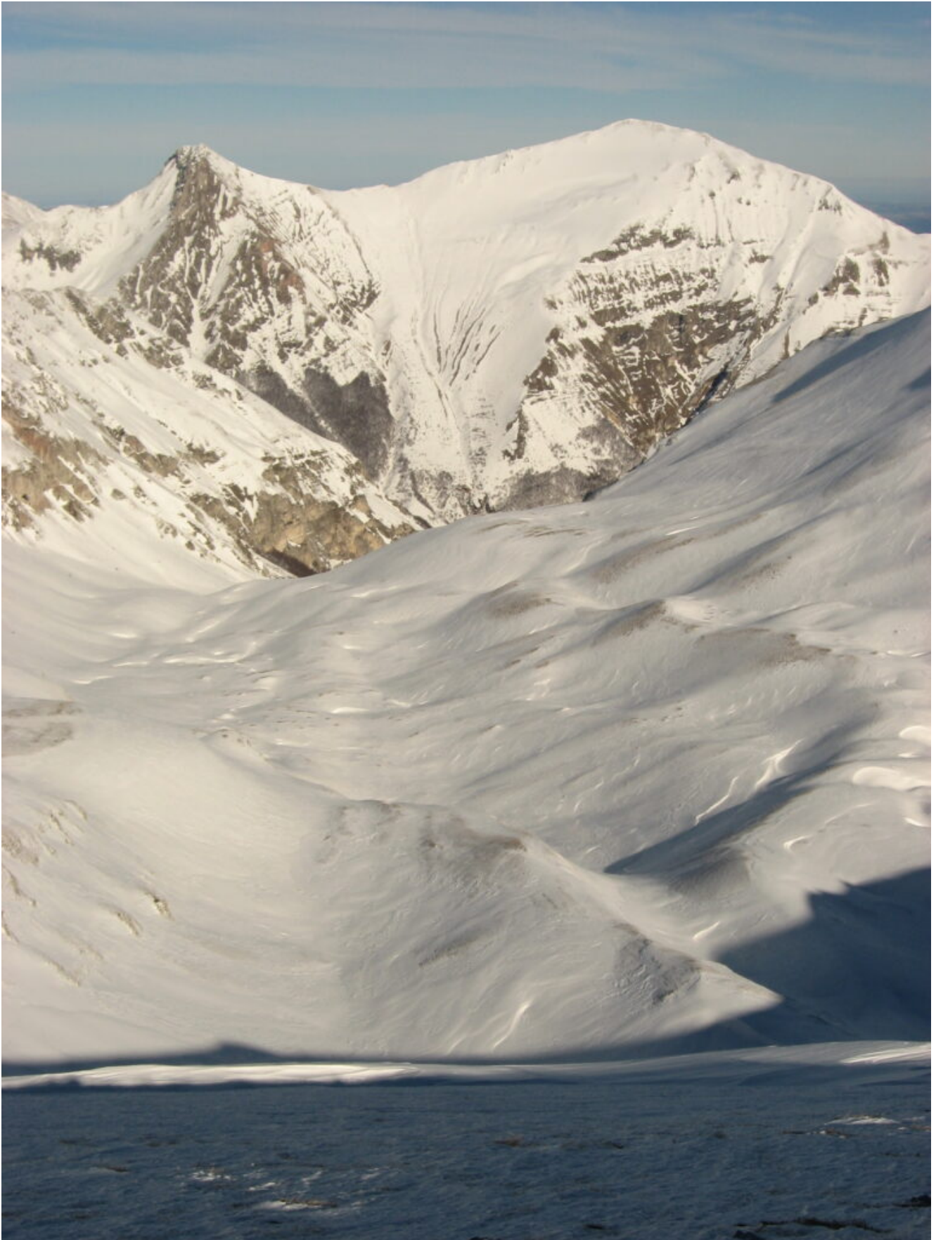
33- Veduta verso Nord con il Pizzo Berro e Il Pizzo Regina..