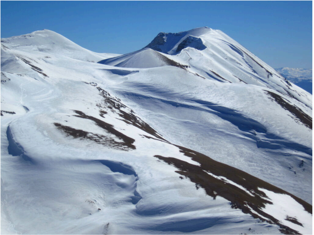
20- Grandi accumuli di neve prodotti dal vento sui canali Ovest del Monte Argentella.