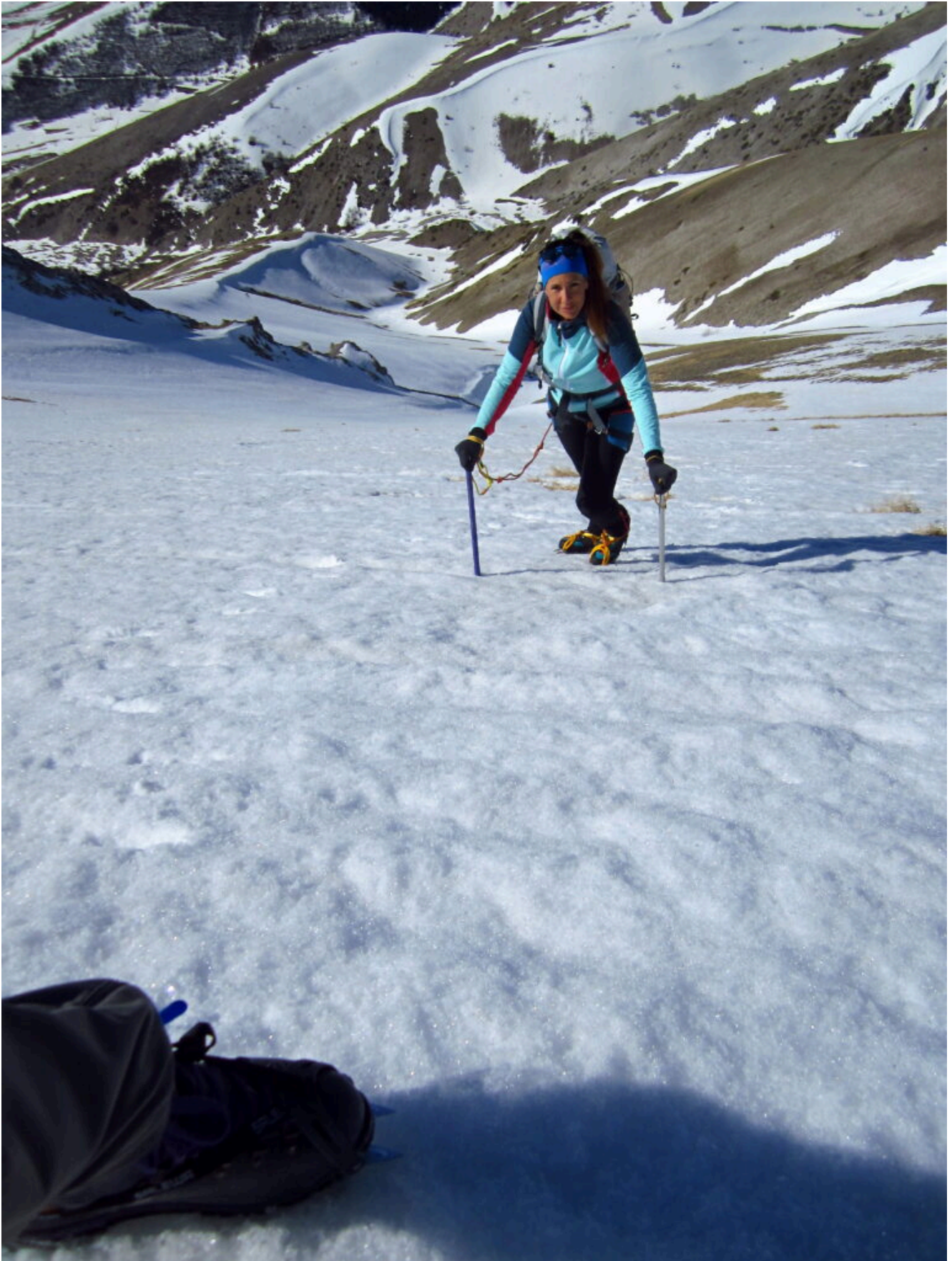
11- Quasi all'uscita in cresta, sotto ai nostri piedi il canale di salita.