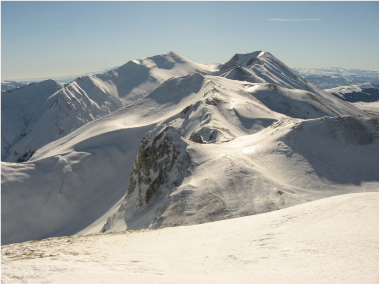
31- Veduta verso Sud.