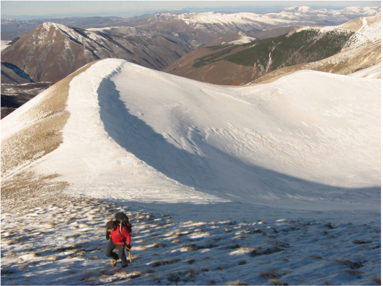
30- La sella Nord Ovest vista salendo verso la cima del Monte Porche.