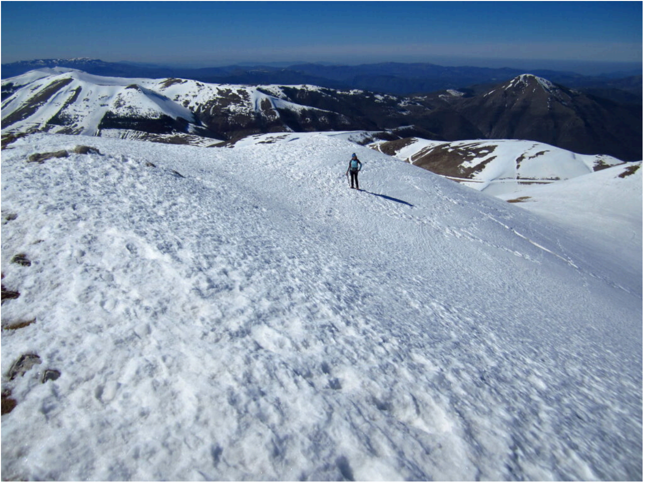
18- Arriva Monica in cima.