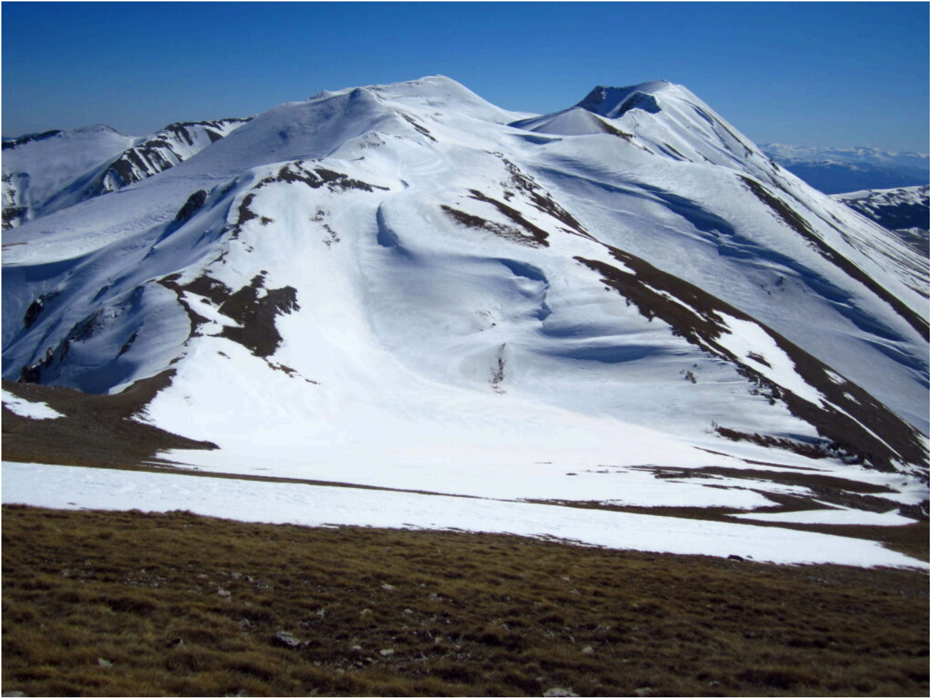
17- Veduta verso Sud con il Monte Argentella a sinistra con sopra il Monte Vettore e il Pizzo del Diavolo e la Cima del Redentore sullo sfondo a destra.