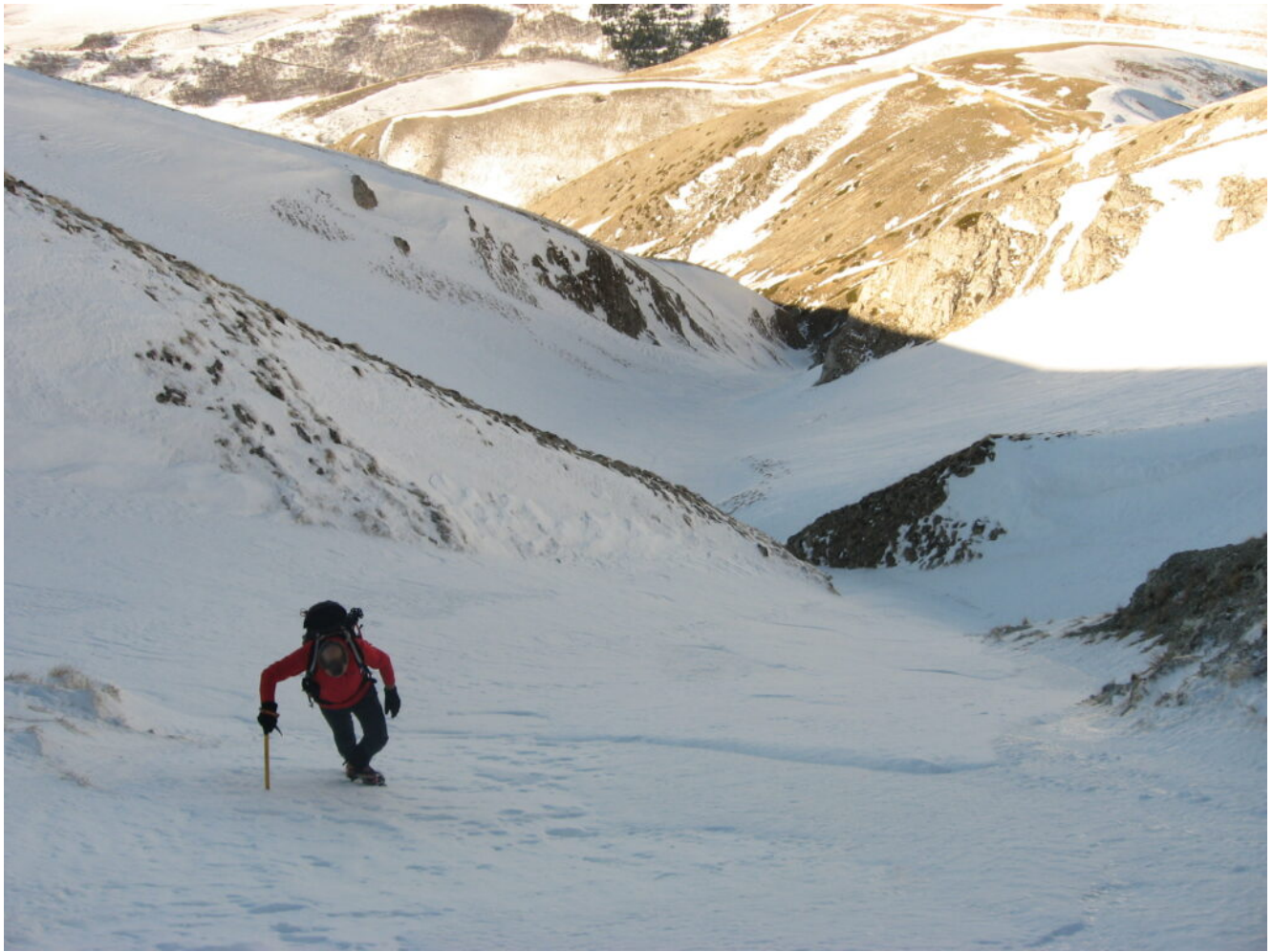
26- Salita del 2011, a destra al sole la zona della Fonte della Giumenta da cui si può entrare nel canale di salita.