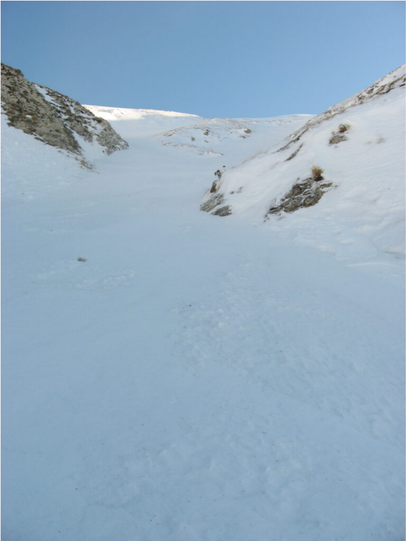
27- 28- La parte alta del canale.