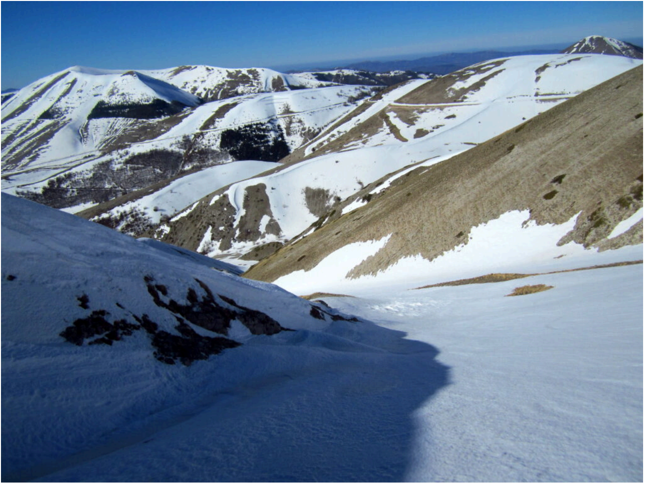
6- Vista verso Ovest sul Monte Cardosa a destra e sotto il Monte Prata con la strada mentre a sinistra il Monte Lieto con la fascia di rimboschimento.