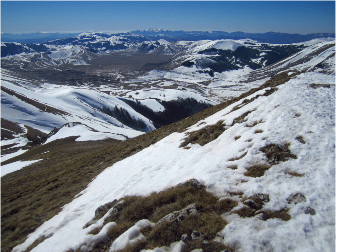
19- Veduta verso Sud-ovest con Castelluccio, il Piano Grande senza neve e sullo sfondo il Monte Terminillo.