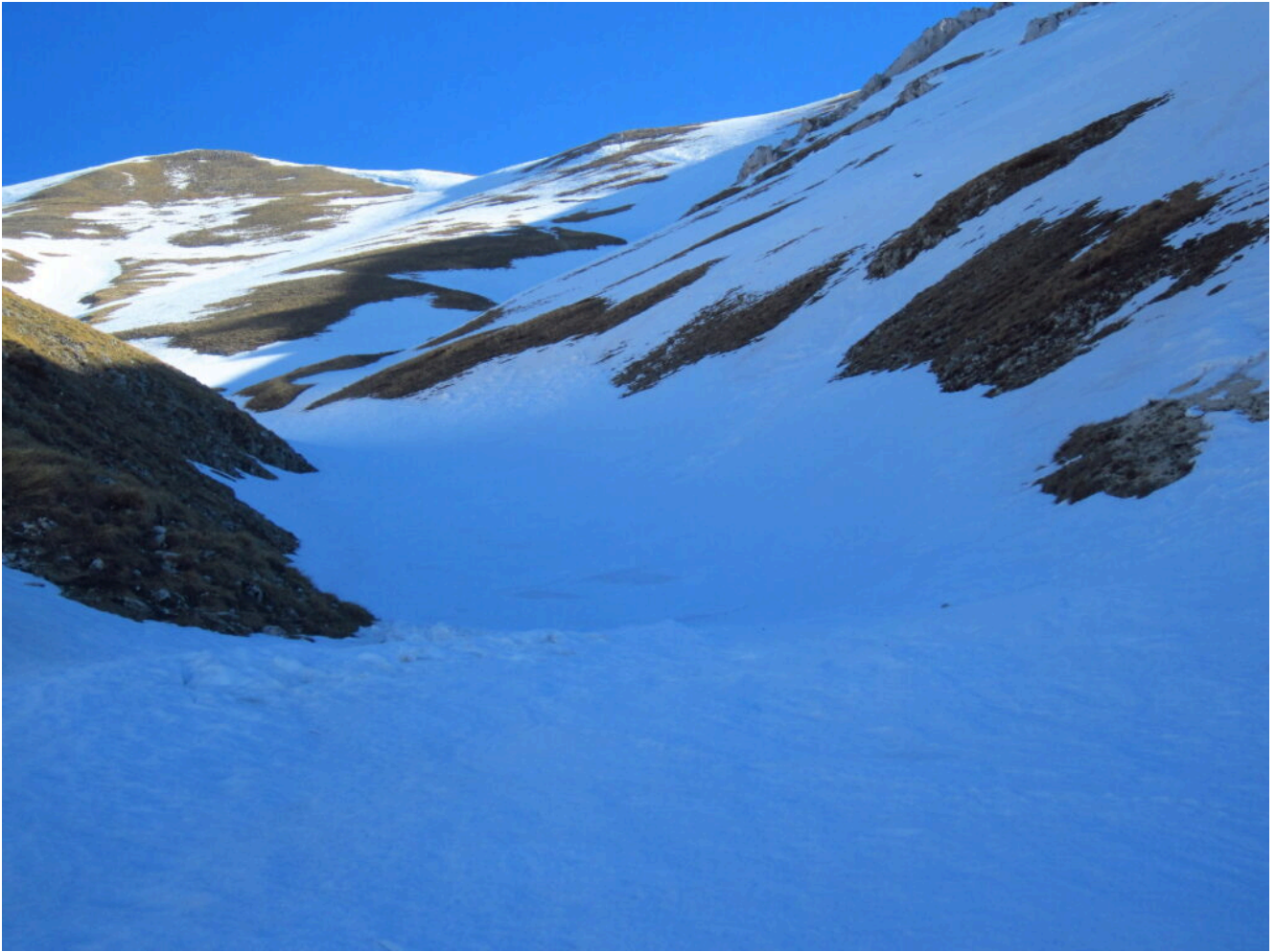
4- Il canale con la cima del Monte Porche a sinistra e la lama di roccia a destra.