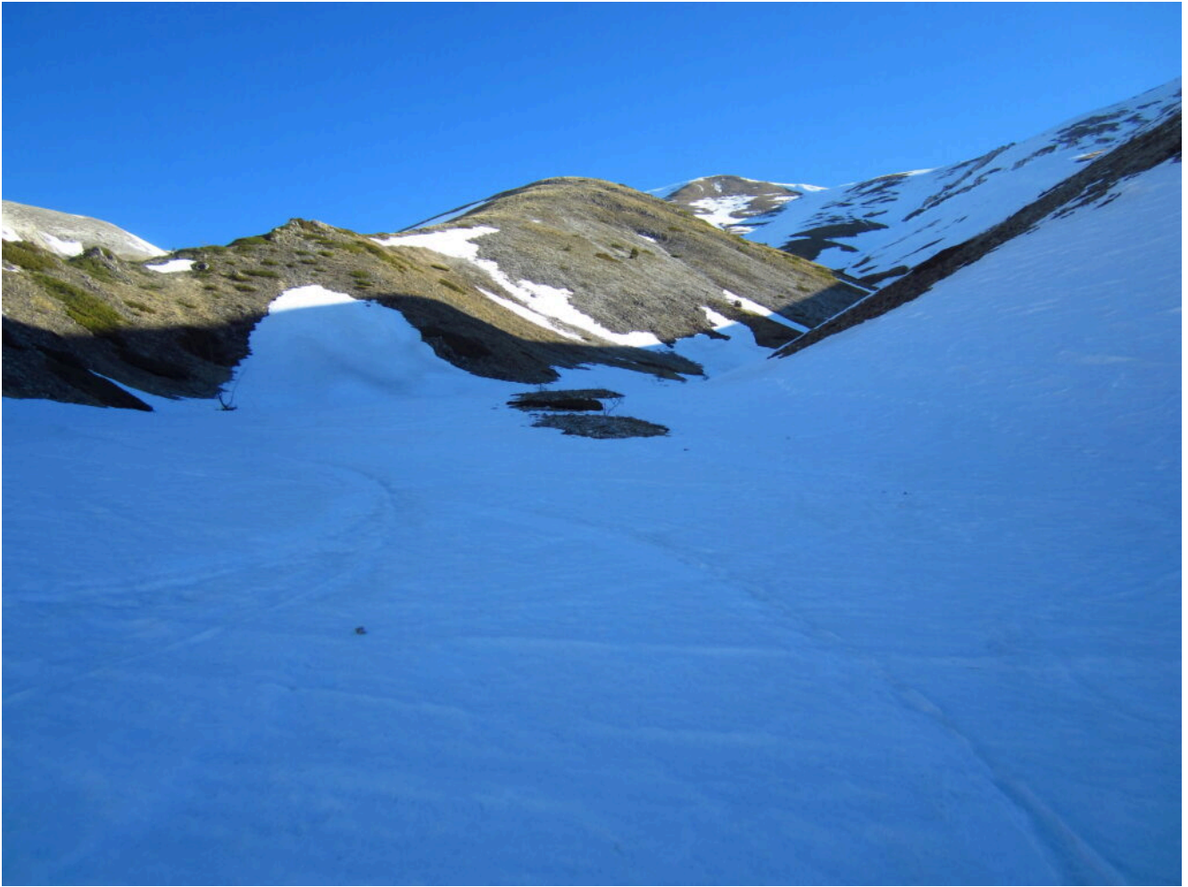
2- Il primo tratto del canale Ovest di Monte Palazzo Borghese.