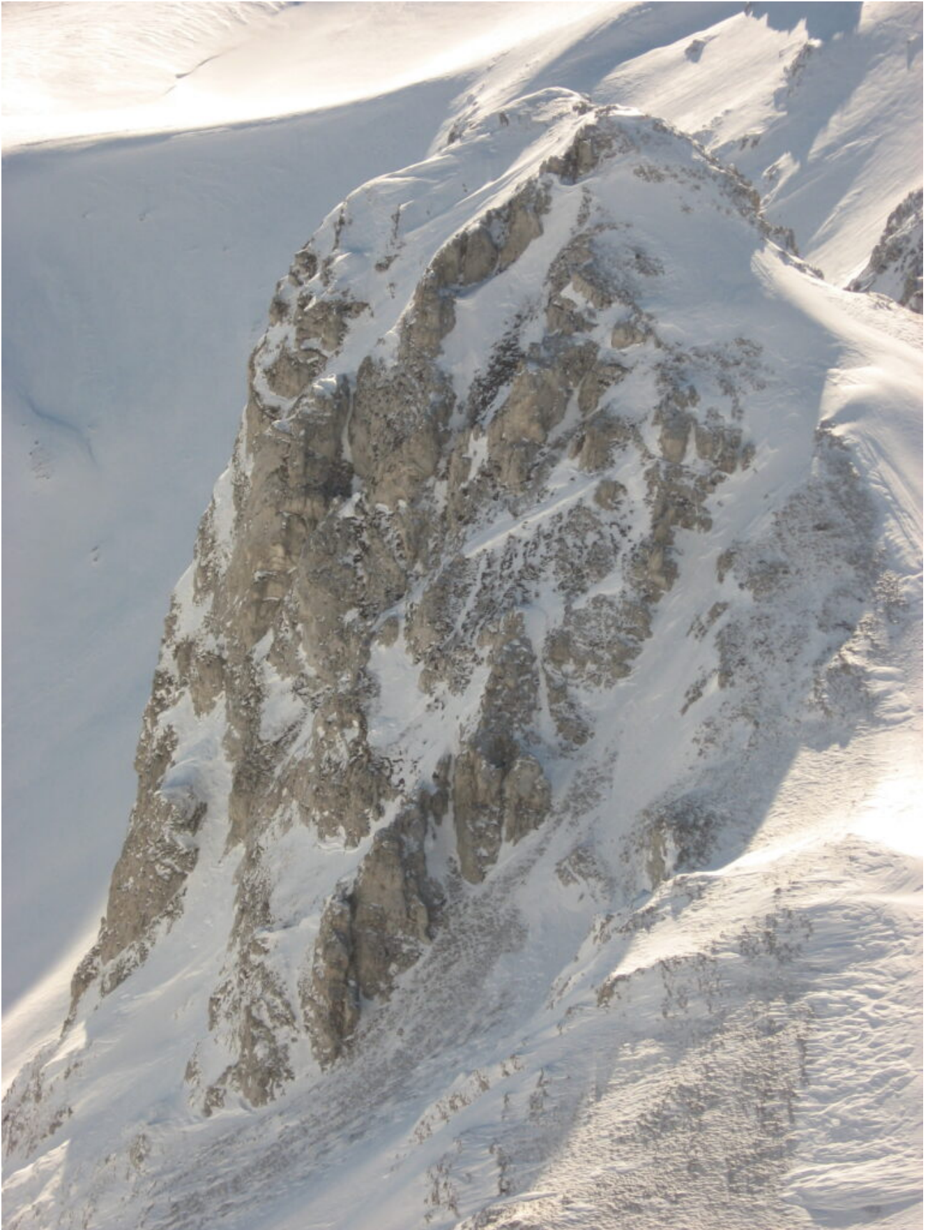
32- La parete Nord del Sasso di Palazzo Borghese.