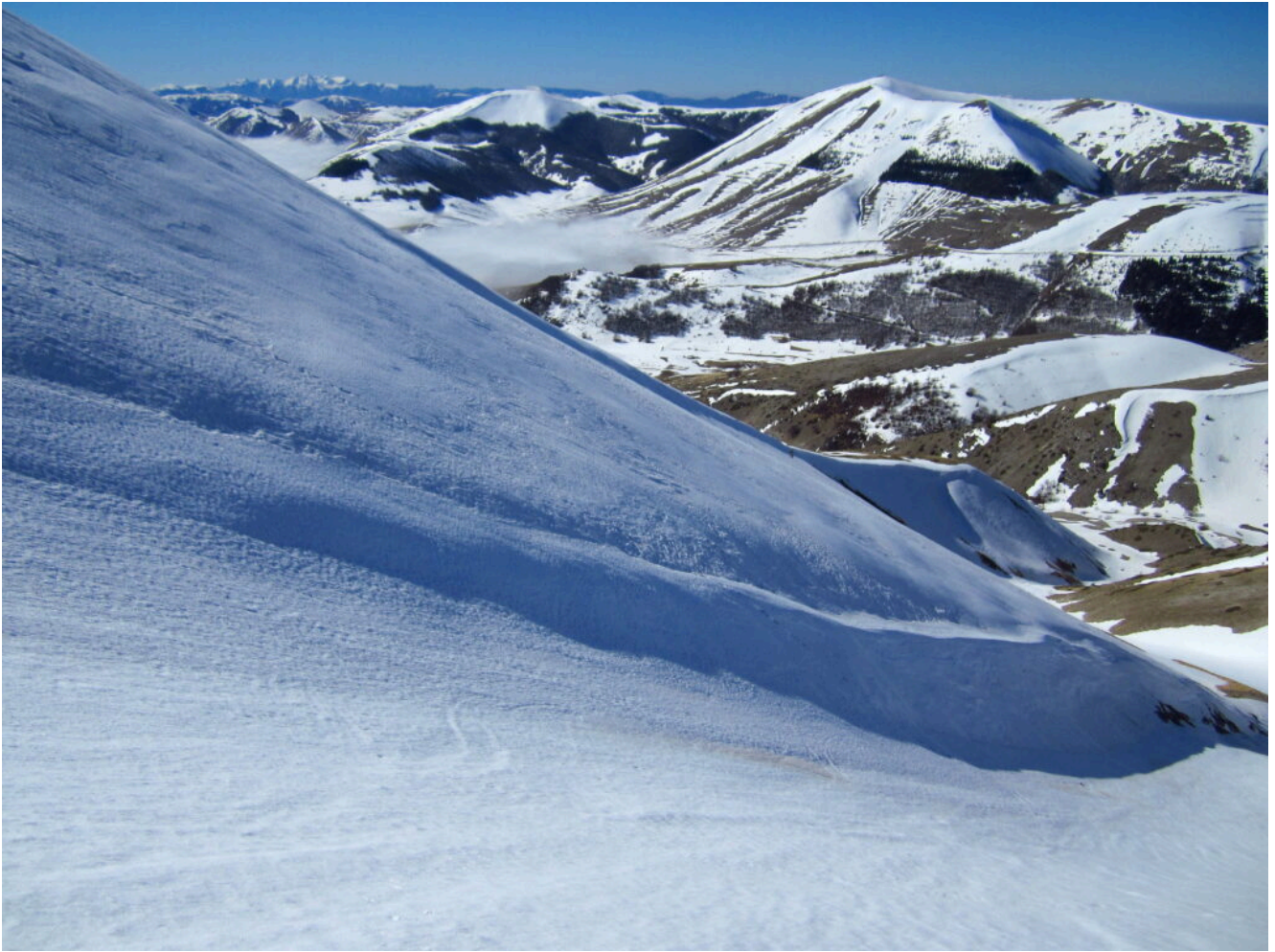
8- L'inizio del tratto più ripido del canale.