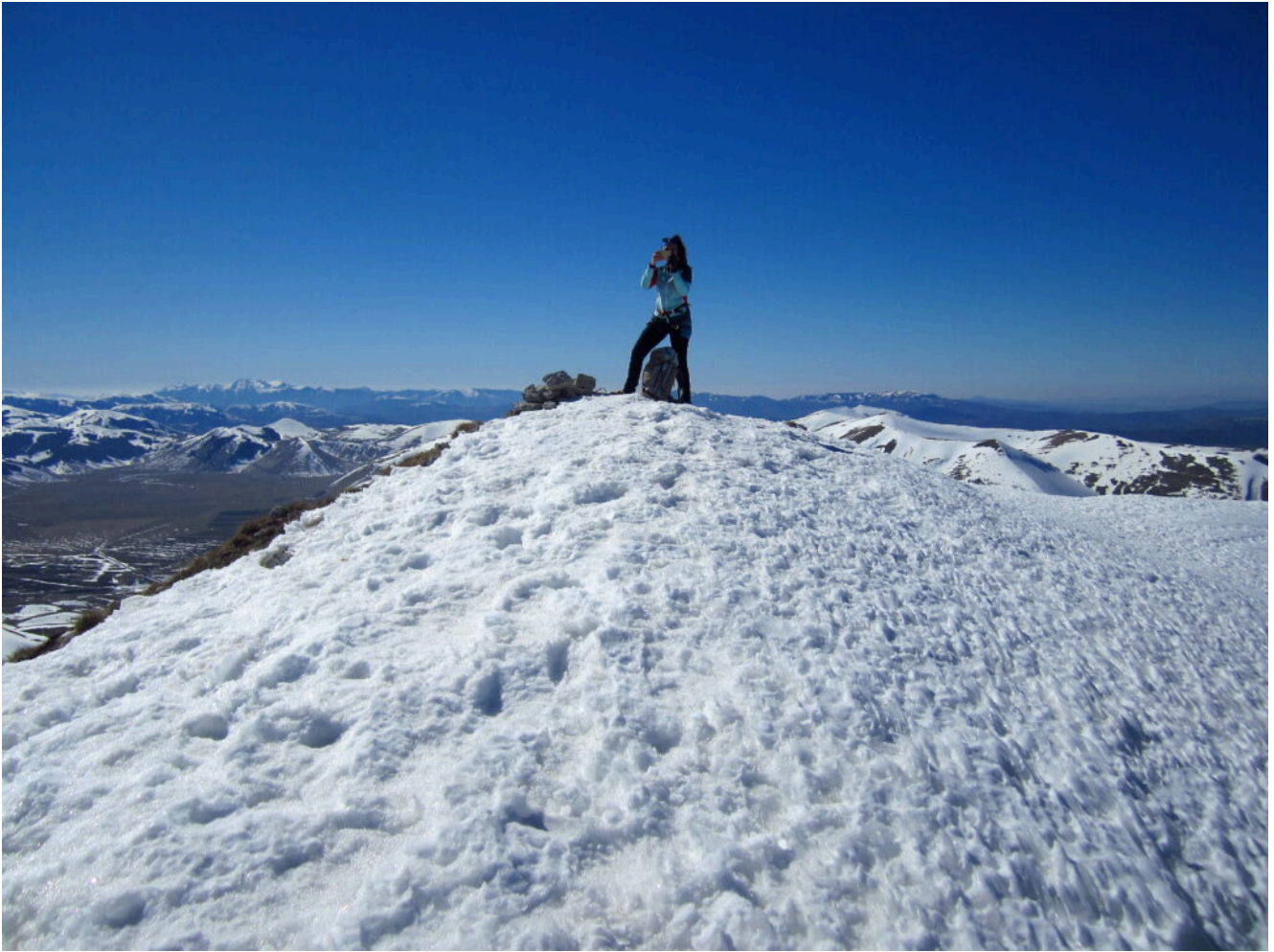
22- La cima del Monte Palazzo Borghese.