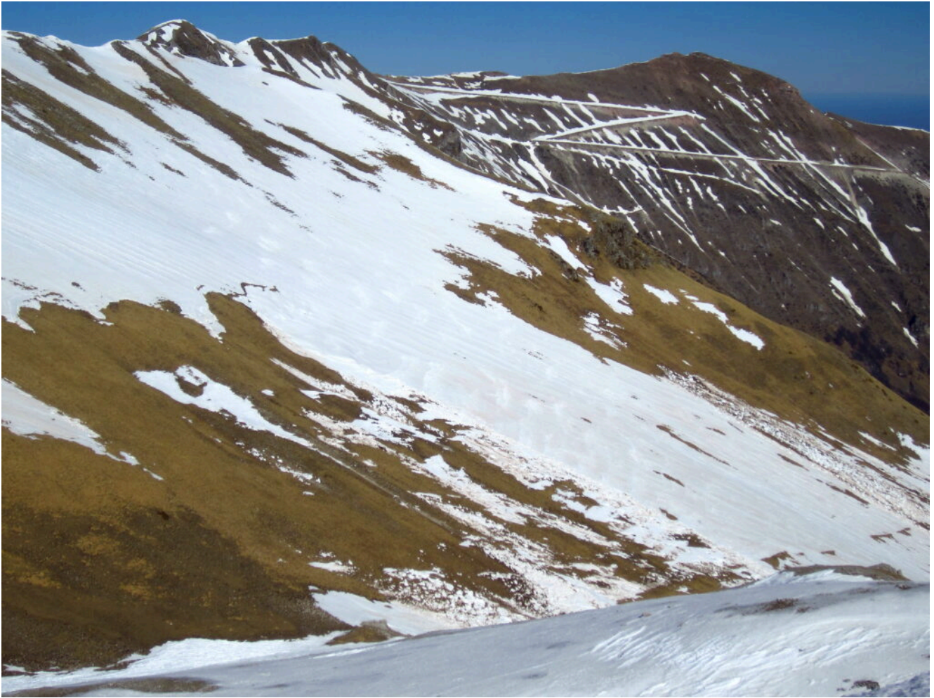
22- Dettaglio delle slavine staccatesi dal versante Est del Monte Porche e il Monte Sibilla.