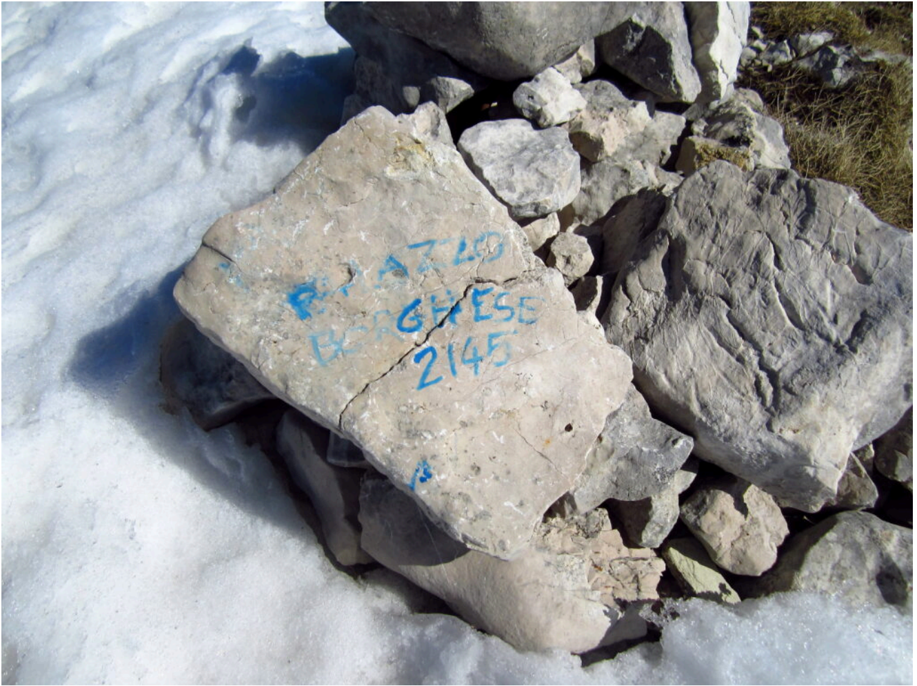
16- L'immane scritta sulla pietra di cima al Monte Palazzo Borghese ma ormai scolorita.