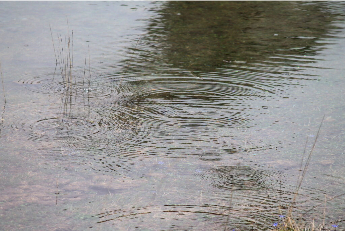
29 – 30- Bolle di aria o gas ? salgono di continuo dal fondo del Laghetto nella parte verso valle.