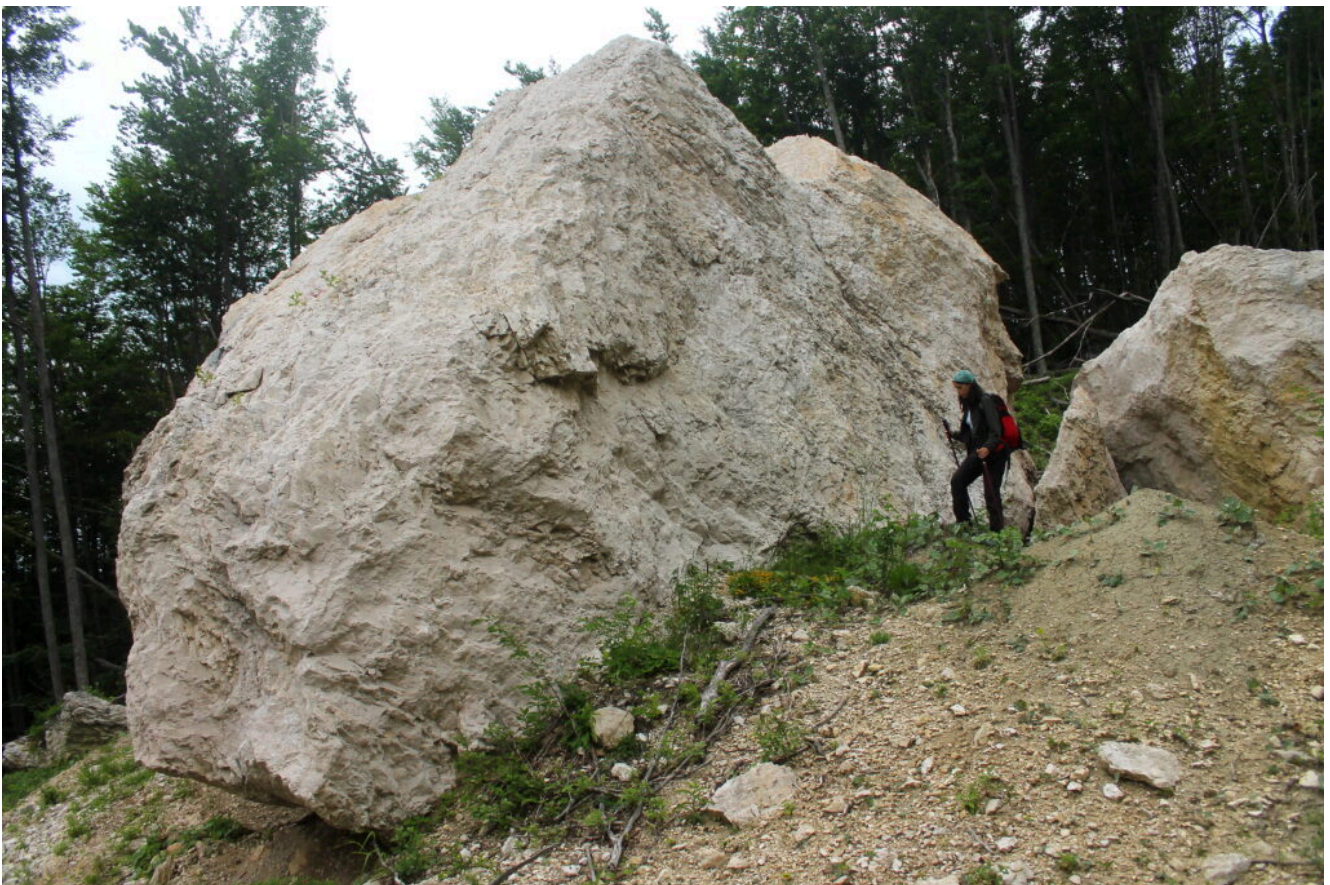
9- Lato Nord.