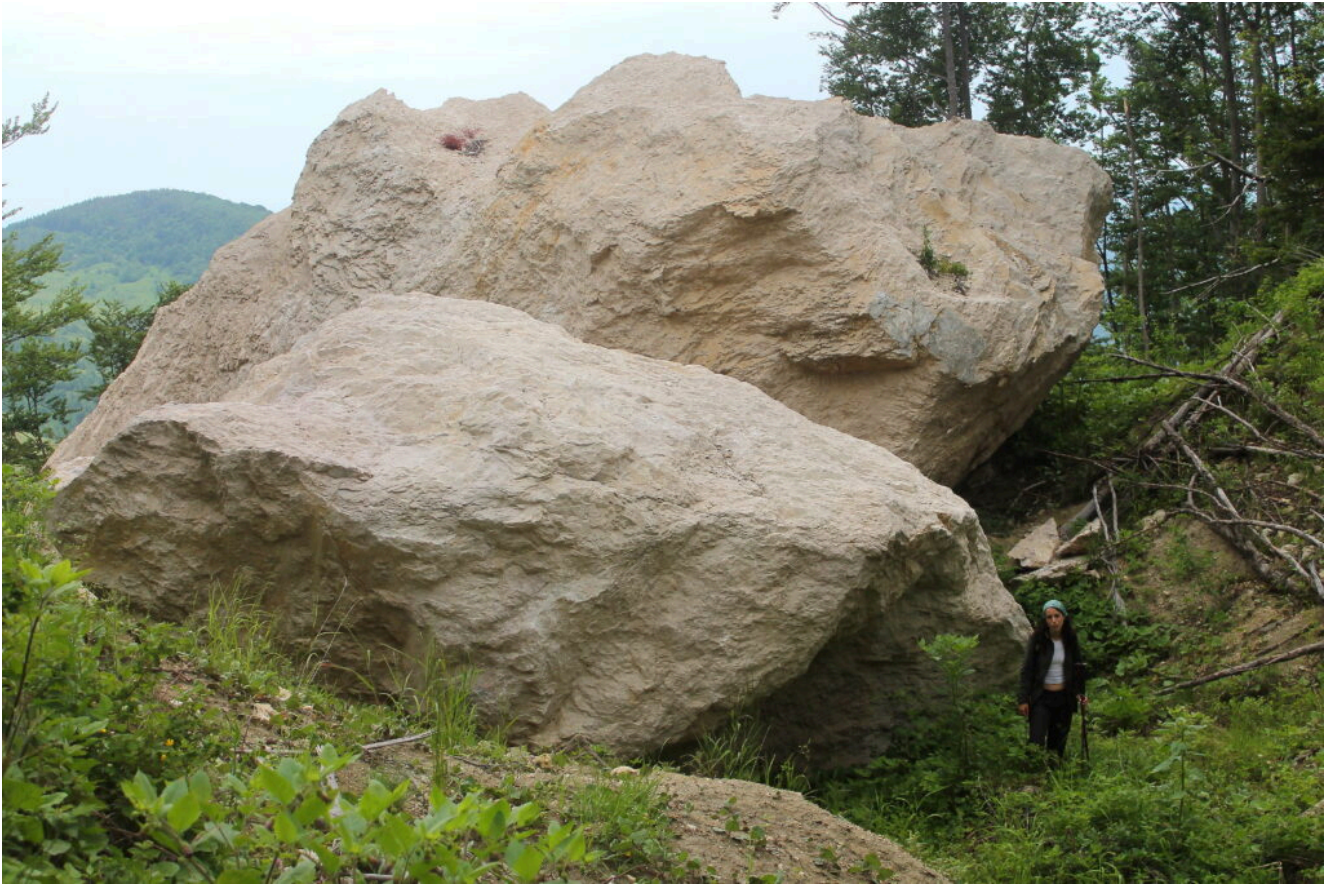
8- Lato Ovest