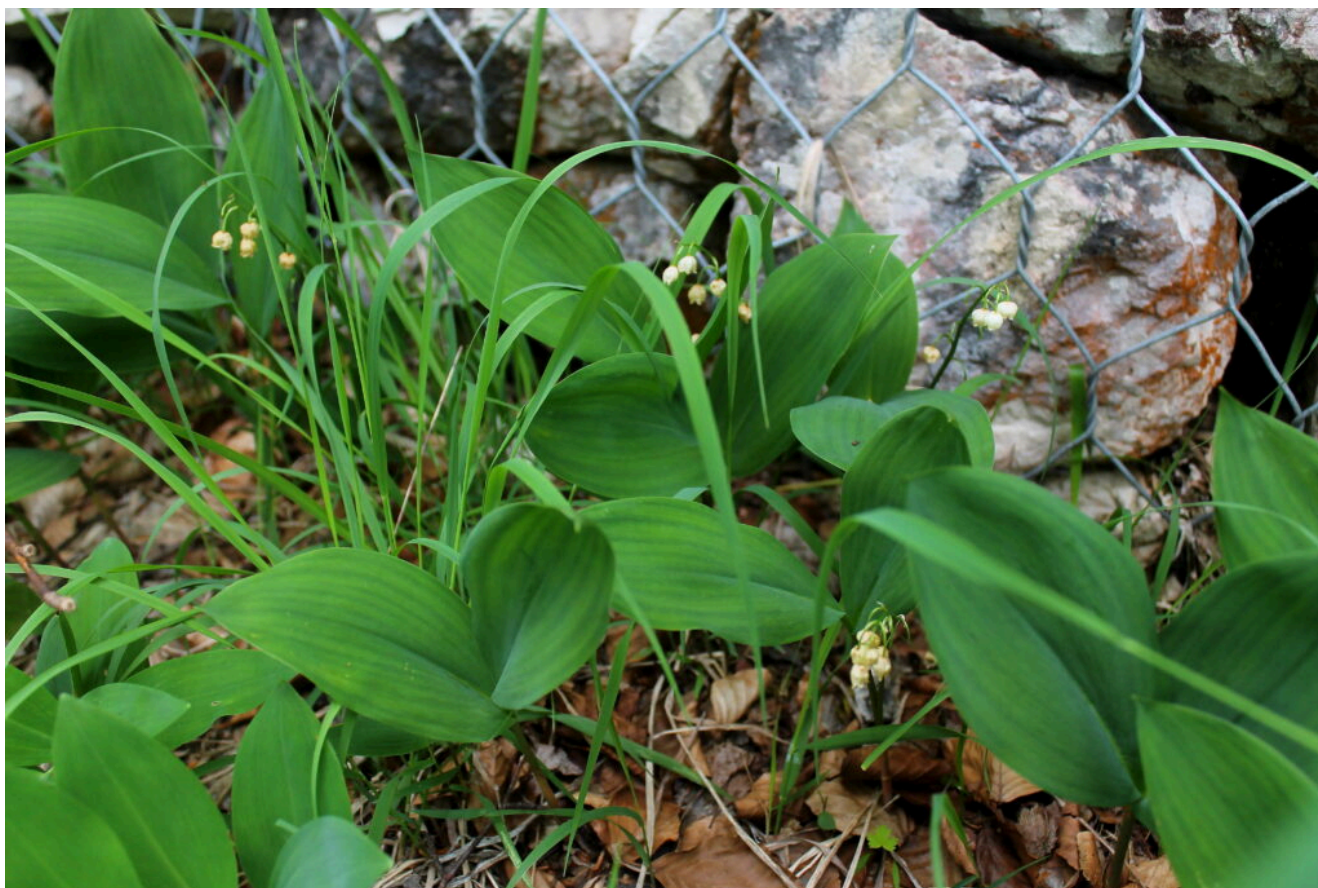
19- La rara Convallaria majalis (Mughetto).