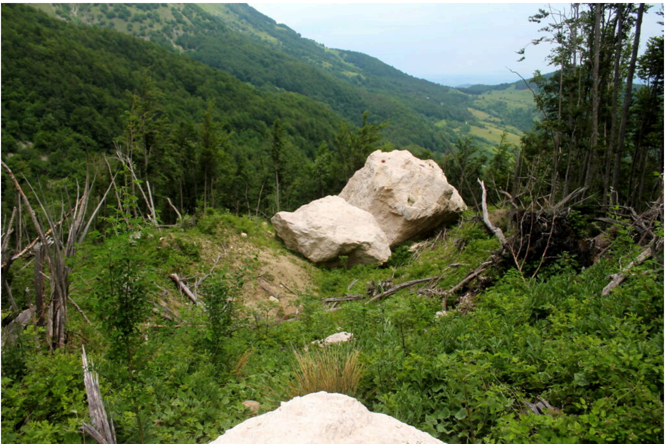
11- I massi ed il cratere.