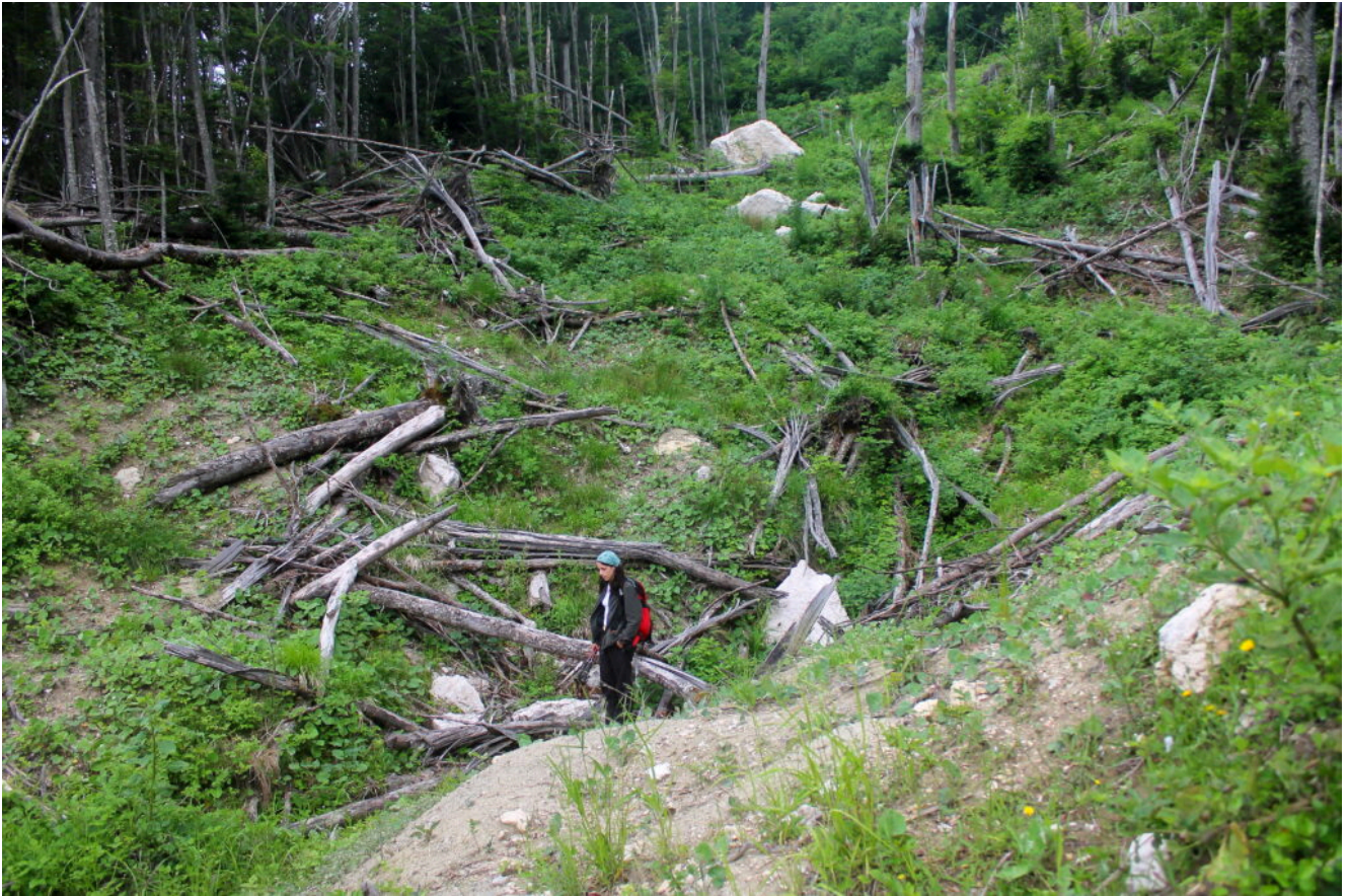
10- Il cratere che hanno formato nel fosso, prima di fermarsi.