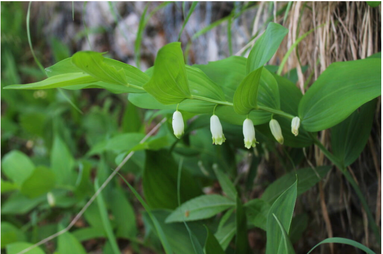
17- Polygonatum odoratum