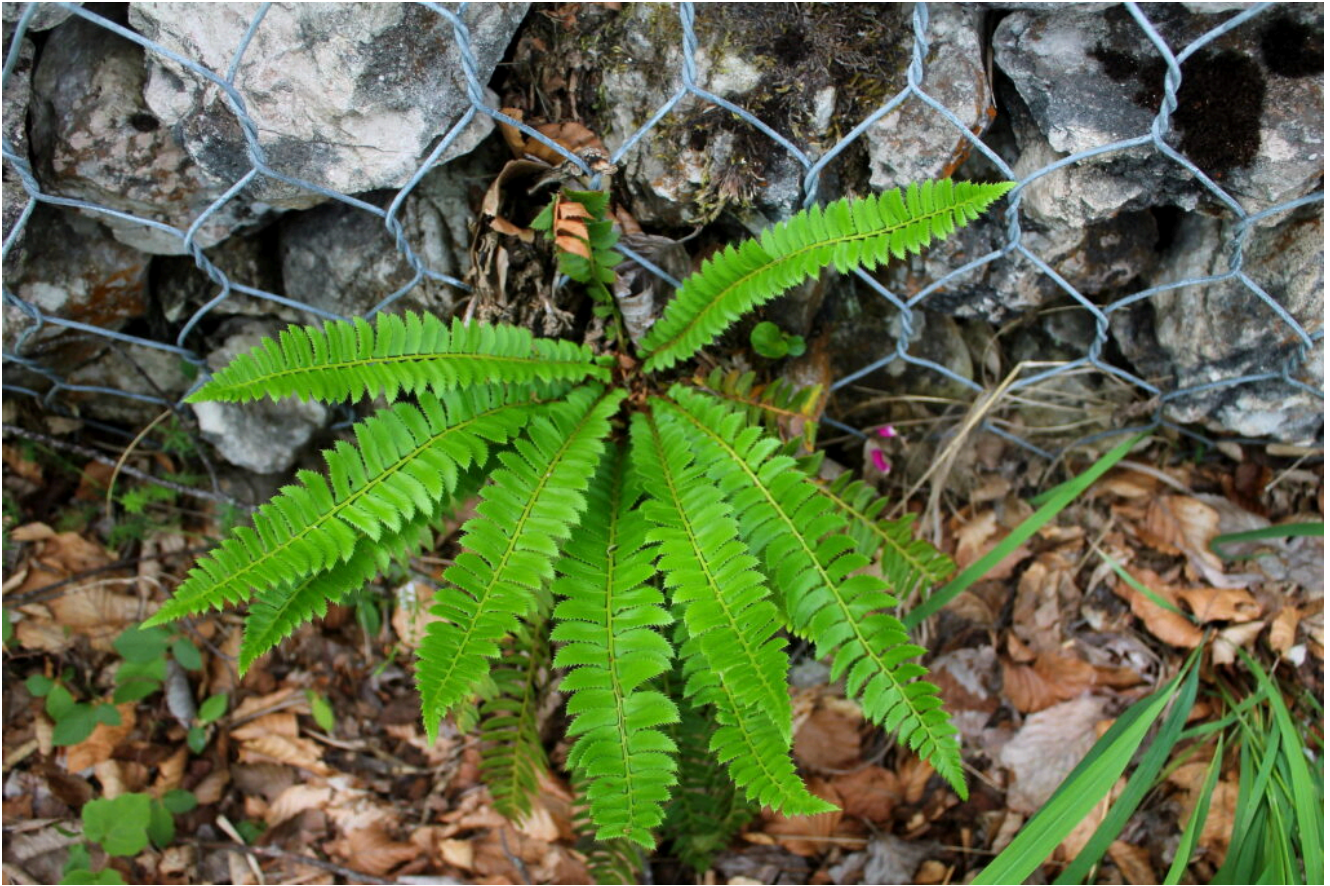
16- La felce Polystichum aculeatum .