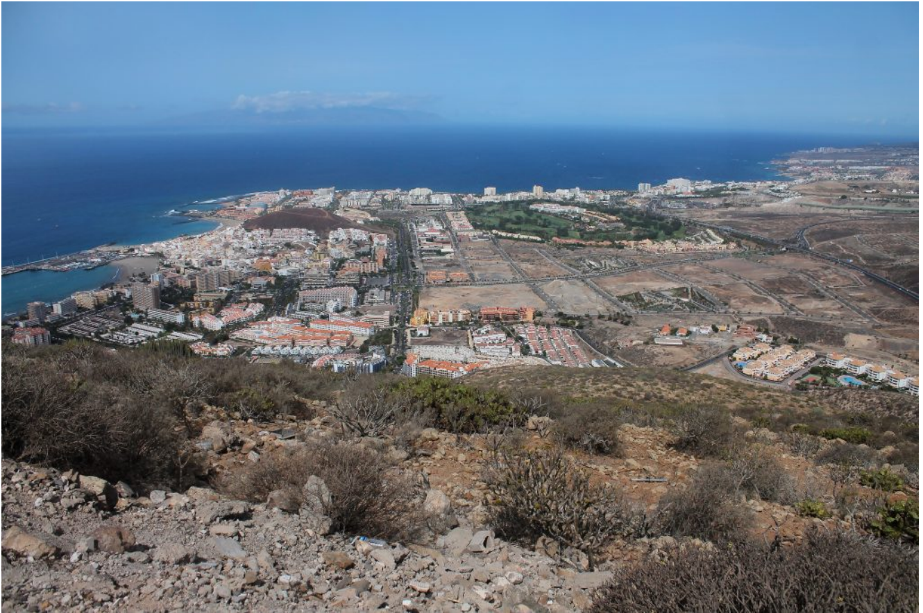
11- La baia di Los Cristianos e di Las Americas visti dalla cima del Morros del Viento, la grande zona verde al centro è il campo del Golf Club Las Americas.