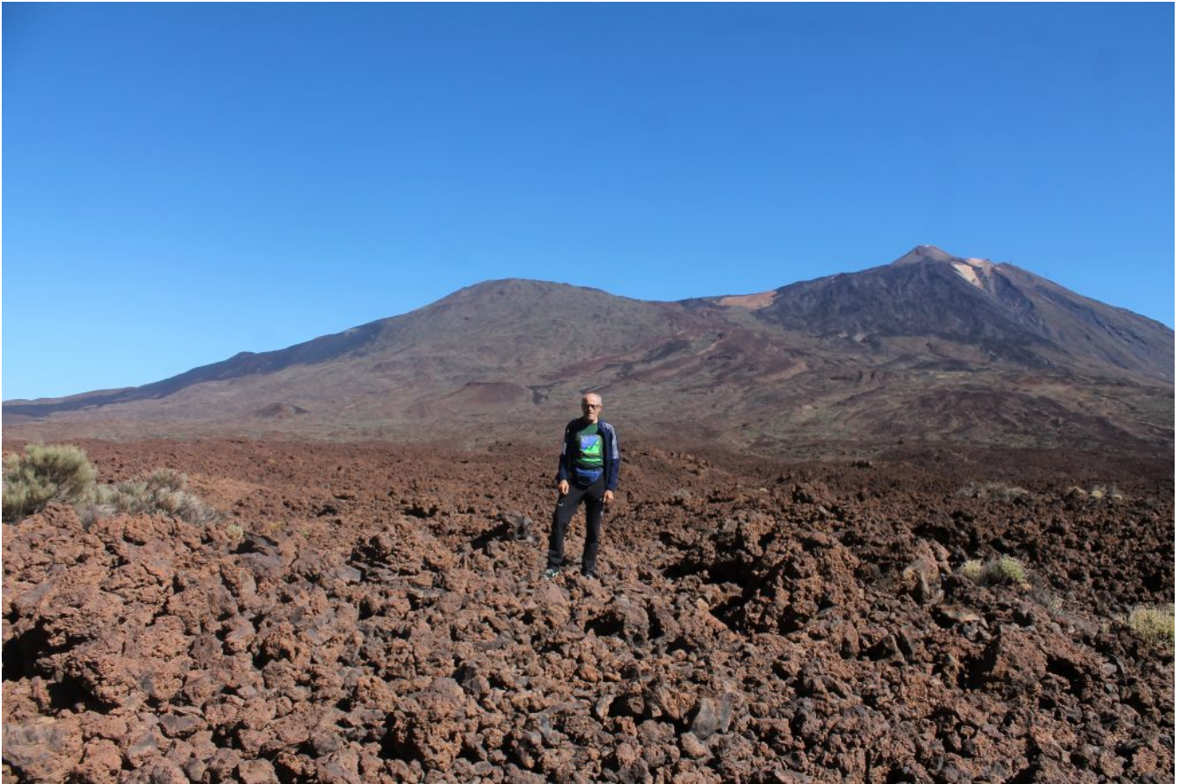
18- Sulle immense colate laviche del Teide con la cima a destra, salita nel 2018 (vedasi articolo)