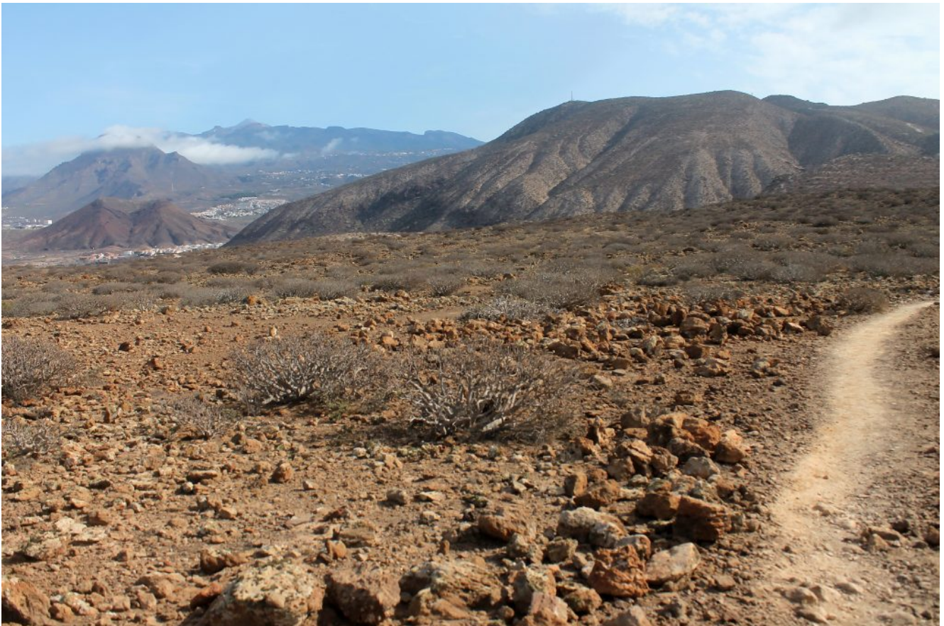
9- La piattaforma lavica prima della cima del Morros del viento, a sinistra il Roque del Conde immerso dalla nebbia e