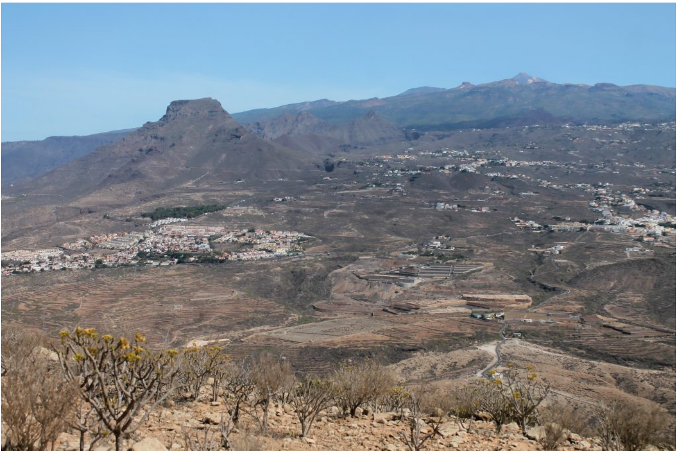
12- 13- Veduta dal Morros del Viento verso la Roque del Conde