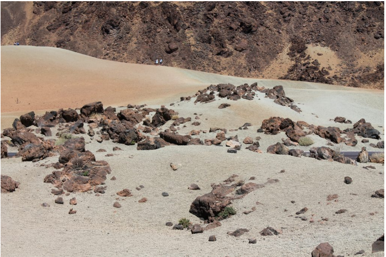
19- Le desertiche distese di pietra pomice, capace di galleggiare sull'acqua, alla Montana Blanca, sotto alla cima