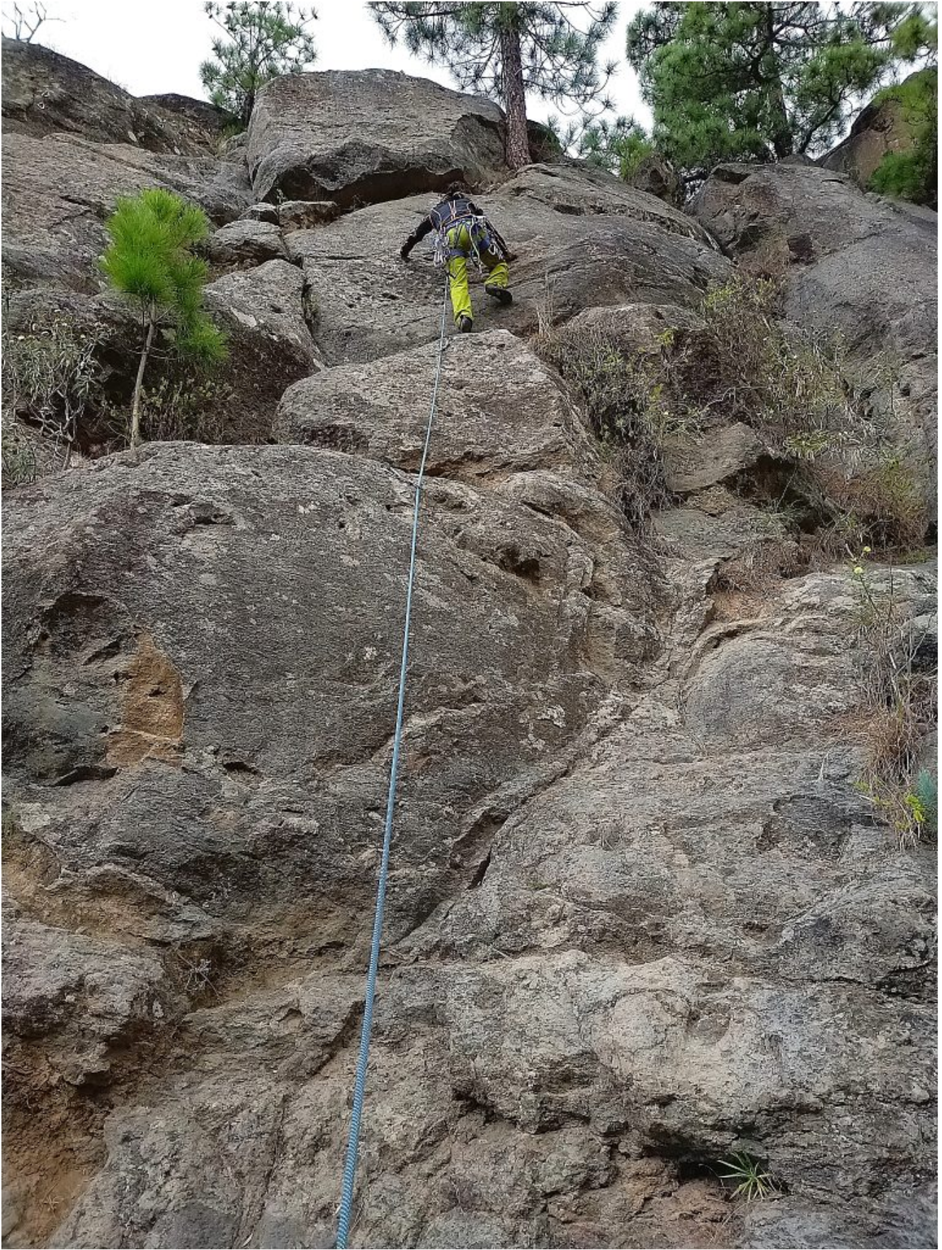
2- 3 – 4- 5 -6- 7-Arrampicata sul basalto della palestra del Barranco de Arico, vie dal 6C in su.