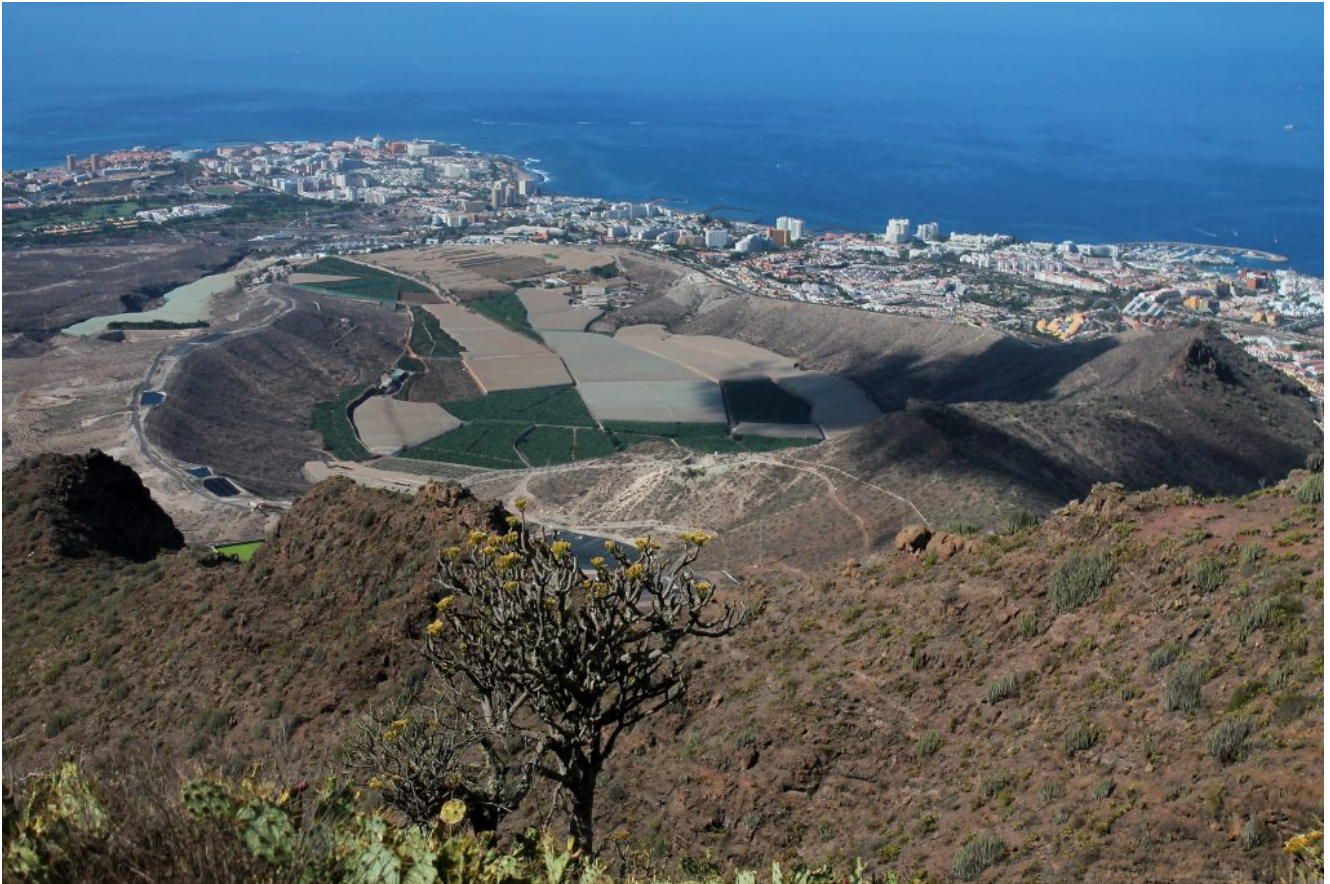
31- Veduta dalla cima della Roque del Conde verso Las Americas, ai piedi la Caldera del Rey coltivata a bananeti e la cresta del Morro Negro a destra.