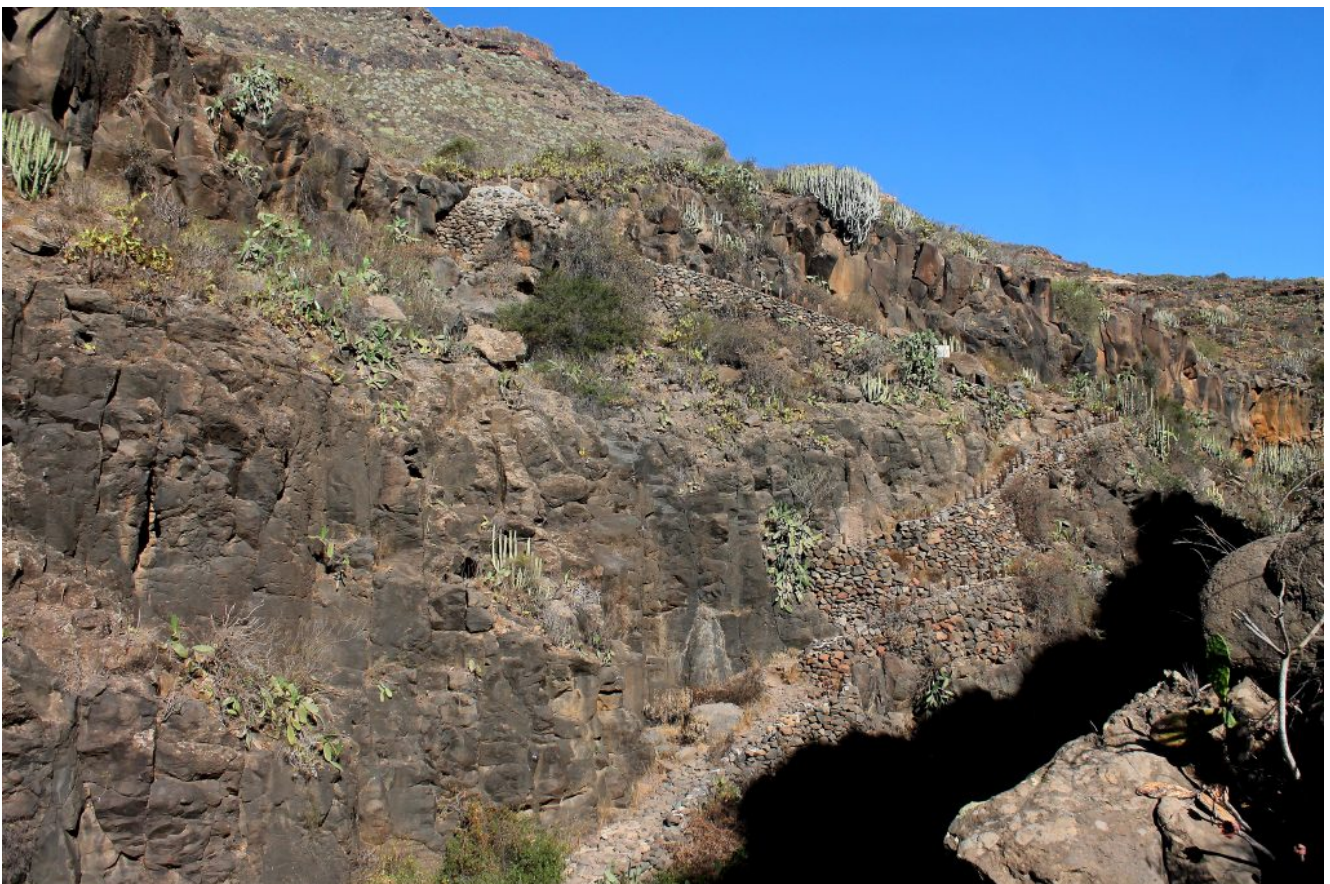
24- Il sentiero di salita si snoda con ripidi tornanti di