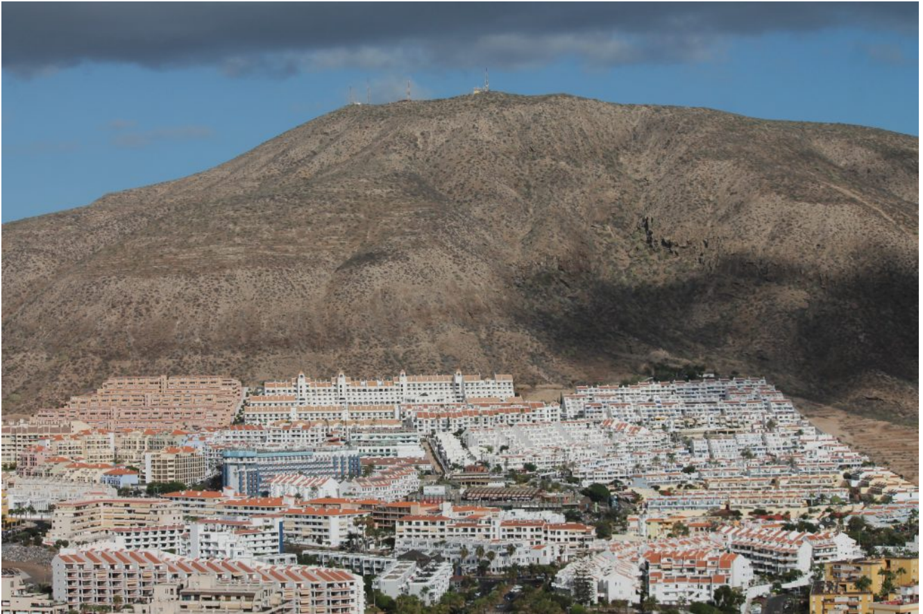
8- La cima del vulcano Morros del Viento sovrasta i residence turistici di Los Cristianos.