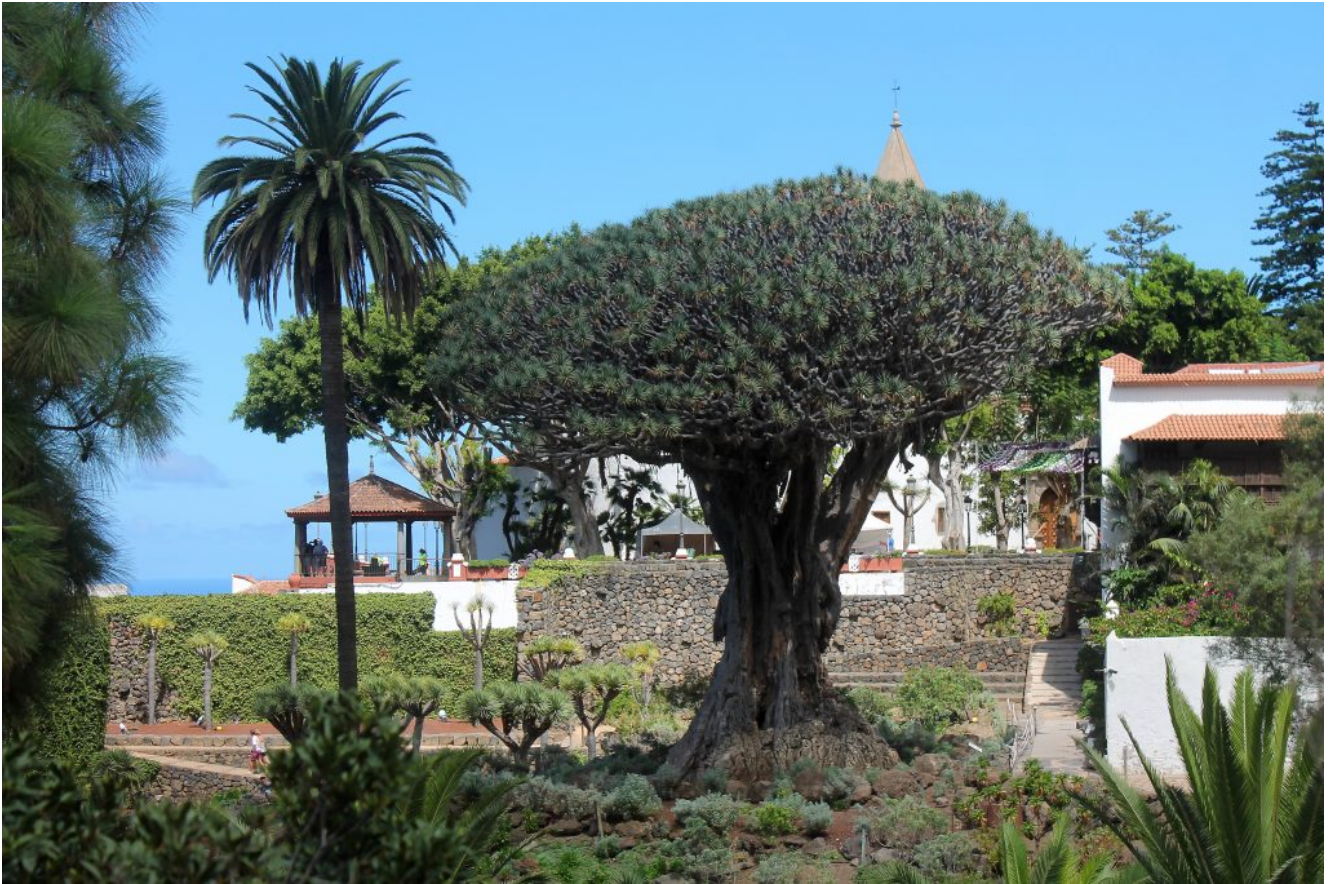
21- Osservare le dimensioni della pianta con la persona al fianco sinistro della palma