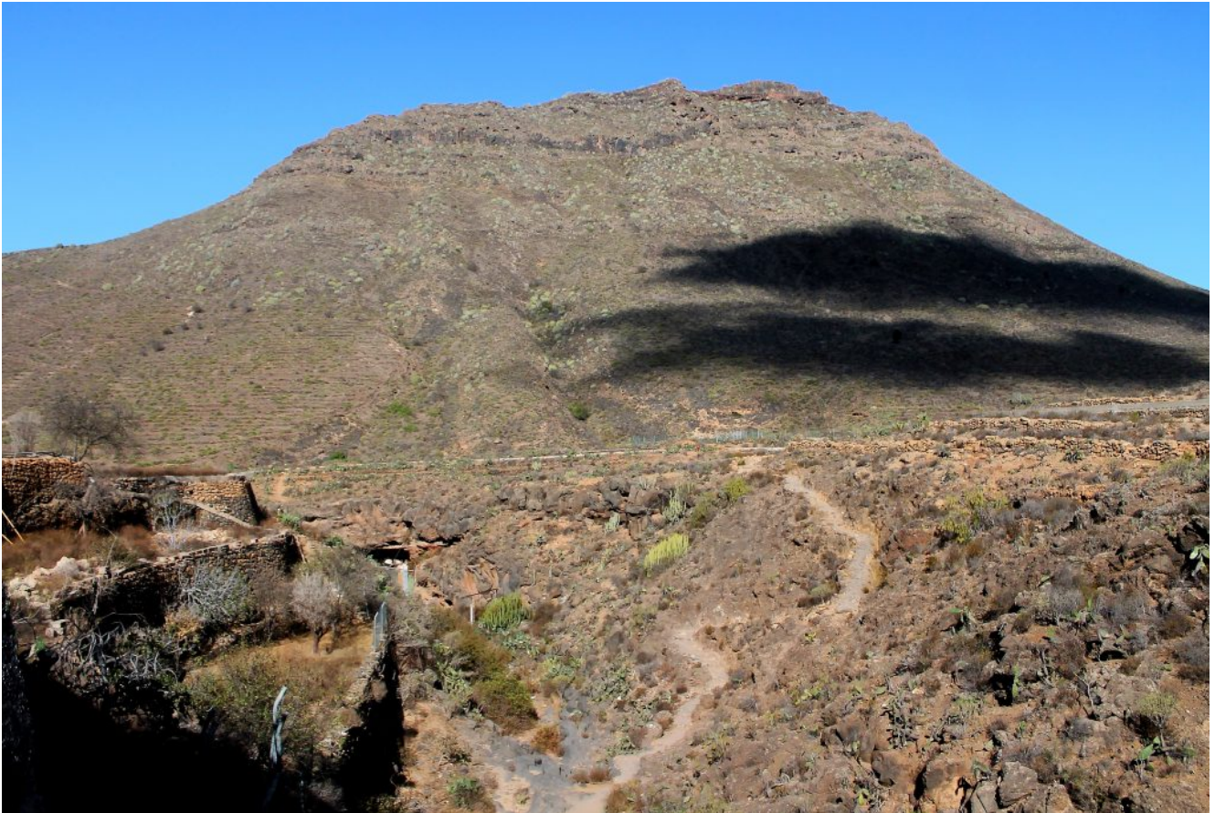
23- La Roque del Conde, una ardita cima vulcanica che si innalza per 1000 metri dalla piana sottostante, salita da solo.