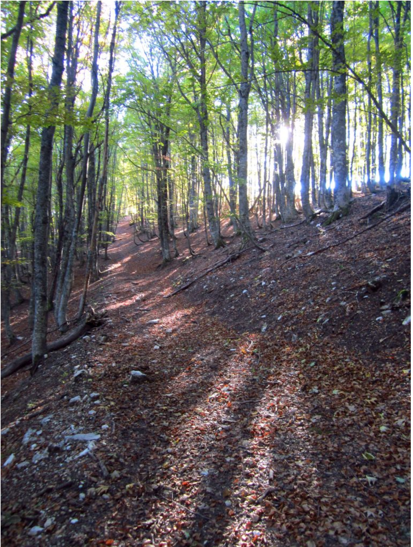
4- Il sentiero nell'ultimo tratto prima della cresta erbosa sopra la Frondosa.