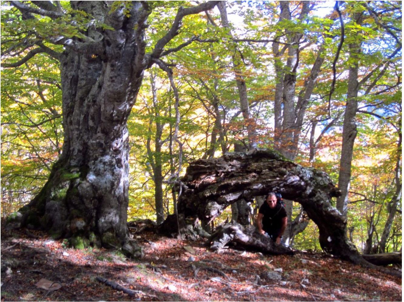
10- Grande faggio nei pressi dello stazzo.