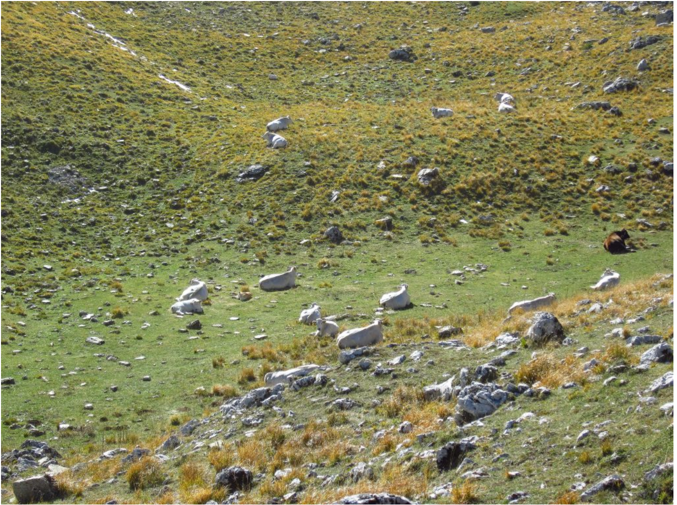
22- Mucche al riposo nei pressi del Laghetto.