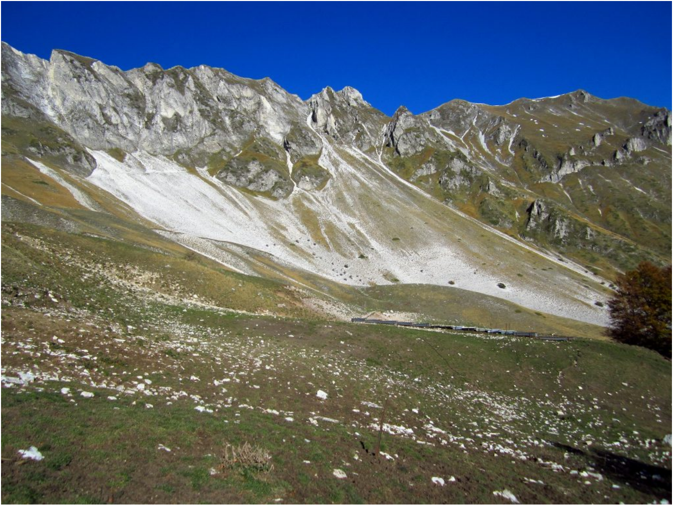
11- La Fonte dell'Acero e la zona del Ramatico sovrastante, nei ghiaioni del versante Est di Cima Vallelunga.