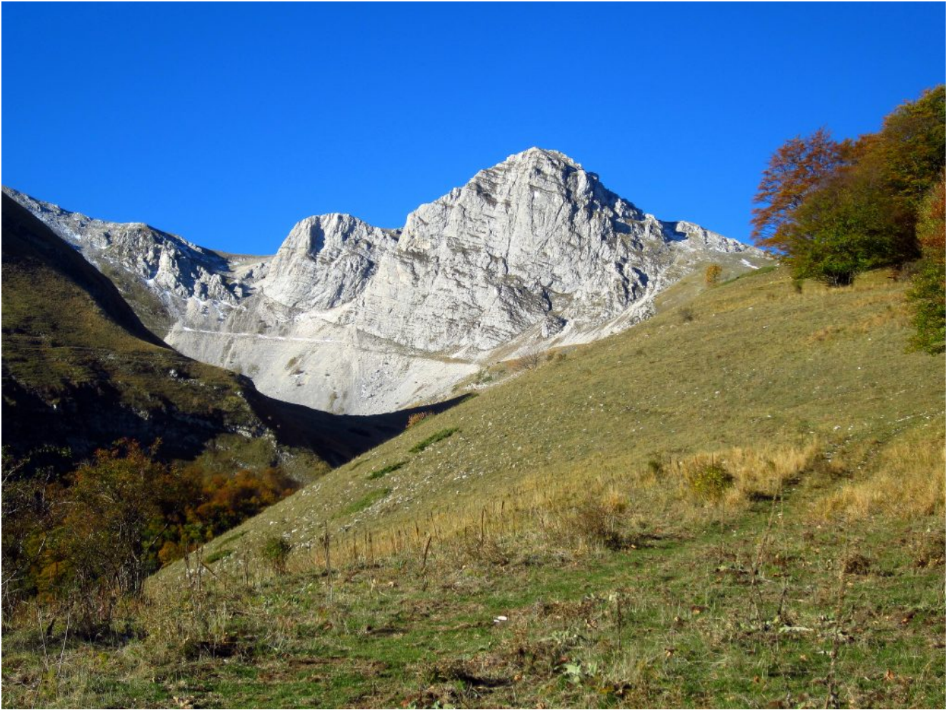
6- Veduta verso Ovest dalla cresta con il Sasso di Palazzo Borghese, il laghetto sottostante e la zona del Canale a sinistra.