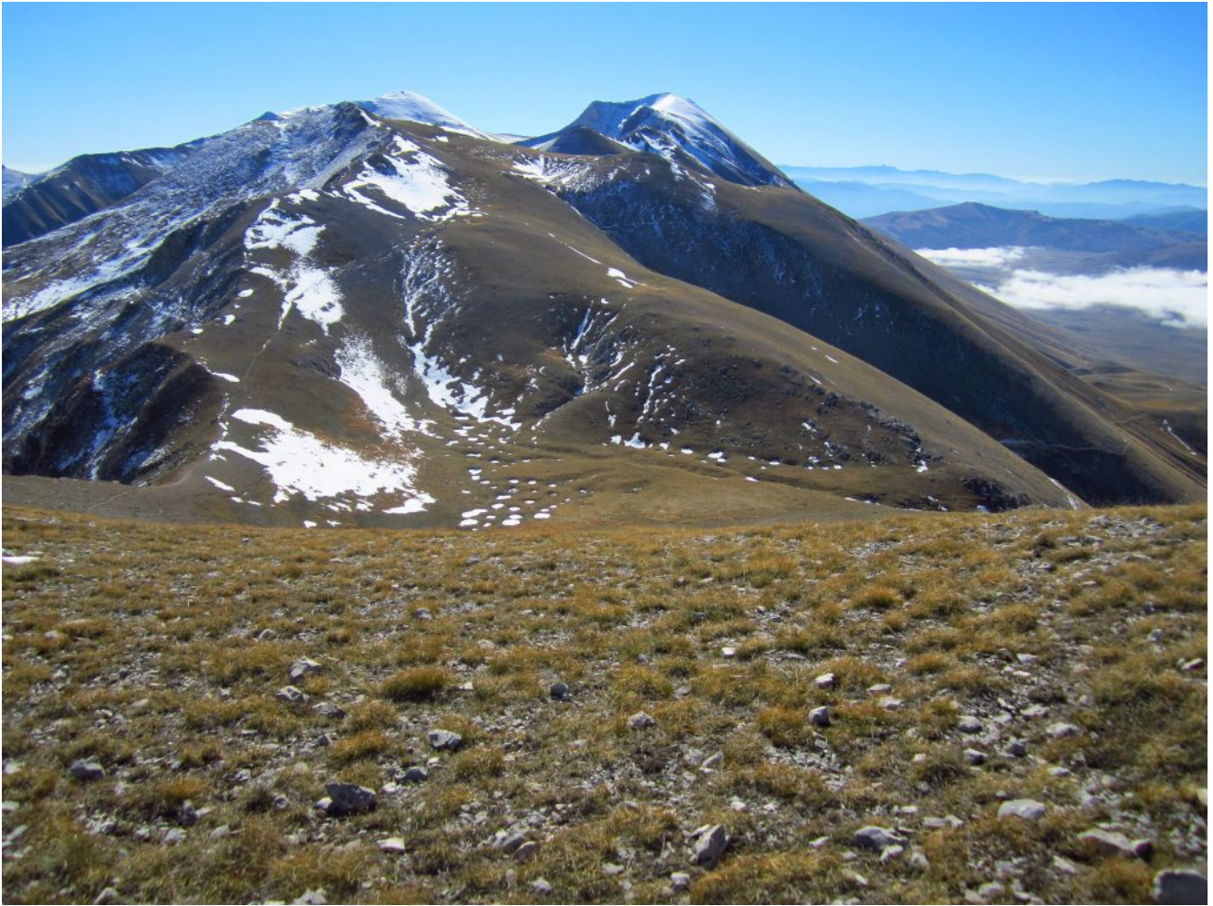
19- Il gruppo Sud dei Monti Sibillini con il M. Argentella in primo piano , il M.Vettore a sinistra e la Cima del Redentore a destra.