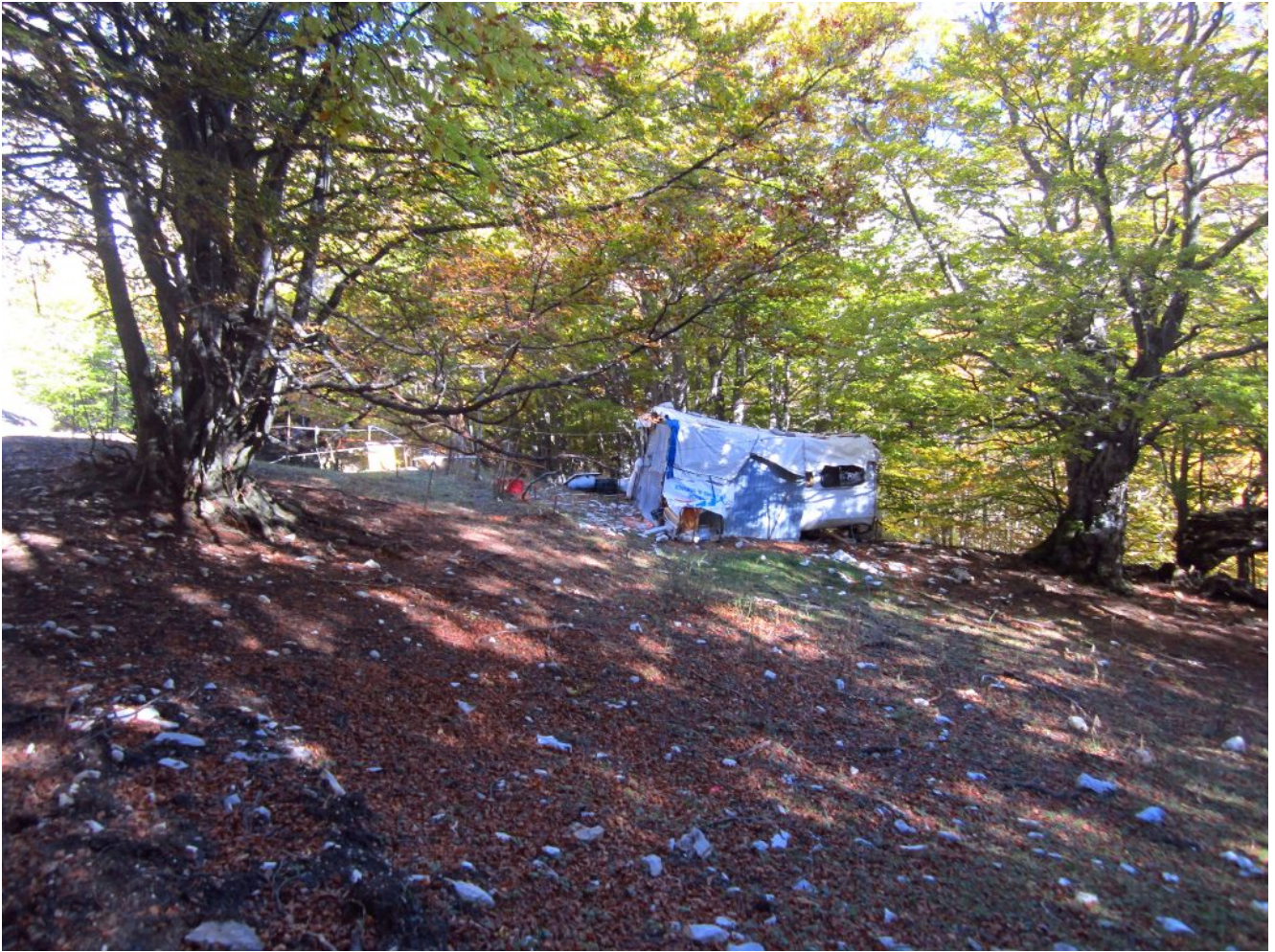
9- Lo stazzo e la sporcizia nei pressi della Fonte dell'Acero.