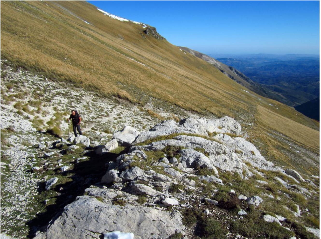
13- Il sentiero che da Fonte dell'Acero prosegue nella zona denominata "I Pianetti" sul versante Est del M. Porche