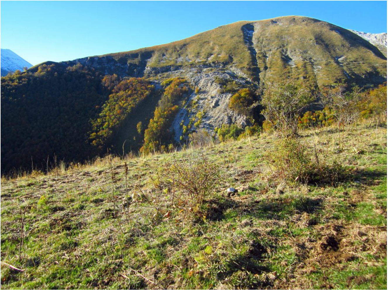
7- La cresta dei Tre Faggi sovrasta il Canale sottostante.