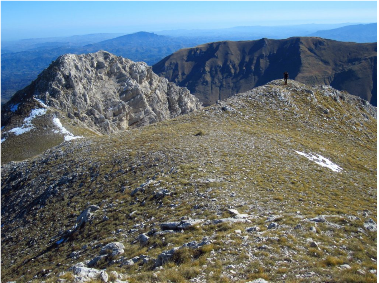
20-Il Sasso di Palazzo Borghese e il M. Banditello e la Cima delle Prata a a destra.