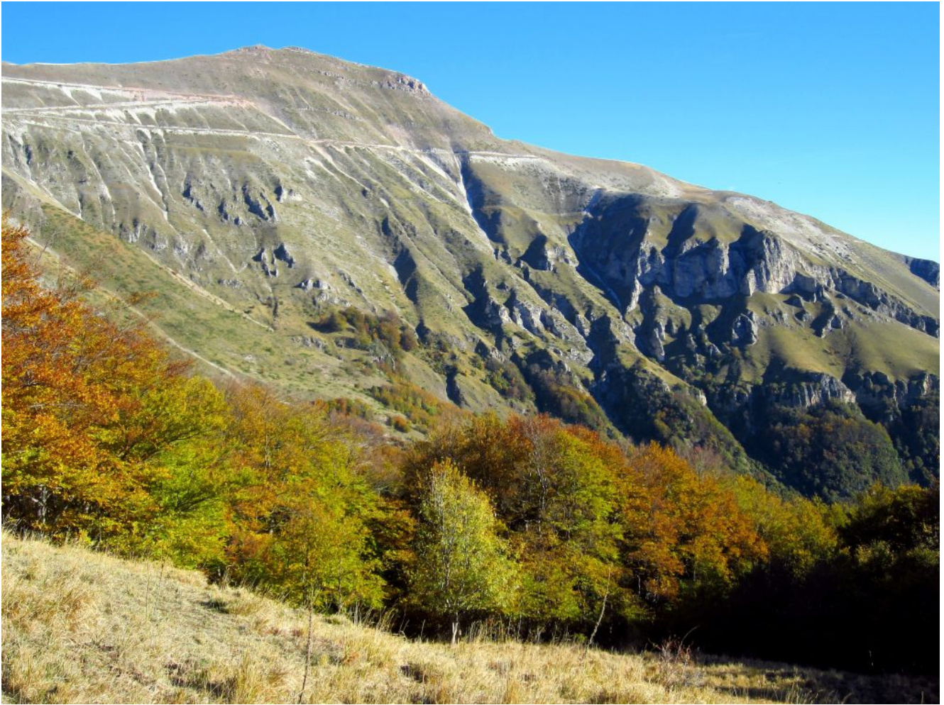
5- La cresta erbosa sopra al bosco con il Monte Sibilla di fronte.