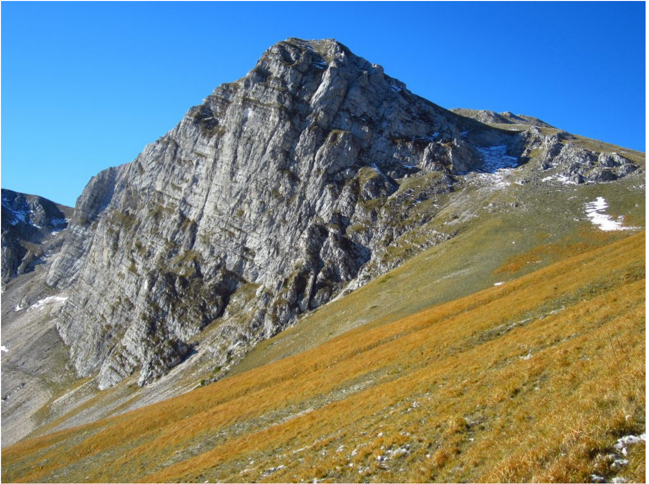
15 – 16- Zoom sulla parete Est e Nord, in ombra, del Sasso di Palazzo Borghese