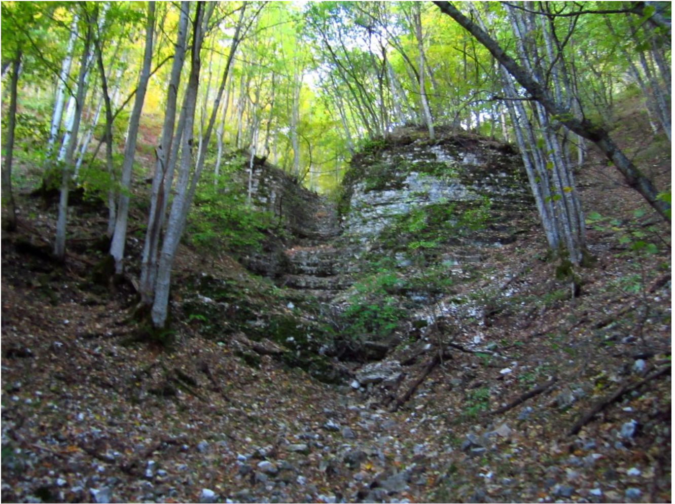
1- Il colatoio roccioso posto nel bosco alla base del Fosso Zappacenero dove inizia la salita.