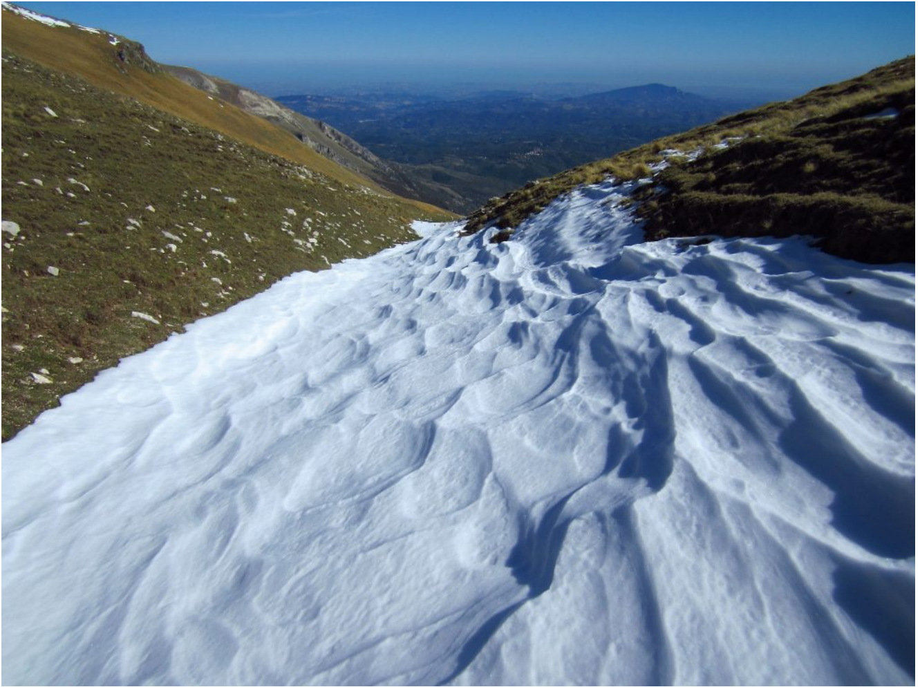
21- Discesa veloce su neve verso il Laghetto.