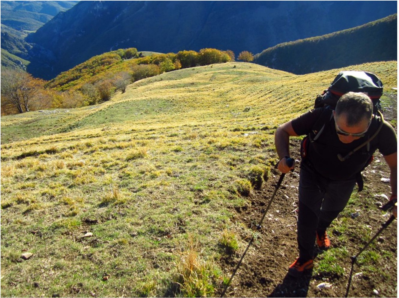
8- La ripida cresta erbosa, in salita verso la Fonte dell'Acero, a sinistra il Fosso Zappacenere, a destra il Canale.