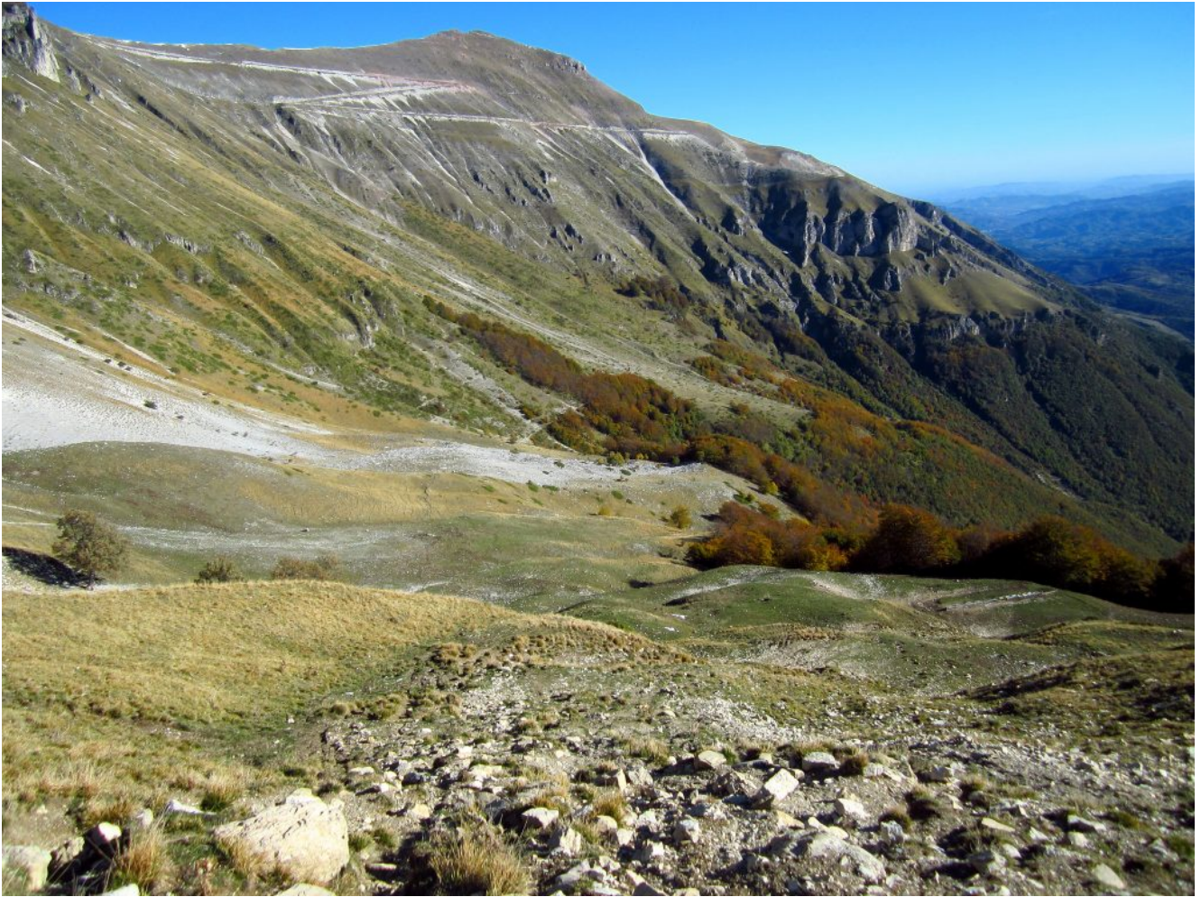
12- Sempre in salita prima del cambio di versante con il M. Sibilla sullo sfondo.