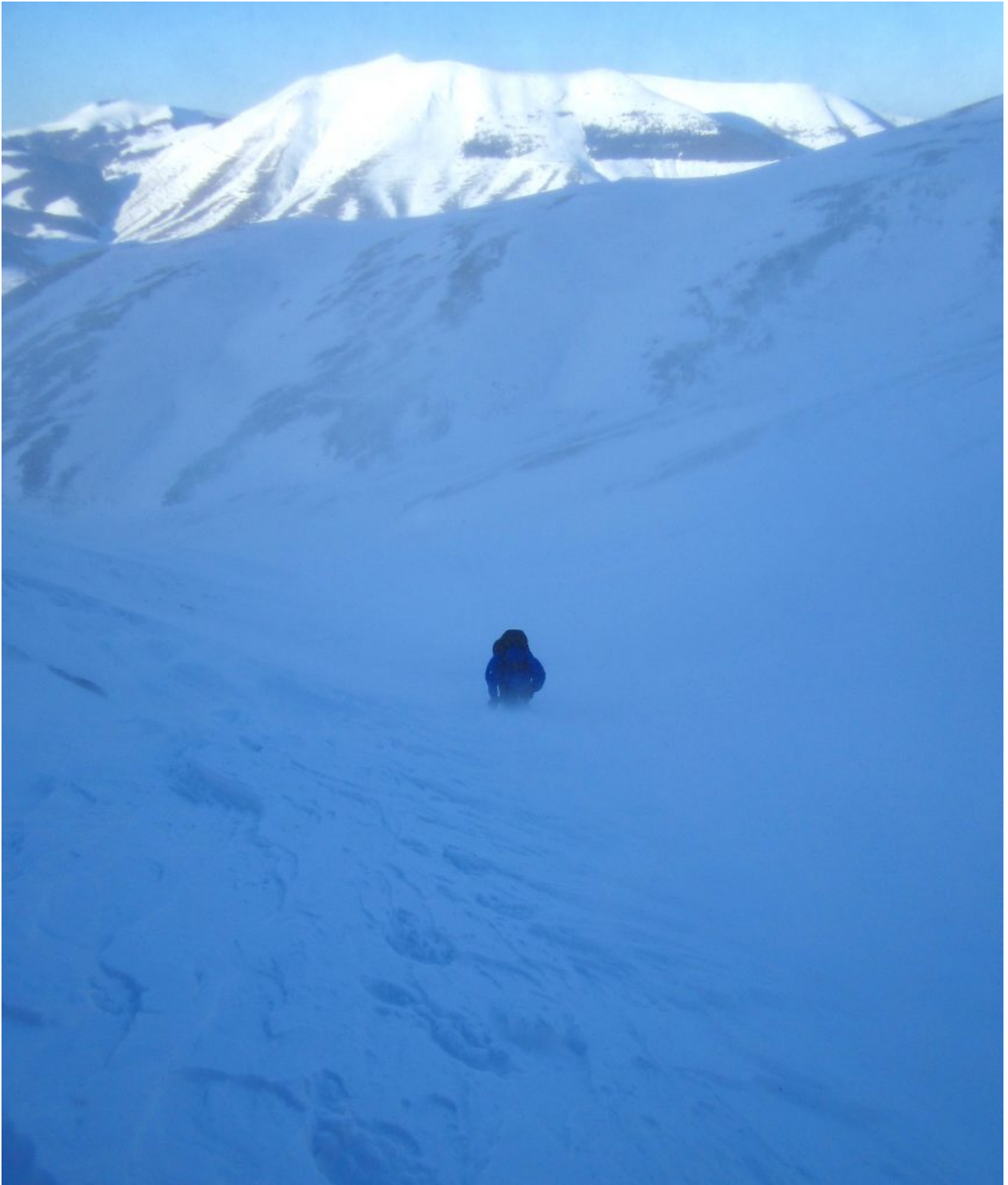
2 – 7- Salita verso Forca Viola per il canale Ovest, momenti di fortissimo vento che ogni tanto ci obbligava a coricarci.