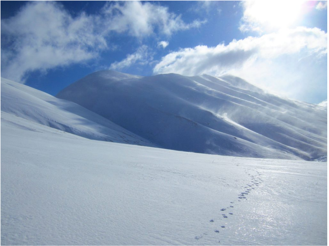
12- La cresta dalla Cima di Forca Viola alla Cima del Redentore vista da Monte Abuzzago.