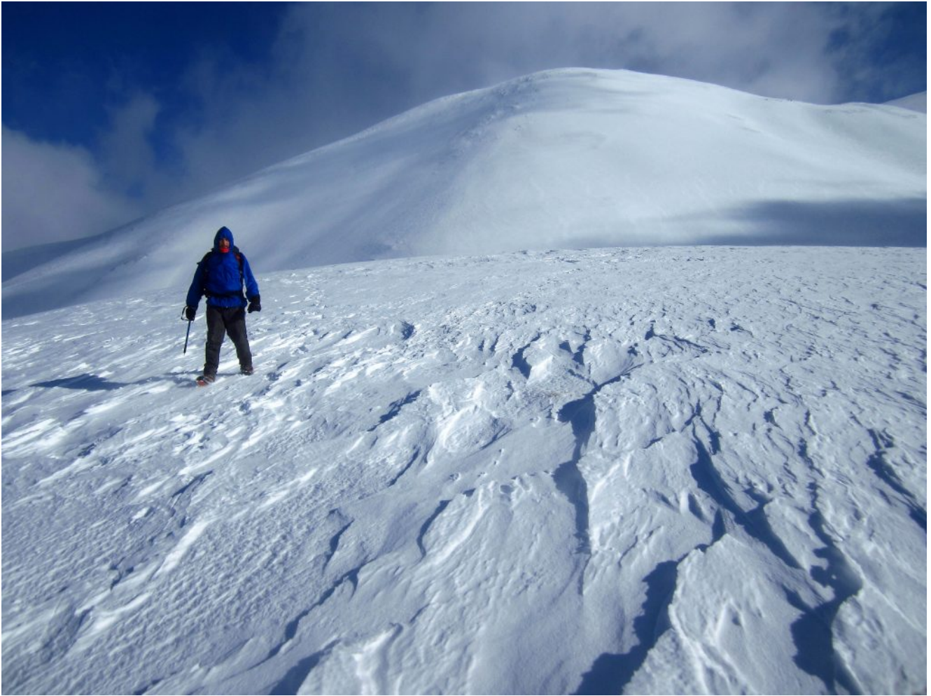
13- Sulla cima del Monte Abuzzago con il Monte Argentella alle spalle.