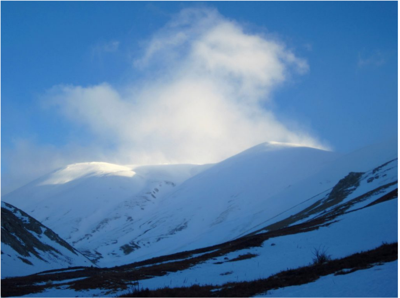
1- Il Monte Argentella dalla Valle delle Fonti.