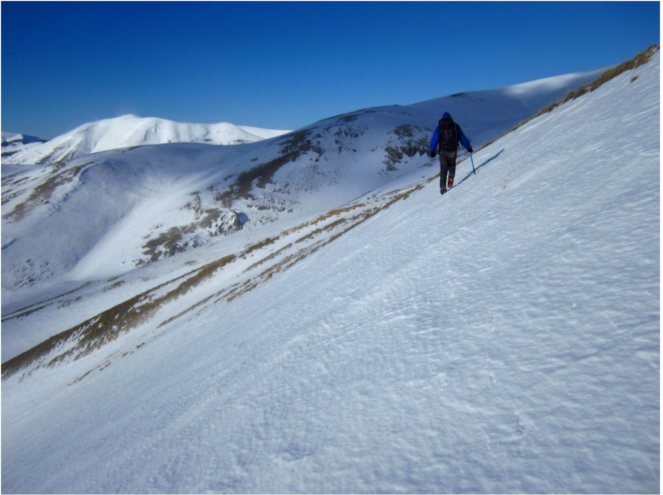
9- Traversata dal canale ovest di Forca Viola verso i canali gemelli.