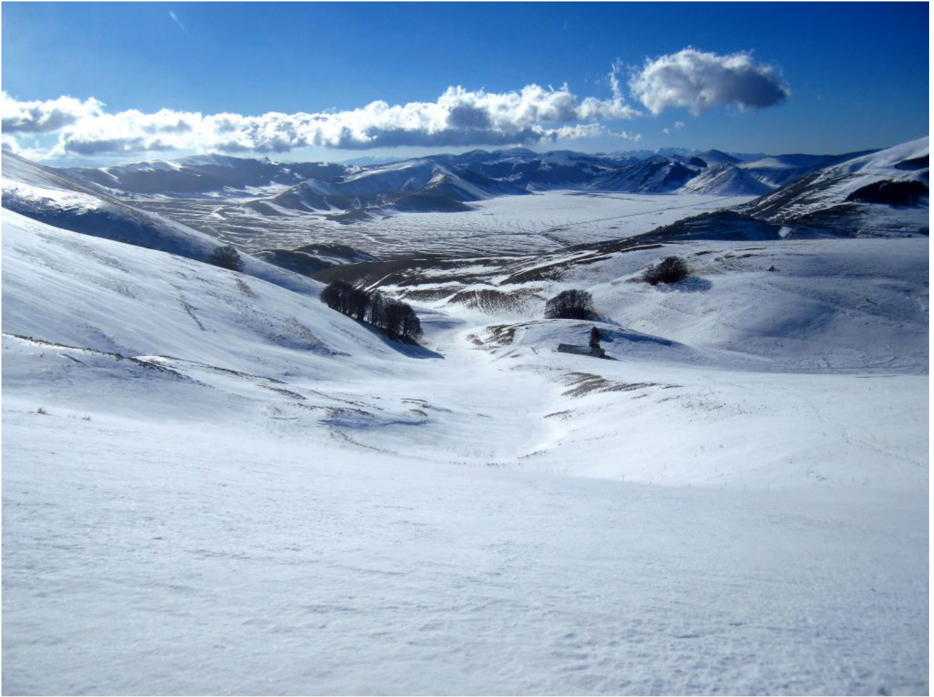
14- Discesa verso la Capanna Ghezzi.