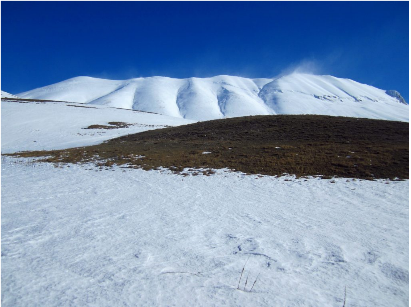
15- La Cresta della Cima del Redentore con alti pennacchi di neve alzata dal vento.