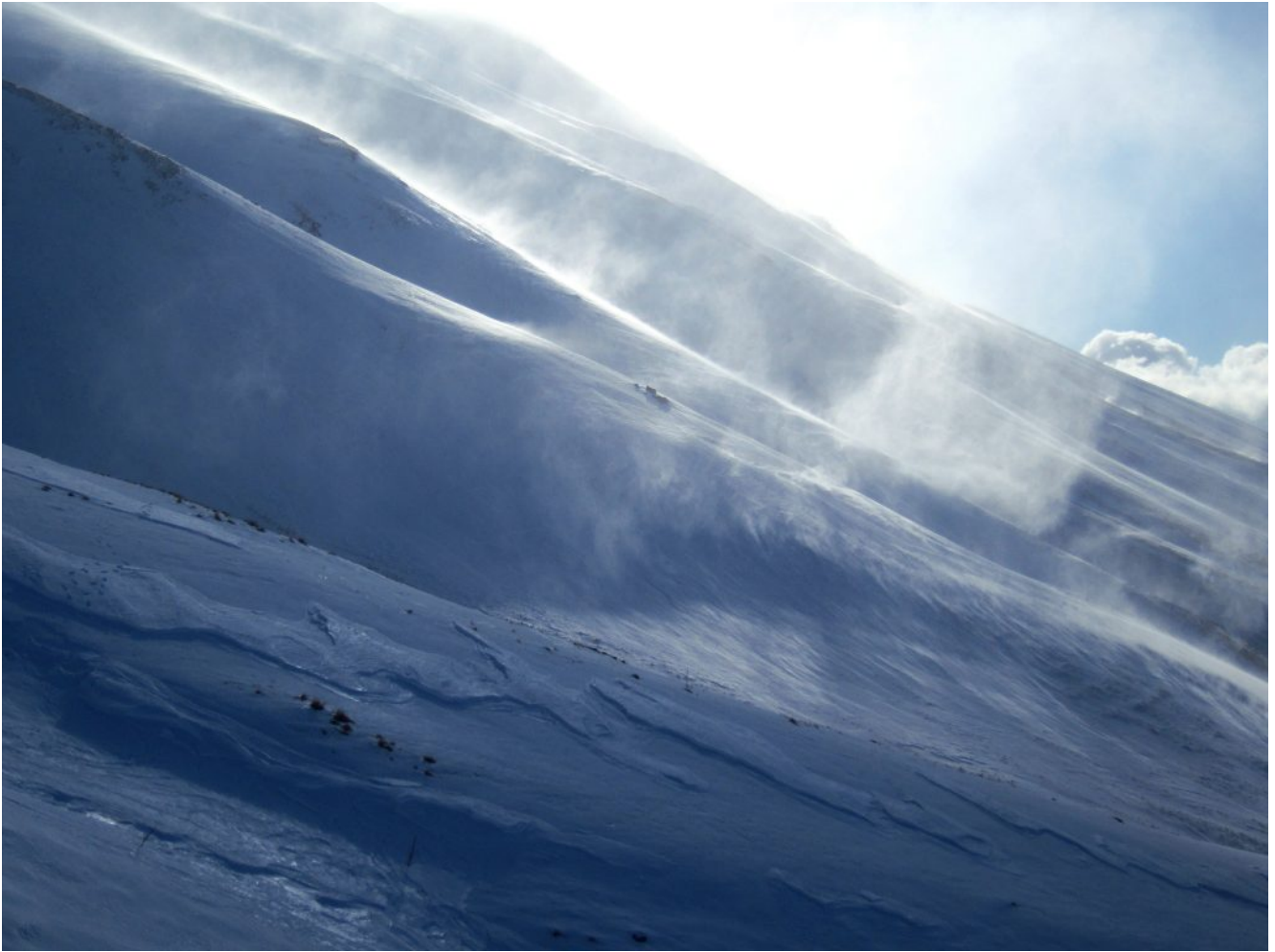
11- Tubini di neve alzata dal forte vento.