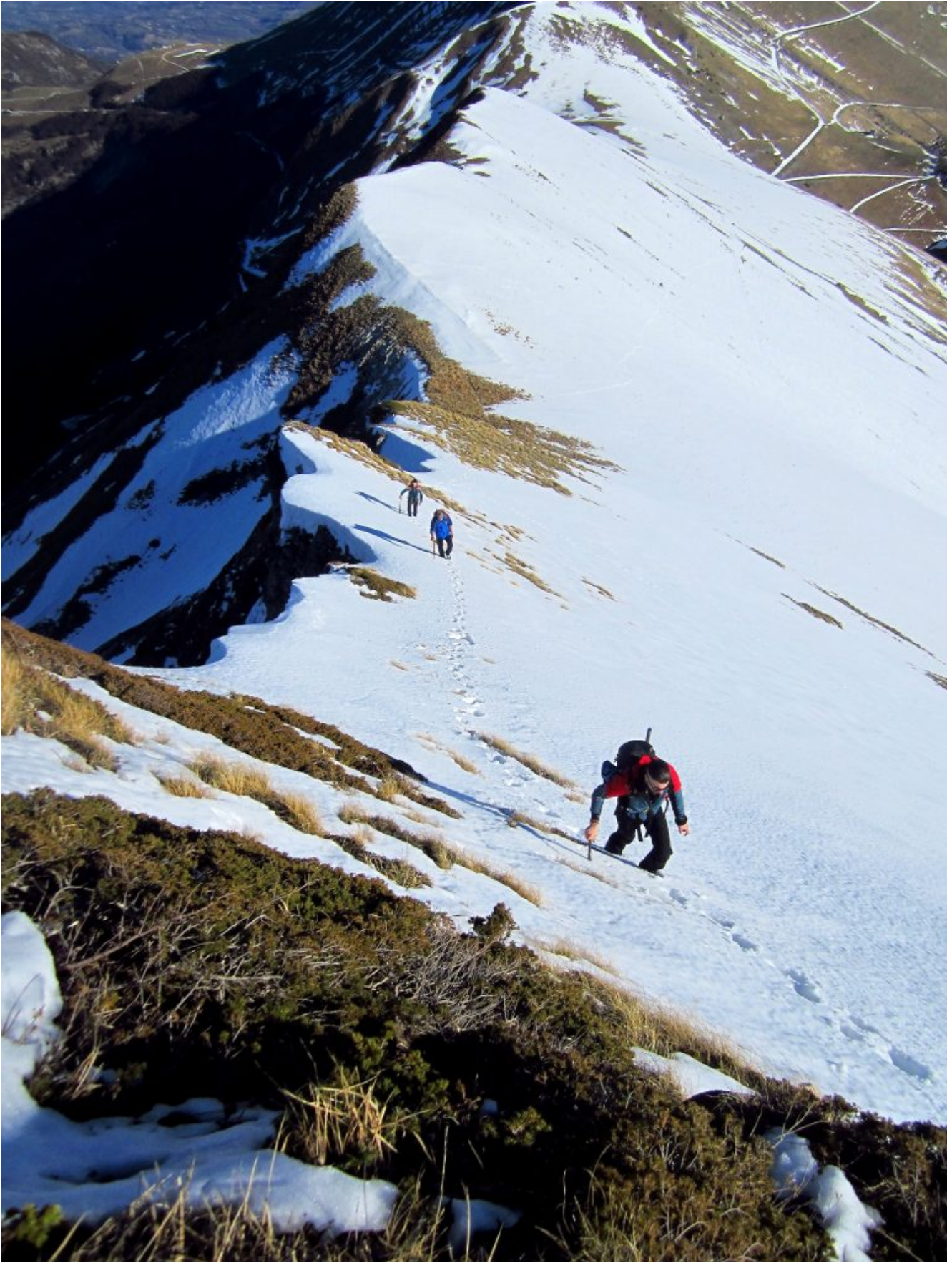
10- 14- Sulla cresta Nord-est del Monte Acuto.