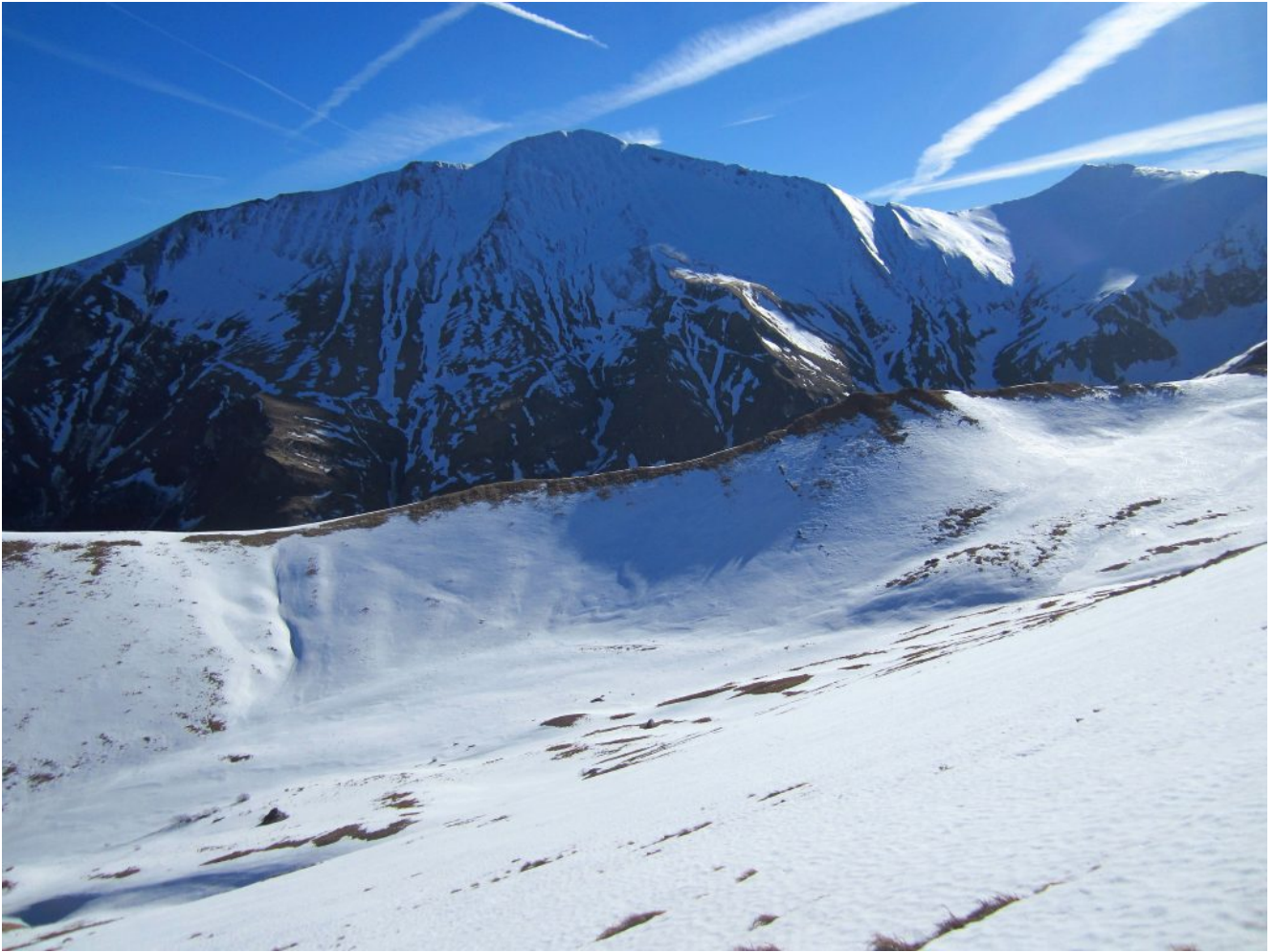
15- Il versante Nord del Pizzo Regina. e del Pizzo Berro a destra