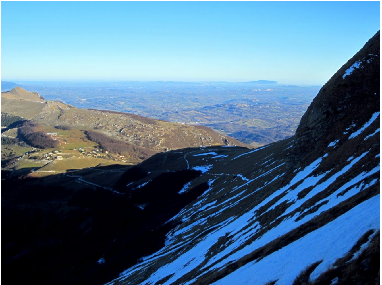
5- La Pintura di Bolognola da dove siamo partiti e, sullo sfondo, il Monte Conero.