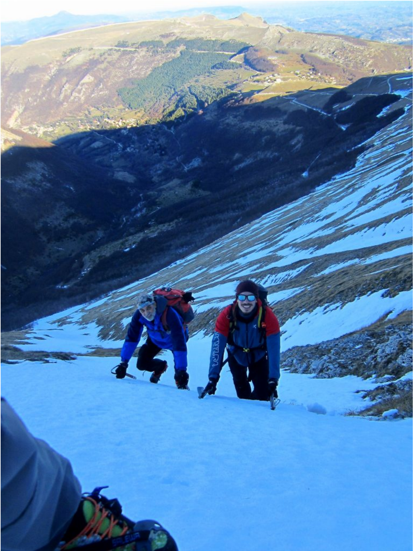
6- L'uscita del canale