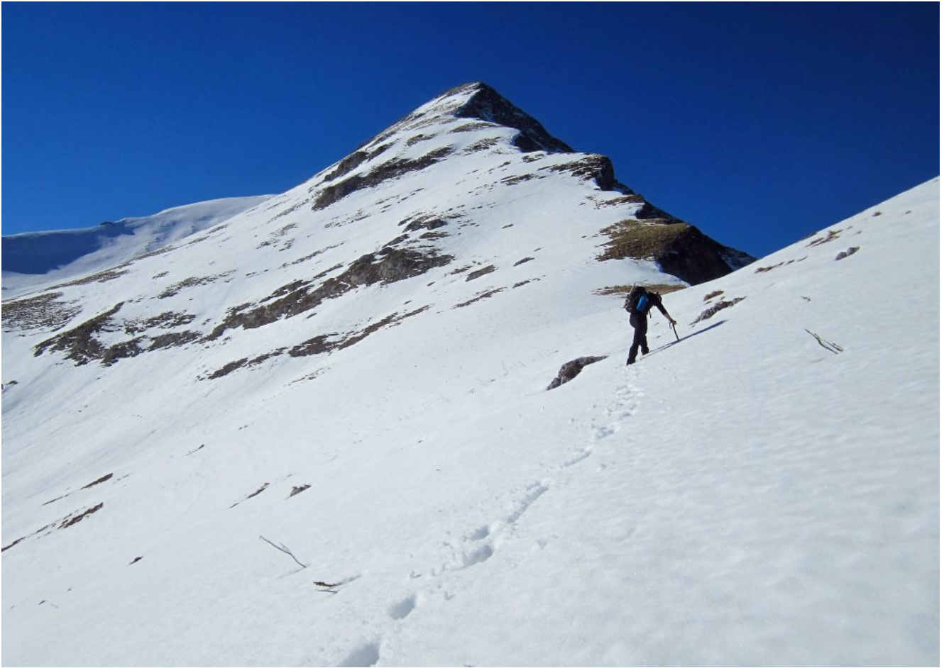
9- La salita verso la cresta Nord-est del Monte Acuto con il suo profilo umano.