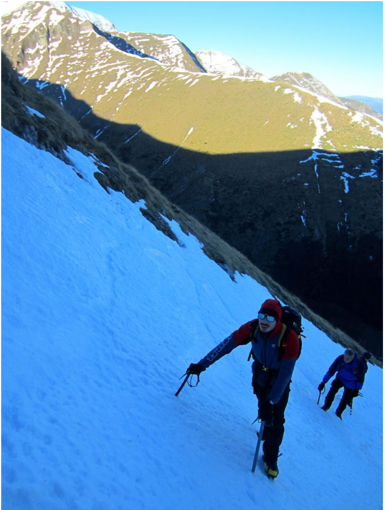
3 – 4- Il tratto finale del canale, più ripido.