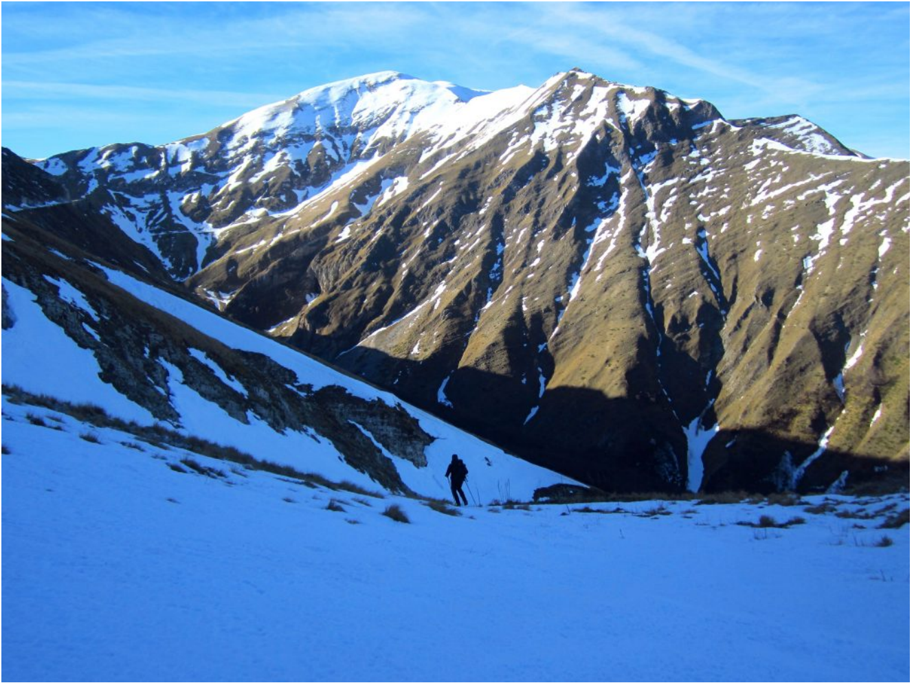
16- Il versante Sud del Monte Rotondo nella vallata del Fargno.