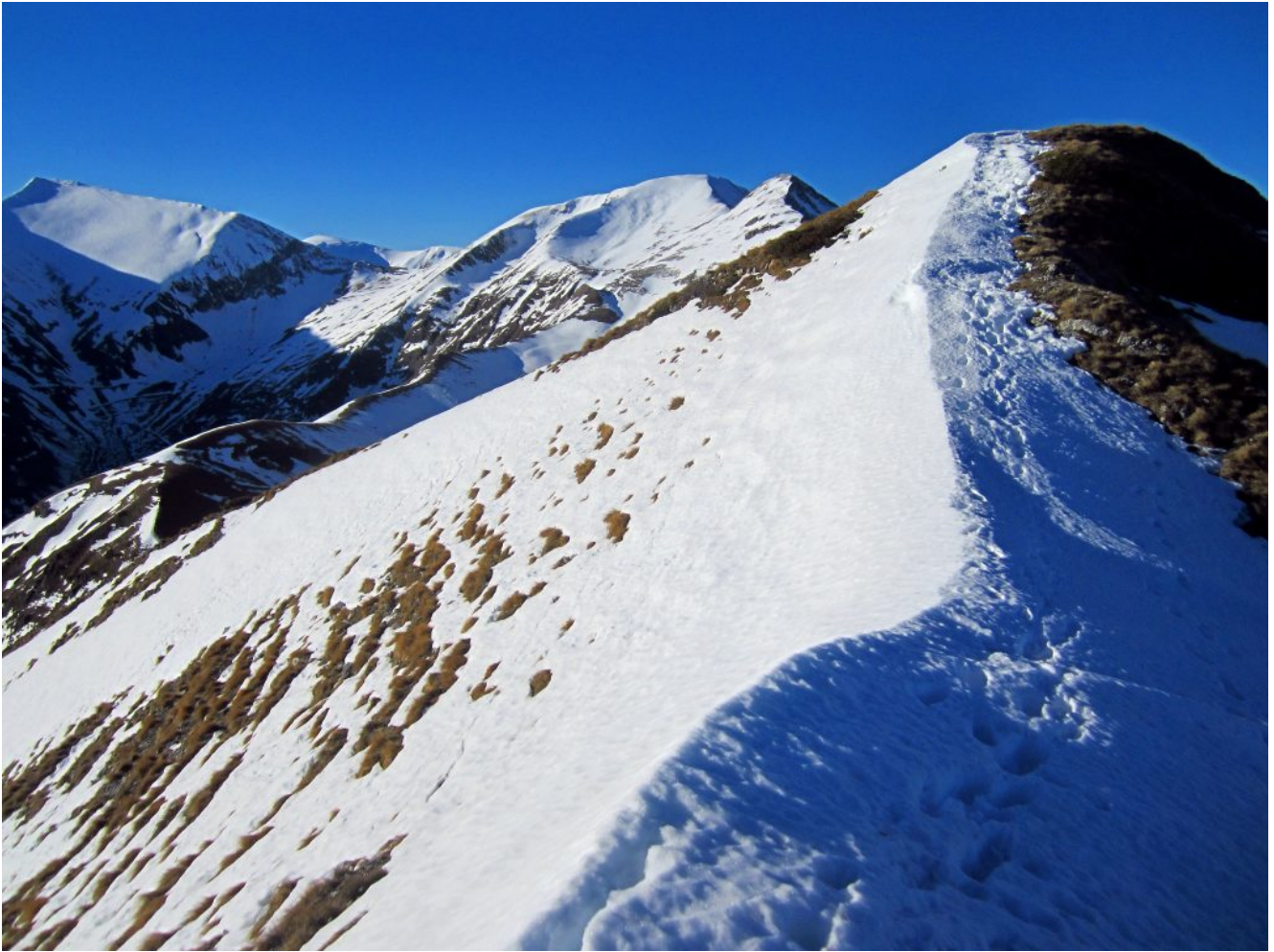
7- 8- La cresta che scende dal Monte Castel Manardo verso Forcella Bassete.