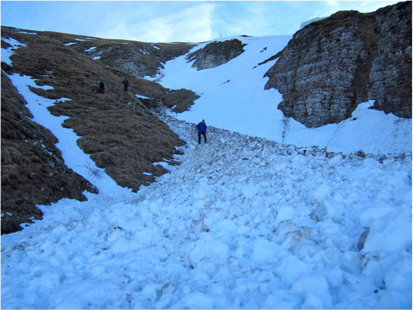
17- Slavina a Fonte Bassete caduta dopo un repentino innalzamento delle temperature di alcuni giorni prima nonostante lo scarso innevamento.