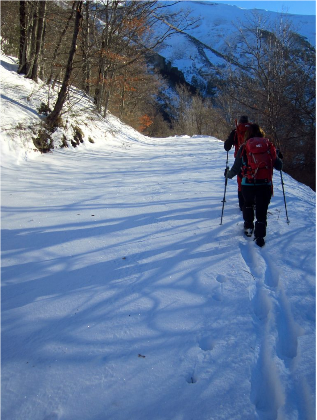
1- La strada Casali-Val di Panico con 30 centimetri di neve fresca.