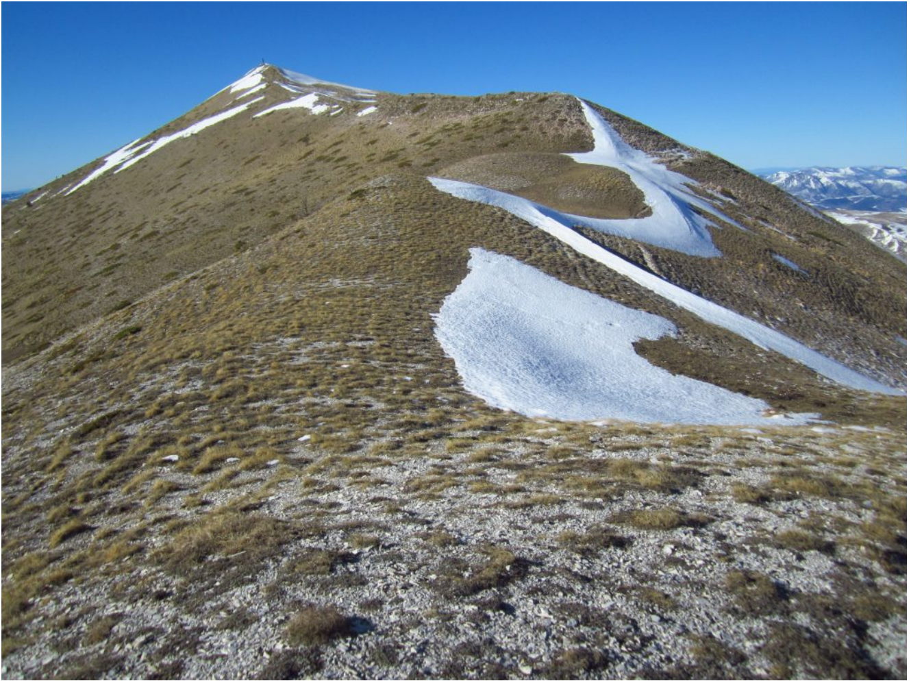
15- La Banditella e la cresta che sale verso la Croce di Monte Rotondo praticamente in condizioni primaverili.