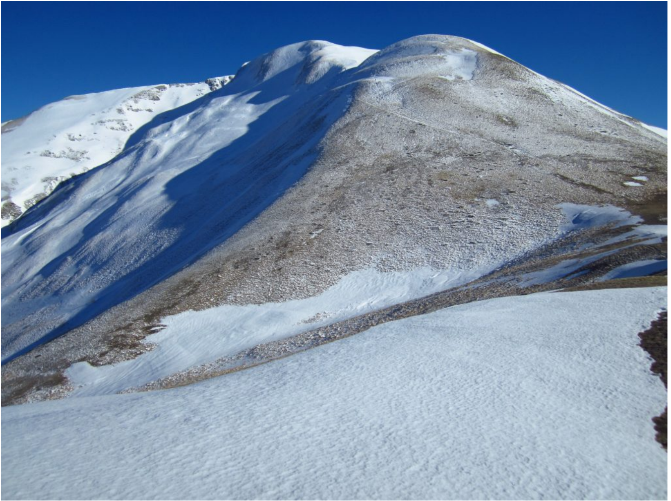
18- Il versante Nord del Monte Rotondo.