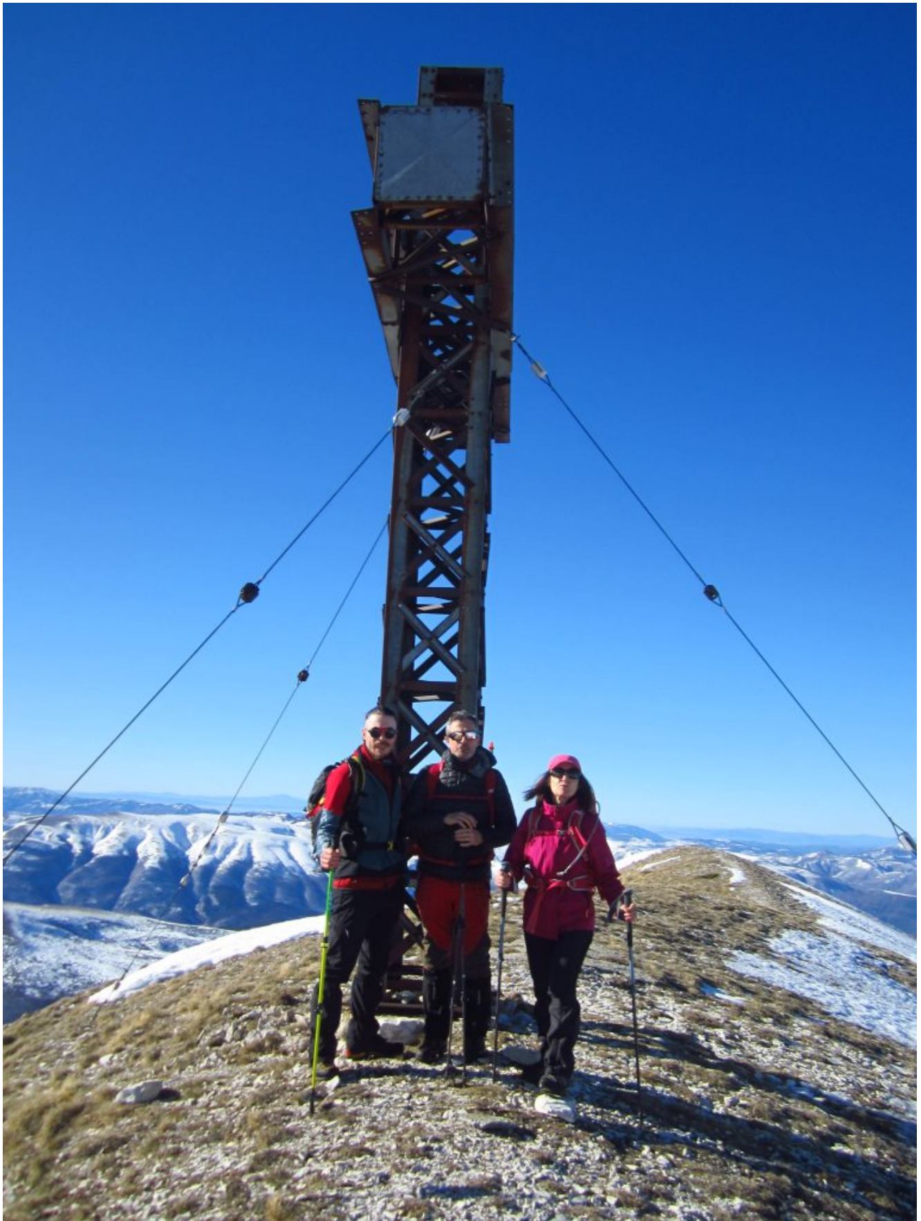
26- Foto di vetta con i miei amici.