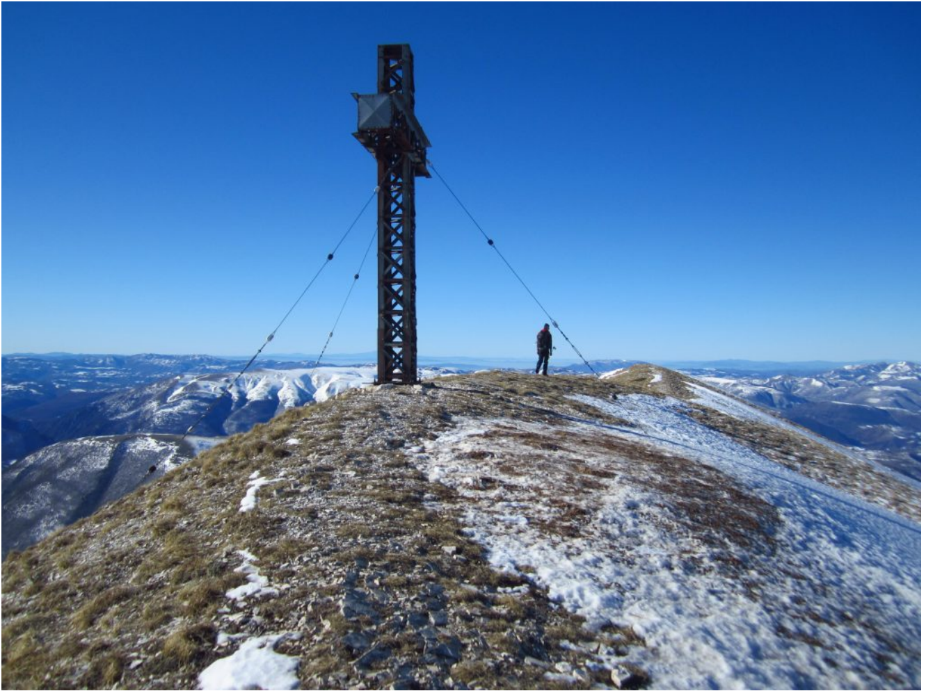
23- La gigantesca croce di vetta della Croce di Monte Rotondo.