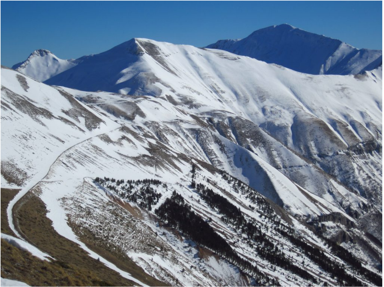
24- da sinistra il Monte Acuto, il Pizzo Tre Vescovi ed il Pizzo Regina.