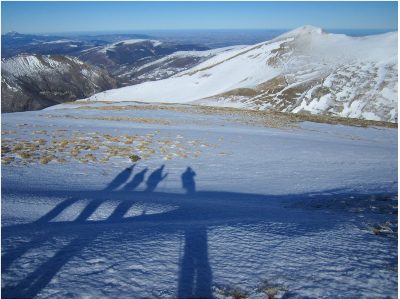
27- Le nostre ombre verso il versante Nord della montagna.