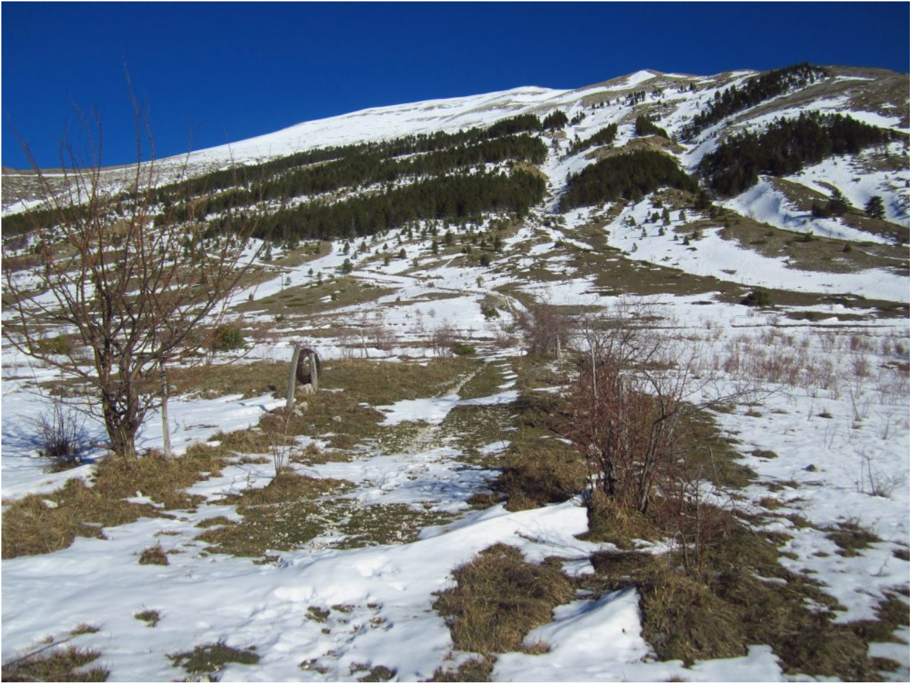
6- Il sentiero che sale verso il rimboschimento per l'edicola di S. Antonio.