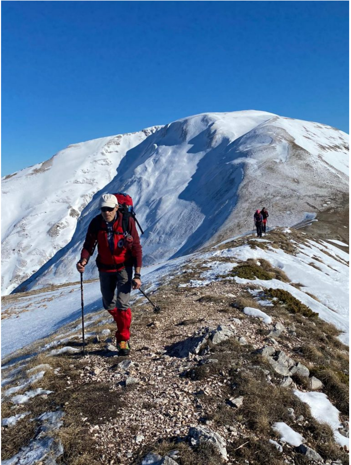
19 – 20- 21- 22- La cresta Est della Croce di Monte Rotondo.