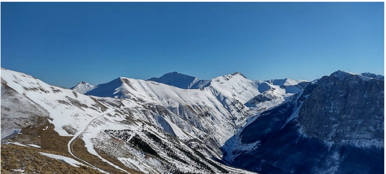
32- Panoramica verso Sud