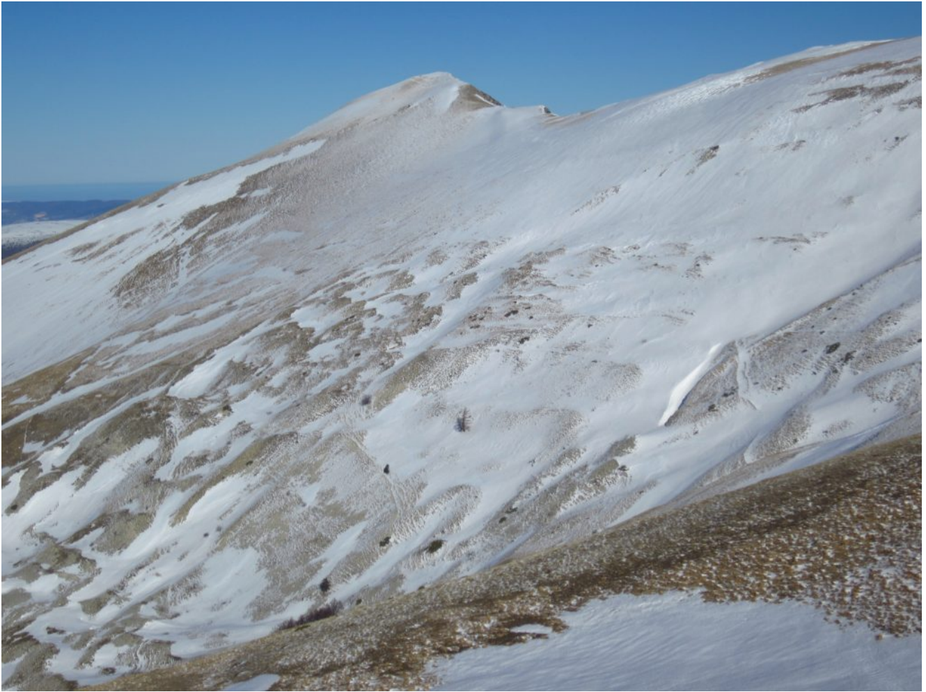
17- Il versante Sud del Monte Pietralata, nella zona del Casale Gasparri.