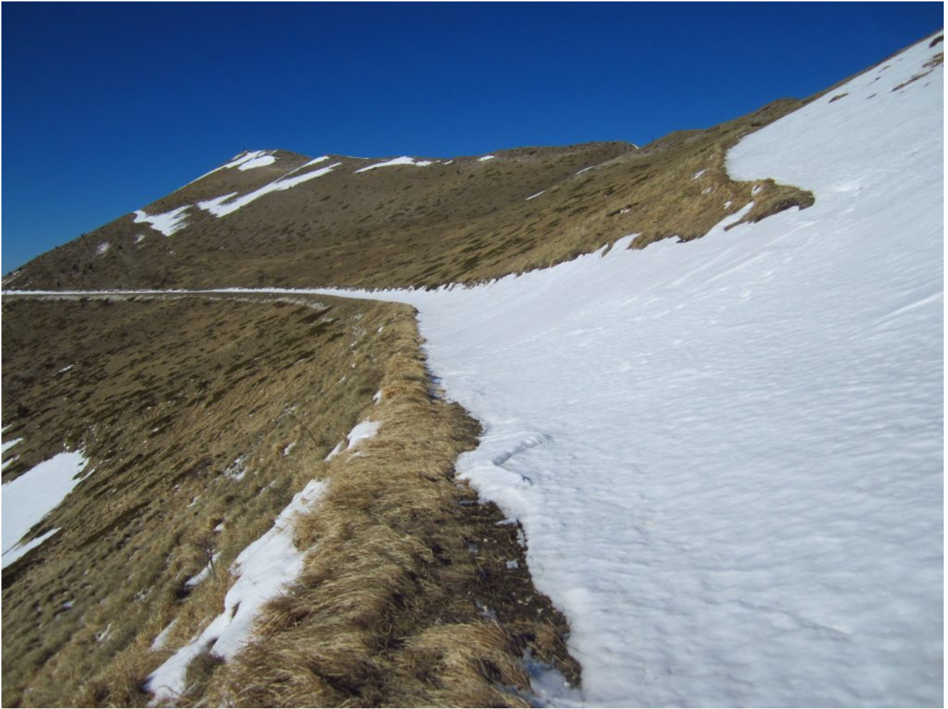
14- La strada Casali-Rifugio del Fargno piena di neve ma i prati sommitali del versante Sud sono puliti.