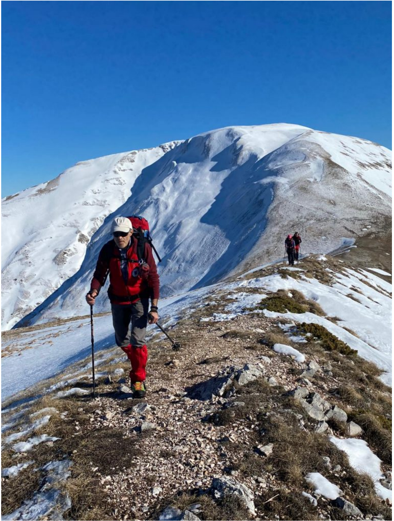
19 – 20- 21- 22- La cresta Est della Croce di Monte Rotondo.