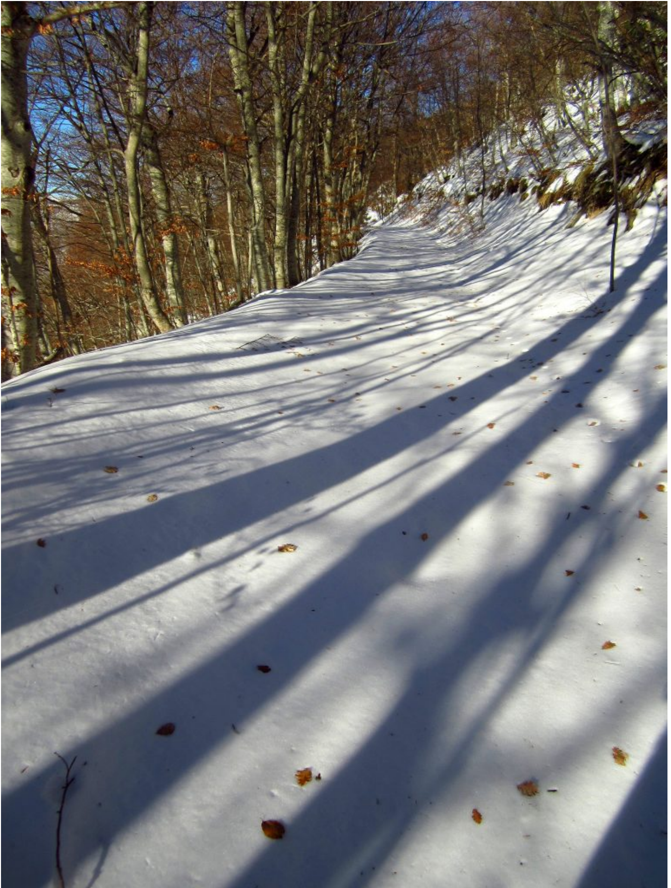
4- La deviazione per i Campi di Casali.