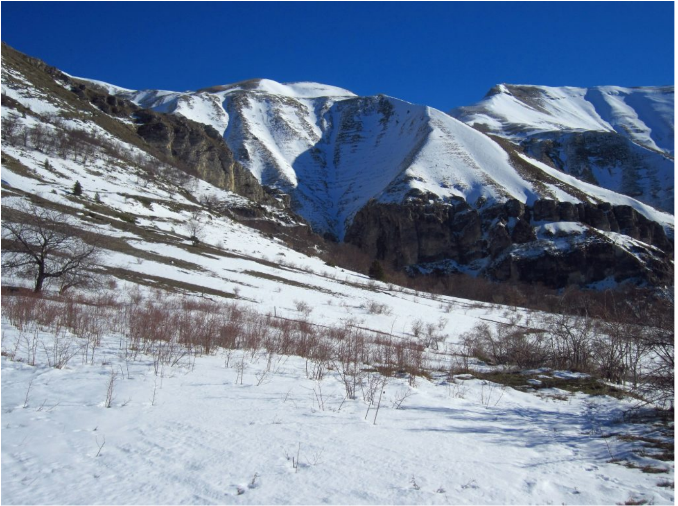
5- I Campi di Casali con vista verso il Fosso La Foce., a destra il Pizzo Tre Vescovi.