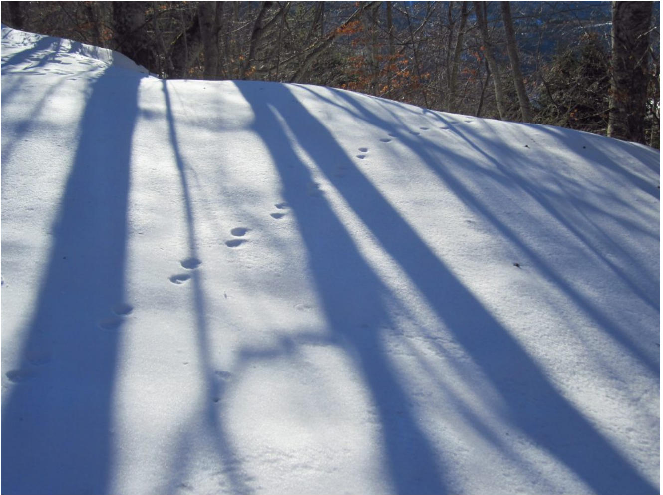
31- Ombre e orme nel bosco verso Casali.