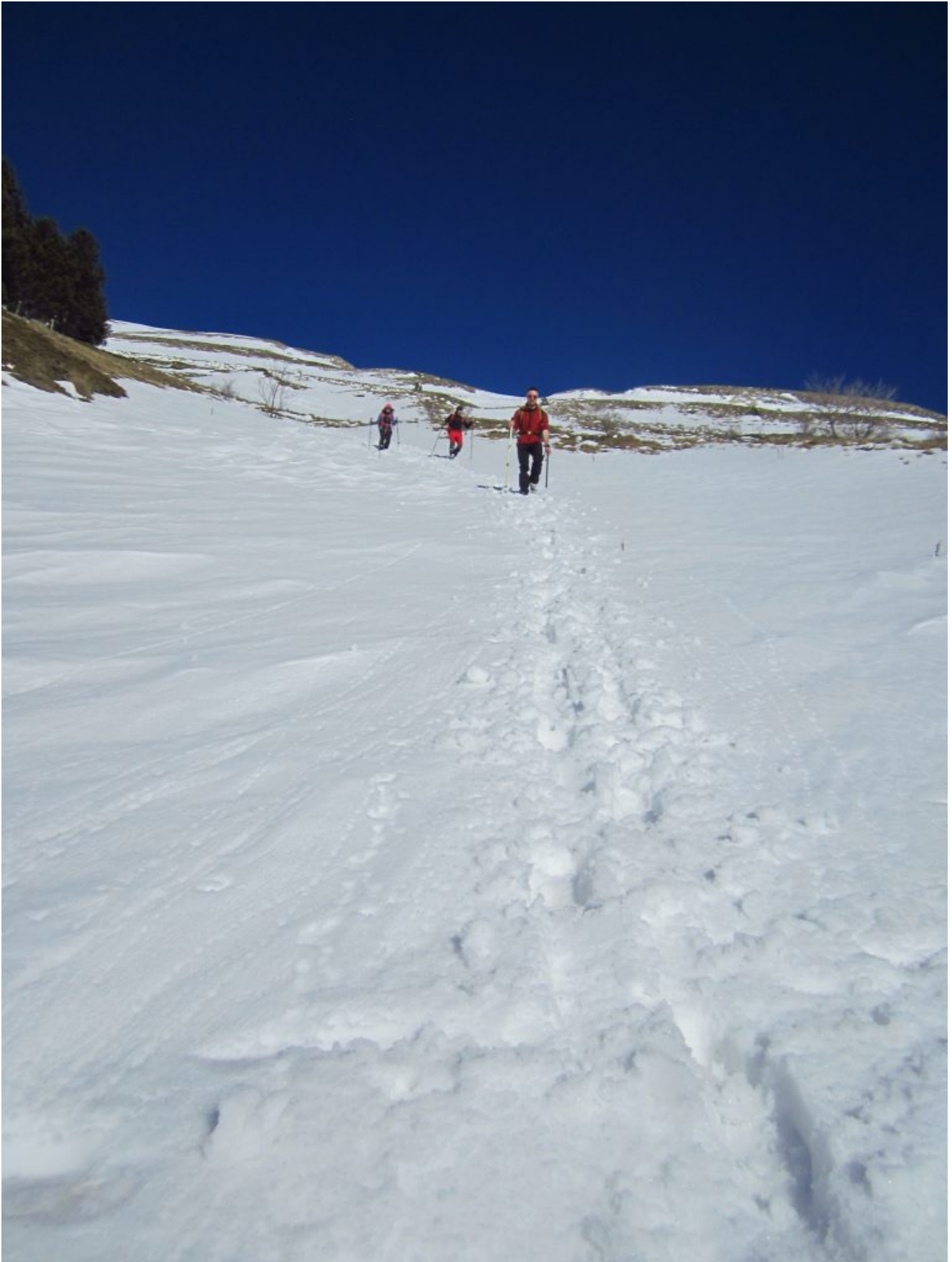
28- La rapida discesa per i canali dalla fonte Scentelle ai Campi di Casali.