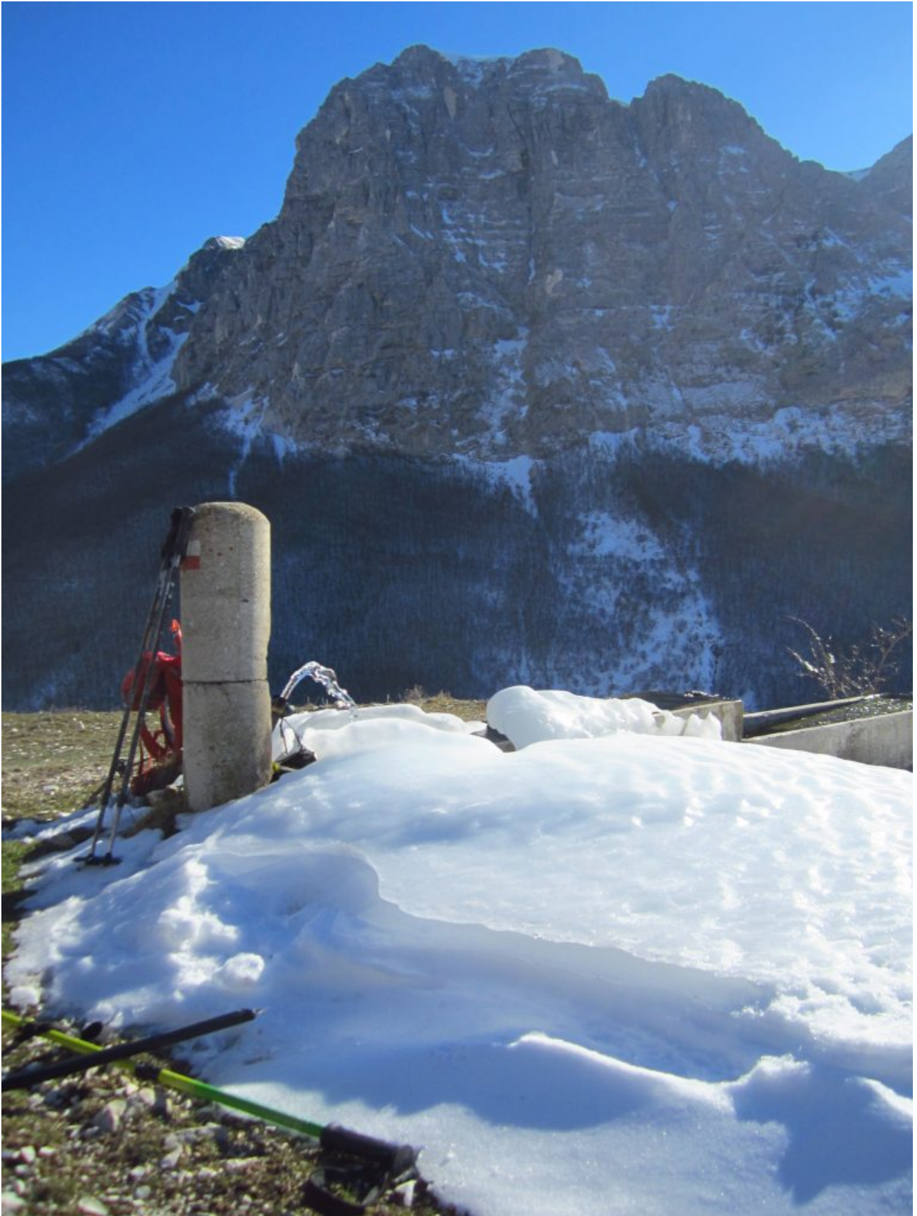
30- La Fonte dei Campi di Casali con l'imponente parete Nord del Monte Bove Nord di fronte.