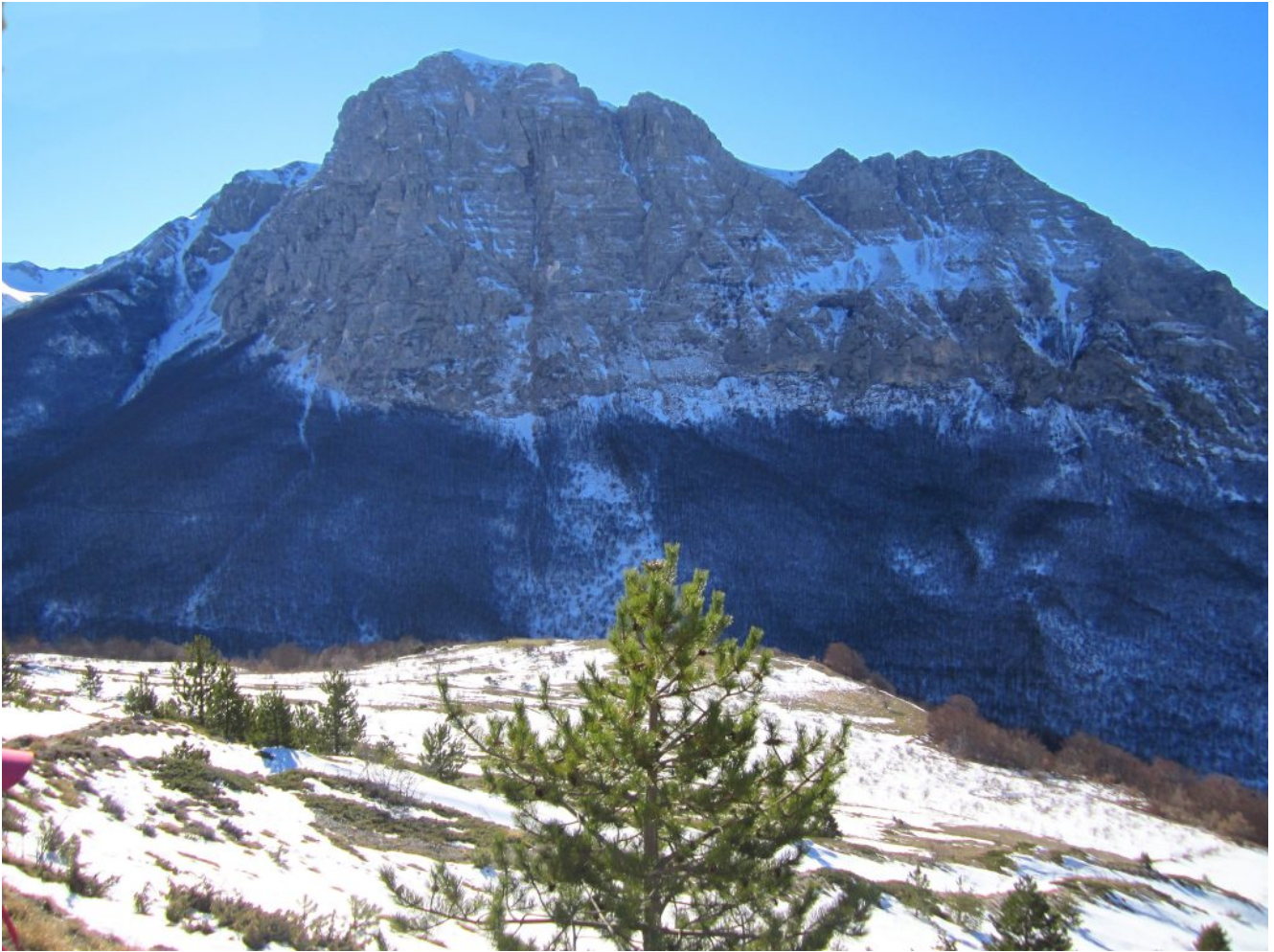
7- Il Monte Bove Nord e la Croce di Monte Bove visti dal sentiero che sale verso la strada Casali-Rifugio del Fargno.