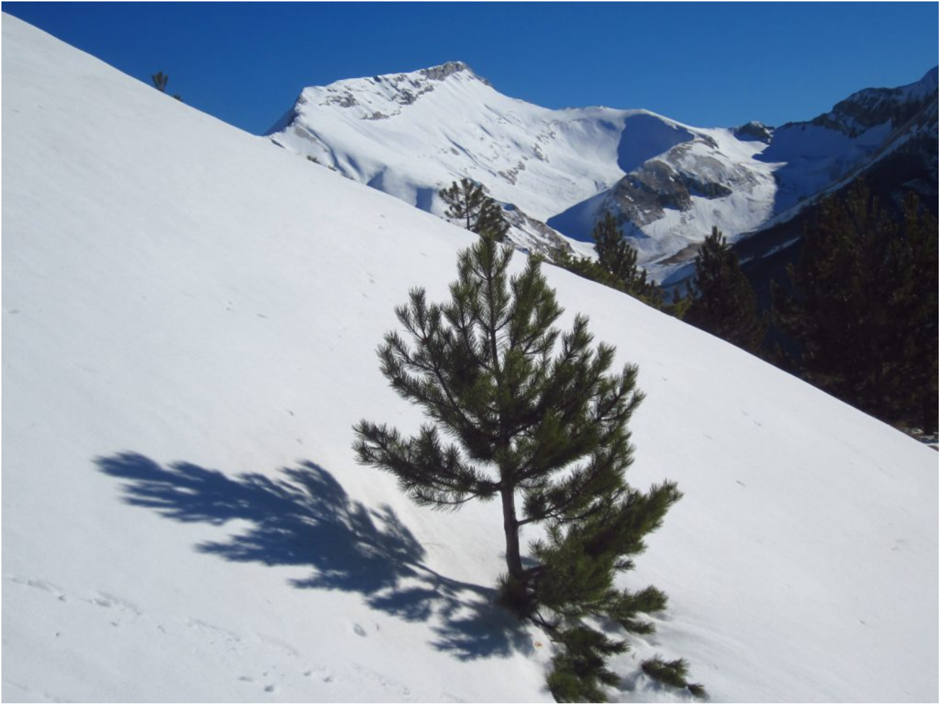
29- Il Pizzo Berro e la val di Panico sulla destra.