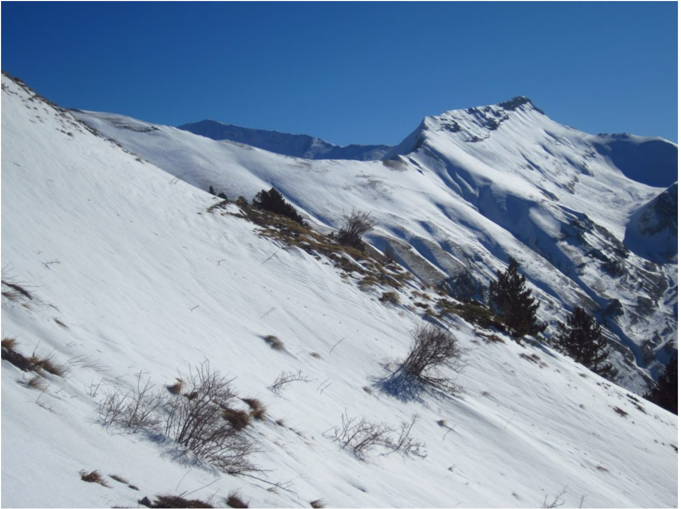
10- Il Pizzo Berro a destra e il Pizzo Regina a sinistra.