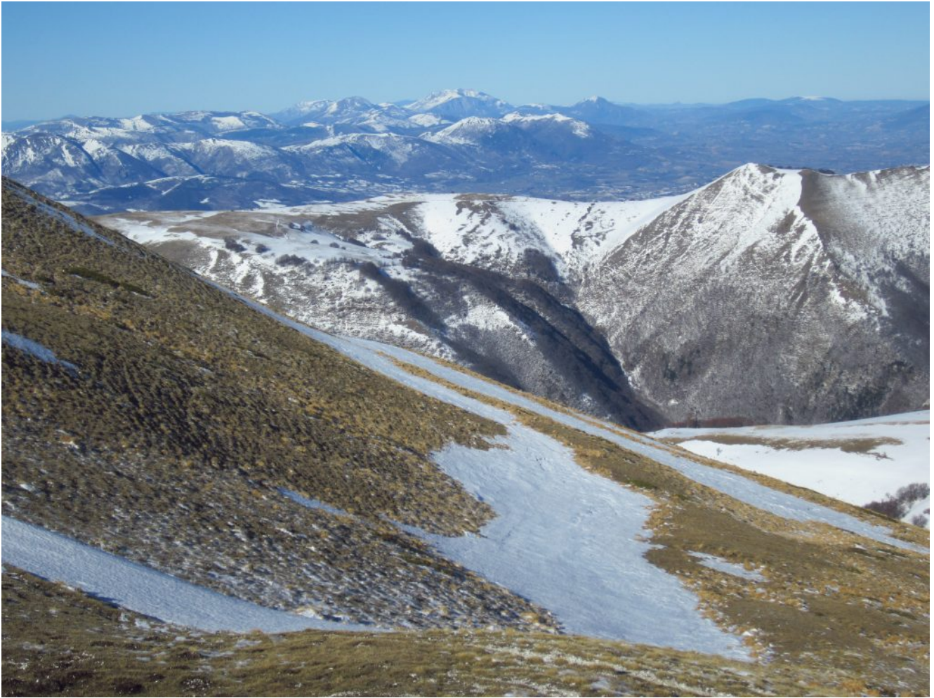
16- Il Monte Banditella al centro e il Monte Va di Fibbia a destra, nella valle di Rio Sacro, sullo sfondo il Monte Catria più alto della catena appenninica settentrionale marchigiana.