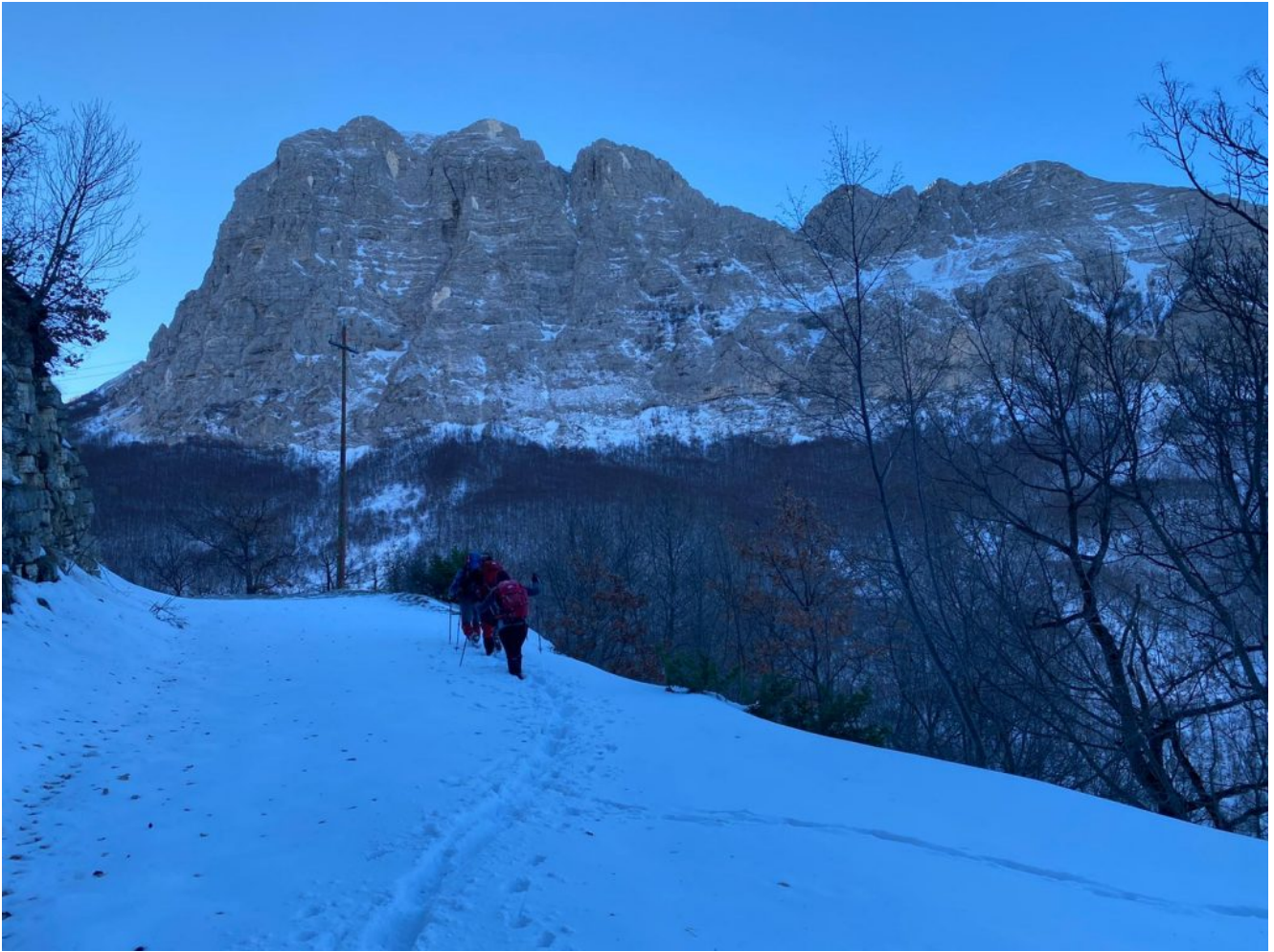
2 – 3- La parete nord del Monte Bove Nord domina la valle.