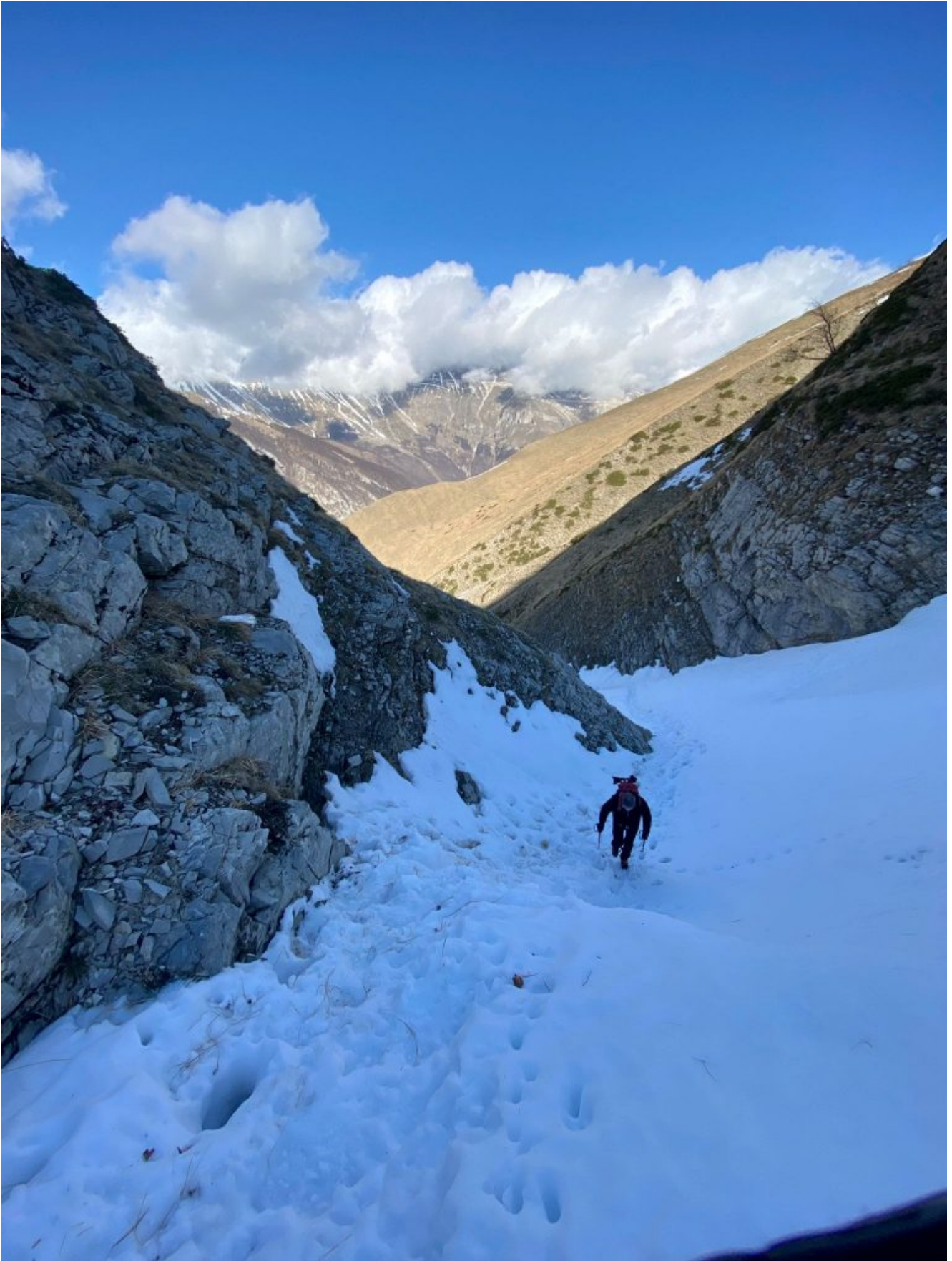
3- 4- Si prosegue nel fosso superando ancora altri risalti nevosi