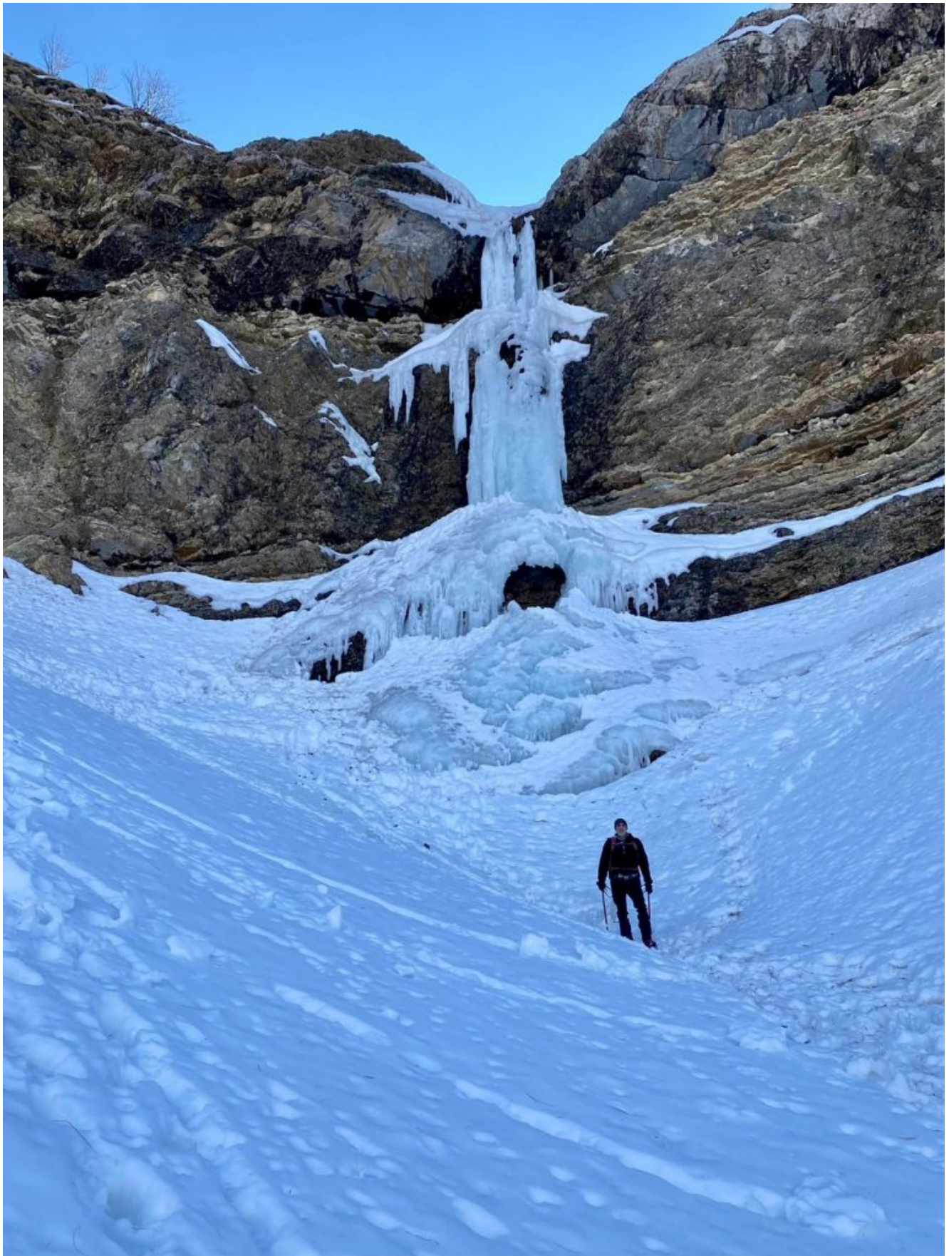
5- 10- E si giunge sotto alla candela di ghiaccio alta circa 30 metri.