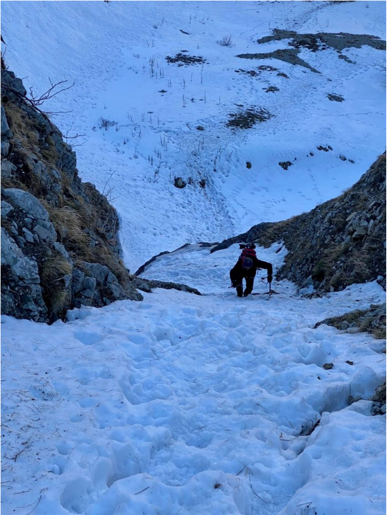
2- Il pendio sopra la prima cascata