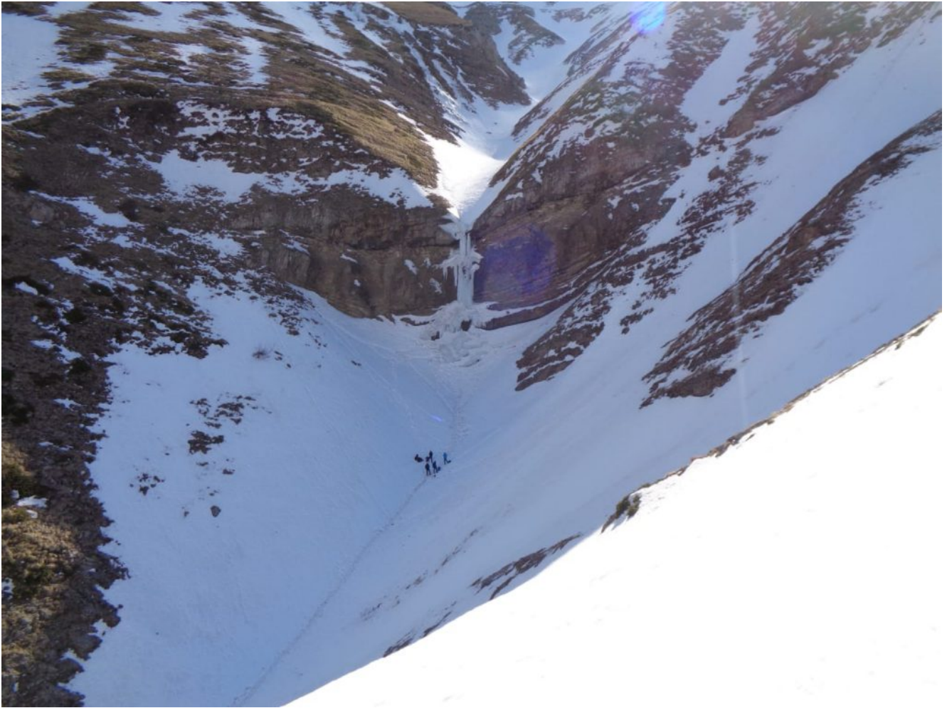
11- Il Fosso visto dalla sponda destra.