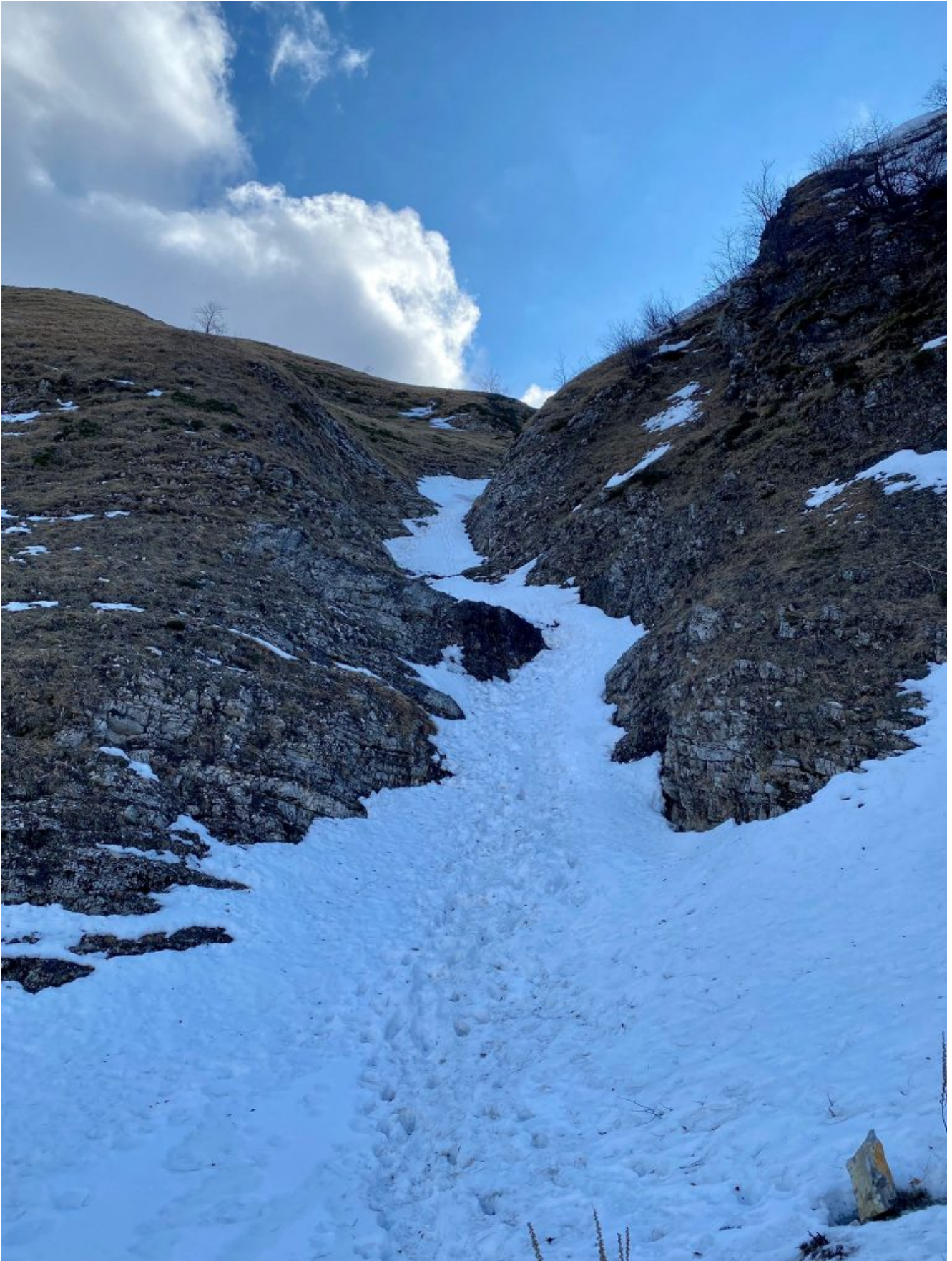
1- L'inizio del Fosso della Rigurdata