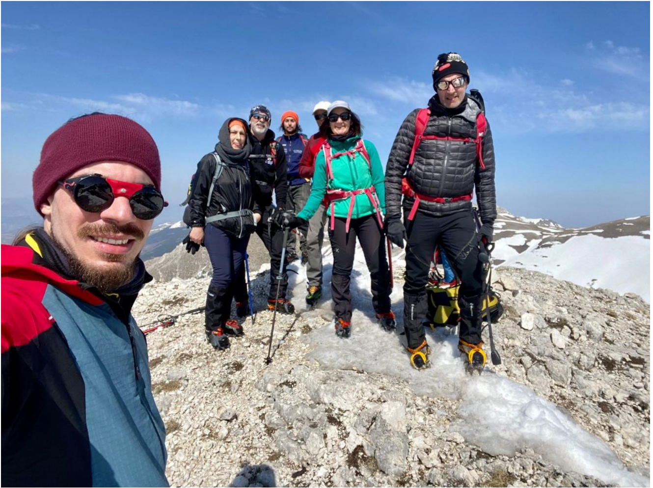
31- Foto di gruppo sulla cima del Monte BICCO