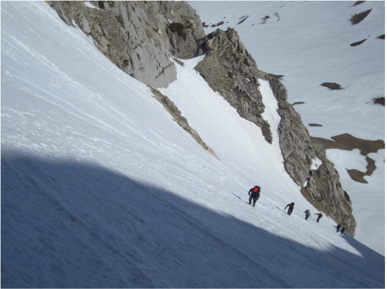
13 – 14- Canalone Maurizi – Il tratto più ripido, saliamo tra ombra e sole.