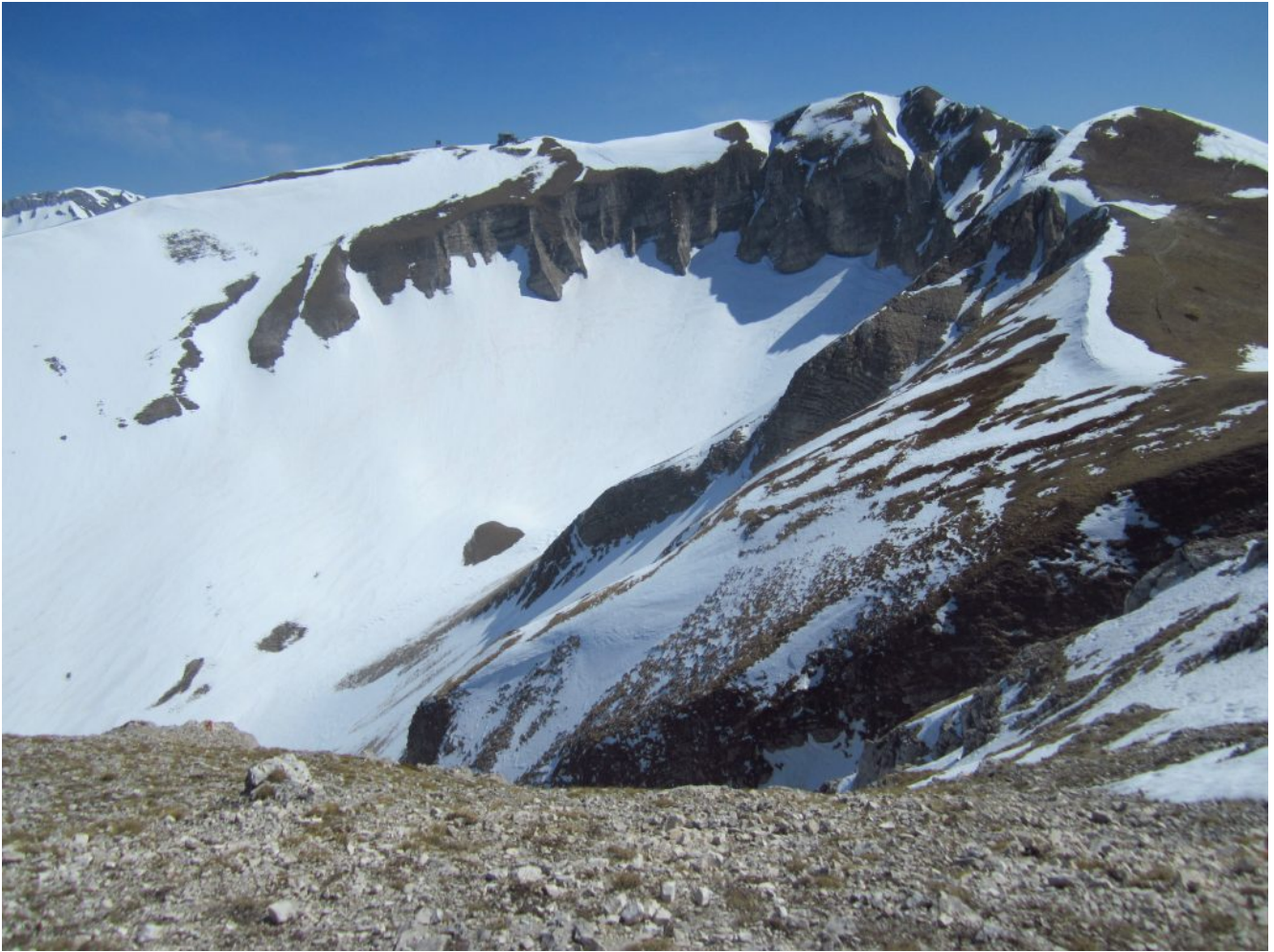
32- Il Monte Bove Sud e la testata della Val di Bove visti dal Monte Biccio.