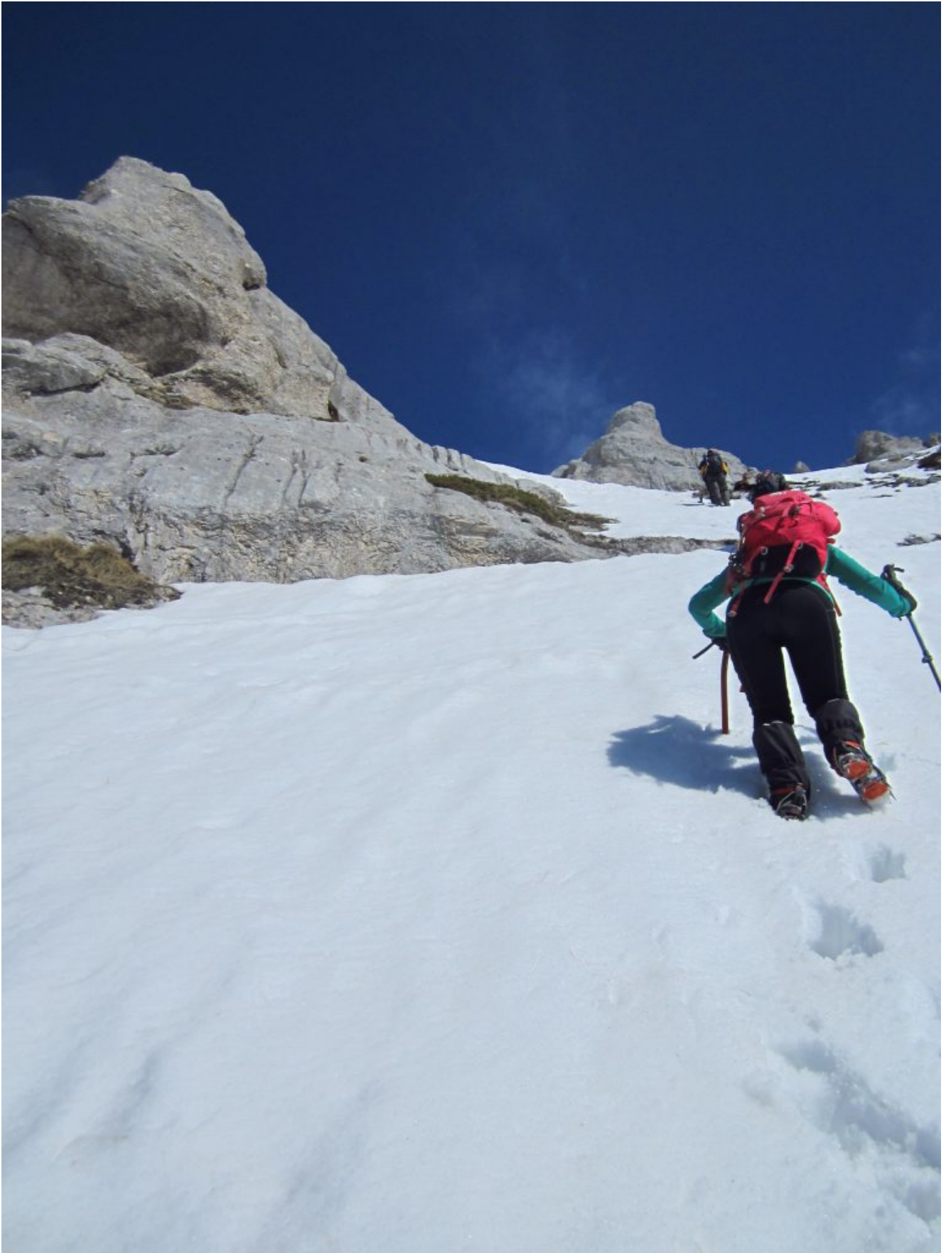
26 – 28- Diretta Ovest- Gli ultimi torrioni prima della cima.