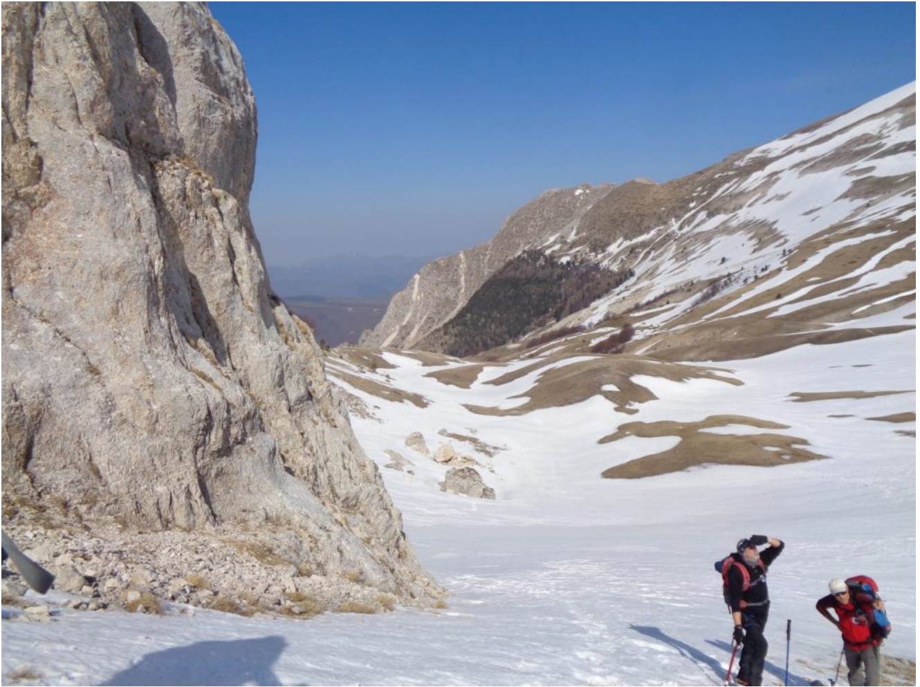
4 – 5- L'attacco della salita del Canale Maurizi, sullo sfondo la Croce di M.Bove già in versione primaverile senza neve