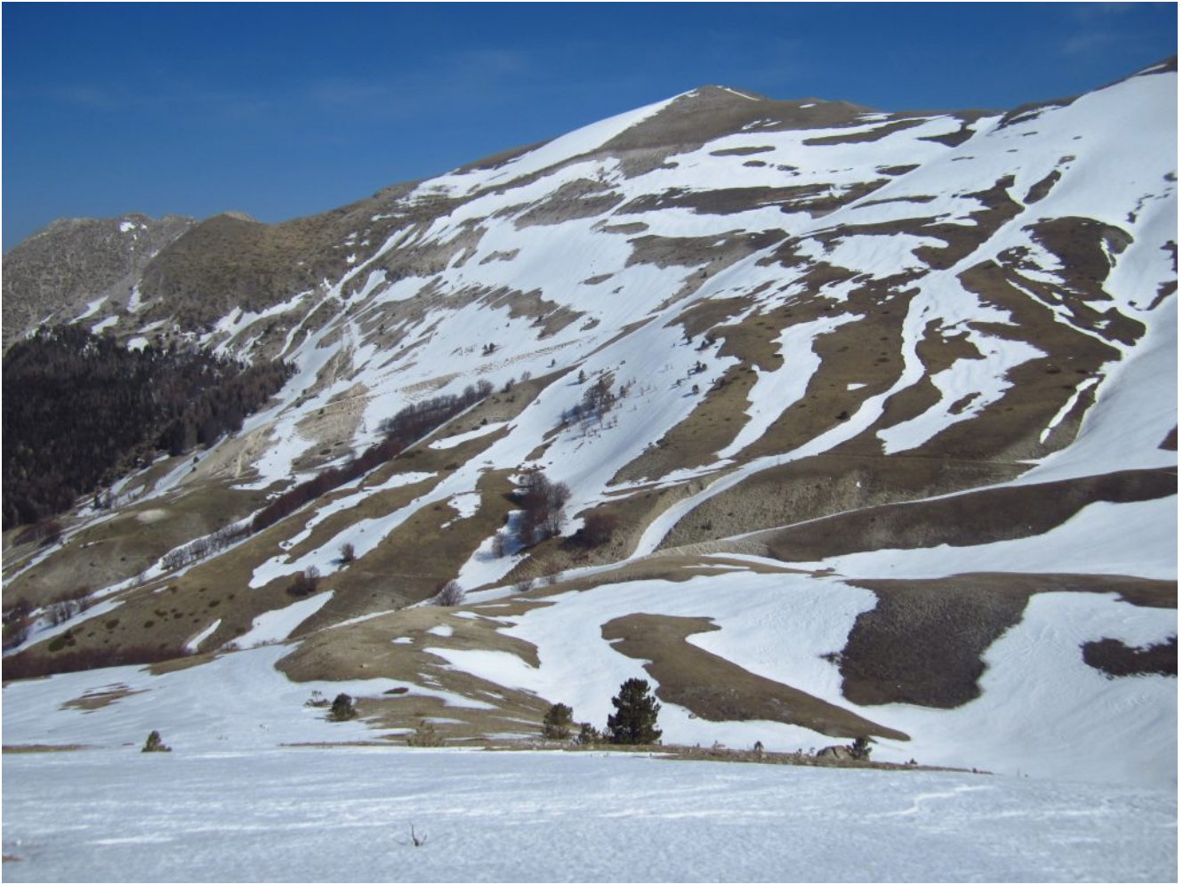
2- Il versante Ovest del M.Bove Nord e la sottostante Val di Bove visti dalla base della parete Nord del M. Bicco.