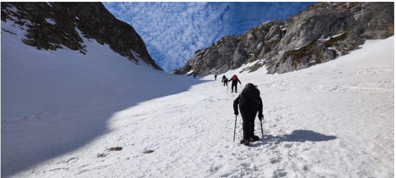
6 – 9- Fasi di salita del Canalone Maurizi.