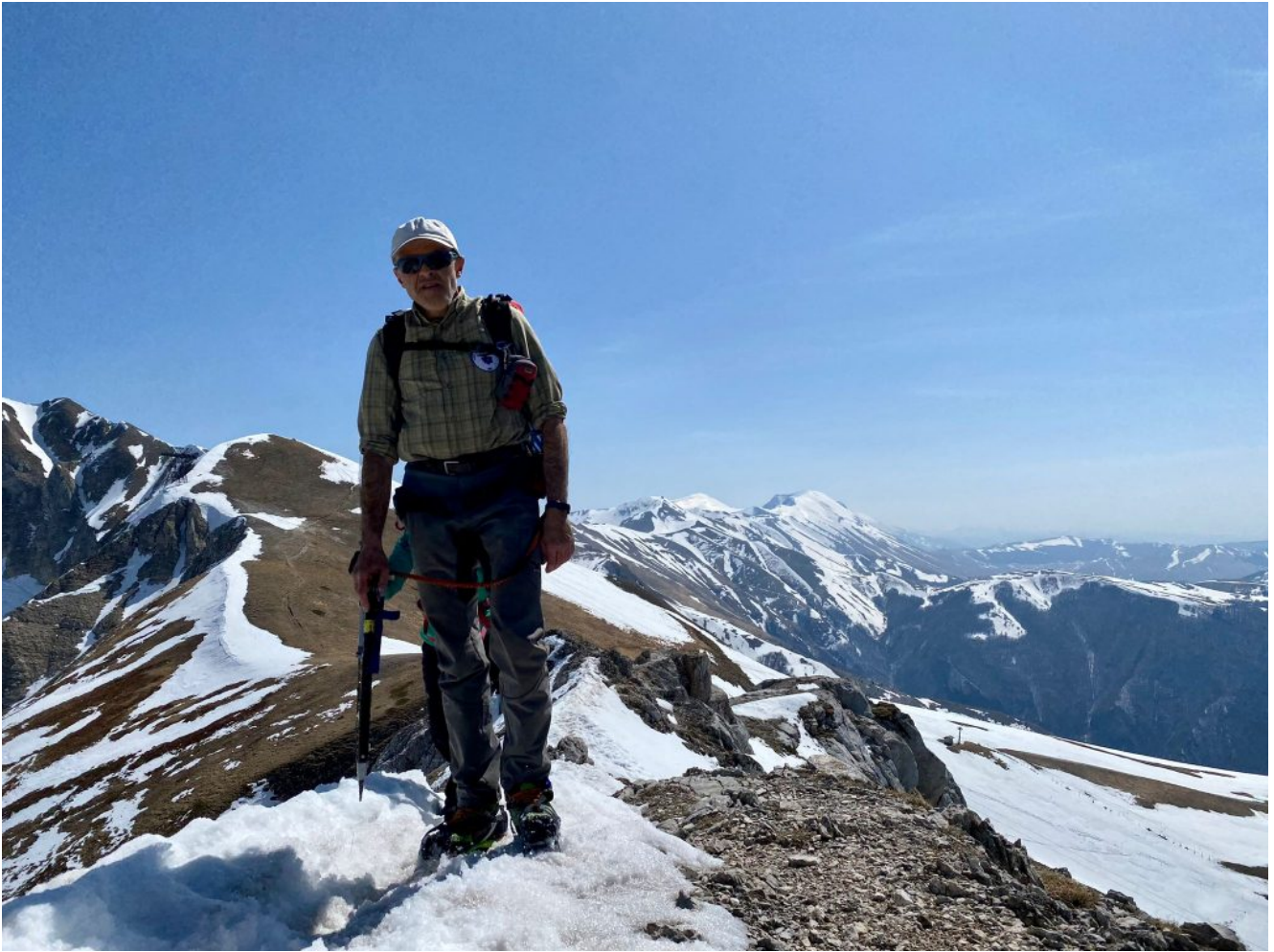
30- In cima al Monte Bicco per la seconda volta in giornata