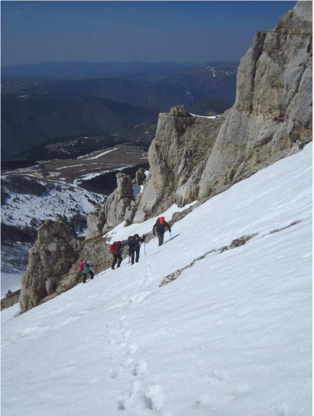
22 – Diretta Ovest- Si costeggiano le particolari formazioni rocciose a gradoni del versante Ovest del M. Bicco, preferite dai camosci.