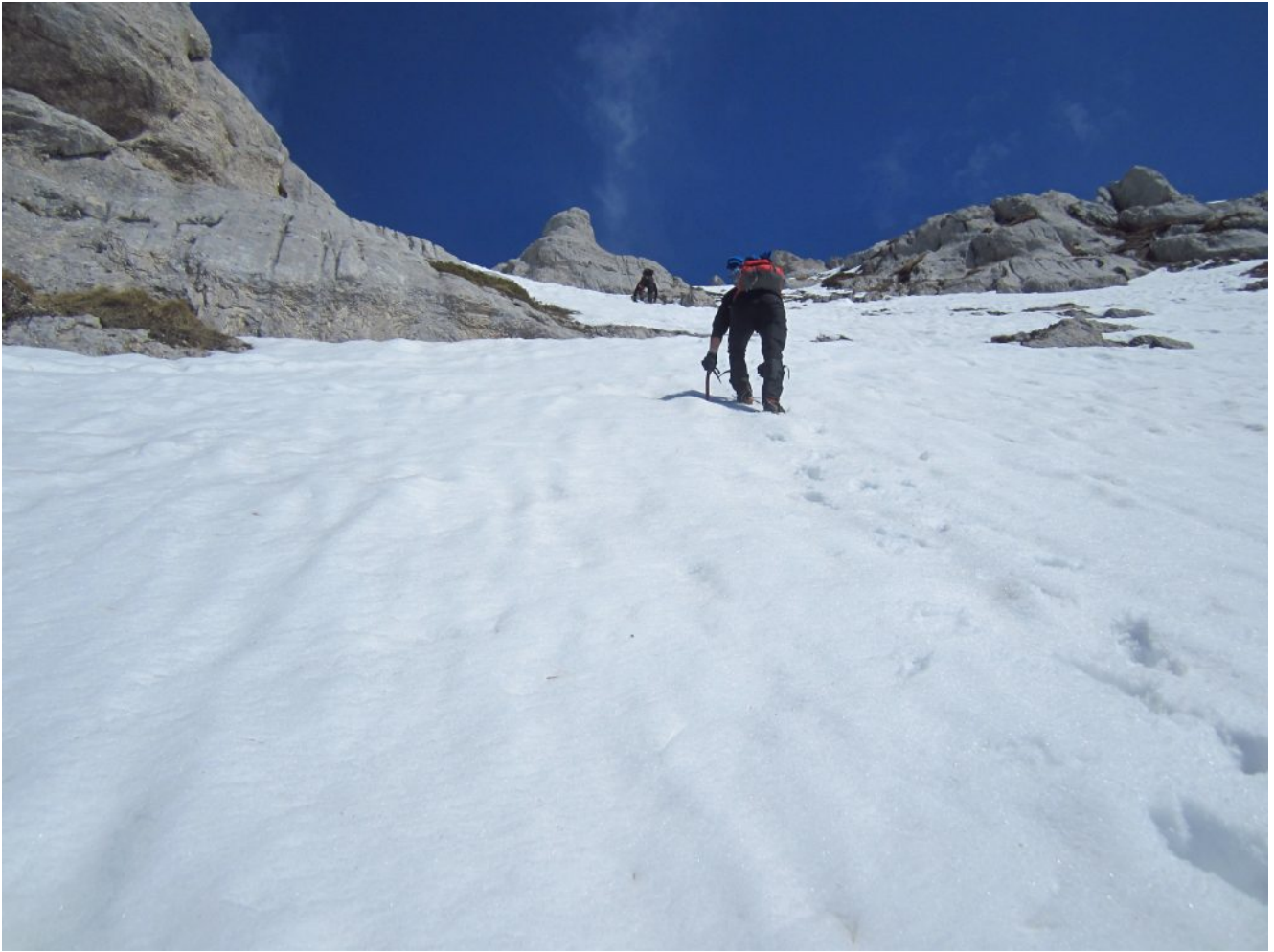
24- Diretta Ovest- Inizia il tratto più ripido.