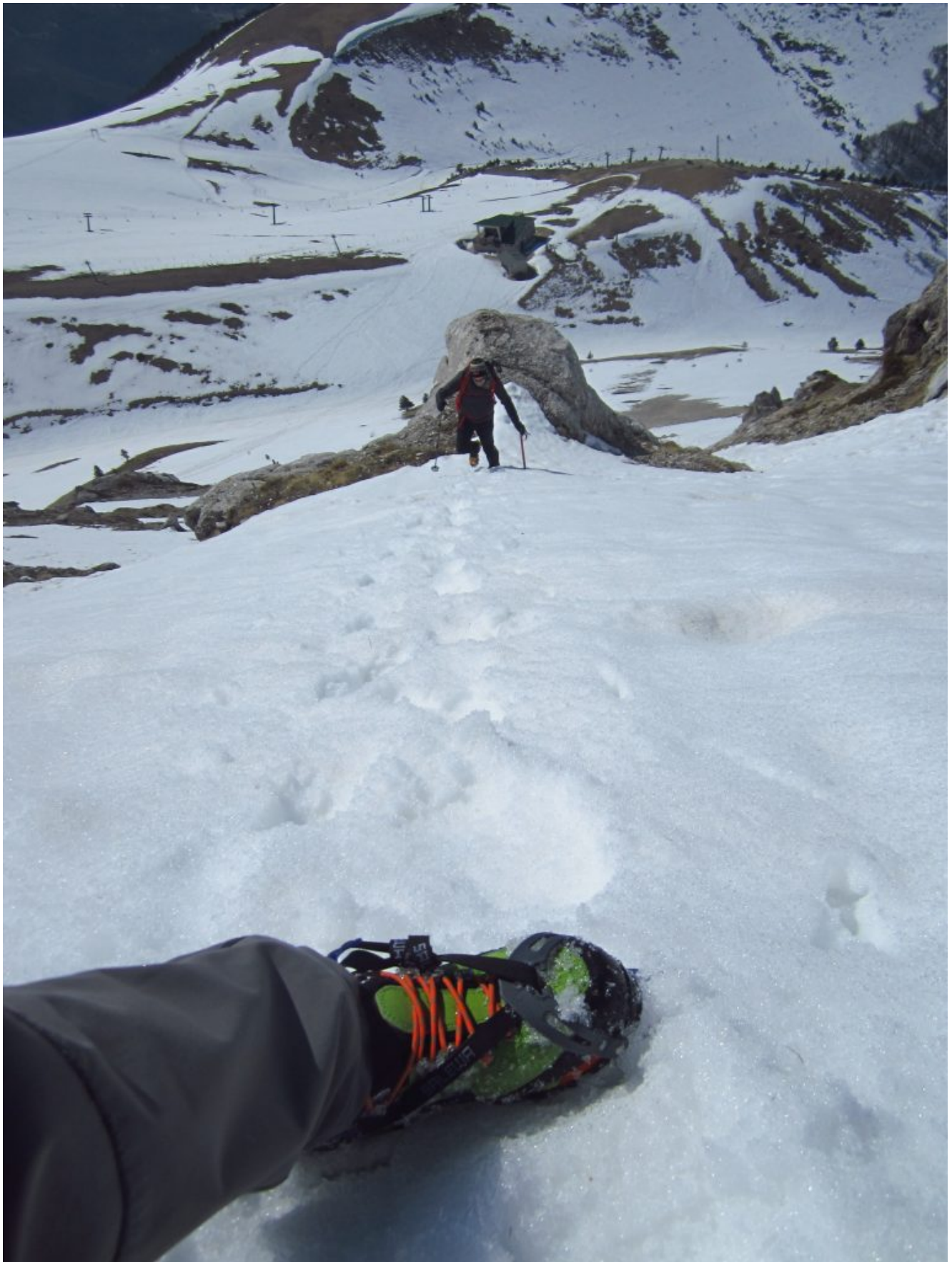
29- Diretta Ovest- L'ultima ripida crestina nevosa. prima della cima.