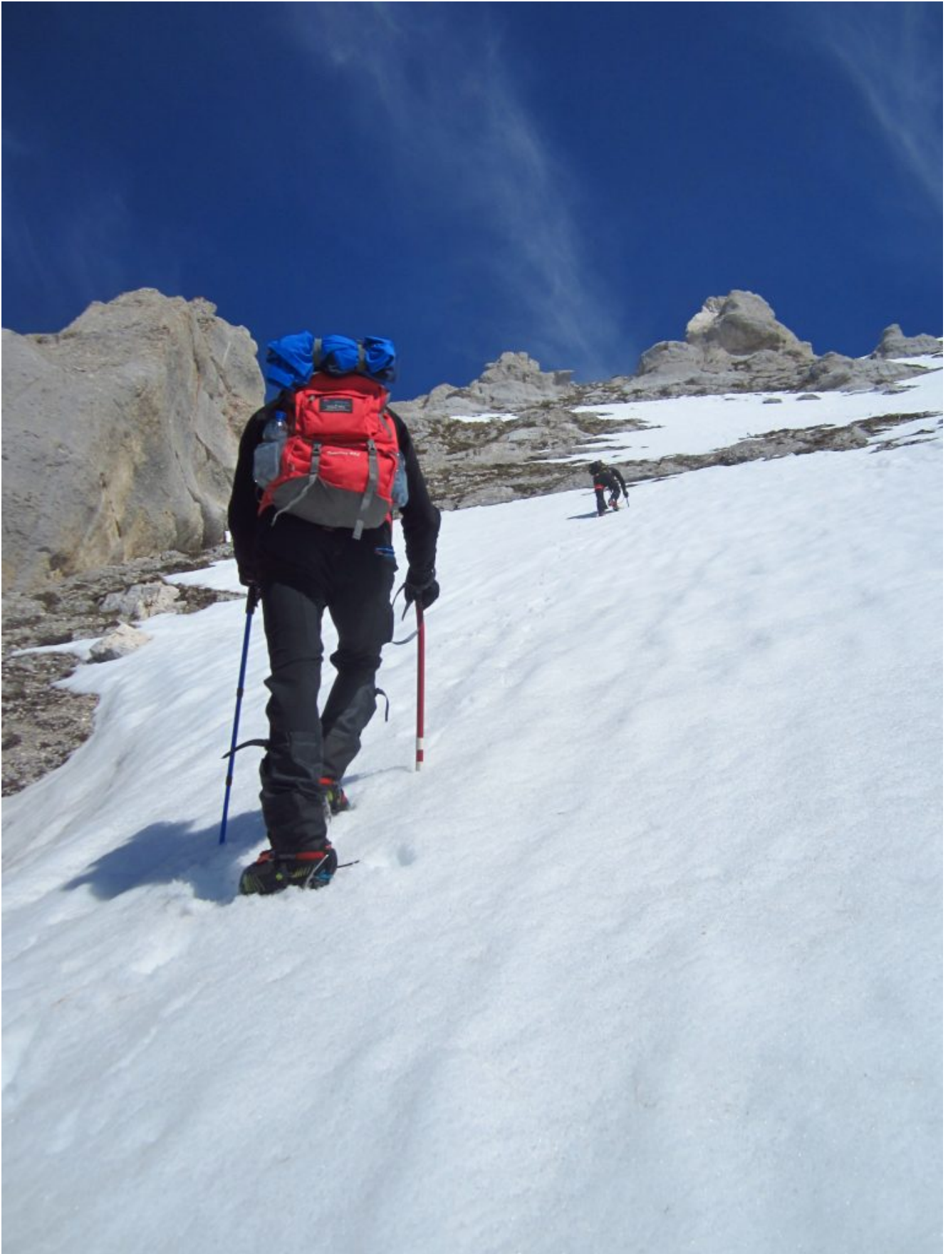
21-Diretta Ovest- Raggiunta la verticale della cima del M. Bicco ricominciamo la seconda salita.