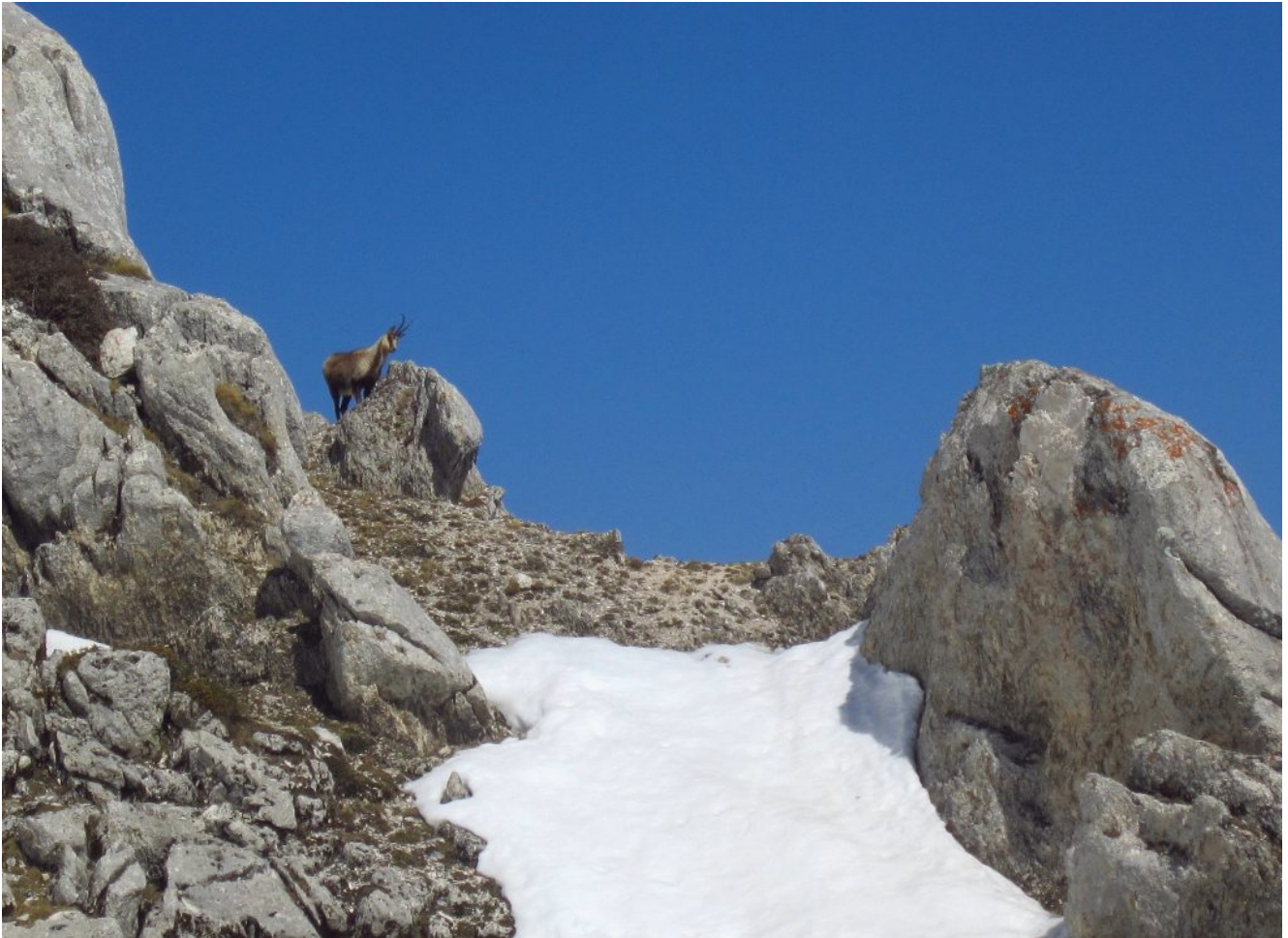
10- Camoscio curioso ci osserva dalla cresta Est del M.Bicco.