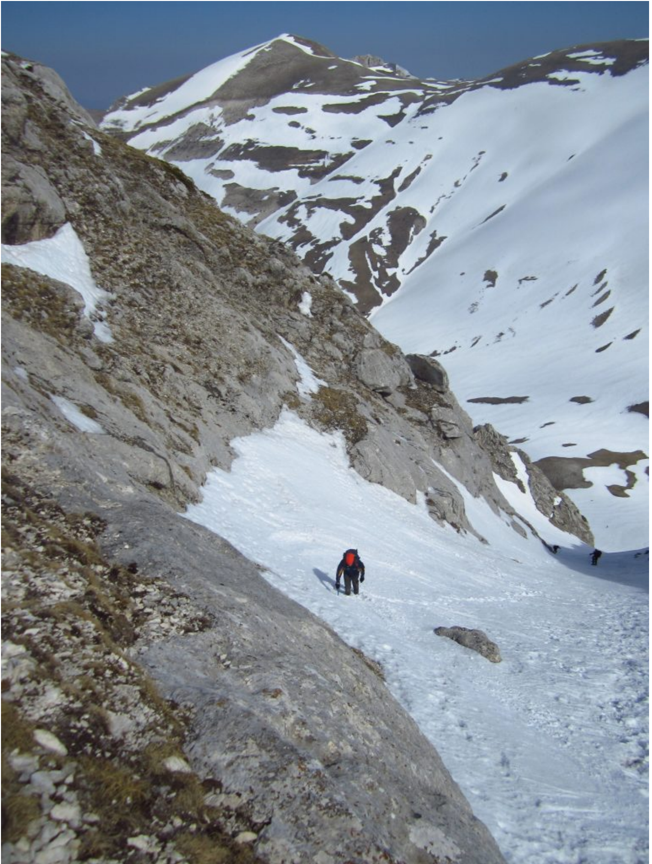
15 – 16- Canalone Maurizi – L'uscita sulla sella poco prima della cima del M. Bicco.