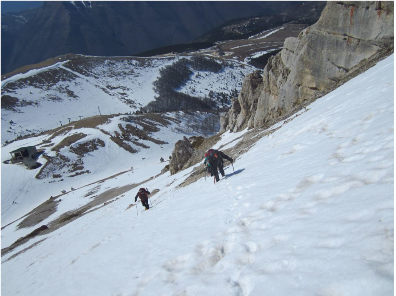
23- Diretta Ovest- Fasi di salita, sullo sfondo gli impianti di risalita Jacci di Bicco.