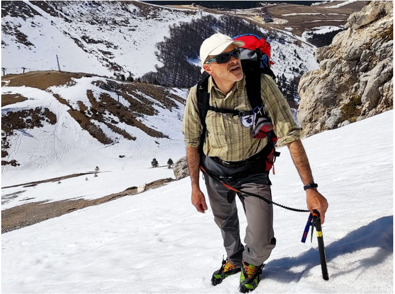
25- Diretta Ovest- Fa caldo ma per fortuna la neve è ancora discreta.