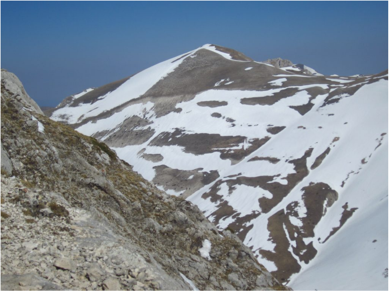
17- Il versante Ovest del Monte Bove Nord con scarso innevamento.