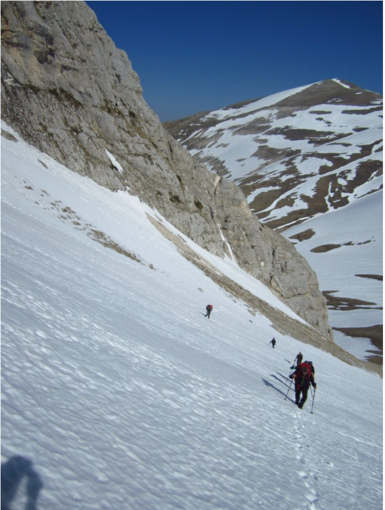
11 – 12- Canalone Maurizi – Zona centrale con il M.Bove Nord alle spalle.