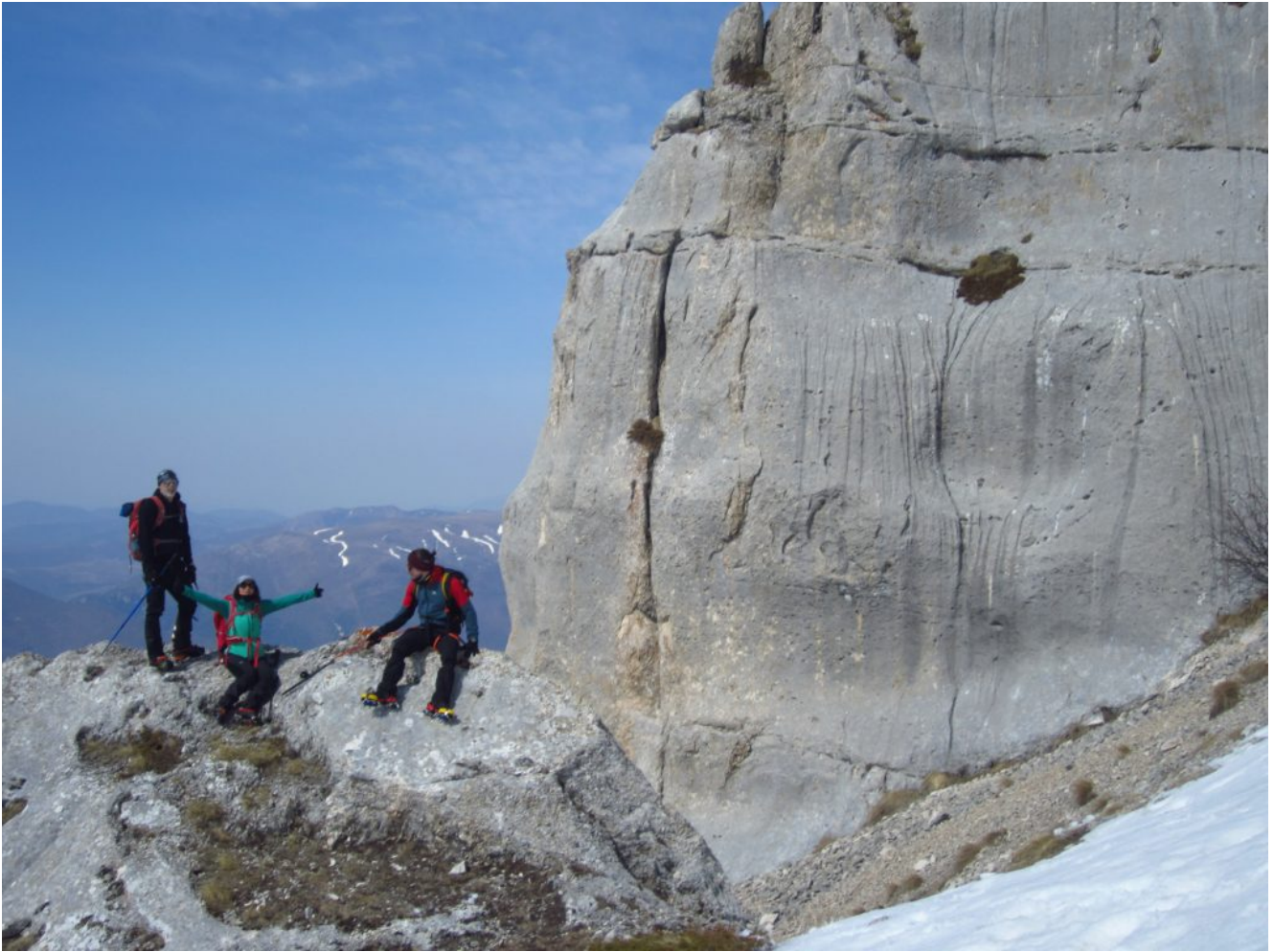
19- Le bellissime placche attrezzate nel versante Sud-ovest del M.Bicco.