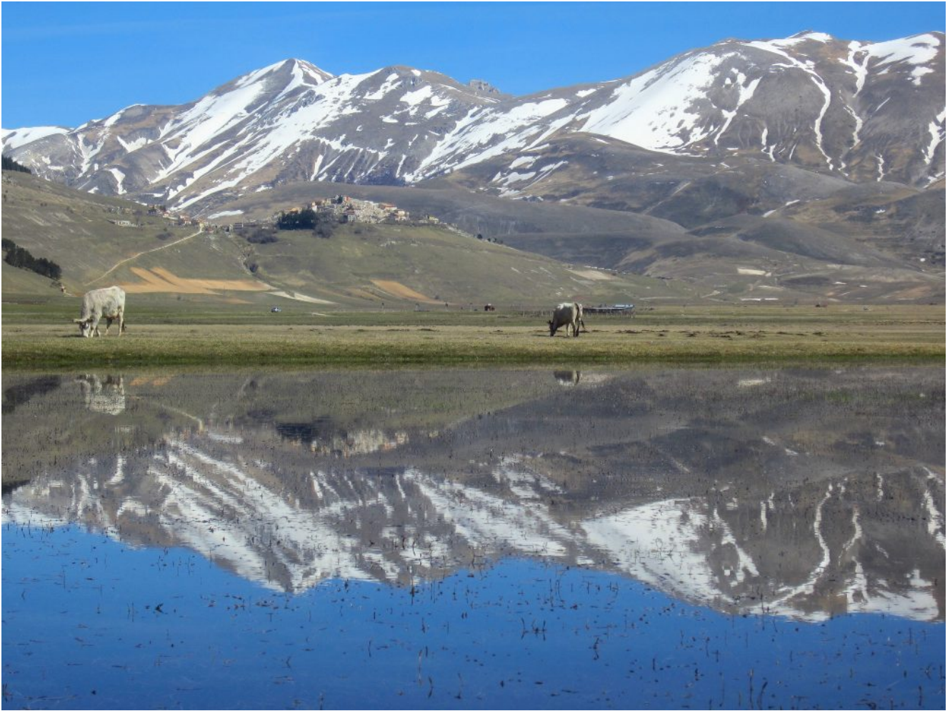
43- 44- Il Monte Porche ed il Monte Argentella.