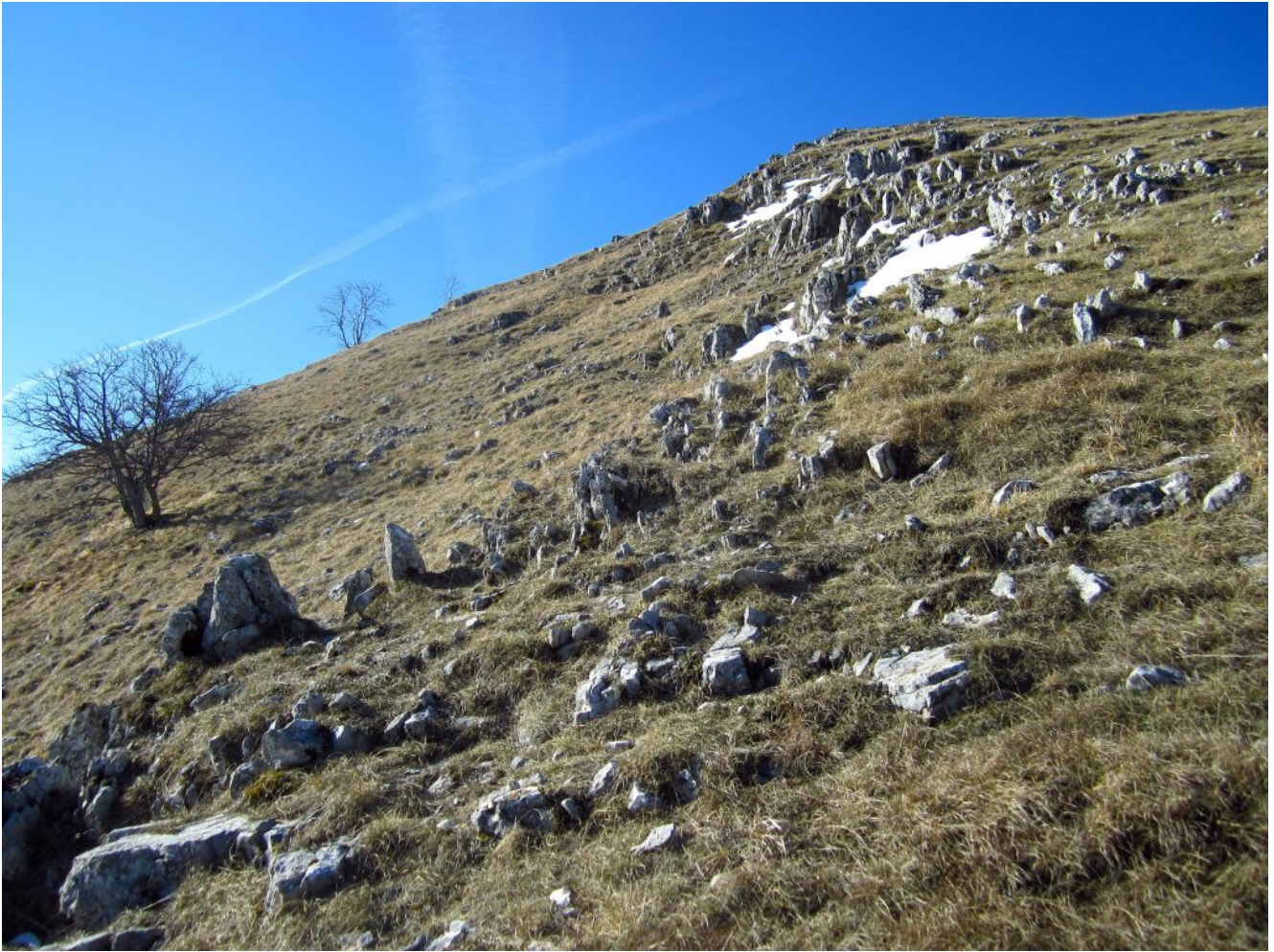
4- La ripida cresta di salita con rocce affioranti.