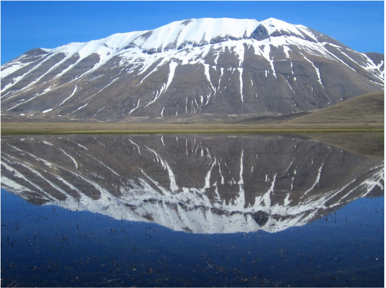
46- 47- La Cima del Redentore con i suoi più di 1000 metri di dislivello dl Piano Grande.