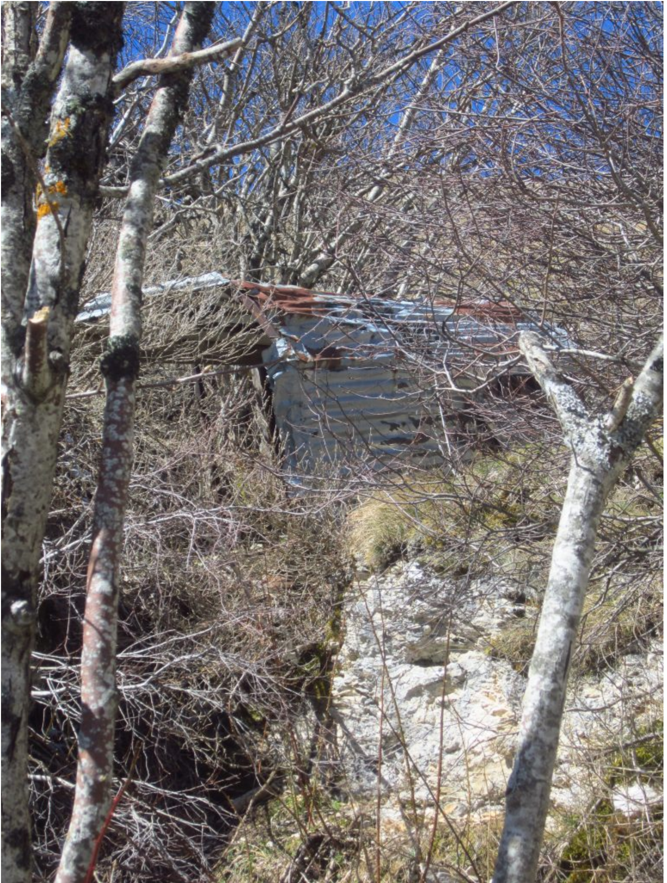
38- Riparo di lamiera di pastori trascinato probabilmente dal vento dai pendii soprastanti nel Fosso del Malpasso, in questi ultimi anni ho documentato numerosi abbandoni indiscriminati di rifiuti vari da parte dei pastori estivi che frequentano i