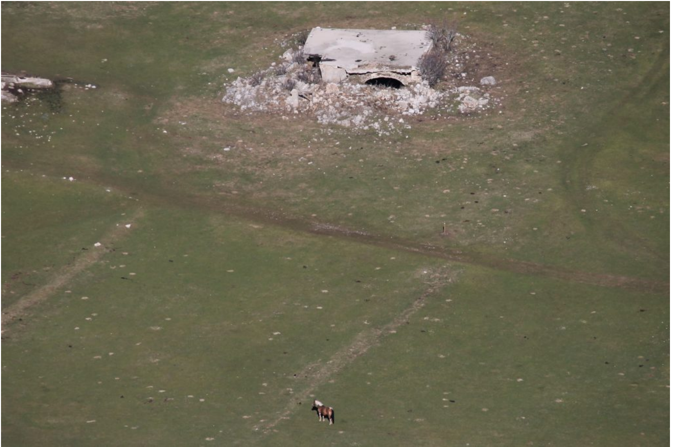
21- Zoom sul Casaletto Guglielmi frequentato da cavalli allo stato brado.