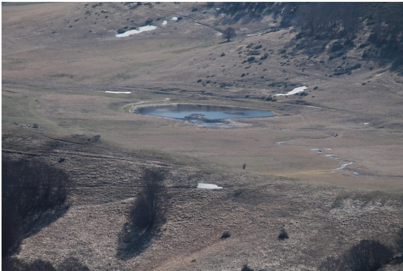
32- Zoom sul Laghetto del Piano Piccolo visto dal Castellaccio