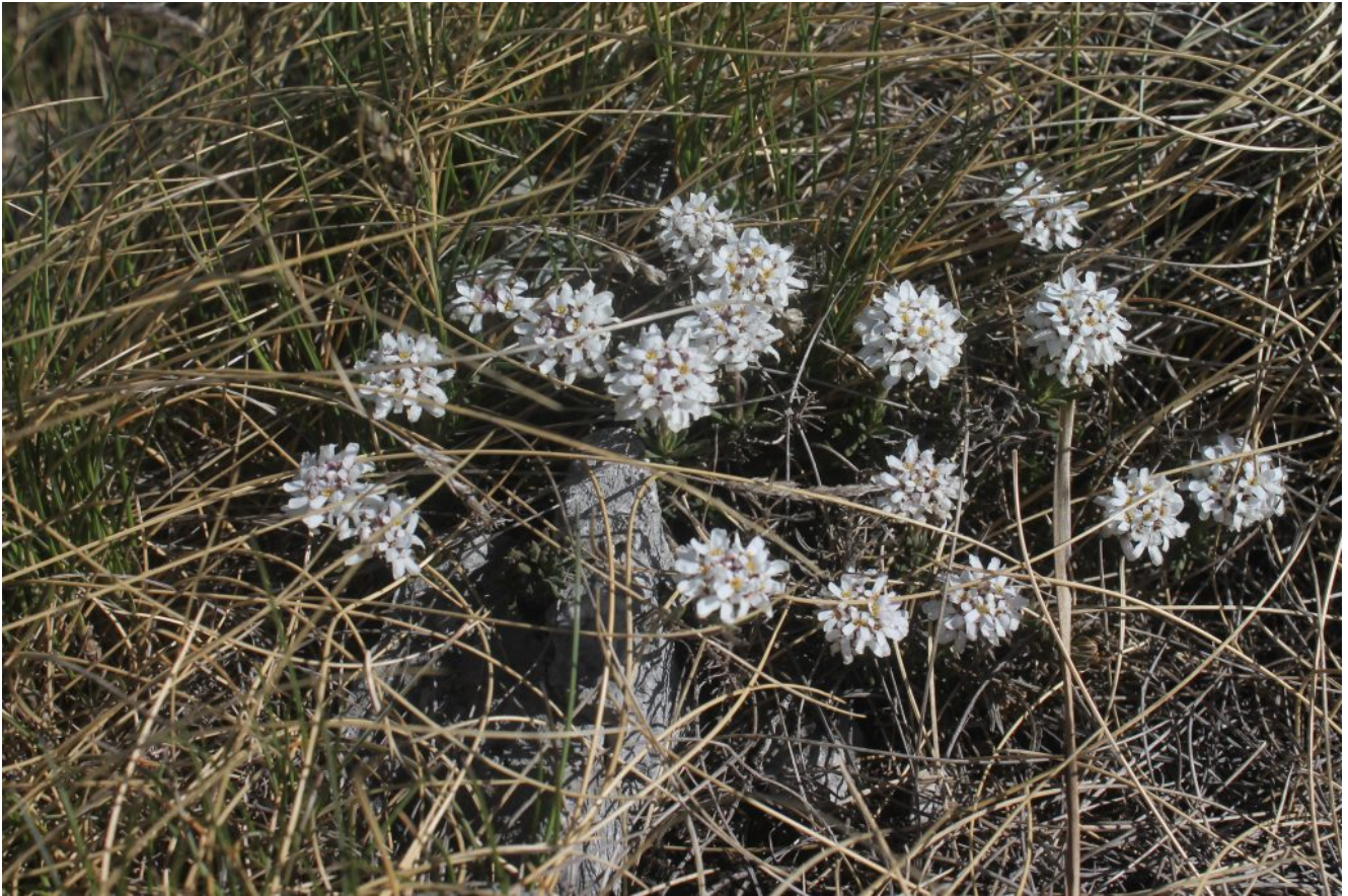
18- Primi fiori primaverili: Iberis saxatilis