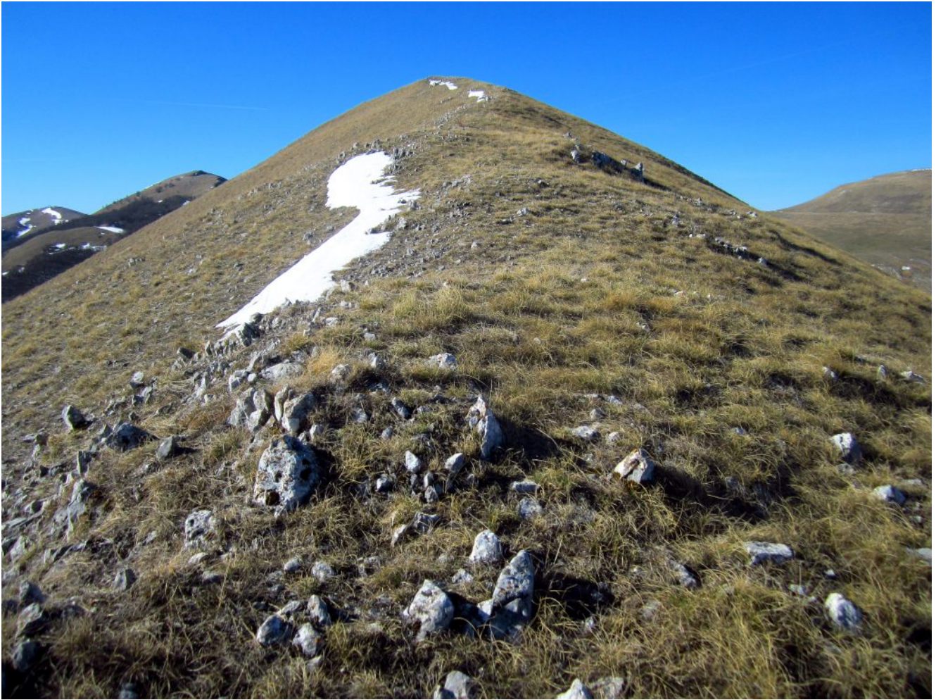
13- La cima del Monte Castello