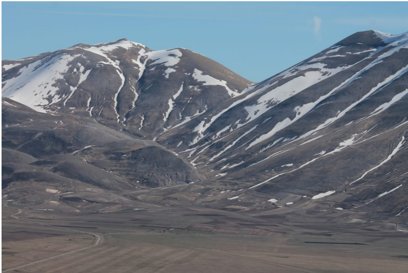
33- Veduta verso Nord, il Monte Argentella a sinistra con i canali gemelli e Cima di Forca Viola a destra.