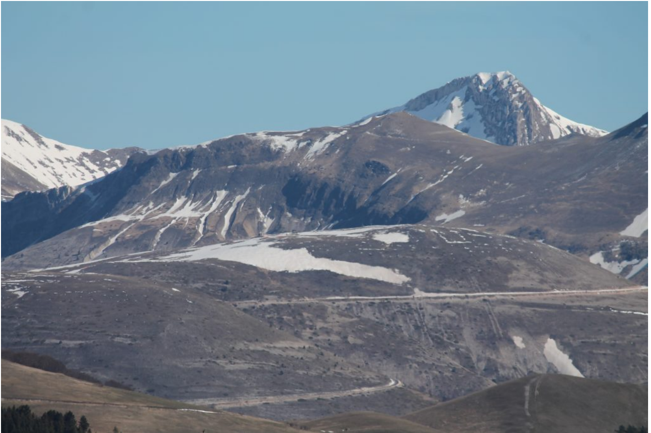
34- La Cima di Passo Cattivo al centro , il Pizzo Berro che emerge dietro, il Monte Prata sottostante in primo piano con la strada per Fonte della Giumenta.