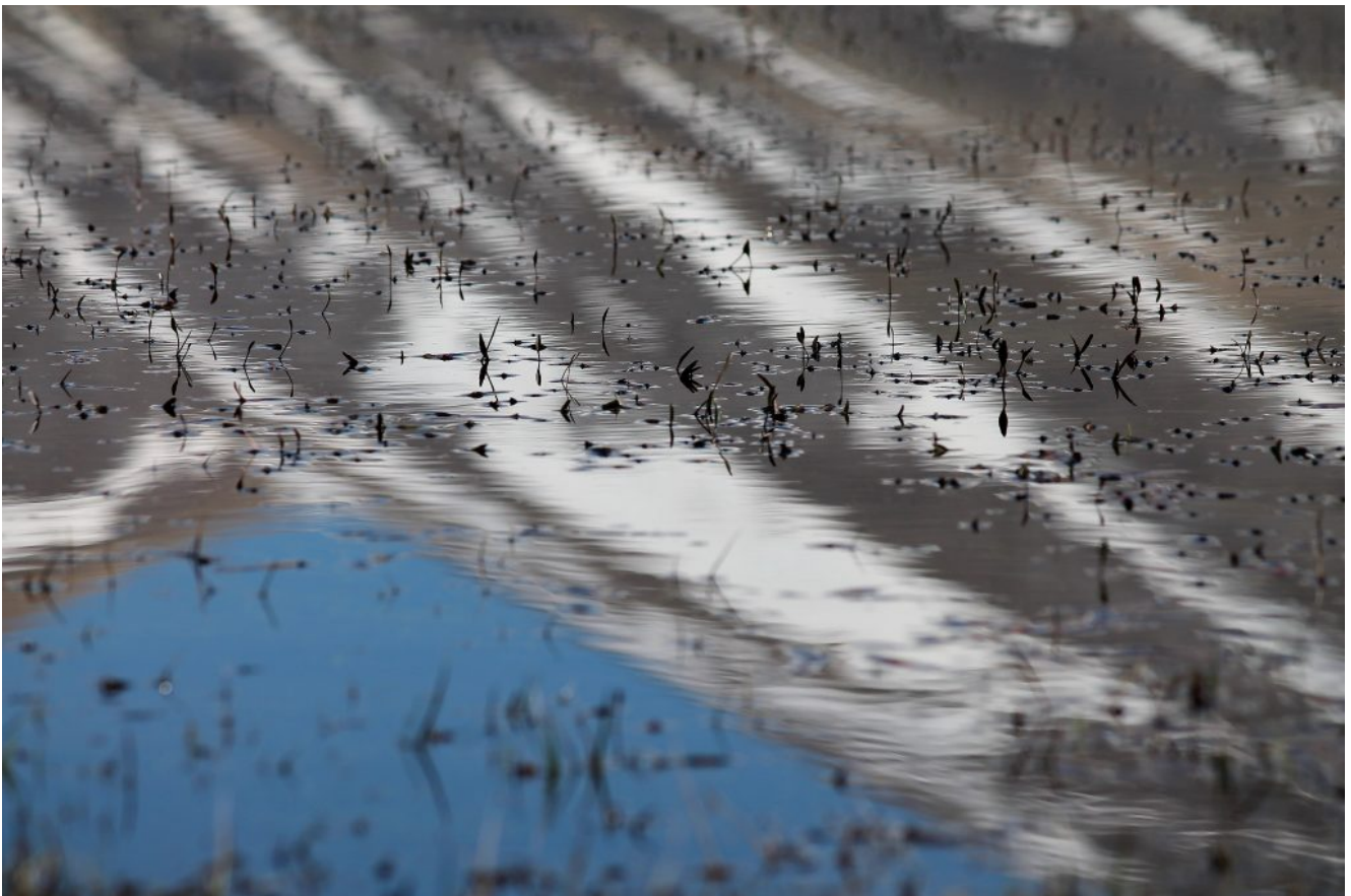
52- Dettaglio dell'erba che spunta dall'acqua dei laghetti