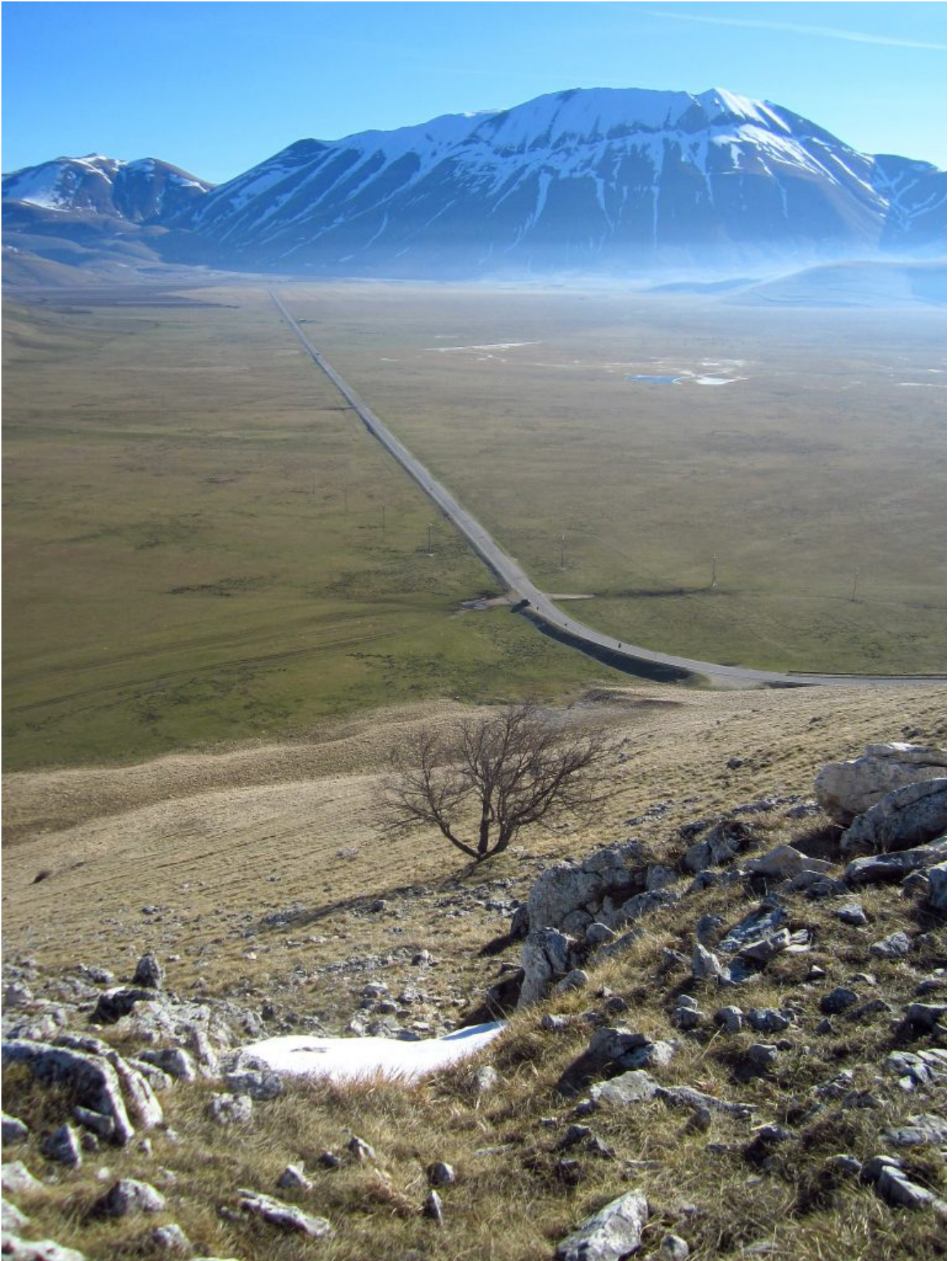
5 – 7- La strada del Piano Grande con il lungo rettilineo di 4 chilometri e la Cima del Redentore che troneggia sullo sfondo, nel piazzaleto prima della curva la mia auto.