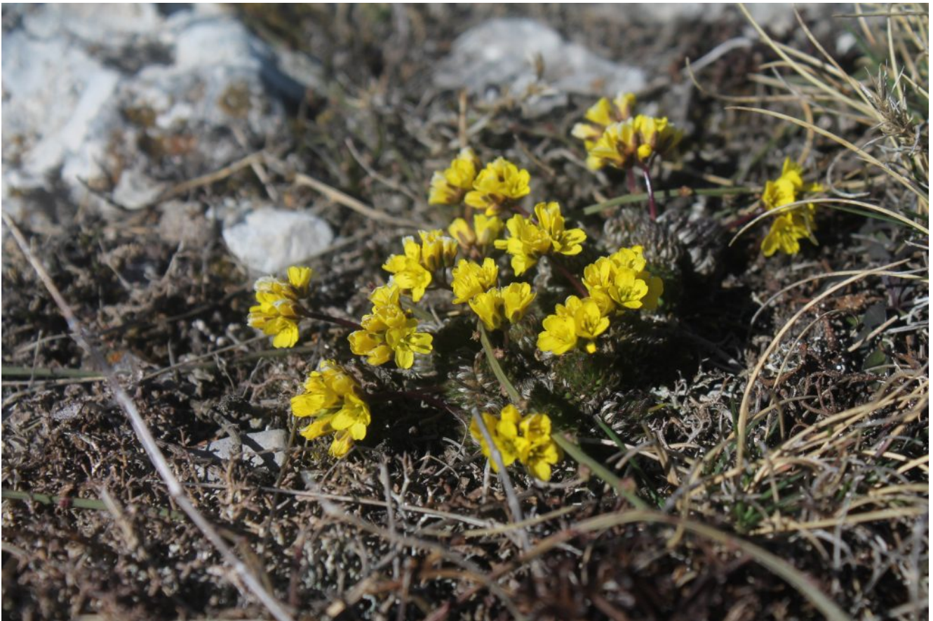
17- Primi fiori primaverili: Draba aizoides