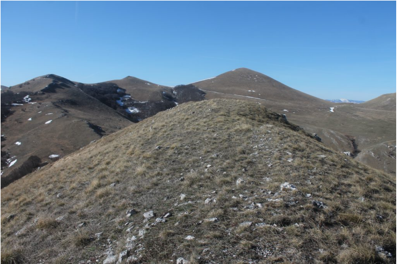
16- Dalla cima del Monte Castello, il Castellaccio a sinistra ed il Monte Ventosola a destra.