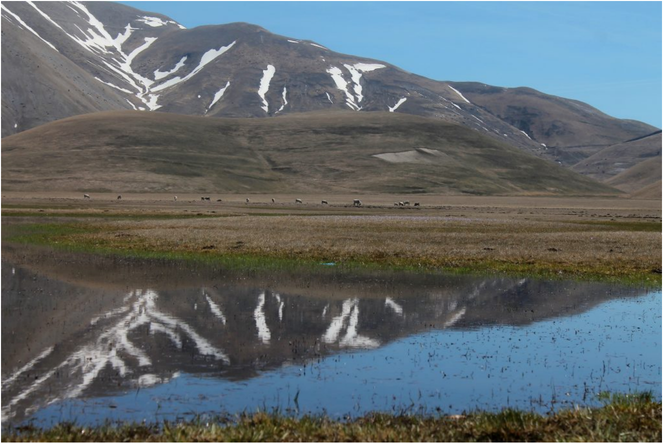
51- La cresta Forca di Presta -Monte Vettoretto e la Valle Santa sulla sinistra.