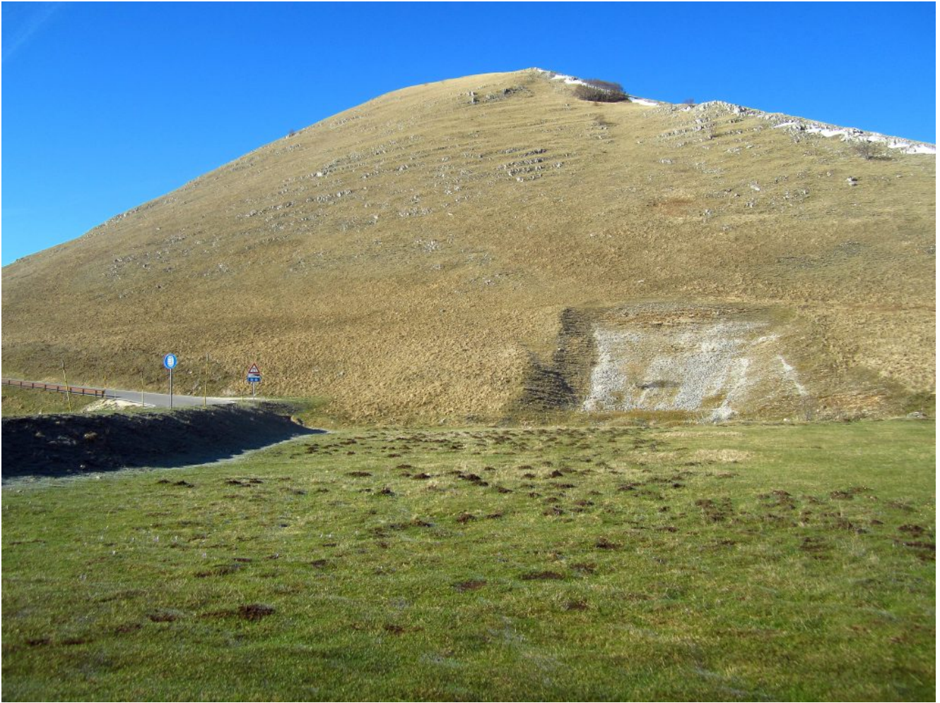
2- La curva della strada del Piano Grande da cui inizia l'itinerario proposto al Monte Castello con, a destra, la cresta di salita con rocce affioranti.