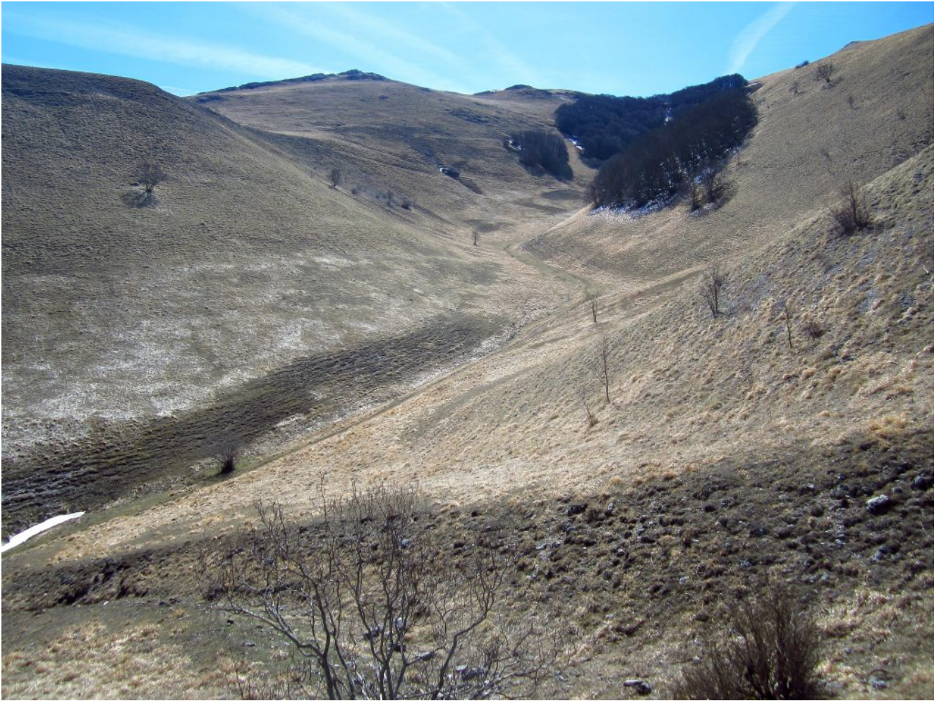
37- La Valle Caprelli ed il Castellaccio a sinistra del bosco.