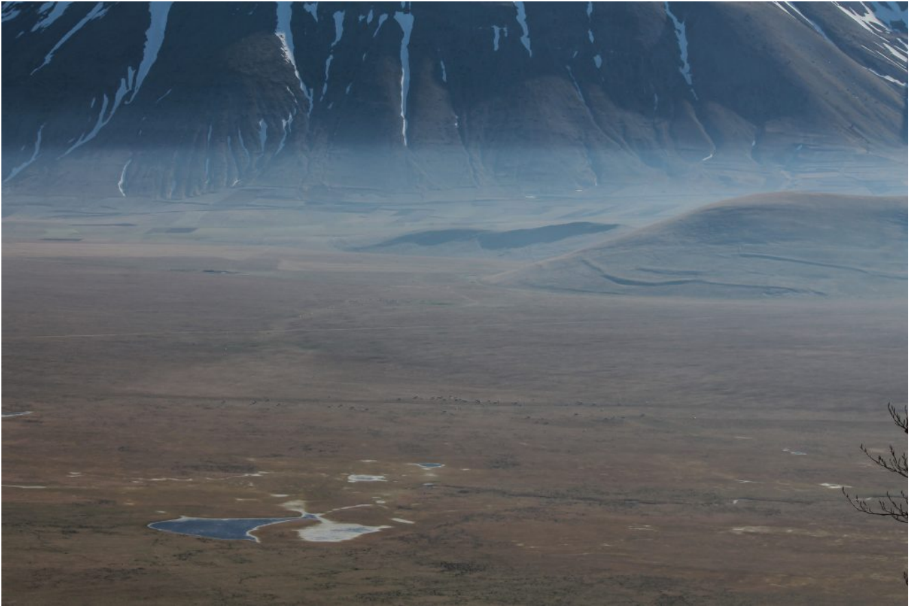
8- Foschia mattutina al Piano Grande.