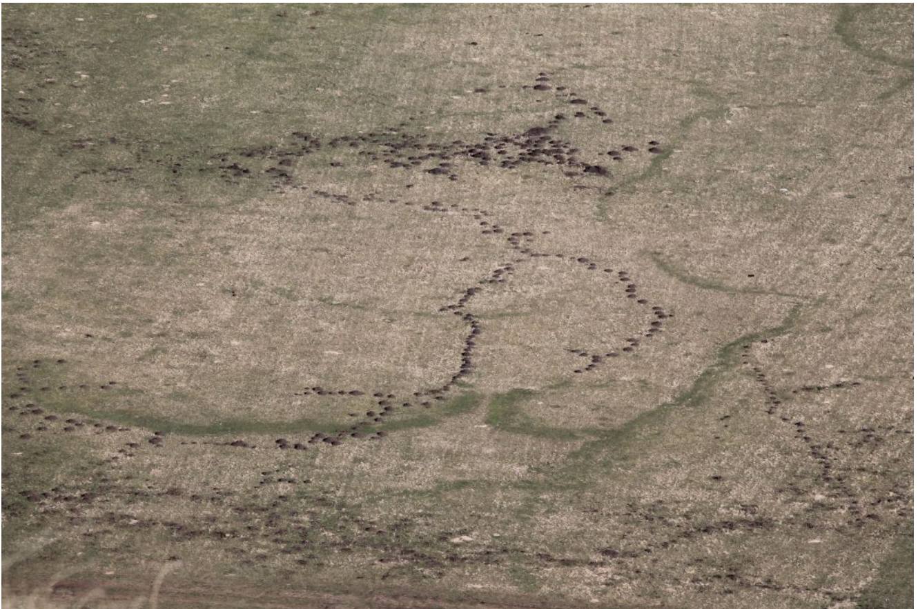
22 – 23- Buche di talpe nel Piano Grande, dall'alto si possono notare i loro tracciati sotterranei e soprattutto il numero