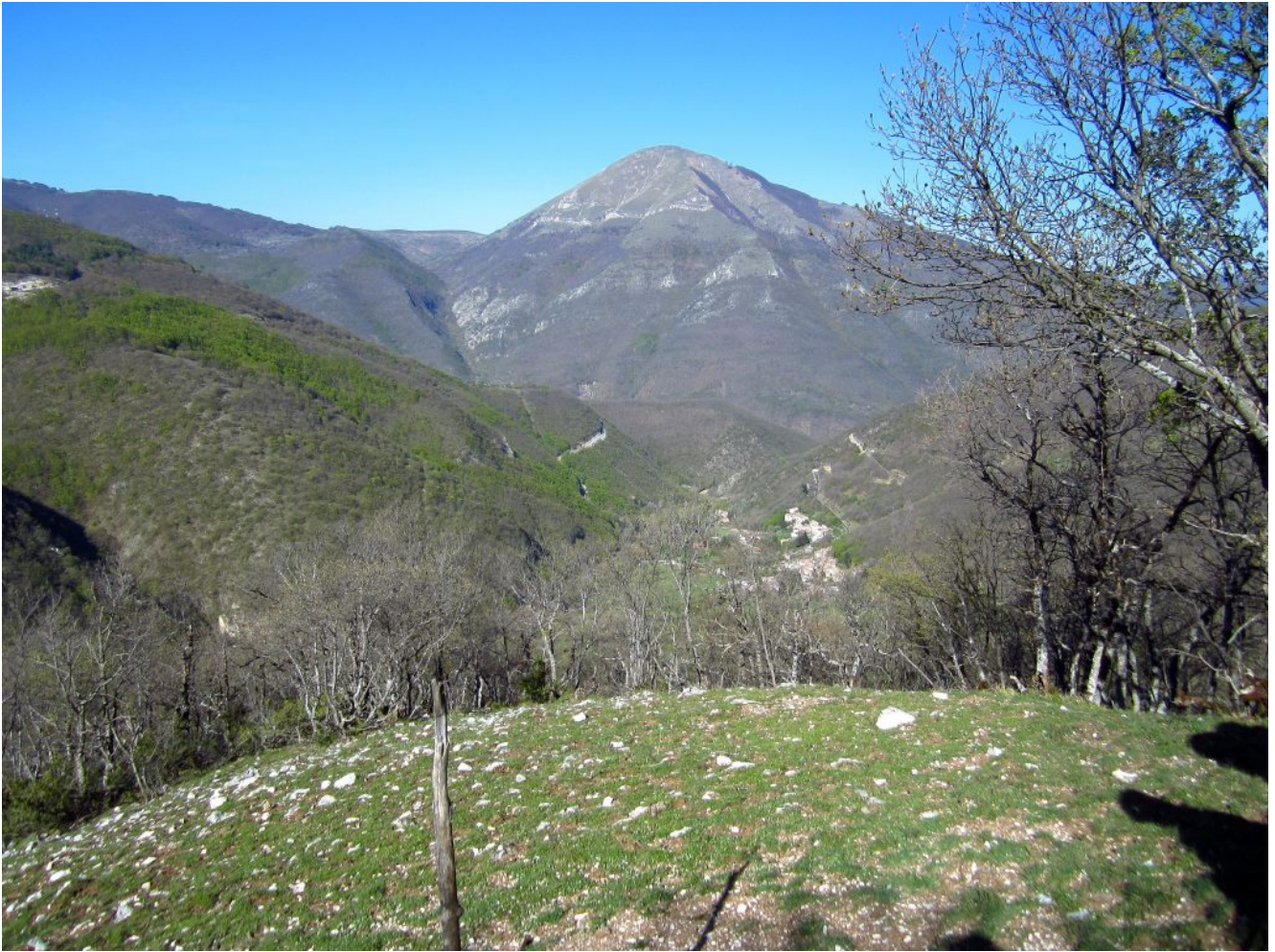
3- La prima radura nella zona “le piane” con vista sul Monte Cardosa.