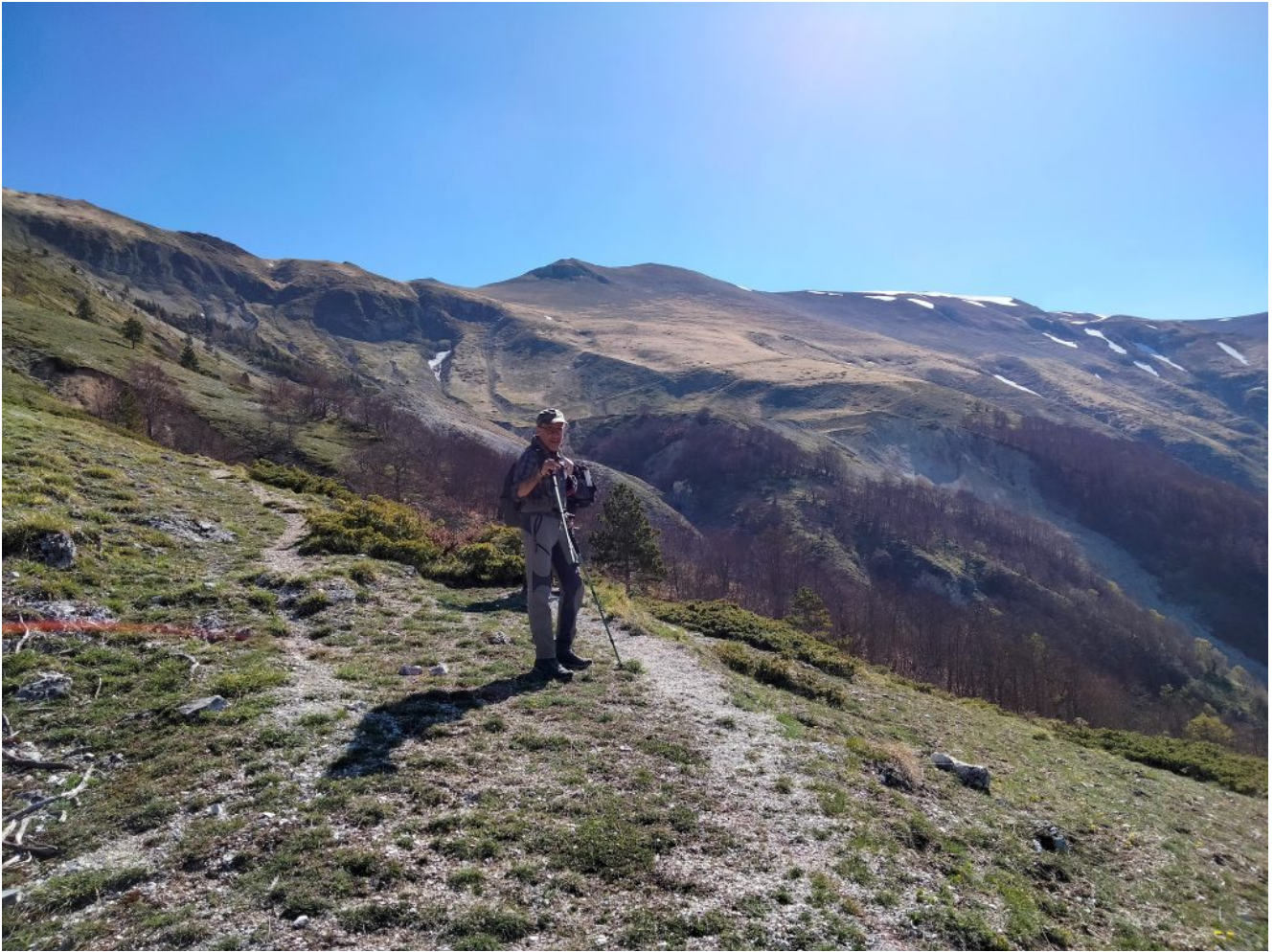
10- Il sentiero si ritrova evidente oltre la cresta rocciosa, in alto la Cima di Vallinfante, metà dell'itinerario proposto.