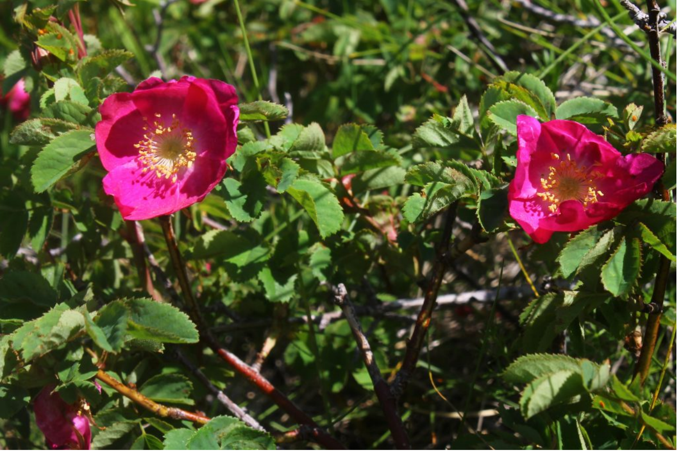
11- Le rose rosse