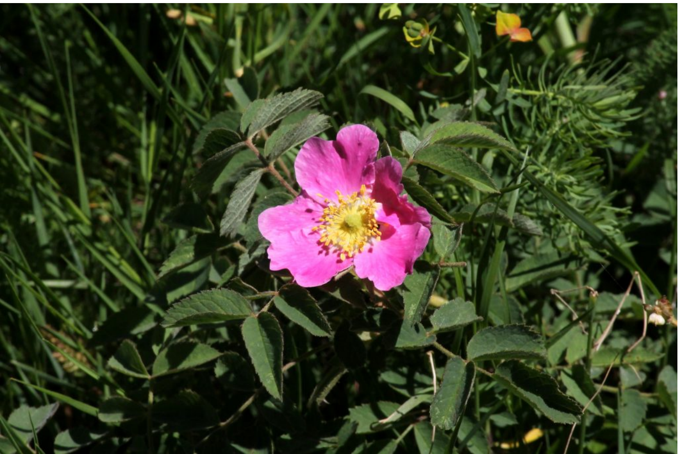
12- 14- E le rose in diverse tonalità di rosa