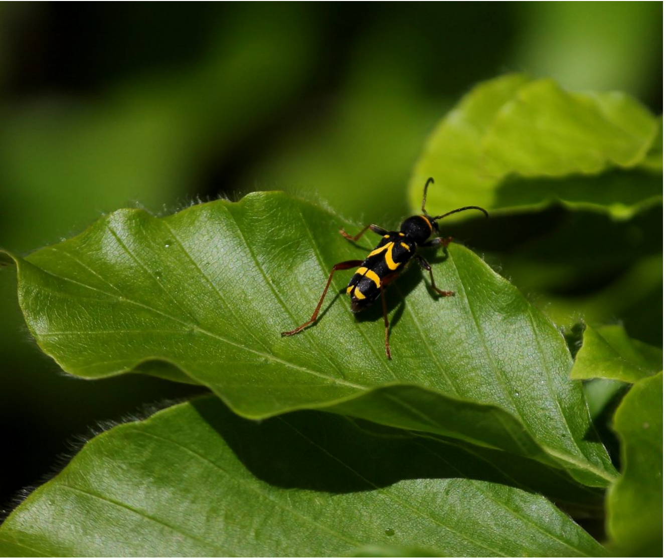
21- il Coleottero Neoclytus acuminatus