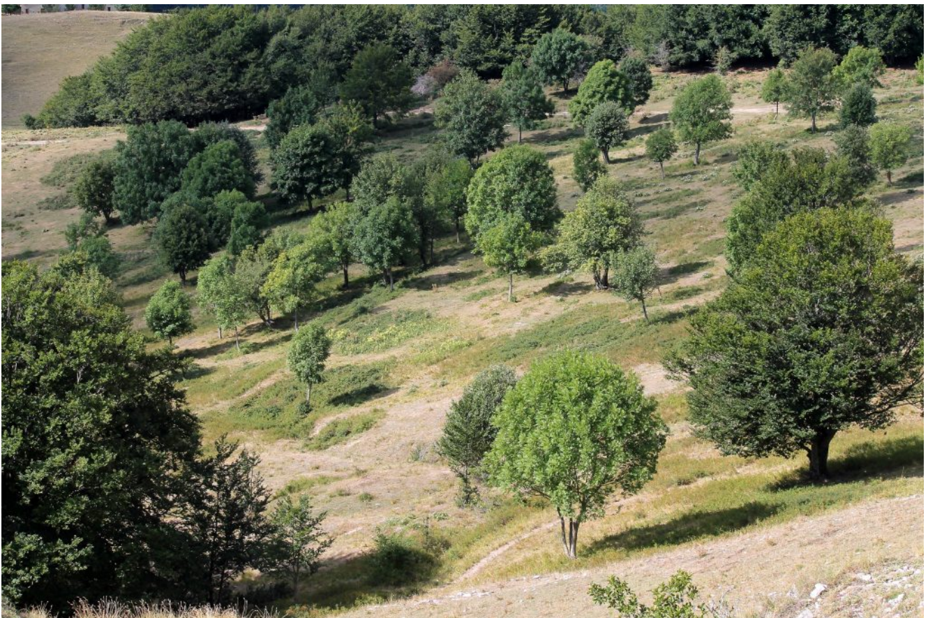
2- Le chiazze verde scuro sono i vari roseti.