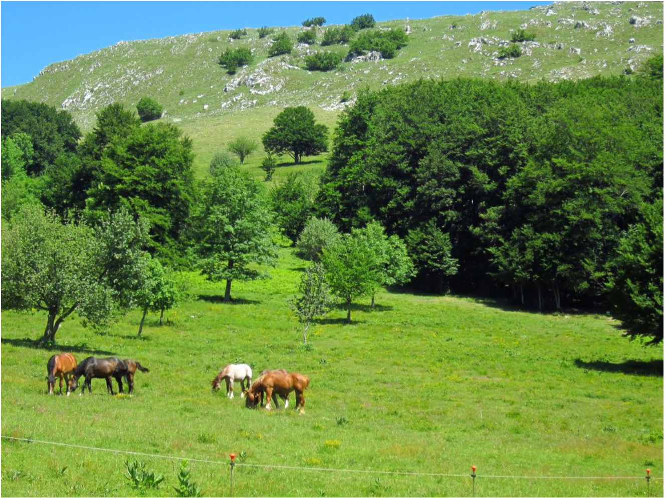
3- Il Monte Valvasseto ed i Piani Gra con cavalli al pascolo.