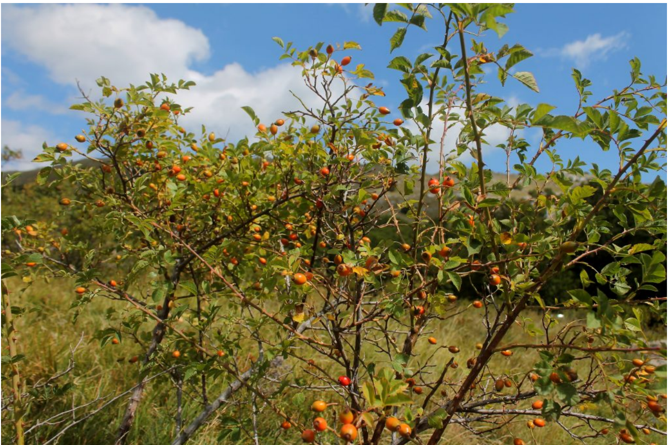
8-9- I classici Cinorroidi della Rosa Canina, usati per la preparazione di ottime confetture.