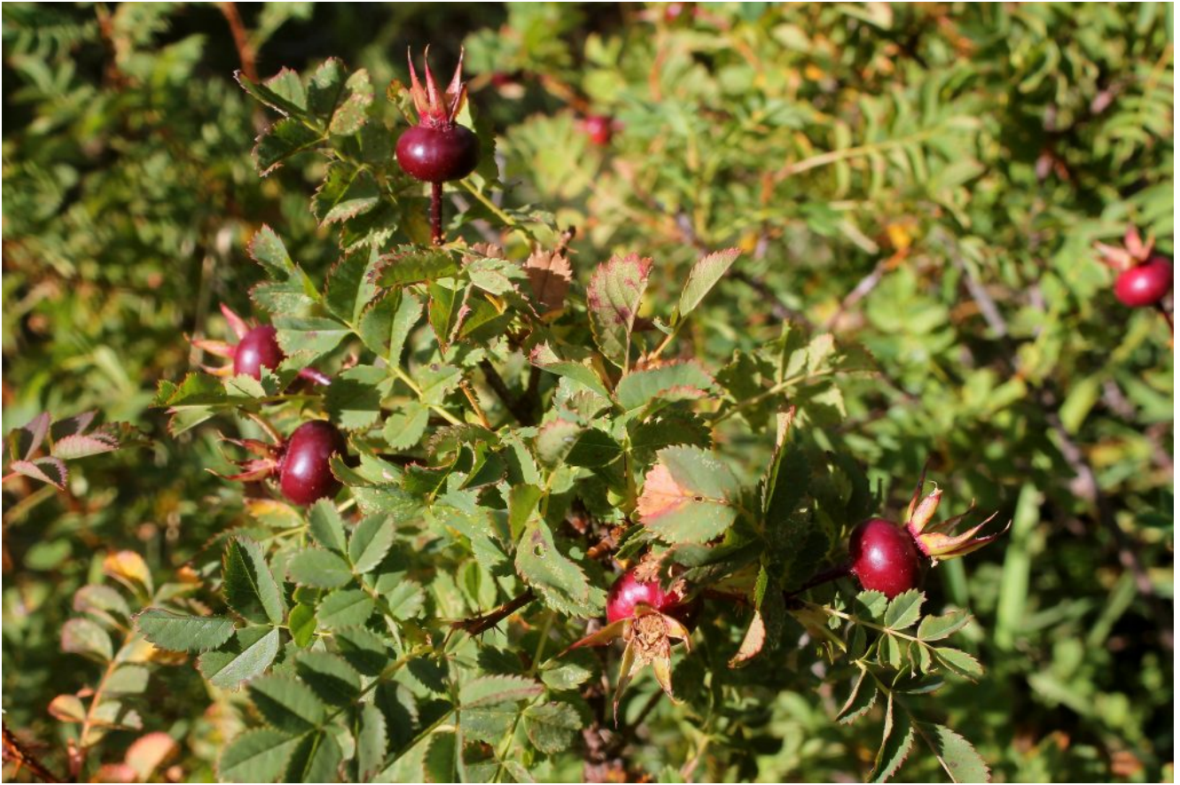
3- I cinorroidi rosso scuro