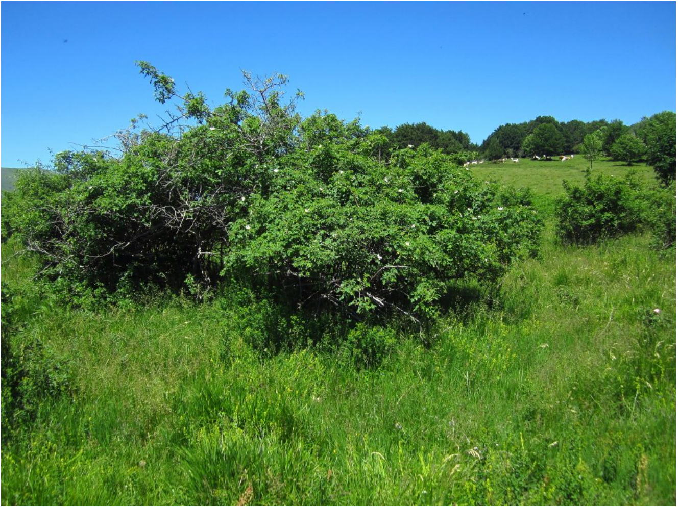
5- Alcune piante di rose canine sono sicuramente secolari.