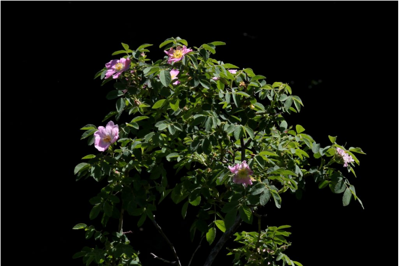
15- 16- E le rose canine, le ultime a fiorire