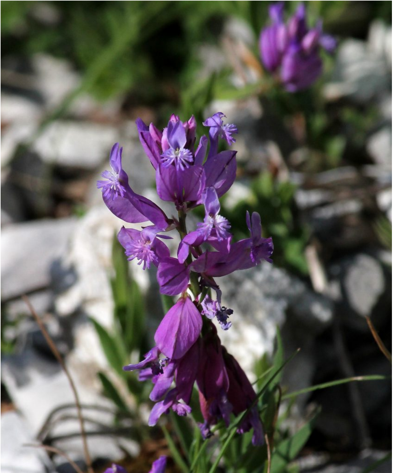
19. Il particolarissimo fiore della Polygala.