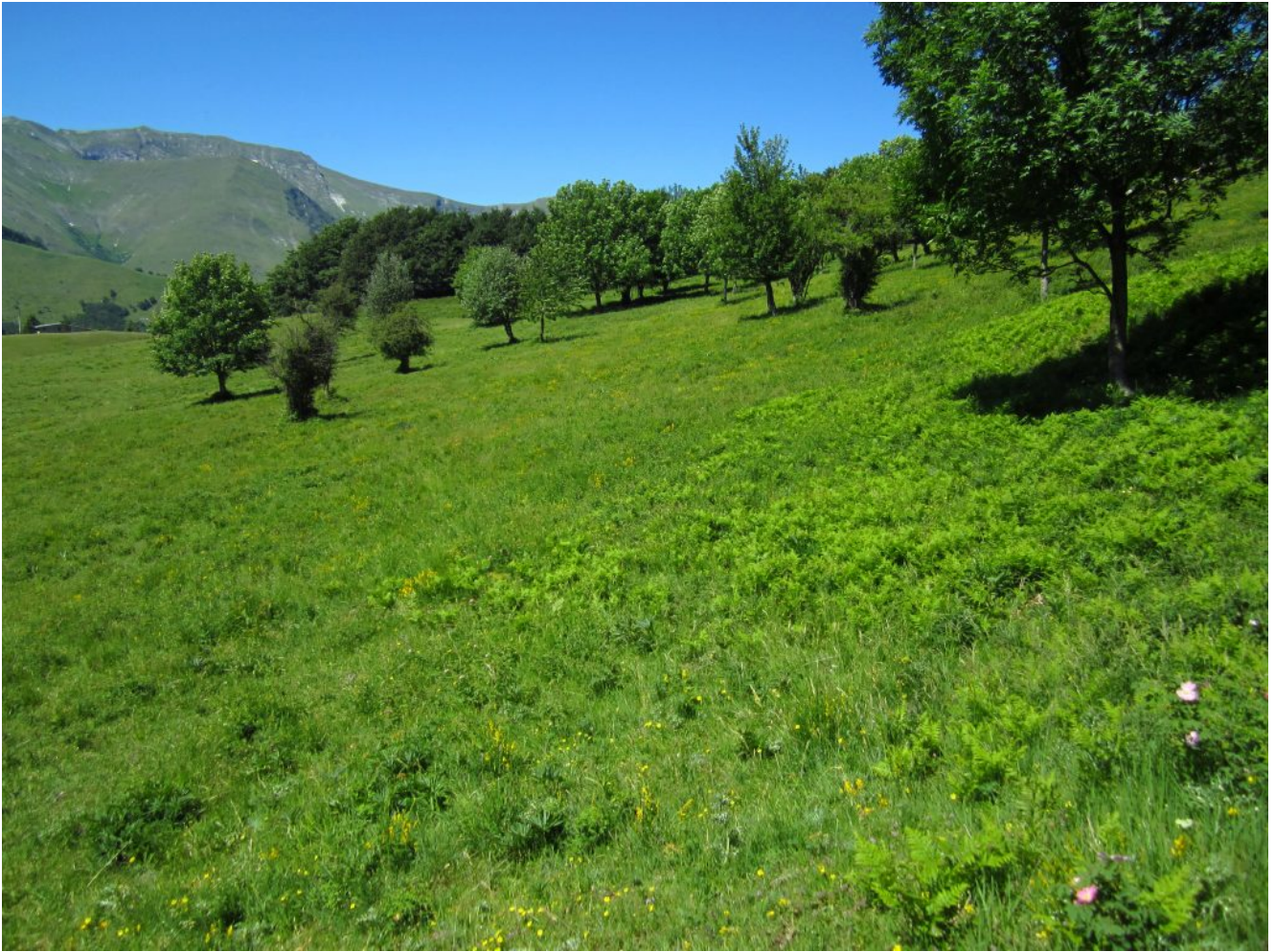
1- I Piani Gra con il versante Est del Monte Rotondo sullo sfondo