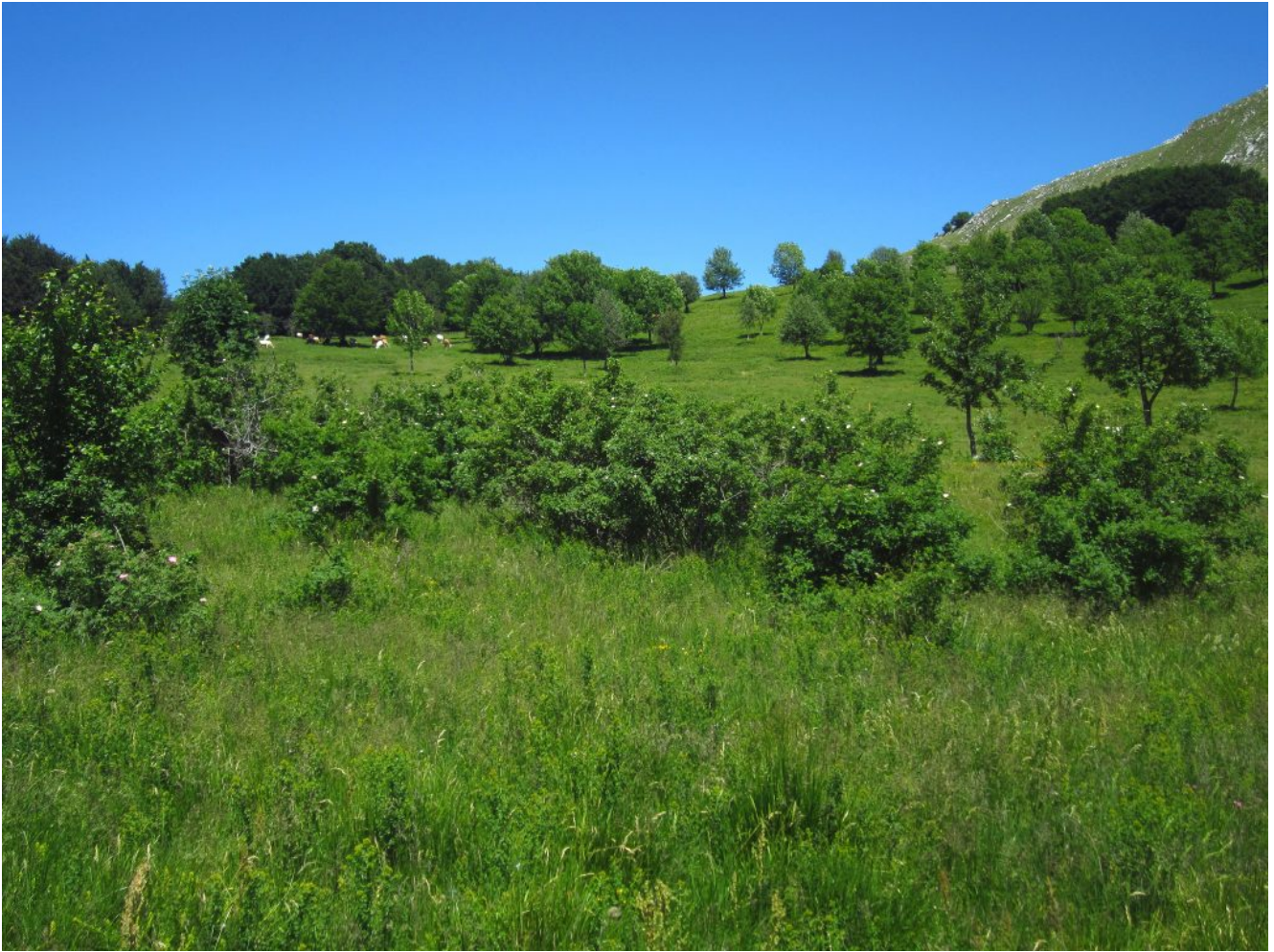
4- Le grandi Rose canine al margine sud dei Piani Gra