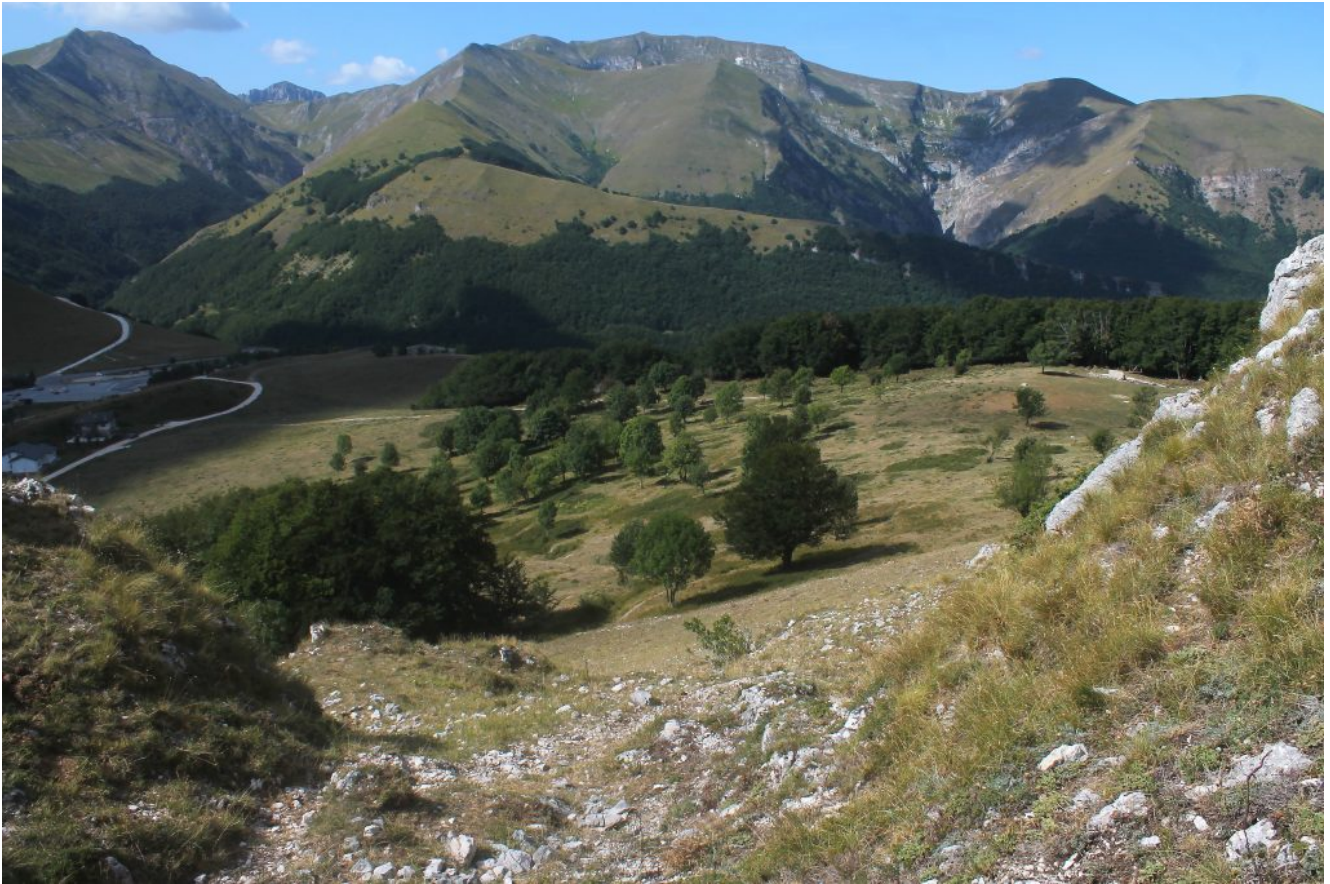
1- I Piani di Grà visti dal Monte Valvasseto.