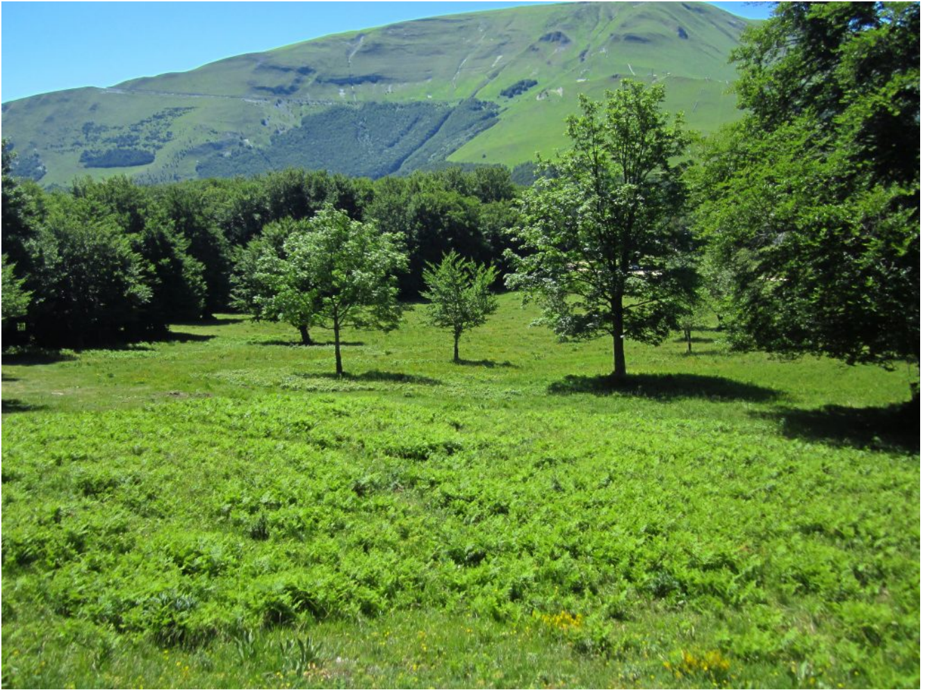
2- I Piani Gra con il versante Nord del Monte Castel Manardo.