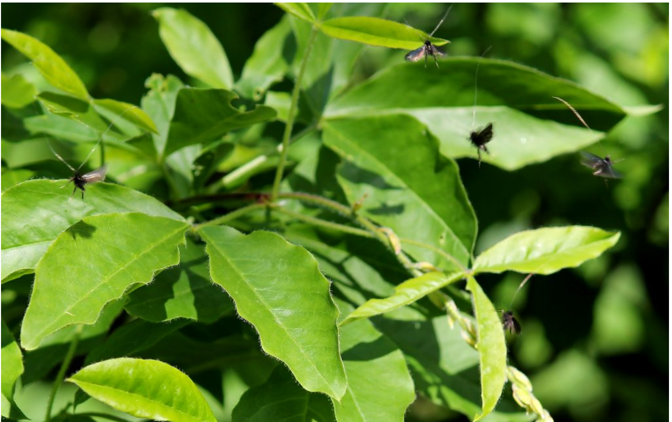
24-25- Quando volano in gruppo si assiste ad una danza anche