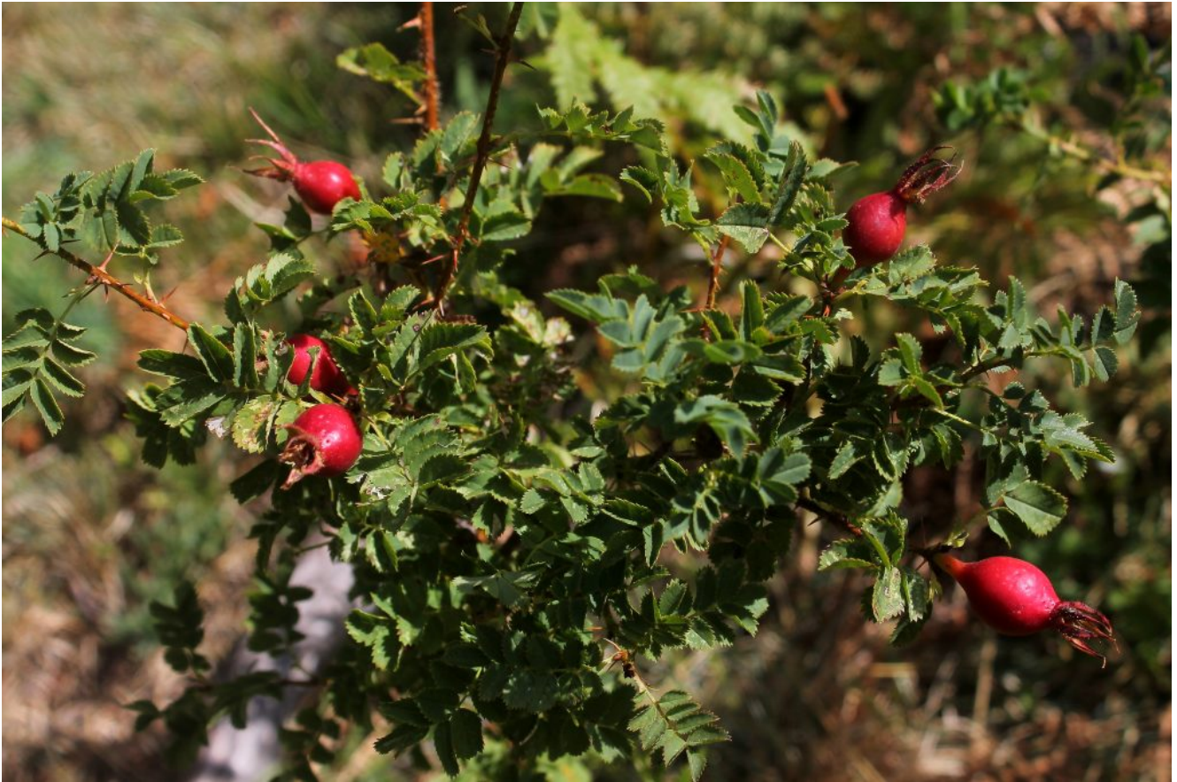
7- I Cinorroidi oblunghi