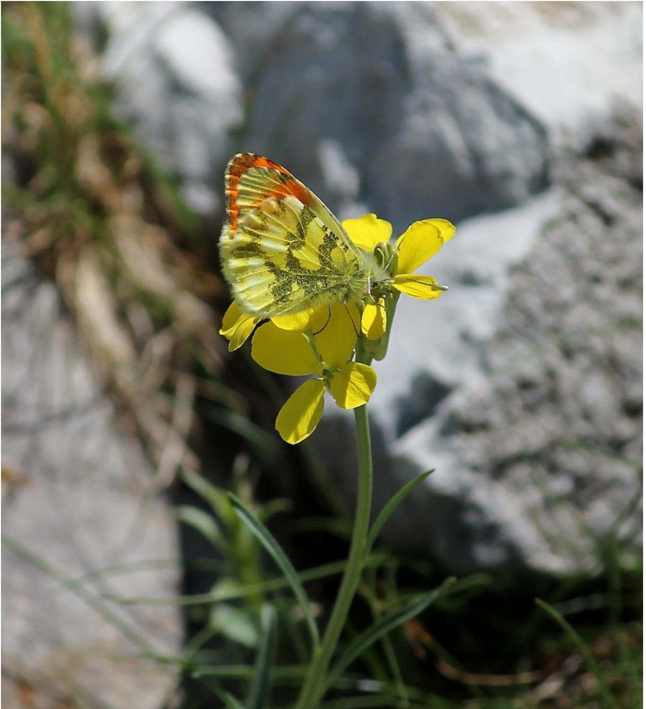
20- In zona è presente anche il raro Lepidottero Anthocaris euphenoides