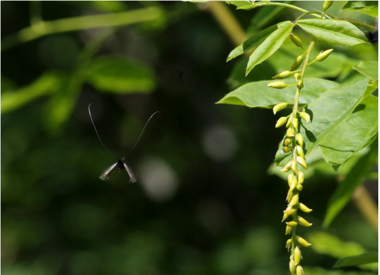
23- In volo anche se sfuocata, le dimensioni delle antenne sono ben visibili.