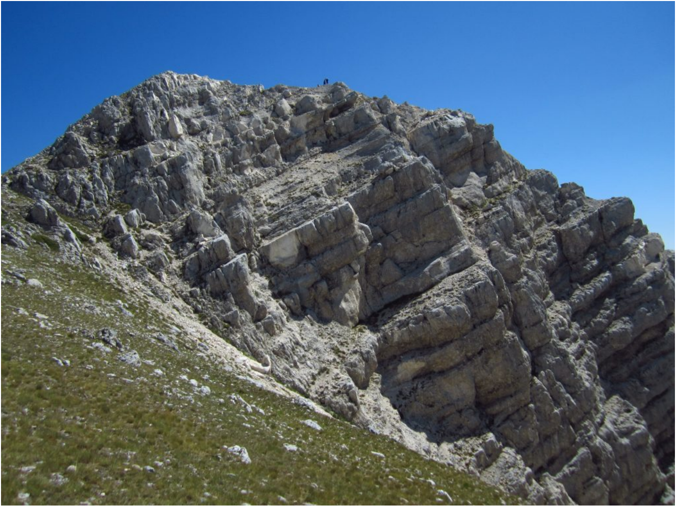
14- Le dimensioni degli escursionisti sulla cima del Sasso di Palazzo Borghese paragonate alle dimensioni della parete.