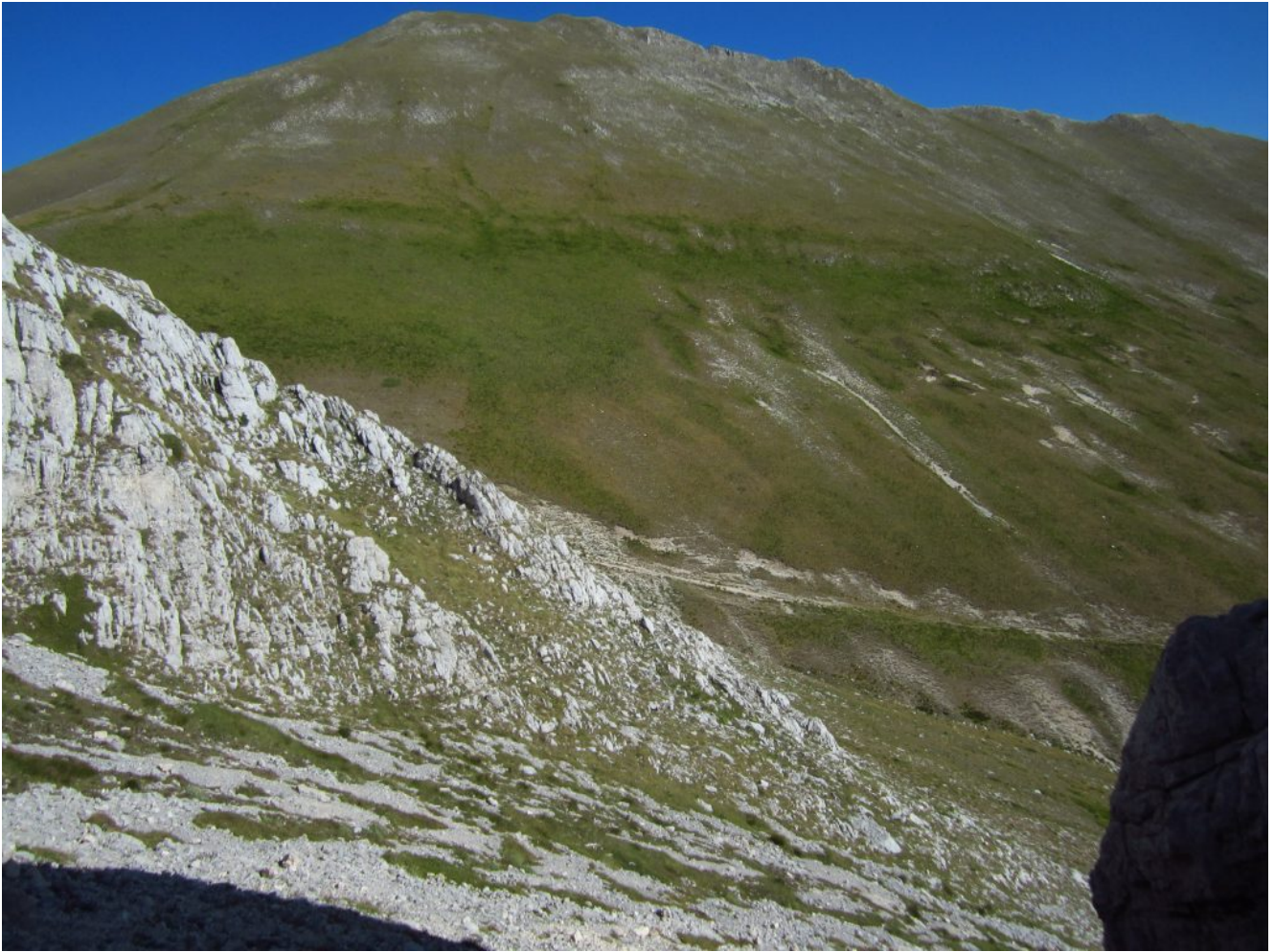
8- Il Monte Porche visto dal canalone Nord di Sasso di Palazzo Borghese.