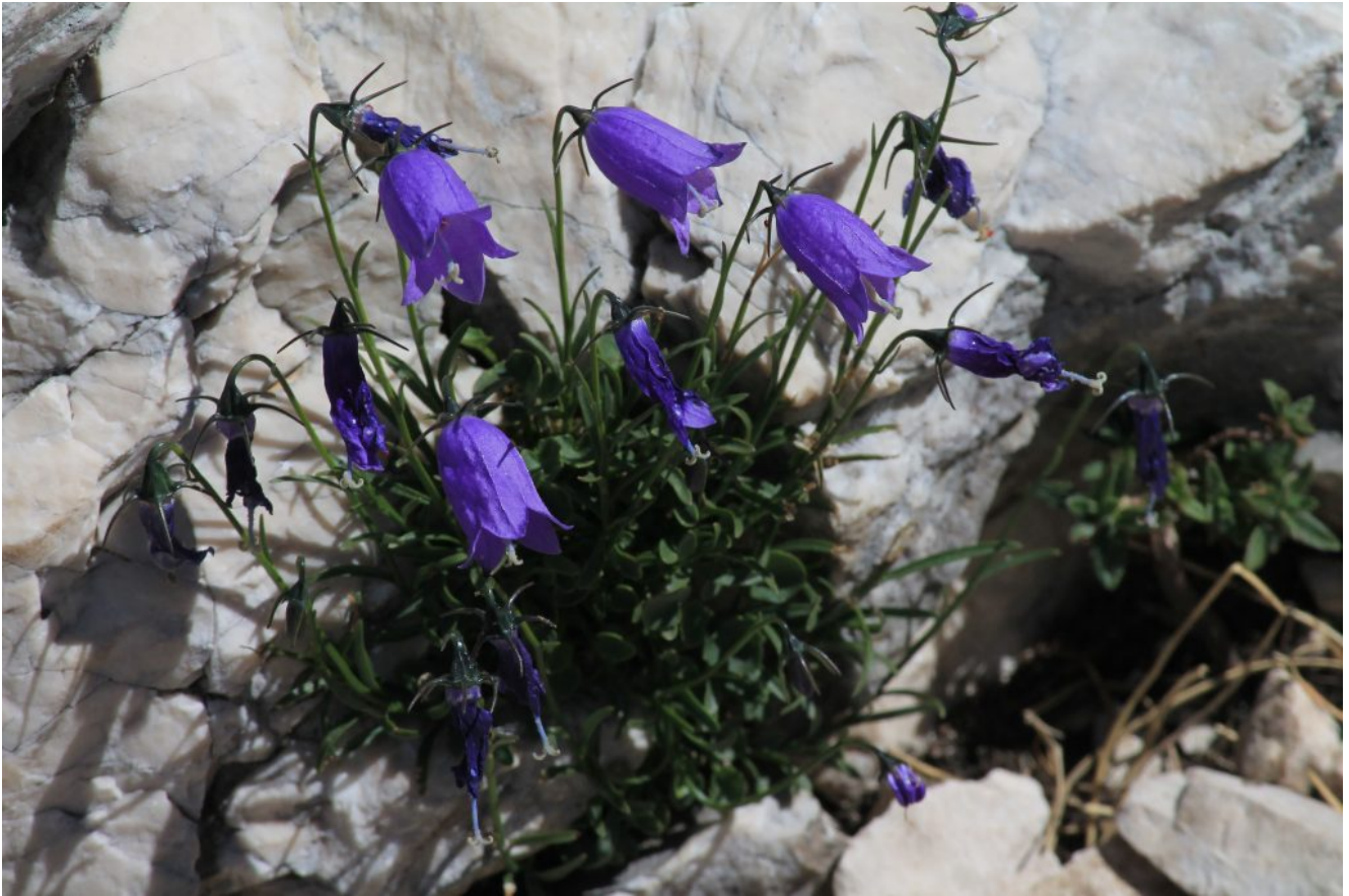
28- Campanula scheuchzeri