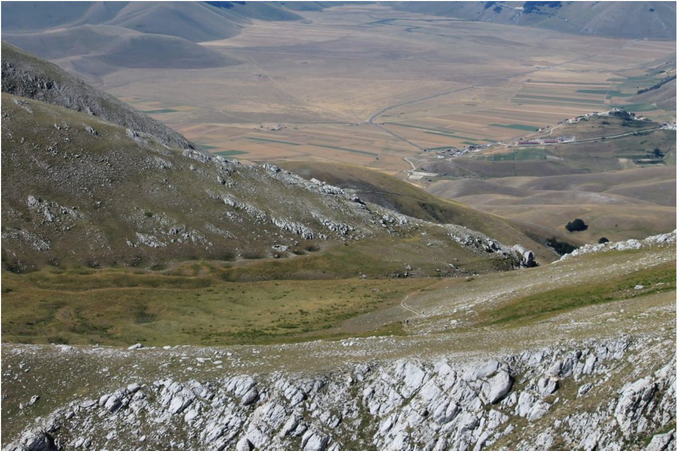
13- Il Piano Grande e Castelluccio visti dal Sasso di Palazzo Borghese.