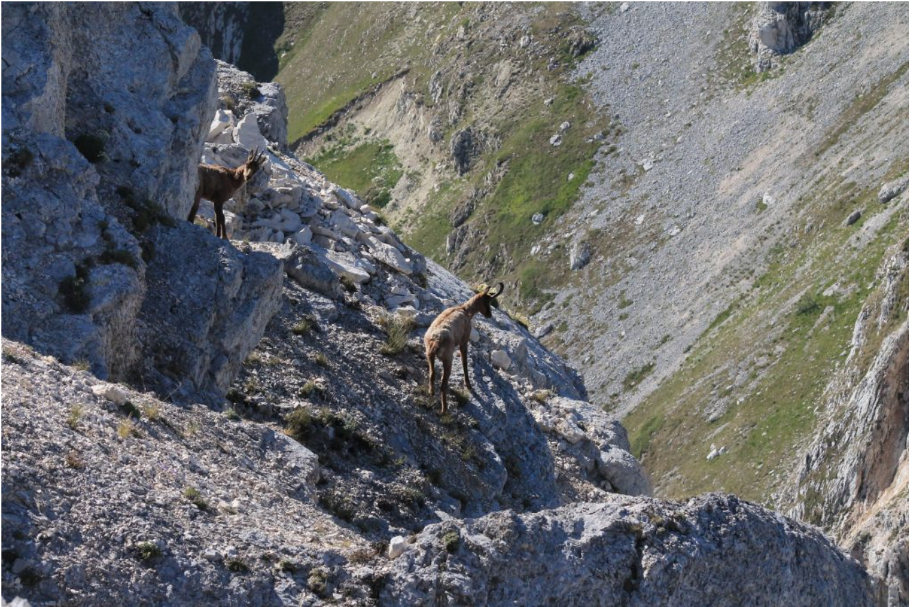
15 – 16 – 17 -Camosci nella parete Sudest di sacco di Palazzo Borghese, la prima volta che li vedo in questa zona.