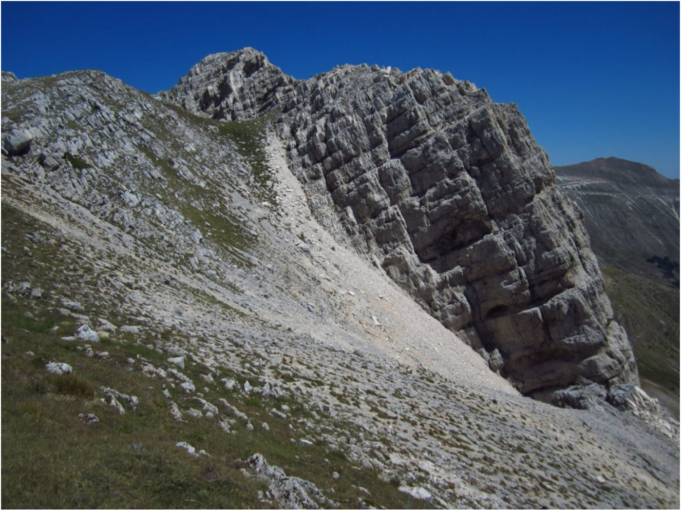
21- La cima gemella, più piccola e situata più a Sud, a destra il Monte Sibilla.