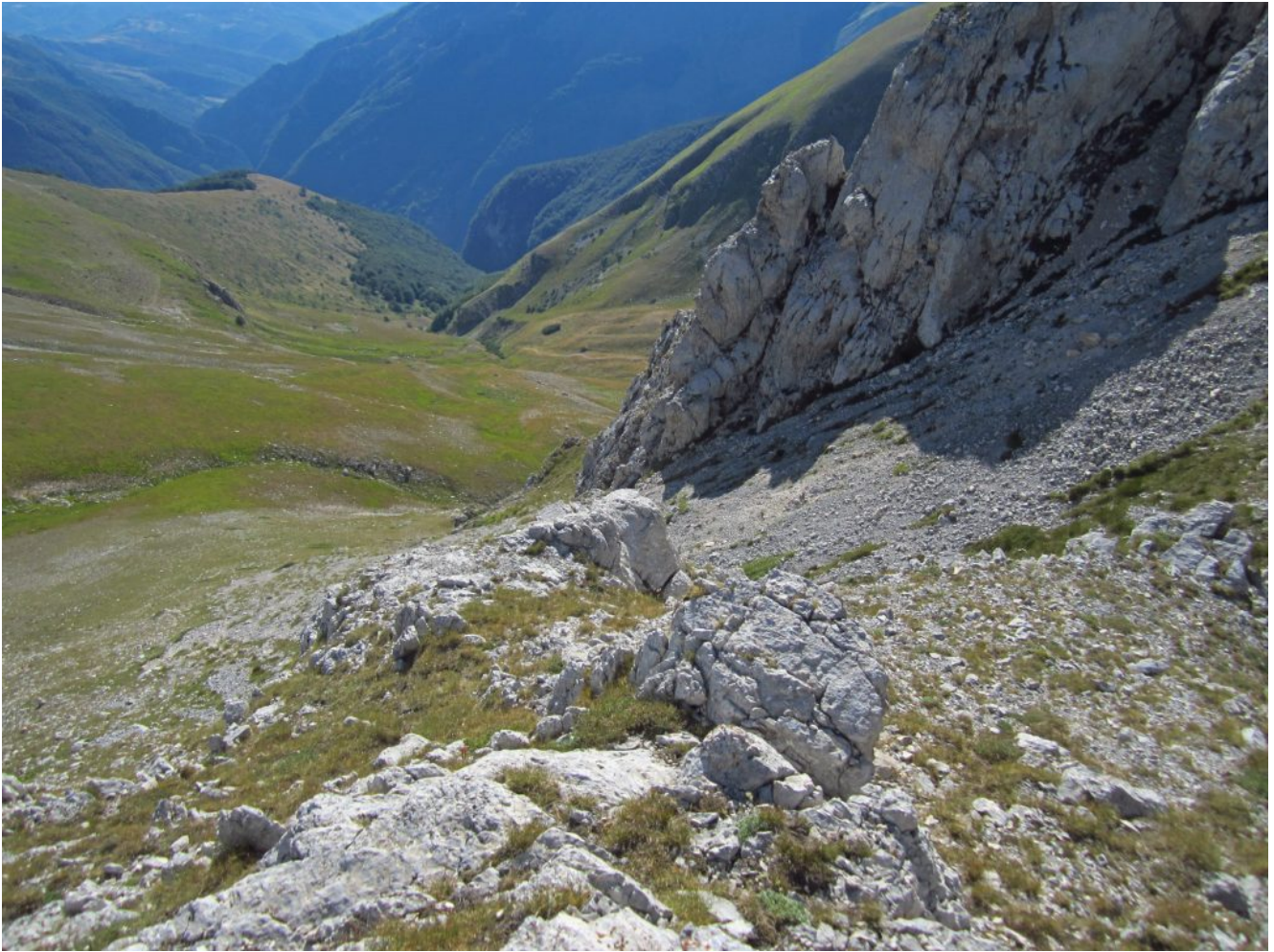
6- fase di discesa dalla sella di Monte Palazzo Borghese all'attacco del canalone Nord.