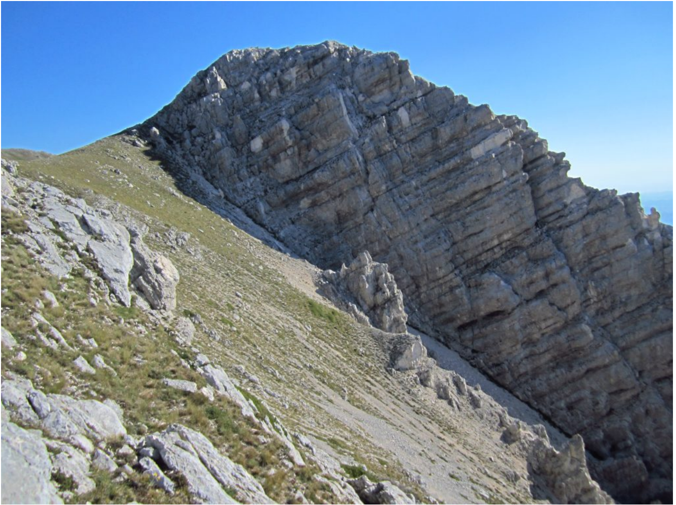
3 – 4 -La parete il canalone Est del Sasso di Palazzo Borghese.