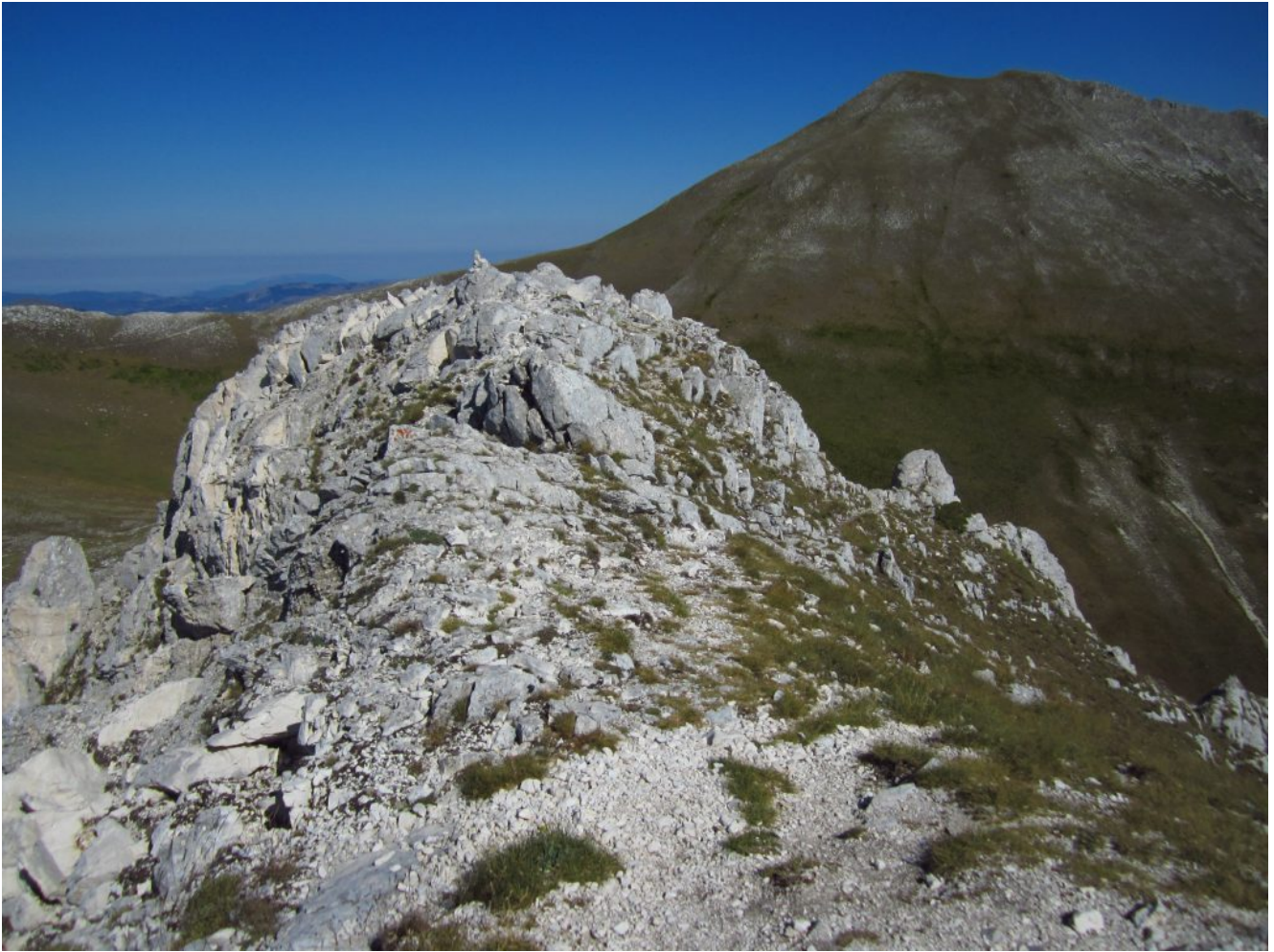
11- La cima del Sasso di Palazzo Borghese con i massi smossi e spaccati dal terremoto del 2016.