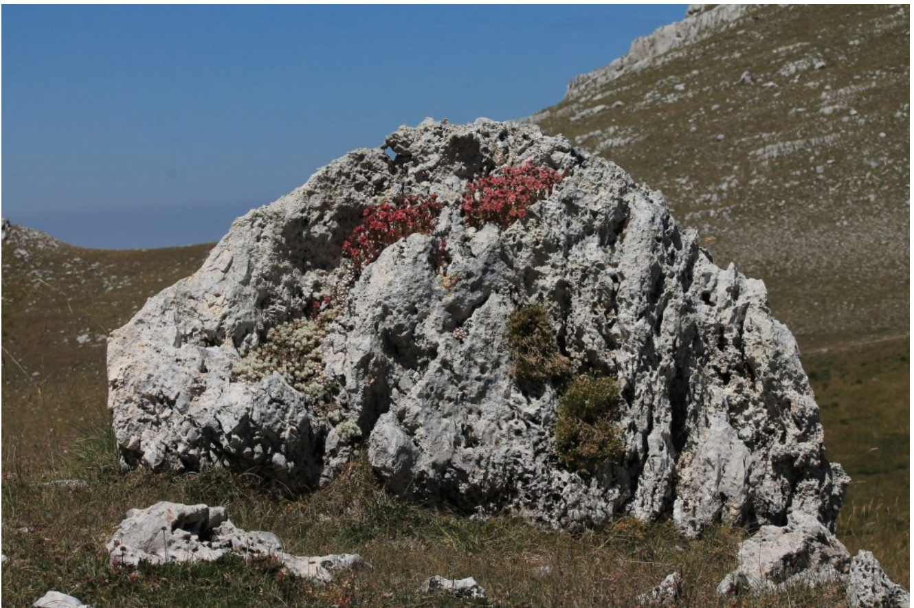
29- Masso isolato nella valletta tra Monte Argentella e Monte Palazzo Borghese con Sempervivum arachnoideum