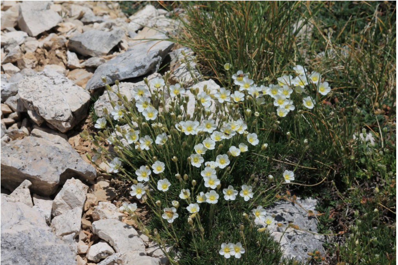
24- Cherleria (ex Minuartia ) capillacea