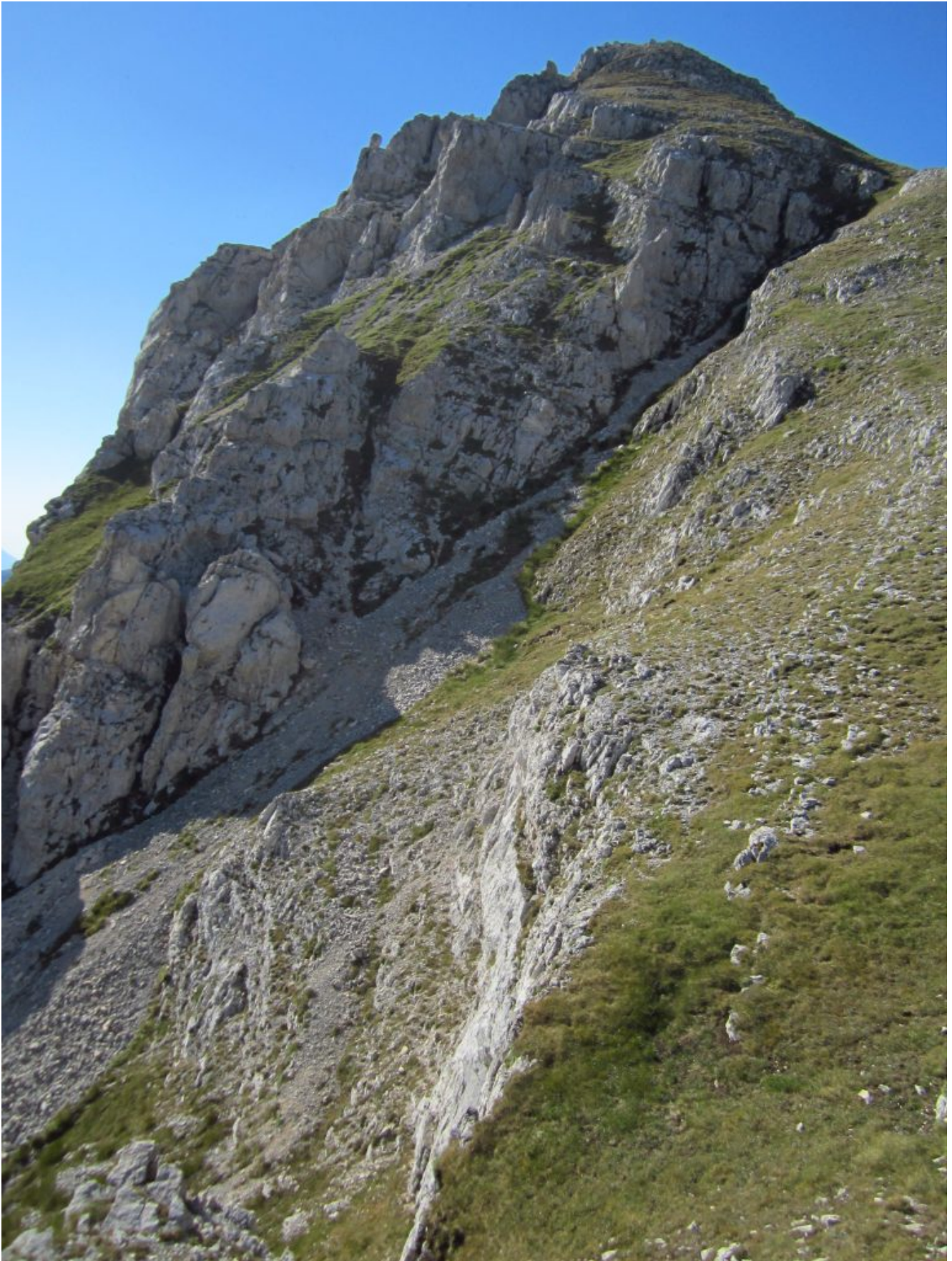
5- La stretta parete Nord di sasso di Palazzo Borghese con il ghiaioso canale di salita estiva ed invernale, al centro della fascia rocciosa il canalino roccioso che ho risalito per prendere i pendii erbosi paralleli al canale Nord.