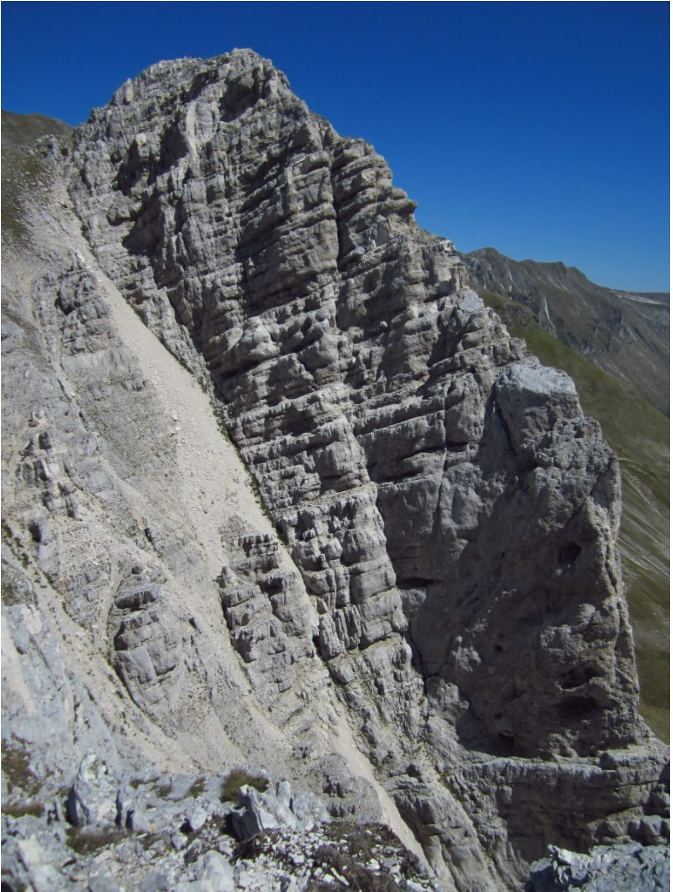
20- L'intera parete Sudest di Sasso di Palazzo Borghese con il ripido canalone est già salito da noi, vista dalla cima gemella.