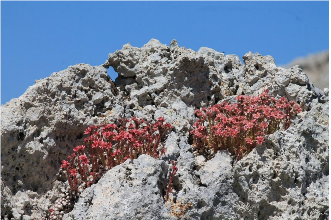
30- Dettaglio della foto n.29