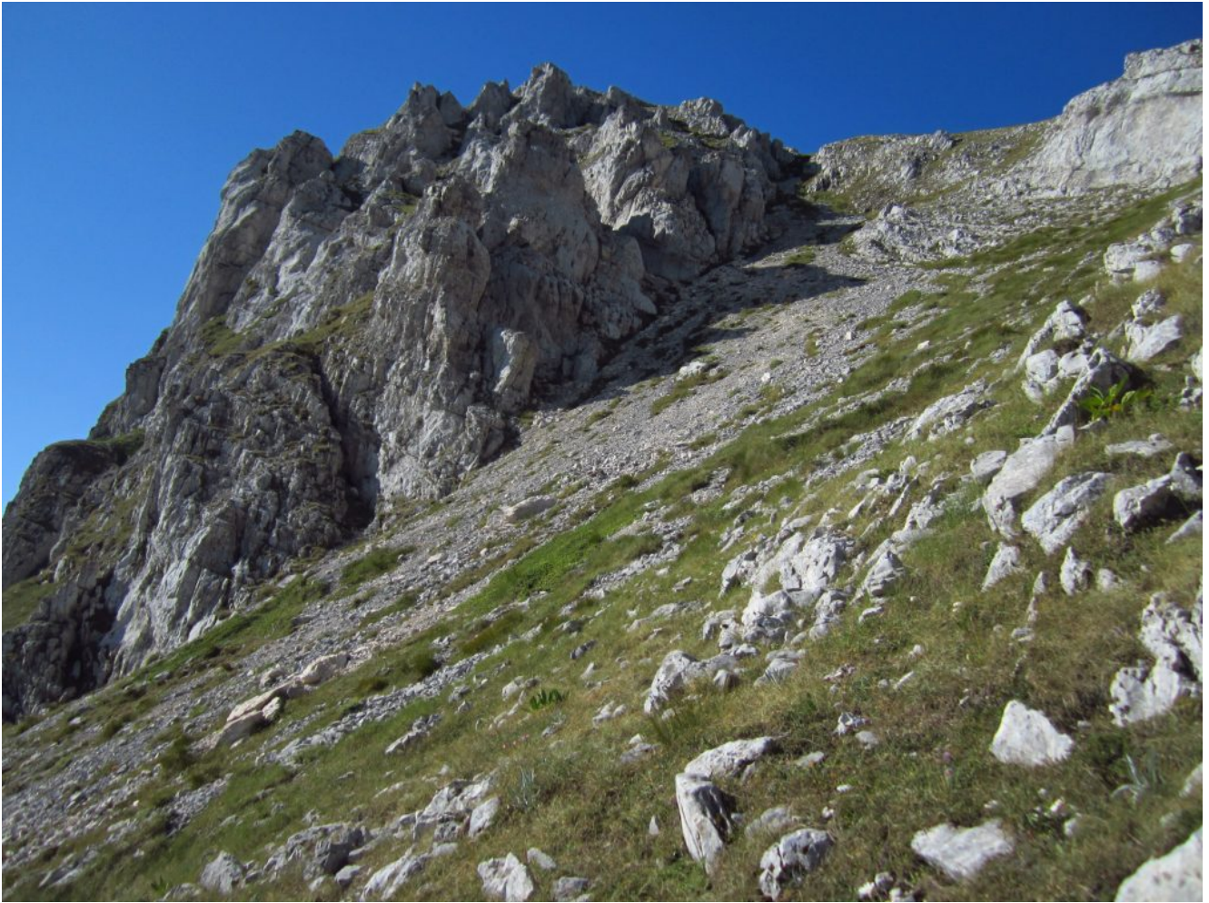
7- Inizio della salita del canalone Nord.