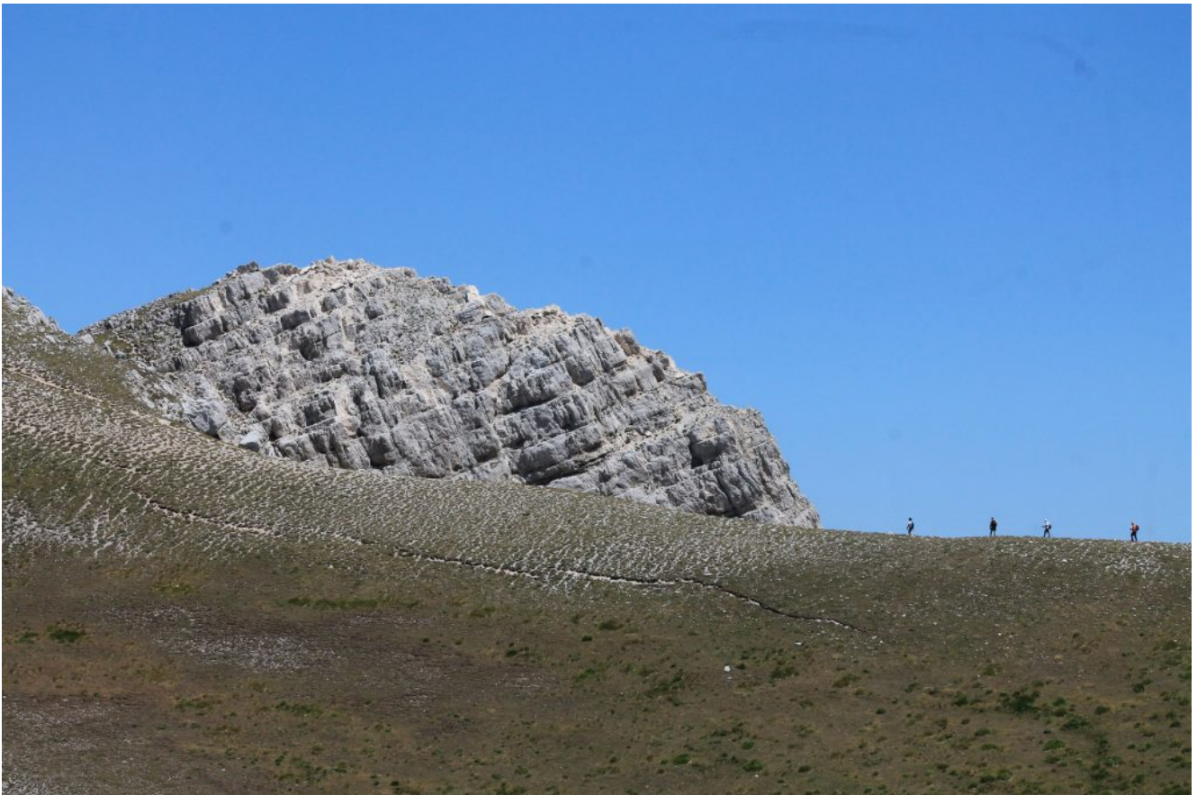
23- La cima gemella con escursionisti e la faglia aperta dal terremoto del 2016 poco sotto il sentiero di cresta.