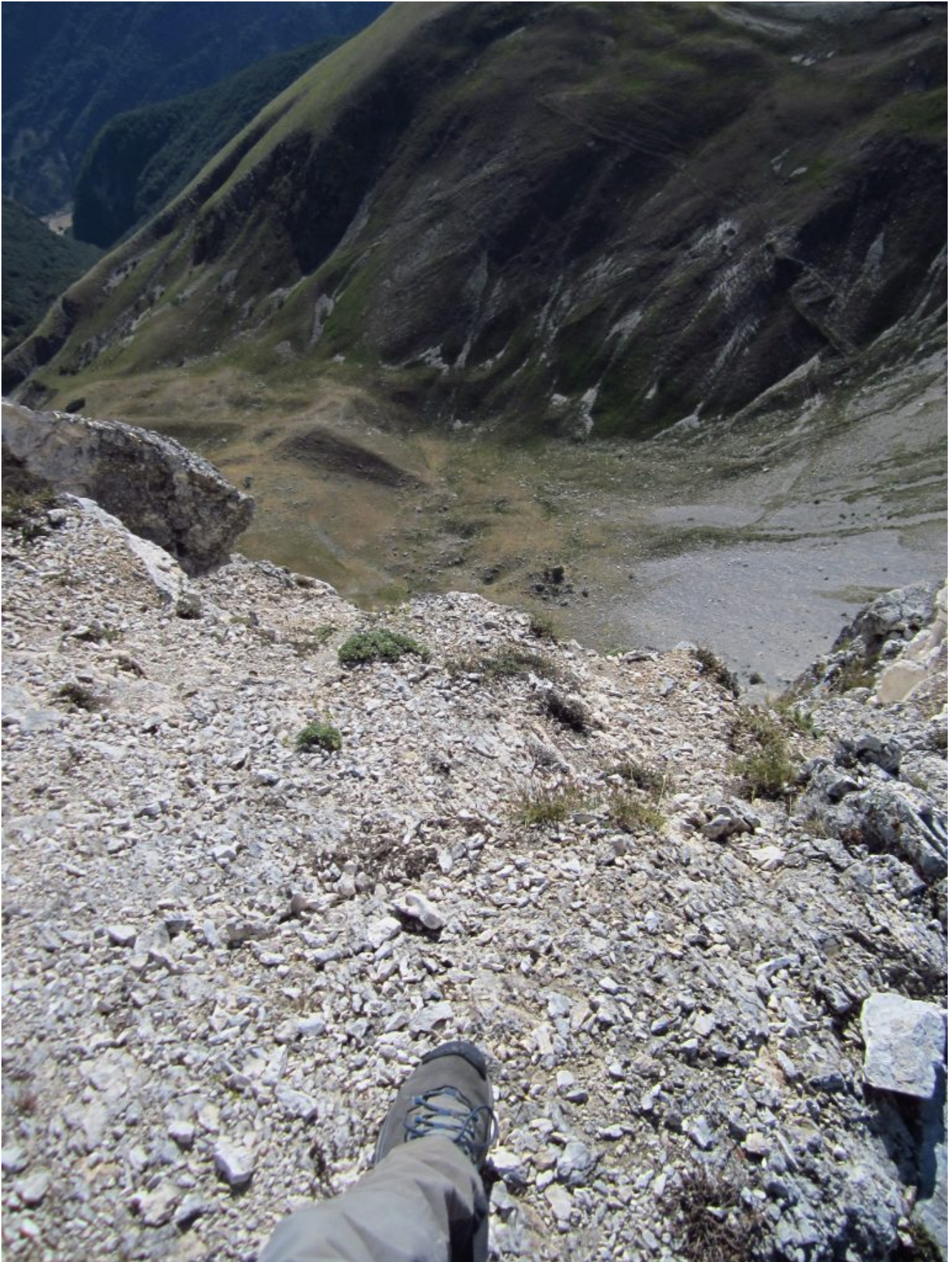
12- Veduta verticale dalla parete di Sasso di Palazzo Borghese verso il sottostante "Laghetto".