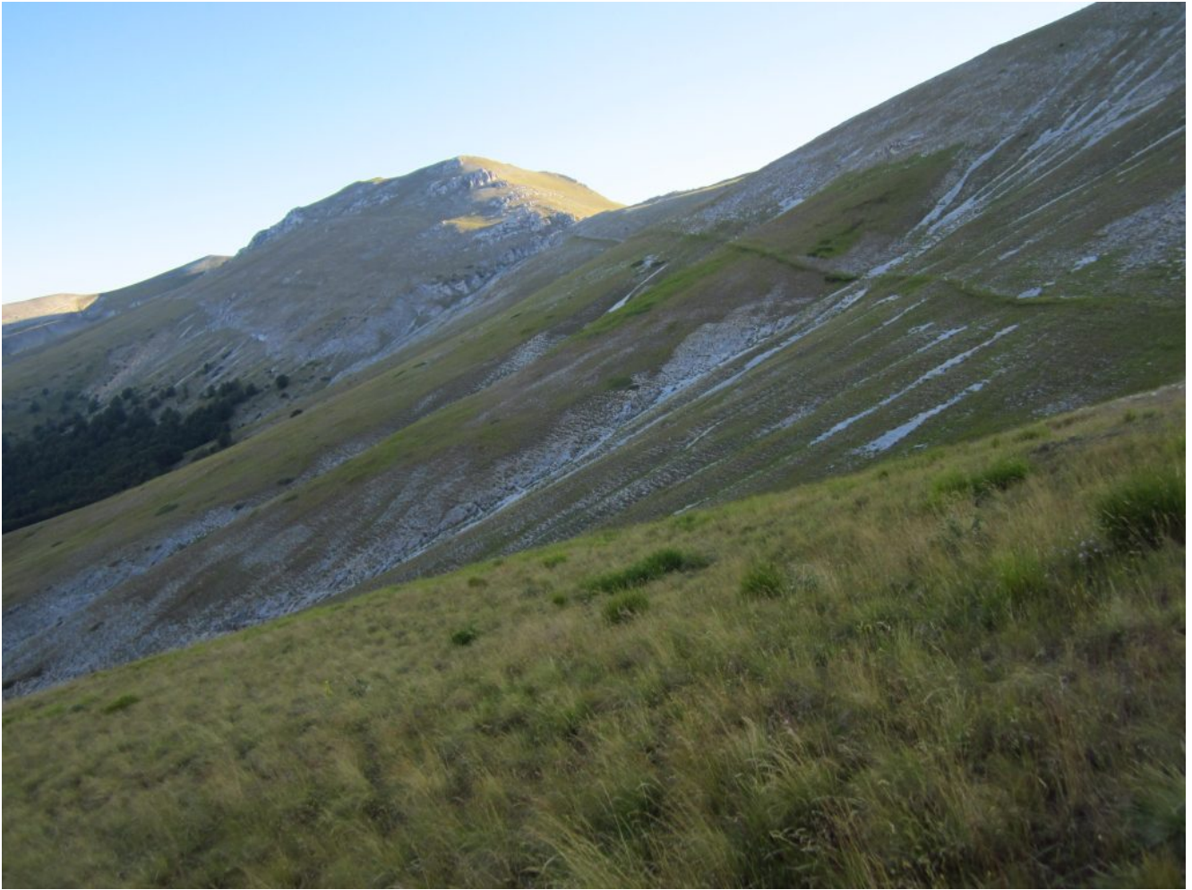
1- Il Monte Palazzo Borghese visto dal sentiero che sale da Capanna Ghezzi.