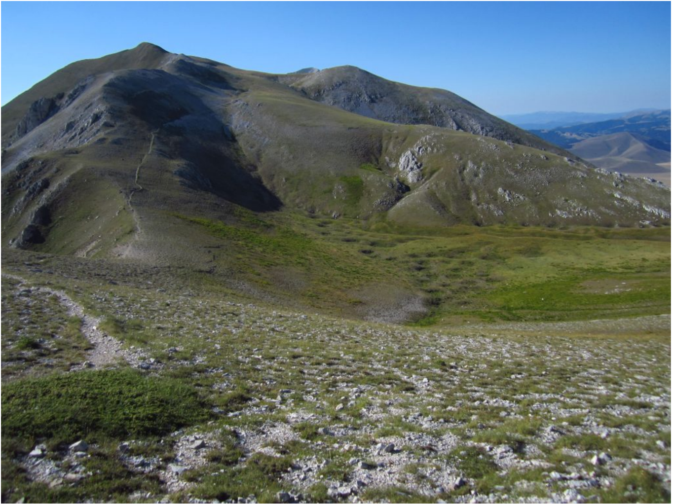
2- Il Monte Argentella e la bellissima conca nivale ancora verde tra questo monte ed il Monte Palazzo Borghese.