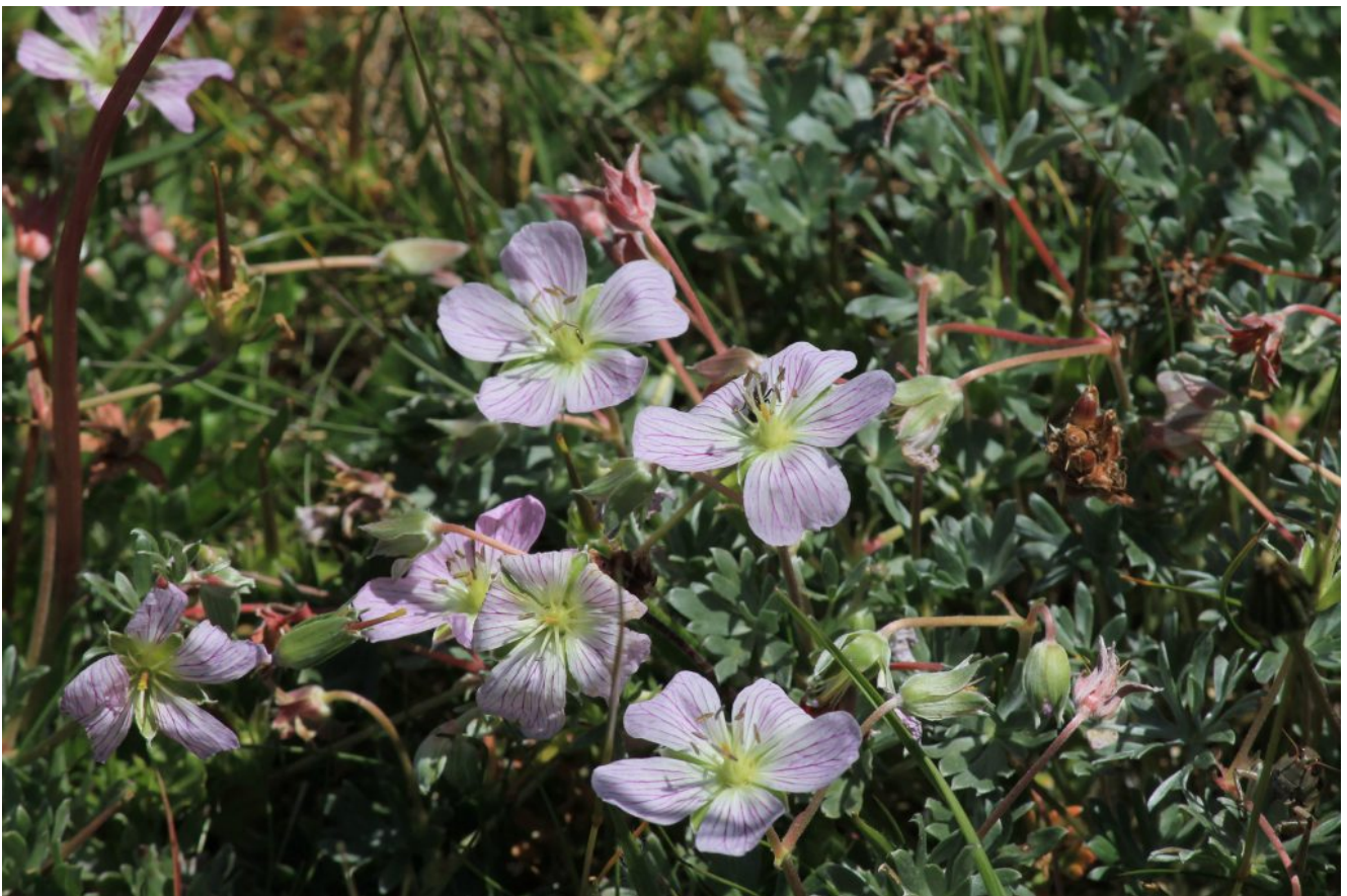
25 – 26- Geranium argenteum dell'unica stazione dei Monti Sibillini, la più a Sud d'Italia.