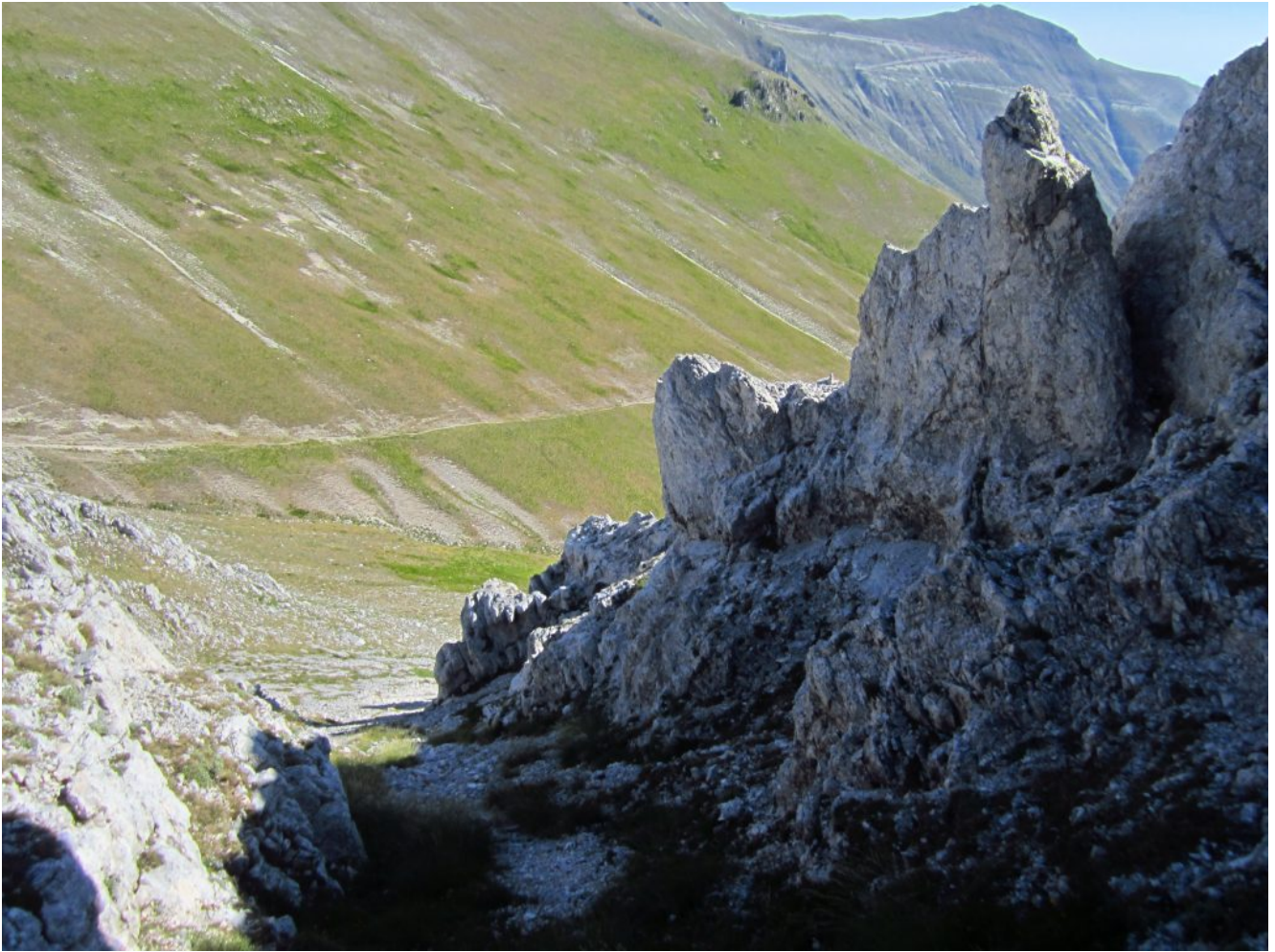
9- A destra il Monte Sibilla.