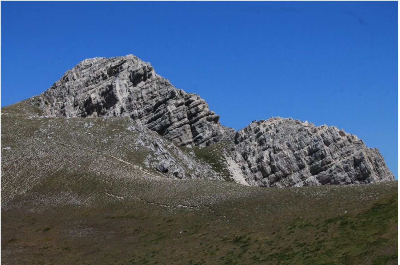
22- La cima di Sasso di Palazzo Borghese e la cima gemella più bassa