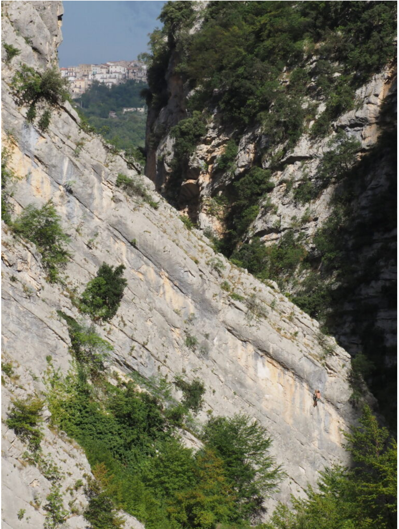
13- La falesia di Fara San Martino con arrampicatore in azione, in alto sullo sfondo il paese di Civitella Messer Raimondo.