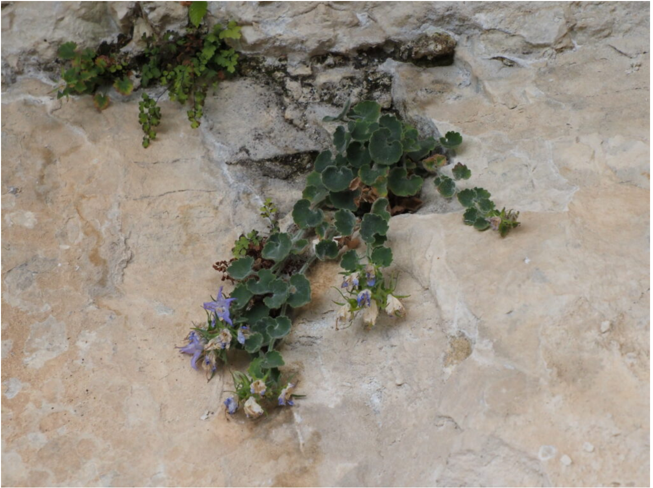
25- La Campanula fragilis subsp. cavolini , endemismo della Majella.