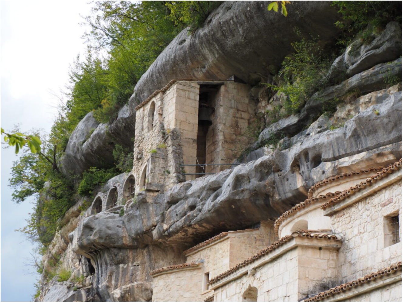
23- Il campanile del Monastero