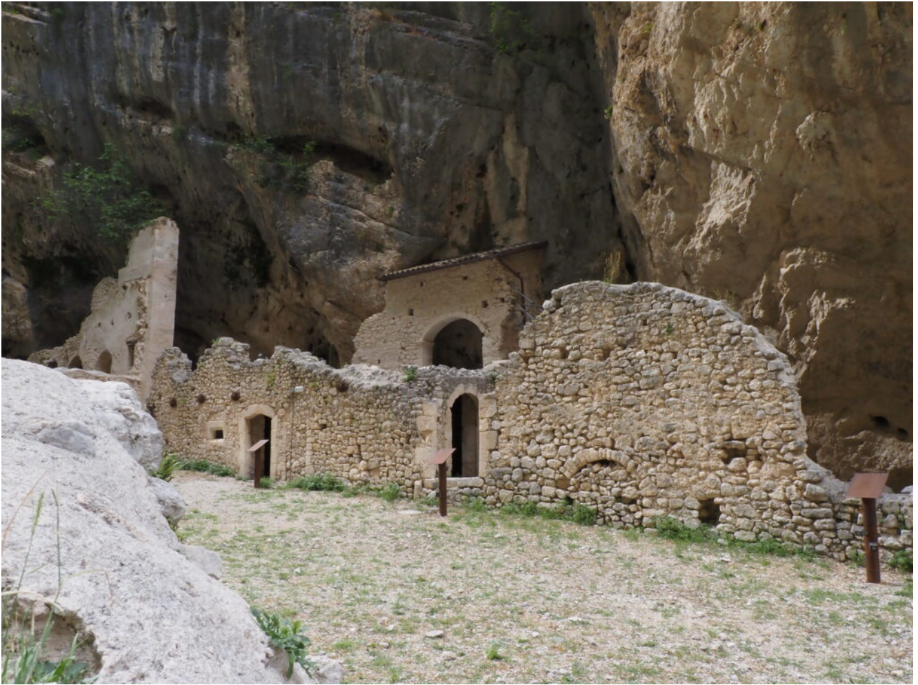
9 – 10 – I ruderi dell'eremo di San Martino in Valle