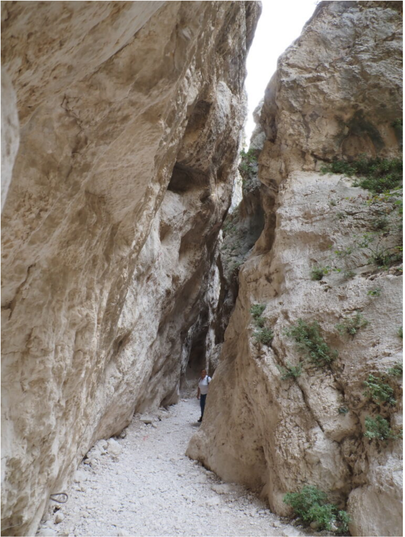
6 – 7 – 8 – La Forra della Valle di Macchialunga