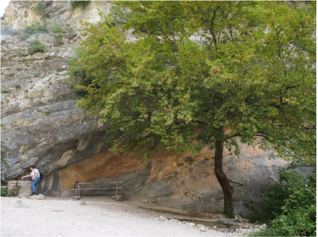
11- Una freschissima fontana sotto ad un grotta nella Valle di Macchialunga