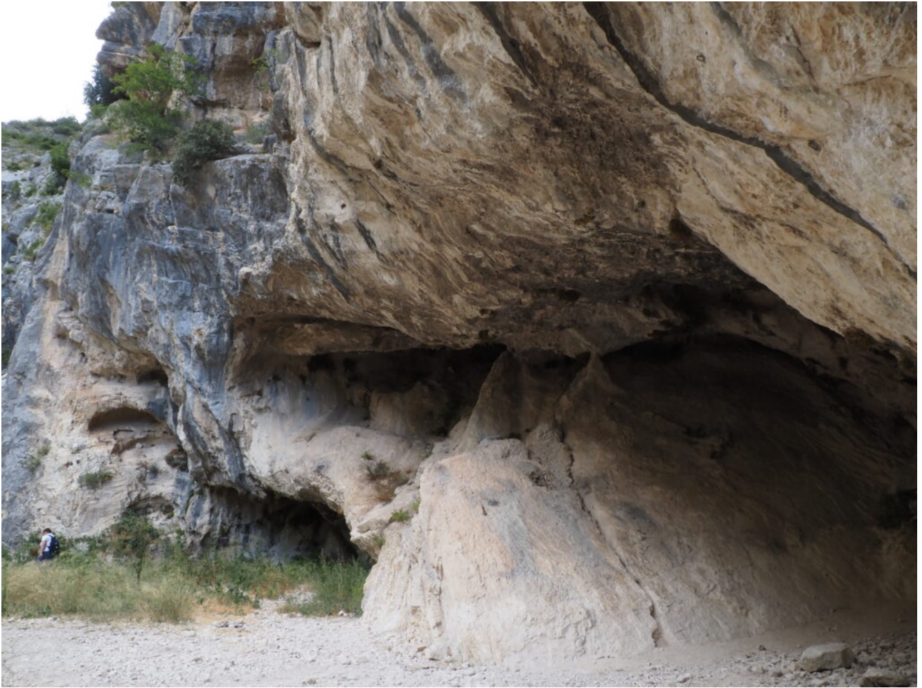
3- Cavità all'ingresso della Valle di Macchialunga