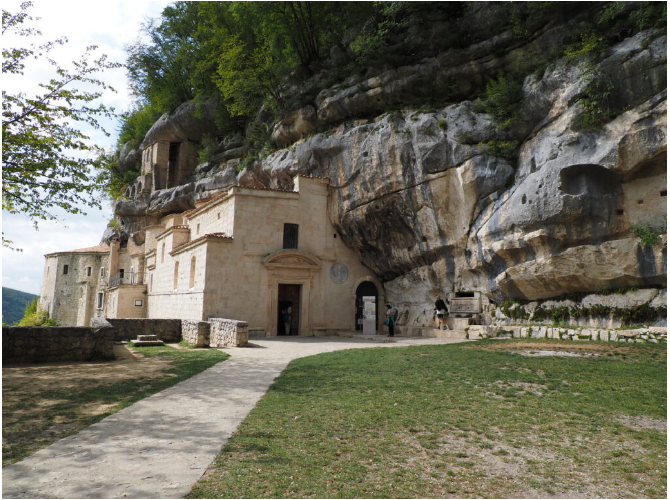
16 – 17 – L'ingresso del Monastero ancora integro ed utilizzato.