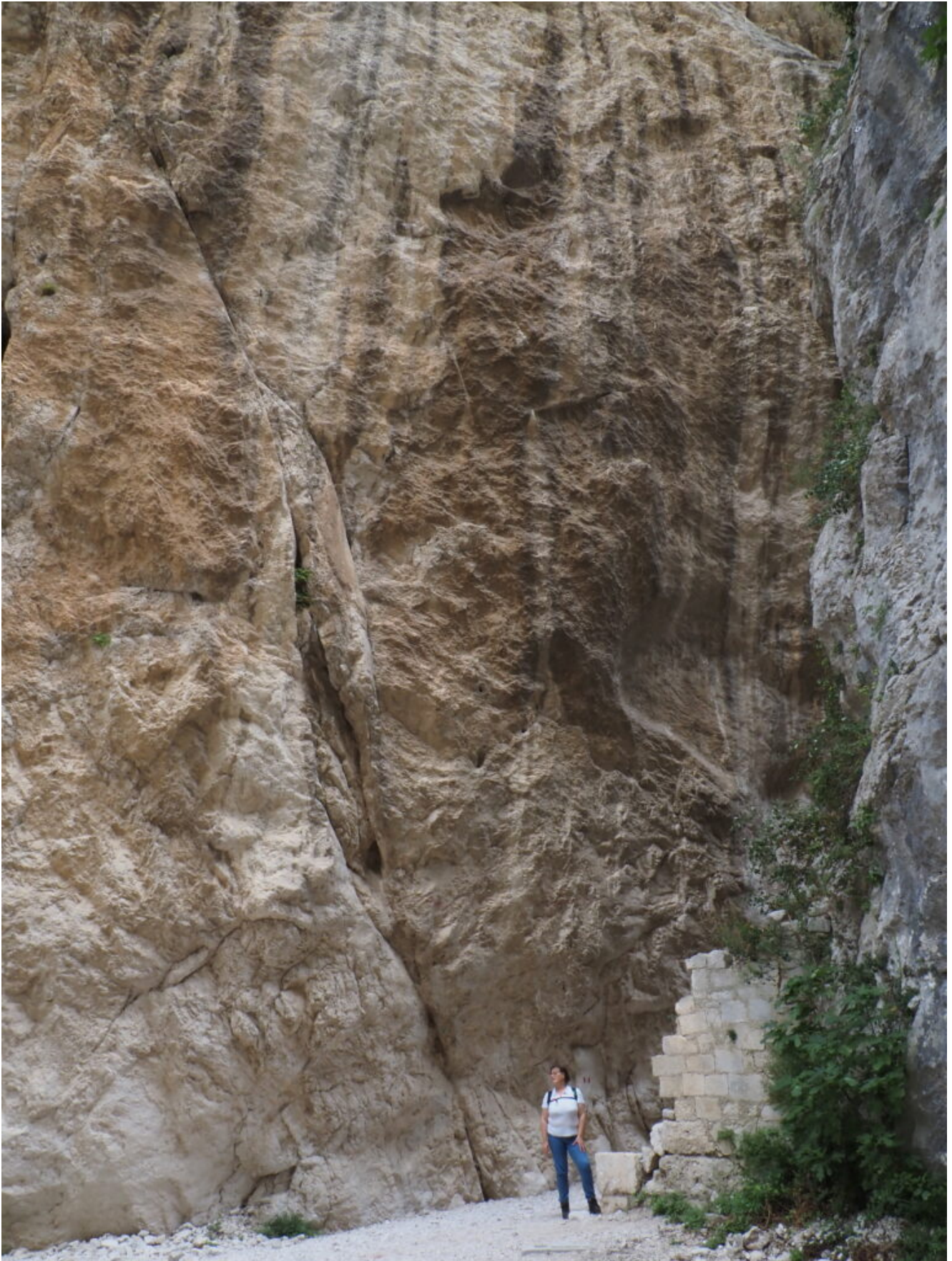
5- L'ingresso della forra della Valle di Macchialunga