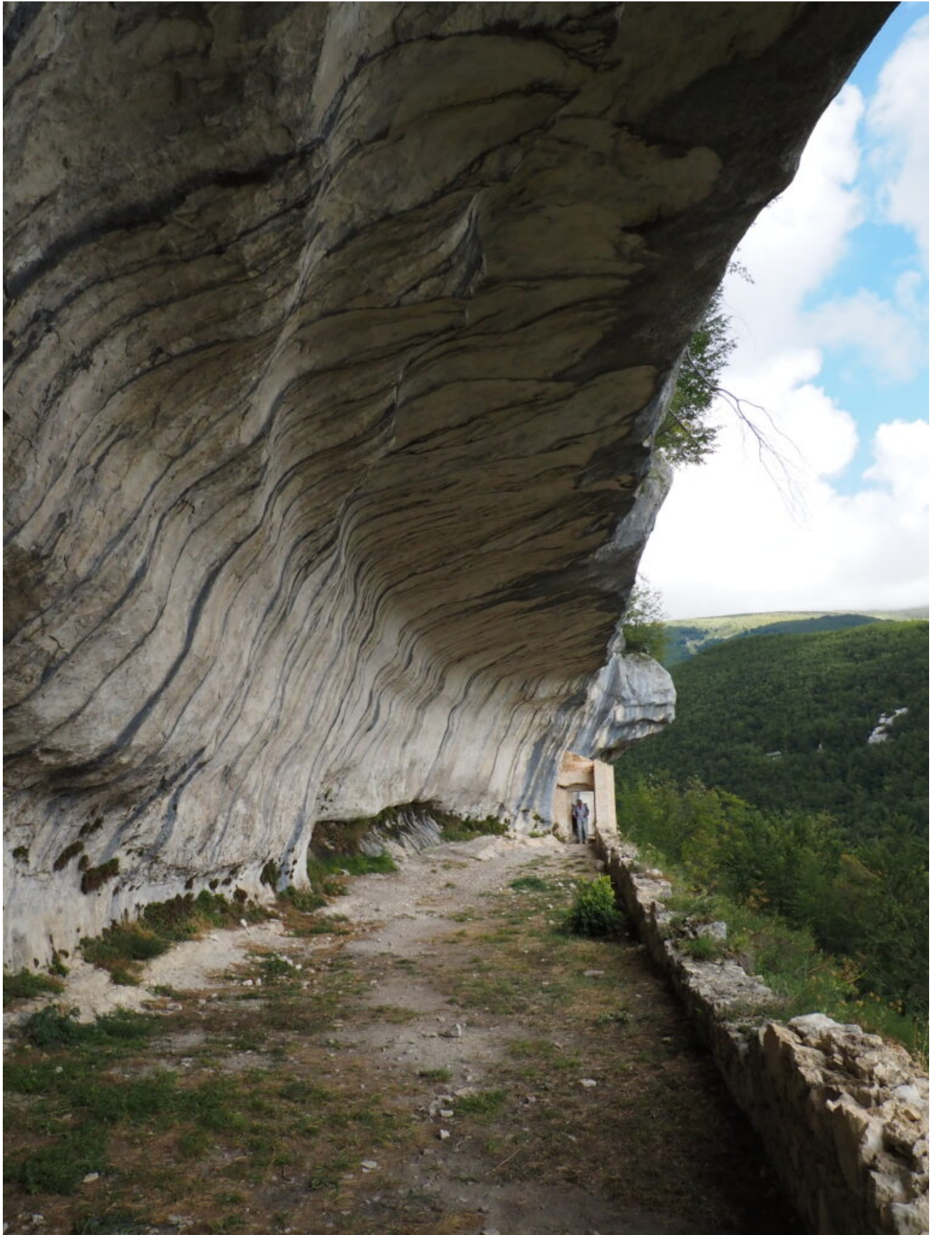
24- Gli ex orti di piante officinali del Monastero