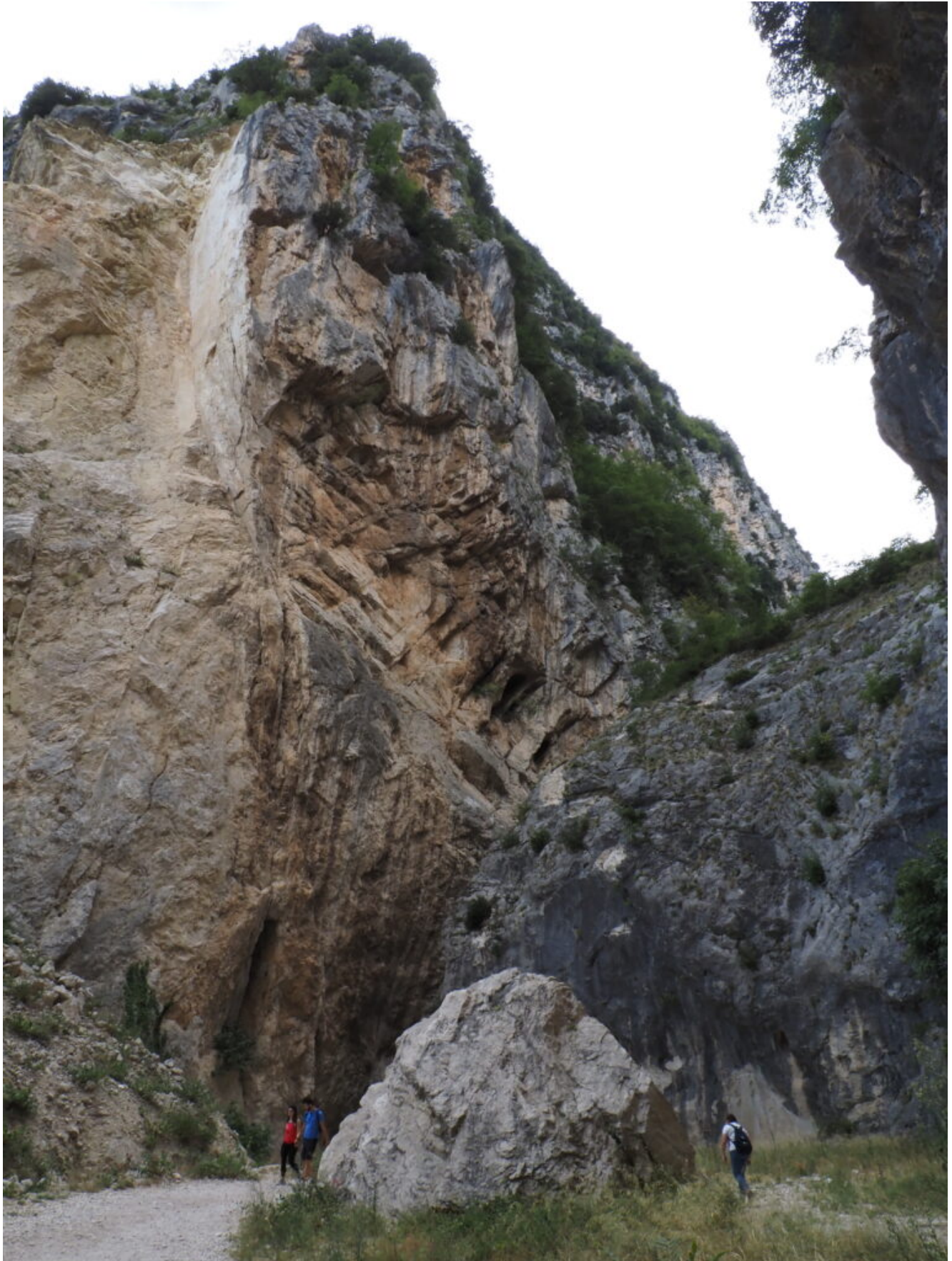
4- Le alte pareti all'ingresso della valle.