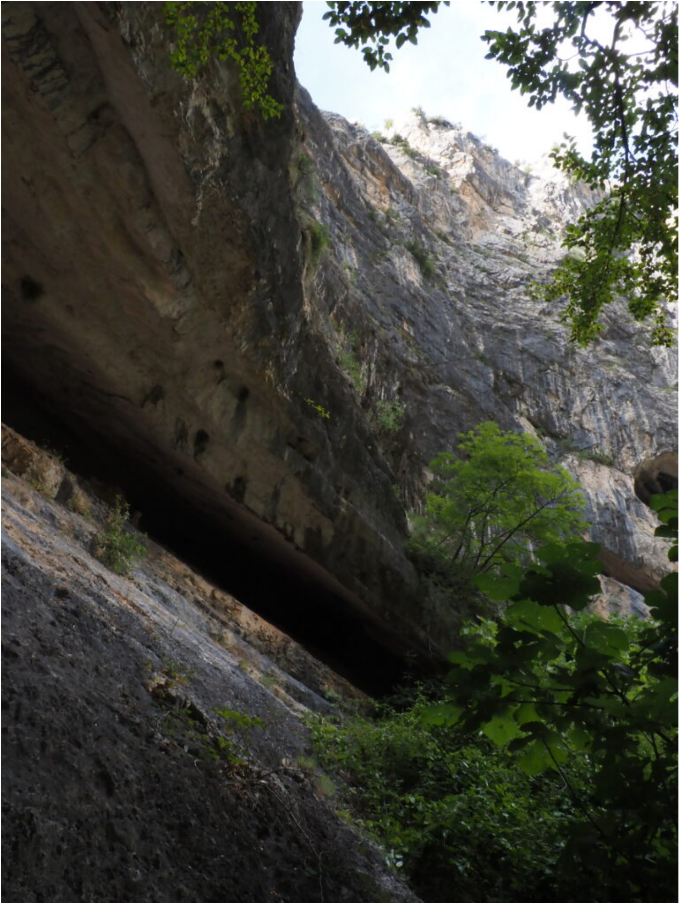
14 – 15 – Altre cavita e pareti della valle