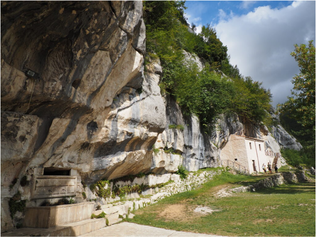
18- 22 – I vari ambienti del Monastero, al riparo sotto grandi tetti di roccia.