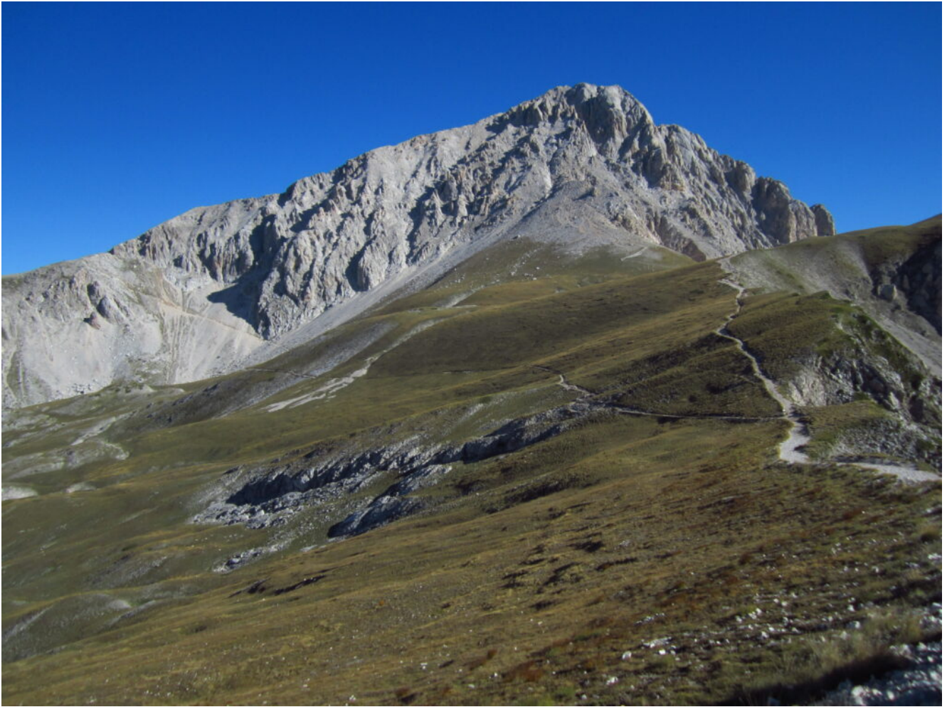
22- Il Corno Grande visto da Campo Pericoli.