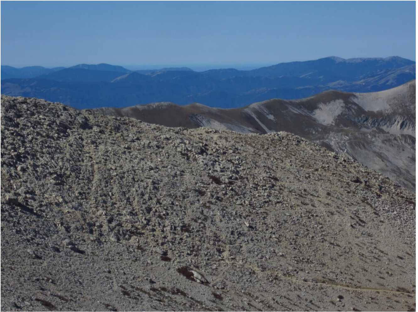
28- Veduta verso Ovest con un tratto di Mare Tirreno visibile.