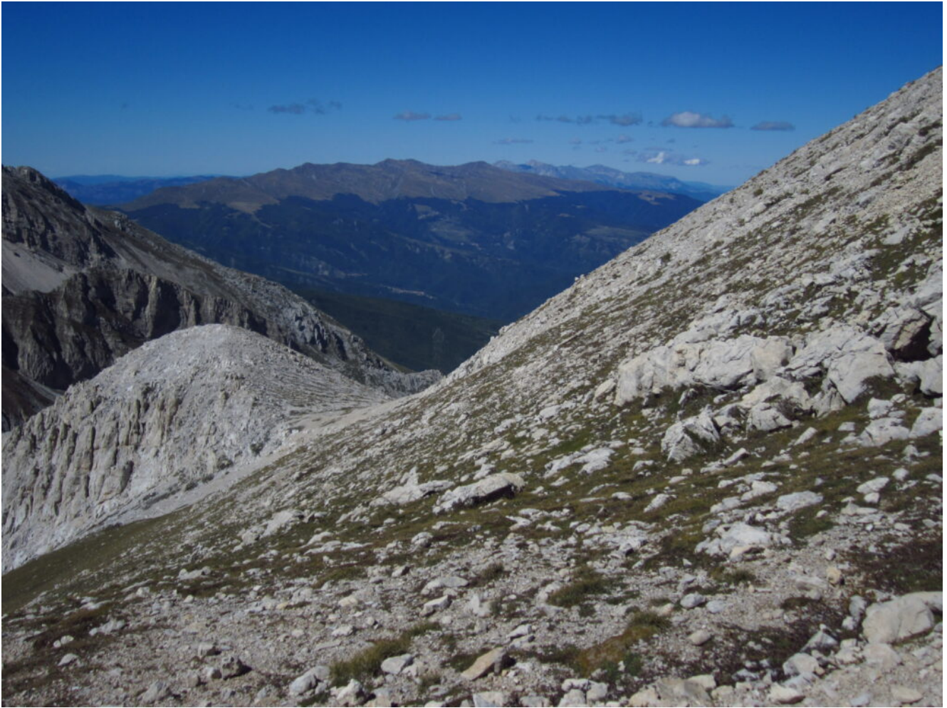
36- Veduta verso Nord con i Monti della Laga e i più lontani Monti Sibillini dalla cima Occidentale del Corno Grande.