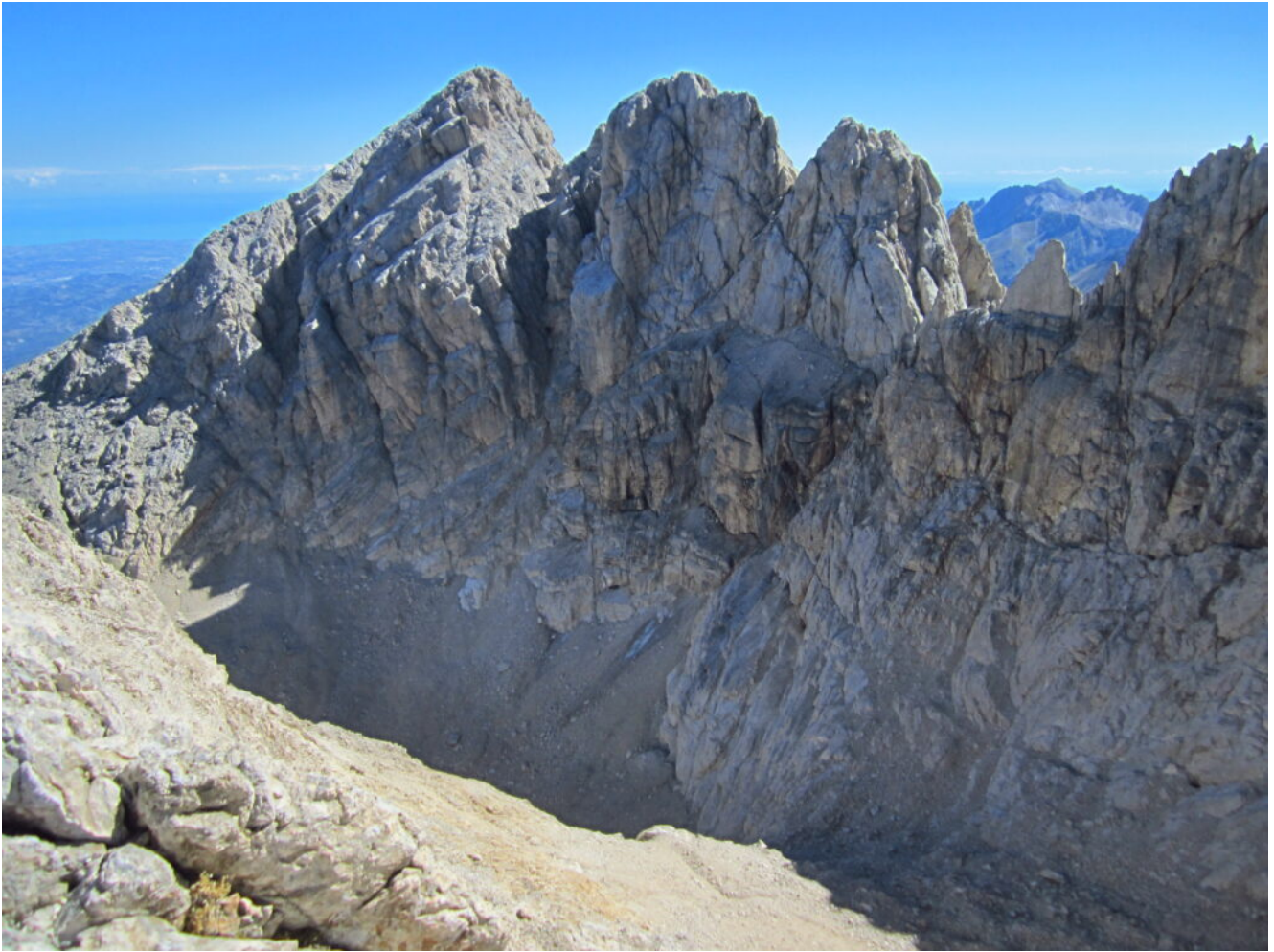
31- La cima Orientale e la conca del Calderone.