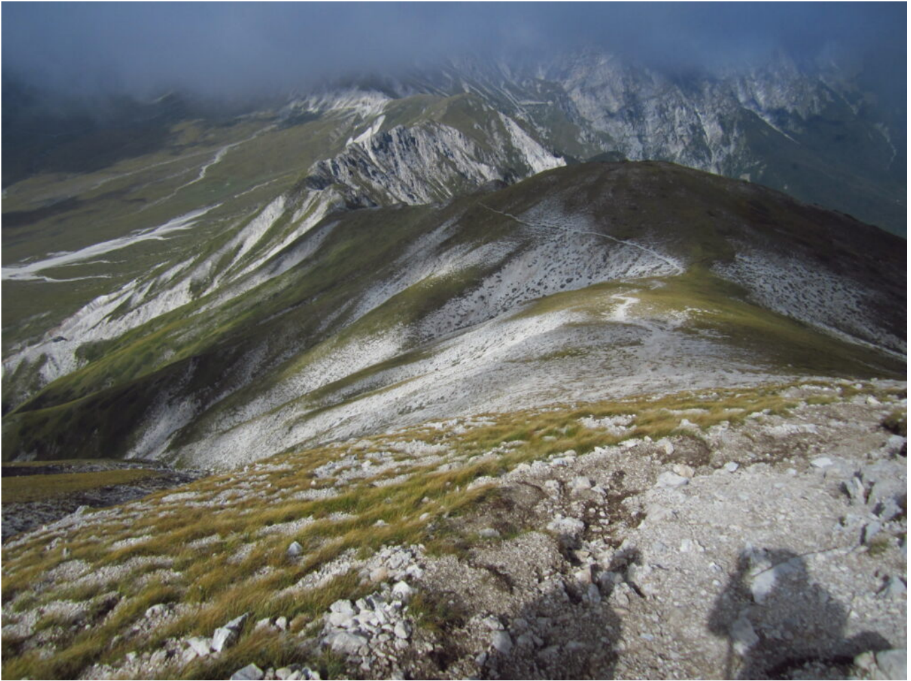
6- In prossimità della cima si vede in lontananza il Vado di Corno.