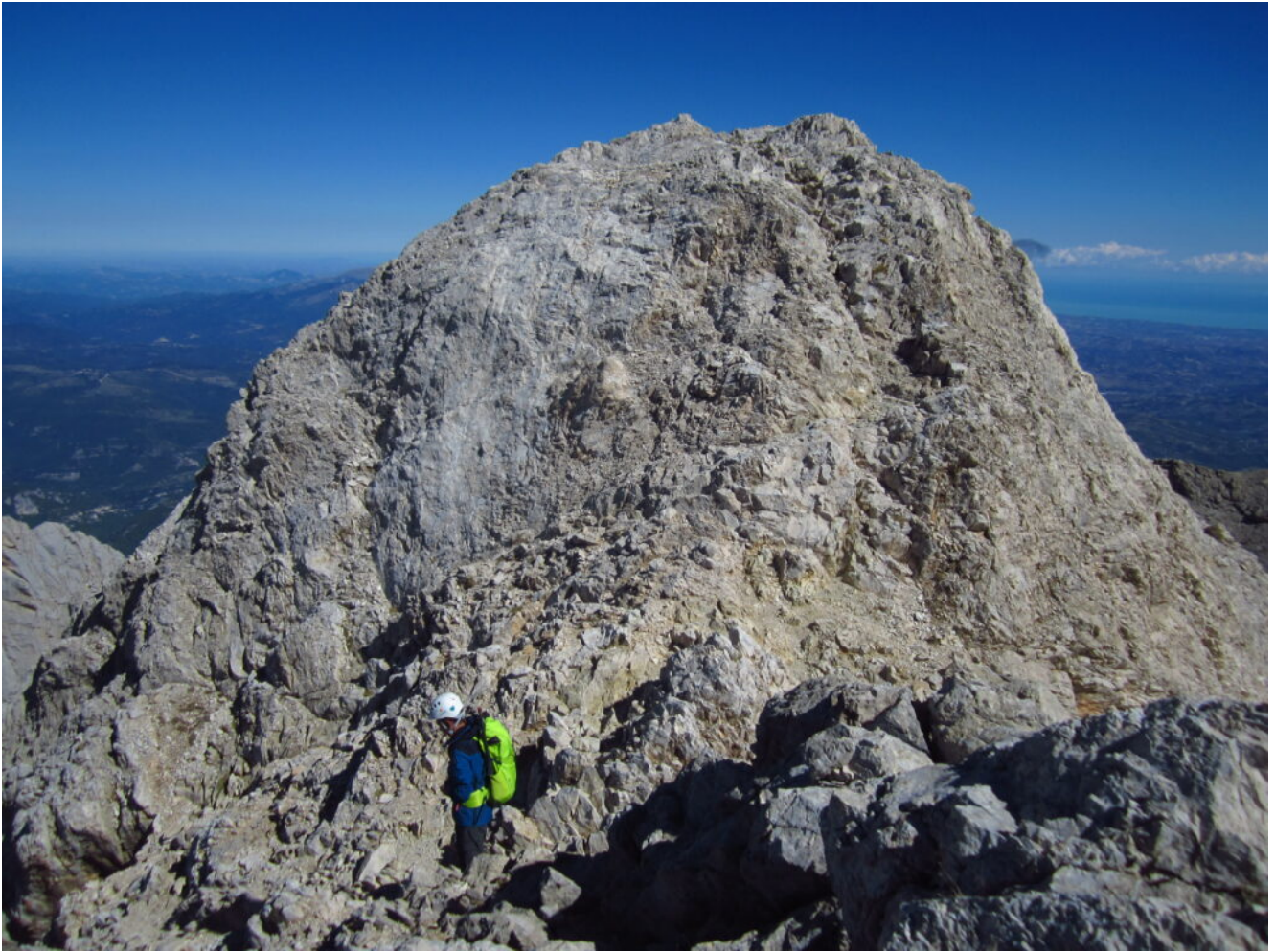
33- La cresta della cima Occidentale.