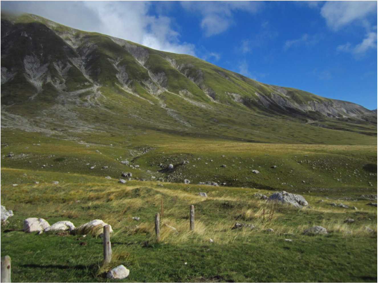
1- Il parcheggio per Vado di Corno, sulla destra.