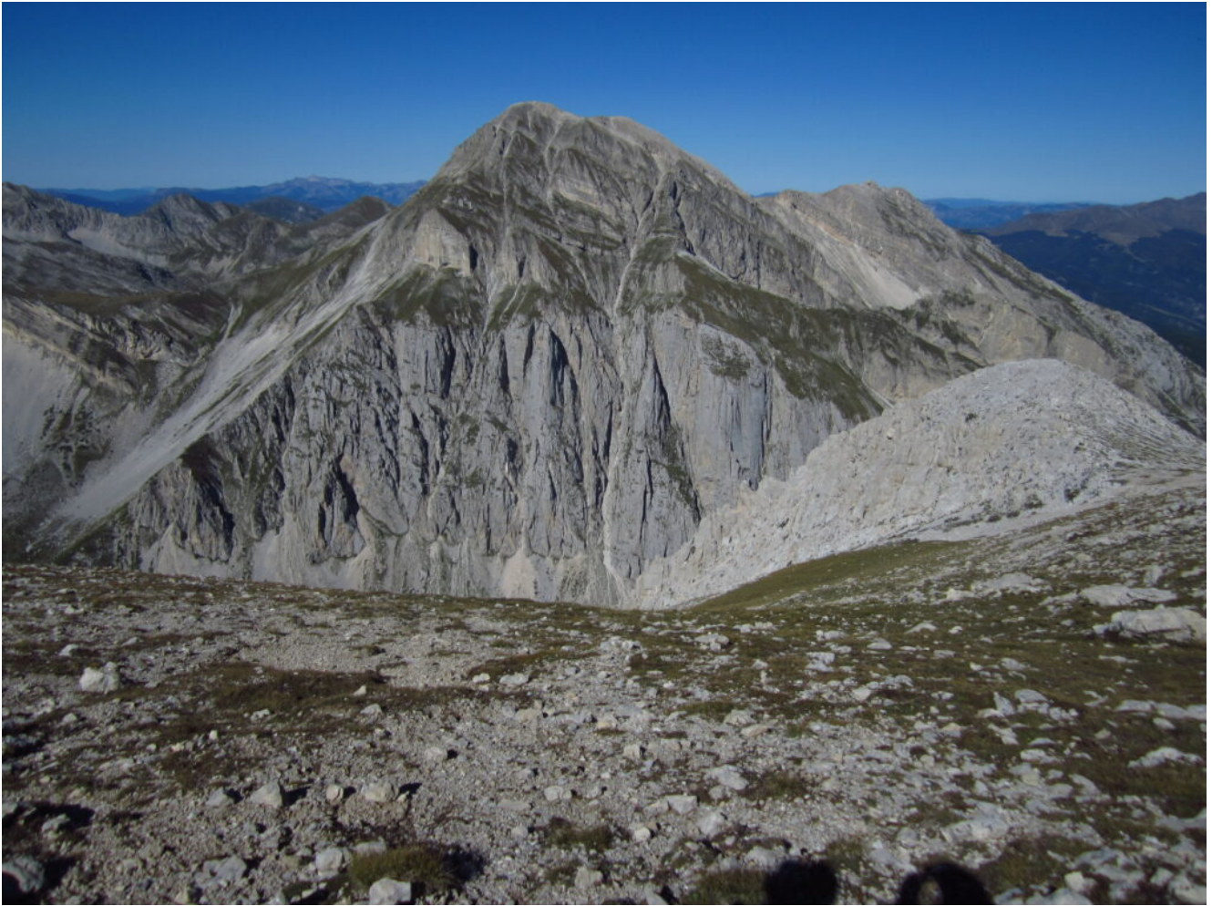
24- Il Pizzo d'Intermesoli.