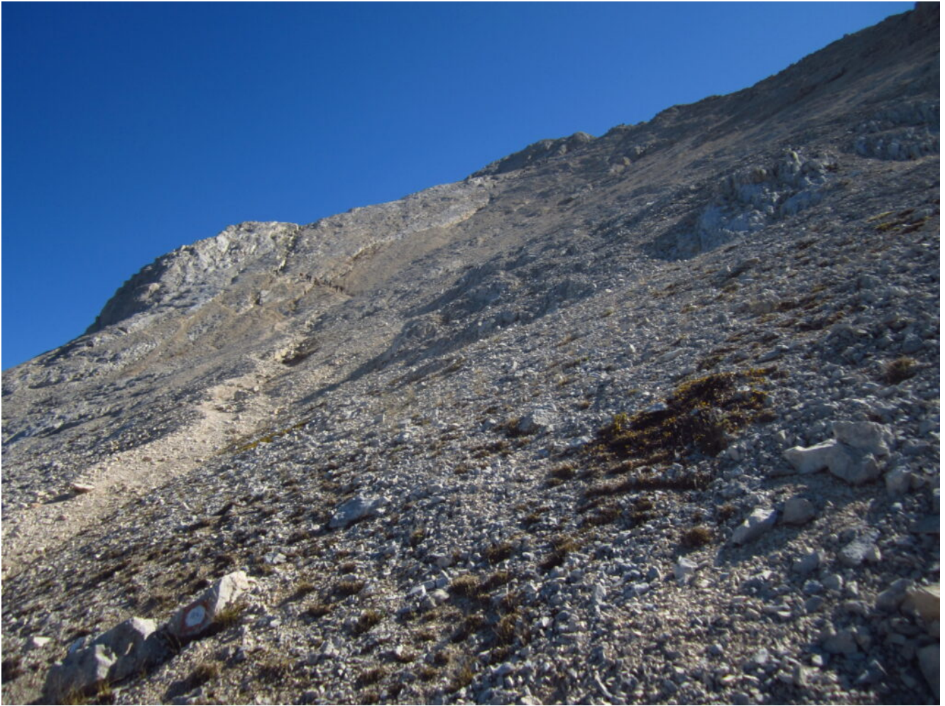
26- L'ultimo tratto di salita più impegnativa per la Vetta Occidentale del Corno Grande.