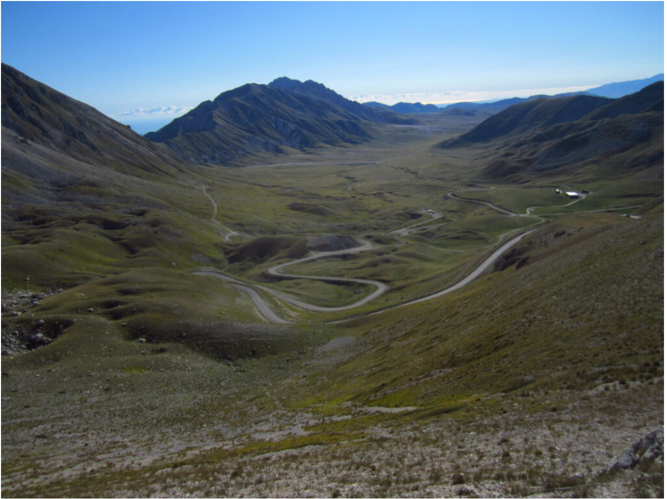
21- Campo Imperatore visto dal sentiero per la Sella di Monte Aquila.