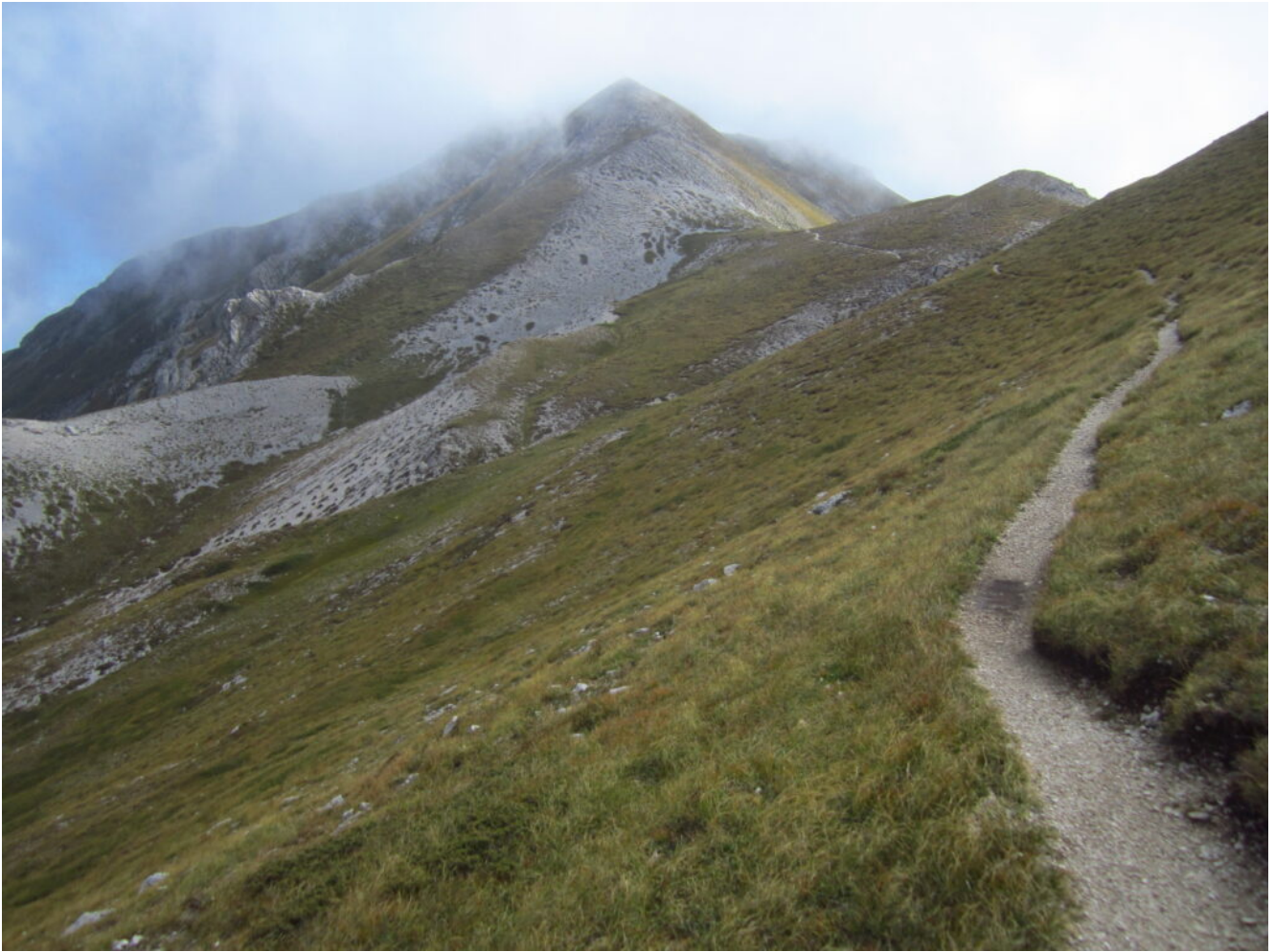
5- Verso il Monte Brancastello