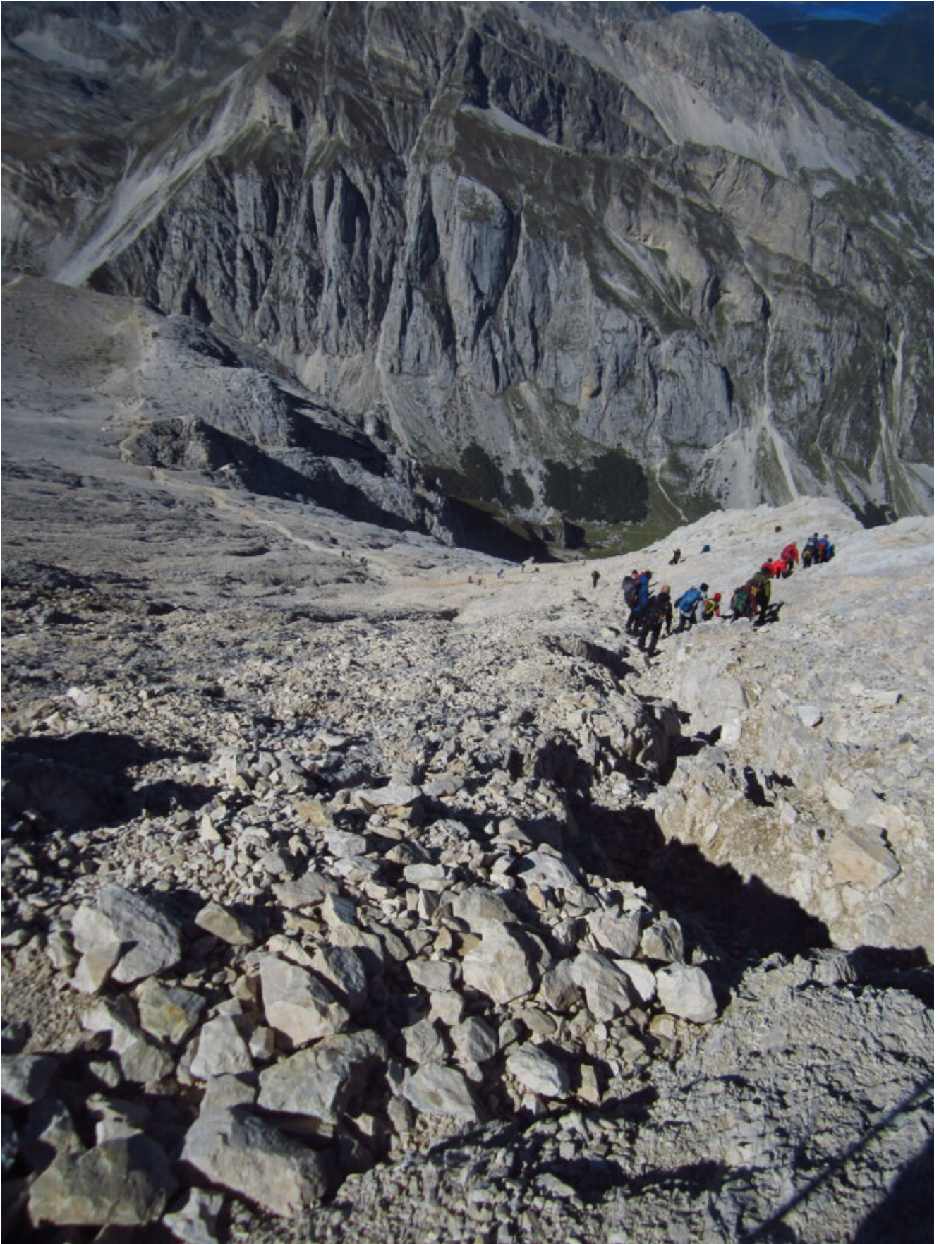
29- L'inevitabile coda domenicale di escursionisti.