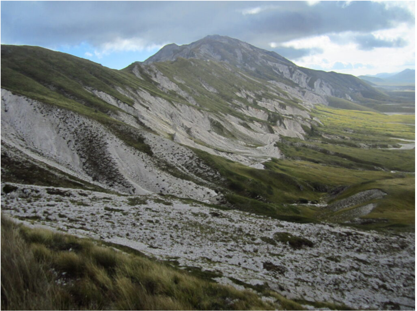
2- La cresta da Vado di Corno al Monte Brancastello.