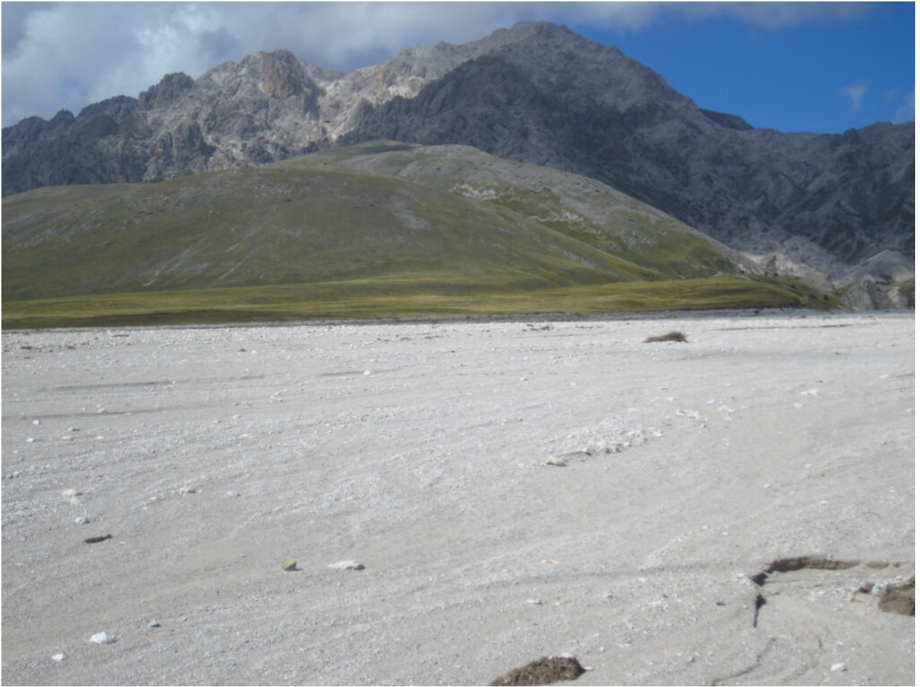
12- Paesaggio lunare verso il Monte Prena.