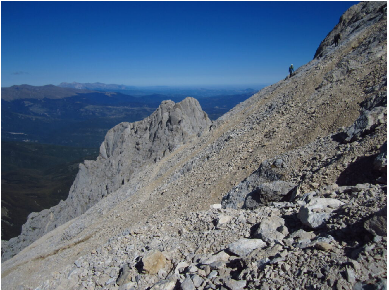
27- Il Corno Piccolo ancora più basso sull'orizzonte man mano che si sale