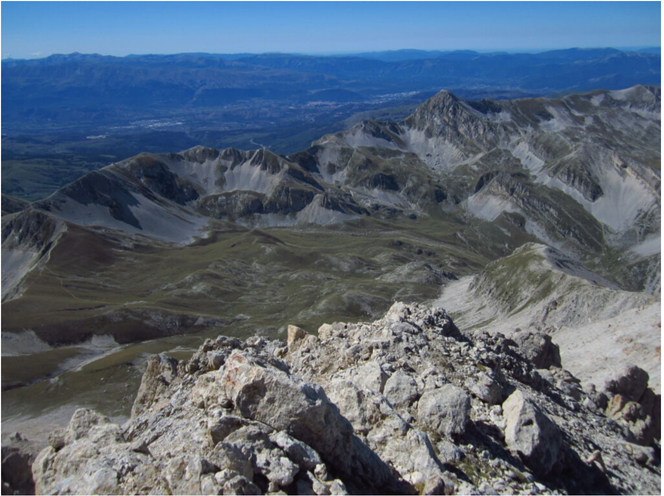
34- Veduta di Campo Pericoli dalla cima Occidentale del Corno Grande.