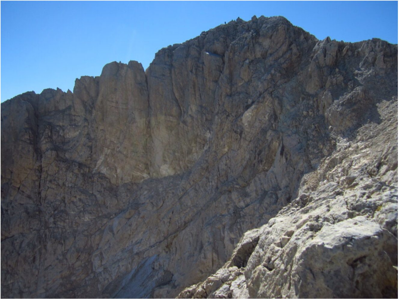
30- La cima Occidentale del Corno grande.