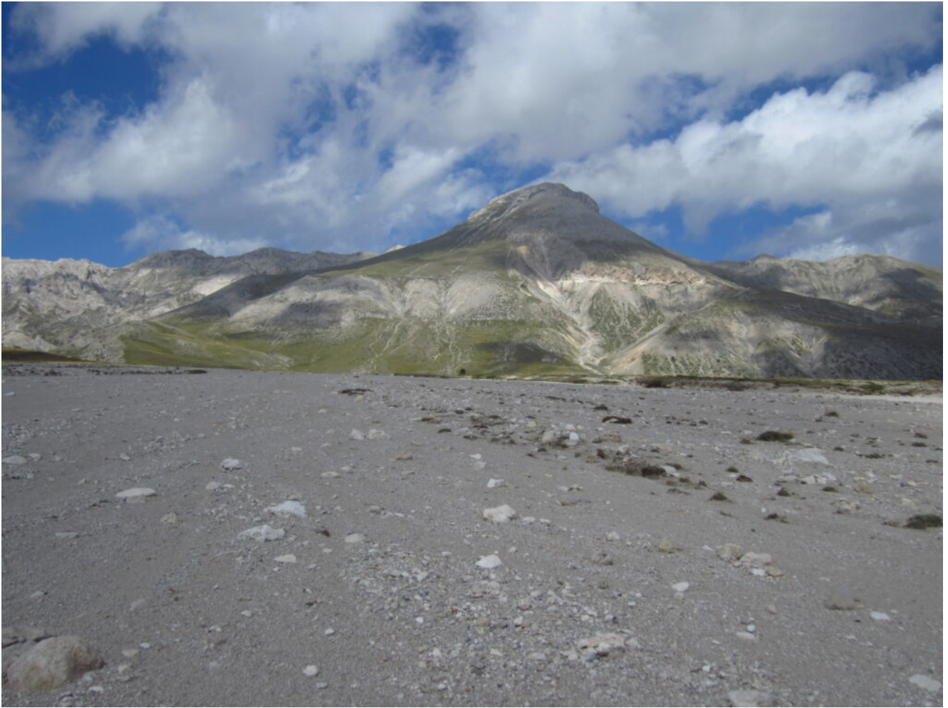
10- La fiumana che scende tra il Monte Prena e il Monte Camicia