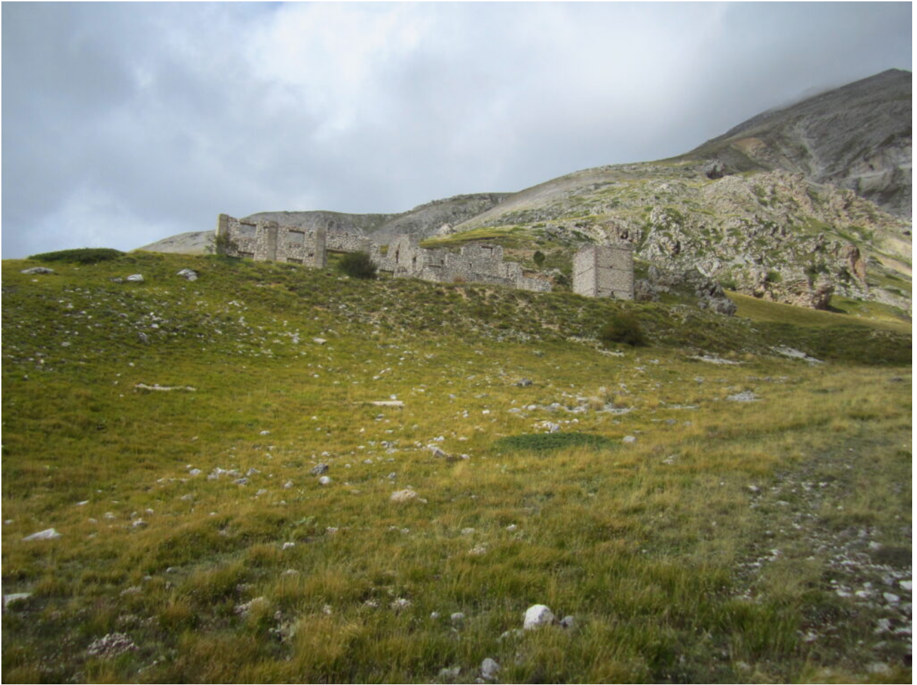
13- 14- 15 – I ruderi della vecchia Miniera di Scisto Bituminoso.