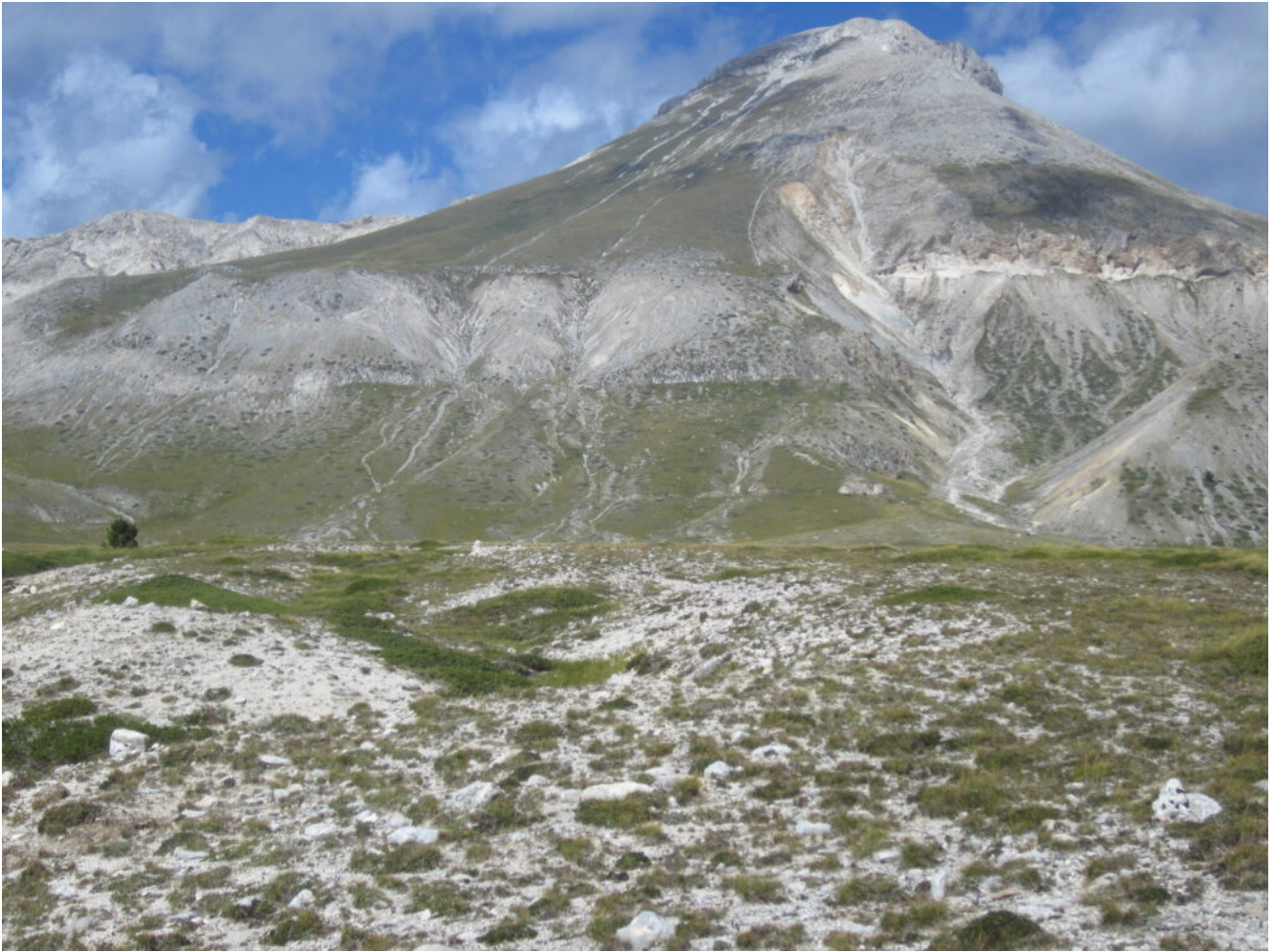
11- Il versante sudest del Monte Camicia con i ruderi della vecchia miniera di Bitume a sinistra alla base del canalone detritico