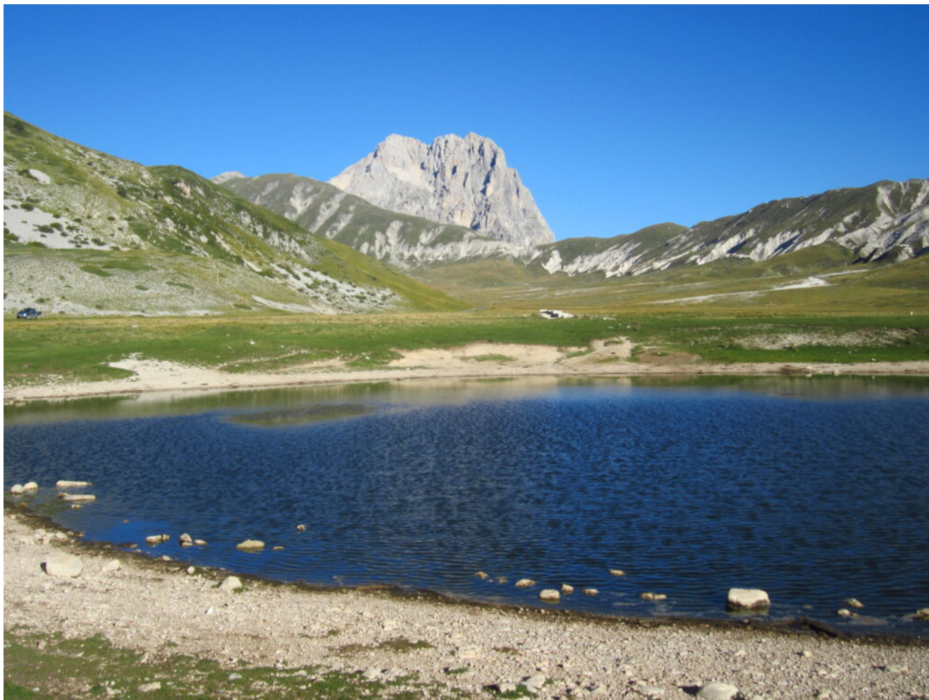
20- Il Corno Grande visto dal Lago Pietranzoni.