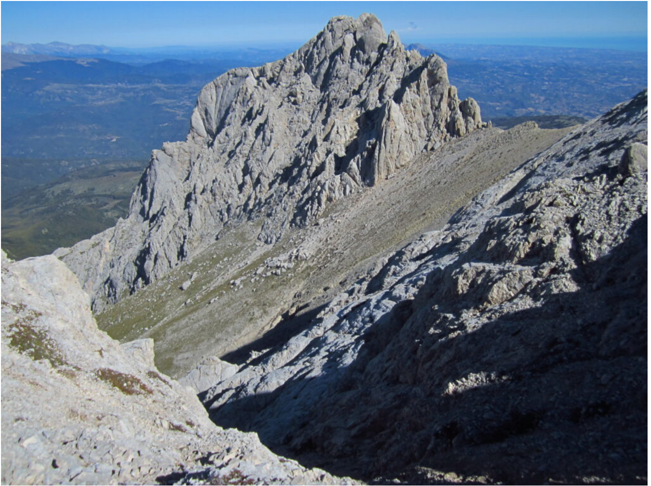
25- Il Corno Piccolo con il Mare Adriatico ai lati.