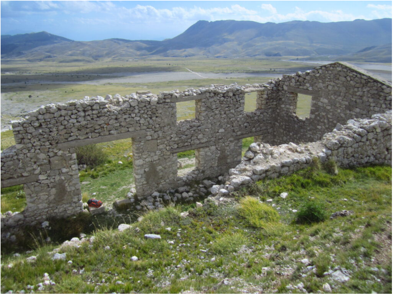
18- Le costruzioni della miniera ed il Monte Bolza sullo sfondo