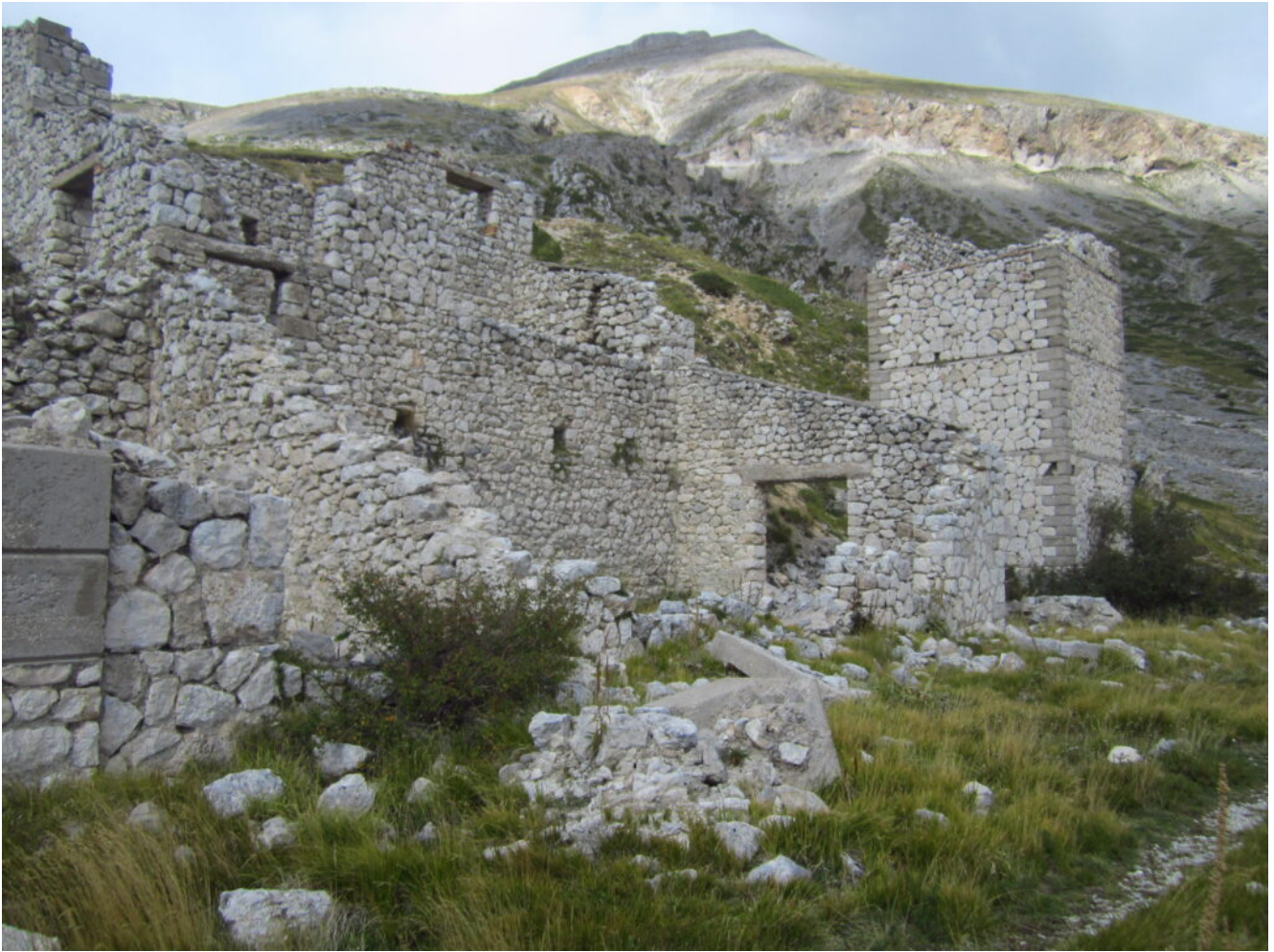
16- La miniera con il Monte Camicia sullo sfondo.