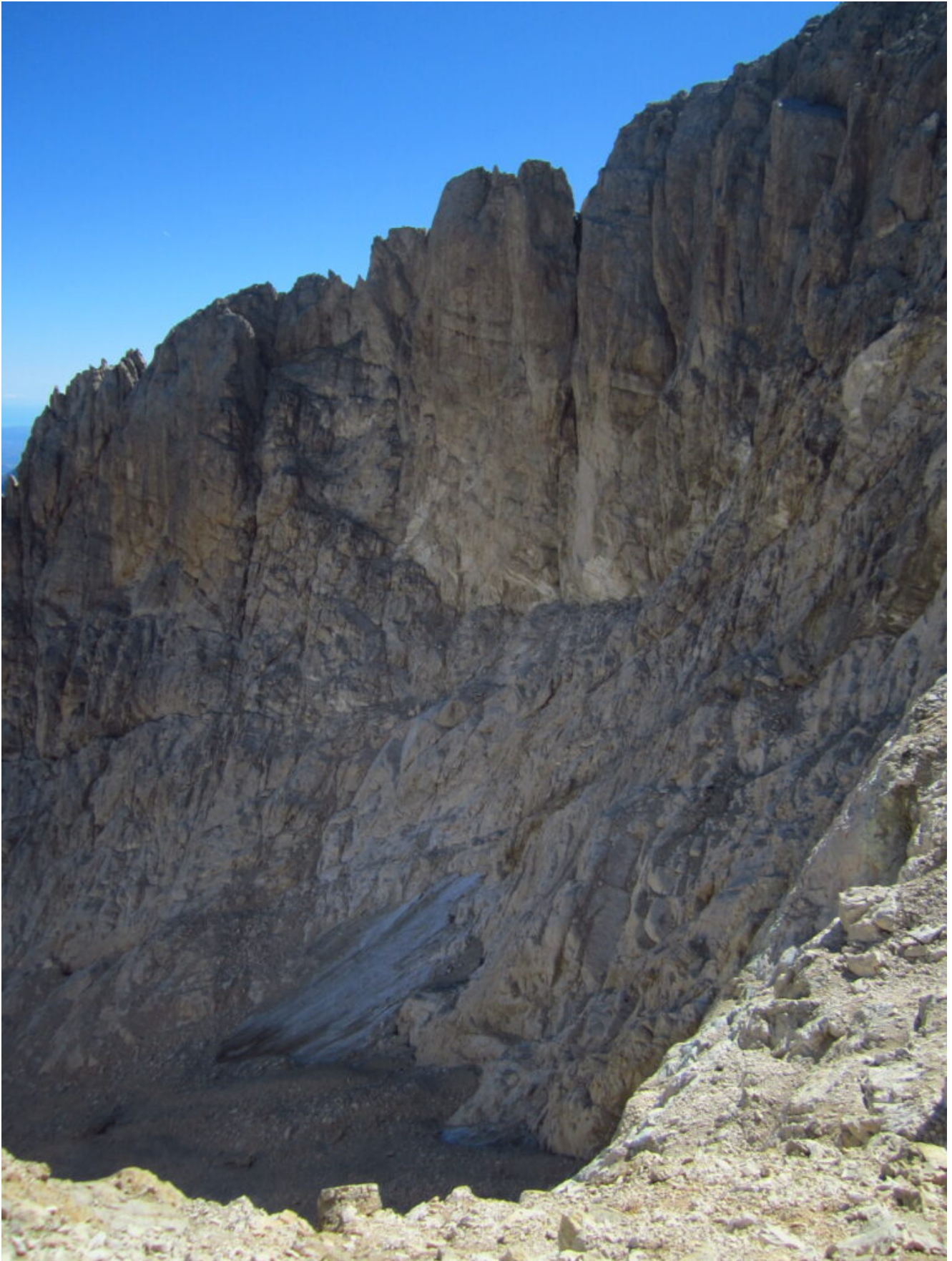
32- Il Ghiacciaio del Calderone nonostante la calda estate tiene duro.