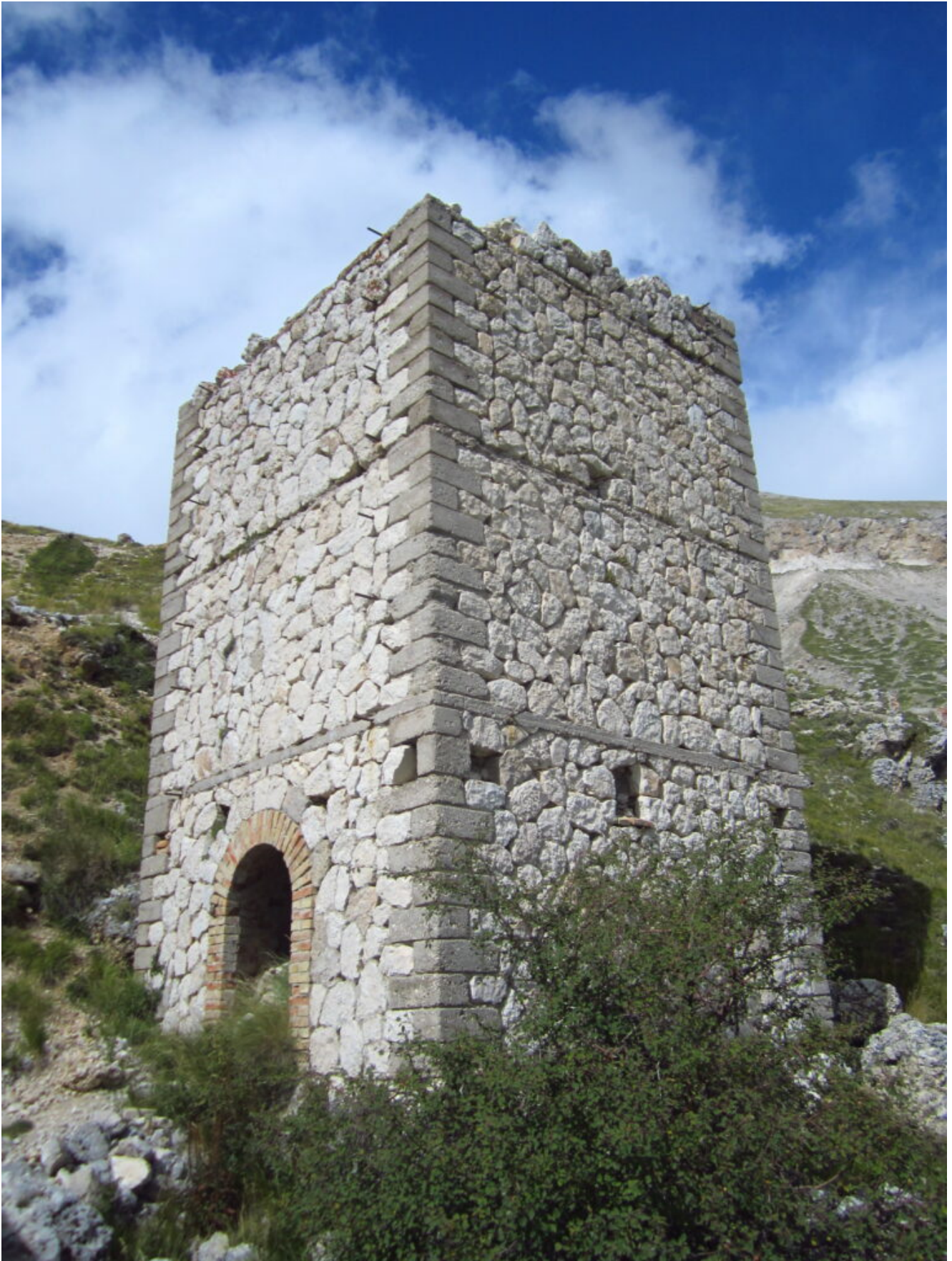
17- Il pozzo di accesso alla Miniera.