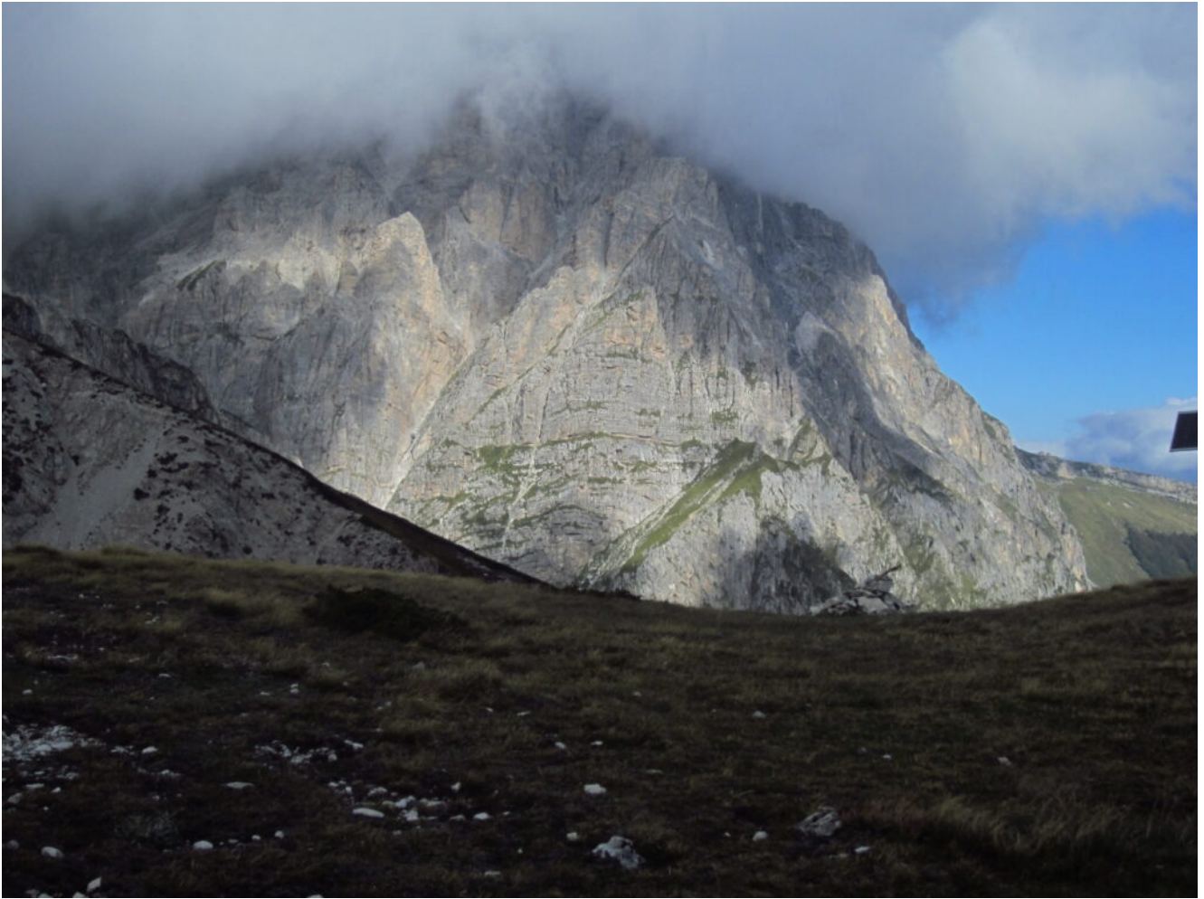
3- Il Corno Grande coperto di nebbia.