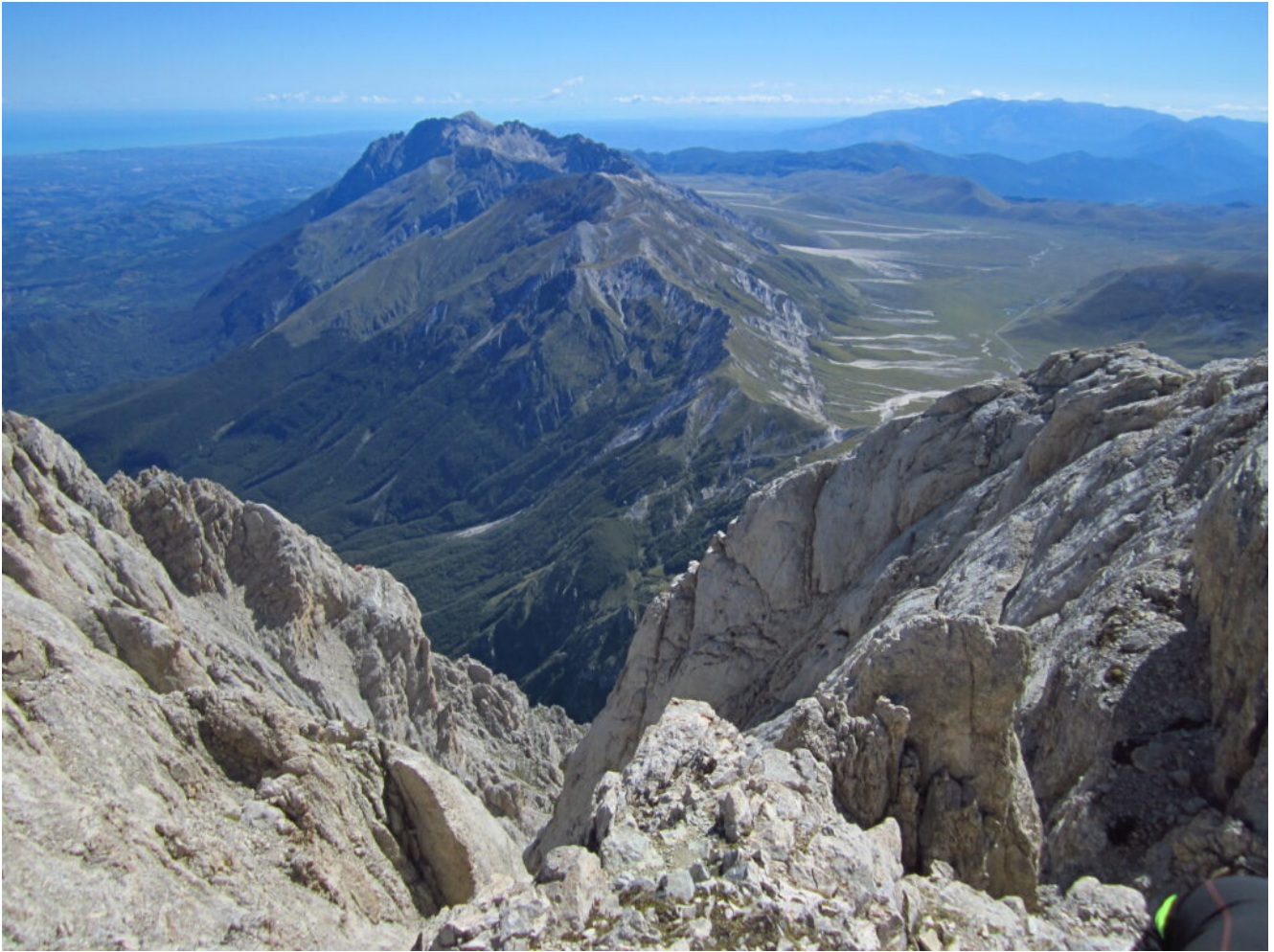
35- Veduta di Campo Imperatore dalla cima Occidentale del Corno Grande con la Majella sullo sfondo a destra.