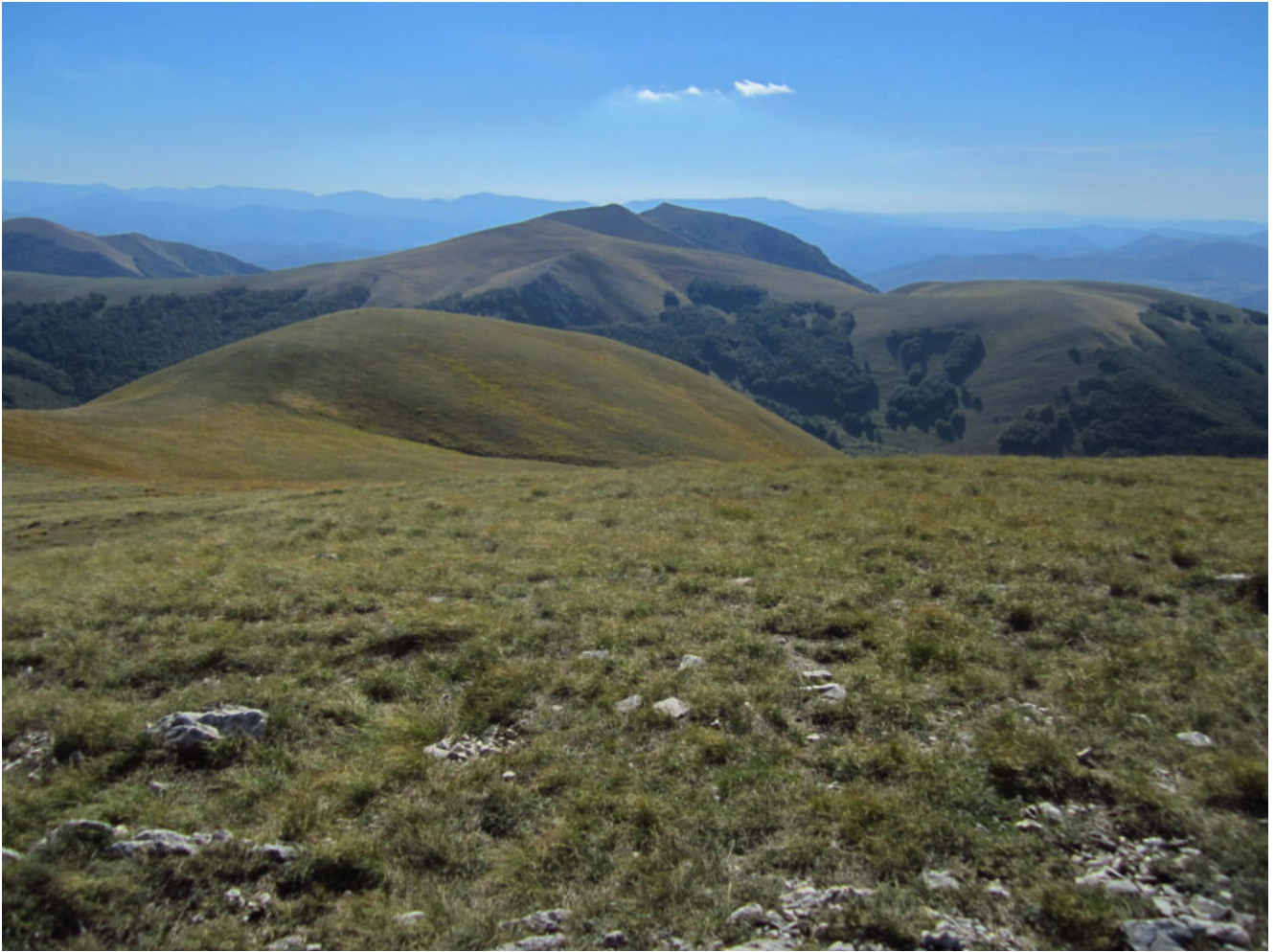
18- Veduta dalla cima di Monte Lieto verso il Monte delle Rose e Monte Patino.