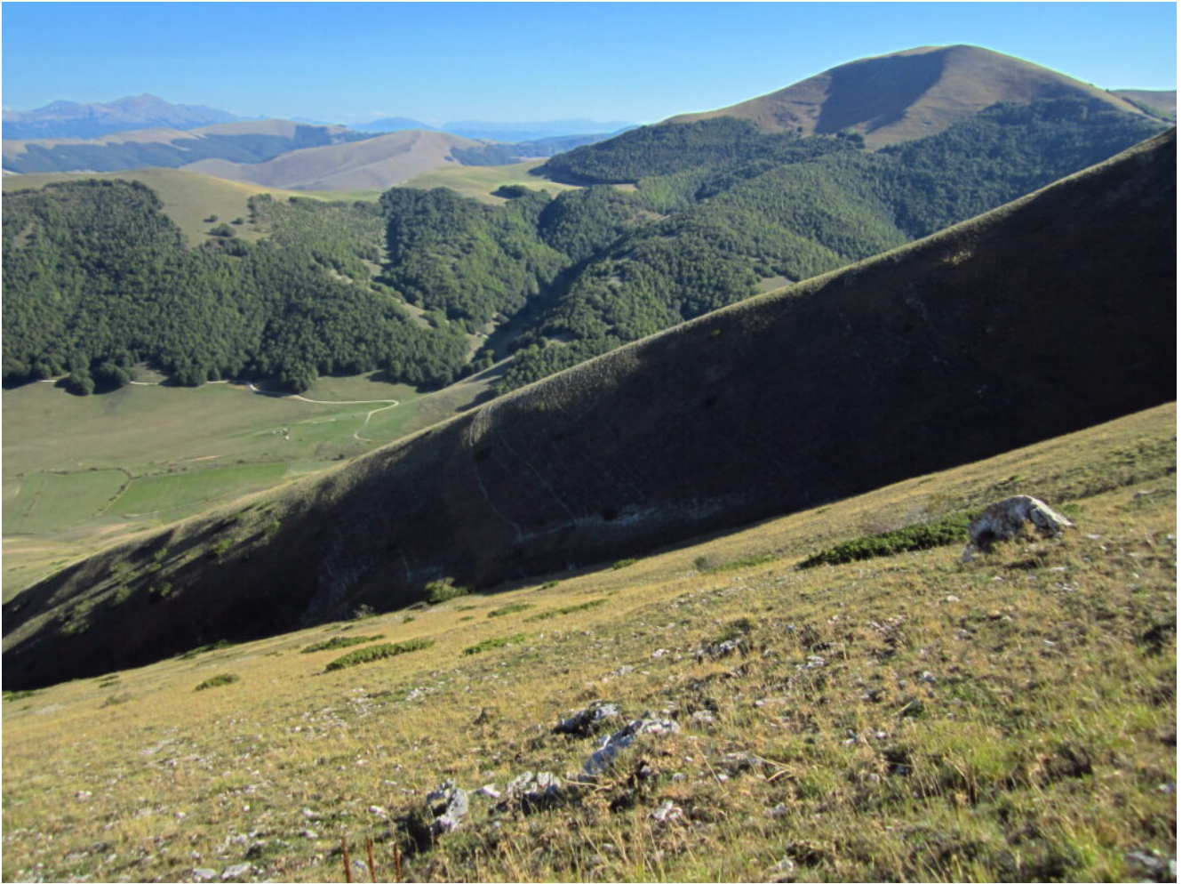
21- Il canale di salita visto durante la discesa nel pendio erboso al lato sinistro.