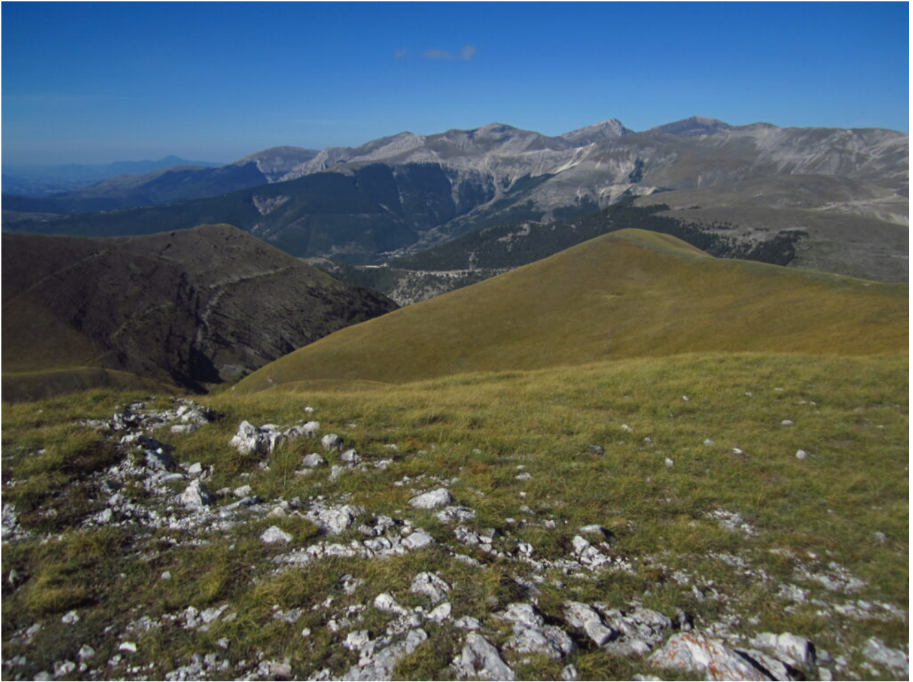
13- Veduta dalla cima di Monte Lieto verso il gruppo Nord dei Monti Sibillini da sinistra la Croce di Monte Rotondo, La Croce di Monte Bove , il Monte Bove Nord, il Monte Bove Sud, Pizzo Berro, Pizzo Regina e la Cima di Vallinfante.