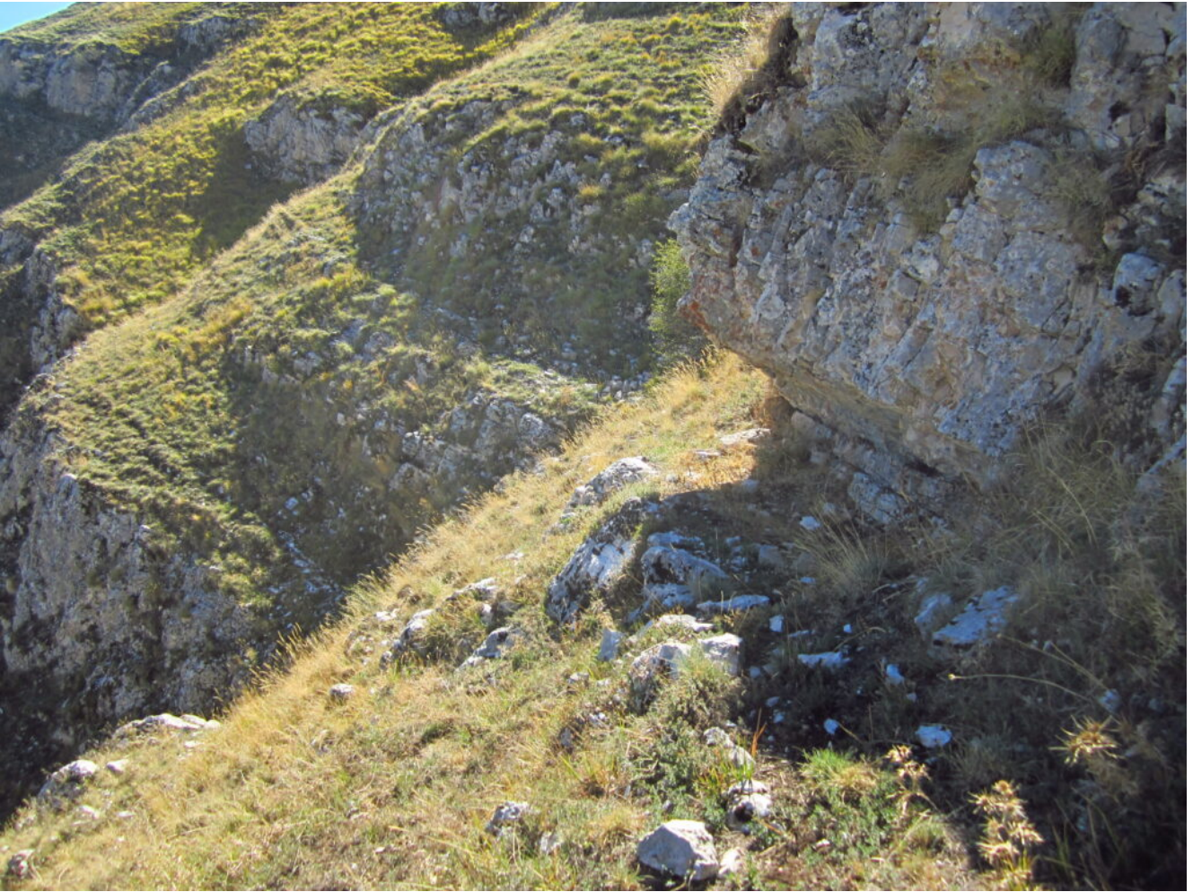
9- La grotticella vista dal lato destro.