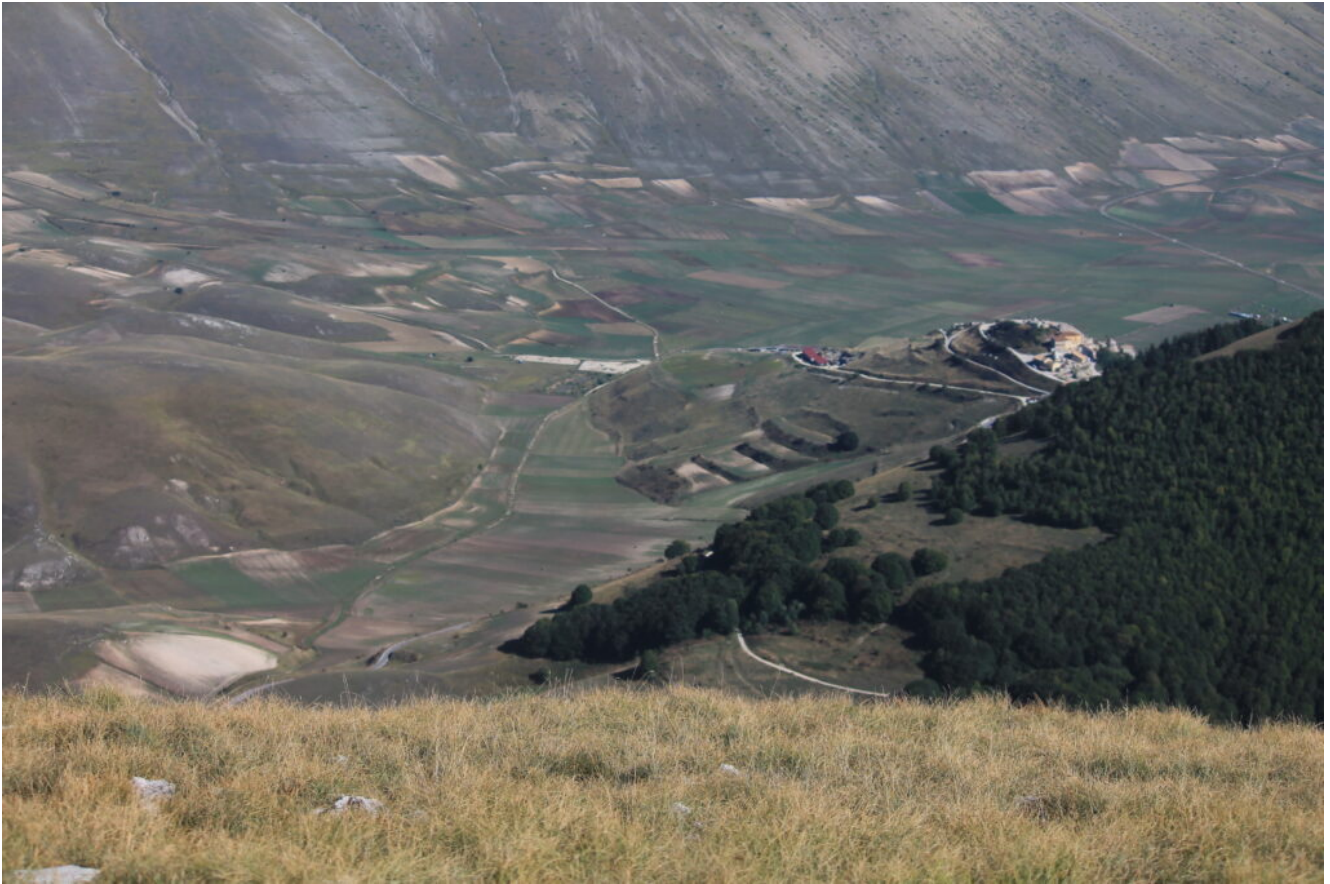
16- Veduta dalla cima di Monte Lieto verso Castelluccio.,