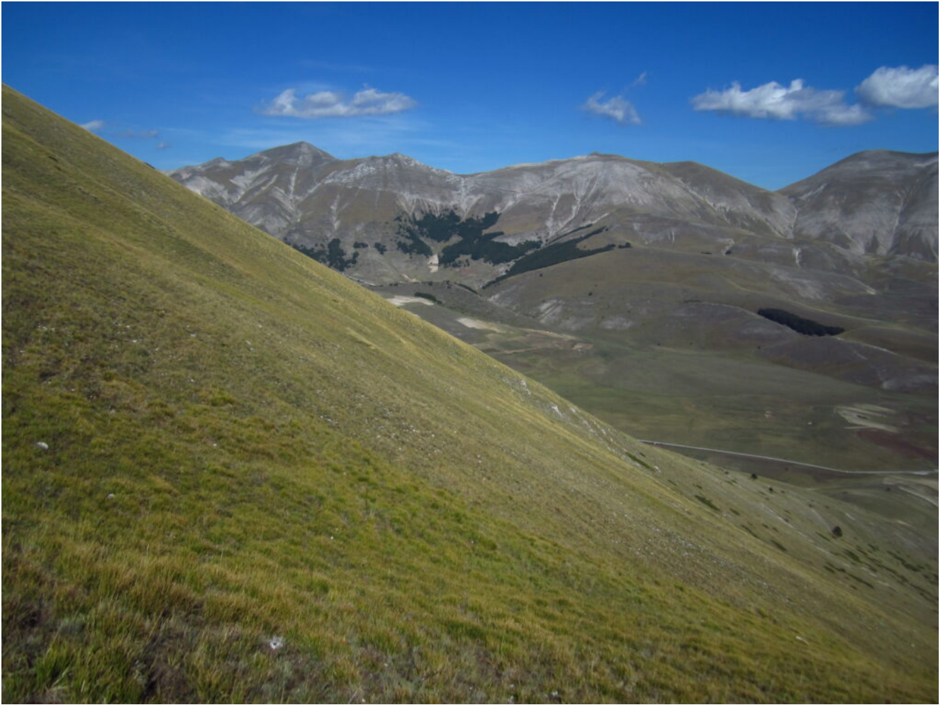
12- Il Monte Porche, Monte Palazzo Borghese e Monte Argentella con il pendio di discesa con pendenza costante di 40^\circ .