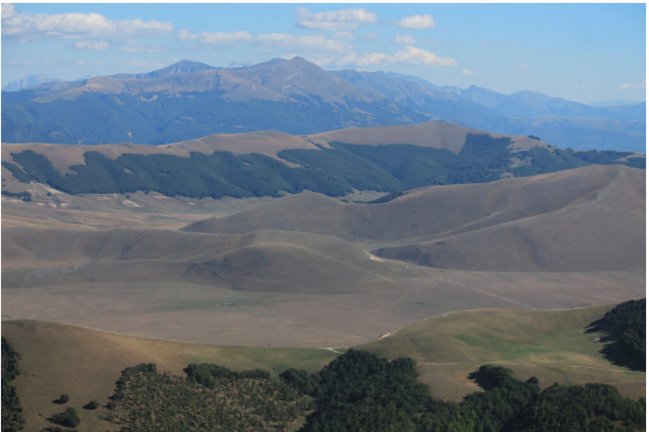
17- Veduta dalla cima di Monte Lieto verso il Piano Grande, Monte Macchialta e Monte Guaidone con i Monti della Laga sullo sfondo.,