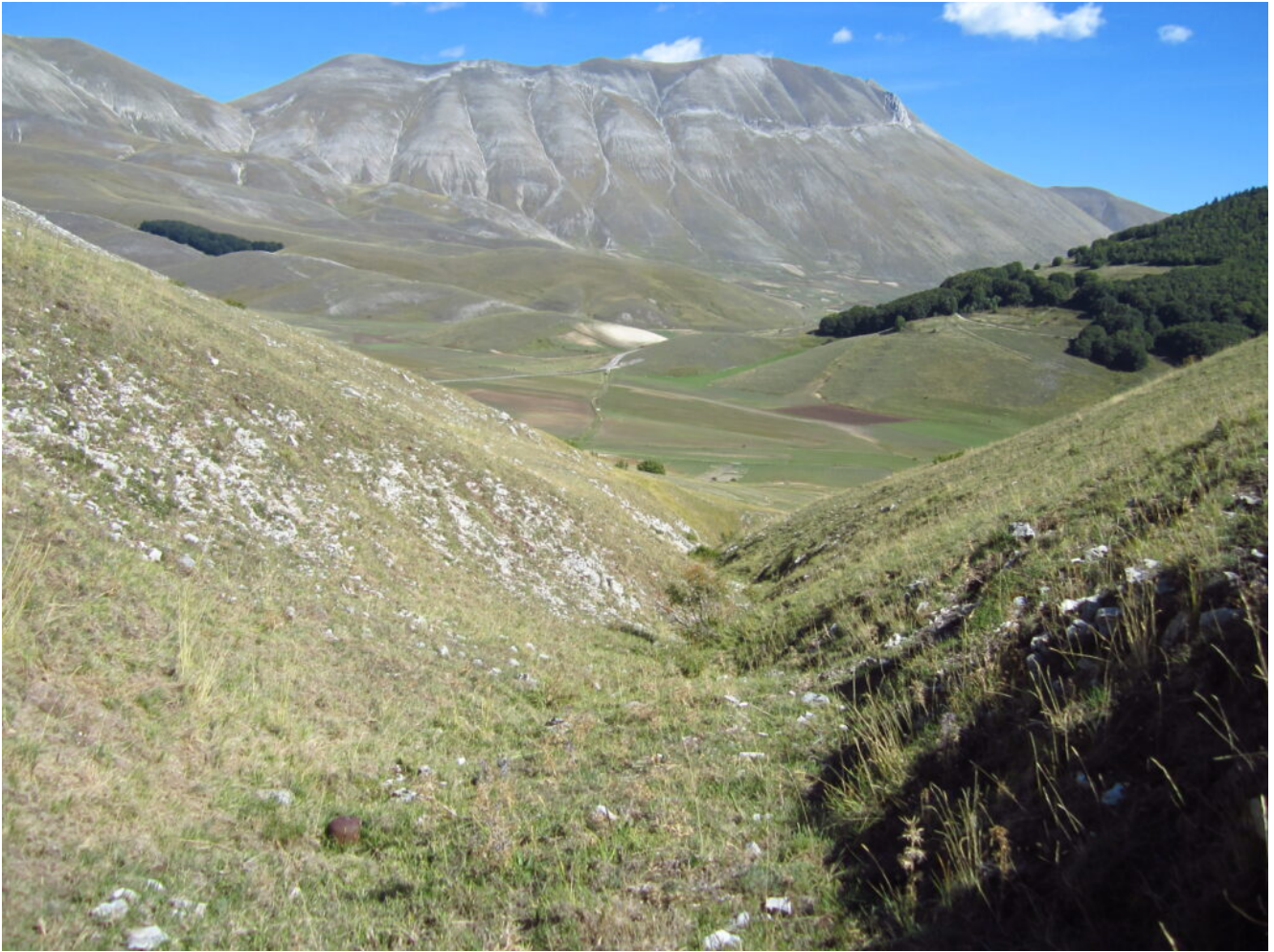
6- La Cima del Redentore vista dalla parte mediana del canale.