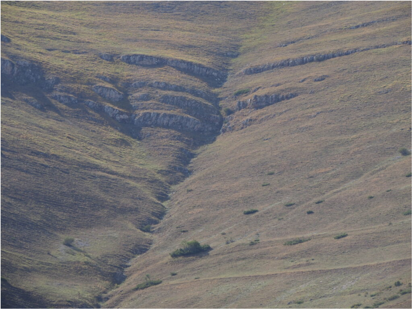
24- La parte finale del canale di salita.