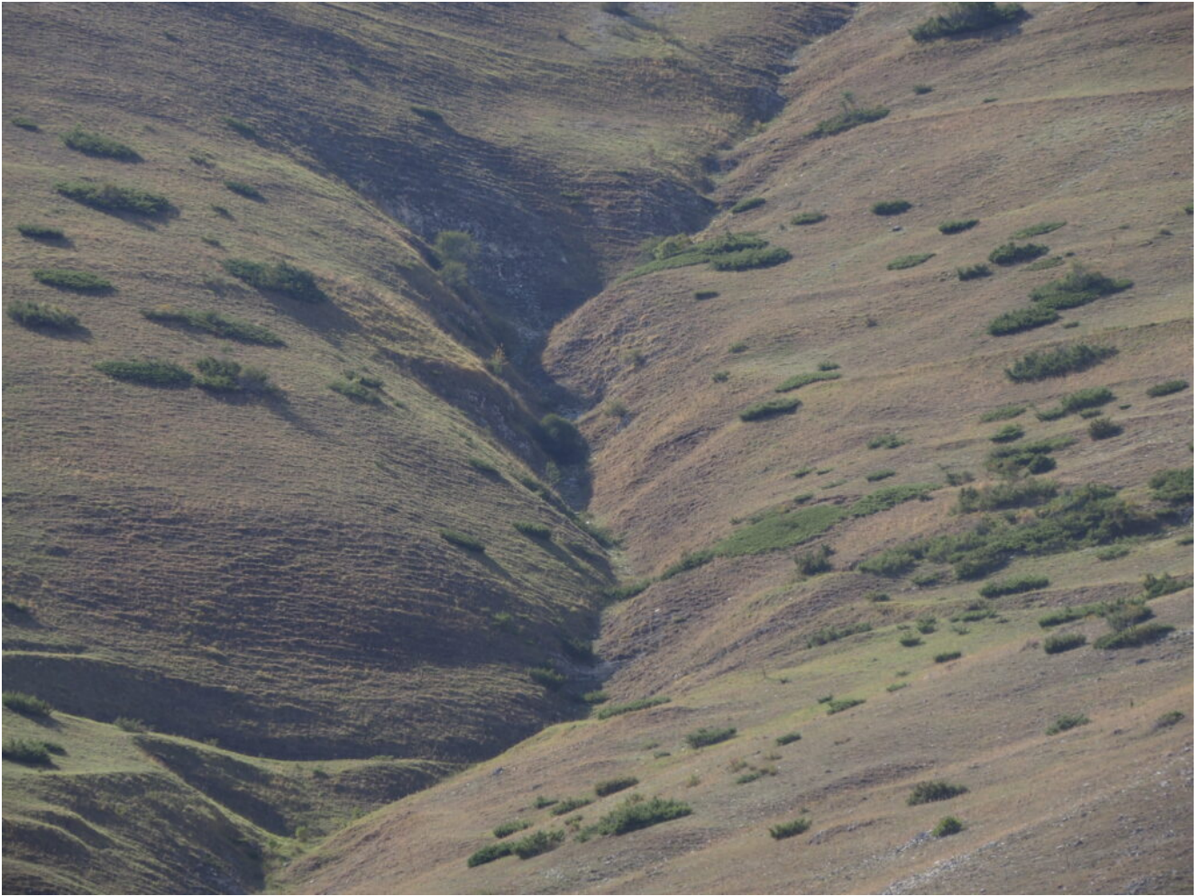
23- La parte mediana del canale di salita.