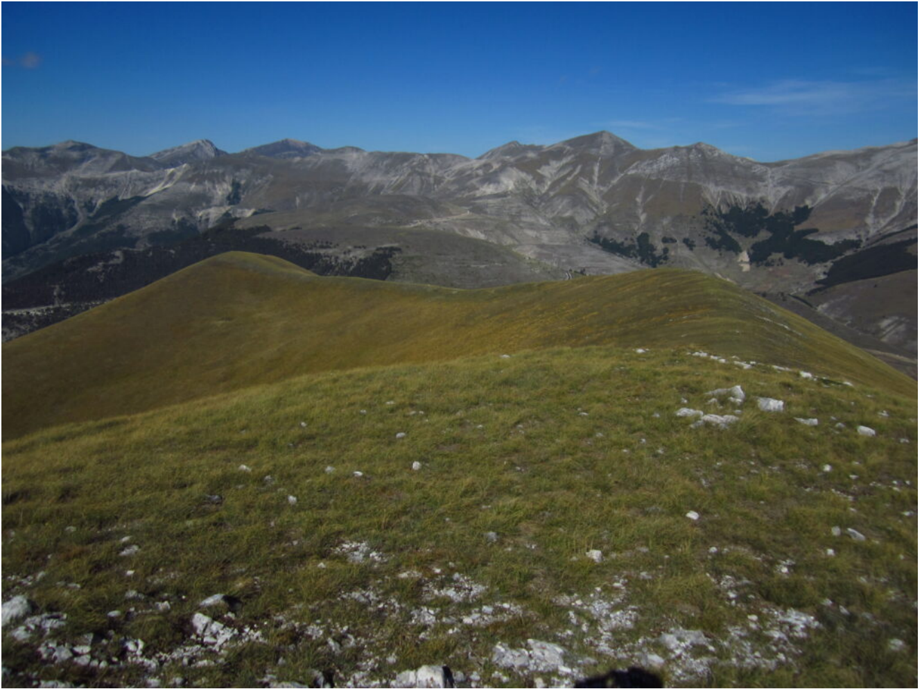
14- Veduta dalla cima di Monte Lieto, da sinistra il Monte Bove Sud, Pizzo Berro, Pizzo Regina e la Cima di Vallinfante, Cima Vallelunga, Monte Porche e Monte Palazzo Borghese.