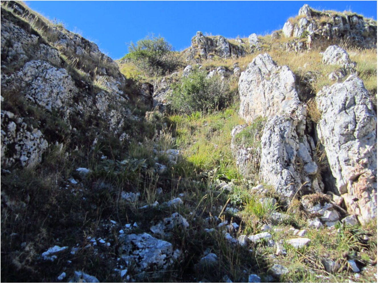
10- I facili risalti rocciosi finali.