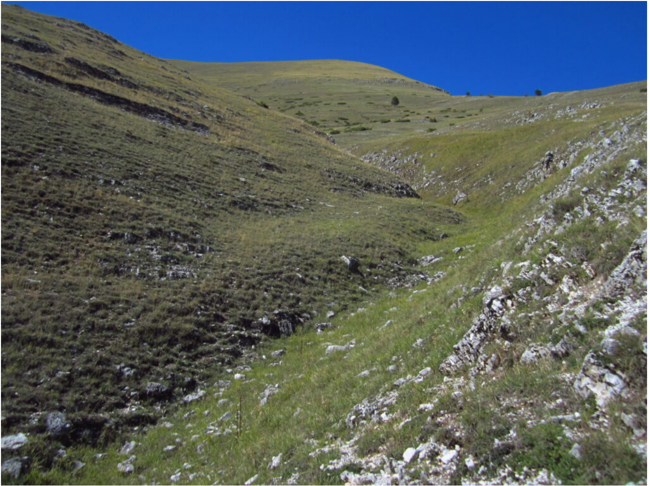
2- La prima parte del canale meno ripida.