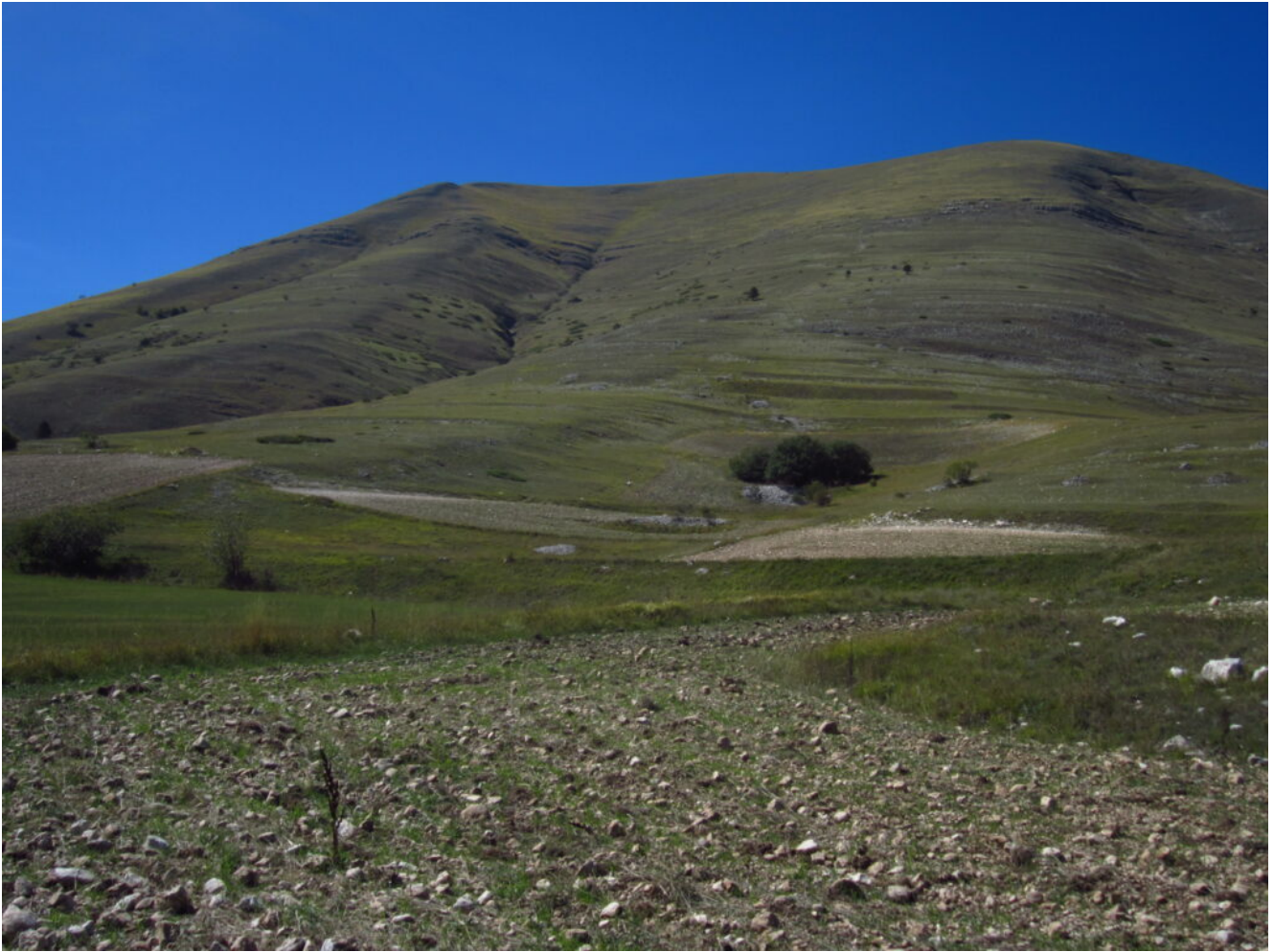
1- Il canale Est del Monte Lieto visto dalla strada del Pian Perduto, all'imbocco della Val Canatra.