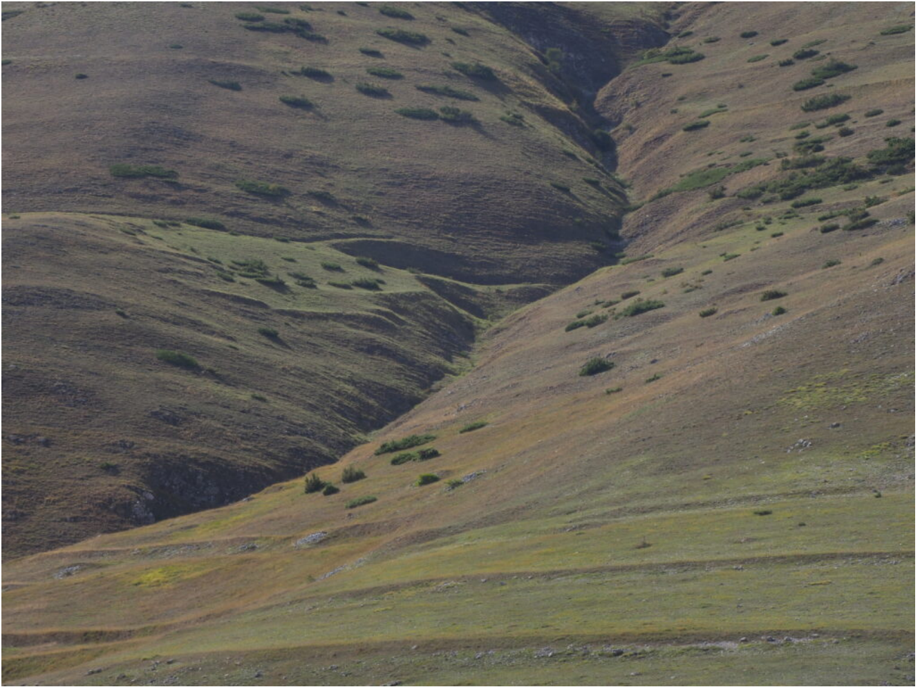
22- La parte iniziale del canale di salita visto da Castelluccio