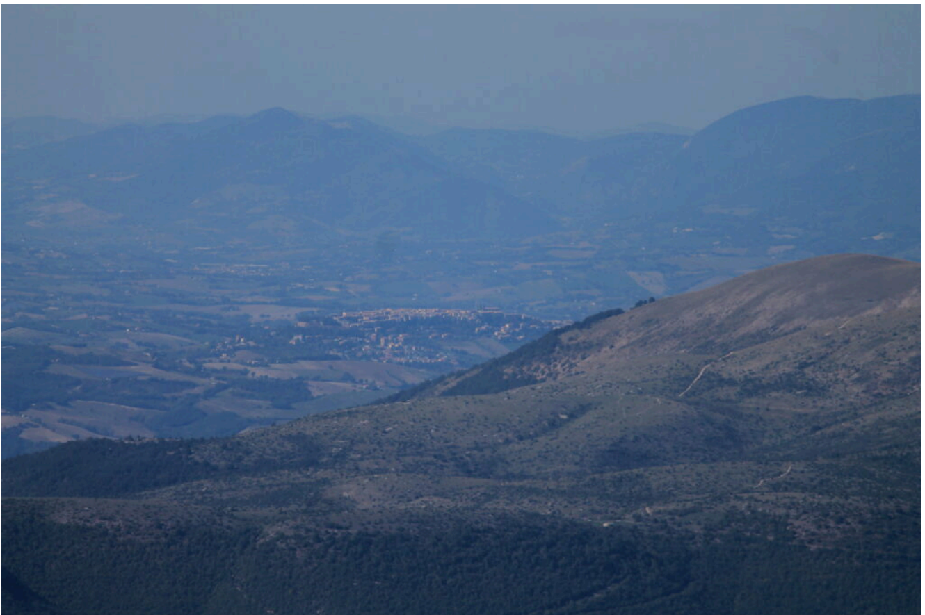
20- Veduta dalla cima di Monte Lieto verso Camerino,