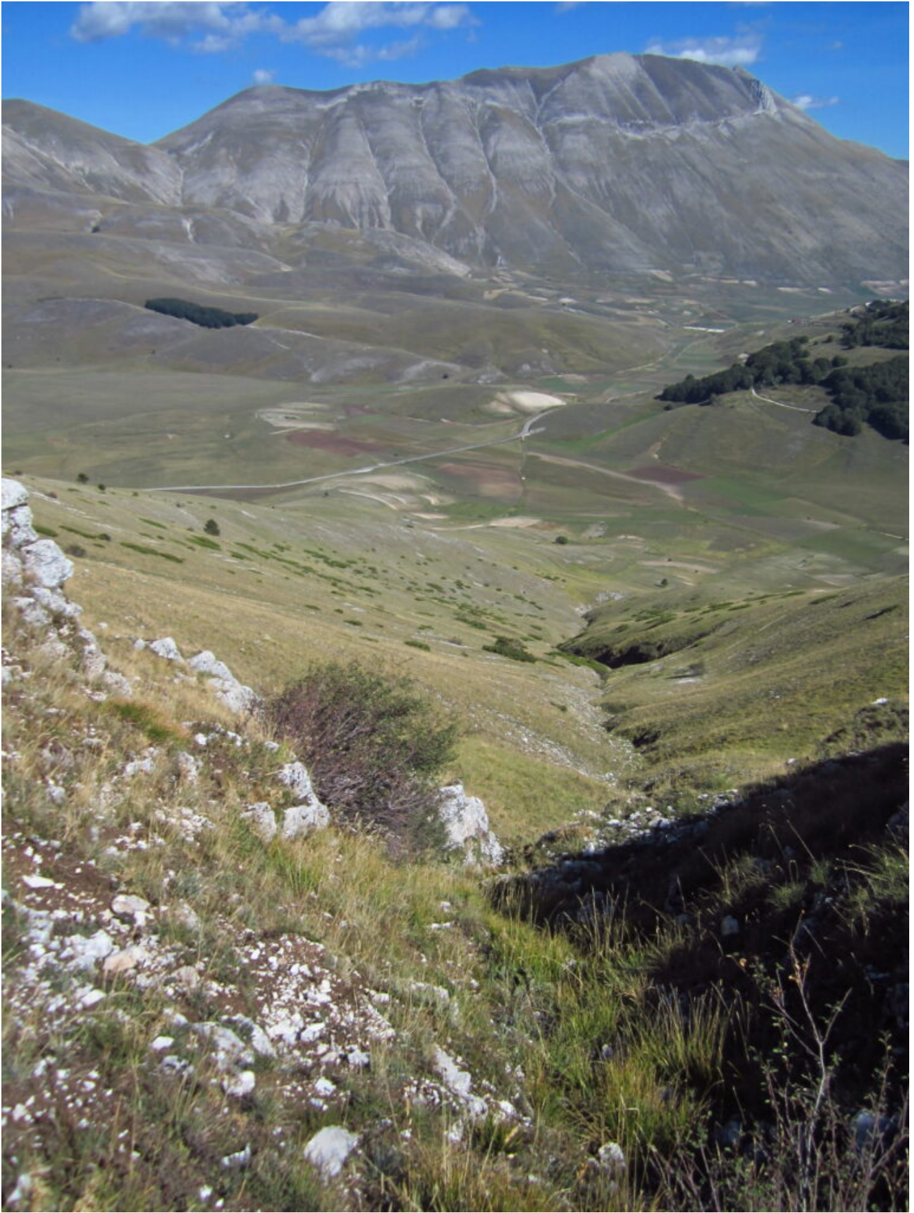
11- Tutto il canale visto dall'inizio del pendio erboso sommitale.