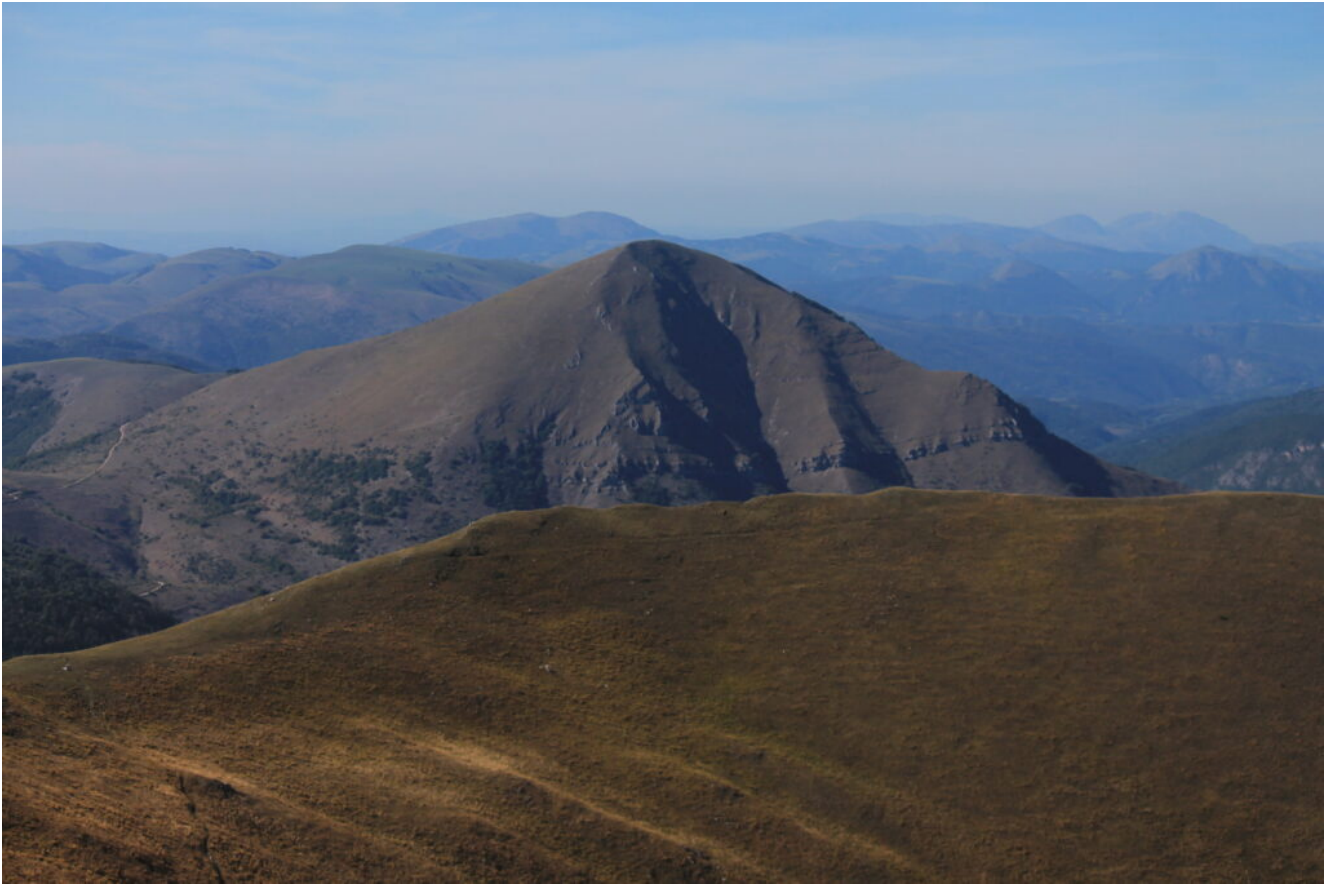
19- Veduta dalla cima di Monte Lieto verso il Monte Cardosa.