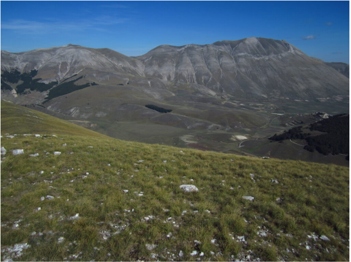
15- Veduta dalla cima di Monte Lieto, da sinistra il Monte Argentella, Forca Viola, Cima di Forca Viola, Quarto San Lorenzo, Cima dell'Osservatorio, Cima del Redentore e Cima del Lago con il sottostante Scoglio dell'Aquila.