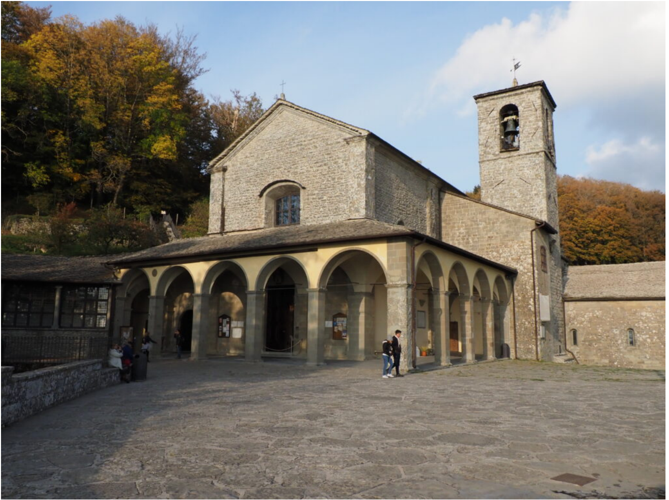
Santuario de La Verna.