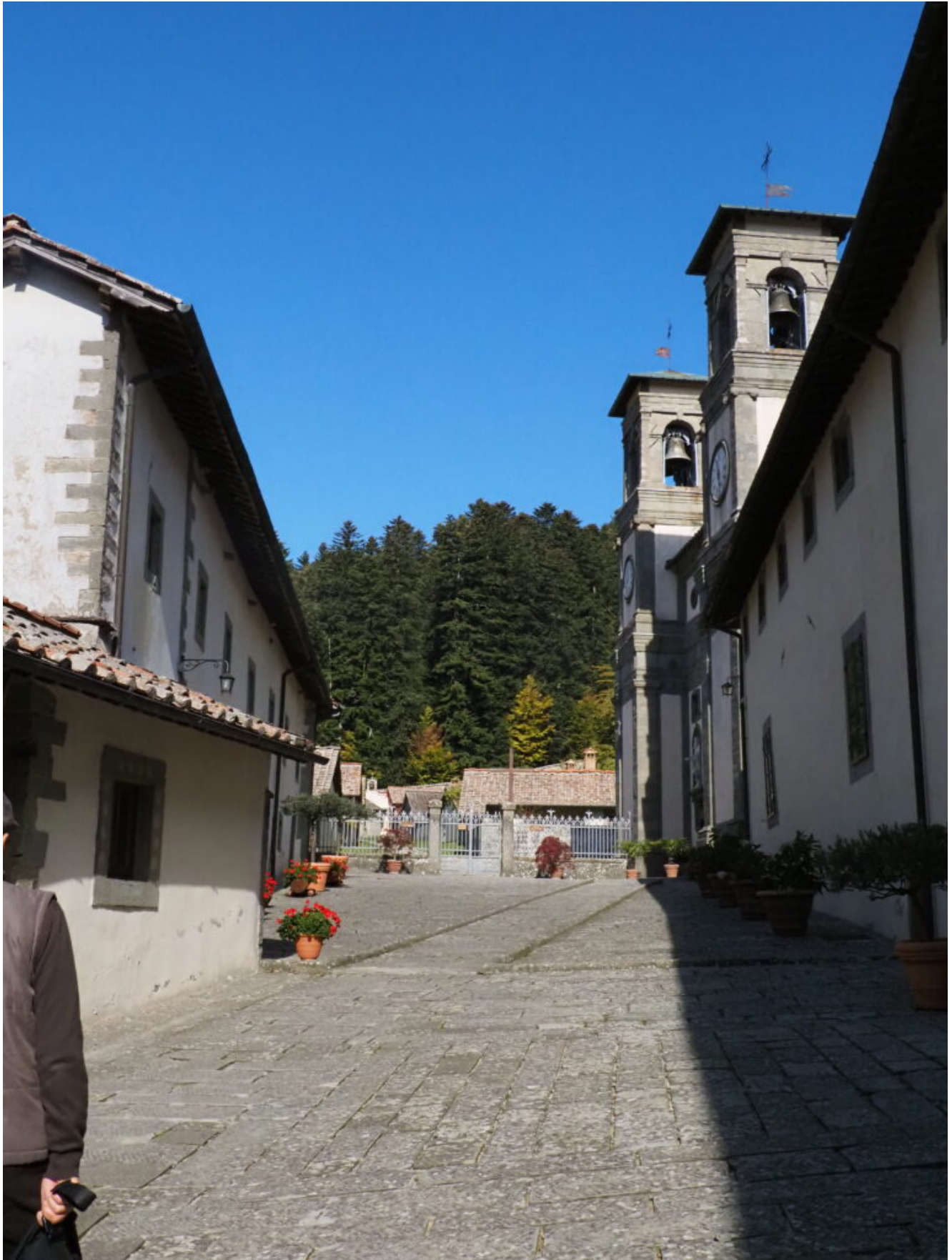
Eremo di Camaldoli FORESTE CASENTINESI