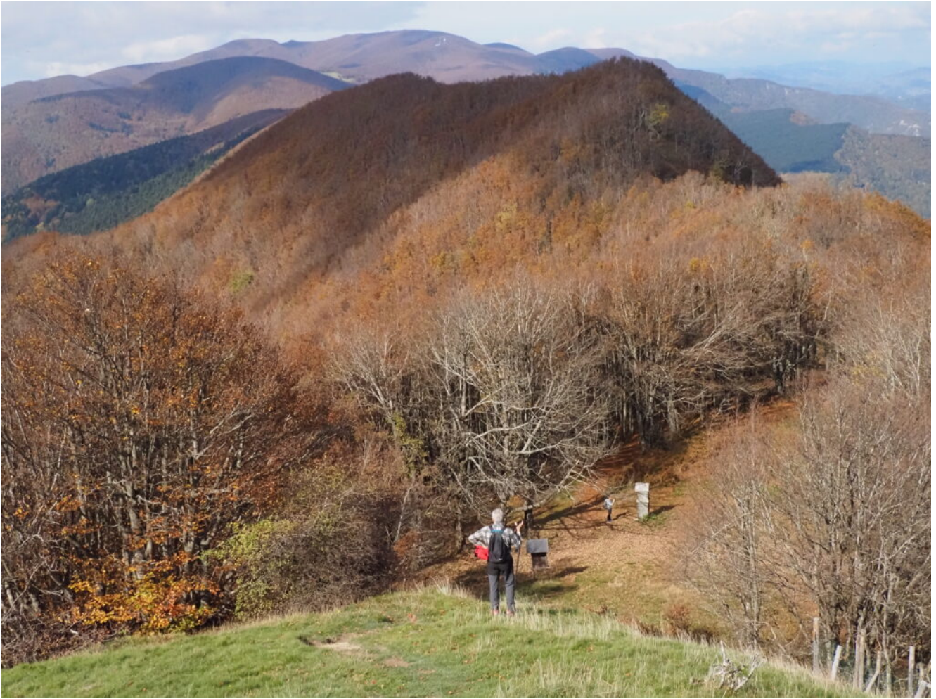
FUNGHI DELLE FORESTE CASENTINESI