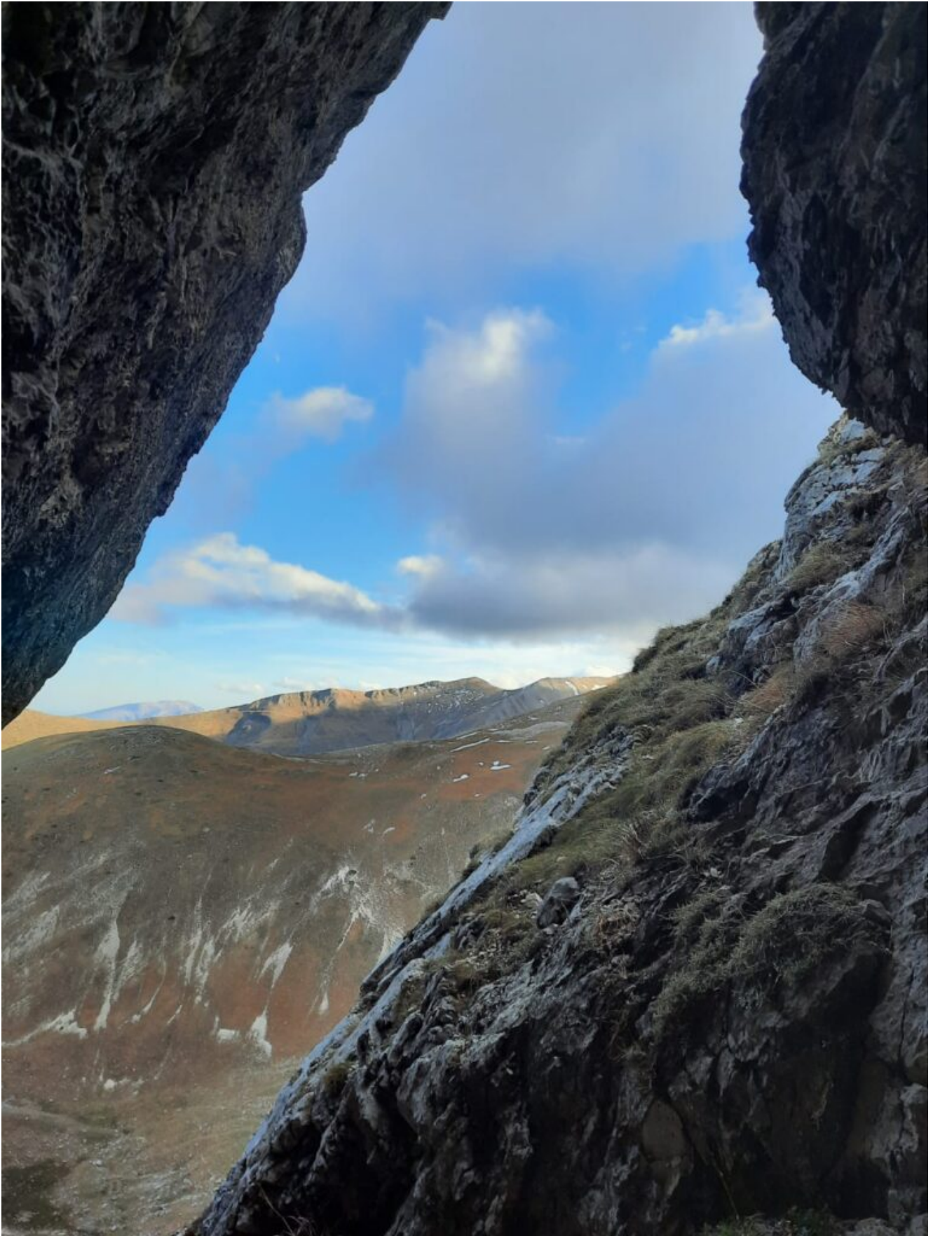
16- La veduta dall'ingresso della grotta.