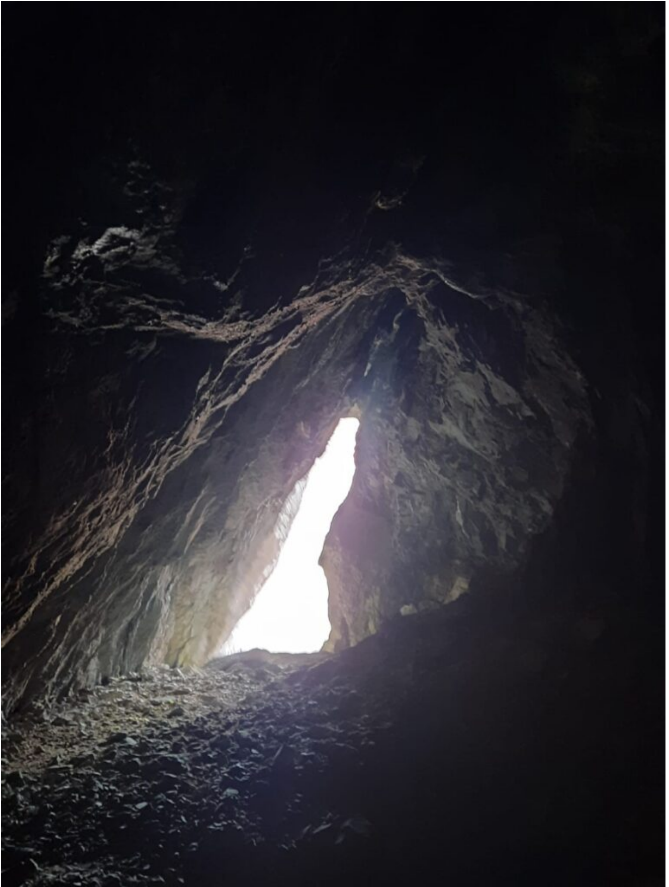
6- Immagini dall'interno dell'ampia cavità.