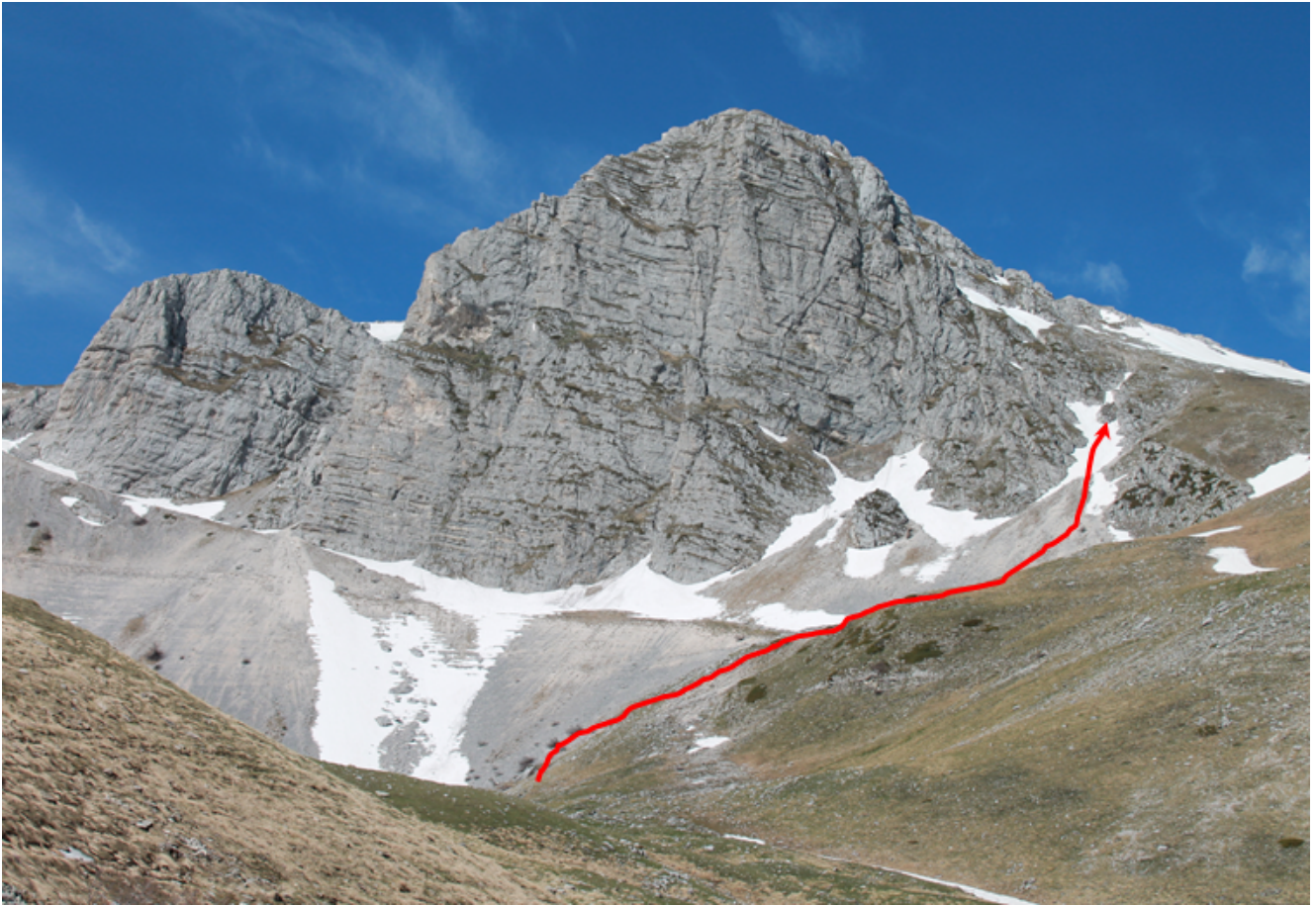
6- L'itinerario di raggiungimento della grotta di Sasso di Palazzo Borghese.