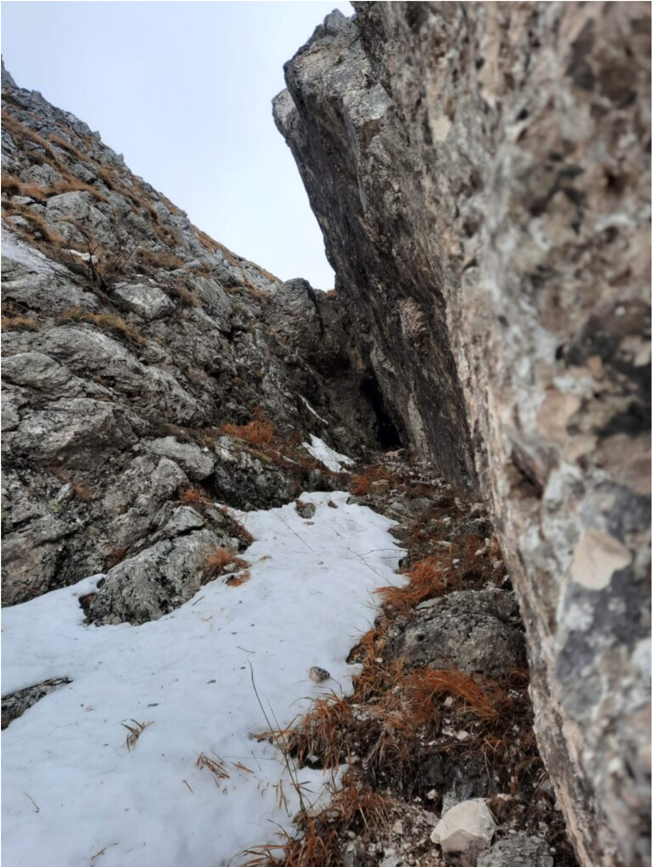
2- Il canalone si chiude tra alte pareti rocciose al di sotto delle quali si apre la cavità.