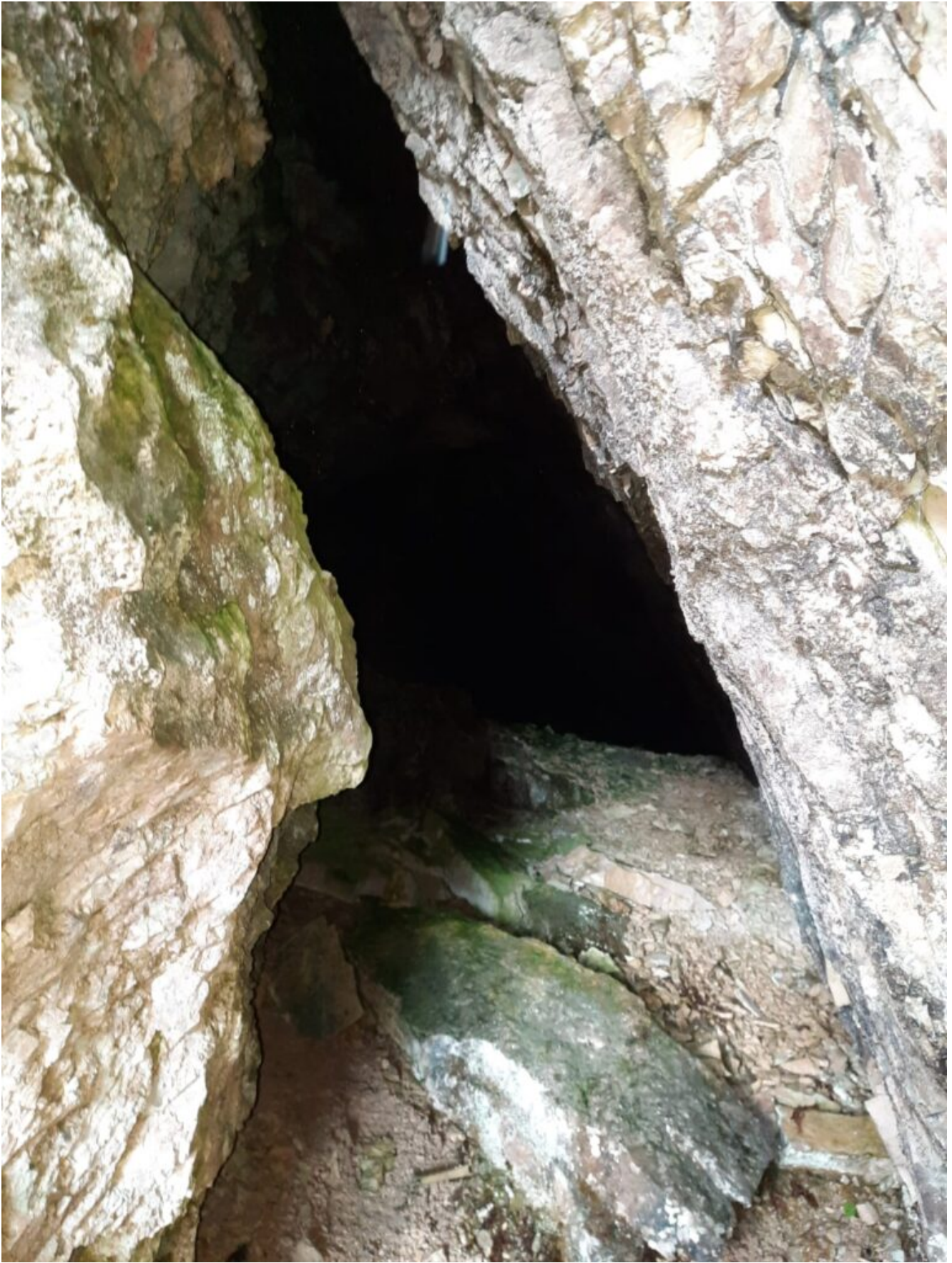
3- Lo stretto ingresso della grotta che poi si apre nel suo interno.