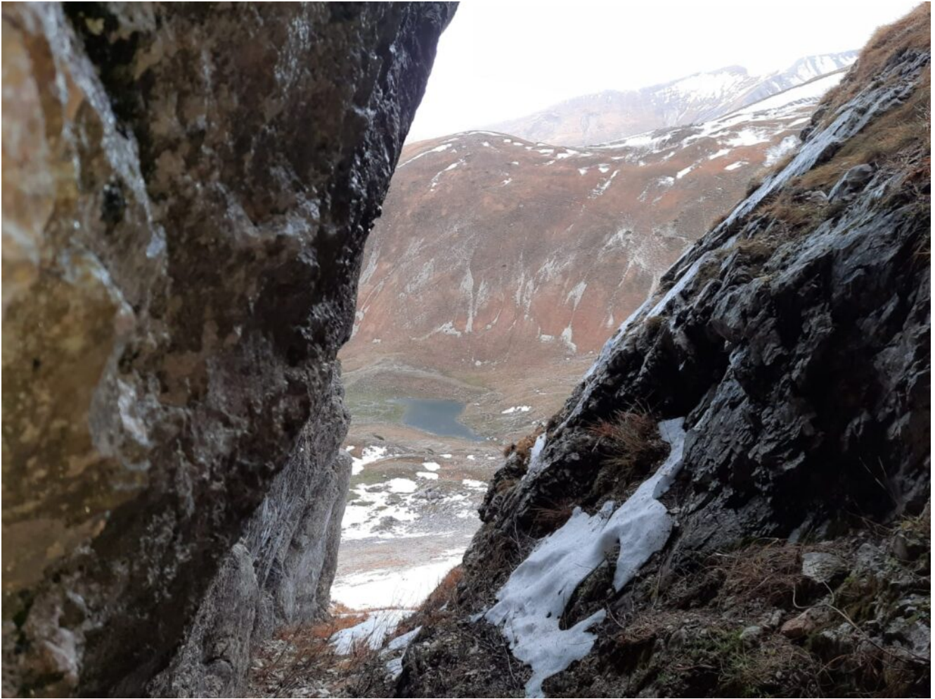
4 – 5-Veduta del Laghetto di Palazzo Borghese dall'interno della grotta.