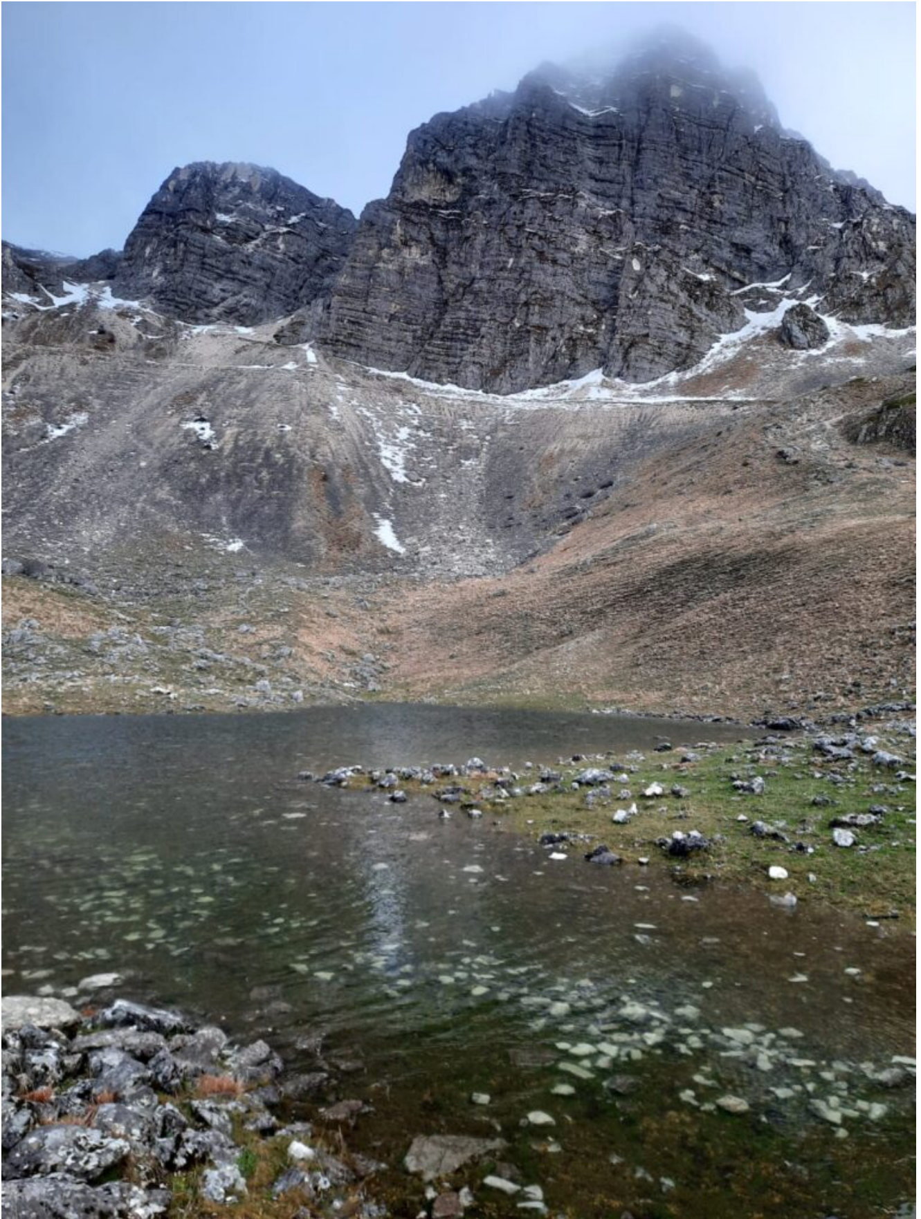
1- La parete Est di Sasso di Palazzo Borghese in assenza di innevamento a metà dicembre, il Laghetto già si è formato.