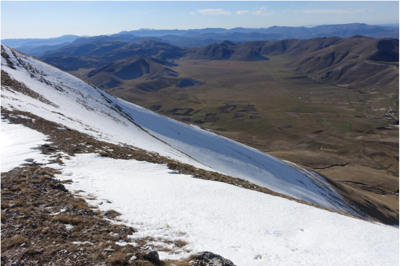
20- Veduta aerea del Piano Grande.