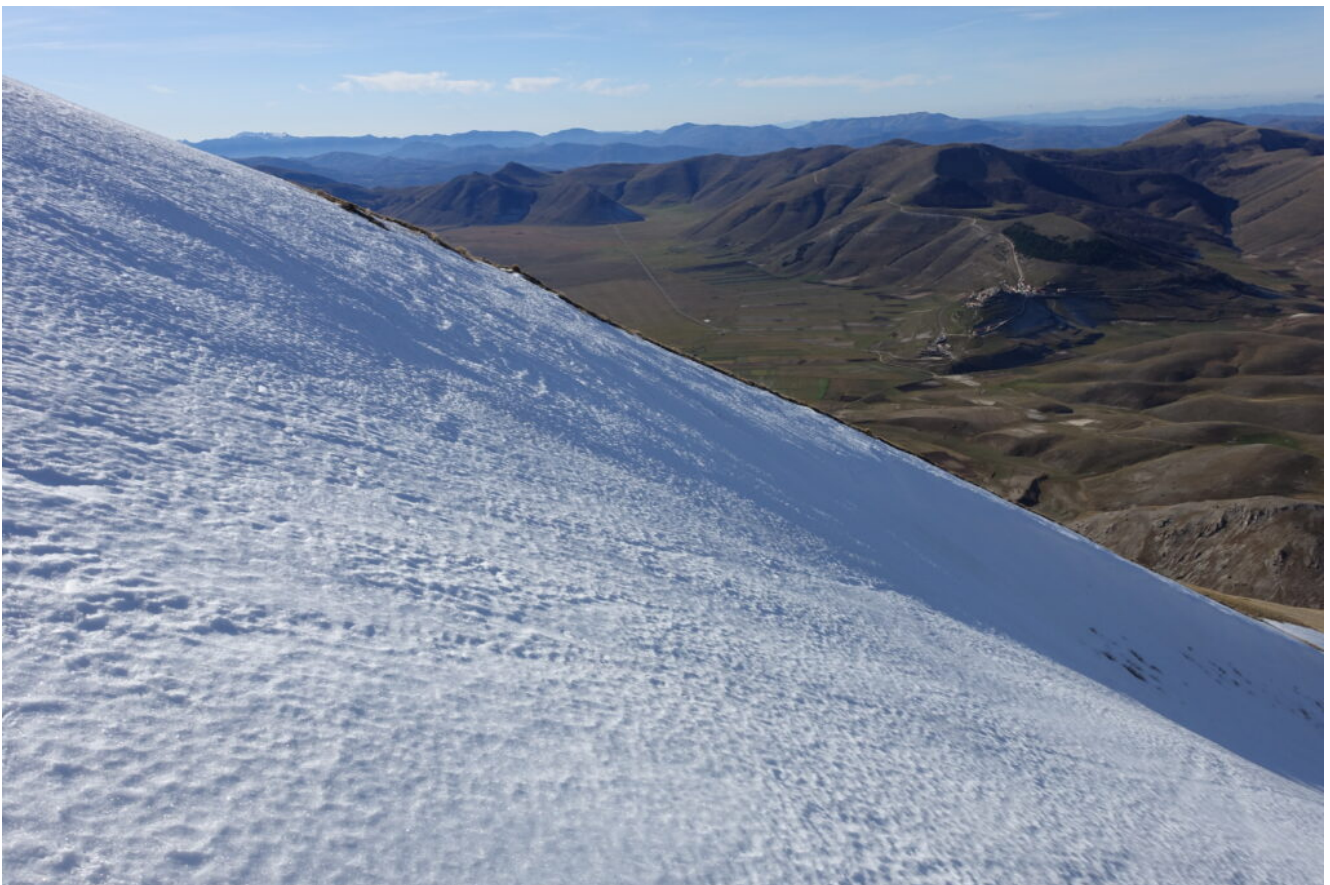
21- Veduta aerea di Castelluccio