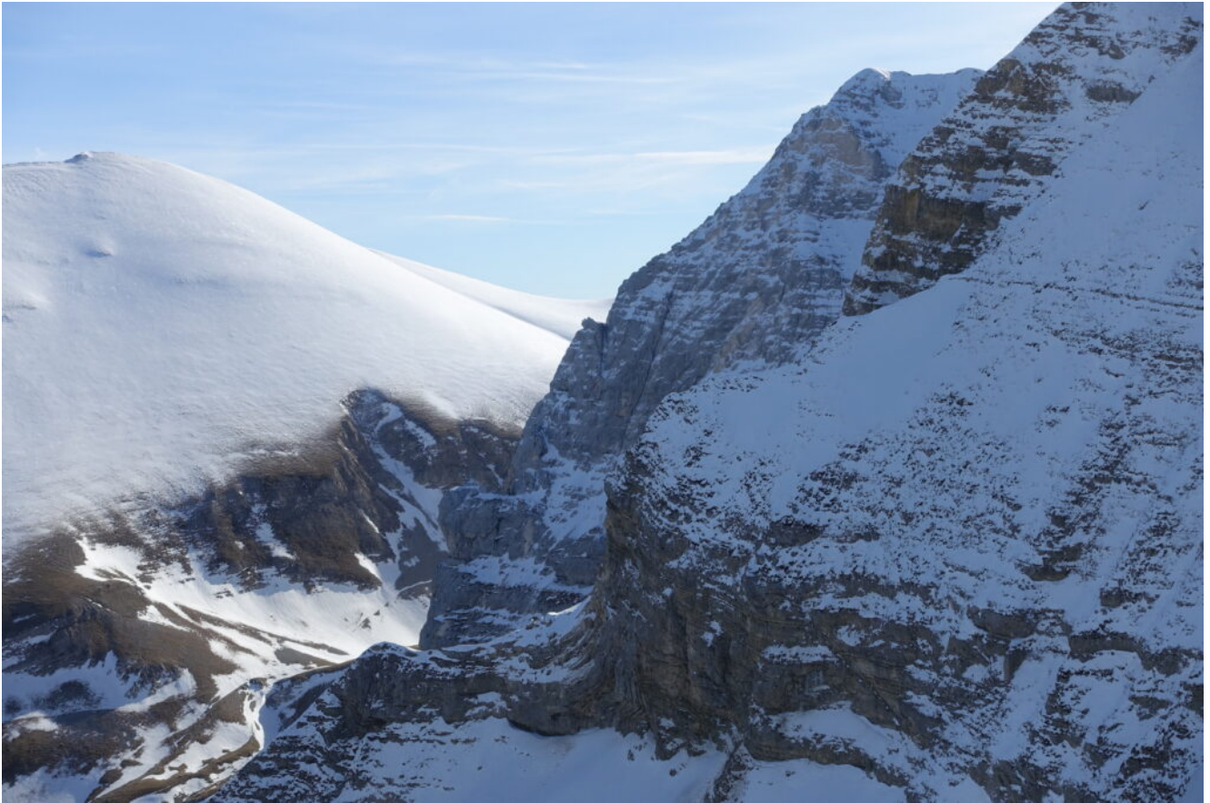
14- Il Pizzo del Diavolo