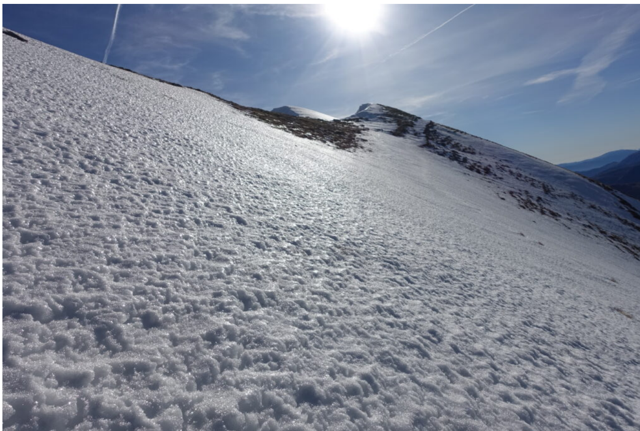
12- La cresta che collega Quarto San Lorenzo alla Cima dell'Osservatorio.