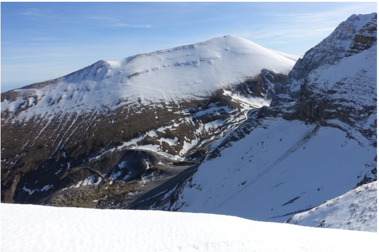
15 – 16- Il Monte Vettore