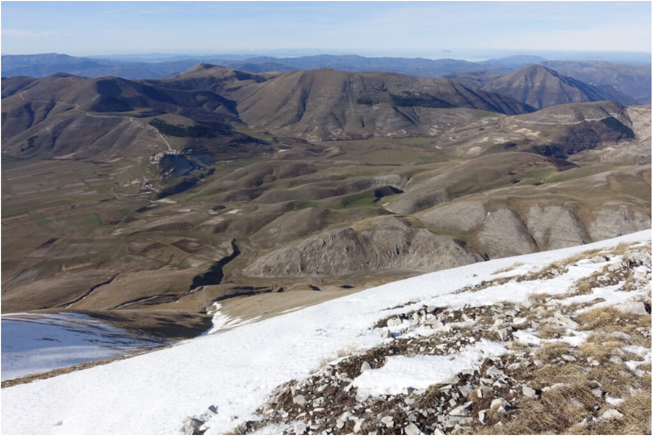
22- Il canale di salita visto dalla cima di Quarto San Lorenzo.