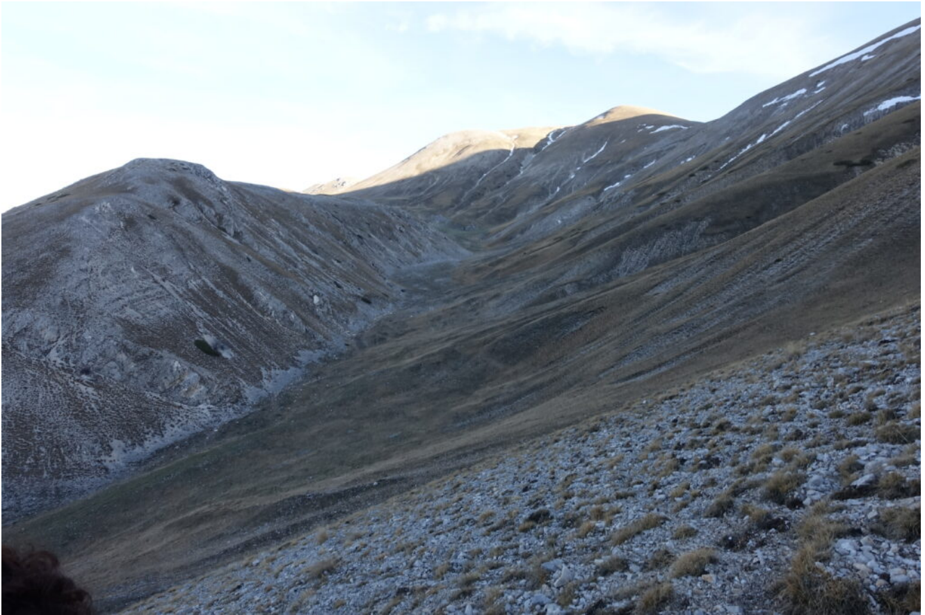
3- La Valle delle Fonti ed il Monte Argentella.