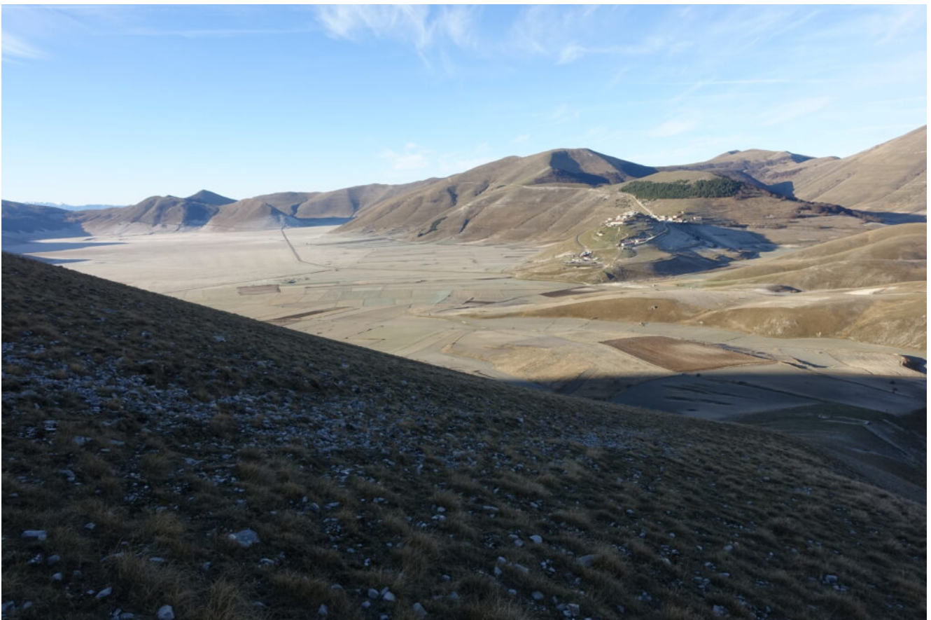
2- Castelluccio e il Piano Grande visto dall'imbocco del canale di salita.