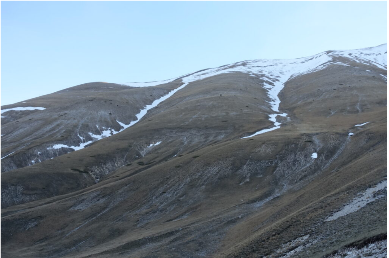
1- L'avvicinamento al canale Ovest, a destra.