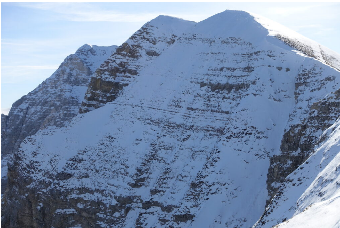
13- La Cima dell'Osservatorio