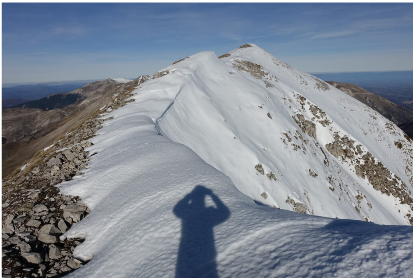
18 – 19- La cima di Quarto San Lorenzo