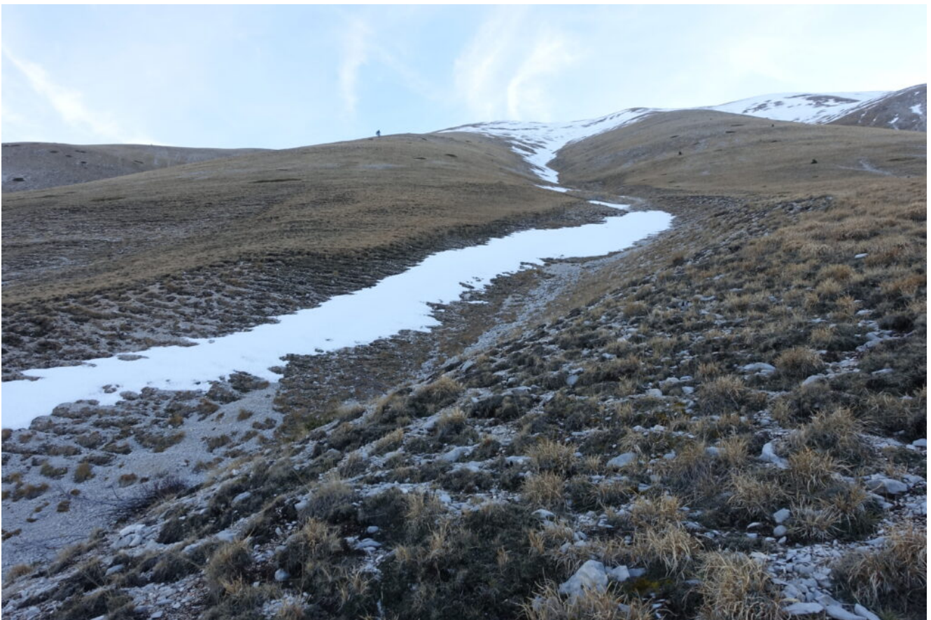
4- L'imbocco del canale di salita con una sottile e penosa striscia di neve per fortuna ottimamente gelata.