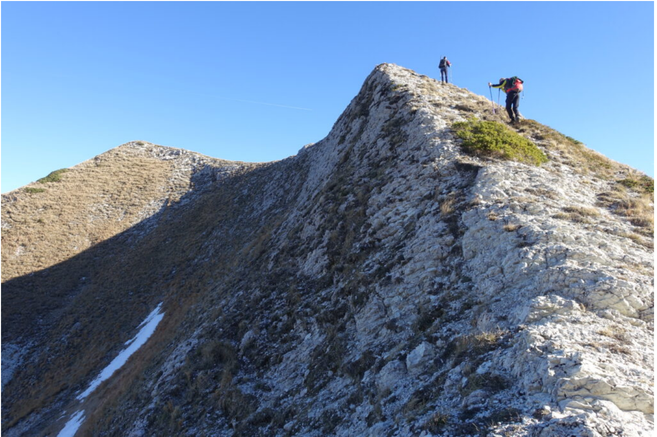
7- 8- Salita della cresta rocciosa a destra di Forcella Cucciolara.