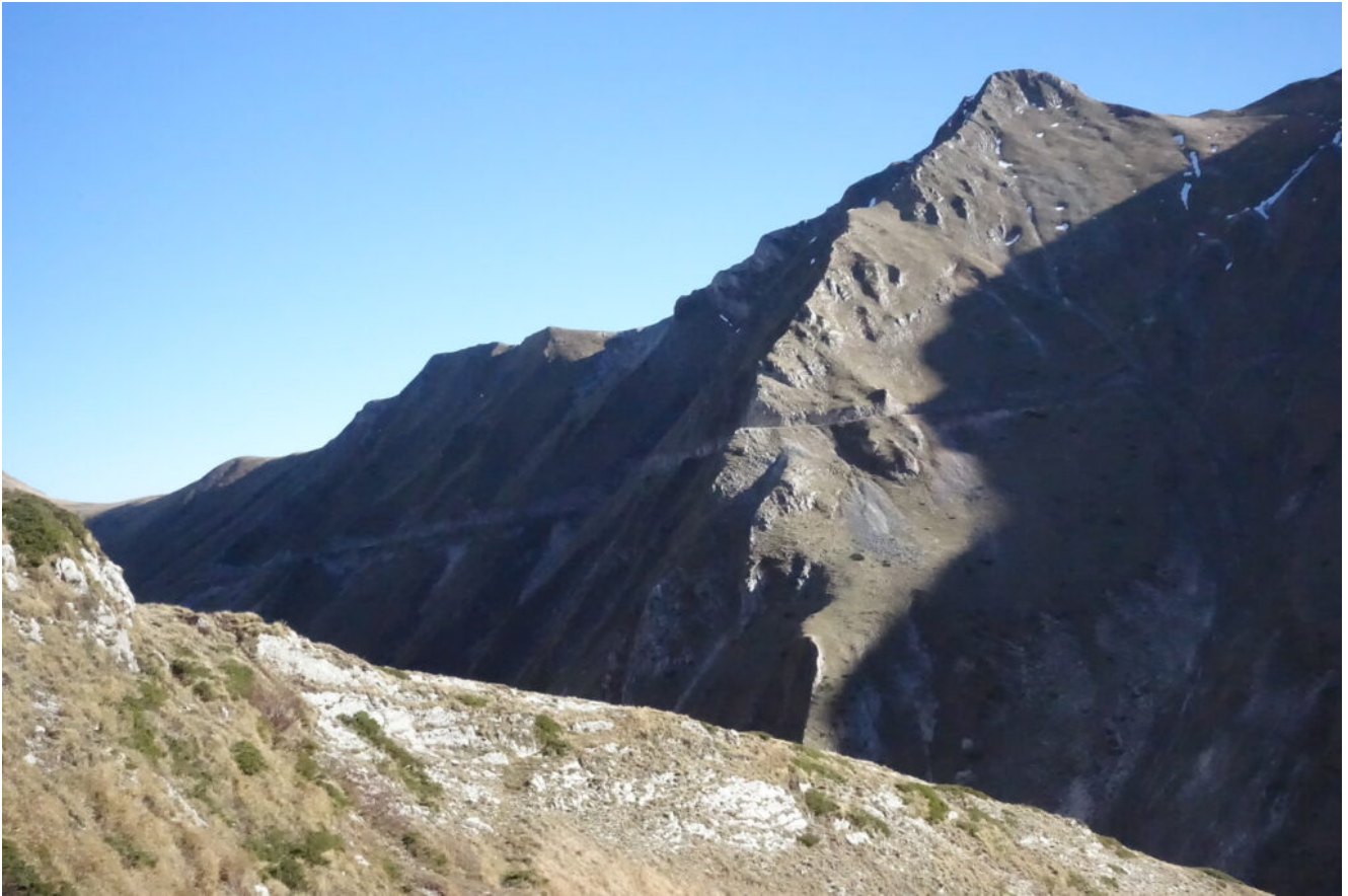
25- La cresta Nord del Monte Acuto.