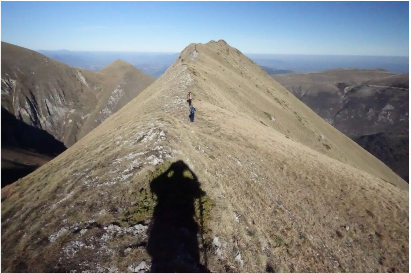
10 - 12 - Fasi di discesa della lunga e aerea cresta verso Punta Bambucerta