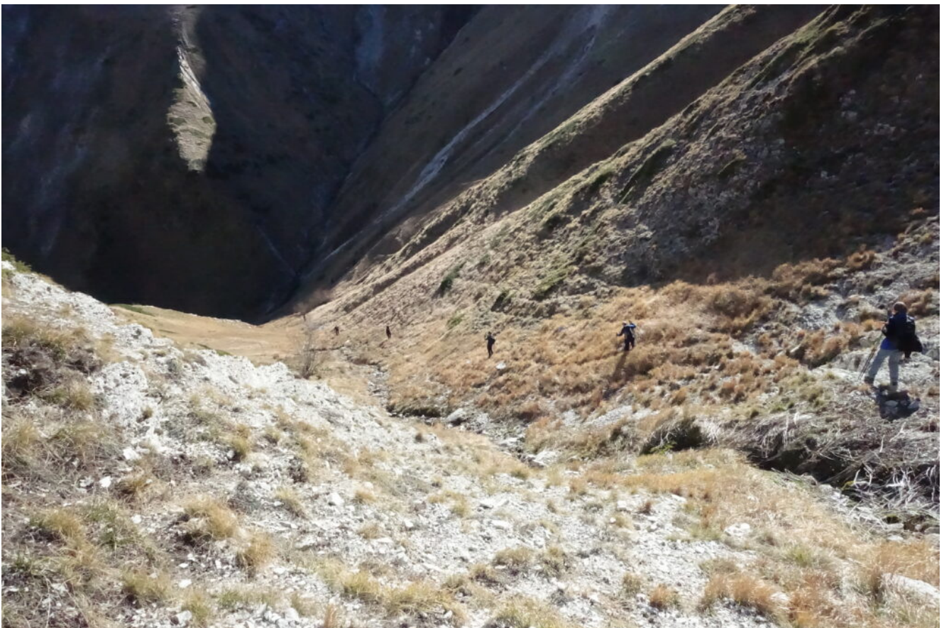
26- Discesa dalla Forcella Cucciolara verso le sorgenti del Fiastrone