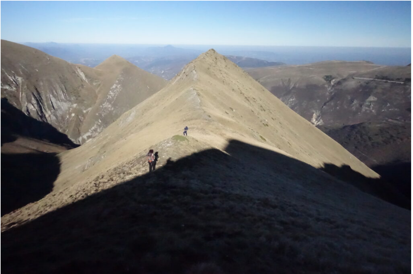
9- Discesa della cresta Nord della Cima di Costa Vetiche (non riportata sulle carte) fino alla Punta Bambucerta.