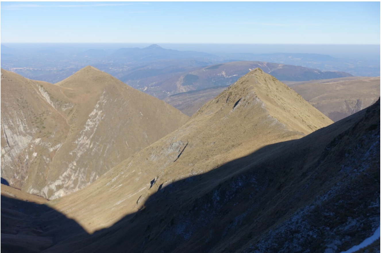
5- Veduta verso Nord dalla Forcella Cucciolara con la Punta