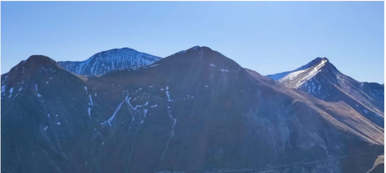
28- Panoramica dalla Forcella Cucciolaria.