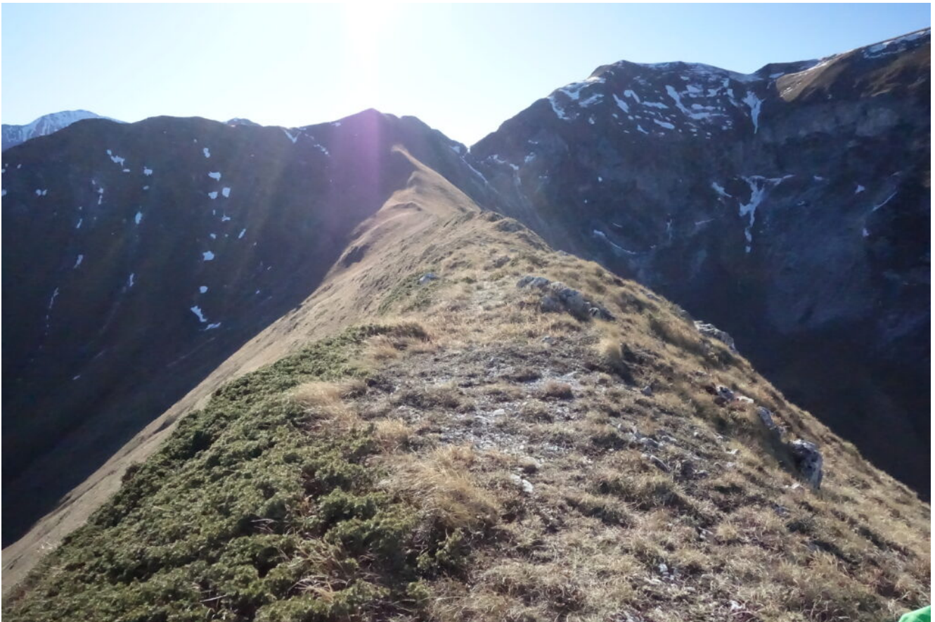
14- Veduta verso Sud dalla Punta Bambucerta