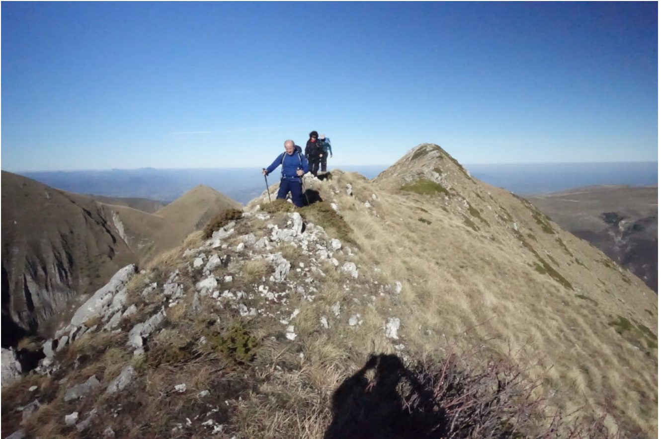
15 – 24 – Fasi di ritorno dalla cima di Punta Bambucerta.