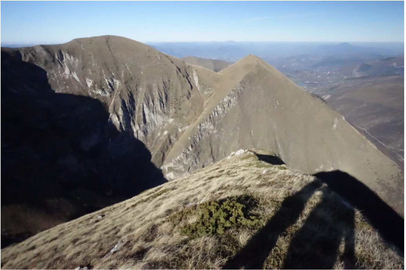
13- Veduta verso Nord dalla Punta Bambucerta