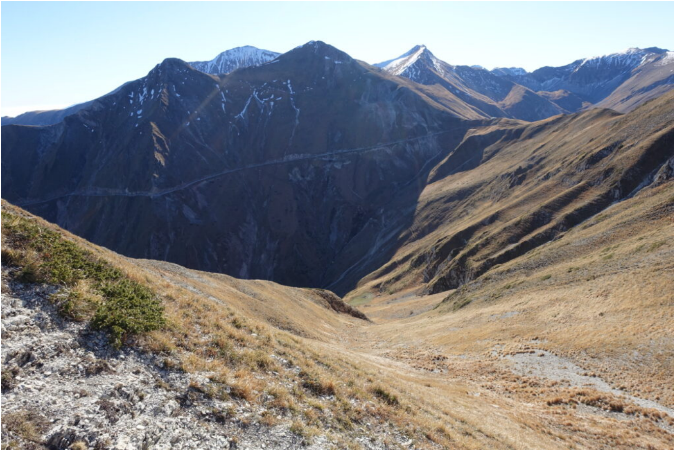
4- Veduta verso Sud dalla Forcella Cucciolara, si scopre anche il Pizzo Regina (tra il M.Acuto ed il P.Tre Vescovi) ed il Pizzo Berro.