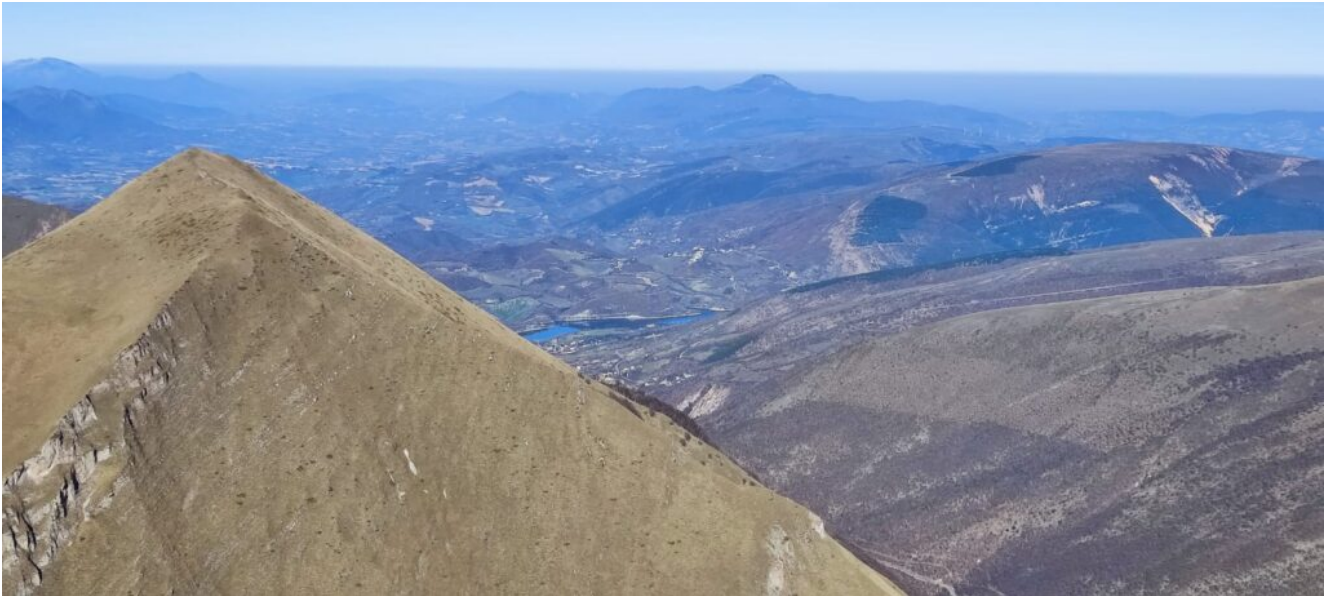
27- Monte Cacamillo ed il Lago di Fiastra.