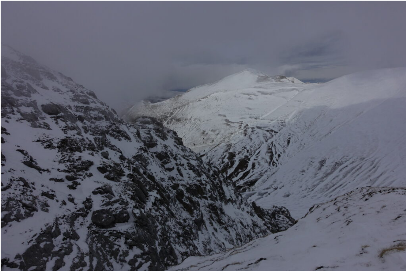
19- Il Monte Bove Nord in un momento di diradamento della nebbia.