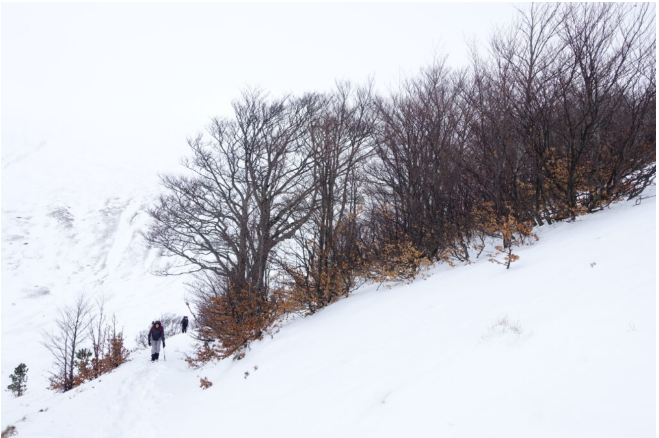
5- Verso la Forcella Passaiola.