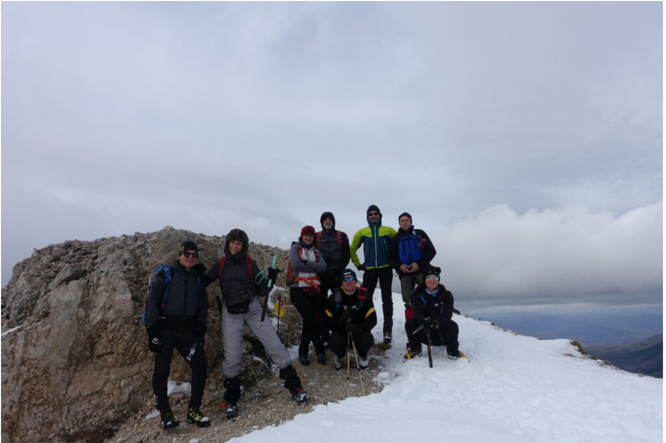
6- Foto di gruppo alla Forcella Passaiola.