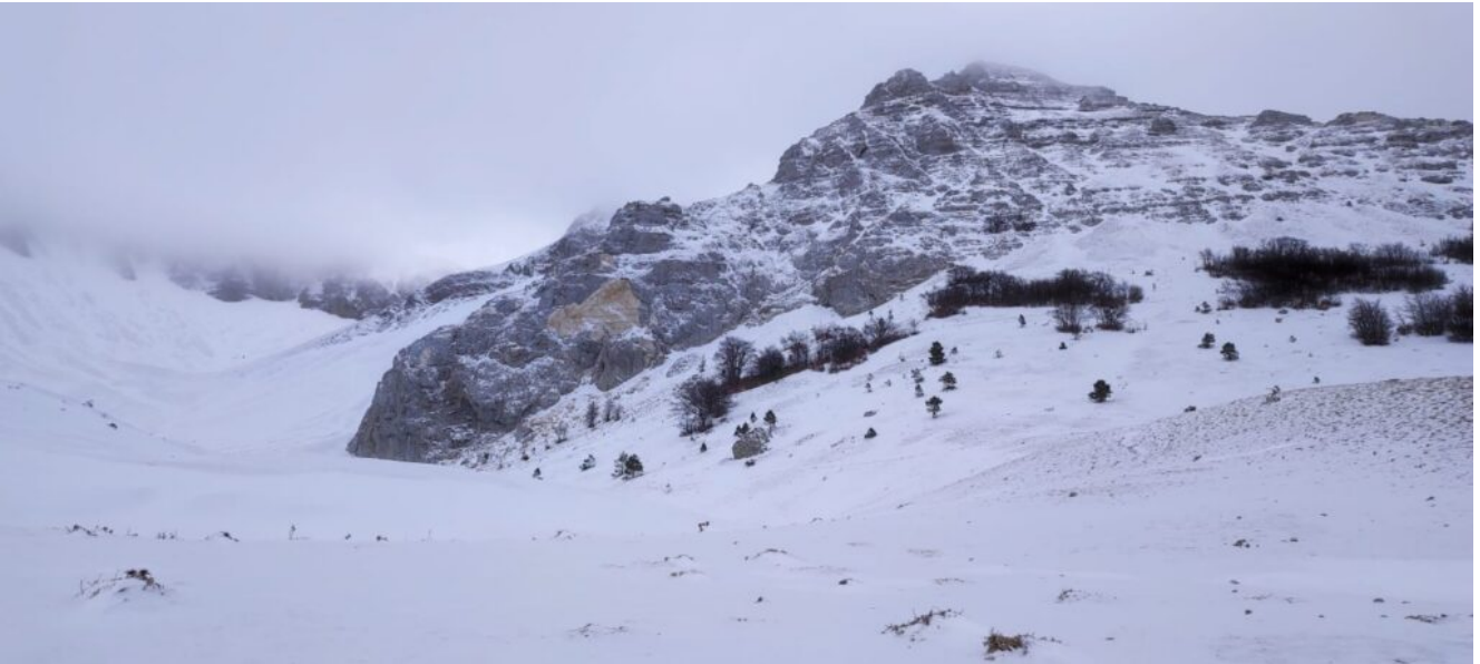
2- La Val di Bove e la parete Nord del Monte Biccio.