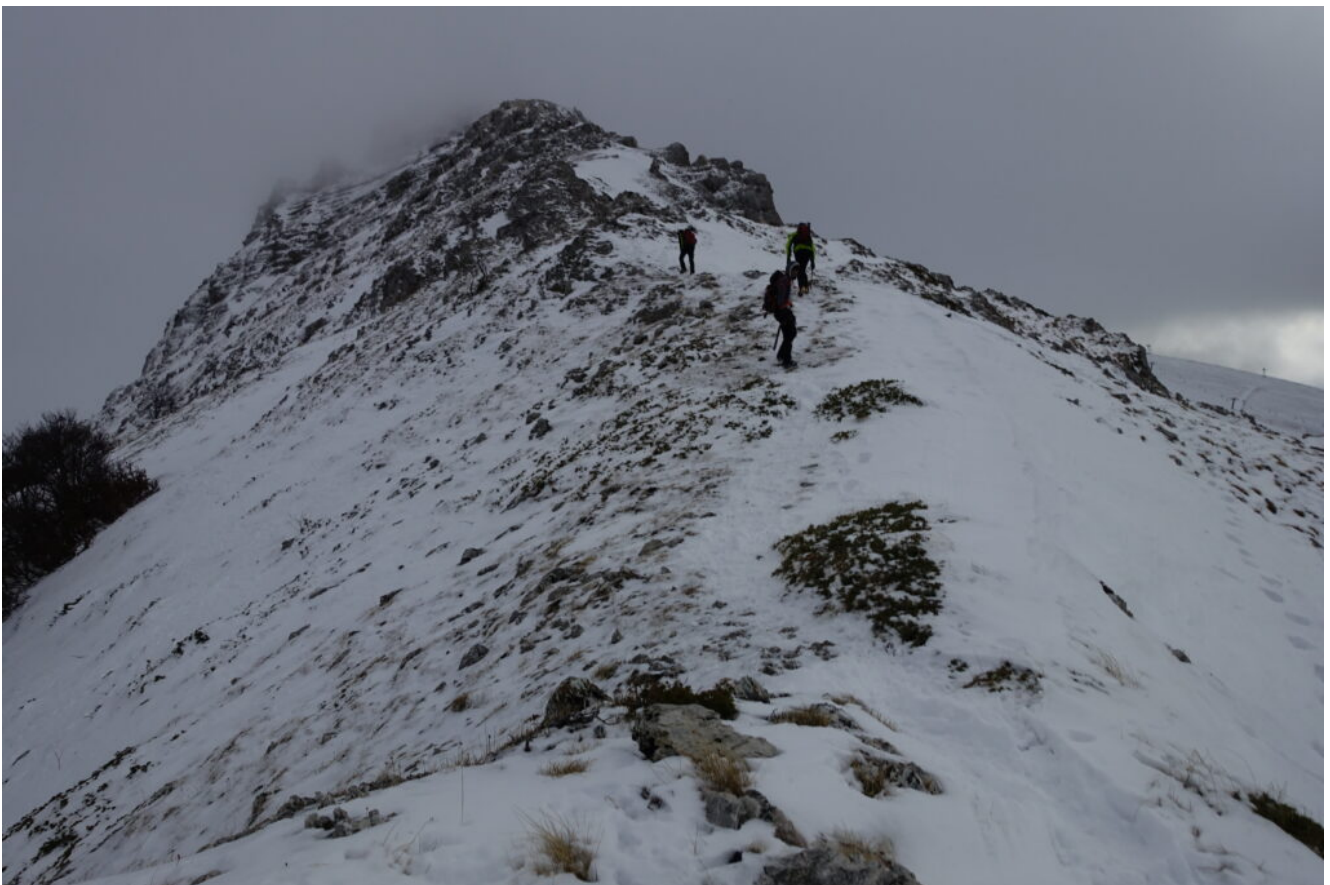
7 – 15- Momenti di salita della cresta Nord del Monte Bicco.