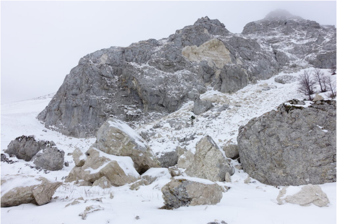
4- Sul sentiero per la Forcella Passaiola, sotto alla grande frana del Monte Bicco.