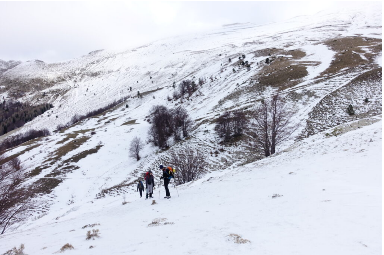
3- Il versante Ovest del Monte Bove Nord. nei pressi della Fonte di Val di Bove, con scarsissimo innevamento