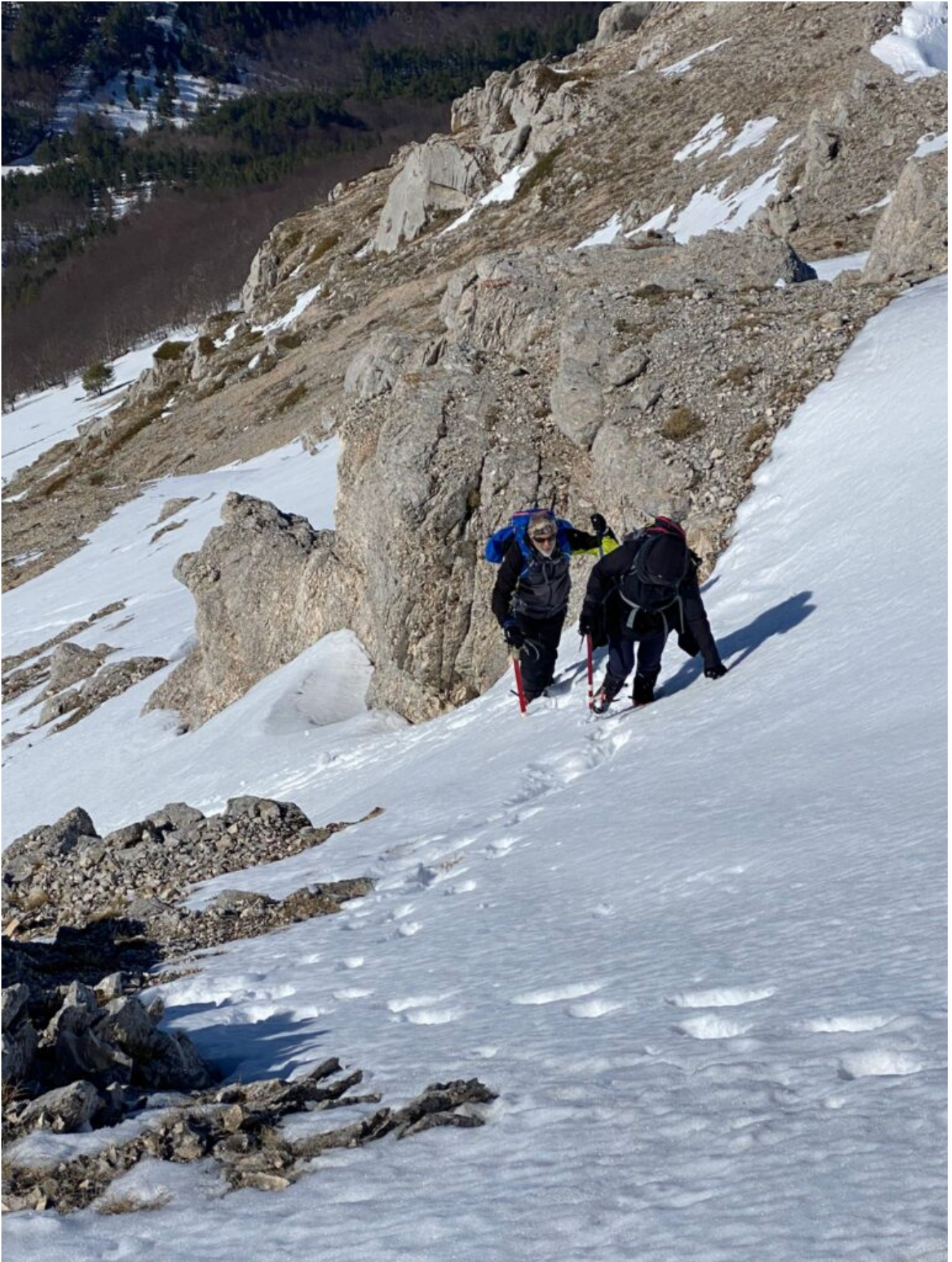
4- Nei pressi della prima fascia di rocce che stringono il pendio.