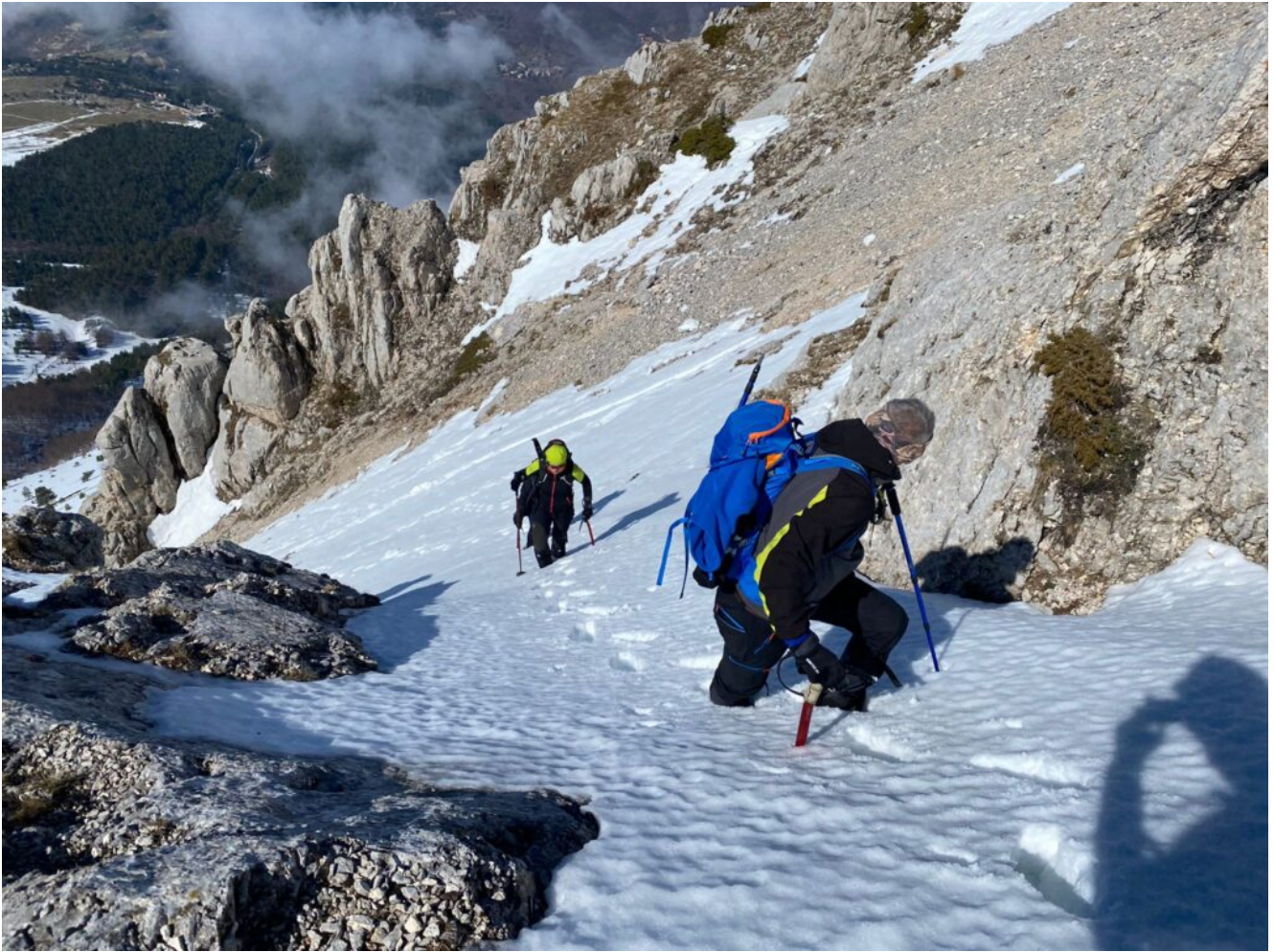
7- 14- Il Tratto più ripido