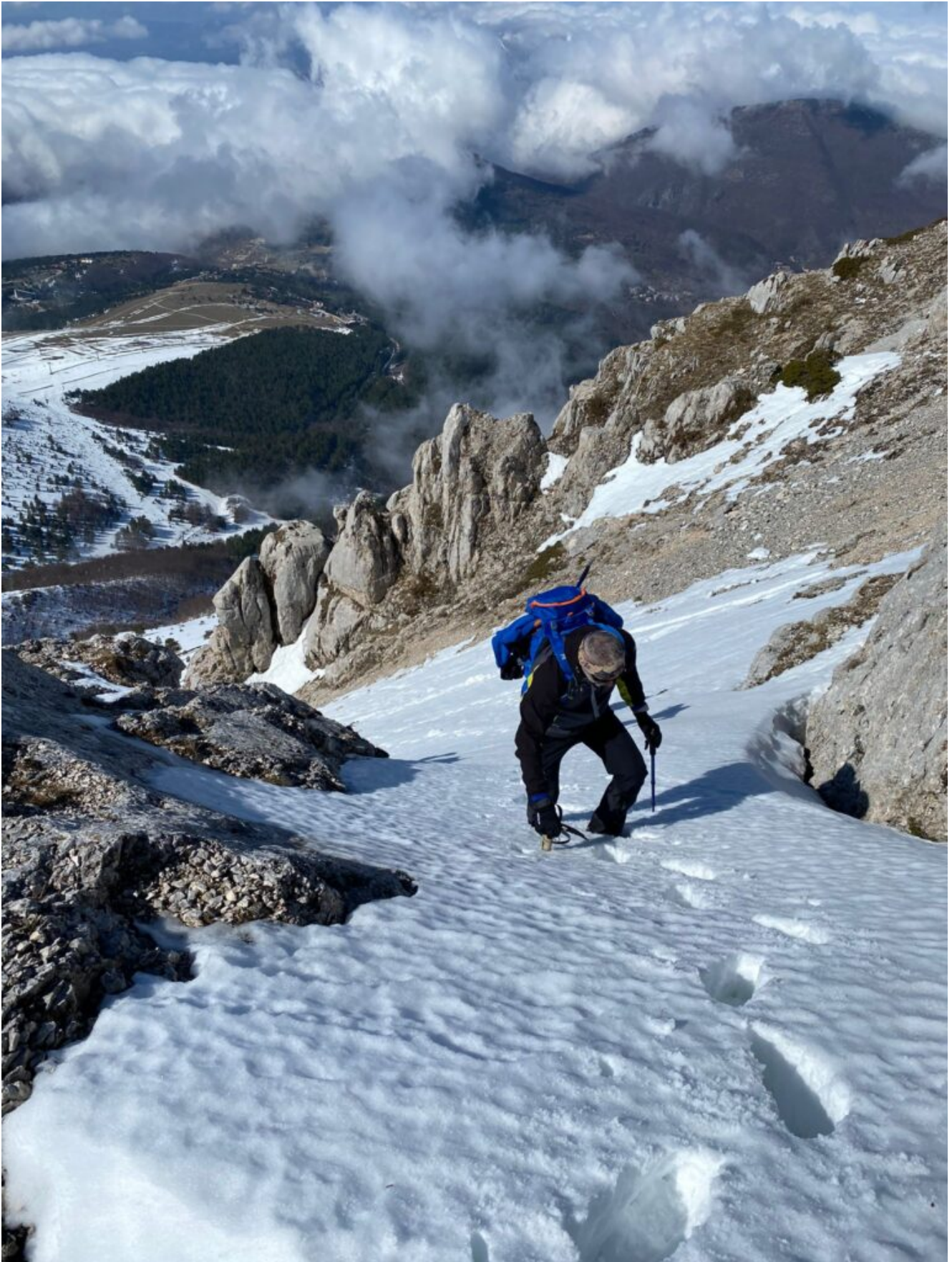
8 – 9- L'uscita dal tratto più stretto e ripido, prima della cresta.