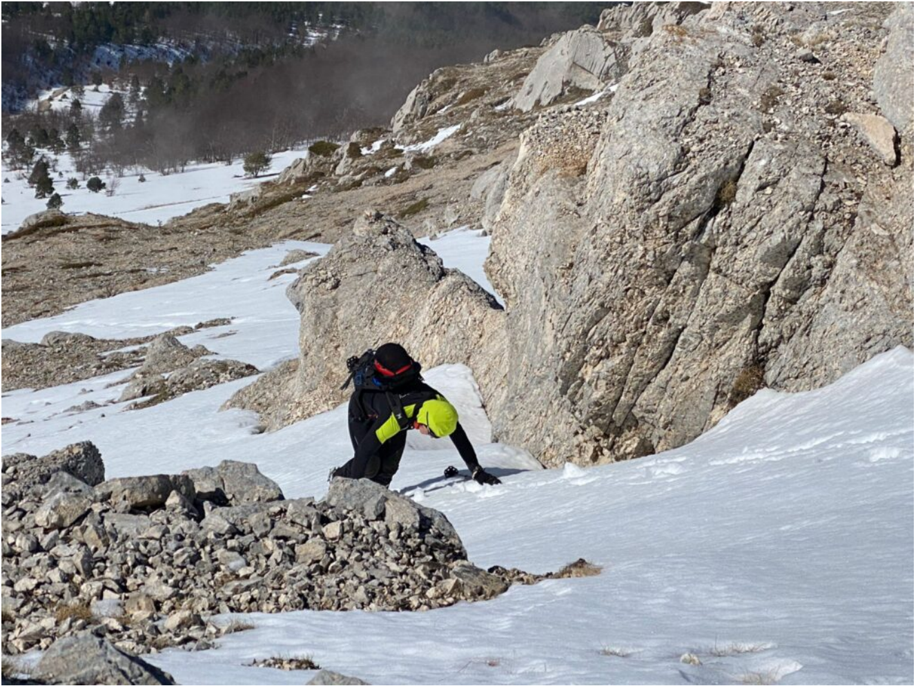
5 – 7- Oltre la prima barriera di rocce il pendio impenna.