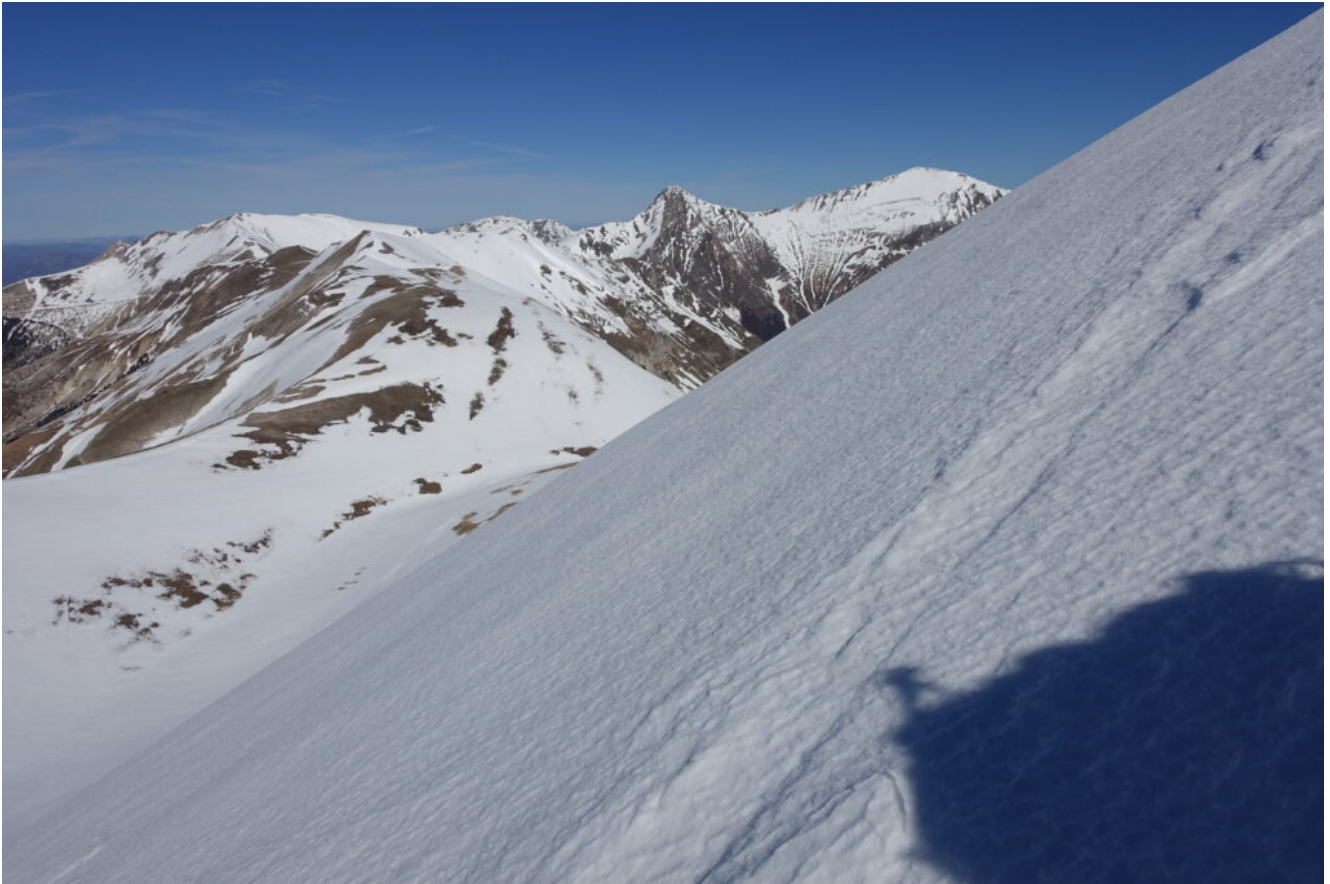
14- Il pendio finale prima della cima.