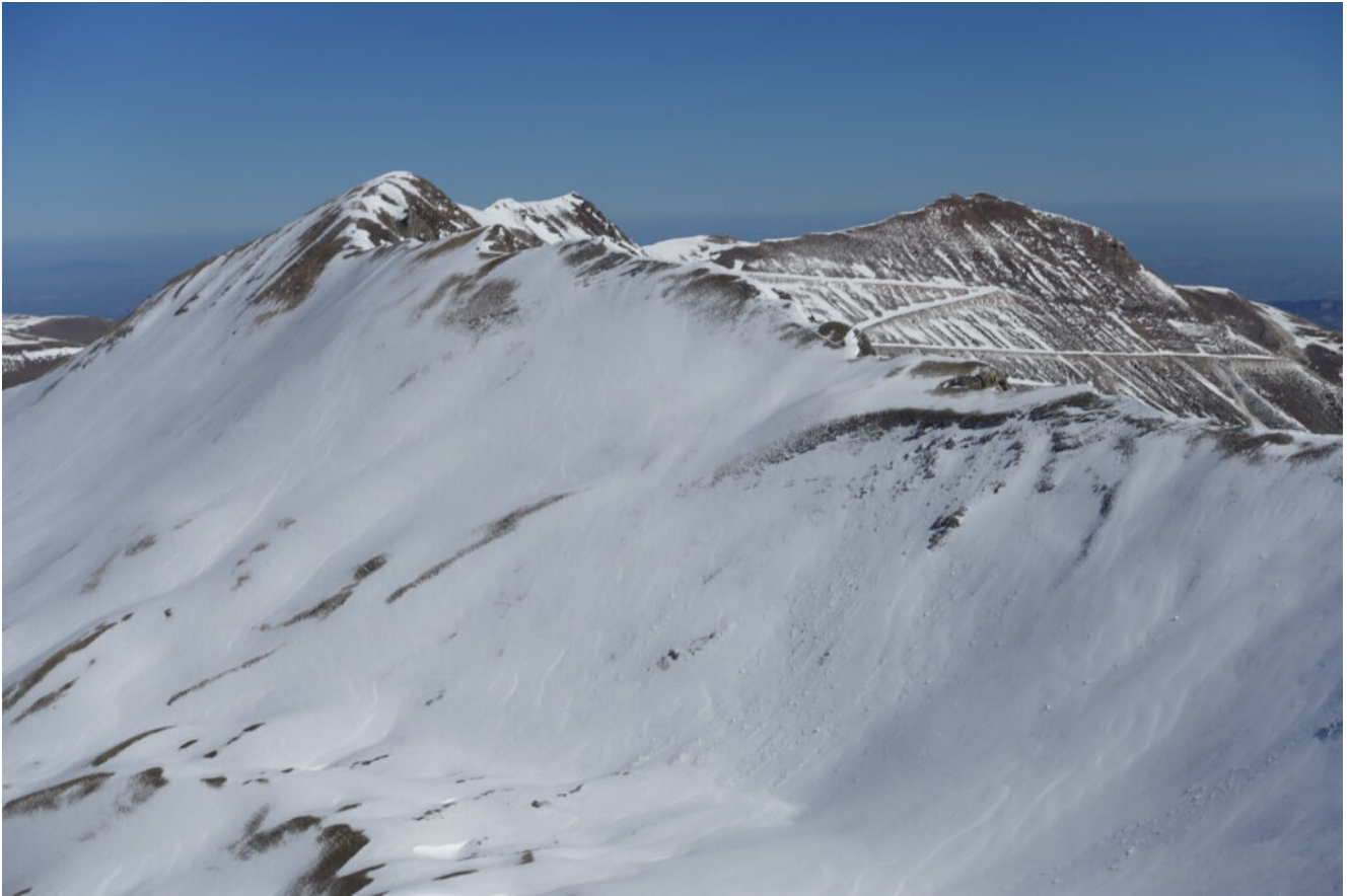
22- La cima Vallelunga ed il Monte Sibilla.