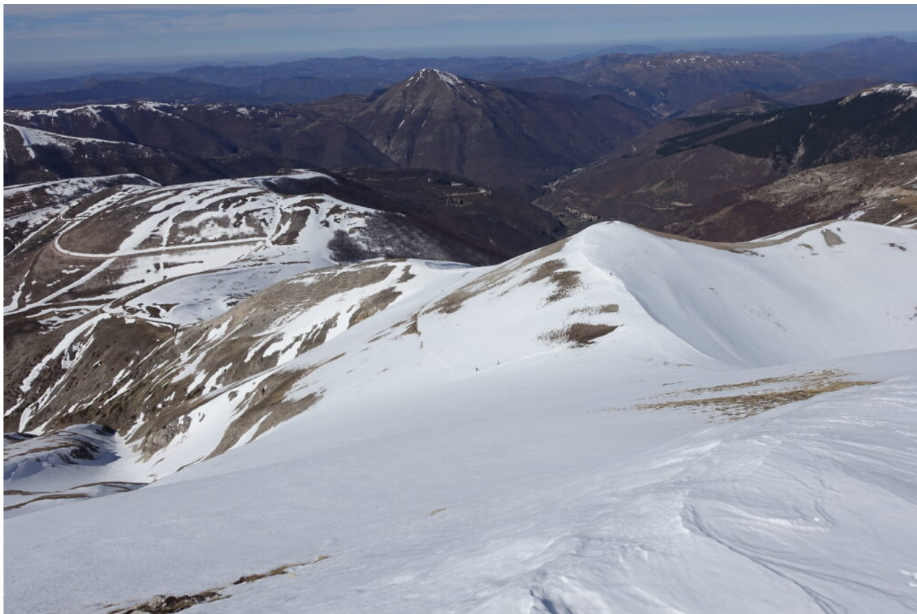
20- Veduta verso Ovest dalla cima.