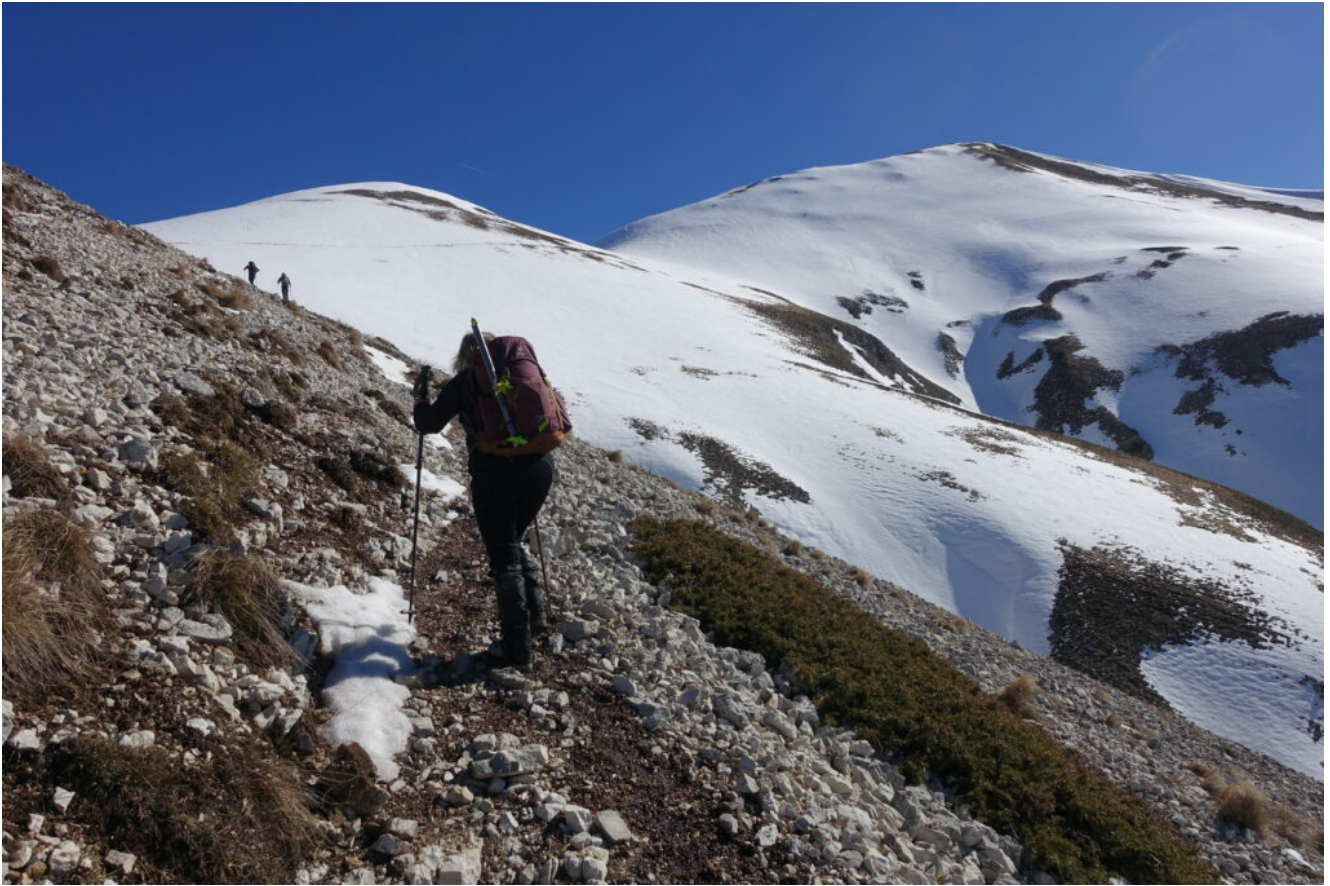
4- Salita del pendio a monte della Fonte della Giumenta verso la sella Nord -ovest visibile in alto a sinistra, a destra la cima del Monte Porche.