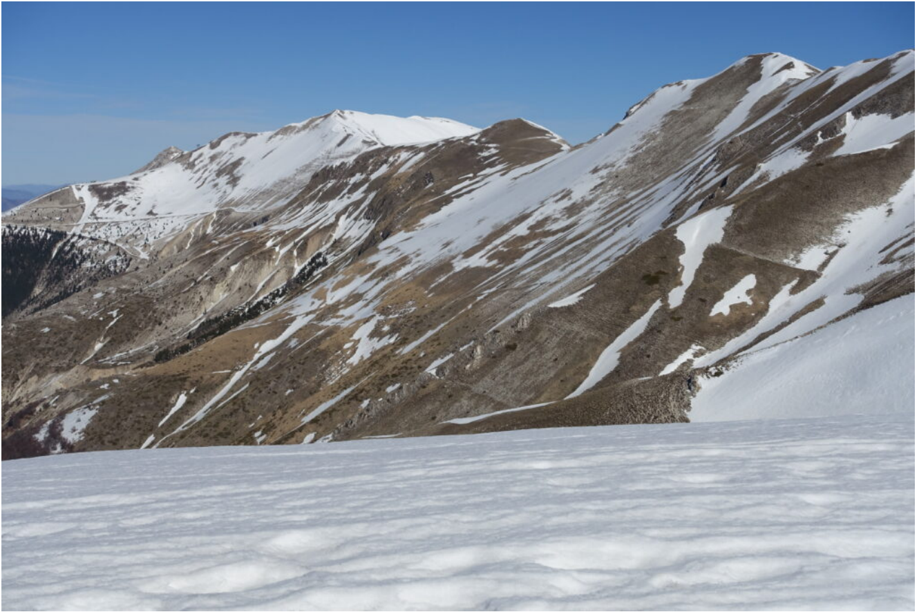
6- A destra la Cima di Vallinfante, la Cima di Passo Cattivo al centro e il Monte Bove Sud in fondo.