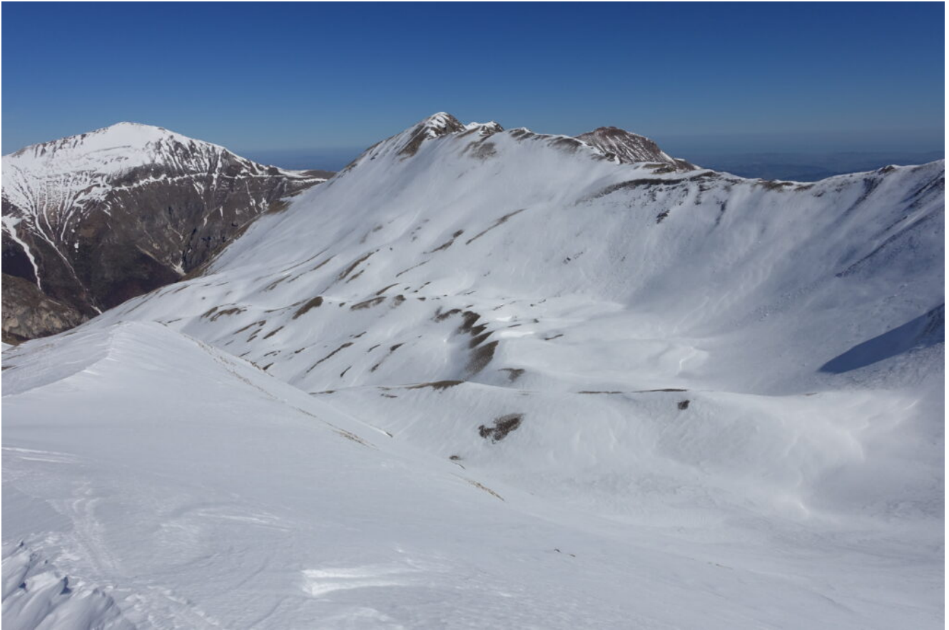
18-La Valle lunga con l'omonima cima al centro, il Monte Sibilla a destra e il Pizzo Regina a sinistra.