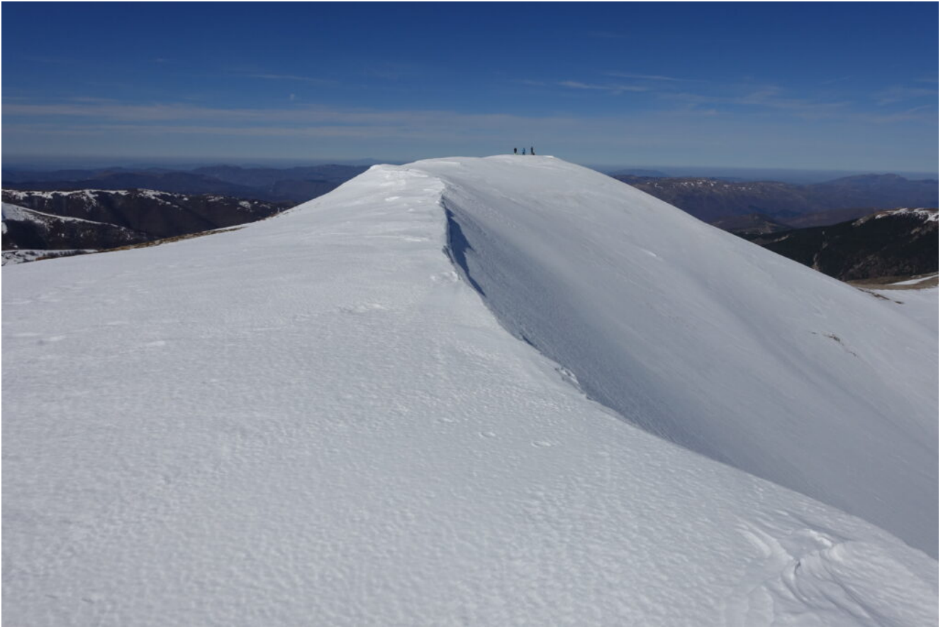
8- La sella Nord-ovest del Monte Porche.