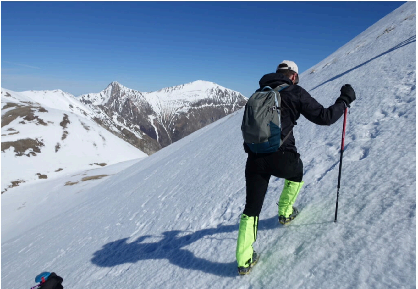
11- I soliti salitori improvvisati, senza piccozza e ramponi