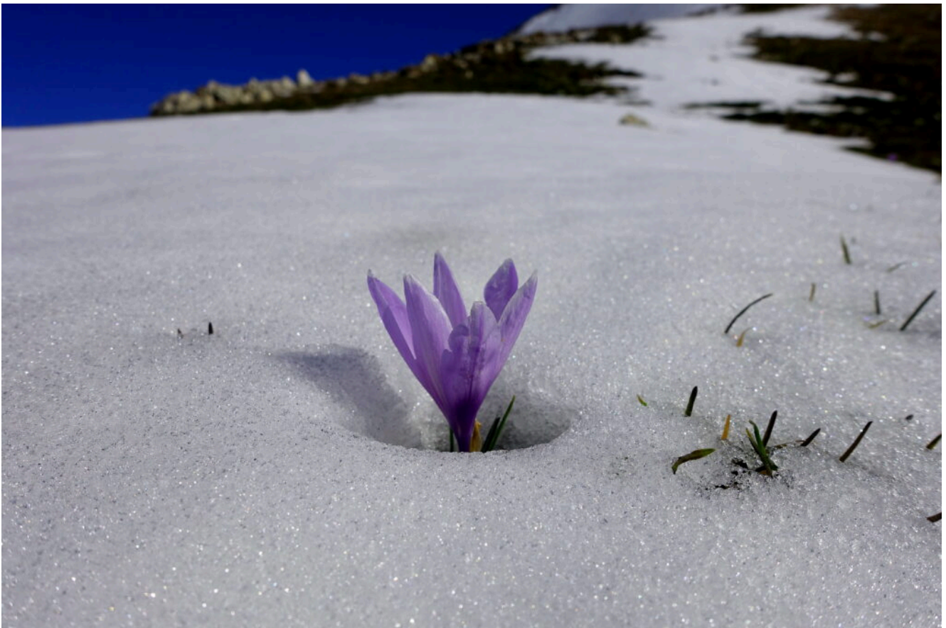
3- I primi crochi primaverili nei pressi della Fonte della