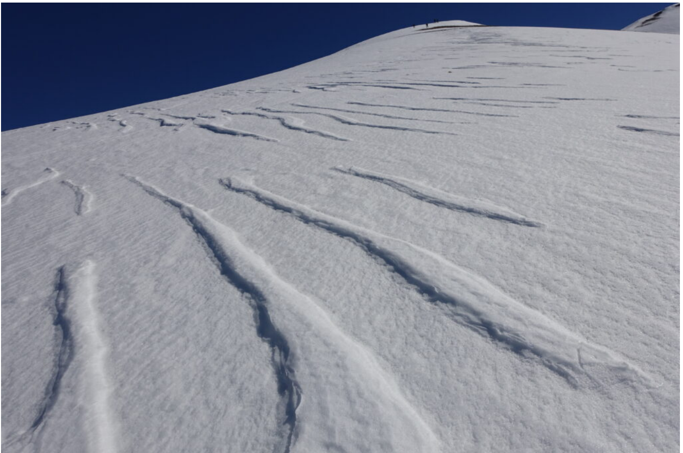
7- Neve modellata dal vento sulla sella Nord-ovest.