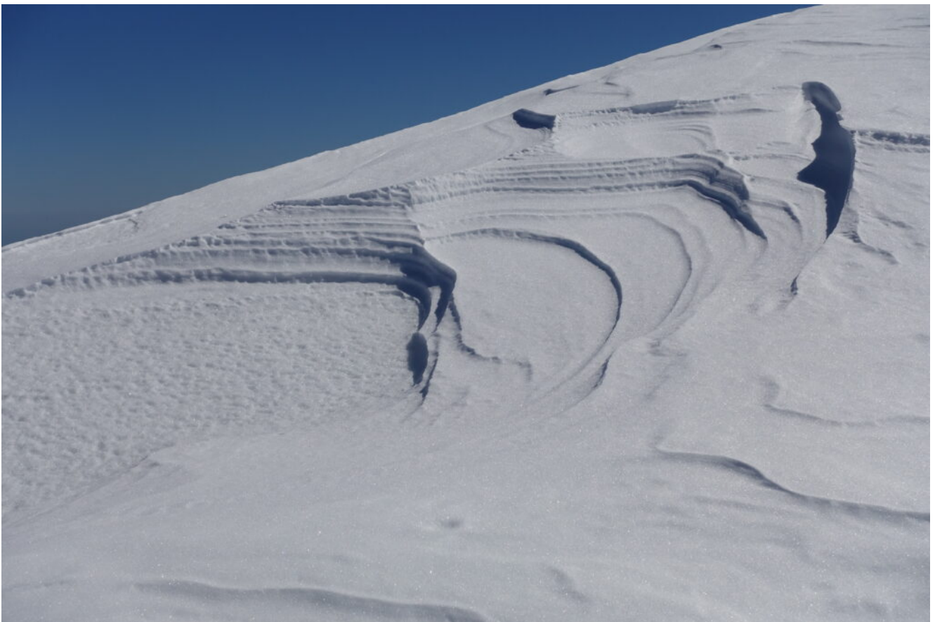
23-26- Neve lavorata dal vento.