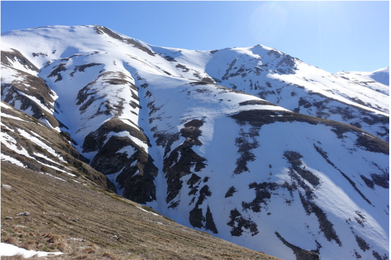
2- Il versante Ovest del Monte Porche e del Monte Palazzo Borghese , con i canali di salita invernali già descritti in questo sito.