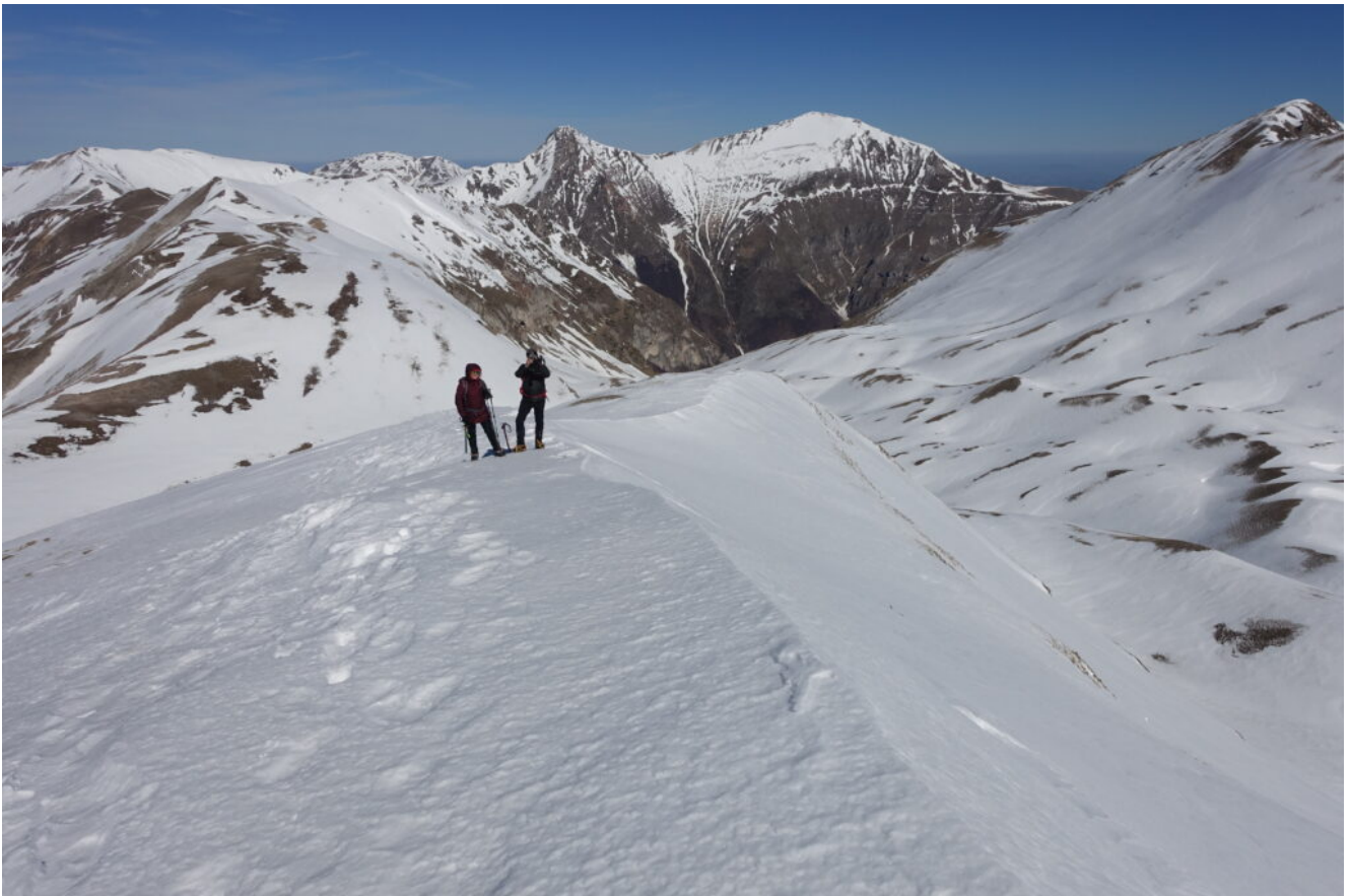
19- Veduta verso Nord dalla cima.