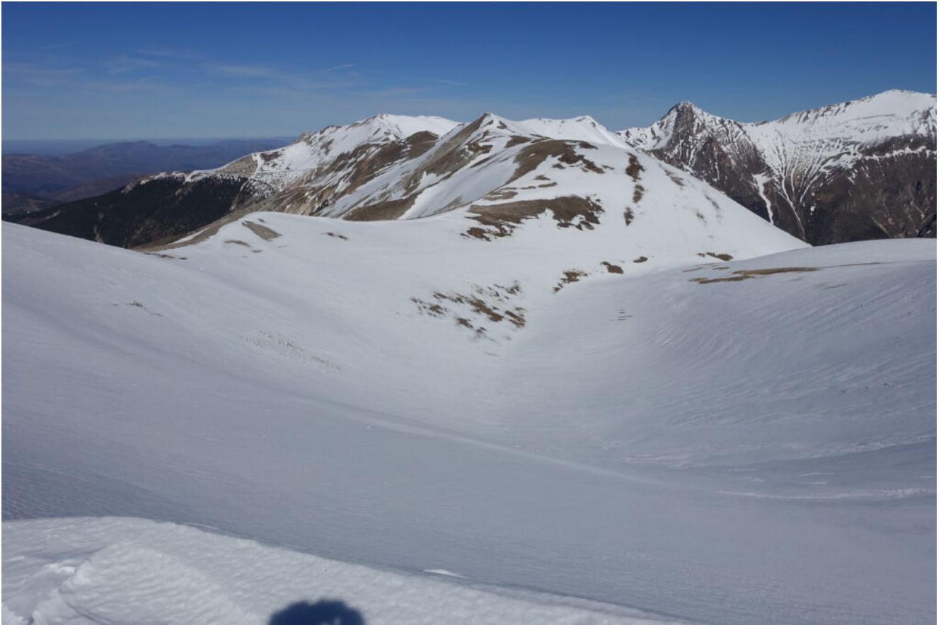
10- La valletta sotto alla sella, in fondo il gruppo Nord dei Monti Sibillini.