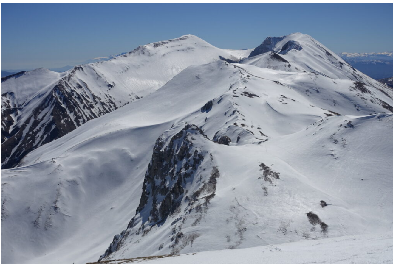
21- Veduta verso Sud dalla cima.