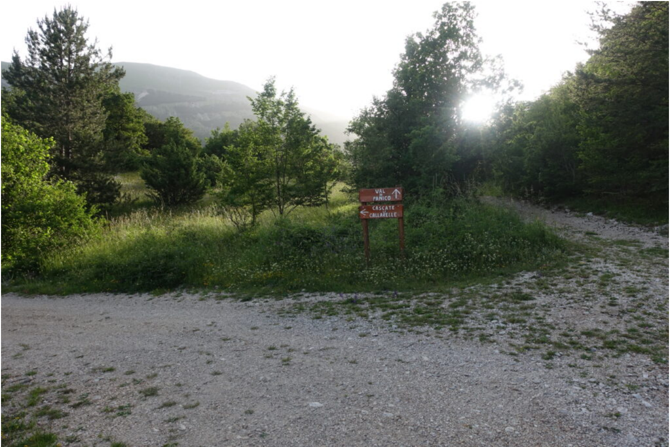
2- Poggio Paradiso con il secondo incrocio ben segnalato.