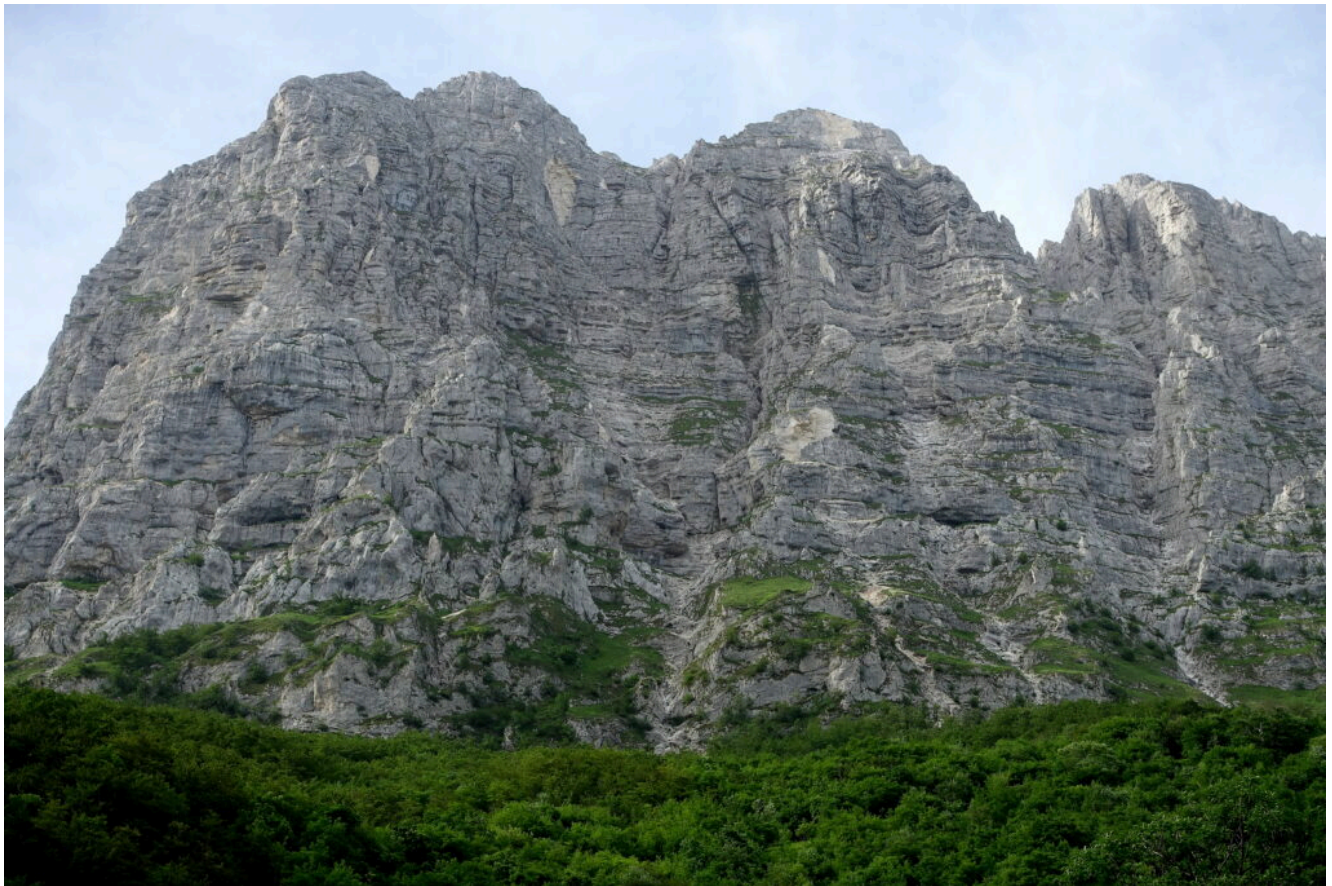
10- La parete Nord del Monte Bove Nord con i suoi tre Spalti e le numerose frane prodotte dal terremoto del 2016, vista dal piazzale della Centrale.