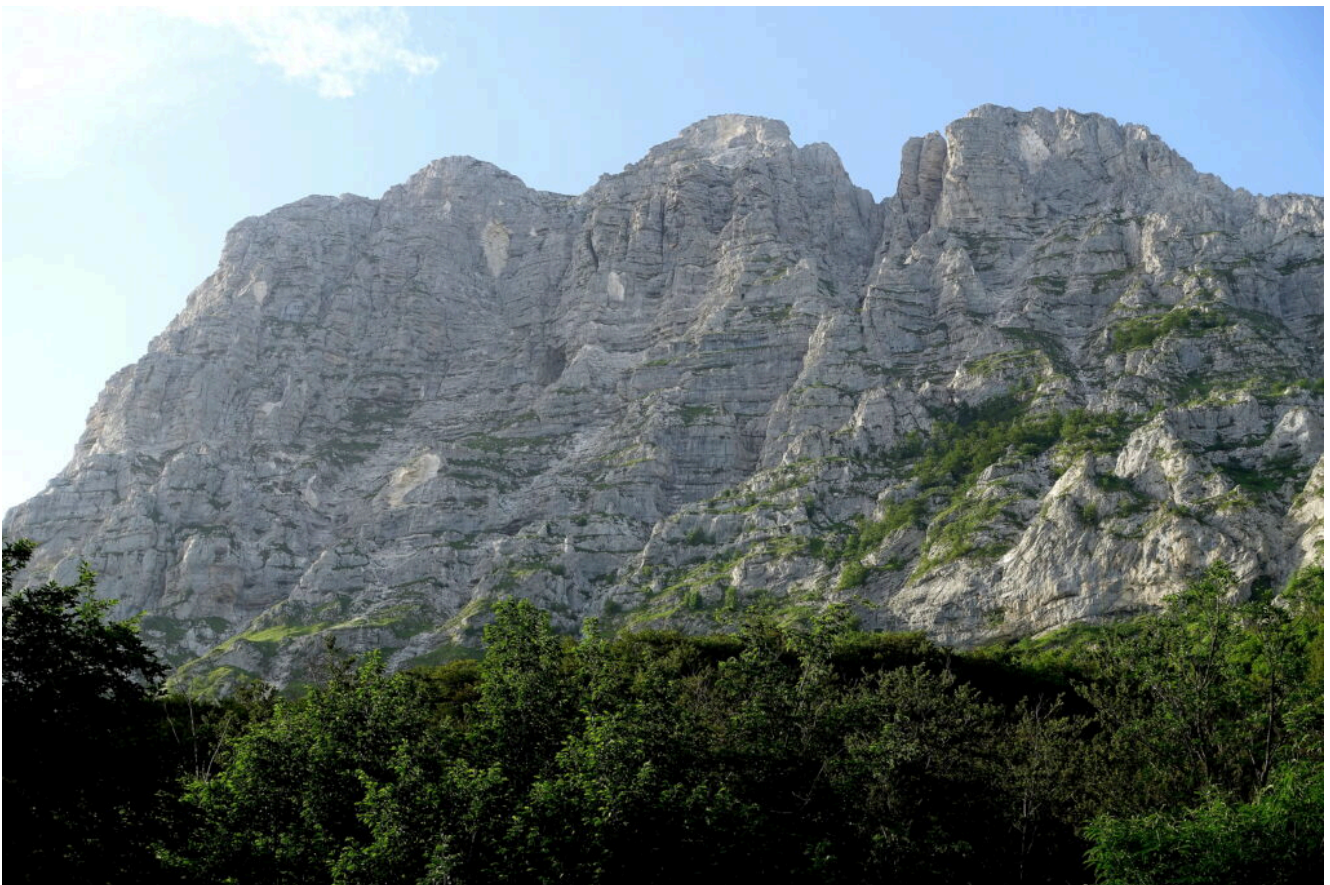
3- La parete Nord del Monte Bove Nord con i suoi tre Spalti e le numerose frane prodotte dal terremoto del 2016, vista da Poggio Paradiso.