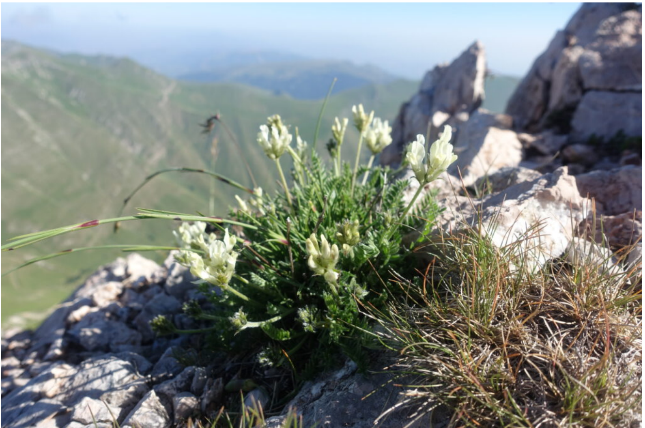
9- Astragalus depressus .