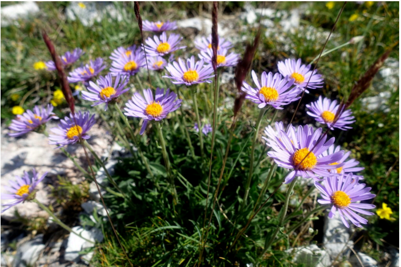
13- Aster alpinus