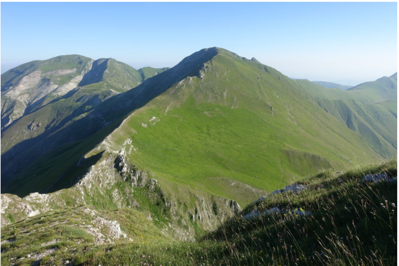
3- Il Pizzo Tre Vescovi e la piccola cima del Monte Acuto a destra, visti dall'antecima Nord del Pizzo Berro, a sinistra il Monte Rotondo.