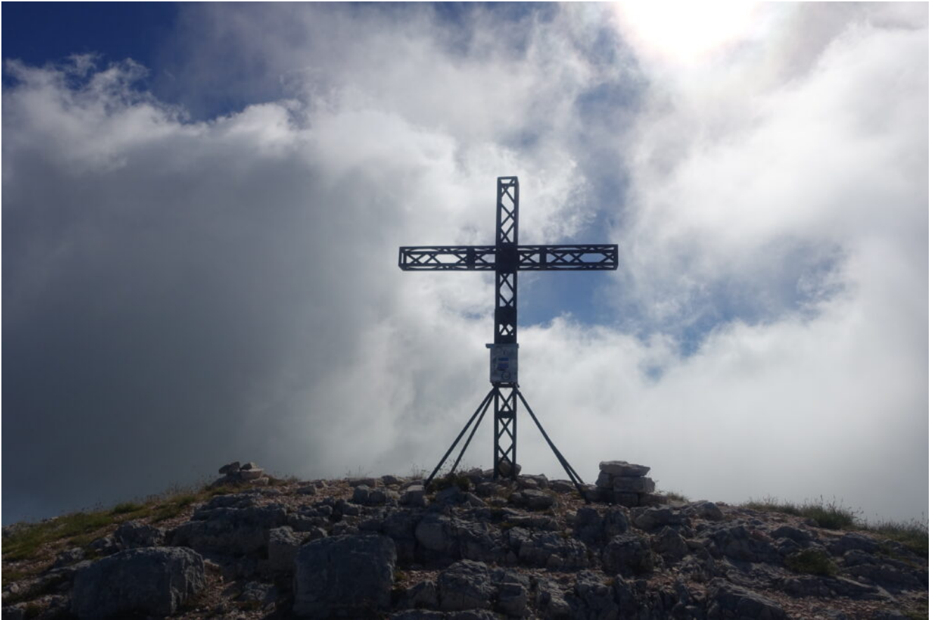
8- La croce del Pizzo Regina, ricorda le polemiche di poco tempo fa proprio sulla necessità di posizionare o togliere le croci di vetta.