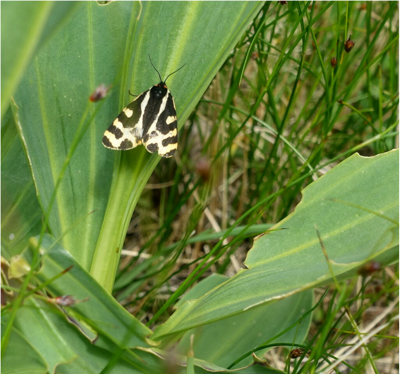
15- Lepidottero della Famiglia Arcitiidae su foglie di Gentiana lutea .