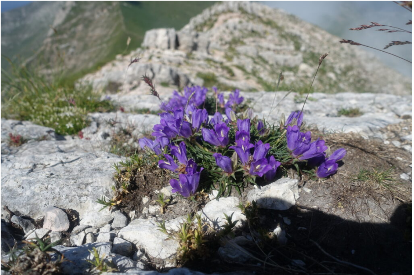
12- Edraianthus graminifolius abbondante sulla cresta Ovest del Pizzo Regina.