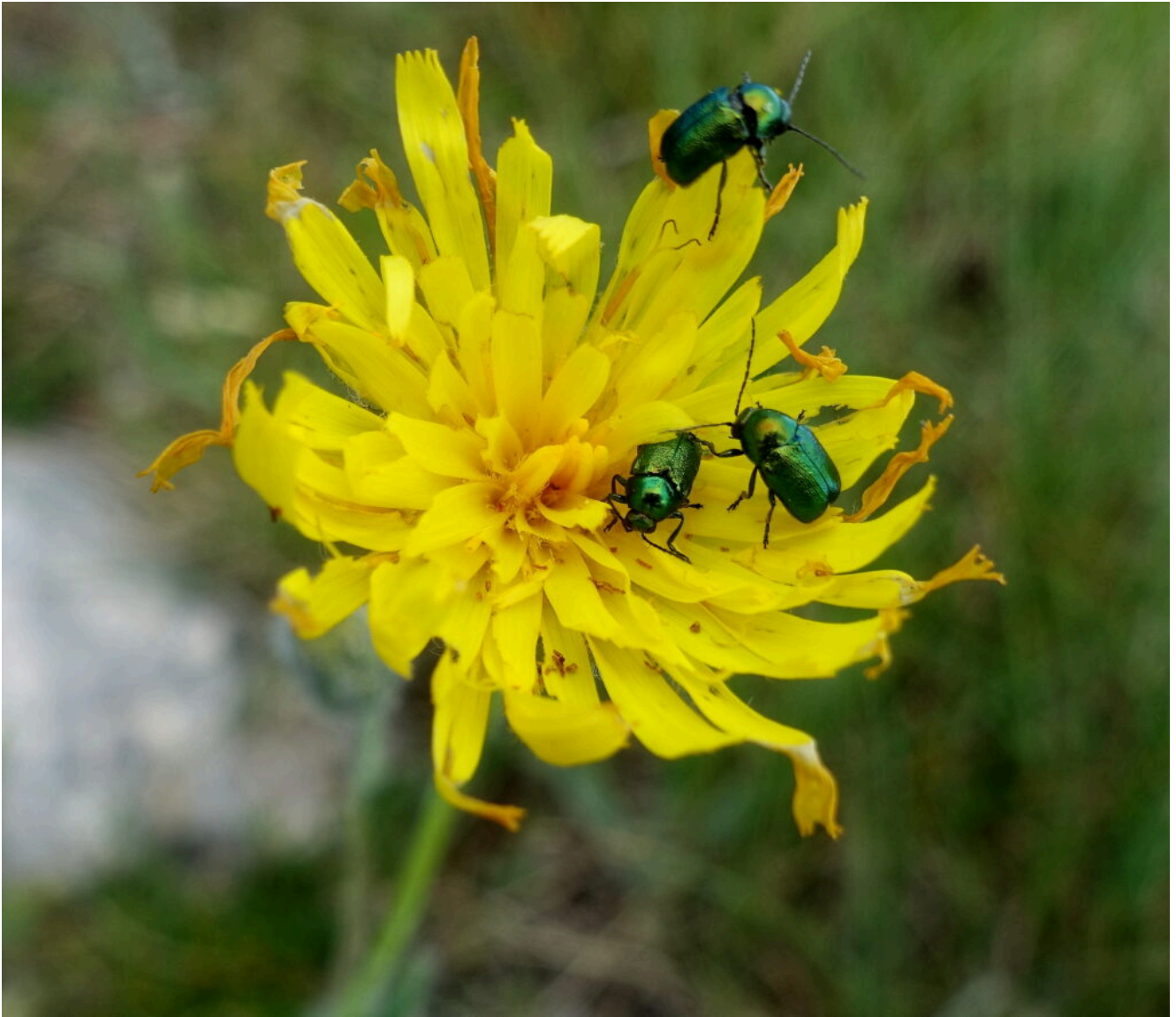
18- Coleotteri Crisomelidi.