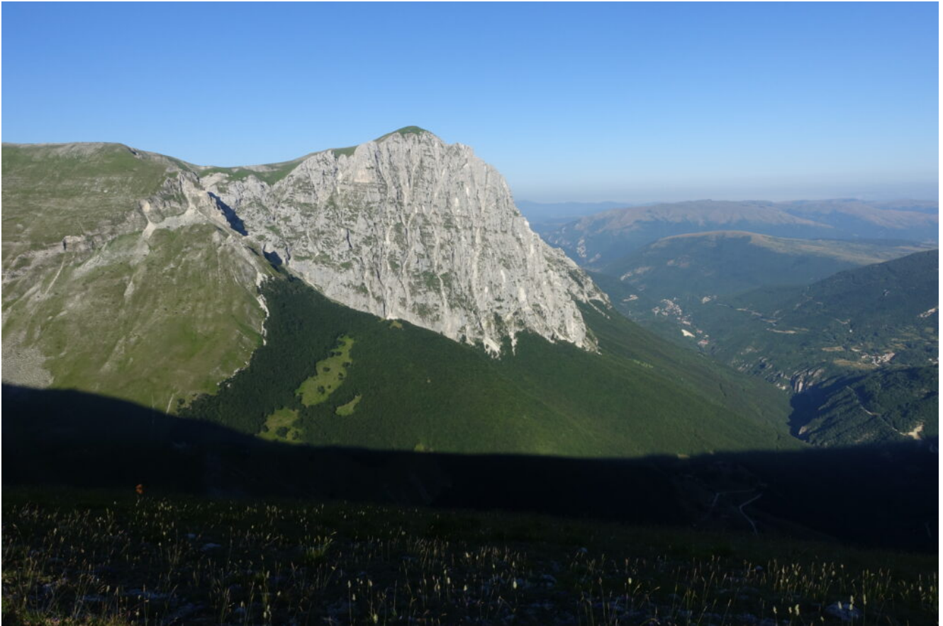
2- Il Monte Bove Nord visto dalla Forcella Angagnola.