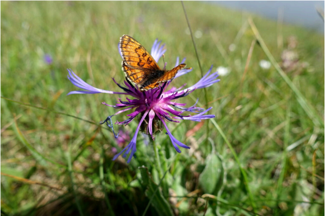
16 – 17 – Incredibile sfarfallamento di migliaia di esemplari in volo per il prato del versante Est del Pizzo Berro di Lepidotteri della specie Melitaea