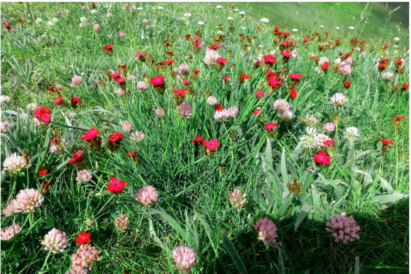
11- Dianthus barbatus subsp. compactus .