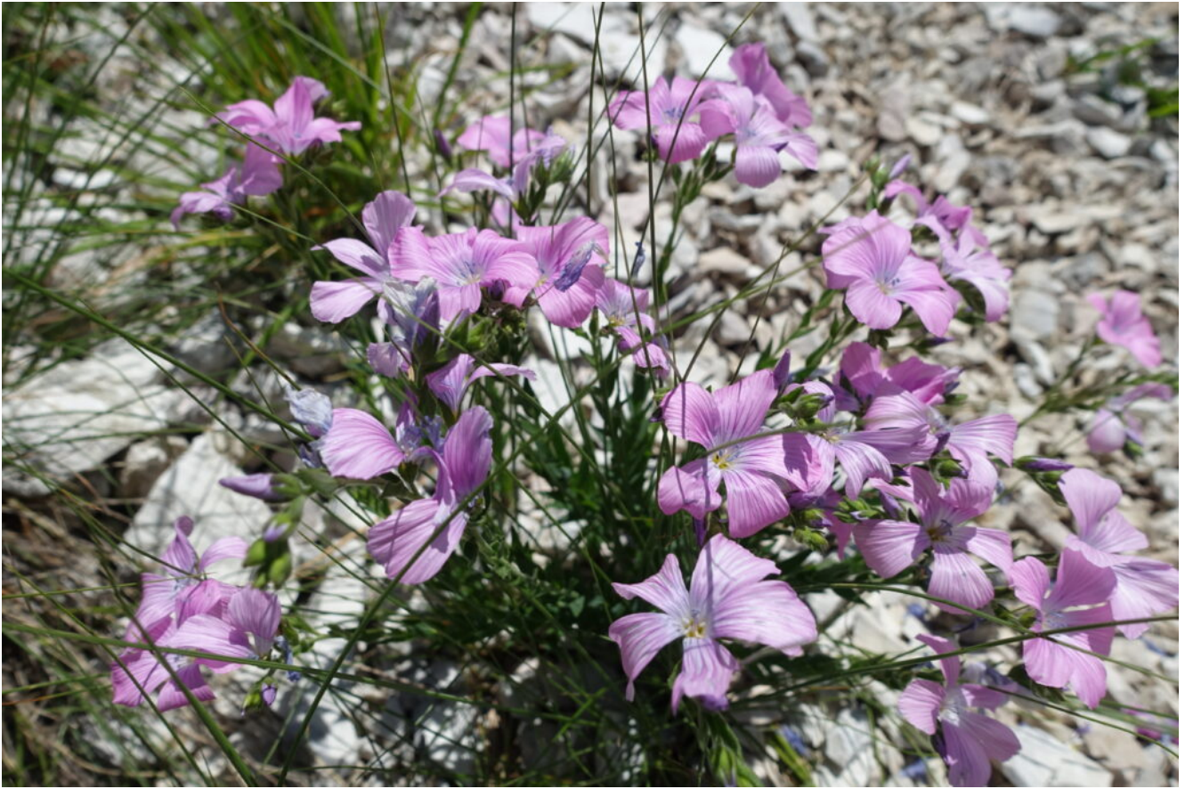
14- Linum viscosum .