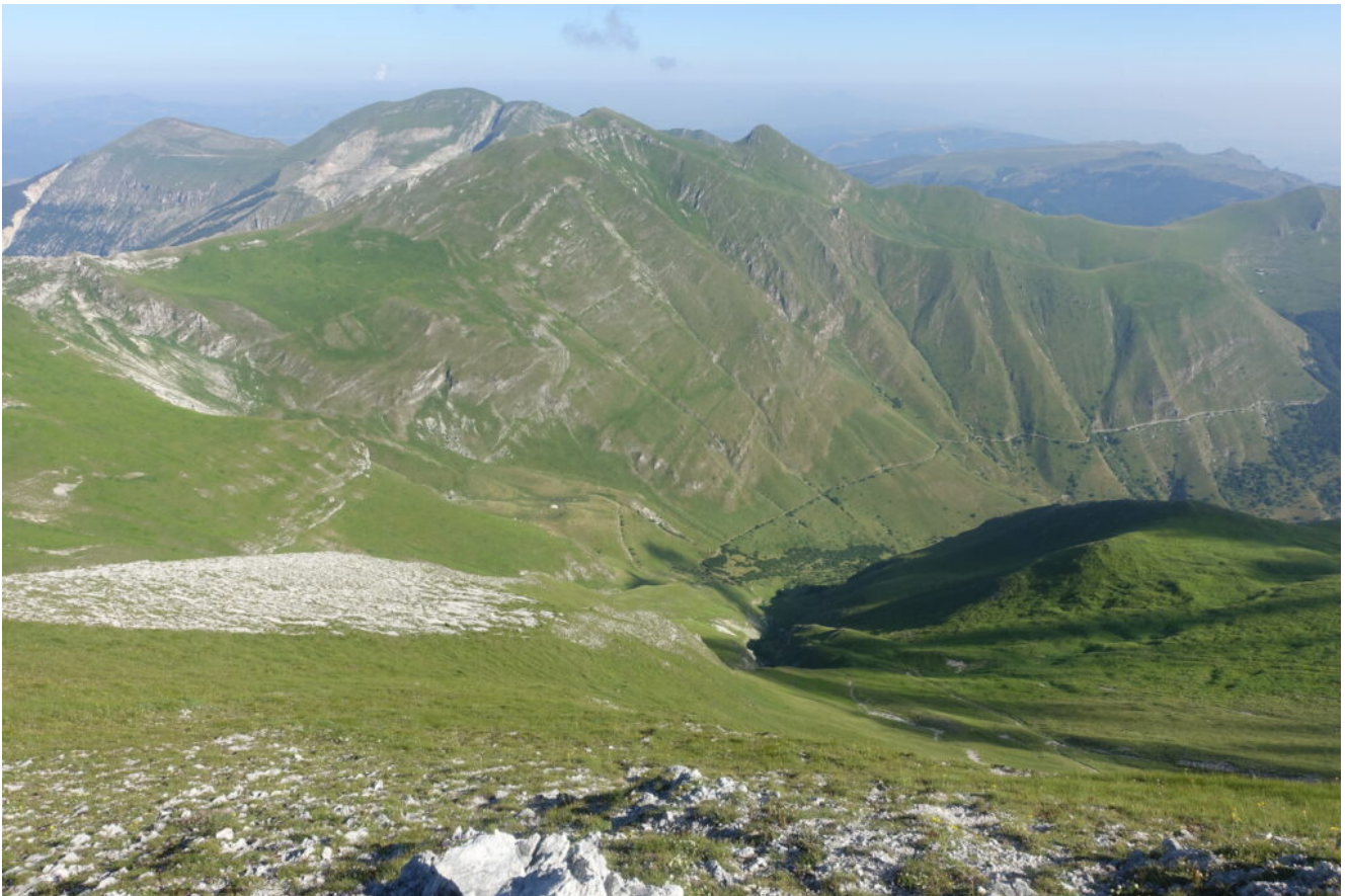
5- Il ripido versante Nord del Pizzo Regina.