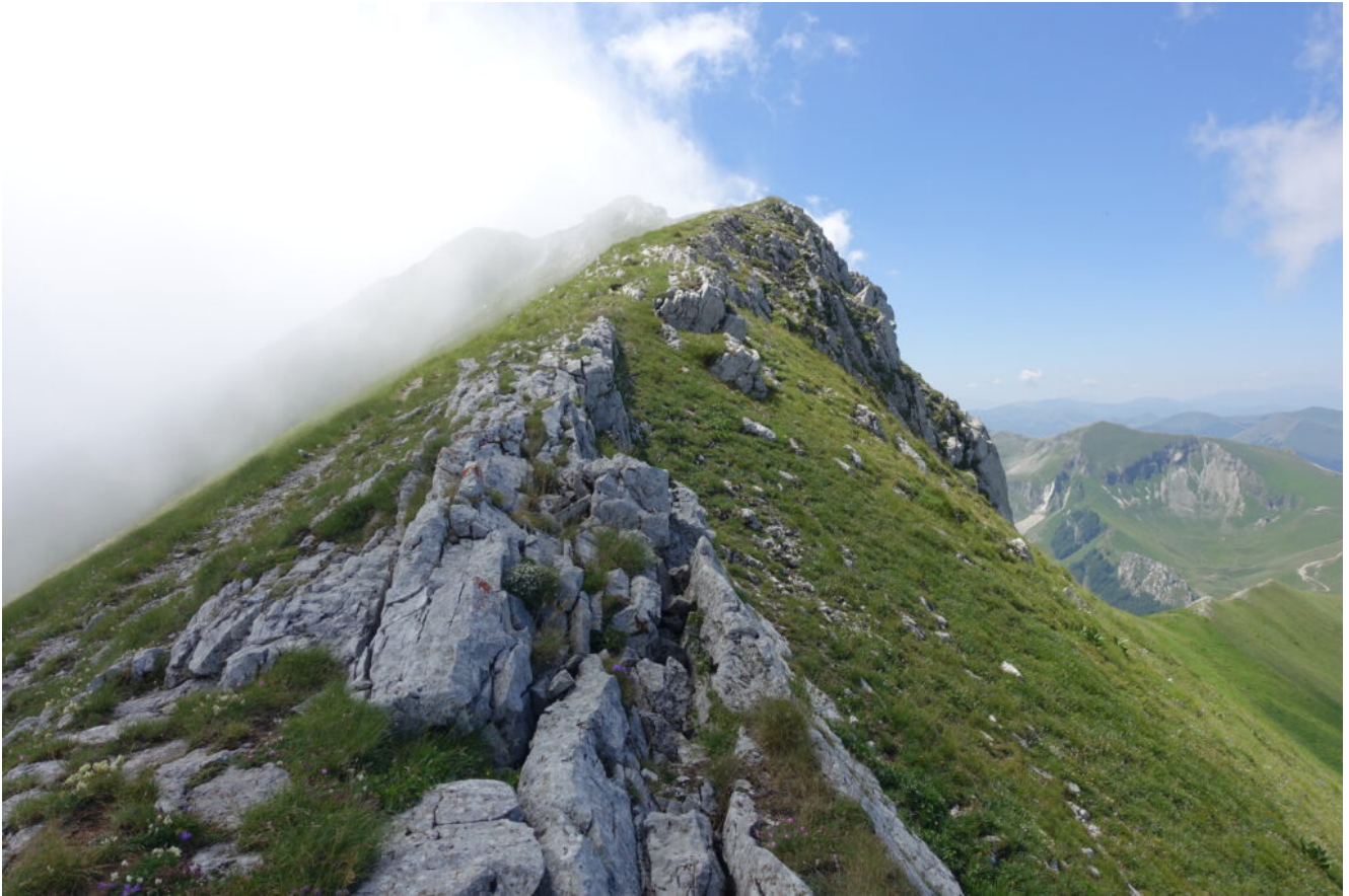
19- La nuvolosità proveniente dal versante Adriatico inizia ad avvolgere anche il Pizzo Berro.