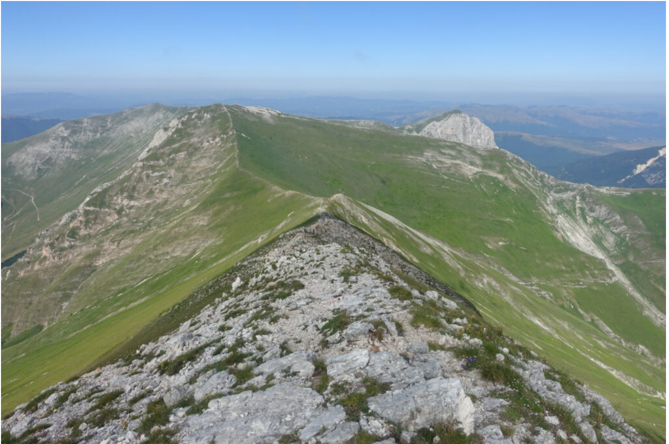
6- Il versante Est del Pizzo Berro visto dalla cima del Pizzo Regina.