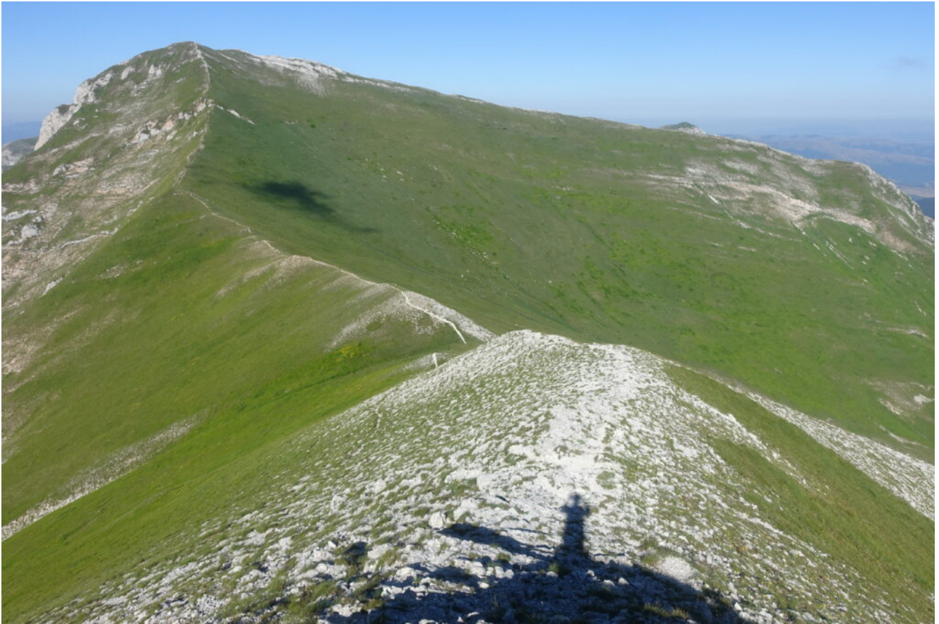
4- Il versante Est del Pizzo Berro visto dall'inizio della cresta Ovest del Pizzo Regina.