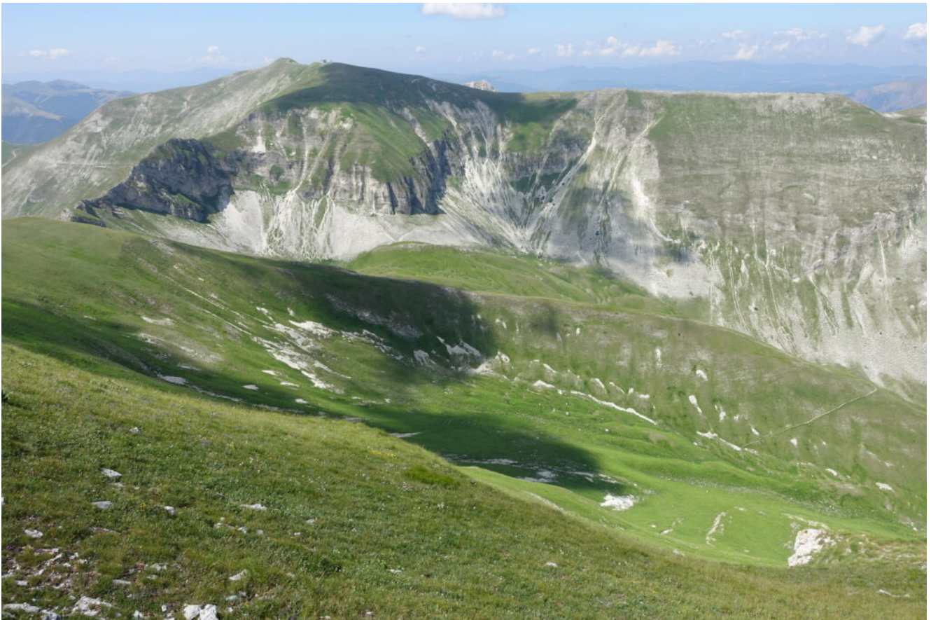
20 – 21- Mentre la Val di Panico con il Monte Bove Sud e Nord (foto n.21) rimangono ancora fuori.