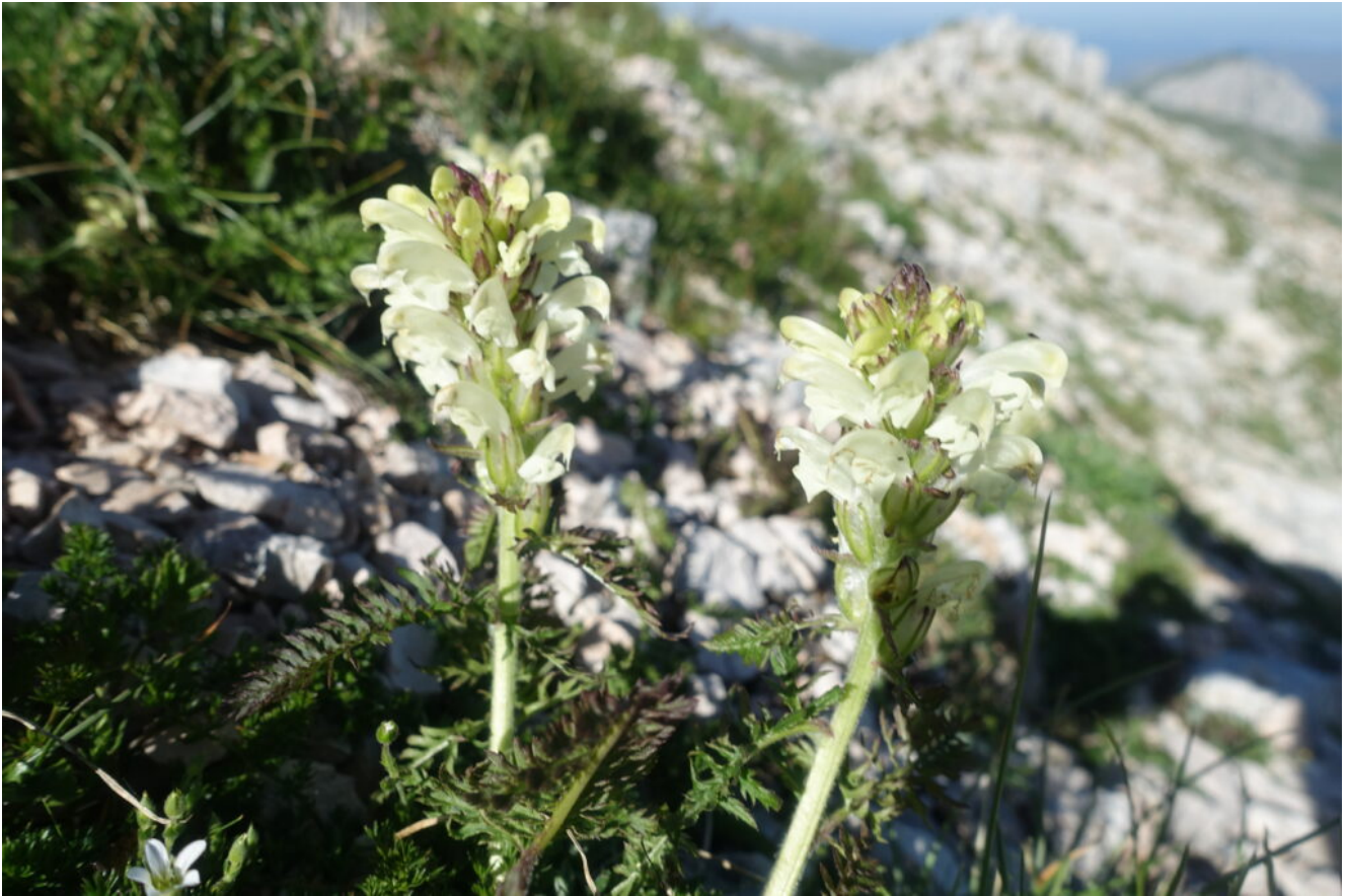
10- Pedicularis tuberosa