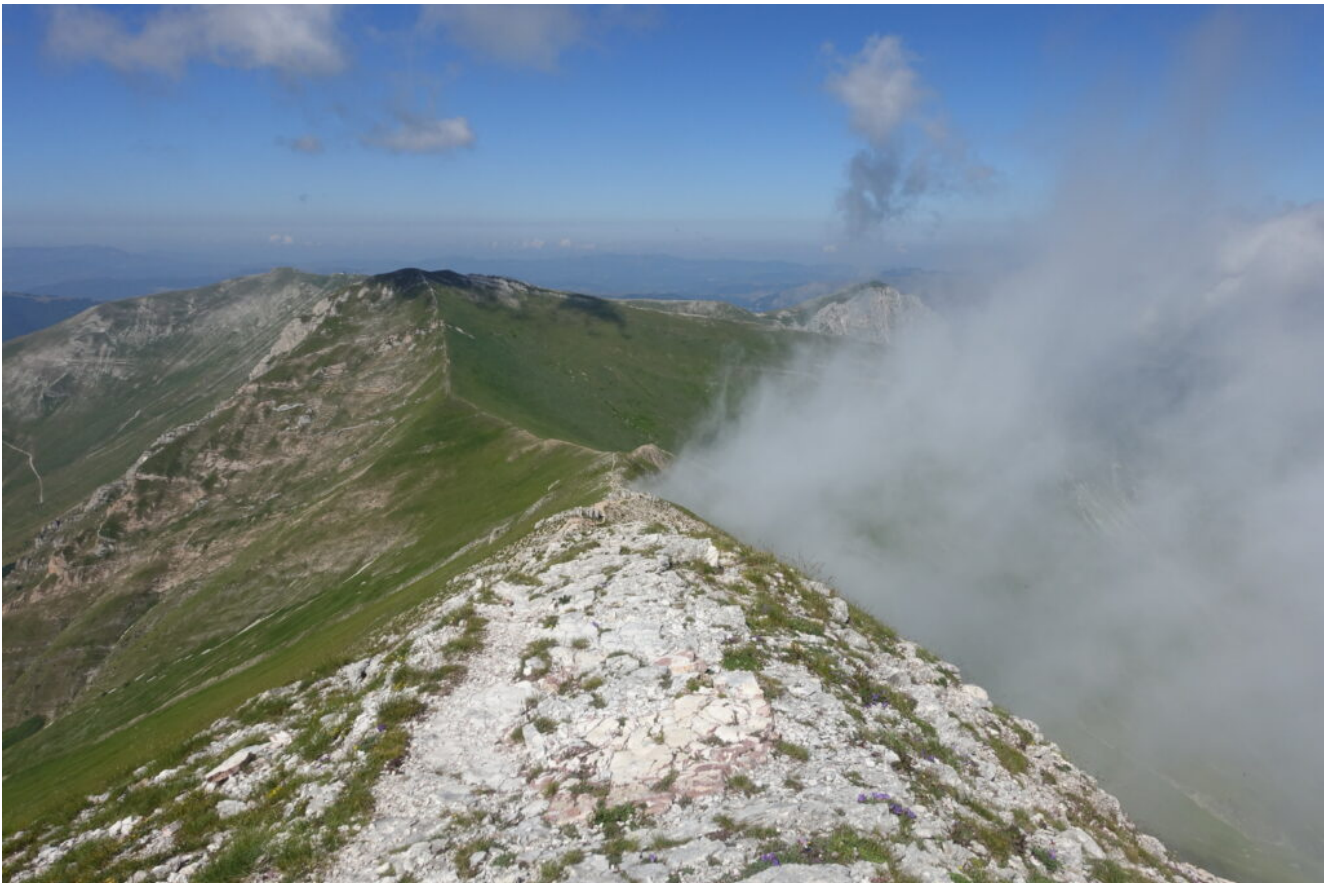
7- Dopo neppure 30 minuti da quando ho scattato la foto n.6 arriva la nebbia.